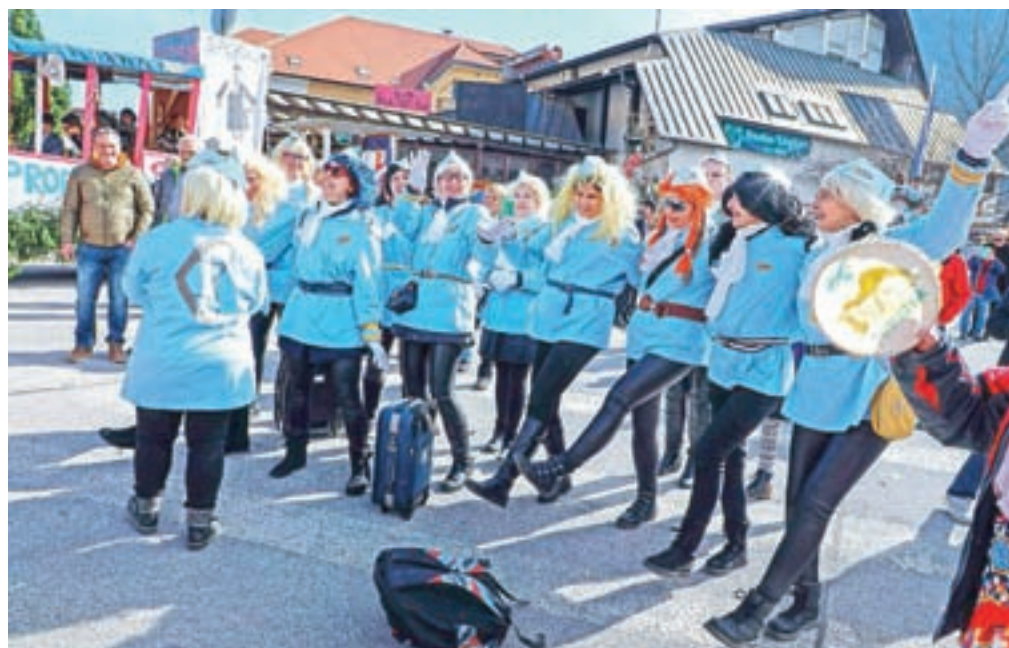
Brhke stevardese propadle Adrie Airways so si našle novega delodajalca Air Serbia. Niso le delile lepih nasmeškov, tudi prepevale so, saj so na rovaš propadlega letalskega prevoznika pripravile temu primerno pesem.