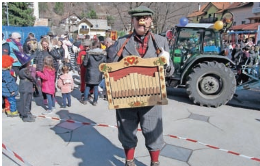
Pustni navdušenci s Hrušice so na Čufarjevem trgu poskrbeli za zabavni program, obiskovalcem so povedali več o tem, kaj povorka predstavlja. Del pustnega veselja je bil tudi lajnar, ki je na trgu zabaval zbrano množico.