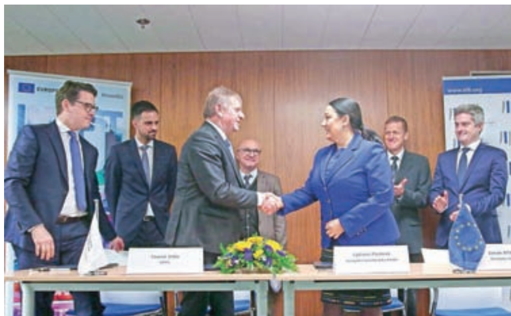
Podpis pogodbe o najemu posojila za izgradnjo druge cevi in obnovo obstoječe cevi z Evropsko investicijsko banko

delo in s tem bo pričel teči pogodbeni rok, so nam povedali na Darsu. Kot je znano, je bila pogodba sklenjena za predvideno 62-mesečno obdobje graditve druge cevi predora in desetletno obdobje garancij-