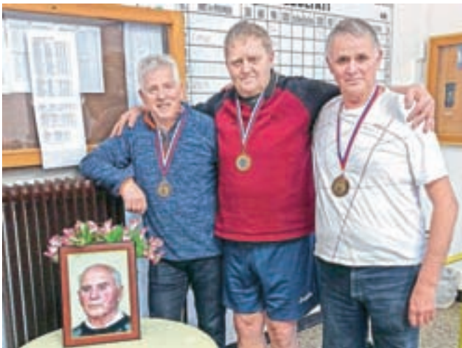
Moška zmagovalna ekipa