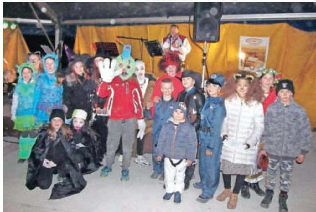
Poleg povorke so poskrbeli še za zabavni program v šotoru na Hrušici. Predvsem so se ga razveselili otroci, zanje so pripravili tudi nagrade.