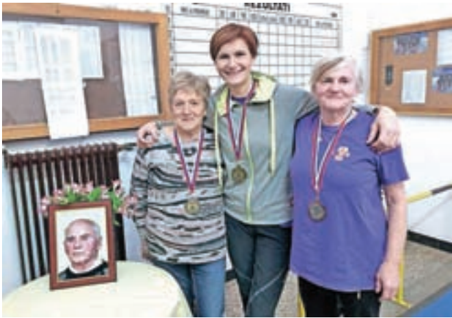
Ženska zmagovalna ekipa