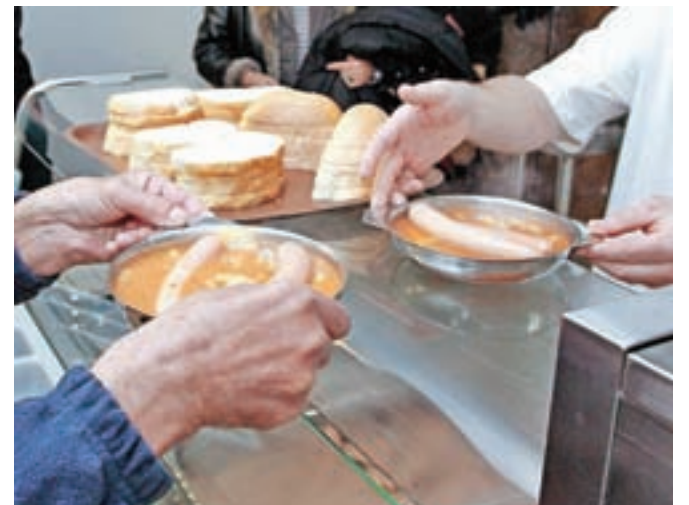
Jeseniški brezdomci imajo zagotovljeno spanje in topel obrok (slika je simbolična).

Lani se je tudi precej zmanjšala možnost za bivanje v samskem domu, saj so ti