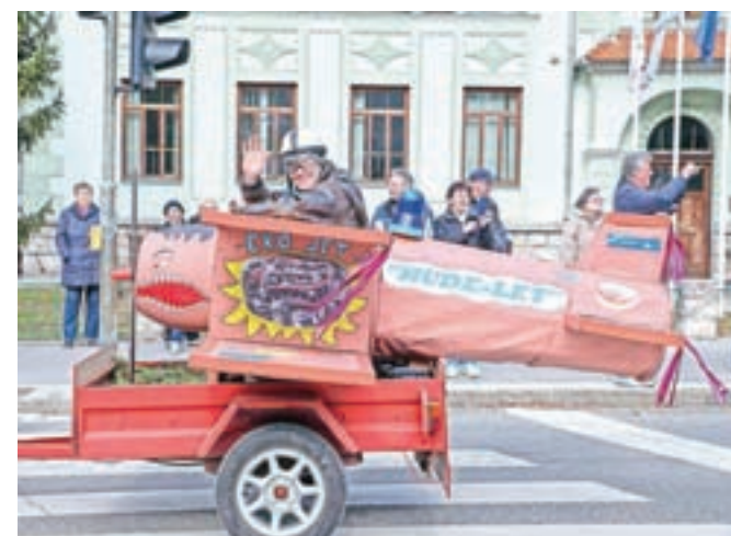
Pustna povorka se je vila od Hrušice do Čufarjevega trga na Jesenicah in nazaj.