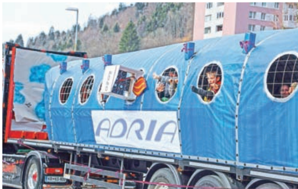
V ospredju je bil propadli letalski prevoznik Adria Airways.

lovalo več kot dvesto domačinov s Hrušice, celotni kraj je neverjetno strnil vrste in dokazal, kaj se da narediti na povsem prostovoljni ljubiteljski bazi.