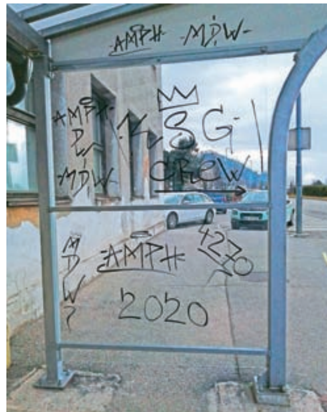
Popisano steklo na avtobusnem postajališču pri Osnovni šoli Koroška Bela

ke, ki so bili uničeni, več pa so jih morali očistiti. Zamenjali so tudi tri koše za smeti in prepleskali grafito na opornih zidovih na Sončni poti. Grafito na postajališču pri šoli je počistil hišnik, medtem ko so grafiti na opornem zidu nasproti vrtca na zasebnem objektu. Različna dejanja vandalizma Občino Jesenice letno