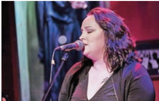
Alja pravi, da ji glede lege in barve glaslu najbolj ležijo balade.