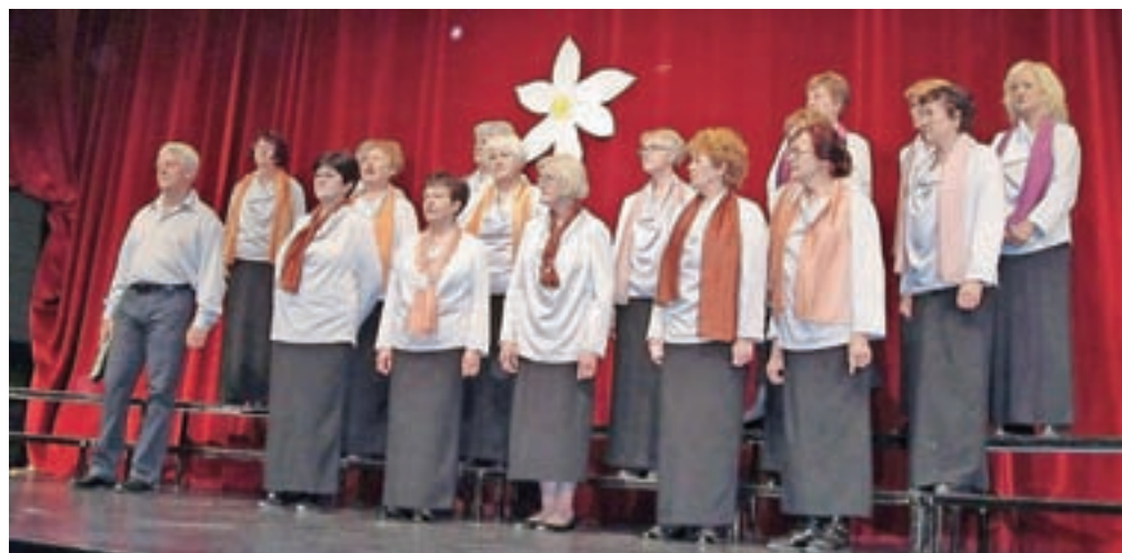
Ženski pevski zbor DU Javornik - Koroška Bela

bosta predstavila na eni od ostalih gorenjskih območnih revij. Manjkalo pa je nekaj drugih zborov, ki so v preteklih letih veliko prispevali v bogato zakladnico zborovske glasbe v občini Jesenice. Pojavlja se negativni trend, v zborih se srečujejo s težko premostljivimi ovirami, saj se ne pomlajujejo. Decembra smo lahko na straneh Jeseniških novic prebrali o velikih težavah pevskega zbora Vox Carniola, ki svoje uspešne zgodbe ne more več nadaljevati, saj jim manjka predvsem moških glasov. Verjetno je še marsikje tako. Vsi, ki želijo, da se zborovska glasba ohranja in krepi, apelirajo na vse petja željne, da se jim pridružijo, saj bo le tako moč sedanjí trend spet obrnil navzgor.