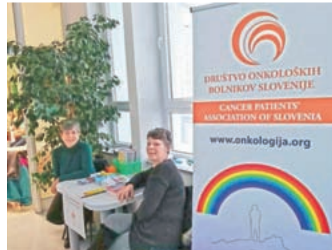
Člani jeseniške skupine za samopomoč sodelujejo tudi na različnih preventivnih dogodkih.

Srečanja običajno trajajo dobro uro, vabijo tudi nove člane, ki se jim ni treba predhodno prijaviti. "Dobrodošli novi člani, enostav-