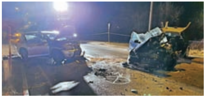
Tragične posledice prometne nesreče med Lipcami in mostom čez Savo

Gorenjski prometni policisti so na glavni cesti Lipce–Savski most na Slovenskem Javorniku obravnavali trčenje treh vozil, v katerem je ena oseba umrla. Povzročitelj prometne nesreče je med vožnjo po klancu navzdol na ovinkasti cesti zapeljal na nasprotno smerno vozišče in tam najprej oplazil enega, potem pa silovito trčil še v drug osebni avtomobil. Pokojni povzročitelj nesreče, državljan BiH, je bil v vozilu sam, v drugem vozilu sta bili dve osebi, državljana Slovenije, v tretjem pa štirje državljanji Srbije. Vseh šest oseb je bilo poškodovanih, ena med njimi huje, vendar ni življenjsko ogrožena. V letošnjem letu je to prva smrtna žrtev na gorenjskih cestah, lani do konca februarja so umrli trije udeleženci.