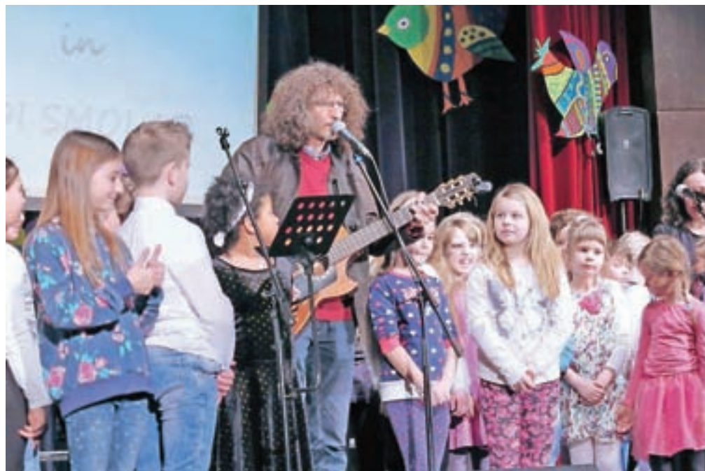
Lanski dobrodelni koncert za nova okna je več kot uspel, letos ga bodo, kot pravijo, še zadnjič ponovili.

S prošnjo za donacijo so se že obrnili tudi na okoliška podjetja in druge donatorje.