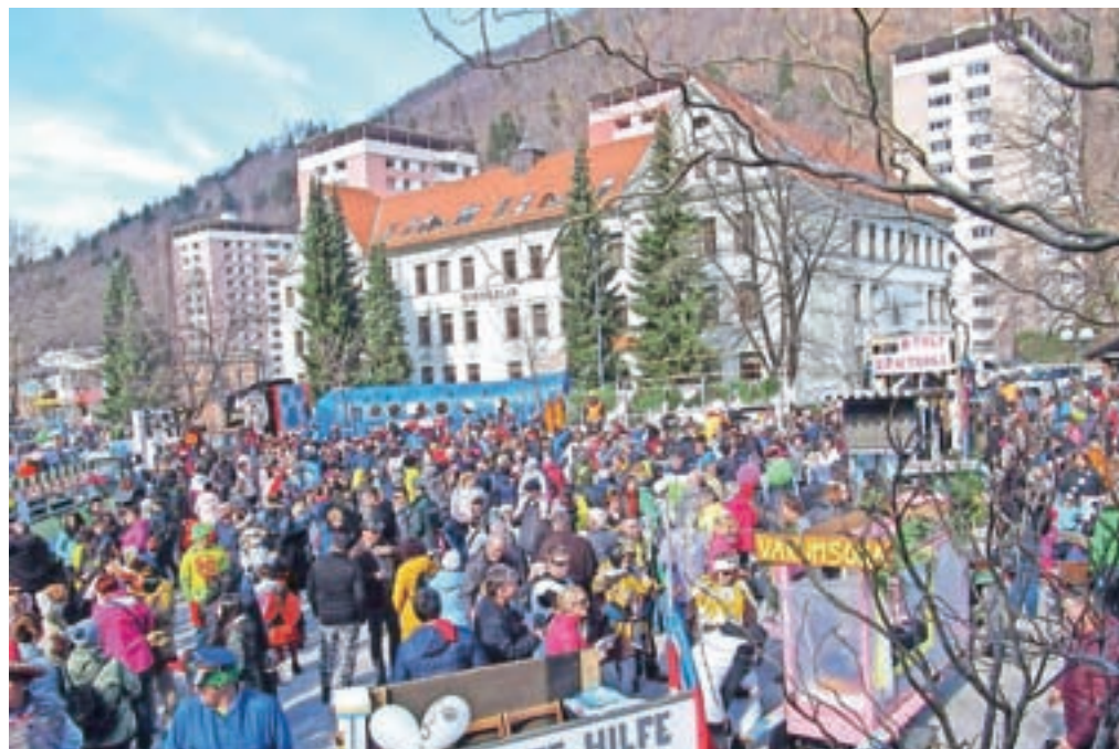
Take množice, kot je bila na pustno soboto na Čufarjevem trgu, tam že dolgo ne pomnijo. Veselilo se je staro in mlado.