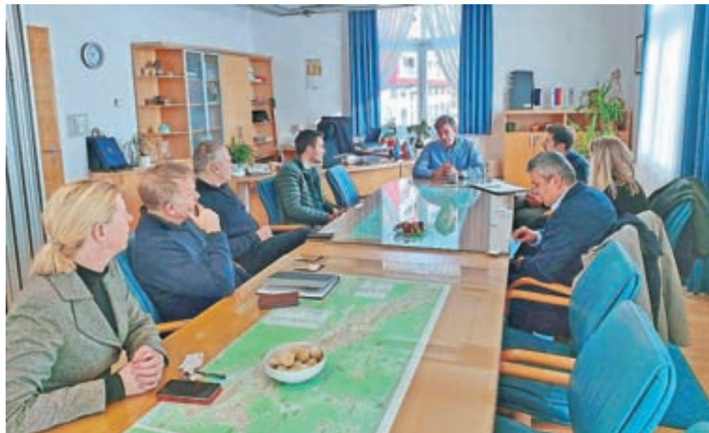
Predstavniki podjetja Cengiz Insaat so v začetku meseca obiskali Občino Jesenice.

Na Darsu je včeraj potekal podpis pogodbe z izbranim izvajalcem Cengiz Insaat. Ko bo ta predložil še bančno garancijo, se gradnja vzhodne cevi predora Karavanke tudi uradno lahko začne. Pogodbena vrednost del je 98,5 milijona evrov brez DDV oziroma 120 milijonov evrov z DDV.