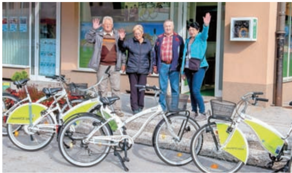
Osrednja točka, kjer obiskovalci Jesenic dobijo turistične informacije, je TIC Jesenice nasproti železniške postaje.

Iz naslova turistične takse se je v lanskem letu nateklo 30.712,40 evra. Leto prej je ta znesek znašal nekaj manj kot dvajset tisoč evrov, v letu 2017 pa le nekaj več kot deset tisoč evrov.