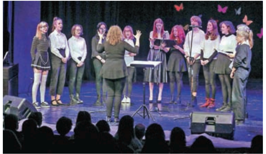
Dekliški pevski zbor Janka Pribošiča Gimnazije Jesenice