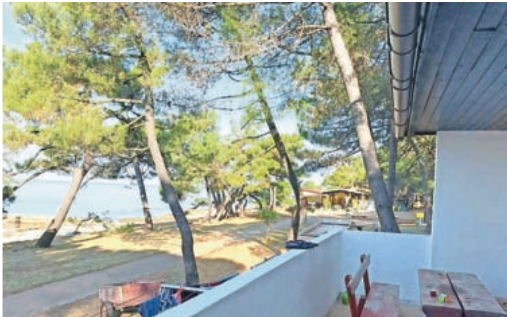
Otroško letovišče Pinea