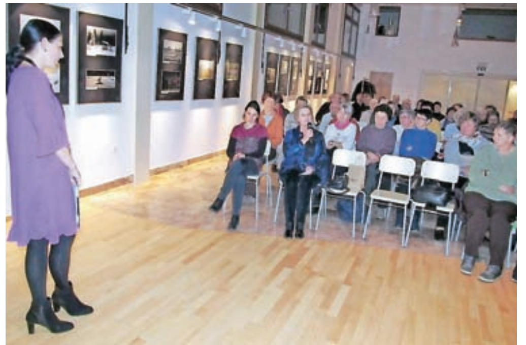
Decembrska predstavitev knjižice ob navzočnosti avtorjev in drugih udeležencev