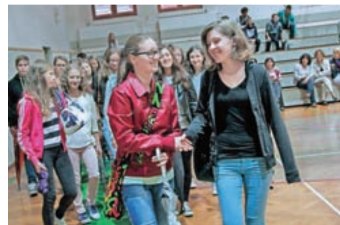
Informativna dneva v srednjih šolah bosta 14. in 15. februarja.

mest) triletnega programa Mehatronik operater, en oddelek (28 mest) štiriletnega programa Strojni tehnik, trije oddelki (84 mest) štiriletnega programa Tehnik zdravstvene nege in dva oddelka (56 mest) programa Vzgojitelj predšolskih otrok. Po besedah ravnateljice Monike Lotrič jim je ministrstvo ponovno odobrilo tri oddelke zdravstvene nege (v letošnjem letu imajo samo dva), uredili so nov kabinet za zdravstveno nego, v prosti kabinet pa bodo umestili vsebine s področja kozmetike (nege kože in nohtov), tako da bodo program zdravstvene nege naredili še bolj vabljen za bodoče dijake.