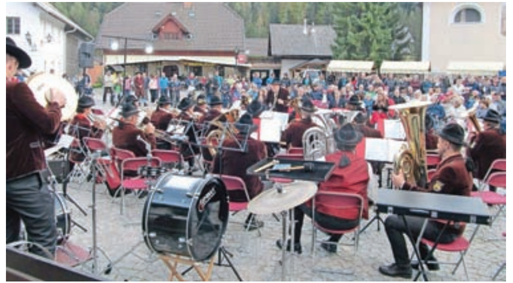
Srečanje godbenikov treh dežel je potekalo v Kranjski Gori.