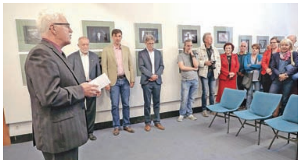
Petdeseta Slovenska pregledna razstava, ki jo tokrat sestavlja 68 fotografij, bo v salonu Dolik Jesenice na ogled do 19. novembra.