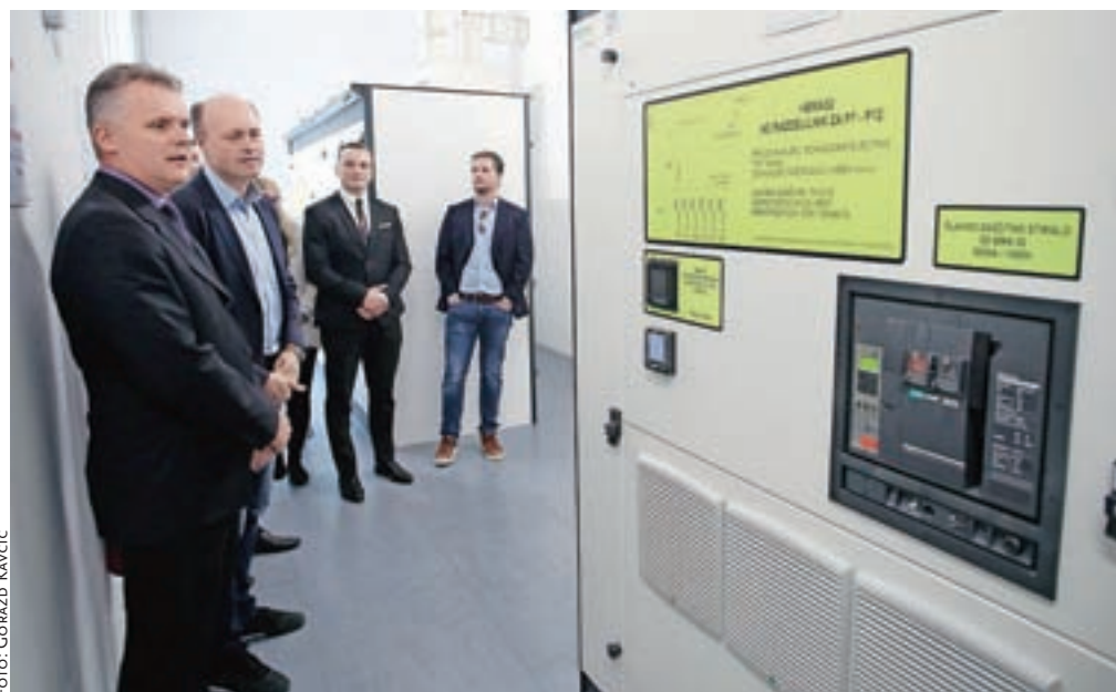
Inovativni sistem je eden največjih tovrstnih v Evropi, temelji na bateriji ameriškega proizvajalca, žirovniško podjetje pa je razvilo programsko rešitev za upravljanje naprave.

»Že od izuma elektrike obstaja problem, kako jo shraniti za kasnejšo uporabo. Brez shranjevalnih kapacitet morata biti proizvodnja in uporaba v vsakem trenutku izravnani. Težave se pojavijo, ko proizvodnja električne energije postane odvisna od zunanjih dejavnikov,« so glavni razlog za začetek uresničevanja ideje o hranilniku električne energije pojasnili v družbi NGEN.