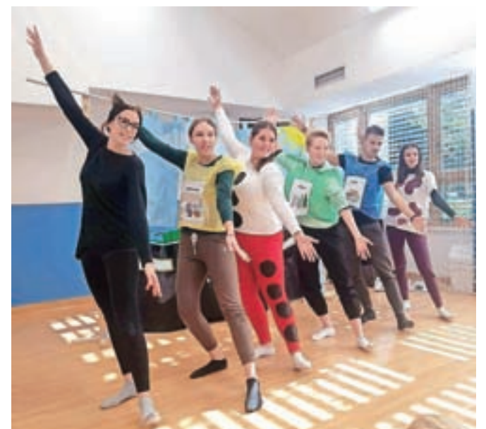
Dijaki so otroke v gorenjskih vrtcih razveselili z igrkami.