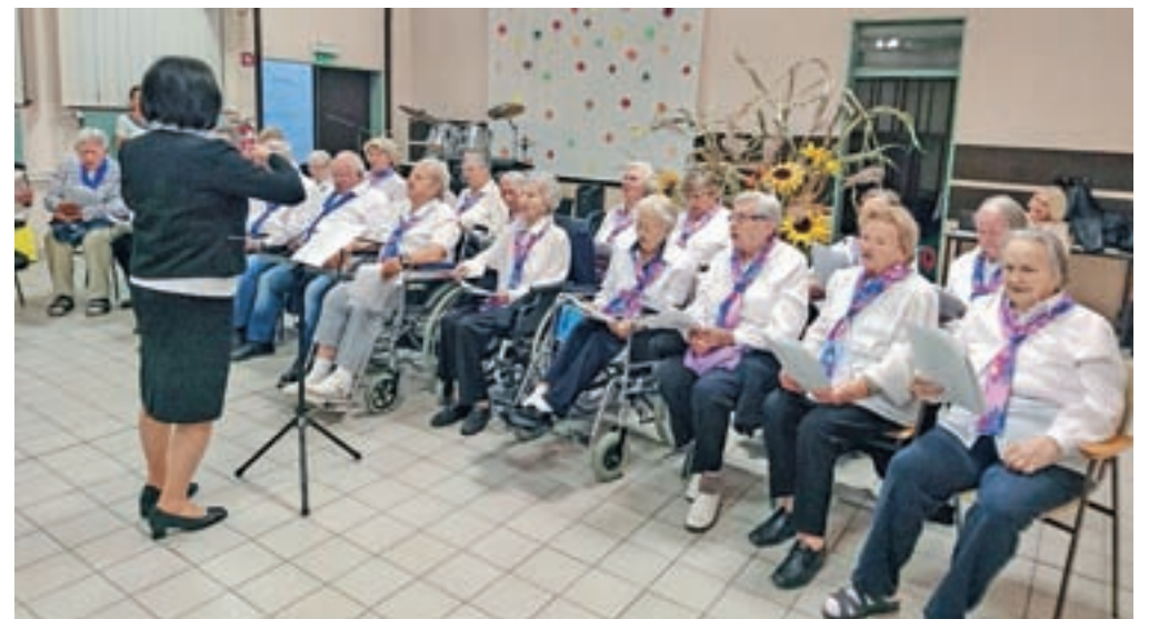
Domski pevski zbor Večerni zvon