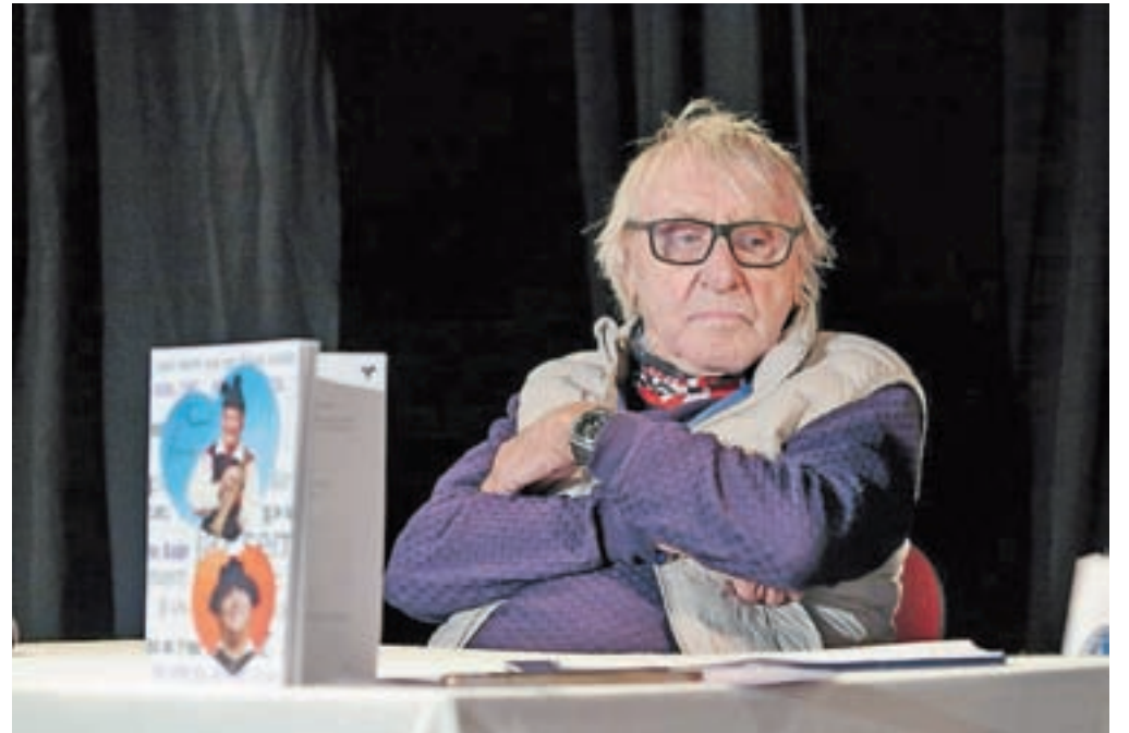
Predstavitve knjige je potekala prav na Koširjevi rojstni Koroški Beli v sklopu prireditve Postani Franc Košir za en dan.