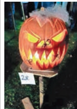
Strašne buče ...

Na otroškem igrišču na Kočni je Športno kulturno društvo (ŠKD) Obranca pripravilo že četrti tradicionalni kostanjev piknik z izrezljanimi bučami. "Izrezljane buče je prineslo na ogled kar 29 pridnih otrok s svojimi starši in starimi starši od blizu in daleč. Prav vsaka buča je odražala veliko ustvarjalnosti, domiselnosti in iznajdljivosti. Nastala je čudovita razstava, ki je v temi s prižganimi svečkami še bolj prišla