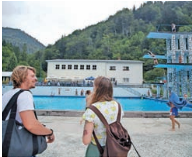
Največ dilem v sklopu razprave o predlogu proračuna je bilo okrog obnove bazena Ukova.

Večji projekti bodo nadaljevanje obnove Ruardove graščine, gradnja kanalizacije Lipce - Blejska Dobrava, širitev in rekonstrukcija prometne infrastrukture Poslovne cone Jesenice ... Prednost bodo imeli že začetni projekti investicije, ki so sofinancirane z državnimi oziroma evropskimi sredstvi. Odbori oziroma občinski svetniki so na predlog proračuna podali več predlogov, med drugim, da naj zagotovijo sredstva za subvencioniranje cene avtobusnih voznic za krajanje Potokov, enako kot v mestnem prometu. Predlagali so, naj