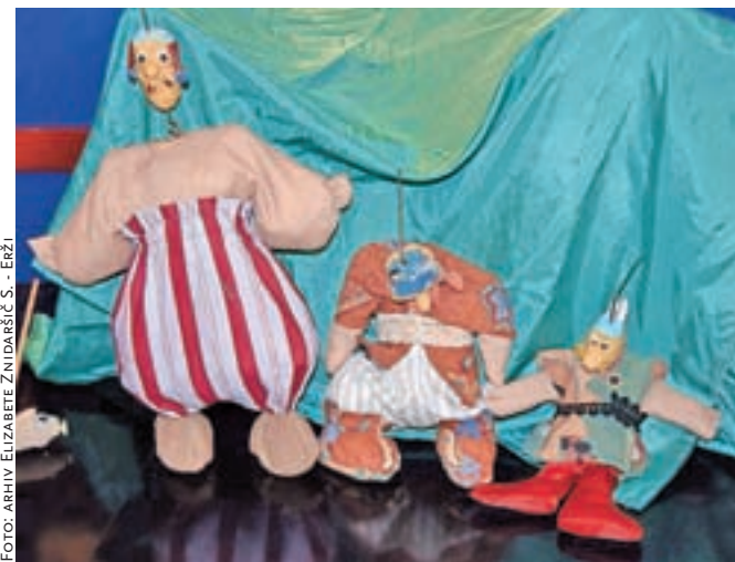
Lutke bodo znova zaživele na jeseniškem odru.