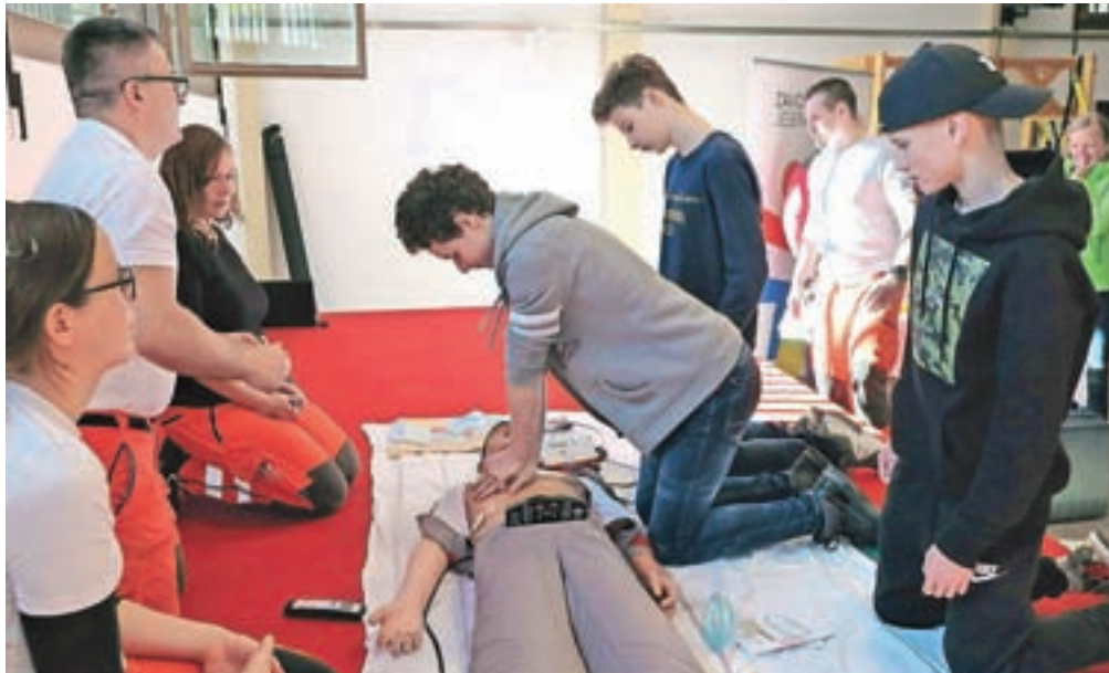
Če se temeljnih postopkov oživljanja in uporabe defibrilatorja naučijo že otroci, je to dragoceno znanje, s pomočjo katerega lahko rešujejo življenja.

"Raziskave kažejo, da se največ srčnih zastojev zgodi ravno v domačem okolju in da je preživetje ob nenadnem srčnem zastoju odvisno od osebe, ki prva nudi pomoč, zato je pomembno, da čim več posameznikov zna prepoznati srčni zastoj, da zna nuditi temeljne postopke oživljanja in uporabljati avtomatski zunanji defibrilator. Še vedno veliko ljudi umre, ker jim očitno