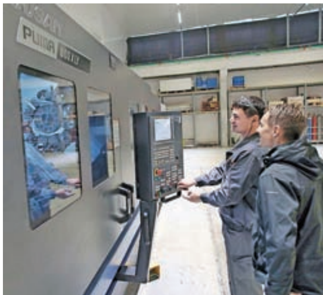
Najnovejši investiciji sta nova hala in najmodernejša CNC-stružnica za obdelavo jeklenih profilov velikih dimenzij.

Na slovesnosti so predstavili najnovejši investiciji, novo halo za CNC-obdelavo in najmodernejšo CNC-stružnico za obdelavo jeklenih profilov velikih dimenzij. Samo letos so za naložbe namenili že 1,3 milijona evrov. Podjetje je začelo delovati v letu 2009, doslej pa so v proizvodno opremo in nakup lastnih prostorov vložili že več kot 4,5 milijona evrov.