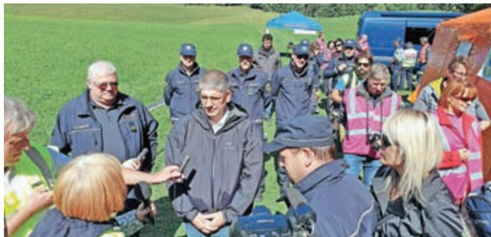
Vajo si je ogledal tudi minister za notranje zadeve Boštjan Poklukar.

Vajo si je ogledal tudi minister za notranje zadeve Boštjan Poklukar, ki je ocenil, da gre za realen scenarij, ki se lahko zgodi in se že je, saj ima Slovenija zgodovino letalskih nesreč. »Naloge policije so, da sodeluje tudi pri naravnih in drugih nesrečah. Tako je policija pomemben del te vaje, saj opravlja tako preiskovalne aktivnosti, identifikacije žrtev kot vzdrževanje intervencijskih poti in druge aktivnosti. Sistemi držav dobro sodelujejo in tudi sistem nacionalne varnosti v Sloveniji deluje, kar je na vaji tudi več kot očitno.«