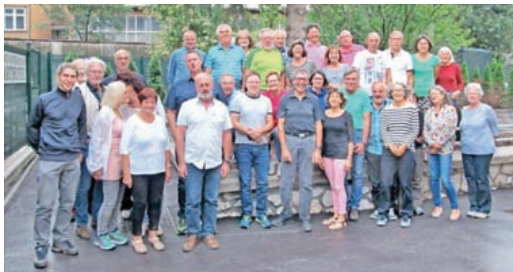
Člani planinske sekcije iz Nagolda so v tednu dni spoznavali Jesenice, okoliške kraje in osvojili več vrhov.

gradivo o mestu. Člani sekcije so se srečali tudi z jeseniškimi planinci. V pogovoru je bila izražena želja o tesnejšem sodelovanju in povezovanju. Dogovorili so se, da Planinsko društvo Jesenice prihodnje leto člane povabi na Golico v maju, v času cvetenja ključavnic.