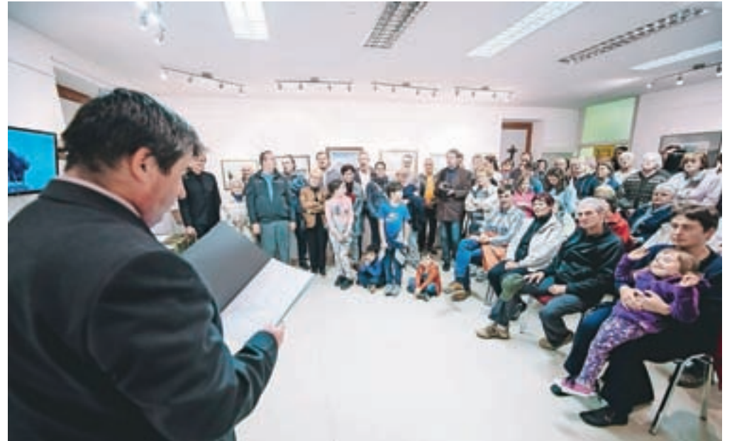
Z odprtja razstave

Po letu 1998 se je zelo zavzeto posvetil naravoslovni fotografiji. Iz tega obdobja je posnetek sive čaplje, za katerega je leta 2006 na razstavi ornitoloških fotografij v