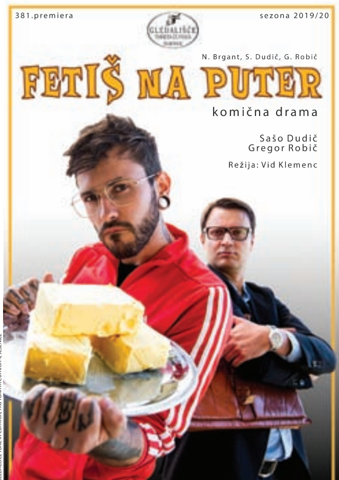
GLEDALIŠČE TONETA ČUFARJA, TRG DOMITRA ČUFARJA 4, JESENICE