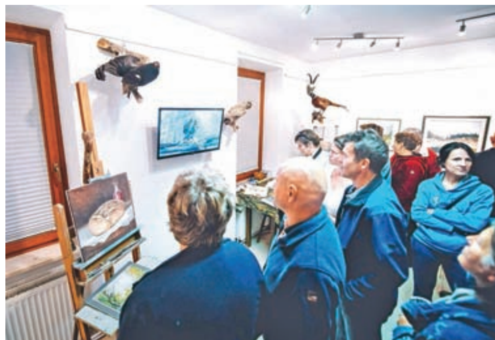
Na ogled so fotografije, likovna dela in tudi nekaj prepariranih živali.

Opus iz tega obdobja obsega več kot 10 tisoč fotografij. Vzporedno s fotografijami je ustvaril številne slike z