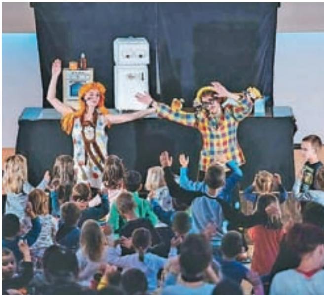
V torek, 1. oktobra, bo v Kolpernu potekal Ta prav živ žav, otroška prireditev ob Tednu otroka.

OSNOVNA ŠOLA KOROŠKA BELA, OD 7.30 DO 17. URE