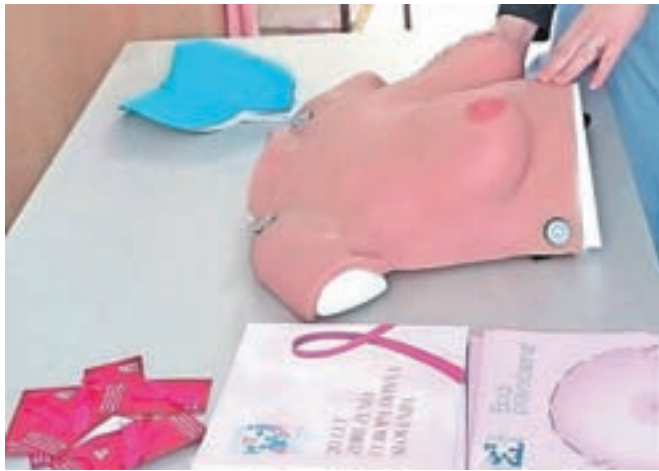
V jeseniškem zdravstvenem domu bodo na voljo informacije o samopregledovanju dojk.

vilnimi aktivnostmi opozoriti na pomen preventive, zdravega načina življenja, zgodnjega odkrivanja in učinkovitega zdravljenja bolezni, tako raka dojk, raka rodil in drugih vrst raka. Kot so zapisali na spletni strani, se umrljivost žensk za rakom dojk počasi zmanjšuje, predvsem zaradi odkrivanja manjših tumorjev in kakovostnega zdravljenja, ki postaja vedno bolj prilagojeno posamezni ženski in njenemu raku.