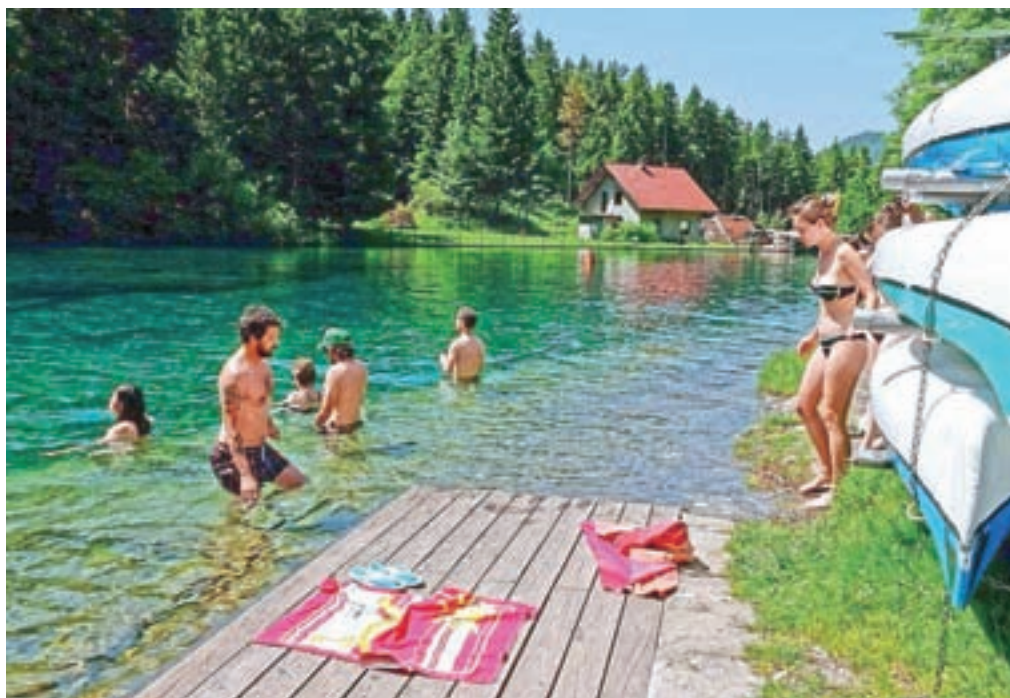
Delavnice se je udeležilo enajst udeležencev, ki so v vodi, ki je imela šest stopinj, preživeli od trideset sekund do dve minuti.

»Na mrzlo vodo se pripravimo z dihalnimi vajami, s katerimi aktiviramo notranji ogenj. Na delavnicah so začelniki v vodi od trideset sekund pa do dveh minut, jaz sem bil najdlje v vodi 25 minut, in sicer v Kamniški Bistrici, ko je imela tri stopinje. Po navadi pa sem v vodi osem, deset minut. Po za-