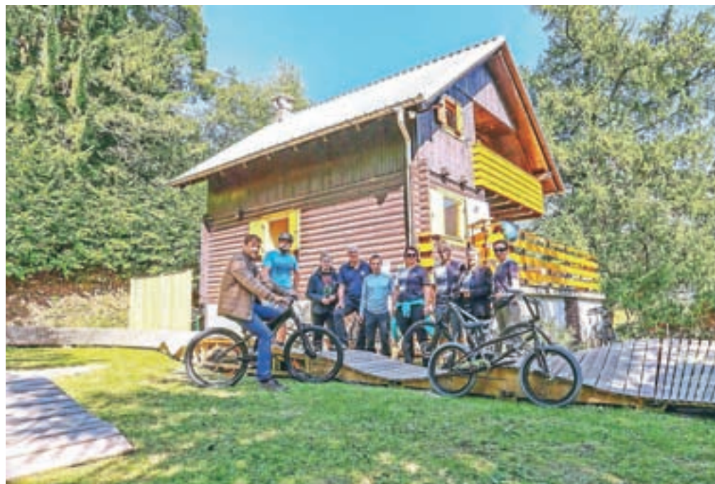
Uradno odprtje gorskega kolesarskega učnega centra in turnokolesarske poti Trans Karavanke je potekala prejšnjo soboto na Pristavi.