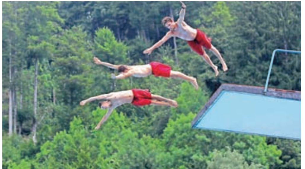
Fantje in dekleta iz skupine Dunking Devils so prikazali nekaj "trikov", saj imajo radi skakanje v vodo z višine.

namen športa in zabave in ohraniti kot simbol kulturne dediščine," je še dodal Veselko. Dunking Devils so v svetu vodilna akrobatska skupina, njeni začetki segajo v leto 2004. So svetovni prvaki v akrobatskem zabijanju, Guinnessovi rekorderji v najvišji salti z zabijanjem in najdaljšem skoku z zabijanjem s trampolina. Do sedaj so nastopili že več kot 1800-krat v kar 47 državah sveta. Poleg z energijo nabitih šovov so poznani tudi po viralnih videih, ki imajo že več kot 100 milijonov ogledov.