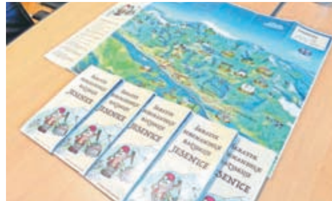
Zemljevid je namenjen predvsem mladim turistom, družinam z otroki in šolskim skupinam. Natisnjen je v slovenskem in angleškem jeziku.