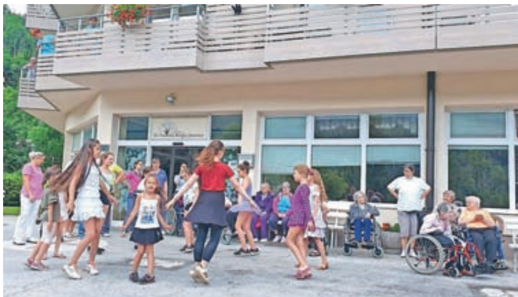
Otroški vrvež pred domom je prinesel veliko veselja stanovalcem.

Dom dr. Franceta Bergelja se ponaša s polnim certifikatom Družini prijazno podjetje. Posebno pozornost namenijo lažjemu usklajevanju službenega in družinskega življenja svojih zaposlenih. Eden od ukrepov je tako prav enotedensko počitniško varstvo za otroke zaposlenih.