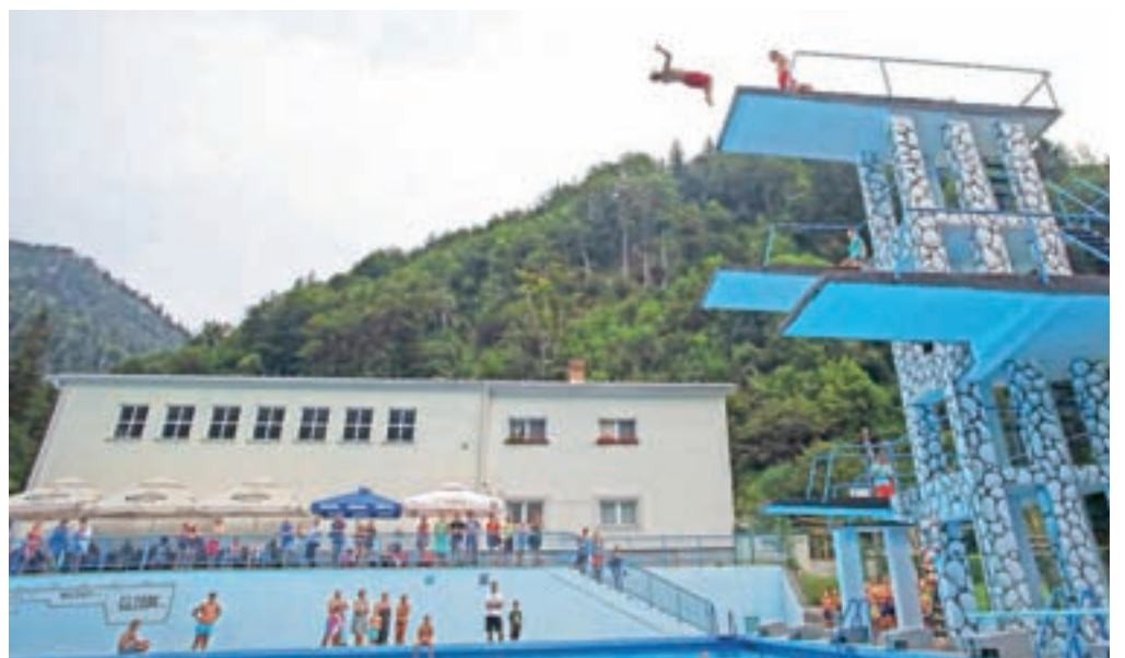
Skakalni stolp na kopaljšču Ukova je edini še odprti stolp v Sloveniji, Dunking Devils so ga obiskali že petič, tudi tokrat pa je nastop prekinila nevihta.