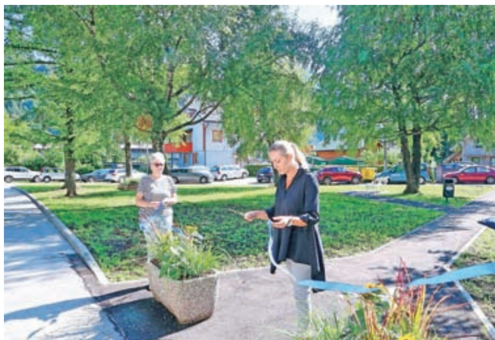
Urejen park v Kurji vasi naj bi postal prostor srečevanja in druženja krajanov. Tako vlogo je nekoč že imel ...