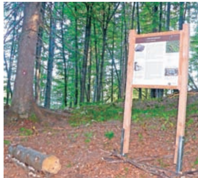
Na mesto padca meteorita so postavili informacijsko tablo s podatki o tem izjemnem dogodku.

Pohodniška pot nosi ime Potep po Mežakli, začne se na Kočni in poteka prek Poljanske Babe, planine Obranca, mimo Snežne jame, Planskega vrha, kjer je padel meteorit, do naravnega mostu na Mežakli, mimo razgledišča Špica do partizanske bolnišnice in Zakopa do Podmežakle. Označevanje vseh omenjenih naravnih in kulturnih znamenitosti ob poti bodo nadaljevali prihodnje leto.