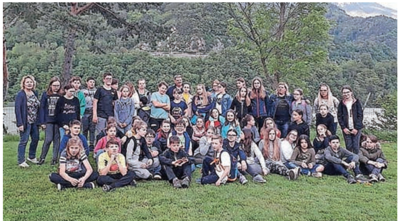
Zaključni izlet v Kamp Perun