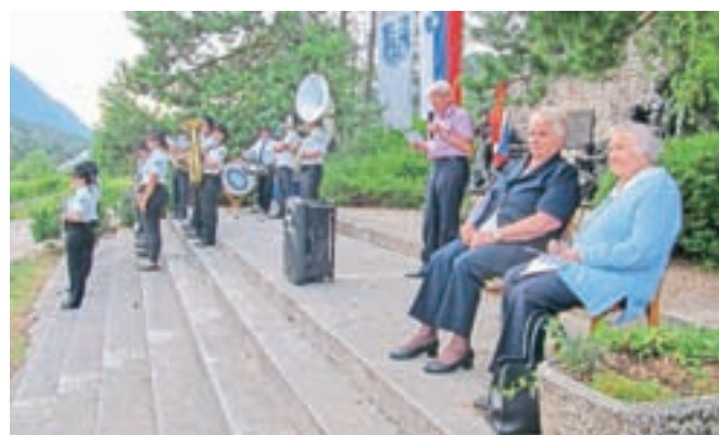
Spominska slovesnost na Belem polju