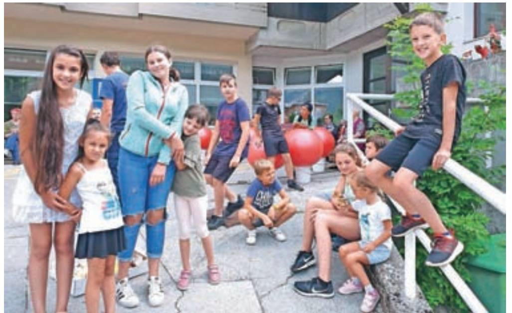
Otroci zaposlenih so uživali v pestrem dogajanju, ob igrah, delavnicah, izletih ...