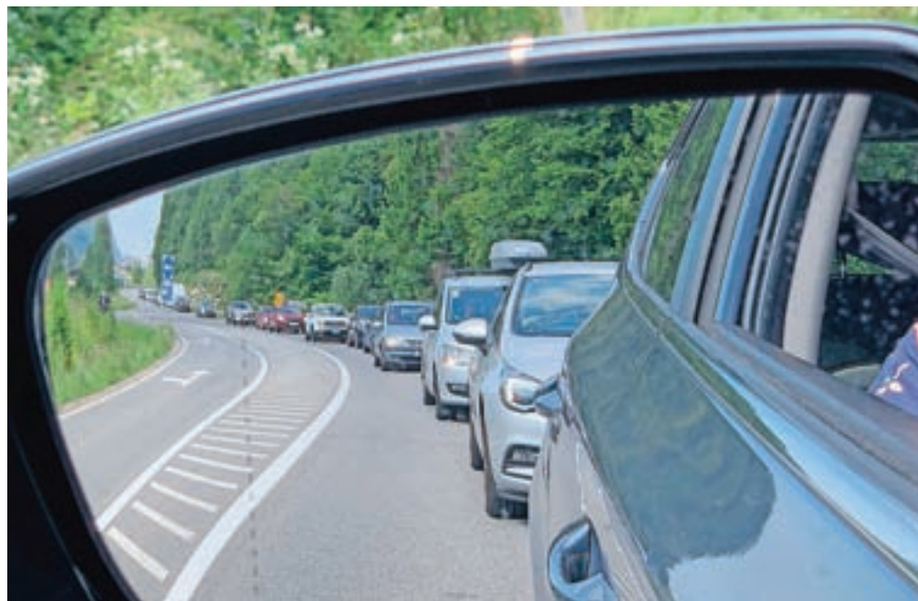
Manj svetla stran turizma: zastoje na gorenjski avtocesti in po novem tudi na magistralni cesti skozi Jesenice

Vrhunec turistične sezone pa ima tudi manj svetlo stran, to