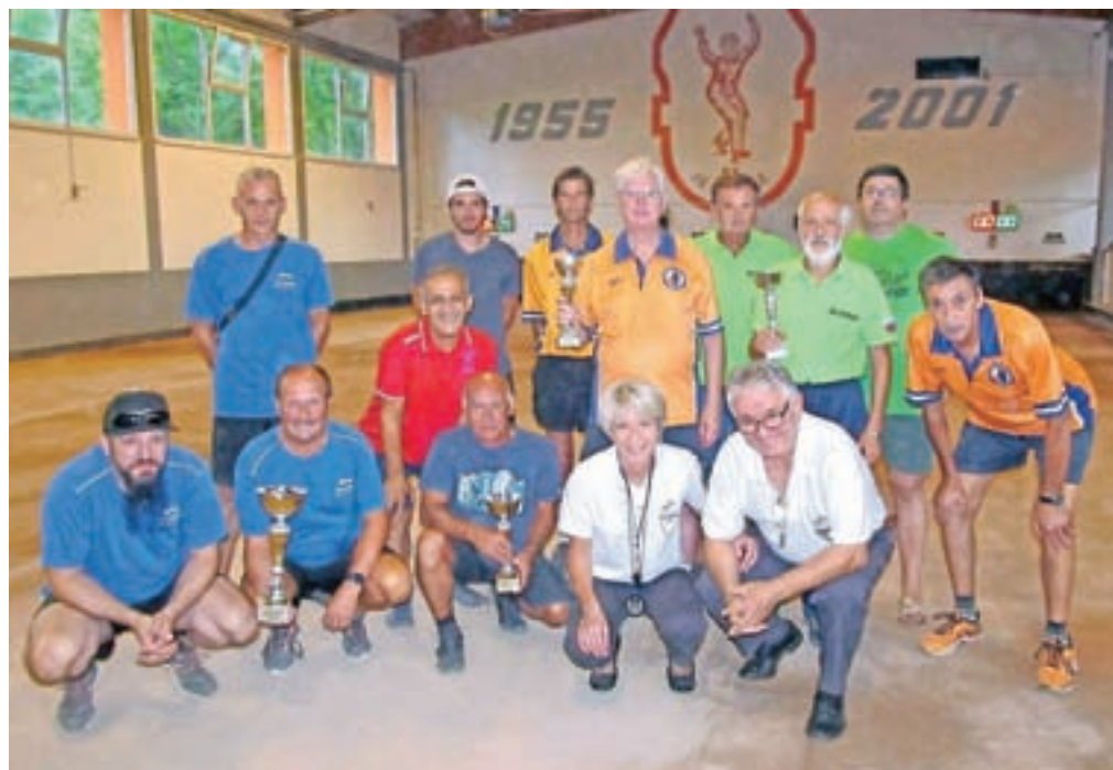
Najboljše ekipe balinarskega turnirja v Bazi