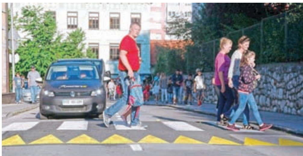
Občina Jesenice je pripravila zgibanko, s katero poskuša spodbuditi prebivalce Jesenic, da vsakodnevne poti bolj pogosto opravijo peš.

bile bi lahko uredili prometne površine za ostale udeležence v prometu (pešce in kolesarje), uredili manjše trge za druženje starejših in igro otrok, uredili več zelenih površin, ki v mestu na naraven način uravnavajo klimo in pripomorejo k bolj-