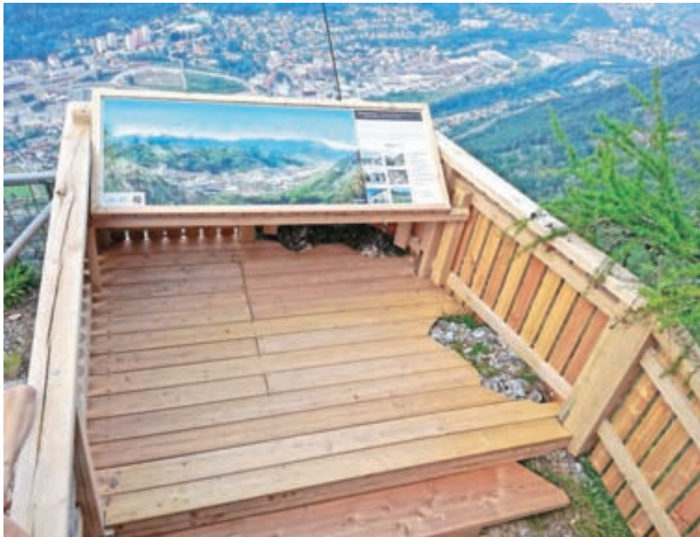
Novo urejeno razgledišče Špica pri televizijskem oddajniku na Mežakli: Čudovit razgled na celotne Jesenice in okoliške hribe.

»Razgledna ploščad ima poleg panoramske table na novo dodano tudi vpisno knjigo ter žig,« je pojasnila Nina Kobal z Razvojne agencije Zgornje Gorenjske. Kot je dodala, obe pridobitvi sodita pod okrilje projekta