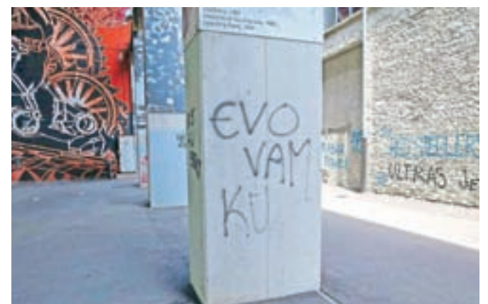
Grafiti so se med drugim pojavili na Stari Savi ...

cijo poškodb, ki so posledica vandalizma (grafitov, poškodovanih košev za smeti ali zabojnikov itd.) v lanskem letu nameniti nekaj tisoč evrov, ki bi jih v nasprotnem lahko namenili za kaj bistveno bolj koristnega. Pazimo torej na okolje, v katerem prebivamo – tudi to je namreč odraz naše (ne)kulture,« so poudarili in pozvali občane, naj v primeru, da opazijo tovrstno neprimerno ravnanje, opozorijo storilca samega ali pristojne službe.