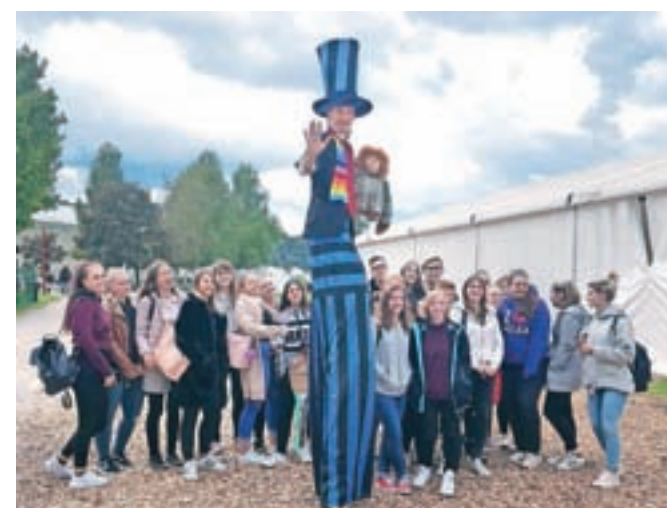
Jeseniški dijaki so sodelovali na Pikinem festivalu.

Pikin festival. Tema letošnjega festivala je bila Kraljestvo živali. Dijaki so se še šesto leto zapored preizkusili v vodenju ustvarjalnih delavnic za otroke, pri čemer so dobili kar nekaj idej za ustvarjanje z otroki v vrtcu. Popoldne pa so si ogledali še ostala dogajanja na prizorišču festivala.