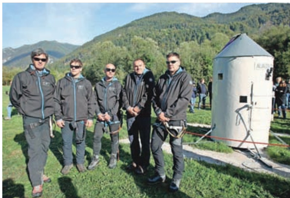
Ekipa iz podjetja KOV skupaj z direktorjem na helidromu v Mojstrani, preden so se s helikopterjem odpeljali na vrh Triglava ... / Foto: Gorazd Kavčič

www.teradom.si | info@teradom.si | 080 14 12 | 040/66 66 12