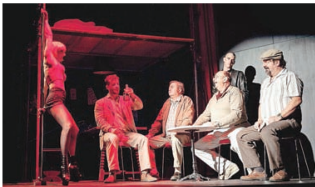
"Predstava deluje kot odlična celota, ob kateri gledalci pozabimo, da smo jo sploh že poznali s filmskega platna," je zapisala žirija.

Kot je žirija zapisala v obrazložitvi, je filmsko zgodbo težko prenesti na odrske deske, sploh če gre za gledališko priredbo enega najuspešnejših slovenskih filmov. "Vendar predstava Petelinji zajtrk ni iskala vzporednic s svojim filmskim predhodnikom, temveč je našla svoj edinstven gledališki izraz. In to zelo uspešno. Celotna ekipa je svoje delo opravila izvrstno. Premišljena režija je igral-