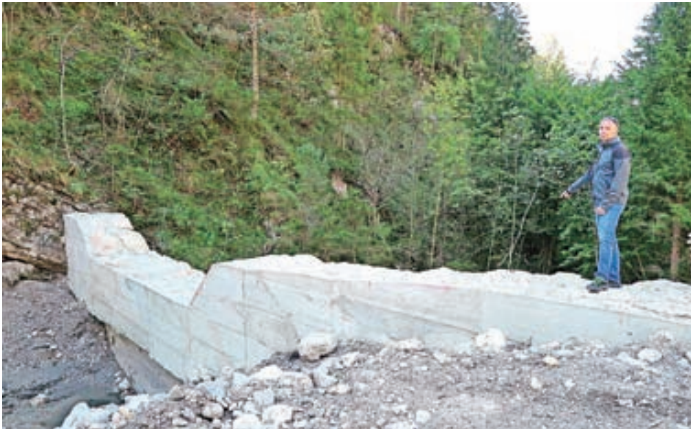
Prodne pregrade so namenjene zadrževanju materiala, ki ga hudournik prinese iz zalednih grap s planine. Pregrado pri vodohranu nad vasjo so že dvignili za en meter in s tem povečali zaplavni prostor za njo. Ko bo zgrajena cesta, bodo zgradili še dve novi pregradi.

V potoku Bela na Koroški Beli sicer poteka tudi celovita sanacija struge, ki jo izvaja Vodnogospodarsko podjetje (VGP) Kranj. Dela potekajo celo hitreje od načrtov, so zadovoljni na Občini Jesenice. Dela so začeli pri mostu čez potok Bela pri gasilskem domu in potekajo gorvodno do prve prodne pregrade. Sledila bo sanacija struge na ostalih odsekih skozi naselje Koroška Bela. Prodna pregrada pri vodohranu je že nadvišana, sledila bo gradnja dveh novih prodnih pregrad, še eno obstoječo prodno pregrado pa bodo očistili. Ta dela financira država, končana naj bi bila do maja prihodnje leto, stala pa bodo 550 tisoč evrov. Sanirana struga bo pripomogla k boljšemu odvajanju padavinske vode in plavin, prodne pregrade pa bodo zadrževale večje količine plavin, ki bi sicer lahko ogrozile kraj. Pri vseh teh ukrepih, ki bodo pripomogli k zmanjšanju ogroženosti prebivalcev pred morebitnimi pobočnimi premiki, torej sodelujeta tako občina kot država.