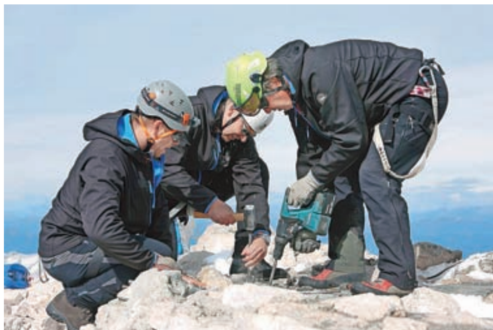
... kjer so sodelovali pri namestitvi stolpa na nove temelje in pričvrstitvi na štiri jeklenice.