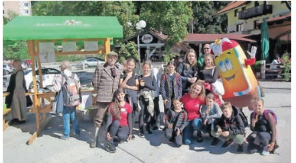
Svetovni dan turizma na Čufarjevem trgu

"V zgodbo so vpeta pravljica na bitja, obenem pa je vodilo projekta Turizmu poma-