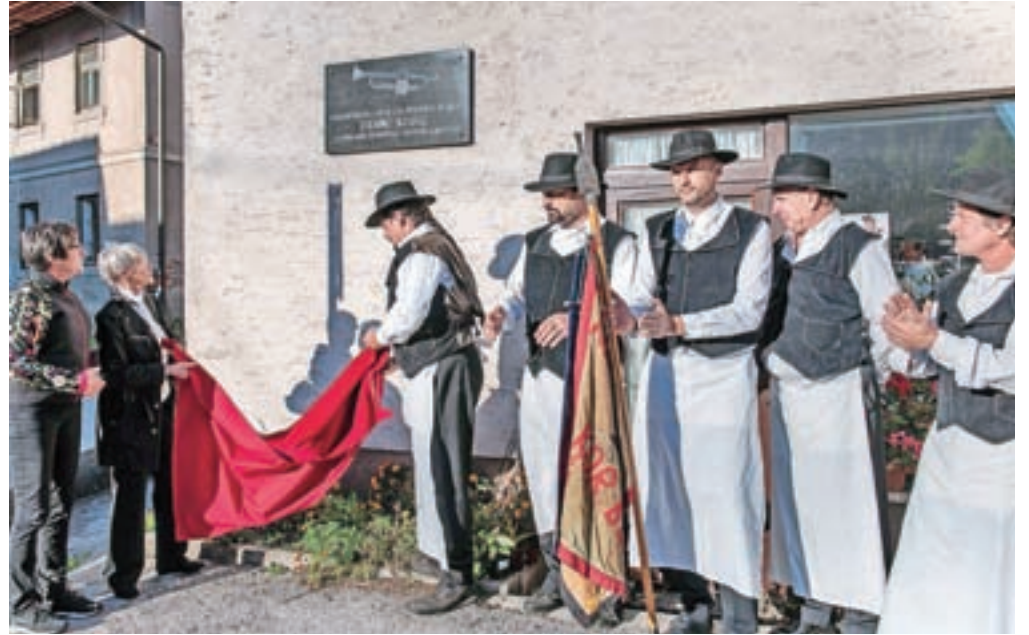
Spominska plošča na Novakovi hiši sredi vasi

hodil okrog in ni bil veliko doma, a ko je bil, smo se res imeli fletno. Veliko smo hodili na izlete, po Nemčiji, Švici, tudi na morje, ko je imel čas. Bili smo fajn družina," je dejal Klemen, na vprašanje, koliko očetovih genov je podedoval, pa je odgovoril: "Ljudje pravijo, da mu postajam vedno bolj podobni. Zabavljaške gene imam sigurno njegove, nisem pa podedoval njegove pridnosti in vztrajnosti. On je trobento vadil tudi po šest do osem ur na dan, sam pa ravno zato nisem resno igral nobenega instrumenta, ker nisem imel te vztrajnosti. No, sem pa našel svoj hobi v gledališču, kjer pa vendarle vztrajam ..."