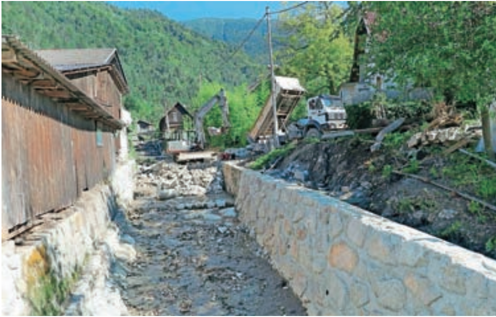
Dela v strugi potoka na Koroški Beli, ki jih izvaja VGP Kranj, potekajo še hitreje od načrtov.