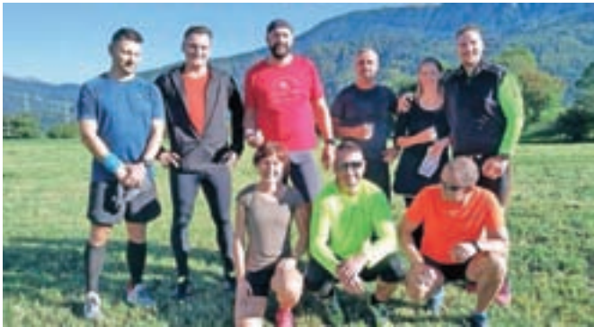
Ekipe Občine Jesenice na teku

Tudi letos, že četrty zapored, je ob svetovnem dnevu srca, 29. septembru, potekal promocijski Tek gorenjskih bolnišnic. Kar 220 tekačev v 29 ekipah je startalo izpred Splošne bolnišnice Jesenice, tekli so po lokalnih cestah in kolesarskih poteh do Golnika. Celotna trasa je bila dolga 43 kilometrov, vsak tekač je pretekel del trase, nekateri pa tudi celotno. Poleg zaposlenih v gorenjskih bolnišnicah so na teku sodelovali tudi predstavniki drugih zdravstvenih zavodov, lekarn, policisti, gasilci, gorski reševalci, vojaki, čebelarji, svoje ekipe so imele nekatere občine, tudi Občina Jesenice.