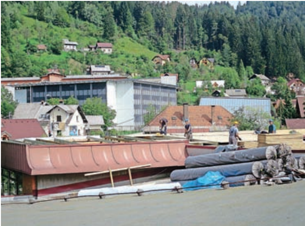
Obnova strehe na OŠ Toneta Čufarja ni potekala tako, kot bi morala. Zdaj bo dela opravil drug izvajalec.