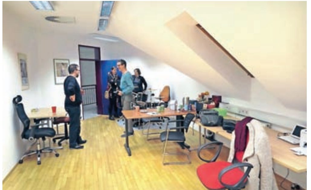
Ena od pisarn na Spodnjem Plavžu, v kateri se združujejo člani skupnosti.