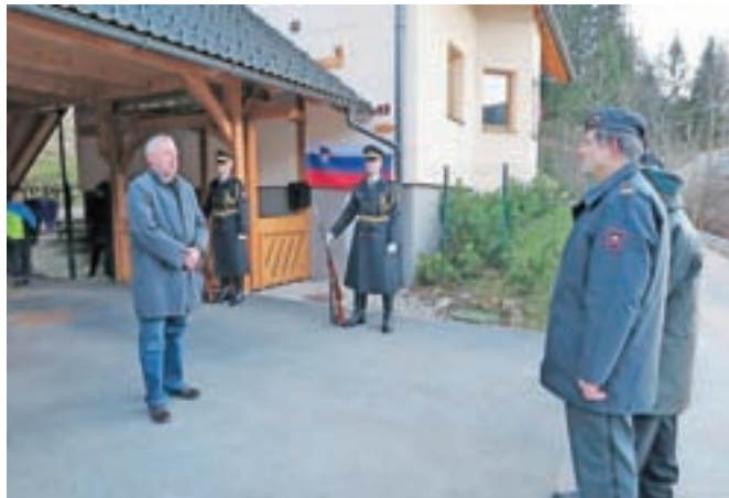
Odkritje spominske plošče na hiši Klinarjevih v Planini pod Golico

Podoben pogum in brezmerno odločnost so izkazali tudi Svetinovi in Jakopičevi, ki so v tistih negotovih časih pomagali tlakovati pot v slovensko samostojnost, v zahvalo in spomin pa so tudi na njihovih hišah odkrili spominske tabli.