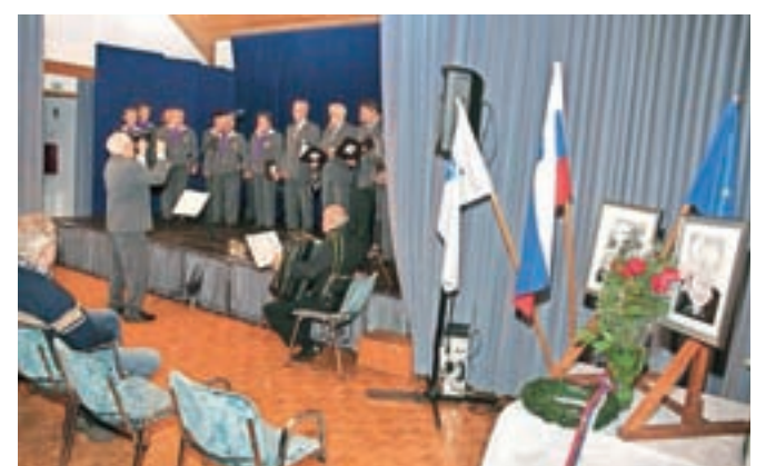
Koncert pevskega zbora veteranov vojne za Slovenijo v spomin na Maistrove borce