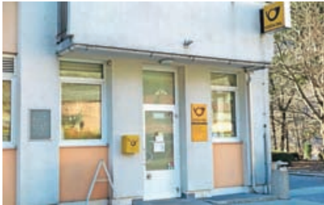
Na vratih je že nalepljeno obvestilo, da bo pošta 4272 Jesenice zadnjič poslovala 30. decembra 2016 ...

"Do zaprtja pošte na Javorniku ne sme priti." To je odločno stališče Sveta Krajevne skupnosti (KS) Slovenski Javornik - Koroška Bela, s katerim so se odzvali na napoved Pošte Slovenije, da bo poslovalnica Pošte na Slovenskem Javorniku 30. decembra letos zadnjič obratovala. Novica je povzročila ogorčenje tudi med krajanji, so poudarili v svetu KS, zato so že julija letos na prošnjo, naj izdajo mnenje o nameravanem zaprtju, zapisali naslednje: »Svet KS je odločno proti zaprtju pošte na Javorniku v prepričanju, da bodo številni, predvsem starejši, ki jih je v našem kraju zelo veliko, nad zaprtjem pošte ogorčeni. Hitri razvoj informacijske tehnologije zanesljivo vpliva na pogoje