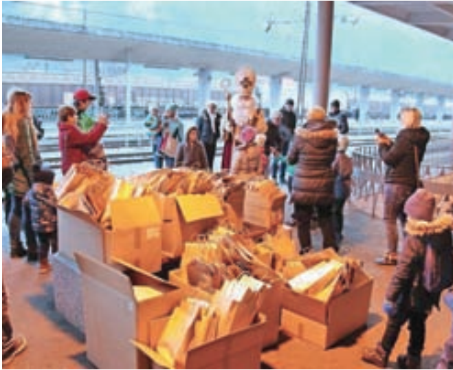
Otroke sta pred odhodom na vlak pričakala Miklavž in kopica daril.

Društvo Ejga je v sodelovanju s Slovenskimi železnicami že tretjič pripravilo praznični izlet z muzejskim vlakom do Bohinjske Bistrice, otroke pa je obiskal in obdaroval tudi Miklavž.