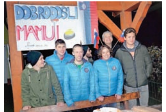
Članice in člani Curling kluba Jesenice so pri Gregorijevih na Lipcah privedli prisrčen sprejem za člane ekipe in jim čestitali za dosežen uspeh.

je uspelo obstati v drugi elitni B skupini evropskega curlinga. Vanj so se Slovenci uvrstili lansko leto, z zmago v skupini C. Curling v Sloveniji je še mlad, saj je ta šport k nam prišel pred šestimi leti. Uspeh je še toliko večji, če vemo, da pri nas ni dvoran za curling niti profesionalnih trenerjev. Za vabo na pravem ledu za curling ledu se morajo peljati v Kitzbühel ali v Bratislavo.