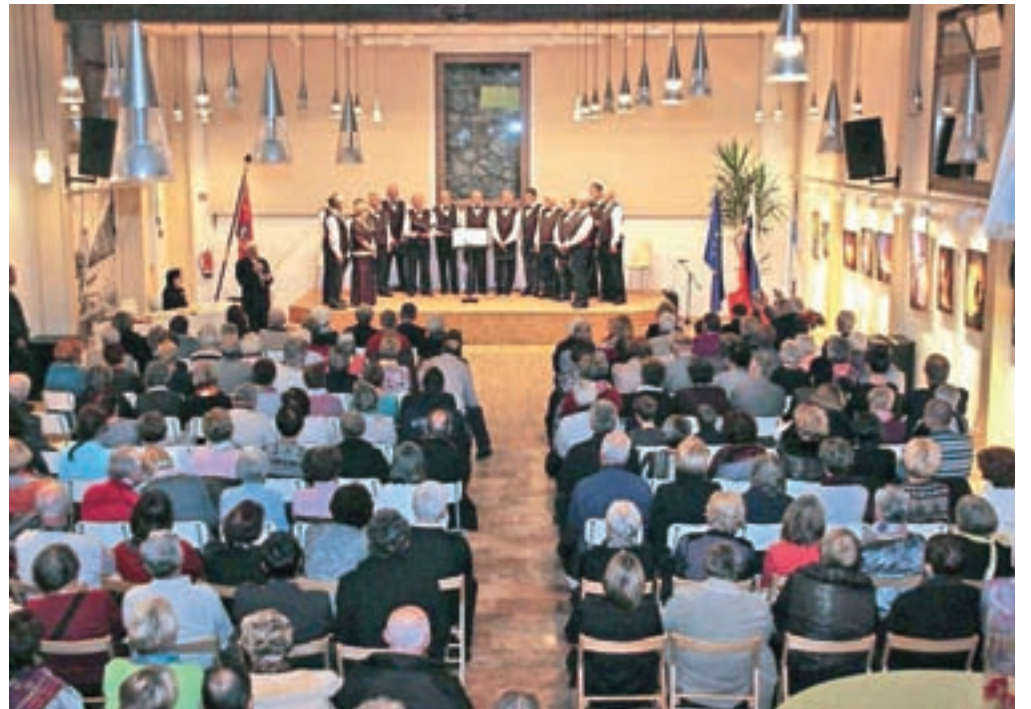
Pevski zbor upokoјencev na koncertu ob 55-letnici delovanja v nabit polni dvorani Kolpern

Moški pevski zbor Društva upokoјencev Jesenice letos praznuje 55 let svojega neprekinjenega delovanja. Ob tem visokem jubileju so v petek, 25. novembra, v bankeetni dvorani Kolpern pripravili koncert slovenskih pesmi, obisk pa jih je kar nekoliko presenetil, saj je pojoče upokoјence pričakala nabit polna dvorana. Publika so izkušeni pevci tudi tokrat povsem očarali ter jim s svojimi glasovi pričarali lepoto minulih let, nočno vasovanje pri dekletu, lepoto mladih deklet, veselo vigred, večer na vasi, mogočnost Triglava in ljubezen do domovine. Dokazali so, da znajo zapesti tako narodne kot tudi umetne domače pesmi. Svojo ljubezen do slovenske pesmi so prenesli na vse poslušalce in ni jih bilo malo, ki so šepetaje peli skupaj s pevci. Kot gosti so na koncertu nastopili še Mešani pevski zbor Odmev iz Kranjske Gore in Folklorna skupina Julijana, ki