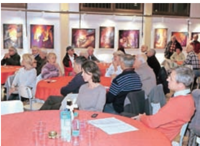
Društvo metalurških inženirjev in tehnikov Jesenice vsako leto praznuje god sv. Barbare.