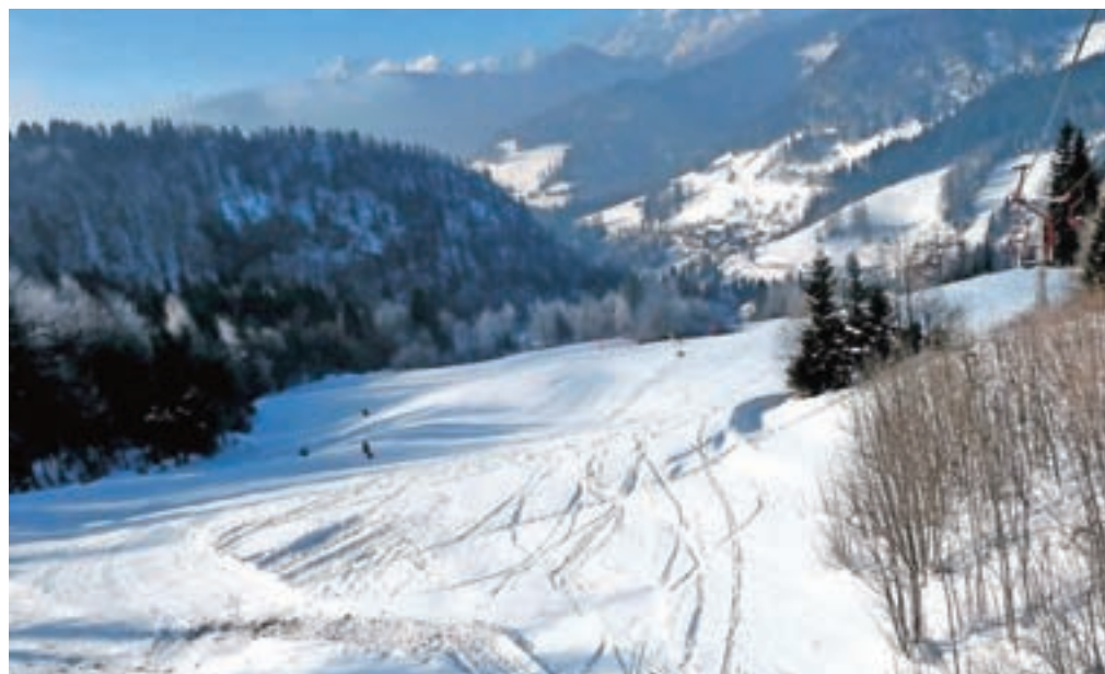
Smučarska pravljiča izpred nekaj let ... / FOTO: ANDRAŽ SODJA (ARHIV)

brih deset tisoč vozovnic. Analize tudi kažejo, da naj bi se število dni s snežno odejo v prihodnje še zmanjševalo, zlasti na nadmorskih višinah med 1000 in 1500 metri. Na Občini Jesenice so ocenili, da se gradnja sistema za dodatno zasneževanje ekonomsko ne izplača, poleg dragega sistema za umetno zasneževanje pa je nujno potrebna nova infrastruktura. Sedežnica je namreč zastarela, postavili so jo leta 1964, smučar pa se z njo do vrha vozi dvanajst minut, kar je, kot so zapisali, za sodobni smučarski turizem nesprejemljivo. Kljub temu pa bi na tem območju lahko razvijali druge dejavnosti, če bi se našla podjetniška iniciativa, menijo na Občini Jesenice. Kako so se sinoči odločili občinski svetniki, do zaključka redakcije ni bilo znano, o tem bomo poročali v naslednji številki Jeseniških novic.