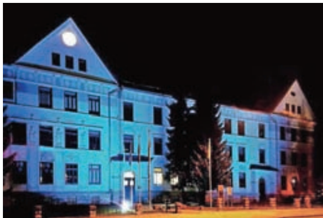
Stavba Gimnazije Jesenice je bila teden dni osvetljena z modro barvo.

korne bolezni je tako v Zdravstvenem domu Jesenice kot v Splošni bolnišnici Jesenice potekalo brezplačno merjenje krvnega sladkorja in krvnega tlaka ter svetovanja glede preprečevanja in zdravljenja sladkorne bolezni.