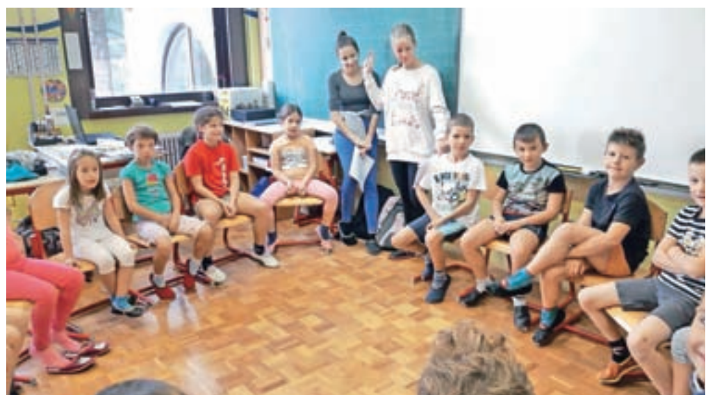
Starejši učenci so poučevali tudi na razredni stopnji.