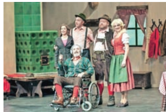
Resničnostni šov na odru

znamke Holzer Vid Klemenc, se vse skupaj dogaja pod goro Matterhorn, kjer v gorski vasi živi družina Holzer, ki se domisli, da bi lahko dobro zaslužila z resničnostnim šovom, v katerem obiskovalci lahko spremljajo avtentično življenje na gorski kmetiji. Šov postane pravi hit in Holzerjevi odidejo na turnejo po svetu, pridejo tudi na Jesenice ... Kot je dejal Klemenc, gre za družinski šov, zato je primeren tudi za otroke.