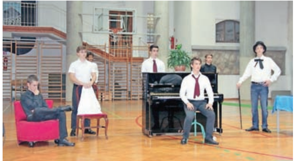
Uspešnim dijakom in študentom bo župan Jesenic ob vsakem občinskem prazniku podeljeval priznanja z denarno nagrado.

Na Občini Jesenice so se odločili, da bodo odslej (tako kot v nekaterih drugih občinah) nagrajevali tudi odlične dijake in študente. Tako so v nedavno spremljeni odlok o občinskih priznanjih dodali novo vrsto priznanj, to je priznanja župana za uspehe v času šolanja. Priznanja, ki jih bo župan podelil ob prazniku občine 20. marca, so namenjena odličnim dijakom srednjih šol, ki so dosegli izjemen uspeh na maturi (so zlati maturantje), in odličnim študentom, ki so zaključili študij s povprečno oceno vseh letnikov študija in diplomske naloge 9,5–10. Priznanja so namenjena dijakom in študentom, ki imajo stalno prebivališče v občini Jesenice. Poleg priznanja bodo dijaki prejeli