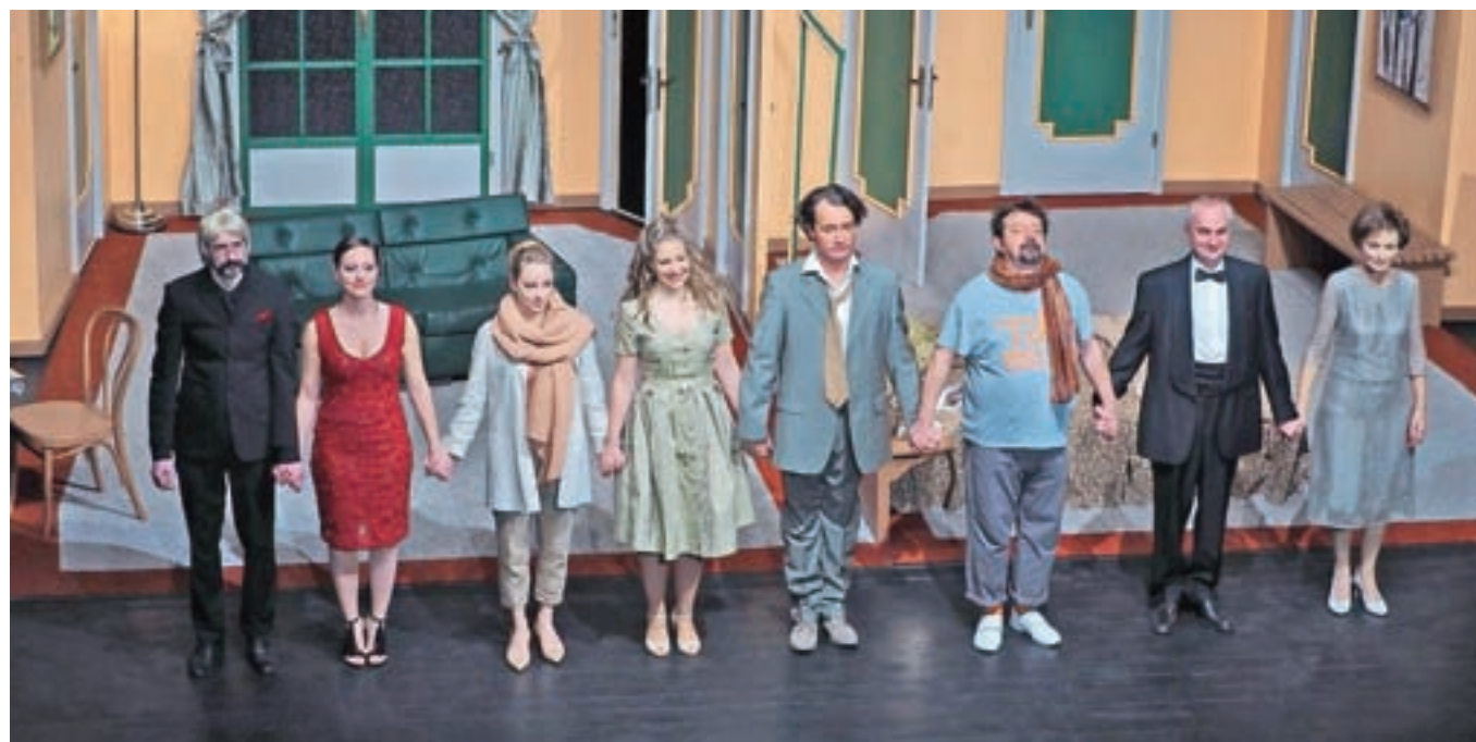
Predstava Ti nori tenorji je prepričala tako strokovno žirijo kot občinstvo.