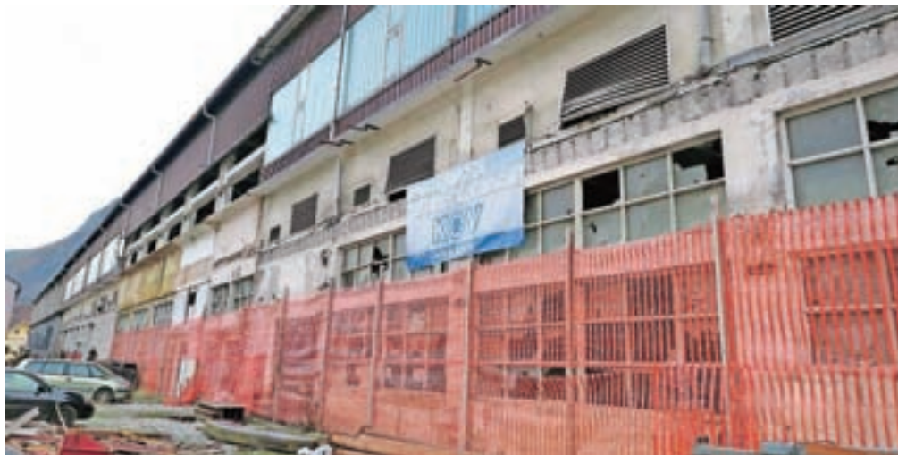
Stavba nekdanje lužilnice kislin bo postala sodoben poslovni objekt, v njem bo tudi interni učni center za kovinarje.