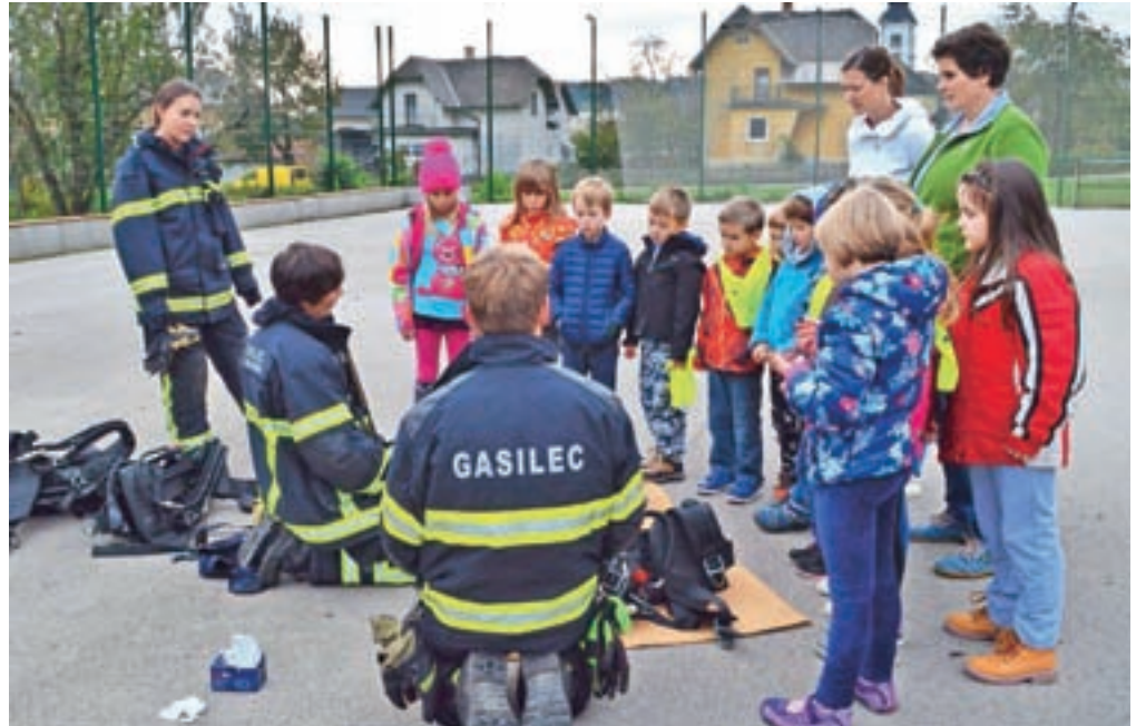
Po končani vaji so gasilci otrokom predstavili svoje delo in opremo.

V ponedeljek, 17. oktobra, je šolarje Podružnične šole Blejska Dobrava in otroke vrtca Ivanke Krničar na Blejski Dobravi iz razredov pregnal dim. K sreči so ga ustvarili gasilci PGD Blejska Dobrava, ki so v sklopu meseca požarne varnosti izvedli vsakoletno vajo evakuacije in reševanja otrok. "Otroke je kuharica obvestila, da v kuhinji gori, zato so organizirano odšli iz stavbe. Dva razreda otrok sta iz razreda odšla po požarnih stopnicah, otroci iz vrtca so iz igralnice prišli po prednjih stopnicah, en razred otrok pa je splezal kar skozi okna telovadnice. Zbrali so se na zbirnem mestu na igrišču šole, kljub temu da je oznako zbirnega mesta nepridiprav že kmalu po namestitvi odtujil. K sreči so otroci dobro naučeni, za kar se lahko zahvalimo učiteljicam in mentoricam pri gasilskem krožku. V tem času so na prizorišče prišli tudi gasilci PGD Blejska Dobrava. Vodja intervencije je pri odraslih