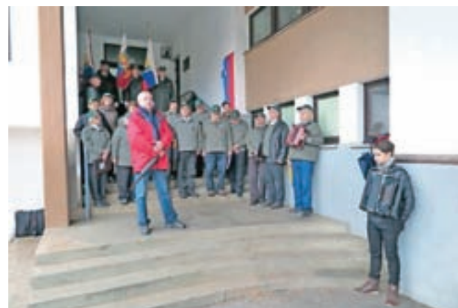
... in na stavbi kulturnega in gasilskega doma.