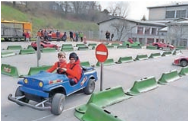
Otroci preizkusijo mini avtomobile na bencinski pogon Jumicar.

Svet za preventivo in vzgojo v cestnem prometu Občine Jesenice že vrsto let sofinancira program Jumicar, v sklopu katerega otroke seznanijo s prometnimi znaki, z osnovno kulturo v cestnem prometu, pravili varnega gibanja po prometnih površinah ... Posebej zanimiv za najmlajše pa je praktični del, kjer se otroci preizkusijo v vožnji z Jumicar mini avtomobilčki na bencinski pogon, ki imajo vse elemente pravega vozila od varnostnega pasu, zavornega pedala in pedala za plin. Program je namenjen učencem druge triade jeseniških osnovnih šol.