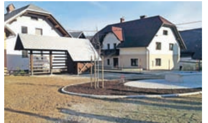
Vaško jedro bo namenjeno druženju krajanov.

ocenjena vrednost del 30 tisoč evrov, pa je bila končna vrednost izvedenih del zaradi prostovoljnega dela krajanov in lokalnih obrtnikov in podjetnikov le dobrih 12 tisoč evrov. "Ob tem se zahvaljujemo vsem sodelujočim, ki so poskrbeli, da je vaško jedro začelo dobivati svojo podobo, ki bo namenjeno druženju in povezovanju krajanov ob različnih dogodkih," so povedali na Občini Jesenice.