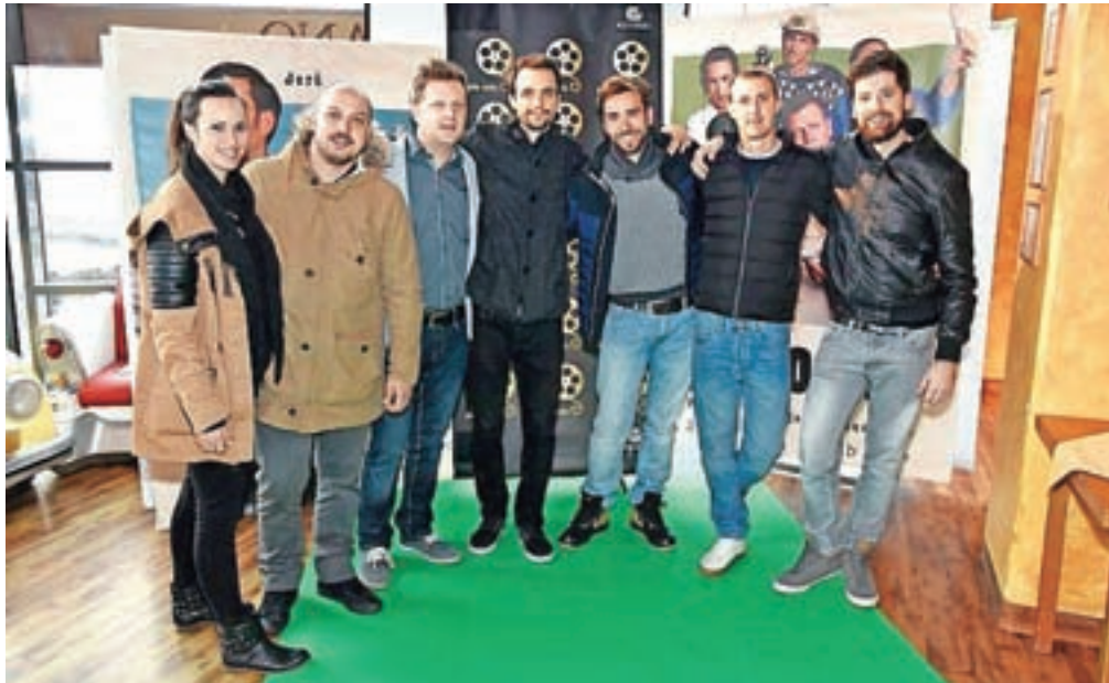
Filmska ekipa Pr' Hostar

Filmsko uspešnico so njeni avtorji zasnovali na spletni seriji, celovečerni film pa so posneli v letu dni z minimalnim proračunom. Dogaja se na idiličnem gorenjskem podeželju, v majhnem hotelu Pr' Hostar, ki posluje razmeroma slabo.