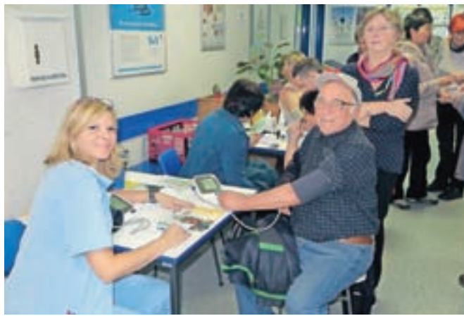
Na meritvah v Zdravstvenem domu Jesenice se je ustavilo tudi dvaindvajset pohodnikov Društva diabetikov Jesenice.