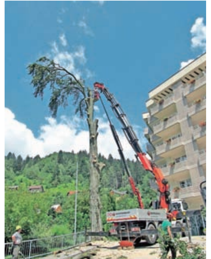
Naslednji dan je sledilo podiranje 32 metrov visoke bukve, ki jo je načel zob časa.

nich in v Zgornjesavski dolini. Delo so opravili profesionalno, brez težav. Veliko dvigalo, s katerega so žagali veje in deblo, so morali pripeljati celo iz Ljubljane.