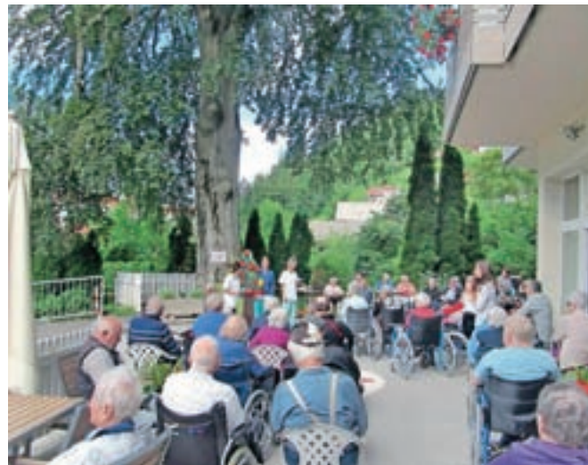
Stanovalci so se od stare bukve poslovili s posebnim dogodkom.

Naslednji dan je sledilo podiranje, ki je bilo za izvajalca, družbo Elektrogradnje Štefelin iz Planine pod Golico kar zajeten zalogaj. Z 32 metri je bila bukev prava velikanka, največja na Jese-