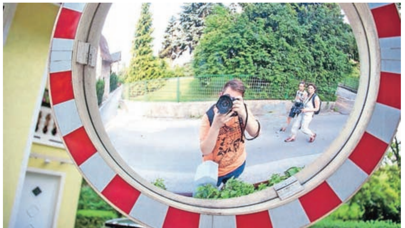
Iskanje najbolj zanimivih točk za fotografiranje / FOTO: NIK BERTONCELJ

ri Nik. Mentor je nato po določenih kriterijih med deli izbral najboljše, ki je bilo tudi nagrajeno. Vodja filmske delavnice, devetnajstletni Blaž Dobravec je izrazil željo po takšnih delavnicah tudi v okviru osnovnih in srednjih šol. Za konec pa dodal še: »Opazil sem, da mladi filma ne gledajo z glavo. Manjka jim razmišljanja, ki jim pokaže bistvo filma, na takšnih delavnicah pa v prvem delu razložimo tudi način razmišljanja in film razdelimo na različne dele, kar razkrije najpomembnejše sporočilo.«