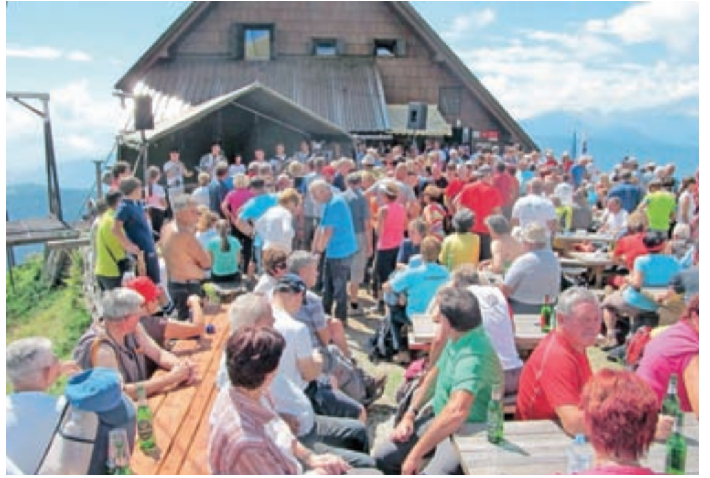
Koča Planinskega društva Jesenice na Golici se je ta dan pomembno vpisala v zgodovino. Okoli 1500 planincev se je zbralo na Dnevu Jeseničanov, več jih je bilo menda le na slovesnosti ob odprtju koč leta 1984.