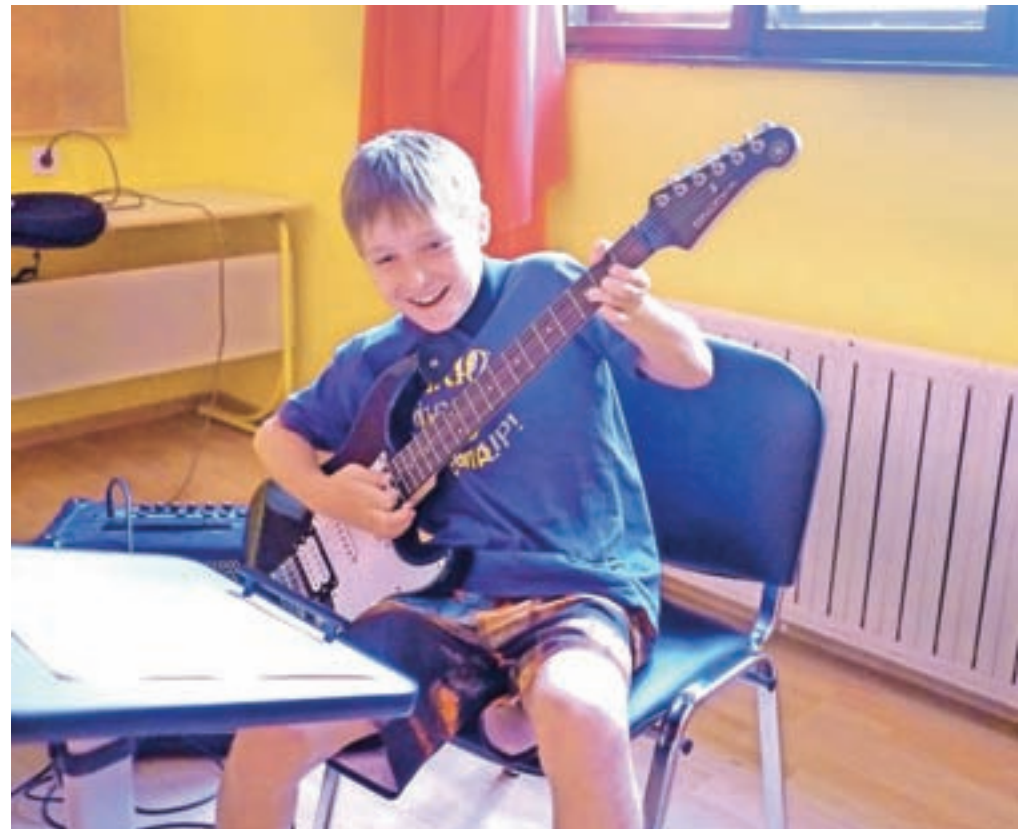
Kitarska delavnica

Kitarska delavnica je bila organizirana kot dan odprtih vrat t. i. Kitarskega orkestra, ki združuje tako mlade kot tudi malo starejše ljubitelje glasbe. Želijo si novih članov, zato so skupaj s centrom pripravili javno vajo, kjer se je kdorkoli lahko naposlušal, nagledal ali pa tudi naigral. »Radi bi se predstavili tudi javnosti in tako mogoče pridobili še kakšnega novega člana, zato so takšne delavnice več kot odlična ideja. Vabljen je resnično kdorkoli, popolnoma amaterski igralec, malo bolj profesionalen ali pa le ljubitelj kitarskih zvokov,«