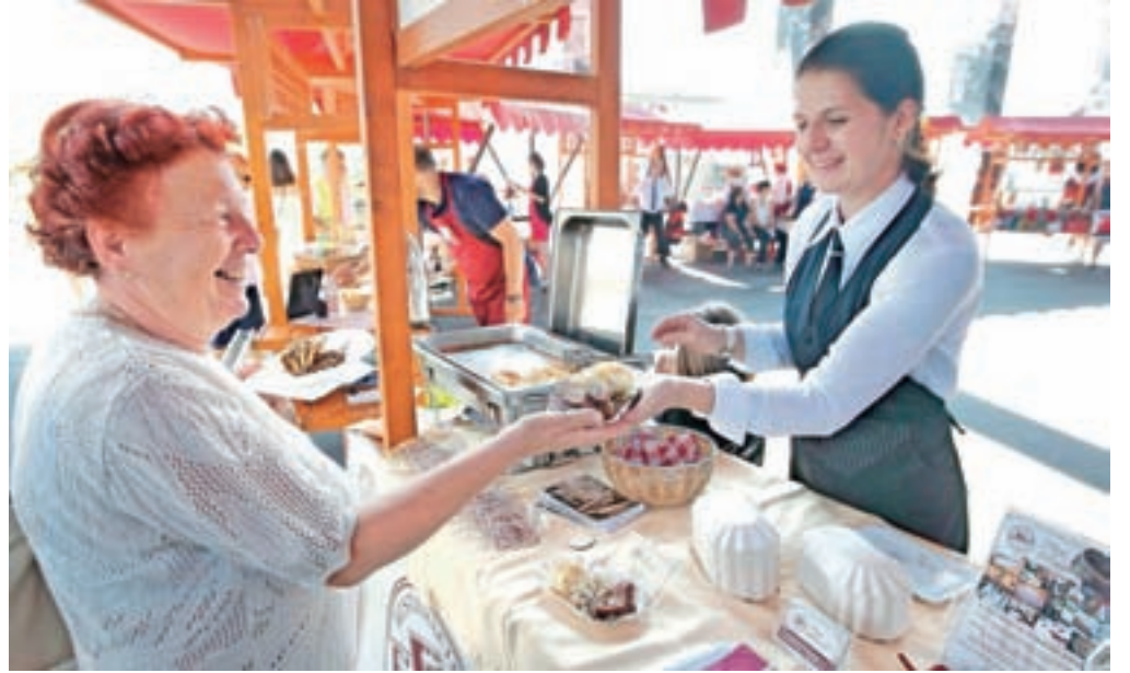
Na stojnici Hiše kulinarike Ejga so obiskovalci lahko poskusili značilne slovenske jedi: kranjsko klobaso s kislim zeljem in domačimi skutnimi štruklji.