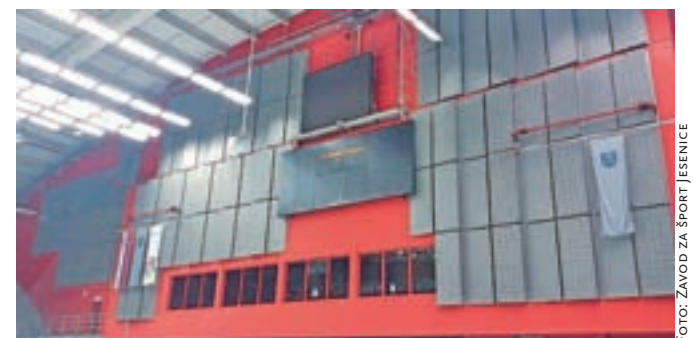
Veliki ekran – big screen na zahodni strani dvorane

Da bo spremljanje tekem v Športni dvorani Podmežakla lažje, so v Zavodu za šport Jesenice na zahodni strani dvorane ponovno namestili tudi veliki ekran – big screen.