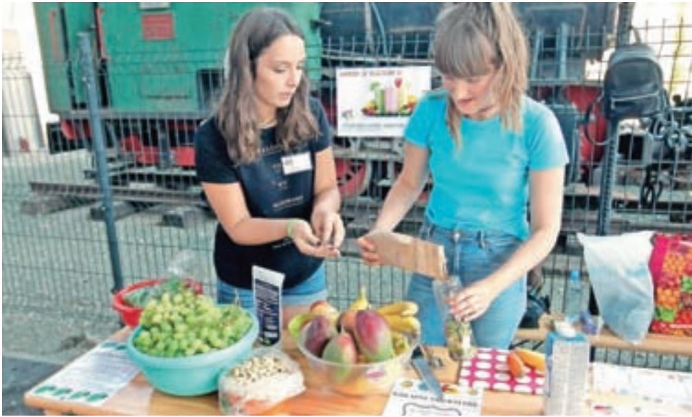
Dekleta iz Mladinskega centra Jesenice so pripravljala zdrave smutije, od zelenega do korenčkovega in čokoladno-bananinega.