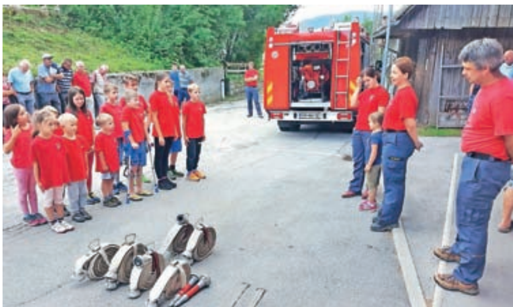
Gasilska vaja z najmlajšimi / FOTO: FACEBOOK

pod Golico v znamenju kmečkih iger. Štiri ekipe so se tokrat pomerile v setavlja-