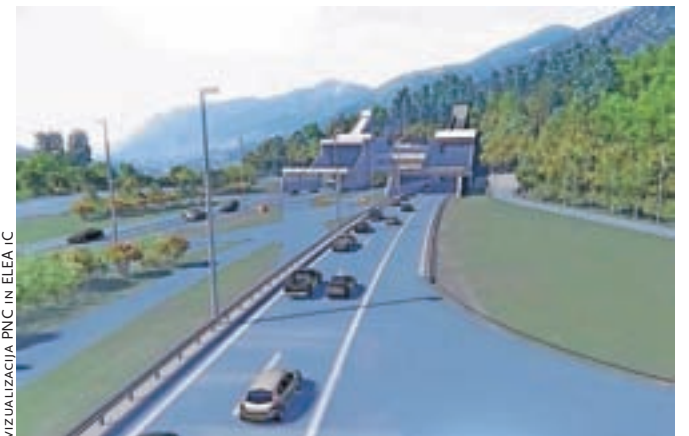
Takole bo videti predor Karavanke po izgradnji druge cevi.

V Uradnem listu je bila objavljena Uredba o državnem prostorskem načrtu za dograditev avtocestnega predora Karavanke, ki je začela veljati 16. julija 2016. Na spletni strani Občine Jesenice je objavljena povezava na uredbo, obenem pa si je prek povezave mogoče ogledati tudi zanimivo vizualizacijo, ki prikazuje, kako bo potekal promet po izgradnji druge predorske cevi, kakšen bo videz portalnega objekta, manjkajočega dela avtoceste, kje bo pristajališče za helikopterje ... Prikazane so tudi lokacije, kamor bodo odlagali viške izkopenega zemeljskega materiala, predstavljen pa je tudi celoten projekt gradnje. Kot so zapisali, je projektno dokumentacijo izdelovalo skoraj sedemdeset projektantov in drugih sodelavcev različnih strok.