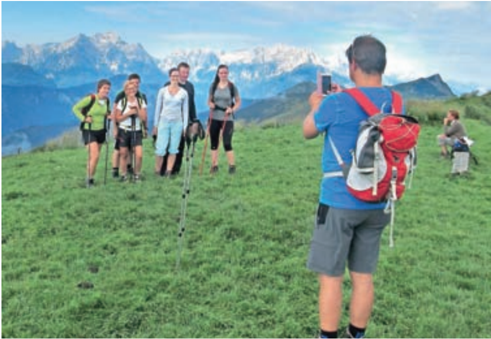
Vrh Golice v soboto, 20. avgusta, v dopoldanskih urah. Gneče ni bilo takšne kot spodaj pri koči, vsi pa so uživali v pogledu na Julijske Alpe z očakom Triglavom, na sončno Gorenjsko, Koroško pa je še prekrivala megla.