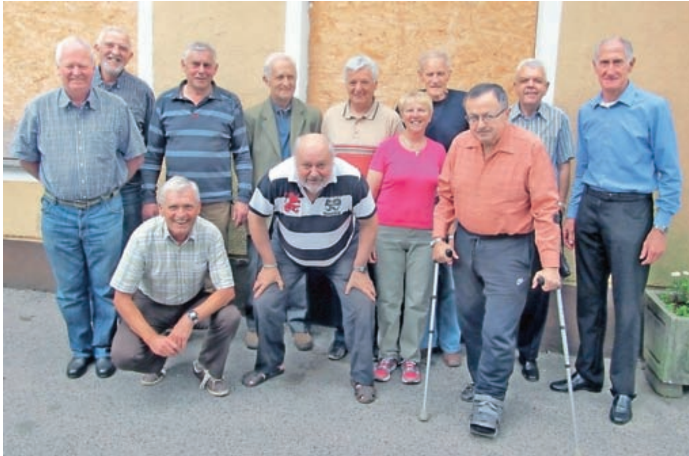
Nekdanji sošolci pol stoletja po zaključku šolanja

Po pol stoletja so se srečali dijaki nekdanje Tehnične srednje šole Jesenice, ki so pridobili poklic metalurški tehnik. Zbrani so z vseh vetrov, najdlje do Beograda in Šibenika.