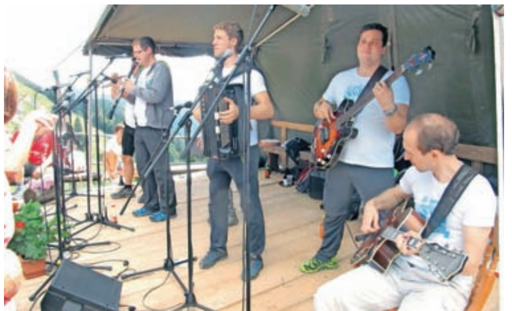
Vrhunec dneva je bil nastop Ansambla Saša Avsenika, ki se je že drugič odzval na povabilo domačih planincev. V triurnem nastopu je navdušil vse, s polko Na Golici in številnimi drugimi vedno zelenimi polkami in valčki Ansambla bratov Avsenik. / BESEDILO: JANKO RABIČ