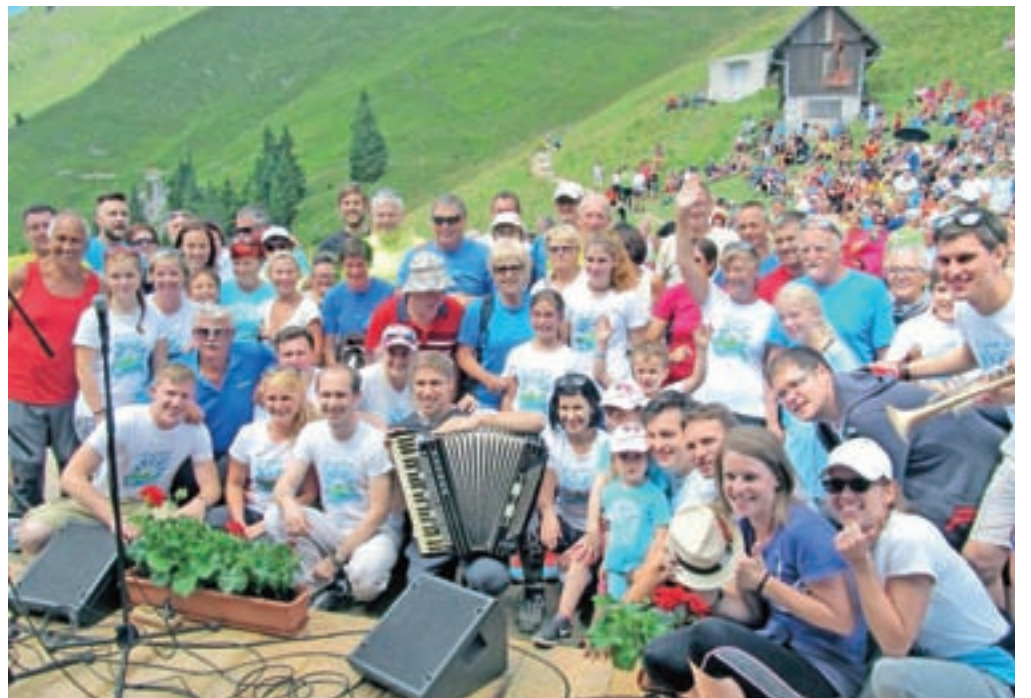
Sašo Avsenik je s svojim ansamblom užival velike simpatije planincev, med katerimi skorajda ni bilo nikogar, ki ne bi oboževal Avsenikove glasbe. Podpisoval se je na majice, se fotografiral z mnogimi, pred kočjo je nastala tudi ta simpatična fotografija Saša in njegovega ansambla z udeleženci srečanja.