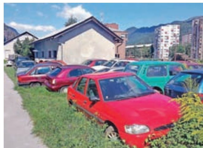
Ob zadnjem ogledu je bilo okoli delavnice že okoli štirideset odsluženih vozil.

dar se ni pripravljen resno pogovarjati. Ker nima urejenega stalnega bivališča, prihodkov oziroma pravnega statusa, pa smo tudi omejeni z drugimi inšpekcijskimi postopki, saj zakon ne zaje-ma tistih, ki živijo izven nje-