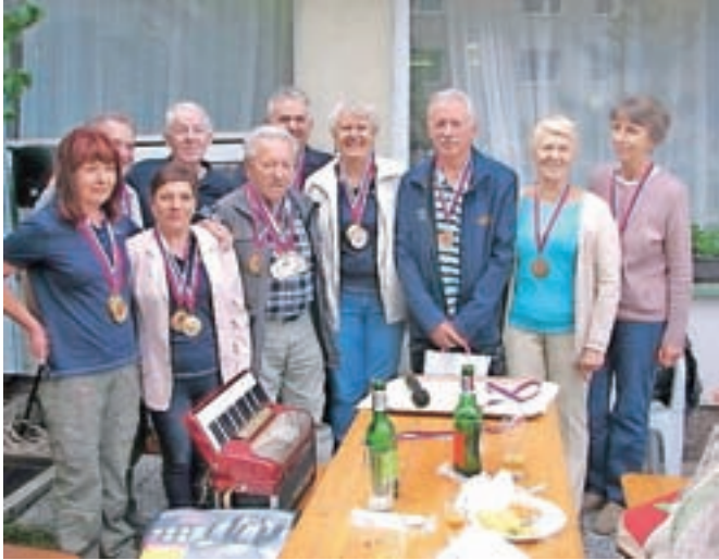
Člani društva s kolajnami, ki so jih osvojili pri športnih in družabnih igrah na dnevu društva.