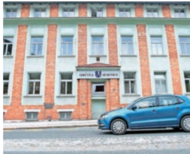
Občinska stavba je ena energetske potratnejših javnih stavb.