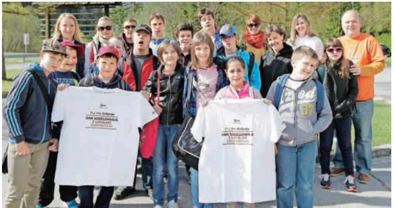
Učenci v Kranjski Gori