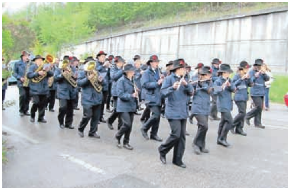
Budnica na Lipcah