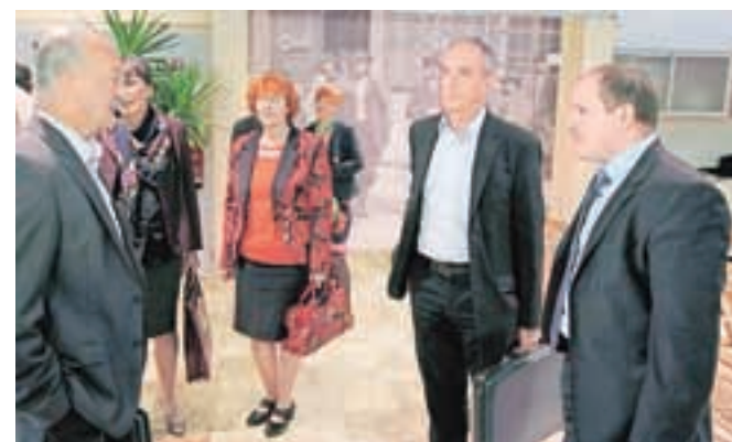
Na srečanju so govorili o organiziranosti služb nujne medicinske pomoči po novem.