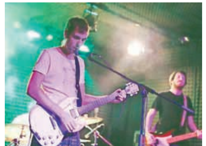
... in na odru.

omogoča potujoči studio. Od mladega fanta, ki je vrstnike kar na gimnazijskem hodniku vabil v skupino, do uspeš-