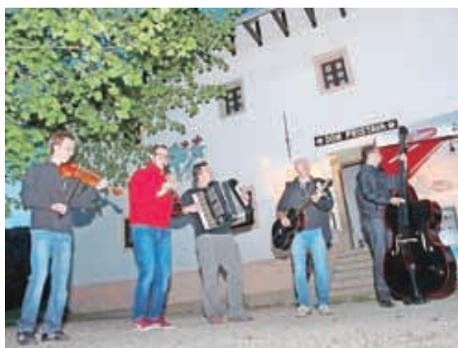
Koncert akustične zasedbe The Pousters