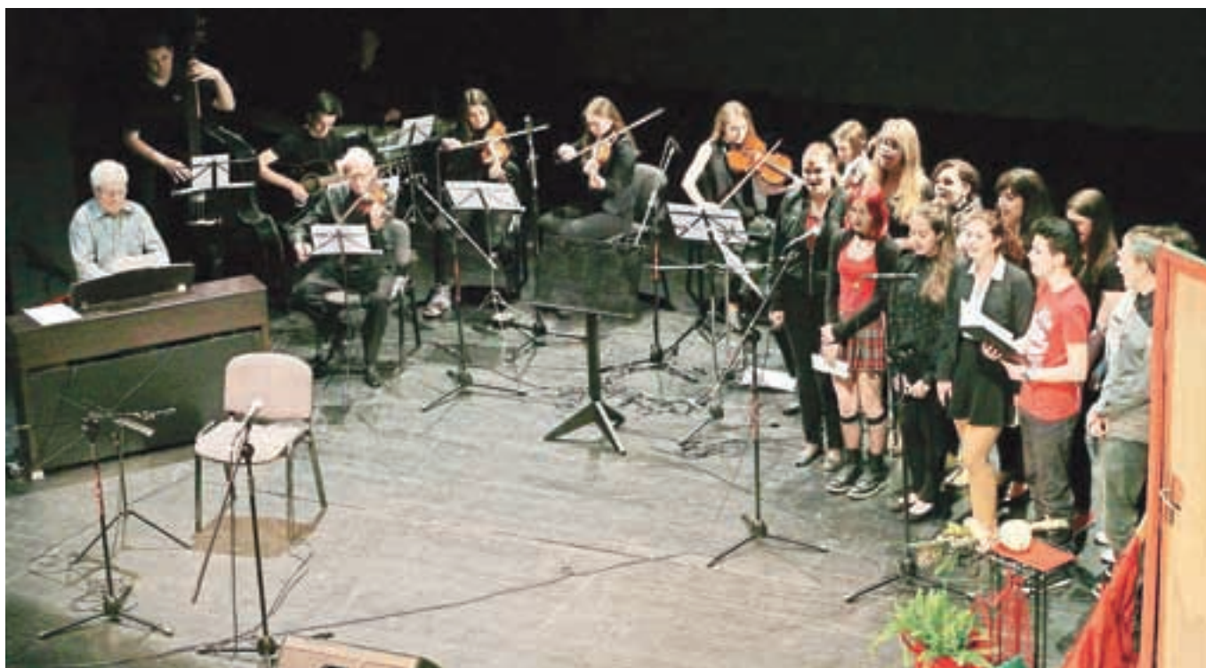
Gaudeamus Igitur v izvedbi gimnazijcev različnih generacij na slavnostni akademiji

V dneh od 15. do 22. maja je na Jesenicah potekal osrednji del letošnjega Tedna vseživljenjskega učenja, s katerim želijo promovirati idejo vseživljenjskega učenja in ljudi seznanjati s pomenom učenja v vseh življenjskih obdobjih. K projektu je letos pristopilo več kot dvajset različnih ustanov, zavodov in društev, ki so pripravili več kot sto brezplačnih dejavnosti. Osrednja prireditve v organizaciji Ljudske univerze Jesenice je bila v sredo, in sicer Parada učenja, na kateri so potekale različne izobraževalne in kreativne delavnice, odrski program, postavljene so bile predstavitevne stojnice. Brezplačne prireditve, povezane s Tednom vseživljenjskega učenja, pa bodo potekale tudi še ves mesec junij.