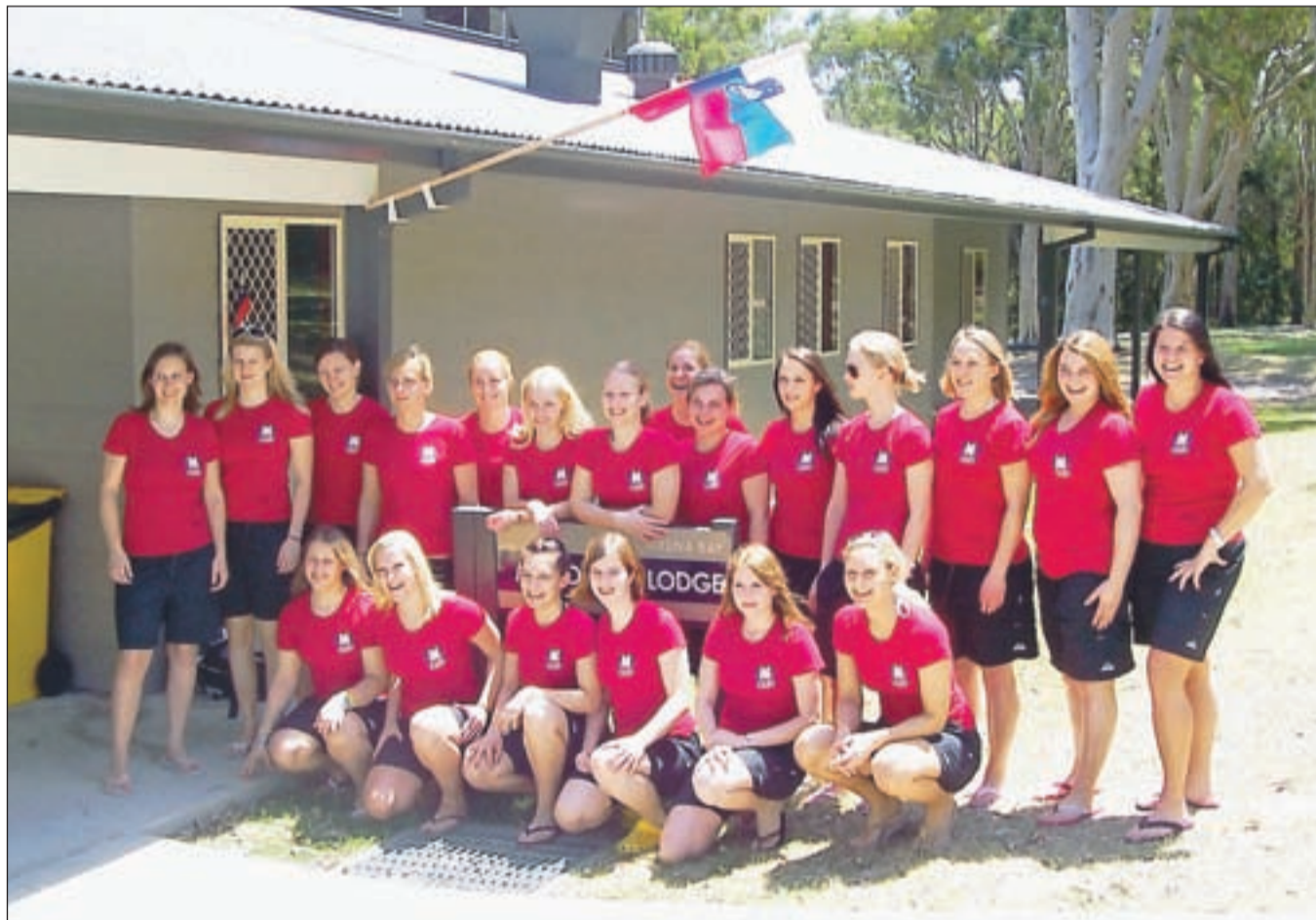
Ženska hokejska reprezentanca Slovenije v Avstraliji je po novici, da je moštvo HK Acroni Jesenice doseglo zgodovinsko zmago nad Salzburgom v gosteh, oblekla majice Acronija in se veselila dosežka krepkega spola.

Za Slovenke so navijali tudi slovenski izseljenci. "Vsi bomo na Avstralijo ohranili lepe spomine tudi zato, ker