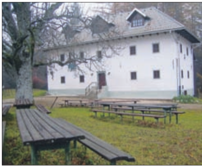
Za Dom Pristava in Kurirski dom iščejo novega najemnika.