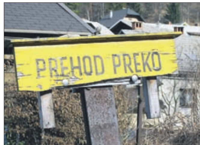
Opozorilne table imajo dober namen: opozarjajo na prehod čez progo, ki je zelo nevaren (sodobni vlaki lahko pripeljejo zelo tiho), lahko pa kot opozorilo zadrži brezglavo tekanje čez progo in ogrožanje lastne varnosti. Poškodovanje take table pa nikomur ne koristi.