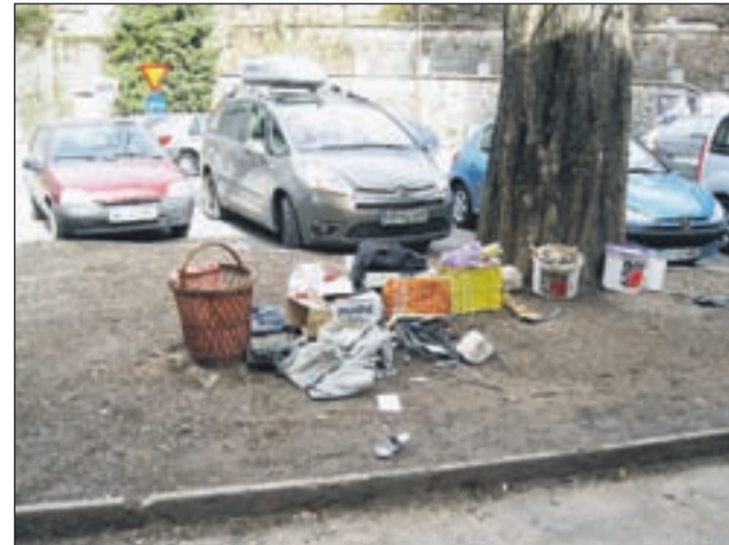
Na Titovi cesti (Center II) je lep kupček smeti. Nekaj ga je v plastični posodi, nekaj smeti pa je raztresenih "za dekoracijo" ... Ker je na tem območju sorazmerno veliko zabojnikov za smeti, bi lahko prav vse stresli vanje.