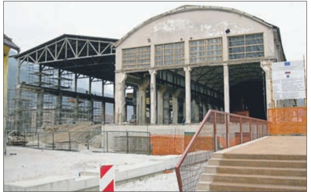
Gradnja tržnice na Stari Savi

Izbrani koncesionar bo Občini Jesenice moral pošiljati devetmesečna poročila o poslovanju, tako da bodo imeli nadzor nad poslovanjem in tudi možnost pravočasnega ukrepanja v primeru poslovnih težav koncesionarja.