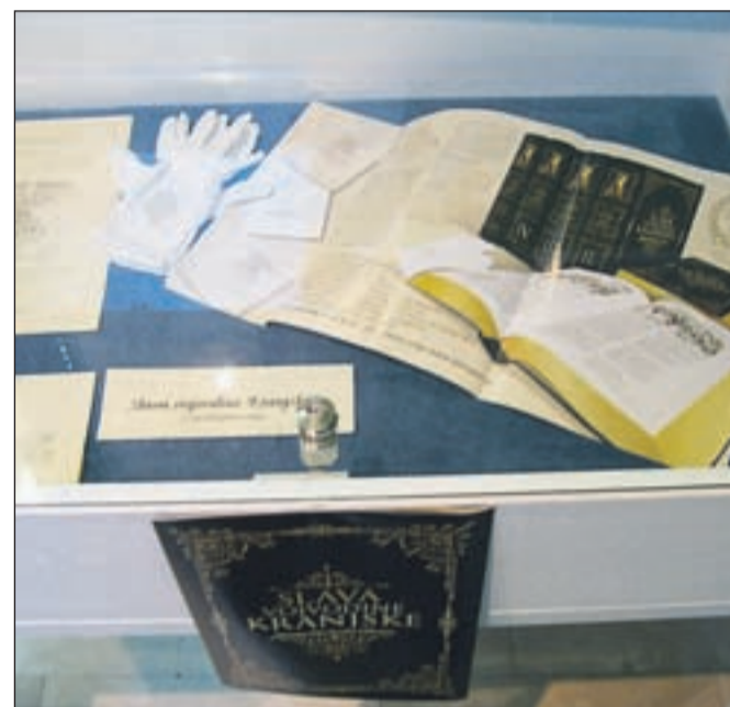
Valvasor je štiri knjige Slave vojvodine Kranjske razdelil na 15 poglavij v skupnem obsegu 3552 strani s 24 prilogami in 528 bakrorezi.