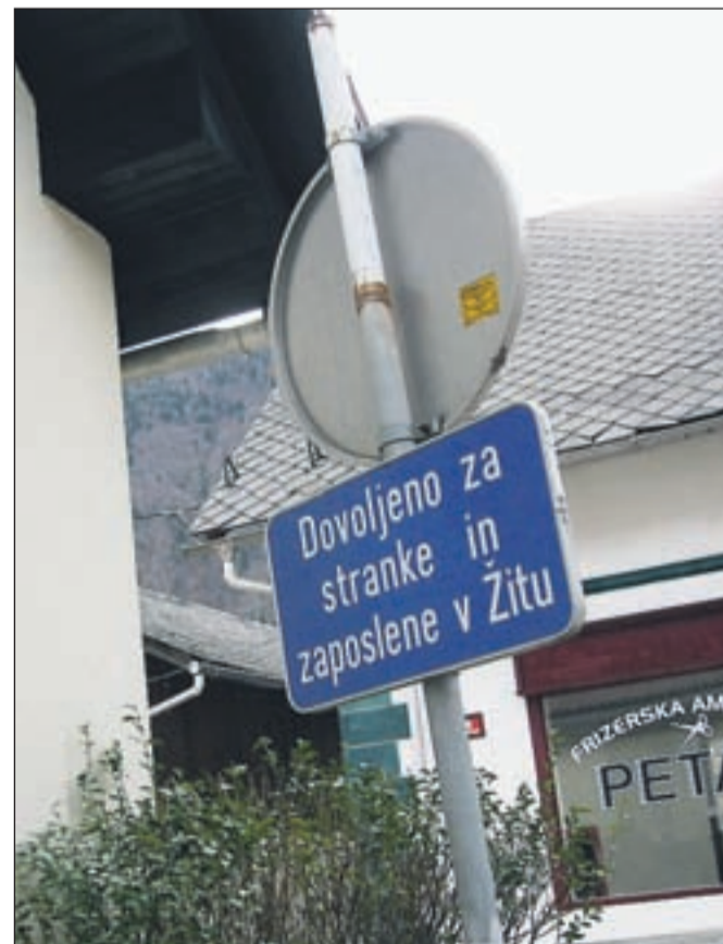
Nočni šaljivci so ugotovili, da parkirišča pri nekdanji prodajalni Žita ni treba zavarovati z oznako: dovoljeno parkiranje in ustavljanje samo za zaposlene v Žitu, zato so tablo malo premaknili.