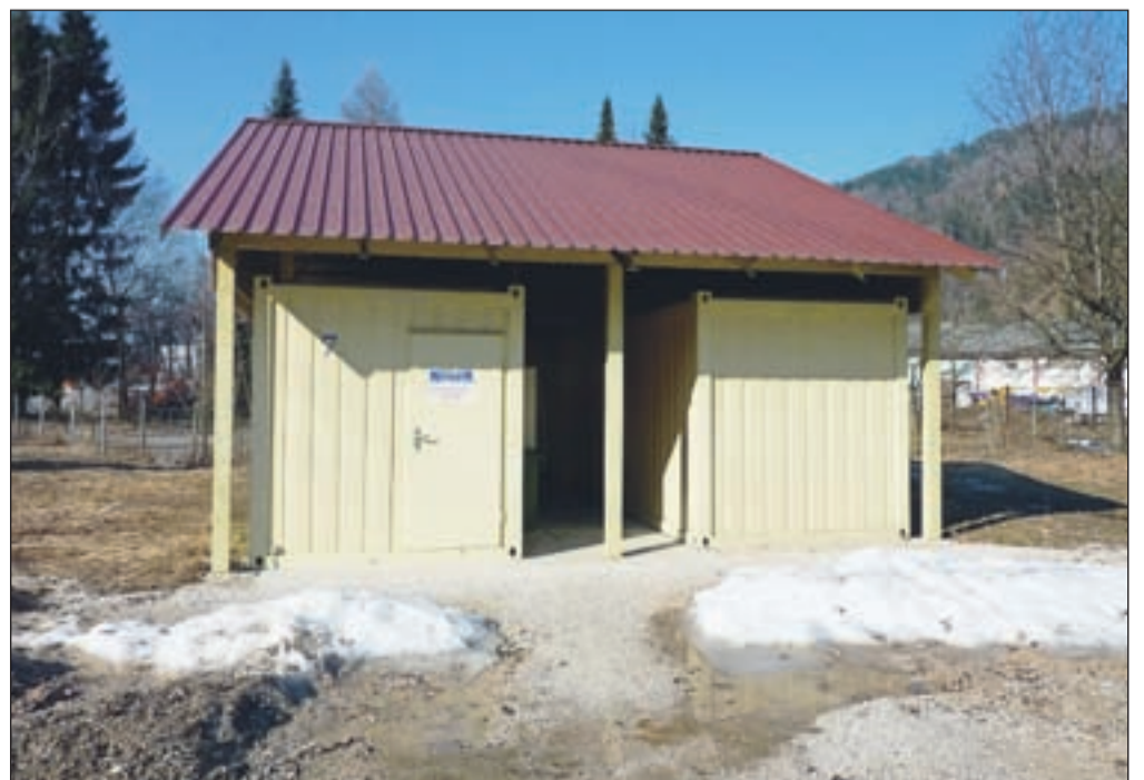
Zavetišče za brezdomce v Logu Ivana Krivca: v bivalnih zabojnikih ta čas bivata dva brezdomca.

domcem (vzdrževanje zavetišča in plačilo oskrbnika) okrog 12 tisoč evrov. Topel obrok v domu upokojencev pa krijejo brezdomci sami iz denarne socialne pomoči.