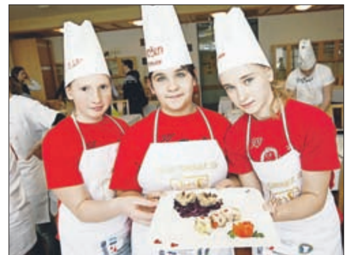
Učenke s Koroške Bele so se izkazale na regijskem tekmovanju za zlato kuhalnico.

ljanju receptov so jim pomagali v hotelu Lek v Kranjski Gori, vodja šolske kuhinje Rok Šporn pa jim je pomagal pri osnovah mehanske in toplotne obdelave živil. "Naučil nas je tudi, kako se uporablja parno-konveksijsko pečico in kakšne so njene prednosti. Pri receptih so nam pomagali tudi naši starši in stari straži," so povedale šestošolke in nam zapale nekaj posebnosti svojih receptov. Piščanca so marinirale s svežimi zelišči (timijan, rožmarin, žajbelj) in ga nadevale z rdečo papriko, matevža so pripravile po receptu babic in ga zabelile z domačo zaseko, za dušeno rdeče zelje so uporabile veliko začimb, prevladovali so cimet in klinčki, ki so zelju dali prav poseben okus ... "Učenke so pri kuhanju pokazale veliko spretnosti, tako pri mehanskih kot toplotnih postopkih kuhanja,