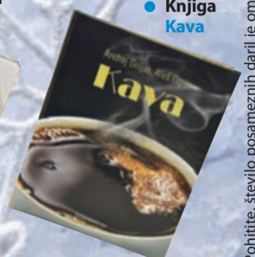
• Knjiga Kava