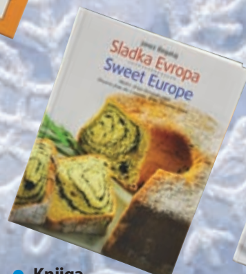
• Knjiga Sladka Evropa