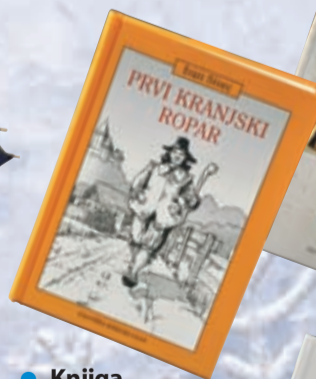
• Knjiga Prvi kranjski ropar