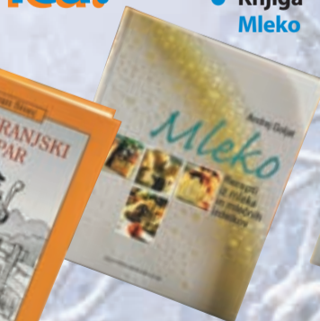
• Knjiga Mleko