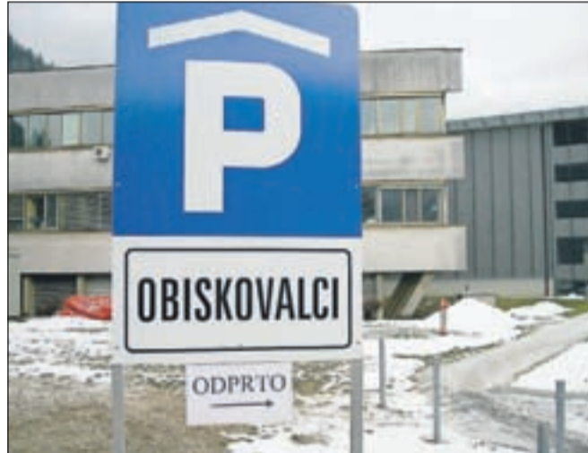
V novi garažni hiši že parkirajo zaposleni iz bolnišnice in obiskovalci.