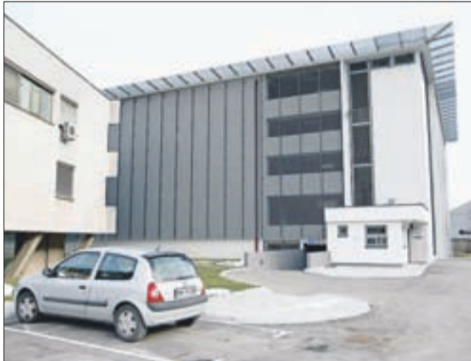
Na strehi garažne hiše je heliport, ki še vedno ostaja zaprt zaradi težav s projektiranjem požarnega sistema.