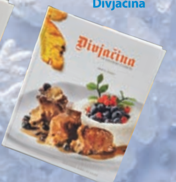
• Knjiga Divjačina