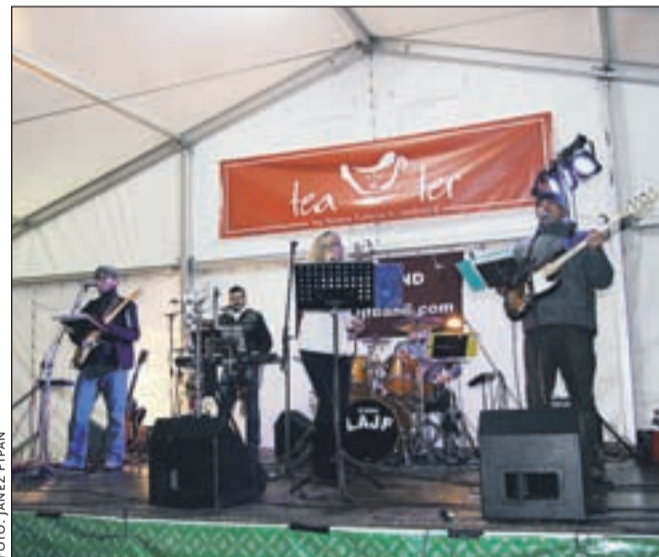
Kar lepo število občanov se je udeležilo silvestrovanja in tudi drugih decembrskih prireditev na Čufarjevem trgu. Ogrevan šotor je bil ob hudem mrazu velika pridobitev.

kvačkanih izdelkov, okrasov in aranžmajev. Na Kočni so člani domačega Kulturnega društva Obranca že 23. leto razveselili otroke iz tega kraja. Najprej so si ogledali igrico Kozliček Meketajček v izvedbi Lutkovne-