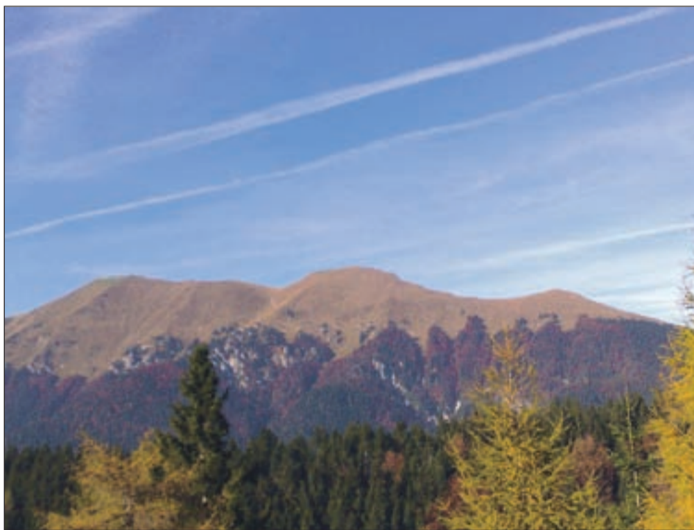
Tudi jeseniške planote so se obarvale v jesenske barve.

Jesen je tudi jeseniške planote pisano pobarvala. Kombinacija s soncem zagotovo kar vabi na svež zrak. Za prijeten sprehod pa se ni treba odpraviti daleč, lahko že po kosilu v bližnji gozd, ki jih v jeseniški občini ne manjka. Za krajši sprehod se lahko odpravite na Trim stezo na Žerjavcu, ki pelje vse do Hrušice, bolj aktivni lahko vmes na postajah naredijo še kakšno vajo. Prijeten sprehod nedaleč stran od centra mesta obljublja tudi pot proti Platoju na Karavankah. Ena od jeseniških zanimivosti je tudi Španov vrh nad Planino pod Golico, sicer bolj znan kot smučišče, v vseh drugih letnih časih pa izletniška točka s širokim razgledom. Za izlete v Karavanke so izhodiščne točke vasi Javorniški Rovt, Plavški Rovt in Planina pod Golico. Vse vasi so lahko že same na sebi izlet, sploh sedaj ko so višji vrhovi že pobeljeni. Pozabiti ne smemo niti izletov po Mežakli, kjer ne smemo spregledati naravnega mostu,