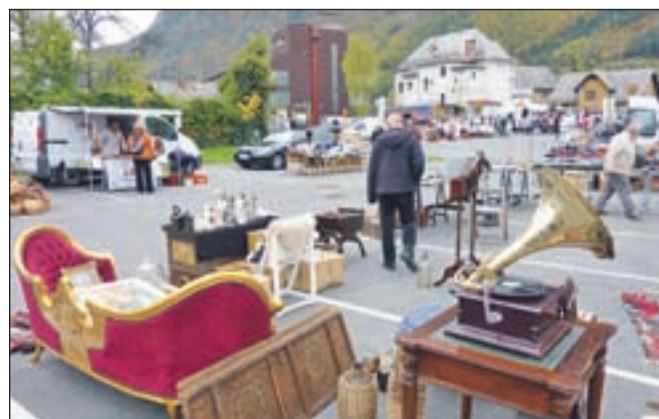
Sejem vsakega 19. v mesecu bo odslej potekal na novih parkiriščih na območju nekdanjega Fiproma.

Redni mesečni sejem, ki ga na Jesenicah pripravljajo vsakega 19. v mesecu, se je med občani Jesenic v zadnjih treh letih dobro "prijel". To dokazuje tudi podatek, da je na sejmu vsakič prek štirideset ponudnikov različnih izdelkov, od oblačil, obutve, prehranskih izdelkov, starin ... Doslej so ga pripravljali na parkirišču pod stavbo Občine Jesenice. A ker so v neposredni bližini začeli graditi nov