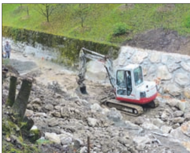
Vodnogospodarsko podjetje Kranj ureja zaplavno pregrado potoka Bela na Koroški Beli.