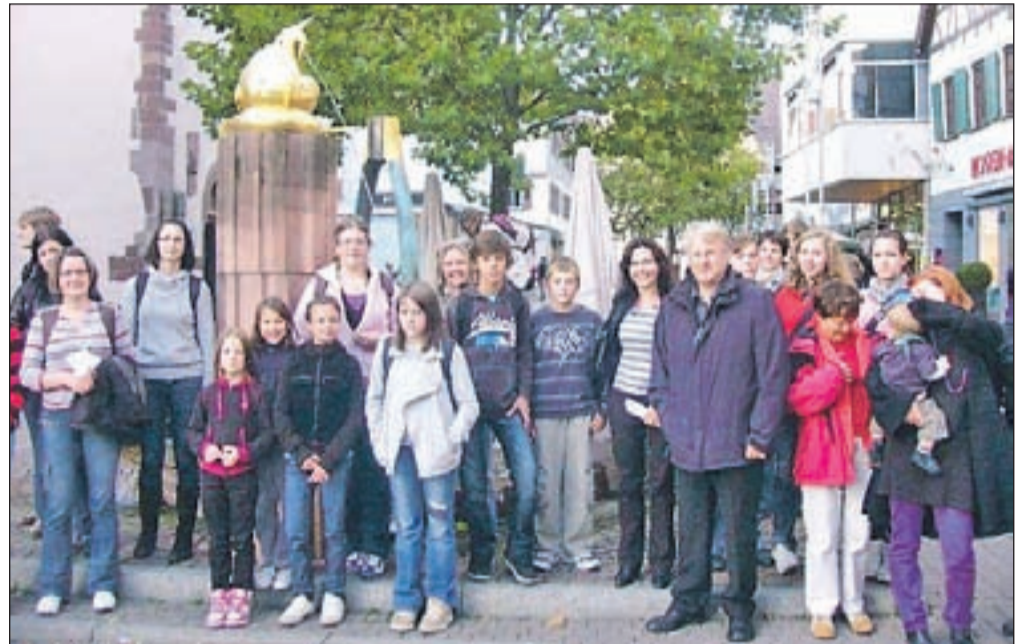
Mladi jeseniški glasbeniki na obisku v Nagoldu