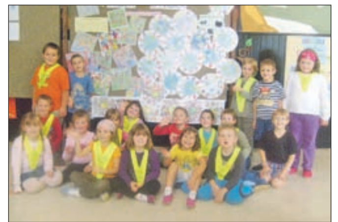
Učenci pa so prevzeli tudi delo učiteljev in eno šolsko uro poučevali namesto njih.

Zavod za šport Jesenice je v sodelovanju z Mladinskim centrom Jesenice izvajal športne aktivnosti z učenci v podaljšanem bivanju. Učenci so se družili pri igrah s padalom, po poligonu so vodili žoge, preskakovali ovire ter se pomerili v hitrosti pri štafetnem teku. Plesali so tudi ob glasbi. Učiteljica jih je naučila gibe z rokami, nogami in s telesom.