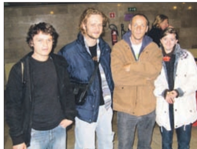
Športna sekcija Kraljev ulice