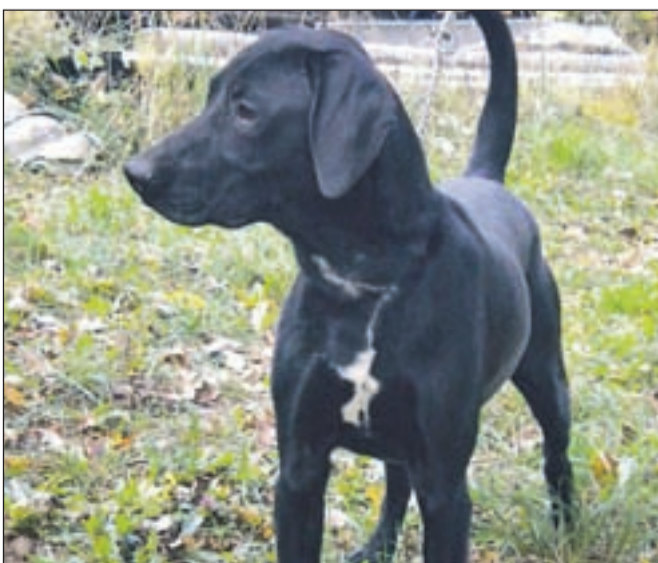
Mešanček na sliki je star devet mesecev.