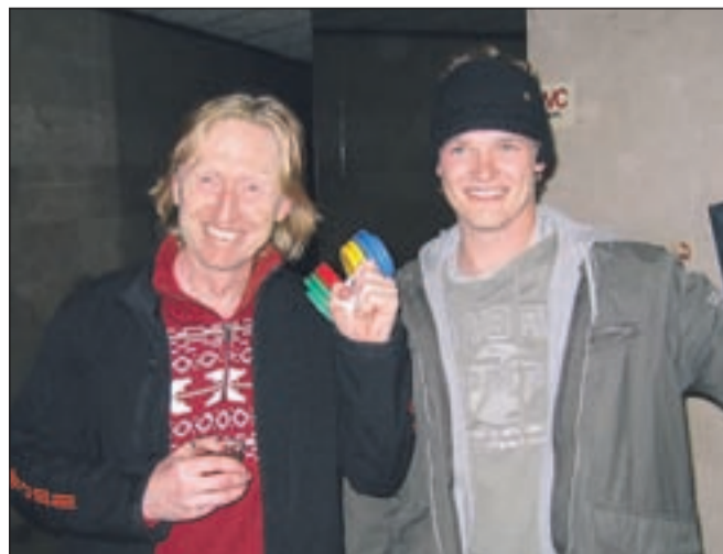
Nasmejana soavtorja filma Donkey Track