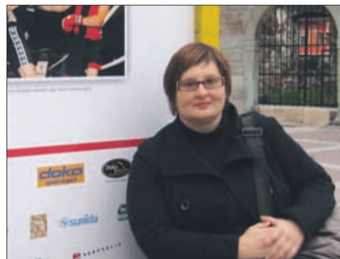
Ob festivalu je potekala tudi razstava športnih fotografij, med sodelujočimi fotografi je bila Tina Dokl z Gorenjskega glasa.