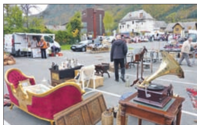
Sejem vsakega 19. v mesecu bo odslej potekal na novih parkiriščih na območju nekdanjega Fiproma.

Redni mesečni sejem, ki ga na Jesenicah pripravljajo vsakega 19. v mesecu, se je med občani Jesenic v zadnjih treh letih dobro "prijel". To dokazuje tudi podatek, da je na sejmu vsakič prek štirideset ponudnikov različnih izdelkov, od oblačil, obutve, prehranskih izdelkov, starin ... Doslej so ga pripravljali na parkirišču pod stavbo Občine Jesenice. A ker so v neposredni bližini začeli graditi nov