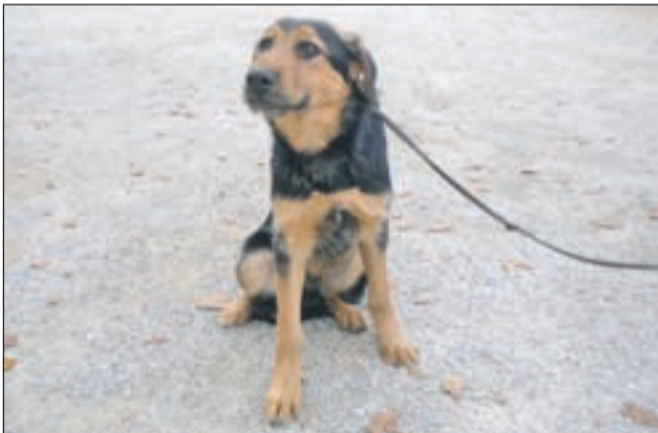
Mešanka na sliki je stara štiri mesece.