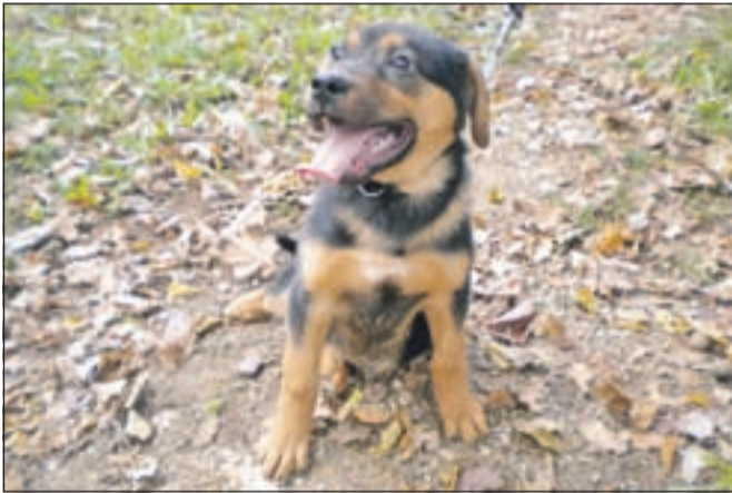
Samček nižje rasti na sliki je star leto dni.