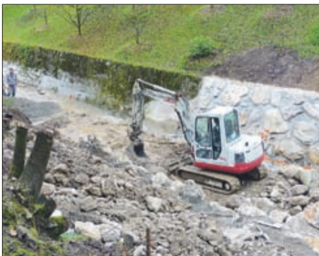
Vodnogospodarsko podjetje Kranj ureja zaplavno pregrado potoka Bela na Koroški Beli.