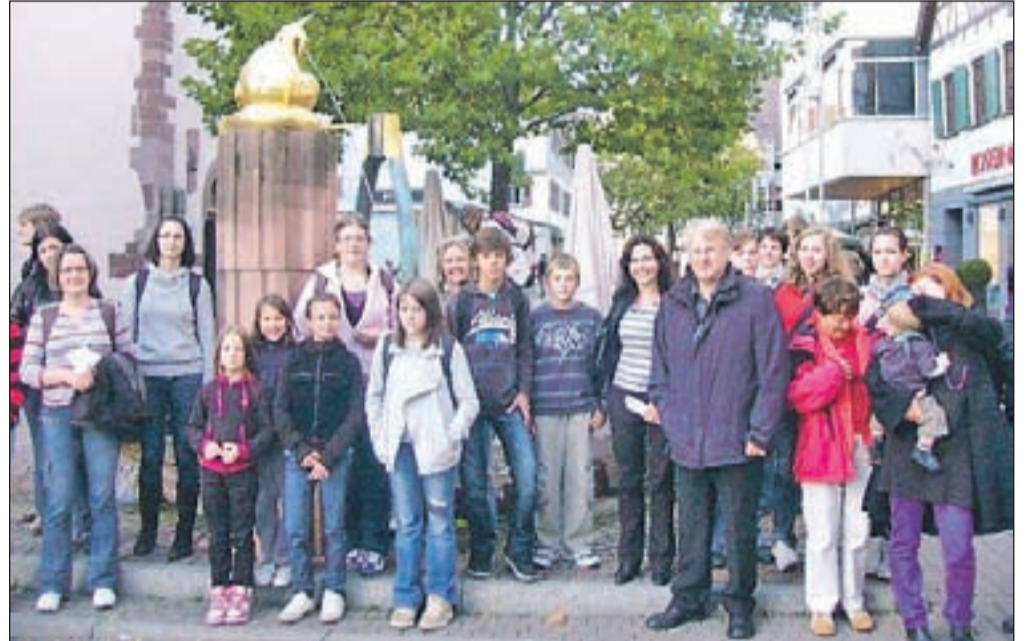
Mladi jeseniški glasbeniki na obisku v Nagoldu