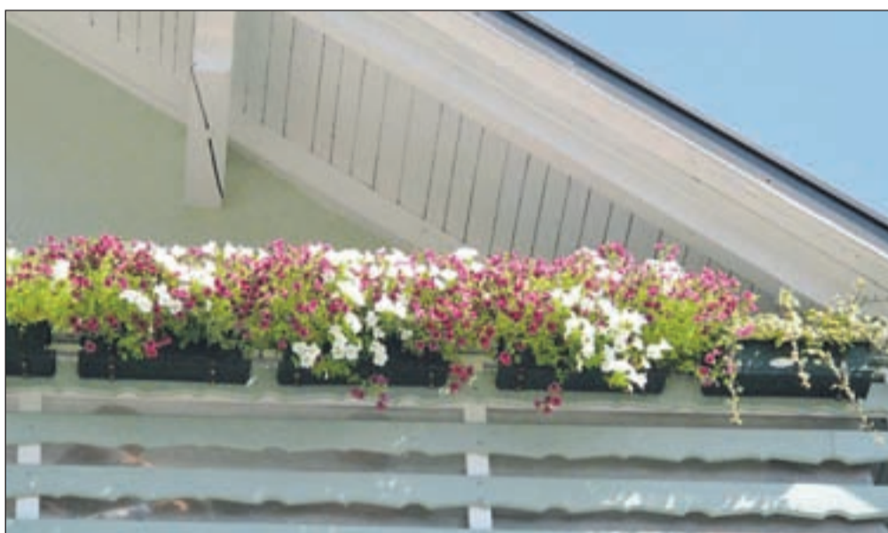
... in pogled na cvetje od blizu