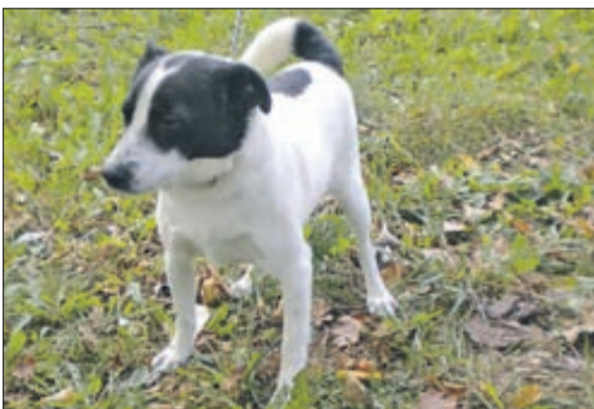
Na sliki je pes mešanček srednje rasti.