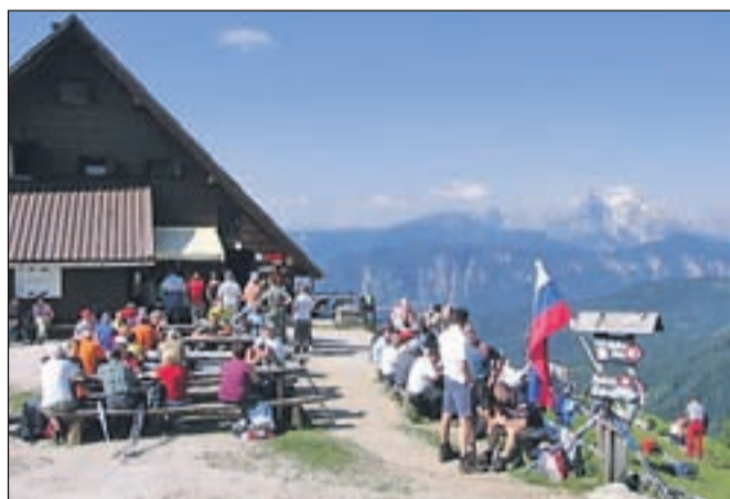
Udeleženci pohoda pred kočjo na Golici