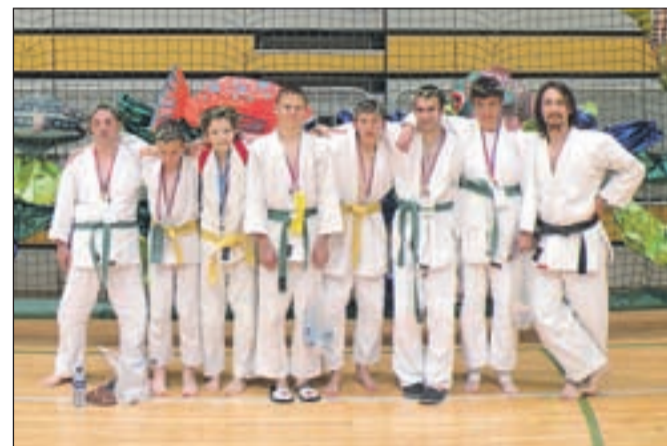
Ekipa Judo kluba Jesenice na specialni olimpijadi v Kopru