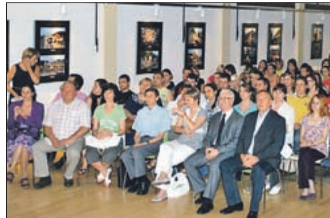
Maturanti v Kolpernu