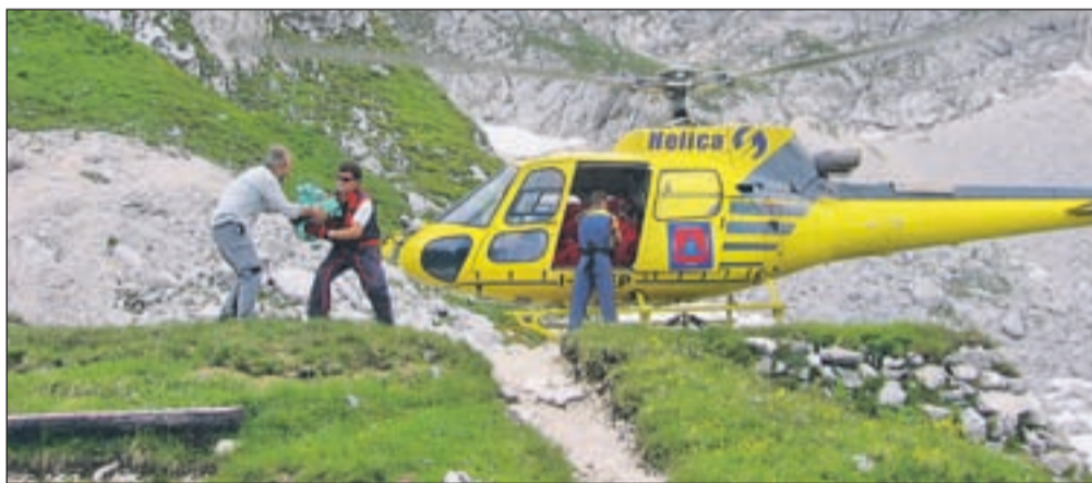
Helikopter dostavlja zaloge na zavetišče.

predvsem tuji planinci, za njimi pa domači. Od tod so predvsem čudoviti pogledi na verigo vrhov Julijskih Alp. Največkrat je cilj planincev Jalovec. Tukaj prepijo in se zjutraj podajo na njegov vrh. Planincem pomagava z informacijami o poteh, vrhovih in vremenu." Ob 60-letnici v zavetišču ne bodo pripravili večjega slavlja. Predvsem bodo veseli dobrega obiska in zadovoljnih obrazov planincev na poletnih potepanjih po Julijskih Alpah.