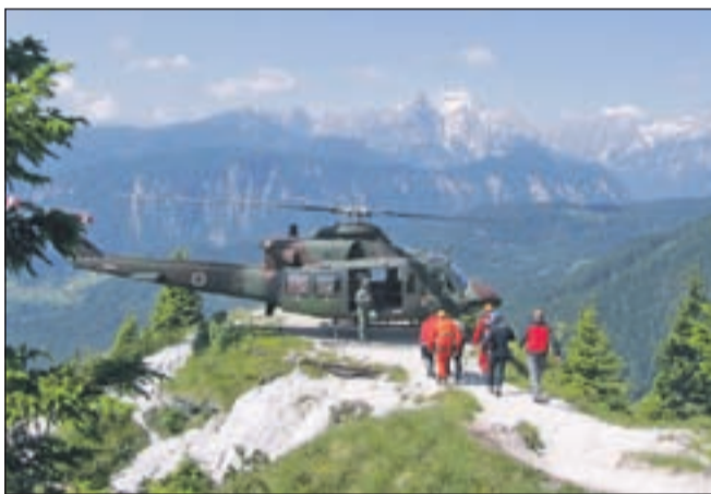
Reševalna akcija oskrbnice kočje