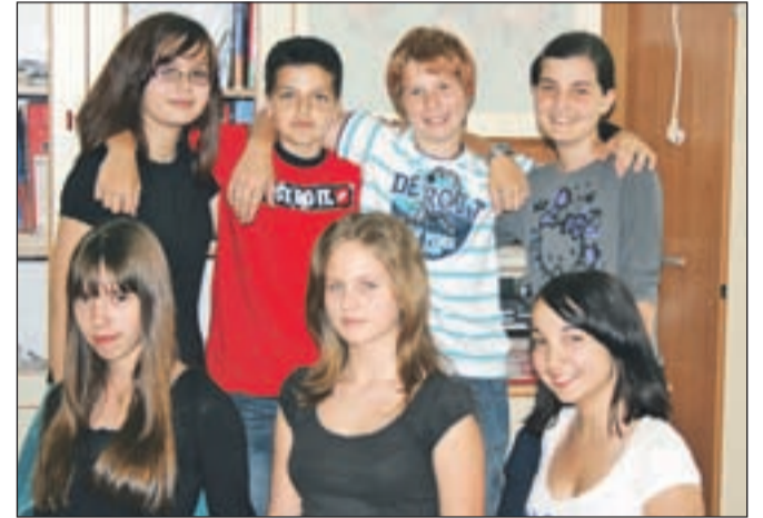
Učenci OŠ Prežihovega Voranca, ki so postali regijski zmagovalci natečaja S pesmijo do ločenega zbiranja odpadkov .

osnovnih šol. Svojo kreativnost so pokazali s pisanjem eko pesmi, ki so jih nato likovno predstavili, nekateri pa so jih tudi zapeli. Na Gorenjskem se je najbolje odrezala skupina sedmih učencev iz zdaj že nekdanjega 7.a OŠ Prežihovega Vo-