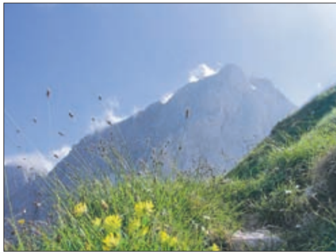
Od zavetišča je čudovit pogled na mogočni Jalovec, eno najlepših gora Julijskih Alp.