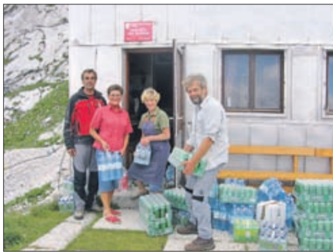
Ekipe, ki je pred zavetiščem prevzela zaloge za poletno sezono.