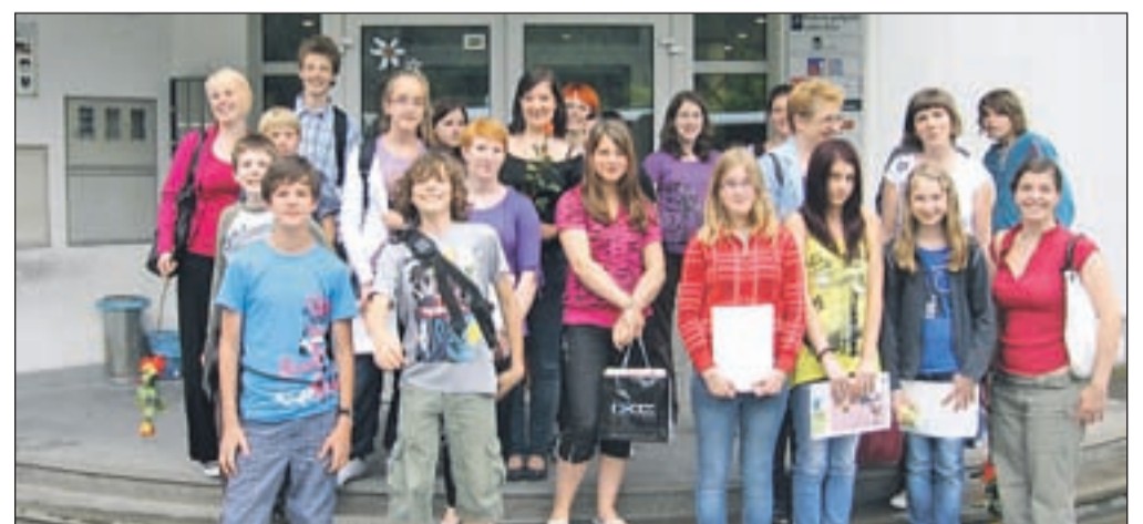
Mladi podjetniki z osnovnih šol

Po osnovnih šolah zgornje Gorenjske že deset let poteka projekt podjetniških krožkov, s katerimi mladim želijo omogočiti pridobitev prvih izkušenj s področja podjetništva. Koordinatorica projekta je Razvojna agencija Zgornje Gorenjske. V pravkar končanem šolskem letu je v projektu sodelovalo sedem osnovnih šol, med njimi tudi tri jeseniške: Osnovna šola Toneta Čufarja Jesenice, Osnovna šola Prežihovega Voranca Jesenice in Osnovna šola Koroška Bela. Učenci so prek leta pripravljali poslovne načrte, svoje zanimive podjetniške ideje pa so predstavili na osnovnošolskem forumu konec junija. In kakšne poslovne ideje so se porajale pri mladih? Učenci z Osnovne šole Toneta Čufarja so pri-