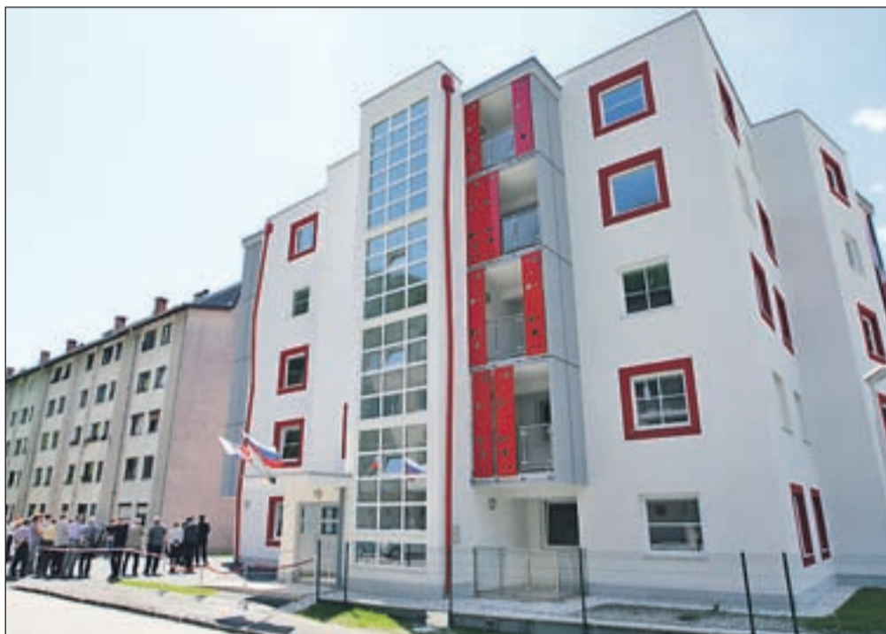
Blok z oskrbovanimi stanovanji na Bokalovi