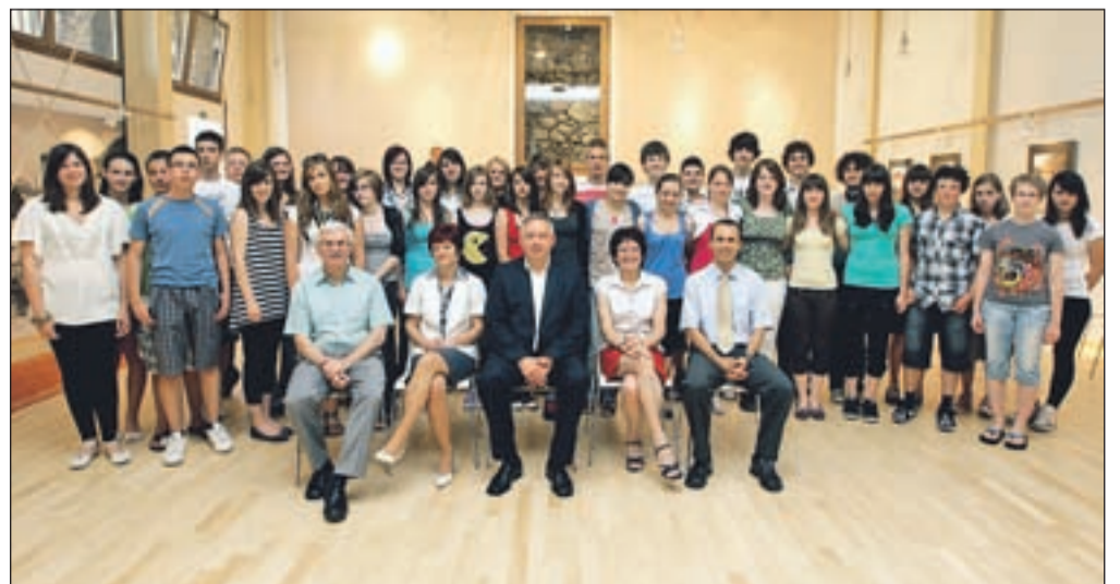
Odlični učenci in dijaki skupaj z nekaterimi ravnatelji in županom