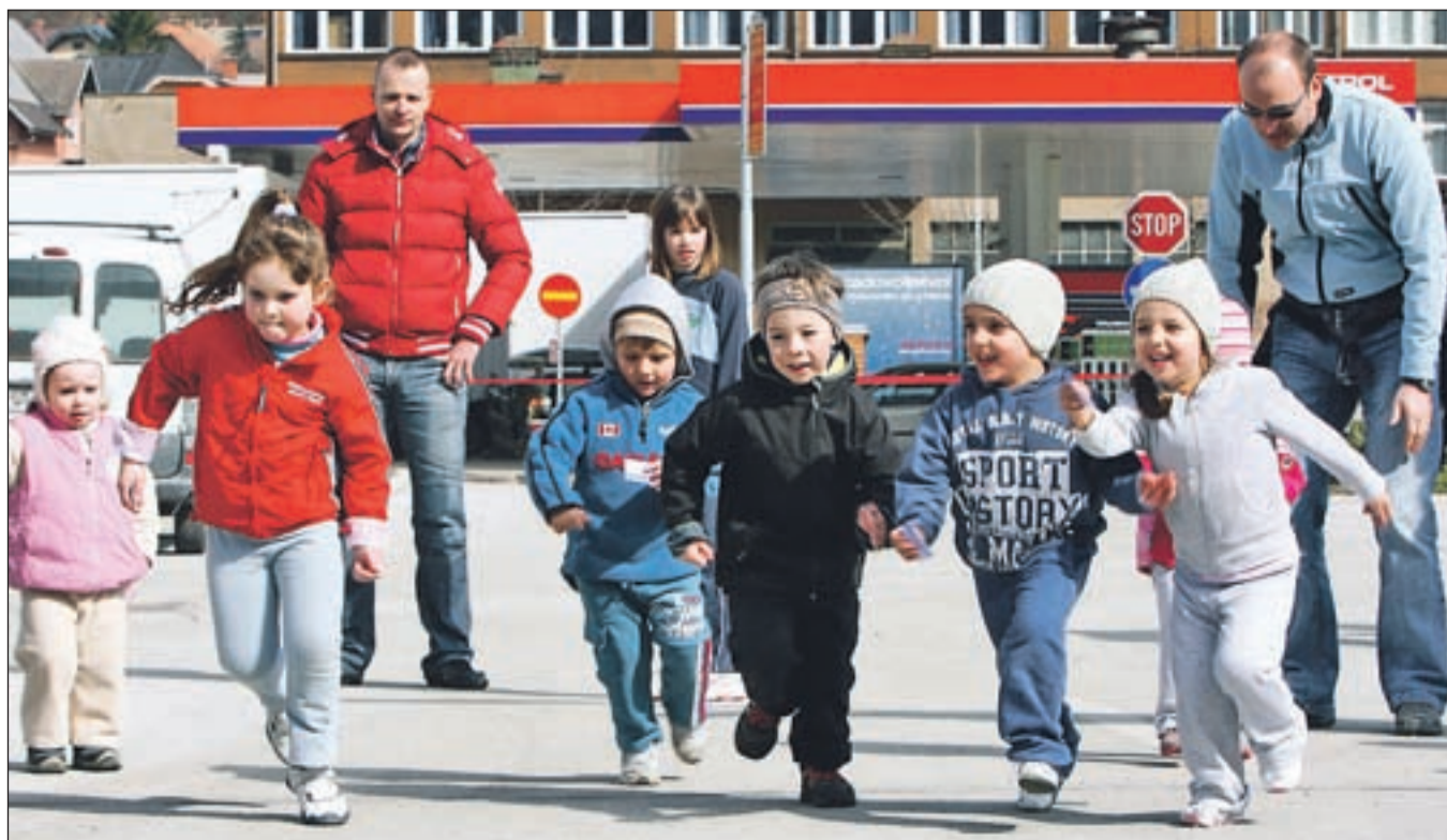
Start najmlajših