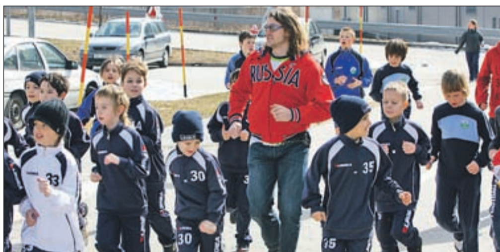
Ogled proge najmlajših tekačev