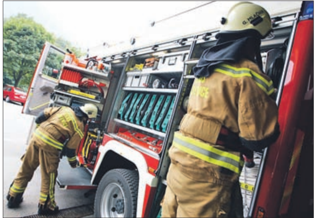
GARS Jesenice bo konec aprila dobil novo, 42 metrov dolgo lestev za reševanje iz visokih objektov.