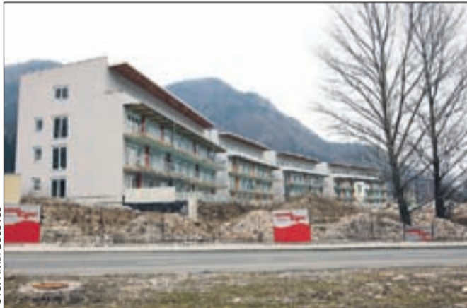
Bloke v Hrenovci naj bi vendarle dokončali do konca leta.

ni dobro, da dela na objektih stojijo, kljub vsemu pa naj bi na Občini Jesenice imeli zagotovila, da bo novi investitor stanovanja dokončal še letos in jih tudi začel prodajati. Na območju Hrenovce pa naj bi tudi Mercator Tehnika po zagotovitvi še letos zgradil trgovski center. Občina Jesenice bo v teh dneh odkupila zemljišča na območju bivšega salona vozil Pančur, s čimer bo zagotovila potreben prostor za ureditev razbremenilne ceste mimo Lipc do poslovne cone v Črni vasi. S tem bodo rešili dolgoletni problem vožnje tovornih vozil skozi Lipce ter preobremenjene ceste do pokopališča na Blejski Dobravi.