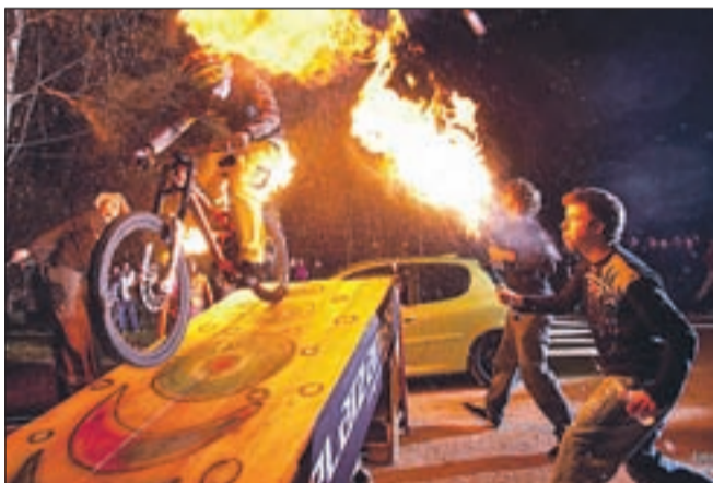
Utrinek z adrenalinskega odprtja razstave

nice na ogled do novega leta - je bilo nekaj posebnega. Rožle s prijatelji se je podal "čez mejo", saj so na dvorišču mladinskega centra postavili skakalnico za kolesarja, ki je med drugim skočil čez avto, nastopila pa je tudi žonglerska skupina Čupakabra z ognjem.