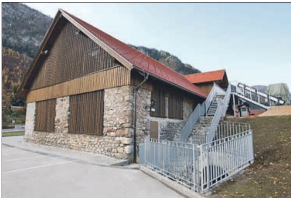
Kolperna je obnovljena, zunanost ohranja videz nekdanjega skladišča oglja, medtem ko je notranjost zažarela v povsem novi podobi.

ljati. Kljub številnim zapletom in težavam pri obnovi stavbe so s končnim rezultatom zelo zadovoljni, je dejal Bregant. Po njegovih besedah so bila dela opravljena zelo kakovostno, posebej pa so zadovoljni, da niso preokračili predvidenih stroškov. V spodnjem delu stavbe so uredili dvorano, ki bo namenjena organizaciji kulturnih in družabnih dogodkov. V