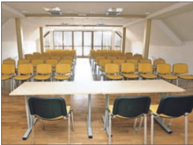
... zgornja pa seminarjem, kongresom ... I FOTO: ANKA BULOVEC