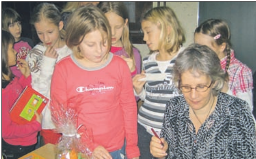
Pisateljica se je učencem tudi podpisovala.