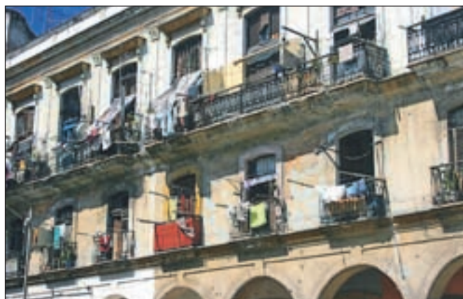
Nekoč mogočna stavba