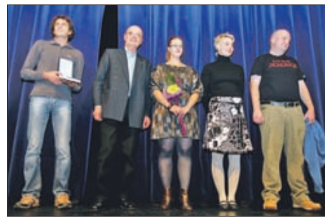
Nagrajenci iz domačega gledališča Toneta Čufarja Jesenice

Strokovna žirija je vsak večer vestno spremljala vse