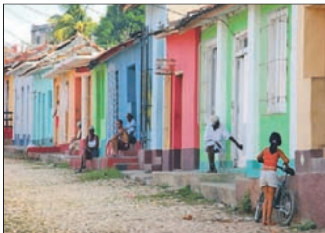
Ulica v Trinidadu