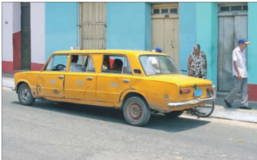
Domač izum iznajdljivih Kubancev