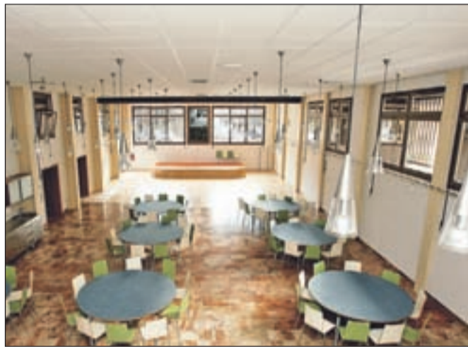
Spodnja dvorana bo namenjena koncertom, sprejemom ...

ne, umetniške in družabne ponudbe. Za to moramo imeti tudi ustrezne prostore, ki jih obnovljena kolperna s svojimi dvoranama v celoti zagotavlja. Zavedati se tudi moramo, da bomo Stari Savi novo življenje vdahnili le tako, če bomo vanjo prinesli kulturno in družabno dogajanje. Ko bo zgrajena še prečna povezava od Čufarjevega trga do Stare Save, kar naj bi se zgodilo leta 2011, bomo res dobili pravo mestno središče in Jesenice bodo res postale pravo mesto."