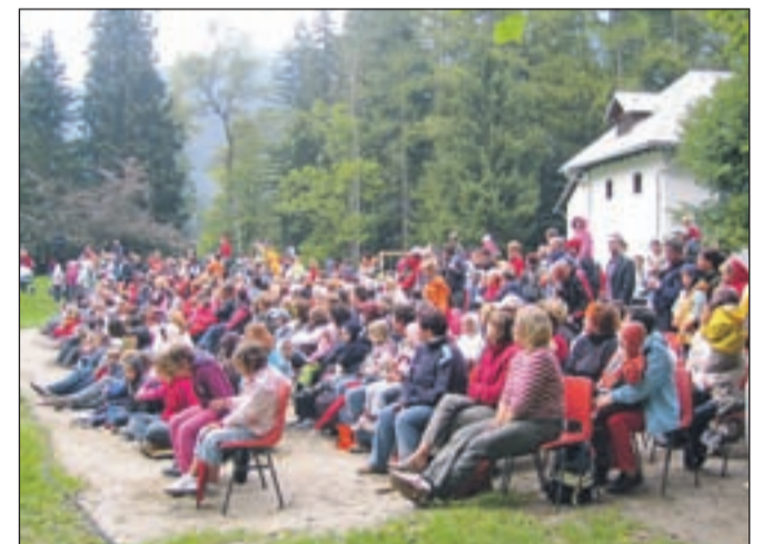
Kekca si je na Pristavi ogledalo prek tristo ljudi. Ob Tednu otroka v oktobru ga bodo verjetno uprizorili še enkrat.