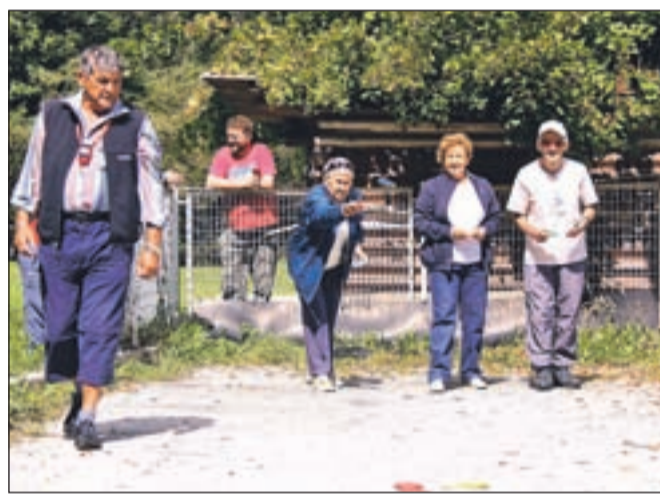
Krajanje so se pomerili tudi v športnih igrah.