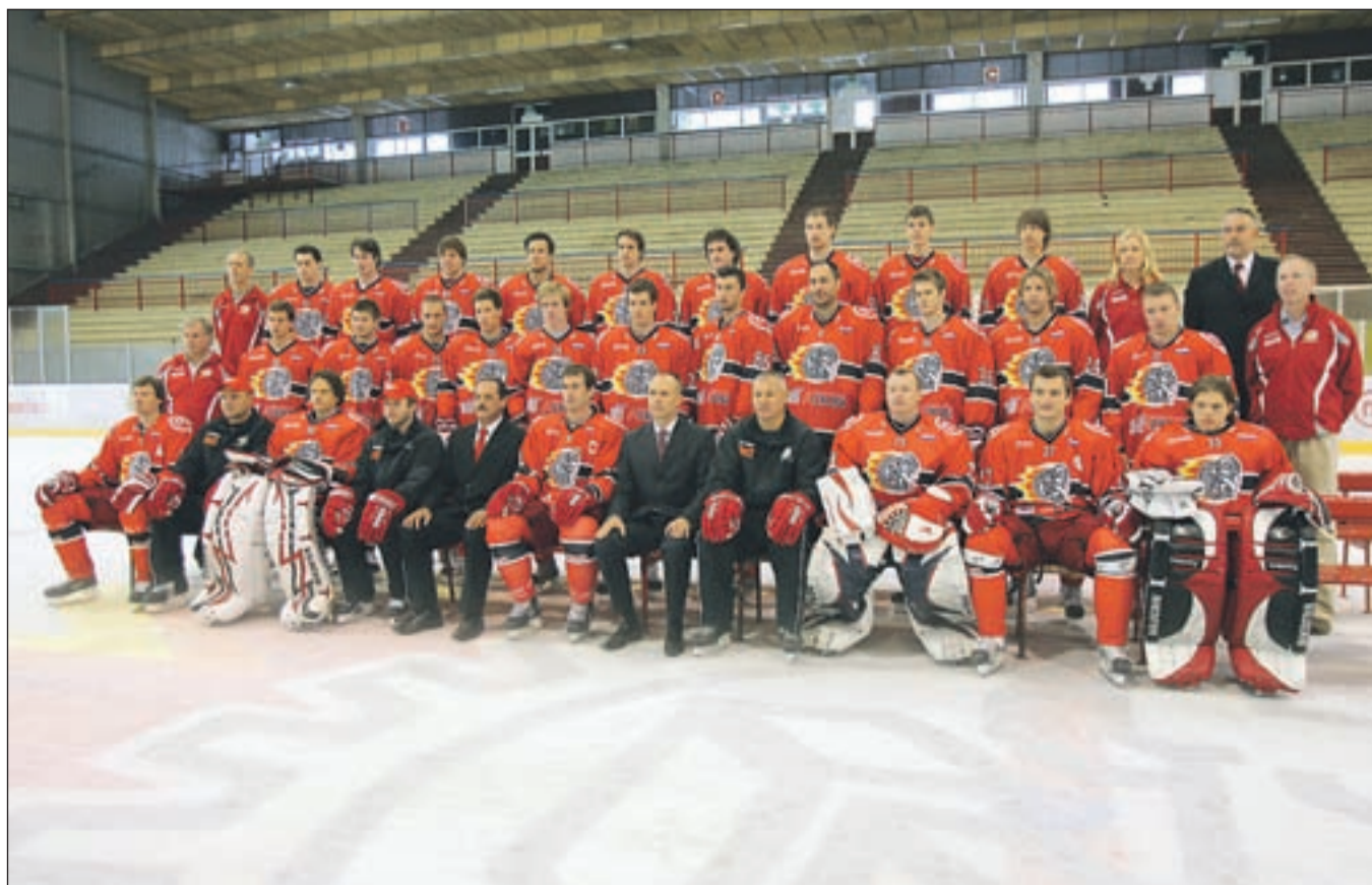
Ekipa Acronija Jesenic je letos močno pomlajena, vendar so v klubu prepričani, da ima lepo prihodnost.