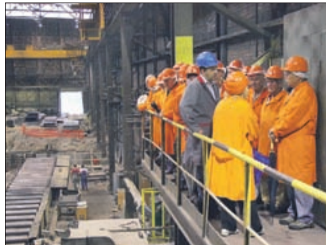
... ob ogledu proizvodnje.

Ob koncu ogleda Acronija so udeleženci izrazili zadovoljstvo nad tem, kar so videli, zlasti so bili presenečeni nad urejenostjo podjetja in "očiščenostjo" zunanjih površin. Zadovoljni so bili tudi z vodenjem, zato so predlagali, da bi podobne ogleda za krajanom pripravili vsako leto.