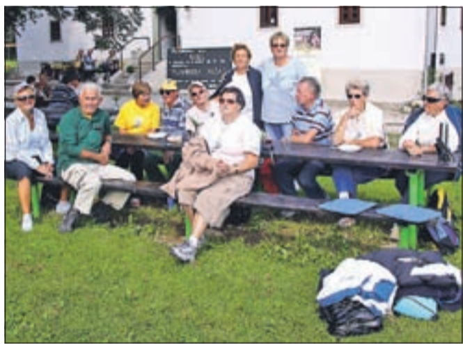
Utrinek z družabnega srečanja na Pristavi

Prireditev so pripravili tudi v Društvu upokoencev, kjer so počastili in skromno obdarili krajanje, stare osemdeset let in več. Bilo jih je prek petdeset.