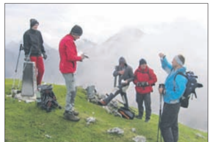
Vrh Vajneža je bil zavil v meglo.