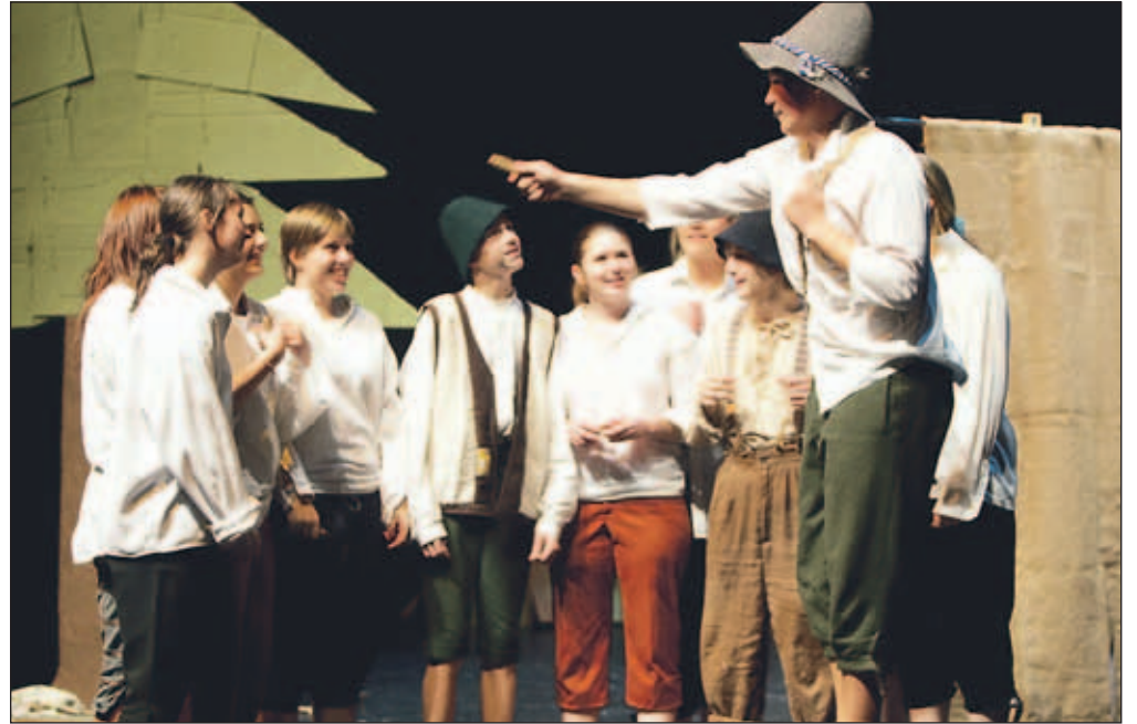
Bodoči pomočniki vzgojiteljev predšolskih otrok so pripravili zaključno prireditev z naslovom S Kekcem in Mojco v planine.