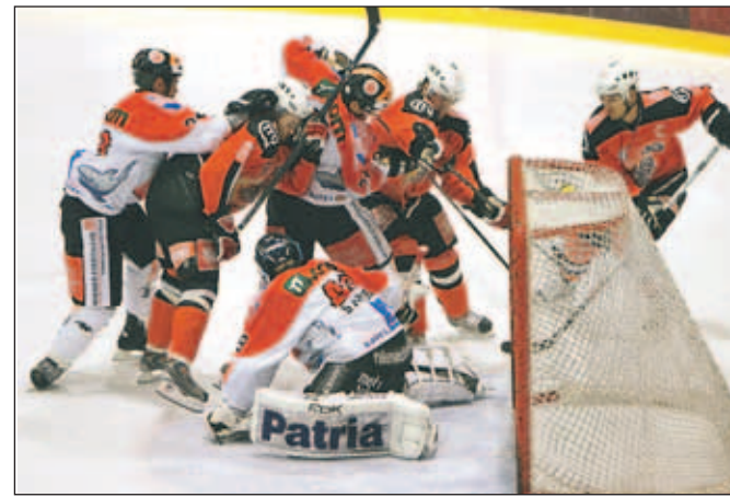
Pred golom Innsbrucka so bili Jeseničani nepopustljivi.