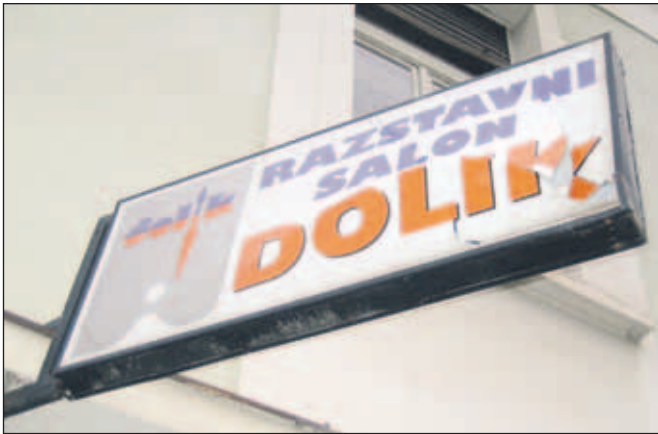
Tabla je razbita, instalacije potrgane, železni nosilci pa premaknjeni.

Pred dnevi so sodelavci razstavnega salona DOLIK opazili, da je nekdo poškodoval tablo, ki visi nad vhodom v salon. Tabla je razbita in premaknjena, kar lahko opazijo tudi mimoidoči. Je bil na delu vandalizem? Vodja razstavnega salona DOLIK Joža Varl je povedal, da ne kamen ne roka ne bi mogla tako močno poškodovati table, ki visi tri metre visoko. "Potrgana je vsa instalacija, železna konzola, ki drži tablo, pa je premaknjena za 45 stopinj. Tako da to ni moglo biti delo vandalov, ampak najverjetneje kamiona, ki odvažata smeti in ki po zagotavljanju sosedov edini vozi neposredno mimo salona," je dejal Varl. Zato se je že skušal dogovoriti z javnim podjetjem Jeko-In za povrnitev škode. Jeko-In naj bi namreč pri zavarovalnici imel sklenjeno zavarovanje za tovrstne primere škod. A šoferja smetarskega kamiona sta po Varlovih besedah zanikala, da bi poškodovala tablo, zato je bil poskus dogovora z družbo Jeko-In neuspešen. Tako v DOLIK-u ne vedo, kdo bo po pokril nastalo škodo, ki naj bi znašala tisoč evrov. Sami denarja nimajo in vse kaže, da bo vhod v hram ljubiteljske kulture še nekaj časa "krasila" zelo neugledna, razbita tabla ... U. P.