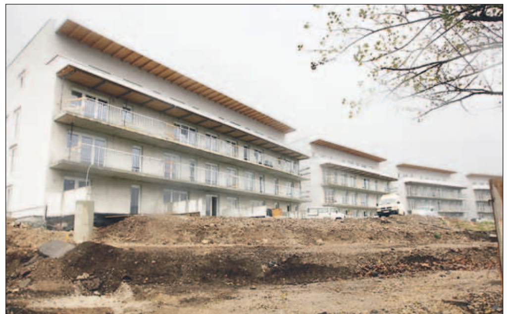
Elitno naselje ali navadno naselje ob železniški progi?

Ob tem pa so občinski svetniki na seji občinskega sveta opozorili, da bodo predvideni stolpiči zelo visoki, s čimer bo uničena panoramska osnova tega območja, v