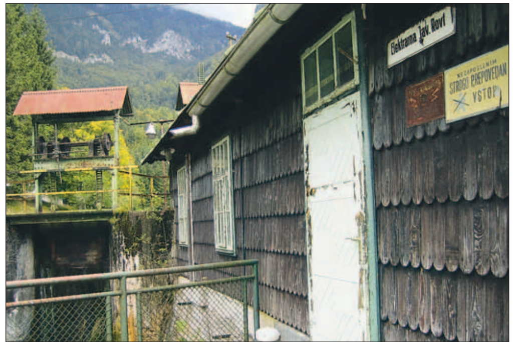
Hidroelektrarna Javorniški Rovt iz leta 1908 od zunaj ...