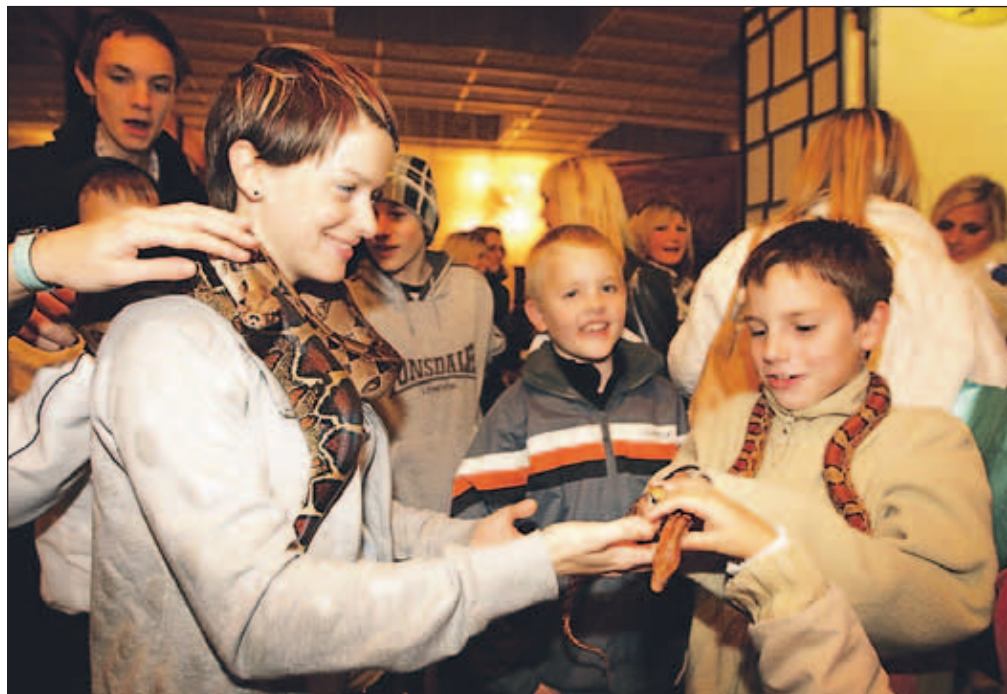
Za popestritev je poskrbelo Družinsko gledališče Kolenc z mini živalskim vrtom, v katerem imajo kače, ježe, krastačo, skakače, želvo ... Obiskovalci so živali lahko tudi pobožali in si kače celo nadeli okoli vratu ... | URŠA PETERNEL, FOTO: ANKA BULOVEC