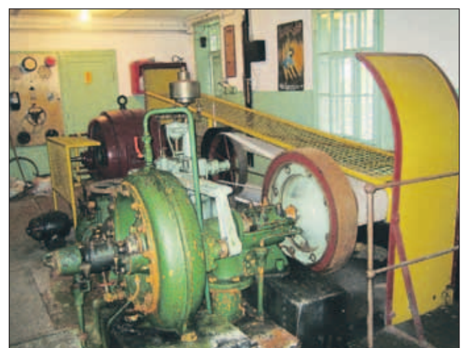
... in njena odlično ohranjena notranjost s številnimi zanimivi detajli

blem odtekanja vode iz lesene vodnega zajetja na Javorniškem Rovtu in izkoristka pritokov potoka Javornik pod jezom, se je KID odločila, da zgradi elektrarno. Tako je leta 1908 avstrijska tovarna J. M. Voight iz St. Poltna zgradila Hidroelektrarno Javorniški Rovt. Pridobljena energija je poganjala črpalke, ki so iz nižje ležečih vodnih zajetij črpalke (vračale) vodo v vodni rezervoar. Danes hidroelektrarna ne deluje več, ogledati si jo je mogoče kot spomenik preteklosti, ključ objekta pa obiskovalci lahko dobijo v Domu Trilobit.