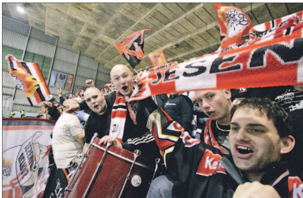
Pekleno vzdušje, kot ga znajo pričarati le člani skupine Ultras.