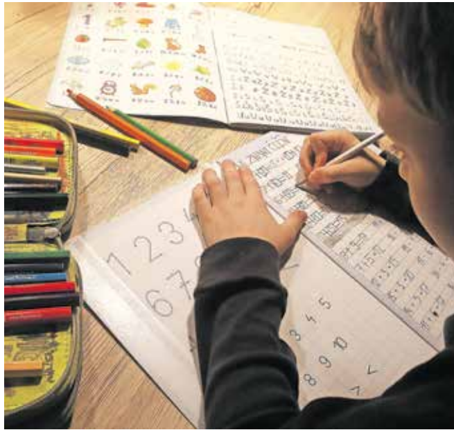
V gorenjski regiji se v letošnjem šolskem letu na domu šola 77 učencev.

»Šola ni rožnata in še danes menim, da javni šolski sistem ne podpira odprtosti uma in ustvarjalnosti, ampak ga s prenatrpanimi informacijami in zahtevami ter pretirano tekmovalnim duhom ugaša. Tukaj tudi tiči razlog, zakaj se vedno več družin odloči za šolanje na domu,« razmišlja mama, ki je svojega otroka dve leti šolala na domu, a je zaradi izčrpanosti, ki je vodila v resne zdravstvene težave,