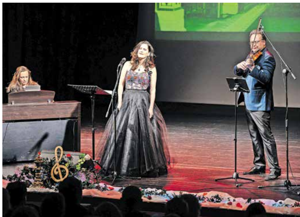
Koncert Dunajski večer je občinstvo lepo sprejelo.

Zakonca Izmajlov se v Slovenijo vračata kmalu. Že marca ju čaka nastop v Ljubljani, pripravljajo pa tudi turnejo za Dunajski večer. Z njim bodo nastopili v Ljubljani, po Avstriji, v mislih pa imajo tudi Nemčijo.