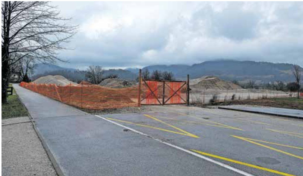
Občina Bled bo pod Blejskim gradom gradila parkirišče.

Letošnji sveženj sredstev so zagotovili iz različnih virov. Med drugim je 250 tisoč evrov prihodkov od Turističnega društva Gorje, 80 tisoč evrov iz naslova parkirnih in