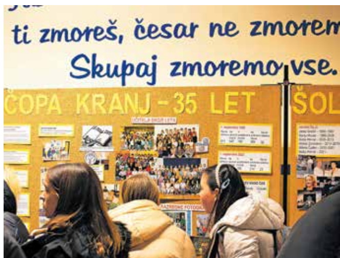
Ob vhodu v šolo si je bilo mogoče ogledati razstavo s fotografijami učencev in učiteljev iz preteklih let.

Za točko smo uporabili tudi motor, zato je bila točka veliko boljše in bolj smešna,« je razložila Ela Zaletel in dodala, da so se med nastopom vsi zabavali in se zares živeli v vloge mladine 19. stoletja. Obiskovalci pa so si lahko ogledali še razstavo na vhodu šole s fotografijami učencev in učiteljev iz preteklih let.