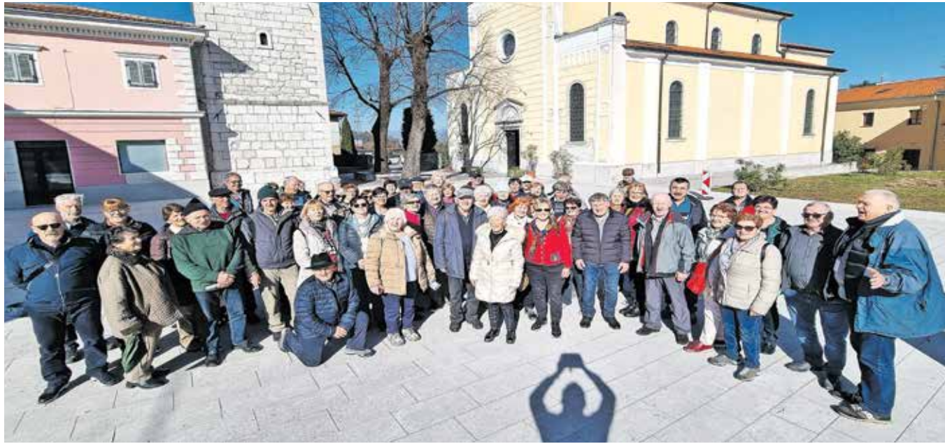
Skupinska slika na trgu pred cerkvijo svetega Martina v Sežani