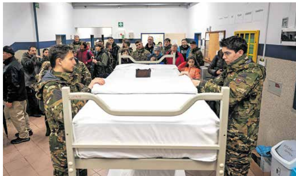
Veste, kako se na vojaški način pravilno postelje postelja?