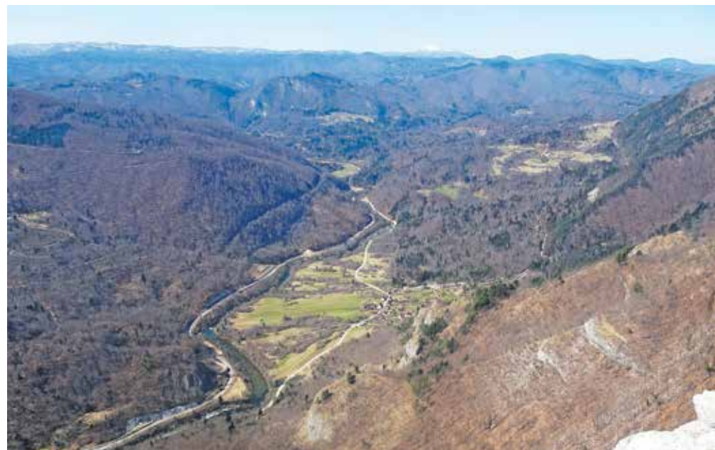
Z Loške stene pogled na dolino reke Kolpe. V ozadju se vidi Snežnik.

ki ga tudi končno zagledamo zapisanega na enem od smerokazov. Cesta se začne spuščati in nas pripelje do spominskega znamenja nekdanje partizanske bolnišnice. Zavijemo levo, cesta se začne vzpenjati. Dosežemo obračališče, na levi pa opazimo oznake za Firstov rep in tudi za Loško steno. Kolovoz se rahlo spušča in na ostrem desnem ovinku nadaljujemo kar naravnost skozi gozd. Občutek je, kot da hodimo po nekakšnem pomolu. Hitro dosežemo Firstov rep, kjer je vpisna skrinjica. Do Loške stene se bomo kar spuščali. Bodimo oprezni za markacijami, saj je svet izrazito kraški. Razgled z Loške stene je spektakularen, saj se globoko pod