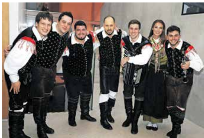
Ansambel Saša Avsenika

Seveda v Delovni akciji tudi brez presenečenj ne gre, lahko pa pričakujemo srečne konce manj srečnih zgodb. Delovna akcija se tako vrača na Pop TV ob nedeljah zvečer ob 20. uri.