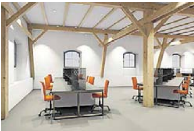
Projekcija podjetniškega inkubatorja

Po podpisu pogodbe z izvajalcem sledi še podpis pogodbe za nadzor in za dobavo ter montažo pohištvene opreme ter javno naročilo za tehnološko opremo za inkubator. Izvedba projekta mora biti zaključena do konca oktobra letos, kar je pogoj za izplačilo pridobljenih sredstev iz državnega proračuna.