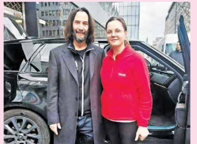
Keanu Reeves spada med prijaznejše in dostopnejše svetovno znane igralce.

Igralec svetovnega slovesa Keanu Reeves, ki se je veliki večini vtisnil v spomin iz kultne franšize Matrica, navdušuje pa tudi kot John Wick v istoimenskih filmih, je v teh dneh obiskal Ljubljano. Po pisanju tako slovenskih kot hrvaških spletnih portalov se je v Ljubljani oglašil zaradi podjetja Akrapovič, ki proizvaja izpušne sisteme. Po mnenju nekaterih naj bi za podjetje Akrapovič posnel dokumentarec, drugi pa trdijo, da oglas. Zasedli pa smo, da je igralec velik ljubitelj motornih koles, tako ko Reeves pa so tudi Akrapovičevi sistemi znamka svetovnega slovesa. Po tem, ko so člani njegove ekipe vsako jutro popili kavo v Žitovi trgovini na Bavarskem dvoru v Ljubljani in so se v njej počutili že kar domače, so prodajalkam omogočili tudi srečanje in fotografiranje z zvezdnikom, od Žita pa je ta v dar dobil sveže pečeno potico.