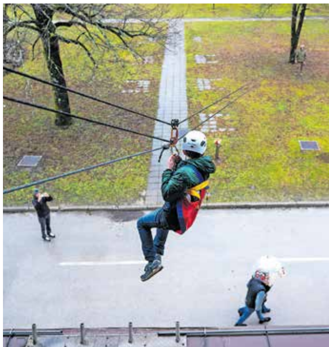
Med dejavnostmi, ki so jih lahko izkusili tudi starši in drugi obiskovalci, je bil spust po jeklenici.

Na ministrstvu opažajo velik porast zanimanja mladih tako za poletni kot tudi zimski tabor, zato so že lani povečali število mest za udeležence, letos pa so na zimski