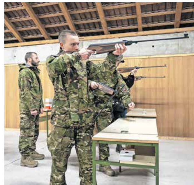
Udeleženci so se preizkusili v streljanju z zračno puško.

poleg tega je ta dan mlade pozdravil minister za obrambo Marjan Šarec. »Tabori so izjemnega pomena pri seznanjanju mladih z vojaškim poklicem, zato jih bomo v prihodnje še krepili. Velik del udeležencev se kasneje odloči za zaposlitev v stalni sestavi Slovenske vojske, nekateri za pogodbeno rezervo, tretji za prostovoljno usposabljanje, kar dokazuje, da mladi vidijo perspektivo zase v vojski. Navsezadnje jim nudi različne segmente poklicev, od kuharja do operaterja vrhunске tehnolo-