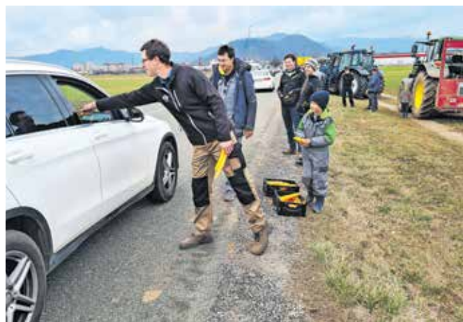
Na protestu so voznikom brezplačno delili korenje.