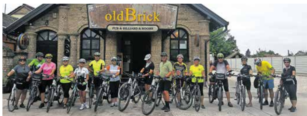
Sombor, skupinska slika pred odhodom / Foto: Slavko Zupanc

kolesarili po nasipu ob reki skozi kraj Labudnjača do cilja Bačko Novo Selo. Vreme tisti popoldan ni bilo preveč prijazno za kolesarjenje, saj nas je zadnjih deset kilometrov kar precej namakal dež. Prenočili smo v hotelu Bela vrba, ki stoji nekoliko zunaj iz naselja v bližini Donave. Pred večerjo smo opazovali še lep sončni zahod.