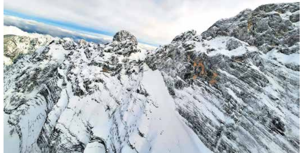
Truplo so našli na območju gore Kepa v občini Kranjska Gora.

Kot so navedli, okoliščine kažejo, da je pokojnik pri prečkanju manjše grape zdrsnil v globino. »Nesreča