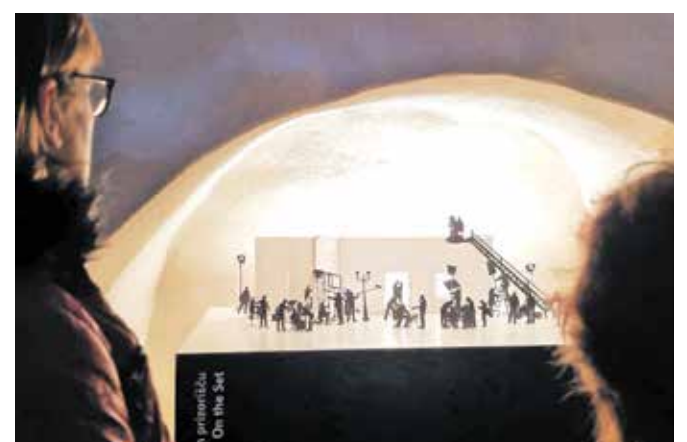
Maketo snemanja kadra so postavili kar v prostoru, kjer je bila včasih ledenica (shramba za led).