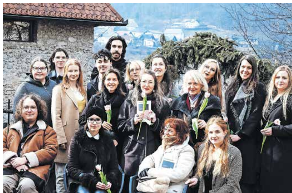
V branje vam ponujajo antologijo erotične kratke proze.

Nabor 19 kratkih zgodb je zelo raznolik, tako po dolžini besedila kot slogovno. Več kot dve tretjini je avtoric, še bolj pa prevladujejo avtorice in avtorji, rojeni v devetdesetih letih, prav tako pa v nekaj predstavitevnihih stavkih o vsakem izmed njih lahko ugotovimo, da so ti zelo različnih poklicev oziroma študijskih usmeritev. »Res je, da zbirka presega izkušene, mogoče celo uveljavljene avtorje, da se v njej