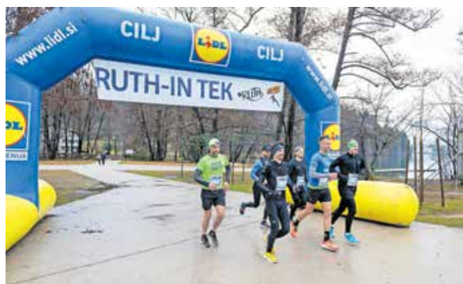
Letošnji Ruthin tek je bil jubilejen.