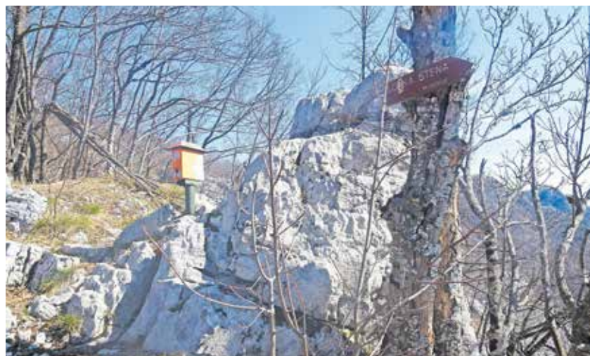
Skrinjica na Firstovec repu s smerokazom proti Loški steni

Nadmorska višina: 1192 m Višinska razlika: 900 m Trajanje: 7 ur Zahtevnost: ★★★★★