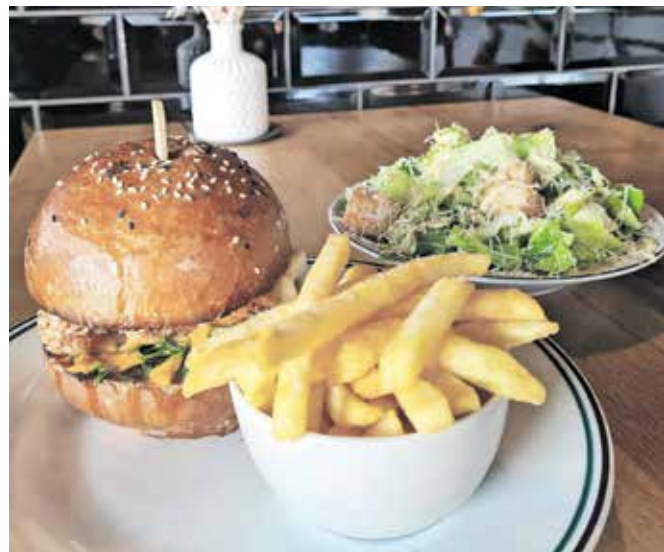
Slastni burger z ocvrtim piščancem, krompirček in cezarjeva solata

Ker je bila nedelja, sem najprej mislila, da se bom morala zadovoljiti s pico, potem pa sem se spomnila na kranjski Projekt burger. Letos pravzaprav praznuje desetletnico obstoja. Na začetku je bil lokal znan po izjemno okusnih burgerjih in glas o njih se je hitro razširil. Spletni portal Big 7 Travel ga je med petdesetimi najboljšimi uvrstil zelo visoko na lestvici priljubljenosti, obrazložitev pa je bila, da imajo odlične k-