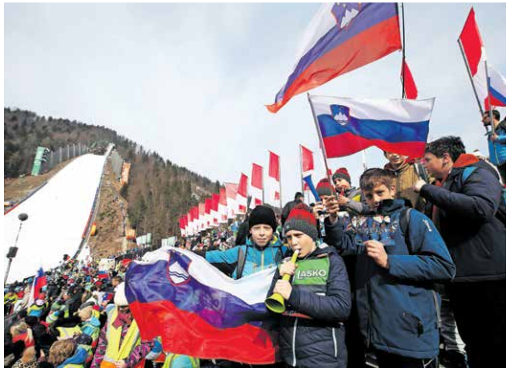
Letalnica bratov Gorišek bo gostila moške finalne tekme, na srednji skakalnici pa se bodo pomerile skakalke, ki prav tako na finalni tekmi upajo na izjemno vzdušje.

Ogled tekme smučarskih skakalk bo mogoč z istimi vstopnicami kot ogled četrtkovskega uradnega treninga in kvalifikacij skakalcev na Letalnici bratov Gorišek. Organizatorji in navijači verjamejo, da bo letošnja finalna tekma skakalk odprla tudi vrata k izvedbi finalne tekme skakalk na Letalnici bratov Gorišek v prihodnji sezoni.