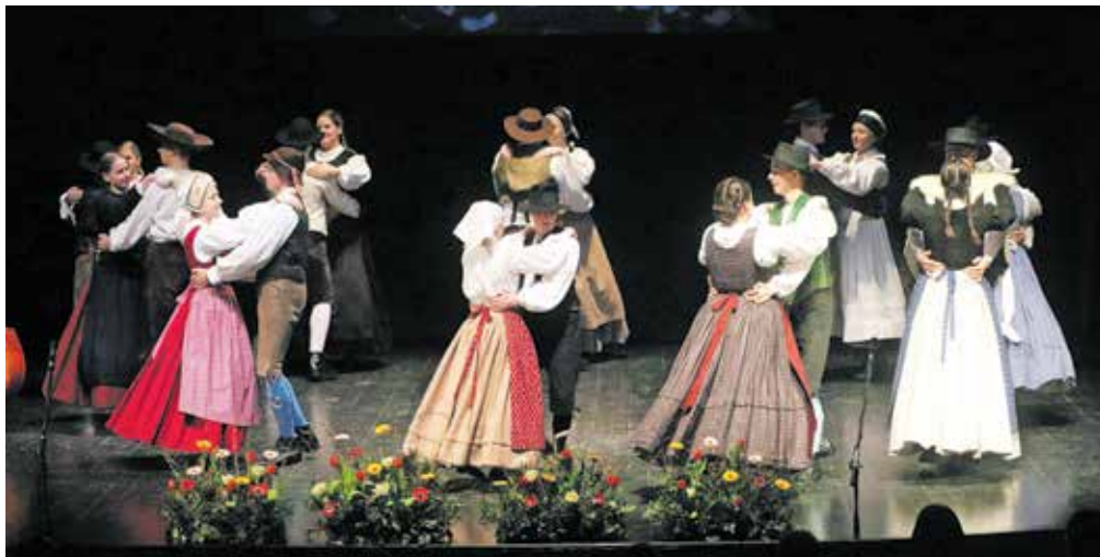
Skodzi ples in petje je občinstvo lahko podoživelo petdeset let ustvarjanja na področju folklorne dejavnosti.

večine odrskih postavitev, sodeloval je tudi kot soavtor, dve odrski postavitvi pa je za tokratni večer tudi priredil.