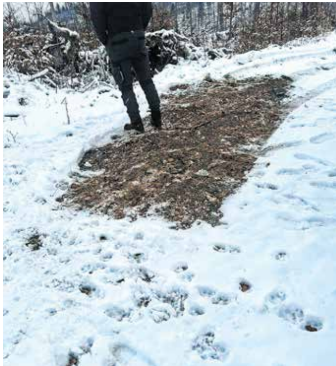
Slika kaže, kje naj bi bilo parkirano vozilo, iz katerega naj bi domnevno v naravo izpustili tri volke. Okoli je polno sledi – od psa, a tudi od volkov.

Problematiko domnevnega izpusta volkov v naravo je na izredni seji obravnavala