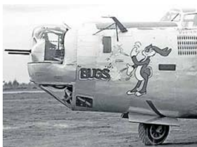
Letalo B-24G, ki je novembra 1944 strmoglavilo na območje Kotovega sedla. Ob 80. obletnici želijo v društvu pripraviti muzejsko razstavo in spominsko slovesnost v Tamarju.