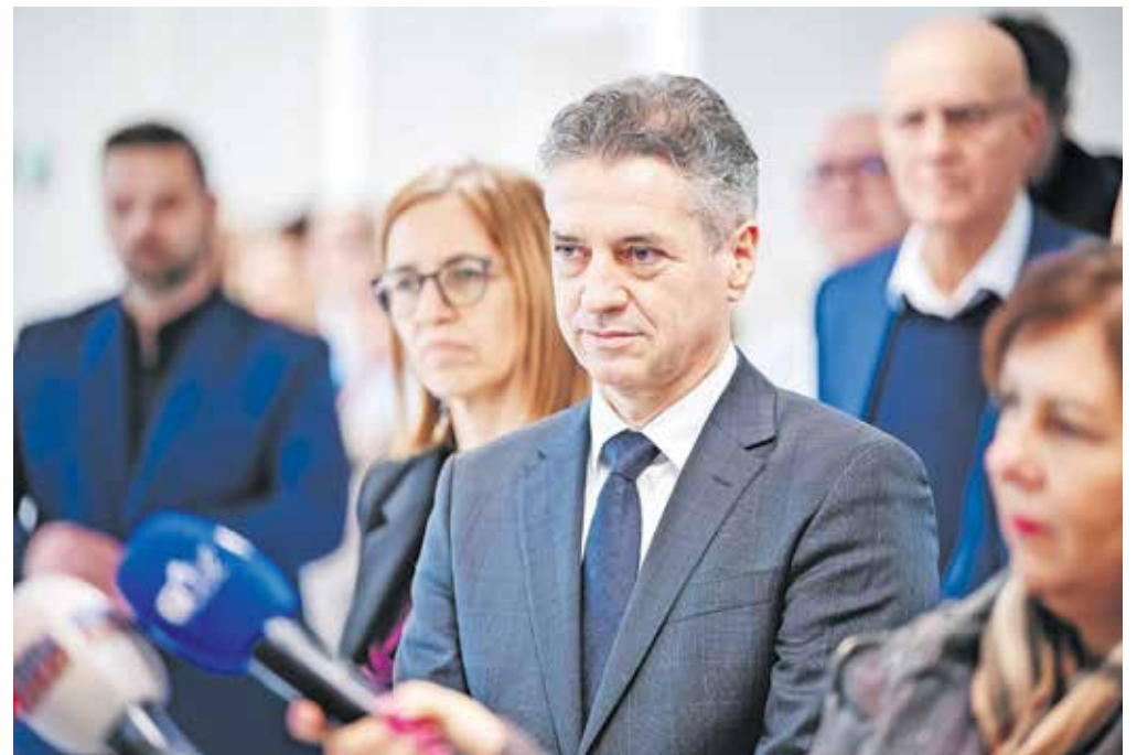
Po mnenju predsednika vlade Roberta Goloba stavka zdravnikov in zobozdravnikov traja že predolgo, kar večja stiske pacientov.