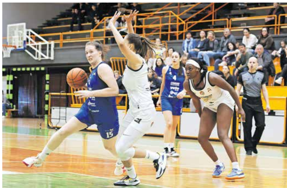
S požrtvovalno igro so si Kranjčanke (v modrih dresih) priigrale finale.