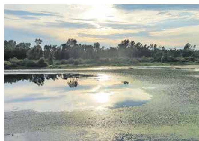
Bačko Novo Selo, sončni zahod

Iz Apatina je do kraja Bogojevo uradna kolesarska pot speljana ob Donavi, mi pa smo se odločili za bolj neposredno in osem kilometrov krajšo pot po cesti skozi kraje Svilojevo in Sonta. V bližini naselja Bogojevo sta most čez Donavo in mejni prehod med Srbijo in Hrvaško. Tu bi prečkali reko, če