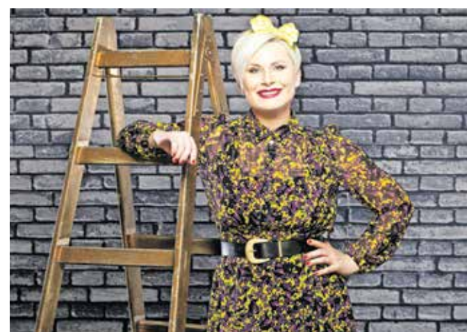
Ana Praznik