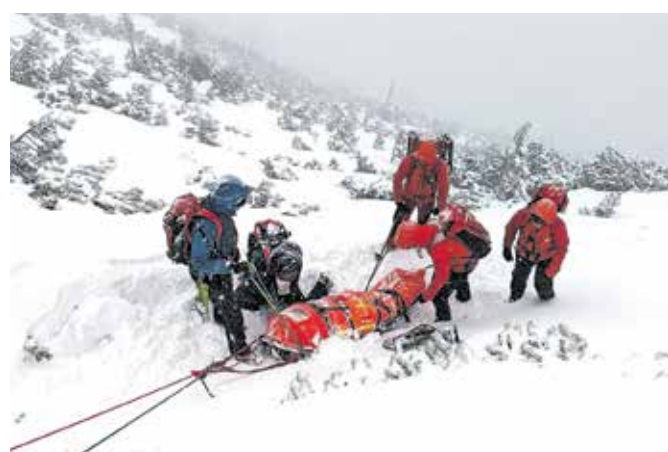
Zahtevno reševanje onemoglih planincev na Storžiču

Huje podhlajeni se je postopoma segrel in je kljub močnemu deževju v spremstvu reševalcev lahko sestopil do avtomobila. Drugi planinec po kratkotrajnem segrevanju in preoblačenju v suha oblačila nadaljnje oskrbe ni potreboval. »Oba pohodnika sta bila neprimerno oblečena in brez tehnične opreme. Pri njiju smo pogrešali tudi nahrbtnik, rokavice, hrano, pijačo. Zaradi zelo slabega vremena sta bila blizu veliko hujšega razpleta, tako pa sta jo z veliko sreče odnesla brez posledic,« so še navedli kranjski gorski reševalci.