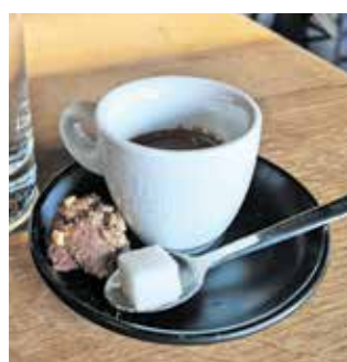
V Projektu burger je tudi espresso simpatično doživetje.

stripse«, to so panirani piščančji trakci, ki sta jih nemurno pomakala v zraven postreženo sladko-kislo omako. Mimogrede smo še izvedeli, da je otroški meni v obliki pobarvanke in se tako otroci zamotijo ter barvajo, ko čakajo na hrano; ter da so bila tokratna naročila burgerjev prijetno presenečenje, saj stranke največkrat izberejo govedino, in ne piščanca.