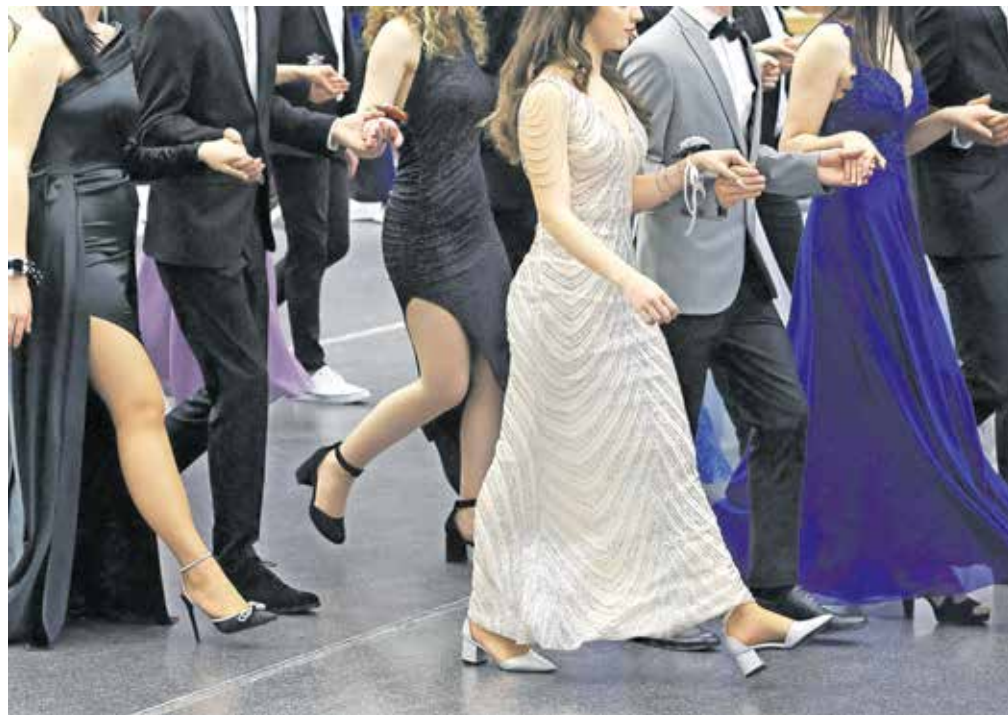
Maturantski ples predstavlja pomemben večer, ki oznanja zaključek srednješolskega obdobja. Kljub čustvenemu naboju in veselju, ki ga prinaša, pa se mnogi sprašujejo, koliko bo ta nepozaben večer dejansko stal.

Če ste pred leti za vstopnico odšteli med 30 in 40 evrov, so cene trenutno precej višje. Najnižjo vstopnico bodo plačali dijaki Gimnazije Kranj, ki bodo na osebo odšteli 55 evrov, cene pa so odvisne tudi od števila maturantov. Manj kot jih je, višja je cena, ki krije stroške najema dvorane. Vstopnice na osebo so se tako že povzpele na 76 evrov, kar v praksi pomeni, da za štiričlansko družino zgolj vstop na prizorišče stane okoli 300 evrov. Plesni večer seveda zajema tudi stroške plesnih vaj. Na tem področju so cene enotne, 50 evrov na dijaka, kar zajema deset plesnih vaj, ponavljalno vajo, generalko na dan dogodka in ponekod tudi plesne vaje za starše maturantov in vajo maturantov s profesorji. Vse šole