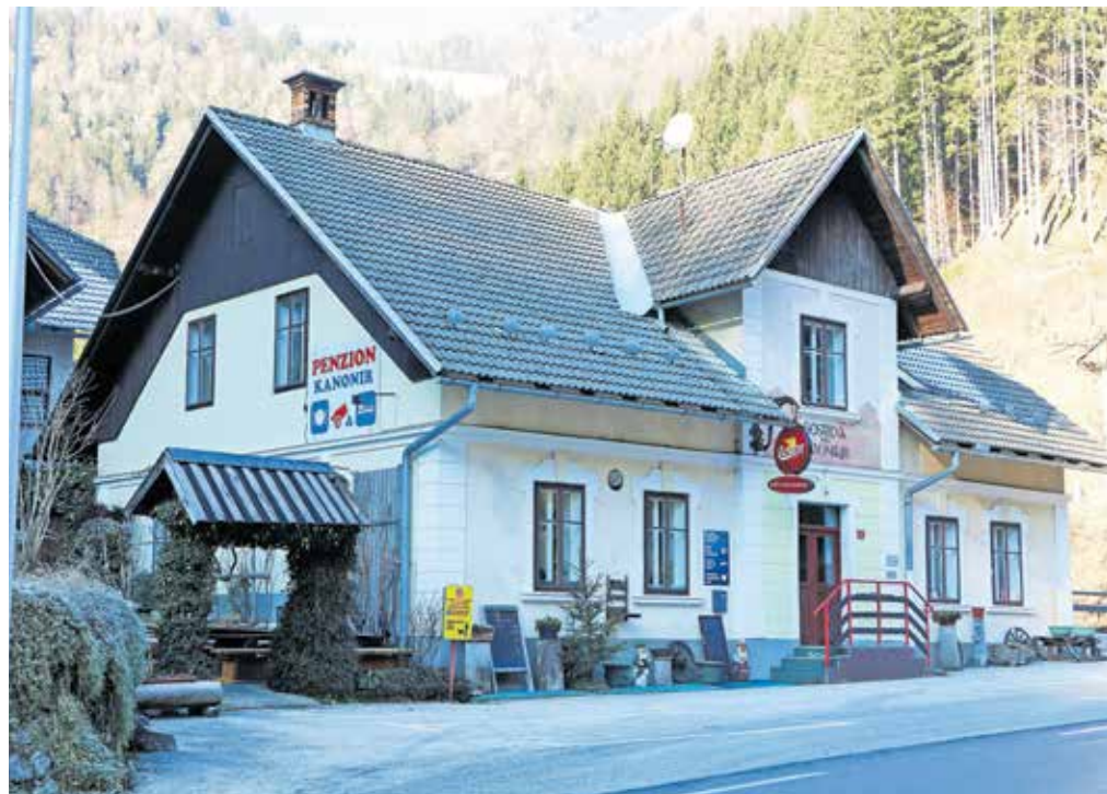
Gostilna in penzion Kanonir stoji ob glavni cesti na Jezersko iz smeri Kranja in spada med najstarejše stalno delujoče gostilne na Jezerskem.

stilne polne,« pripoveduje. Tudi ribiči naj bi bili redni gostje, saj je bila reka Kokra polna rib; pa planinci ravnno tako. Zdaj so med planinci, ki prihajajo, večino tujci, ki opravljajo Slovensko planinsko pot, pojasni lastnica. »Ker imamo sobe, včasih prespijo. Pridejo od Češke koč, nadaljujejo na Storžič, Kališče, Stegovnik, Kozji vrh ... Velikokrat pa se pri nas ustavijo tuji motoristi. Še vedno je veliko gostov lovcev, pa tudi kakšna družina pride na kosilo,« našteva. »Od tujcev pa