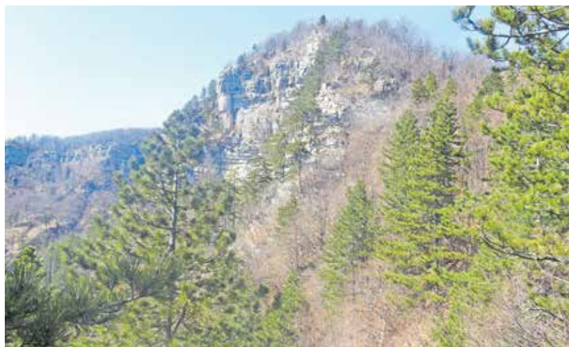
Pri sestopu se nam lepo pokaže skalnati Krokar.