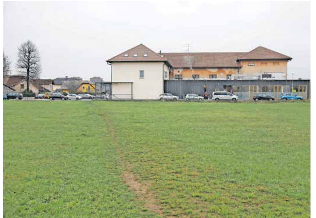
Sklad obrtnikov in podjetnikov je zaradi zemljišča na Primskovem vložil odškodninsko tožbo zoper Mestno občino Kranj.

Gre za zemljišče, ki je bilo predmet ustavne presoje. Sklad obrtnikov in podjetnikov, ki je na Primskovem želel graditi stanovanjske bloke, se je namreč na ustavno sodišče obrnil potem, ko je Mestna občina Kranj leta 2014 na pobudo civilne iniciative in Krajevne skupnosti Primskovo z novim občinskim prostorskim načrtom (OPN) namembnost zemljišča iz stavbnega spremenila v zelene parkovne površine. Ustavno sodišče je leta 2020 ugotovilo, da je OPN v tem delu neustaven, in določilo, da mora občina