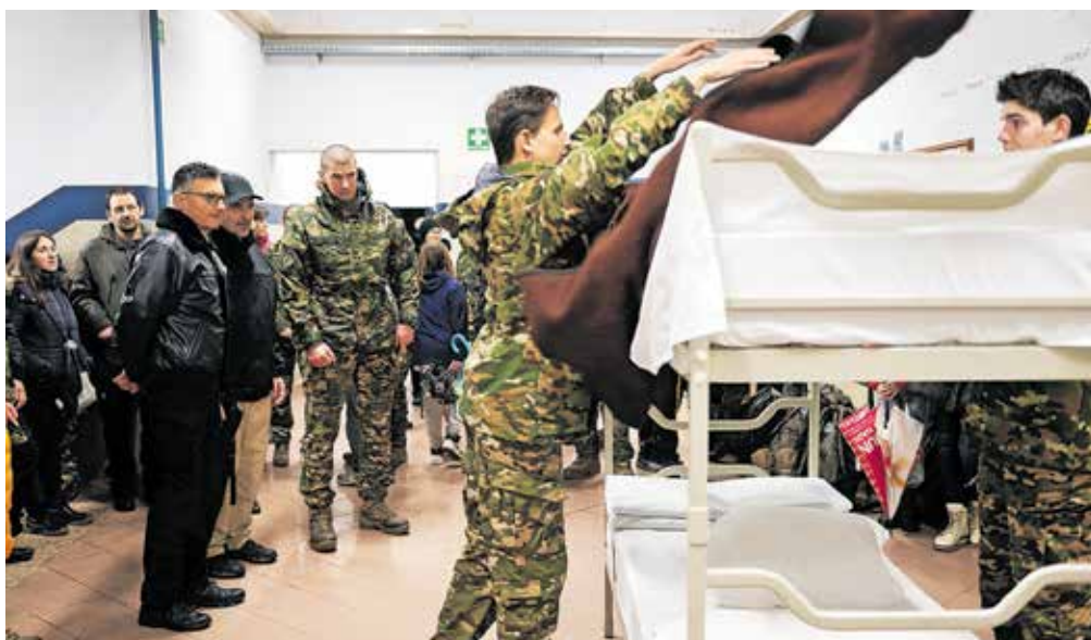
Med zimskimi počitnicami mladi spoznavajo vojaško življenje na taboru MORS in mladi, ki poteka v Vojašnici Boštjana Kekca na Bohinjski Beli.