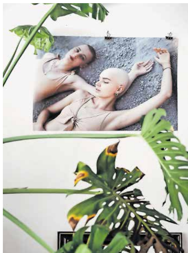
Utrinek z razstave fotografij Razcepljene konice / Foto: Maša Pirc

Vse tu opisane razstave so na ogled še ta teden, do 2. marca.