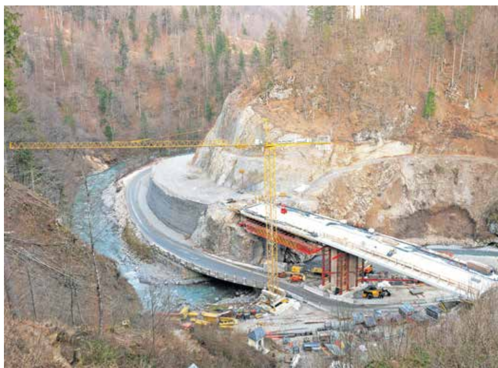
V sklopu druge faze na lokaciji pod Sušo urejajo območje zadrževalnika, ki bo lahko zadržal milijon kubičnih metrov vode.