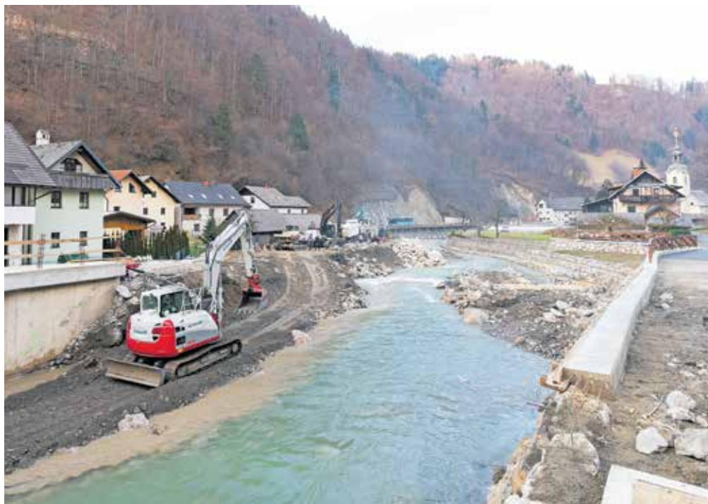
Vodnim ureditvam na odseku od Dermotovega jezua do Dolenčevega jezua sledi še gradnja obvoznice mimo starega dela mesta, ki bo umeščena na levi obrežni zid. Končana bo predvidoma sredi letošnjega leta.

V sklopu druge faze na lokaciji pod Sušo že poldrugo leto urejajo območje zadrževalnika. Uredili bodo dvajset metrov visoko zemeljsko