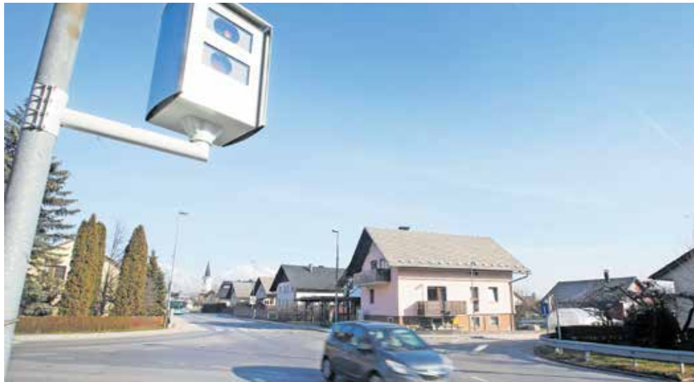
Med novimi lokacijami, kjer medobčinski redarji merijo hitrost, je tudi Škofjeloška cesta v Stražišču.

Zaradi zadnjih postavitev ohišij za radarje je mestno svetnico Sašo Kristan (SDS) zanimala tudi statistika ugotovljenih prekoračitev hitrosti in izdanih kazni na območju MOK. Po podatkih