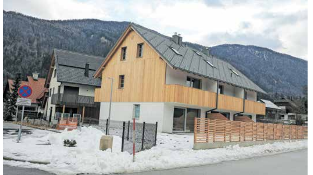
Po ugotovitvah Oštra je vsako četrto stanovanje v novogradnjah v alpskem turističnem območju namenjeno počitnikovanju. V Kranjski Gori je delež turističnih nastanitev najvišji. Slika je simbolična.