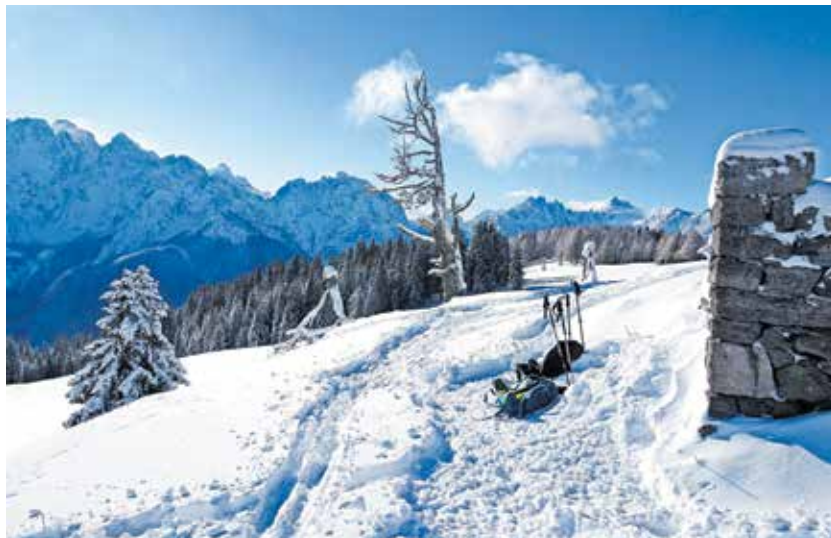
Del ruševin z Julijci v ozadju. Drevo na vrhu je na žalost klonilo.