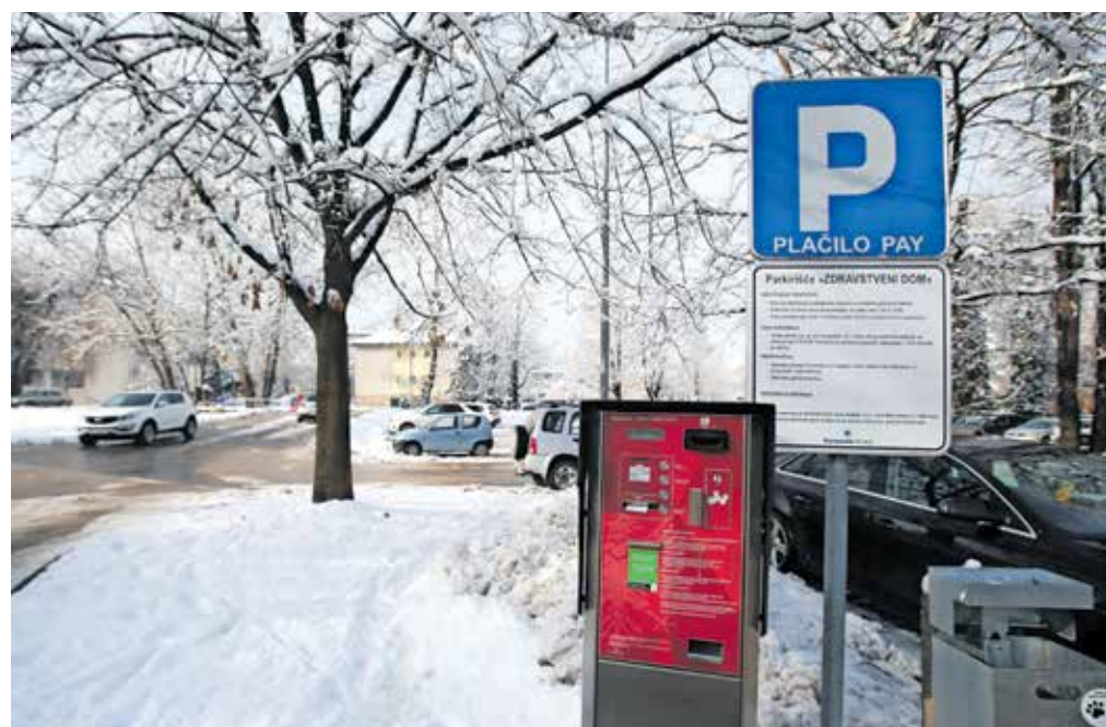
Na parkirišču pri Zdravstvenem domu Kranj je trenutno brezplačna prva ura parkiranja.