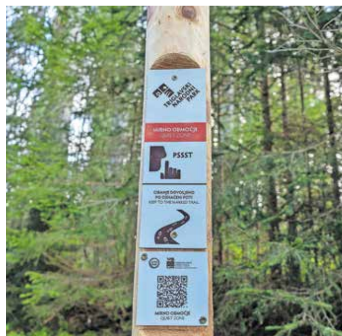
Med ključnimi rezultati projekta je 15 obnovljenih kalov, označitev in uveljavitev 19 mirnih območij ter nova usmerjevalna infrastruktura za obiskovalce.

Zavod za gozdove Slovenije je za izboljšanje življenjskega prostora zavarovanih gozdnih ptic, kot sta divji petelin in gozdni jereb, očistil 61 kilometrov presek, izvedel čiščenje lesne zarasti v okolici Fužinskih planin in zasadil več kot 15.000 sadik avtohtonih drevesnih vrst na Pokljuki. Društvo za opazovanje in proučevanje ptic Slovenije pa je v okviru projekta prvič izvajalo telemetrično spremljanje divjega petelina in belke, da bi bolje spoznali življenje teh dveh vrst. Kot je