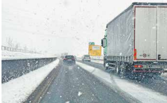
Na gorenjski avtocesti, za razliko od štajerske in dolenske, v petek zaradi obilnega sneženja ni bilo večjih težav.

kjer je zaradi vremenskih razmer – izmerili so kar 38 centimetrov novozapadlega snega – prihajalo do zamud v letalskem prometu. Zaradi močnega sneženja in vetra je letalo družbe Turkish Airlines dlje časa krožilo nad brniškim letališčem, na koncu pa se je njegova posadka odločila za pristanek na beneškem letališču, potem ko so tudi na zagrebškem letališču vladale slabe vremenske razmere. Odpovedana je bila povezava z Münchnom, kar je bilo povezano tudi z vremenskimi razmerami v Nemčiji, so za STA pojasnili v Fraportu Slovenija.