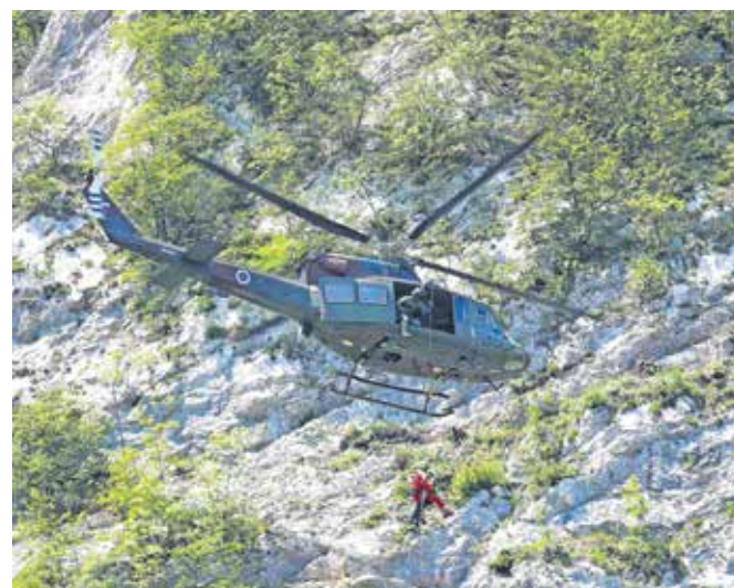
V lanskem letu je v štirih od desetih reševanj v gorah sodeloval tudi helikopter Slovenske vojske ali Policije.

V GRZS si želijo urediti problematiko plačljivosti gorskega reševanja v okviru novega zakona o gorskem reševanju (podobno kot ga imajo gasilci), za katerega že pripravljajo vsebinske predloge. »Država bo morala poiskati ustrezno finančno vzdržno rešitev za pokrivanje stroškov reševalnih akcij, še posebej helikopterskih reševanj, ki v zadnjem času, tudi zaradi velikega povečanja števila reševanj tujih državljanov, hitro naraščajo. Turisti, ki zahajajo v slovenske gore, so velikokrat slabo pripravljeni, brez ustrezne opreme, velikokrat