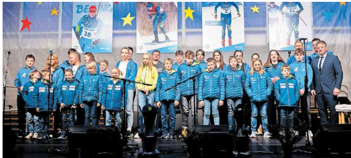
S prireditvijo podprejo gorjanske športnike in vse, ki se trudijo za razvoj zimskega športa v Gorjah.