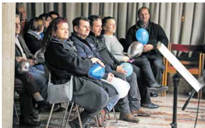
Gluhi gledalci so ob spremljanju koncerta držali balone, ki jim pomagajo občutiti vibracije in glasbo.