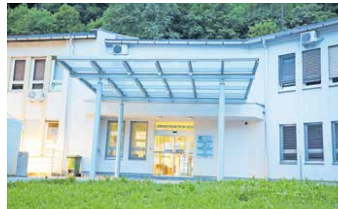
Nadomestna ambulanta bo delovala do pridobitve novega zdravnika.

Nadomestna ambulanta bo delovala do pridobitve novega zdravnika družinske medicine. »Na spletnih straneh zdravstvenih domov Osnovnega zdravstva Gorenjske pa tudi na drugih mestih so objavljeni podatki o možnosti registracije oziroma izbire osebnega zdravnika. Žal pa so zaradi pomanjkanja zdravnikov te možnosti omejene. V ZD Tržič trenutno nimamo novega zdravnika, ki bi lahko nadomestil dr. Krese-