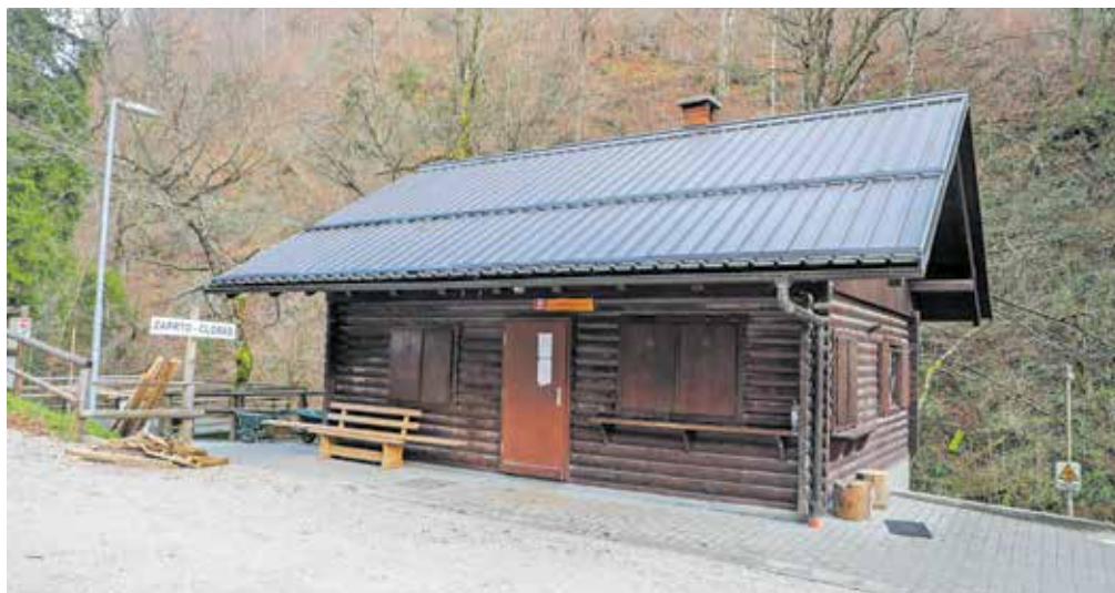
Brunarico pri vходу v sotesko Vintgar bodo predvidoma pred začetkom sezone preuredili.

no obiskovanje. Med drugim vsebuje tudi programsko shemo sodelovanja z lokalnimi skupnostmi na vplivnem območju, saj opažajo, da je bila vpetost upravljalca v širše lokalno okolje v zadnjih letih prepoznana kot pomankljivost in ovira pri uvajanju