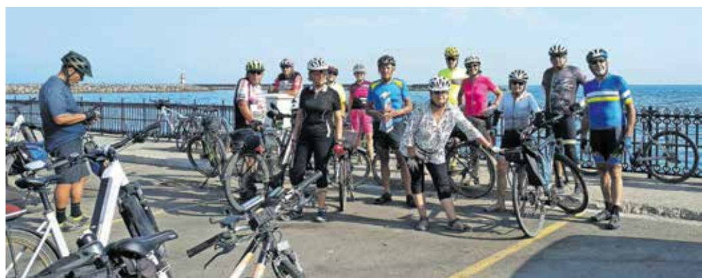
Kolesarji na obali Marmarskega morja

Po štiridesetih kilometrih kolesarjenja po podeželi smo prispeli v večje mesto Muratli, ki leži v provinci Tekirdağ, kjer je zelo močno razvito vinogradništvo in vinarstvo. Skozi mesto pelje železniška proga iz Bolgarije proti Carigradu. Med znamenitostmi mesta je železniška postaja, zgrajena