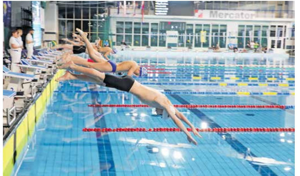
Gre za nekakšno »svetovno prvenstvo« za mlajše.