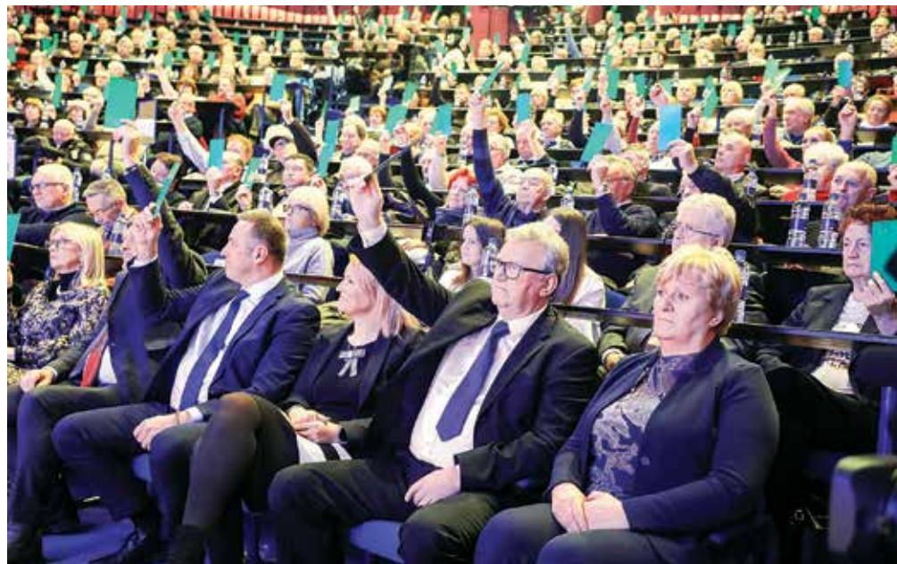
Udeleženci ustanovnega kongresa so potrdili tudi program in statut ter izvolili organe stranke.