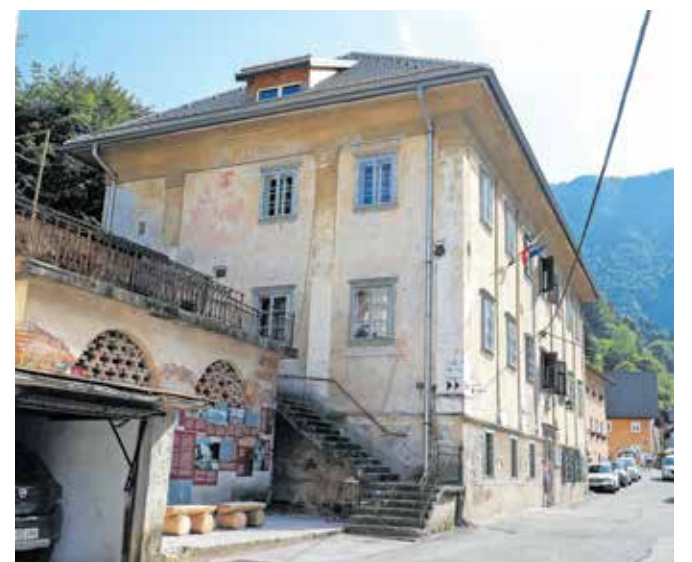
Klinarjevo hišo, v kateri so prostori Kovaškega muzeja, v zadnjih letih temeljito prenavljajo.

potresnih sider, obnovo fasade, zamenjavo stavbnega pohištva ter dokončno ureditev dveh prostorov za razstavno dejavnost v drugem nadstropju objekta, kjer sta predvideni novi stalni razstavi o žebjarstvu ter nekdanjem življenju v Kropi in Kamni Gorici. Muzej bo predvidoma zaprt do konca marca.