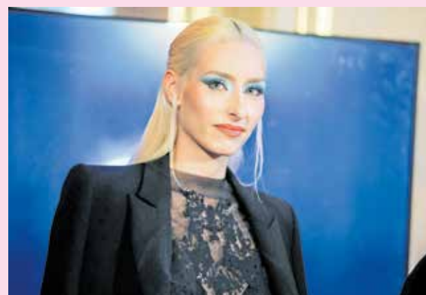
Raiven je navdih za skladbo Veronika našla ob raziskovanju usod ikoničnih žensk, natančneje pri Veroniki Deseniški.

V sobotni televizijski oddaji Misija Malmö sta glasbenica Raiven in RTV Slovenija predstavila letošnjo evrovizijsko skladbo Veronika. Navdih za skladbo, s katero nas bo maja zastopala na 68. izboru za pesem Evrovizije v švedskem mestu Malmö, je Raiven našla ob raziskovanju usod ikoničnih žensk, natančneje pri Veroniki Deseniški: skrivnostni figuri slovenske zgodovine. Skladbo poje v slovenščini. »Menim, da zvrst skladbe, ki jo bom izvedla na Evroviziji, ne potrebuje angleškega jezika. Prepričana sem, da sta tako zgodba kot glasba dovolj močni in izraziti, da bodo njuno bistvo in čustveno globino lahko zaznali in razumeli tudi poslušalci, ki ne govorijo slovensko,« je prepričana Raiven, ki je tudi avtorica glasbe in besedila. Pri ustvarjanju Veronike se je njeni ustaljeni avtorski ekipi pridružil tudi naš lanski evrovizijski predstavnik Bojan Cvjetičanin, sicer pevec skupine Joker Out.