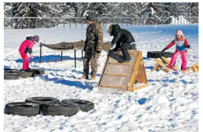
Otroci so se lahko preizkusili tudi na poligonu Slovenske vojske.