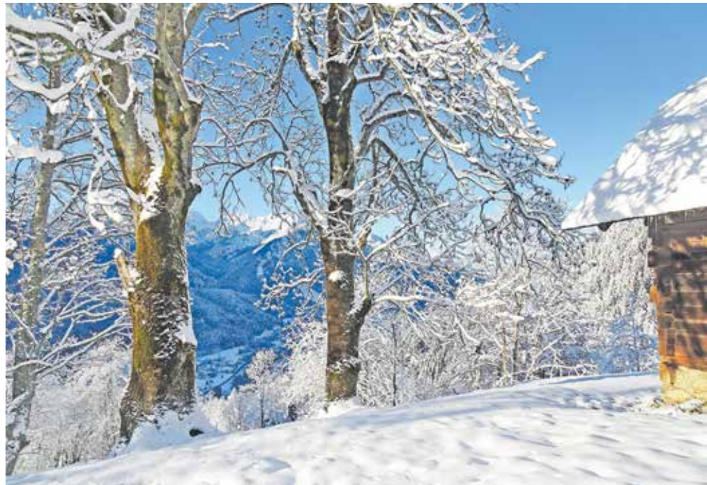
Zimska idila na travniku nad Srednjim Vrhom

nato gre skozi gozd, v nekaj okljukih pridobimo precej višine, potem pa dosežemo travnik Jureževe planine, kjer se poleti sicer pase živina. Smo na višini približno 1400 metrov. Sledimo grabnu, bolj proti desni, in dosežemo zasneženo panoramsko cesto, ki nas v kopnih razmerah pripelje mimo lovske kočice do Železnice. V zimskih razmerah običajno le prečimo cesto in nadaljujemo po travniku, ki je pred nami proti gozdu. Ko prehodimo še nekaj višinskih metrov skozi gozd, smo na robu travnika, po katerem je Vošca dobro znana. Pretekli teden je bila na cesti gaz narejena proti Jureževi planini, pred katero je zavila čez travnik, proti gozdu