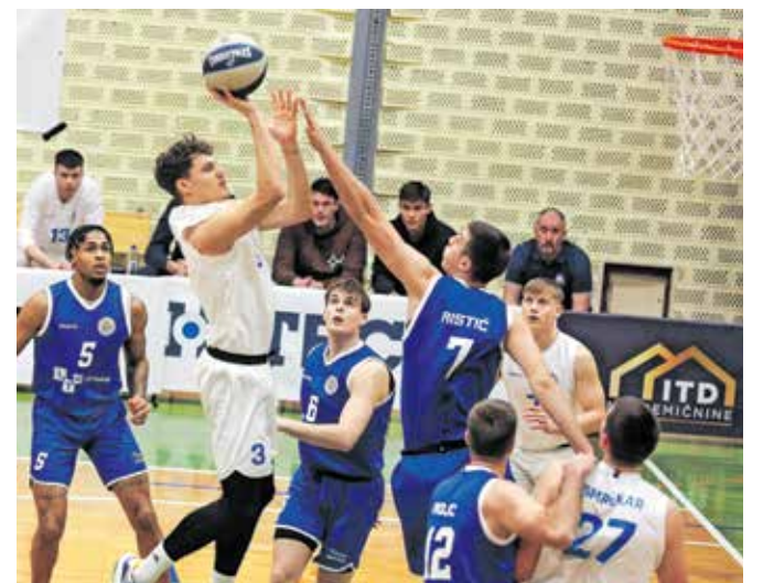
Košarkarji ekipe ECE Triglava (v belih dresih) so si zanesljivo zagotovili zmago nad LTH Castingsom Škofja Loka.

ECE Triglav je zabeležil šesto zmago v sezoni, tako da lahko samozavestno odigra zadnji dve tekmi drugega dela trikožnega sistema proti neposrednim tekmecema v spodnji polovici lestvice. To soboto ga čaka pot