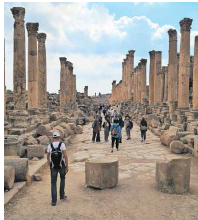
Džeraš, izjemno ohranjeni ostanki starodavnega mesta, katerega zgodovina sega več kot šest tisoč let v preteklost

Kraljevina Jordanija je v mnogih pogledih zelo sodobna 11-milijonska država vzhodno od reke Jordan; na zahodni strani reke sta Izrael in Zahodni breg. Meji še na Sirijo, Savdsko Arabijo in Irak. Po površini je je za dobre štiri Slovenije, večino države predstavlja visok plato, ki se vzdolž meje z Izraelom strmo spušča proti reki Jordan. Čeprav je tradicionalna muslimanska država, kjer si ženske ob odhodu iz hiše skoraj brez izjeme nadenejo rute, je v mnogih ozirih tudi zelo sodobna. Morda tudi zato, ker jo vodi kralj, katejega mati je bila Angležinja, ne njegova ne prestolonaslednikova soproga na nobeni