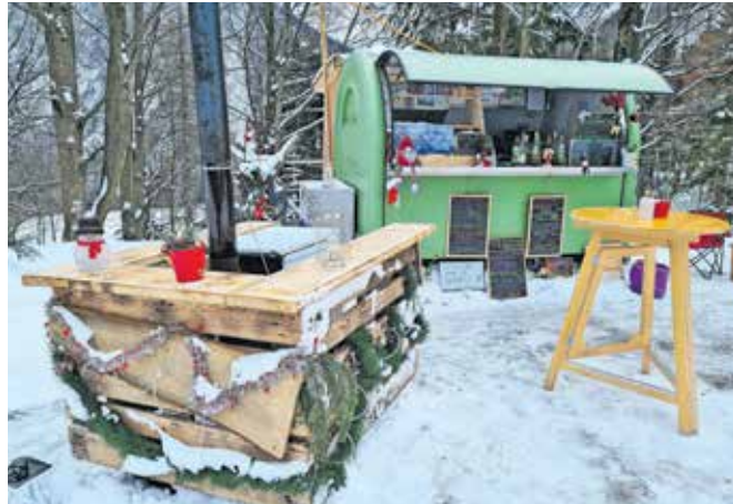
Šentančan v teh dneh