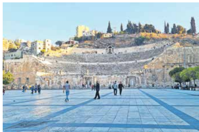
Rimsko gledališče s šest tisoč sedeži je bilo v Amanu zgrajeno pred skoraj dva tisoč leti, ko se je mesto še imenovalo Filadelfija.