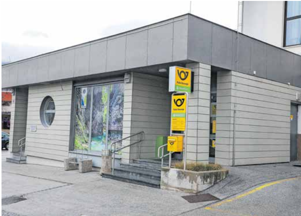
Občina Gorje bo kupila nepremičnino Pošte Slovenije v Zgornjih Gorjah.