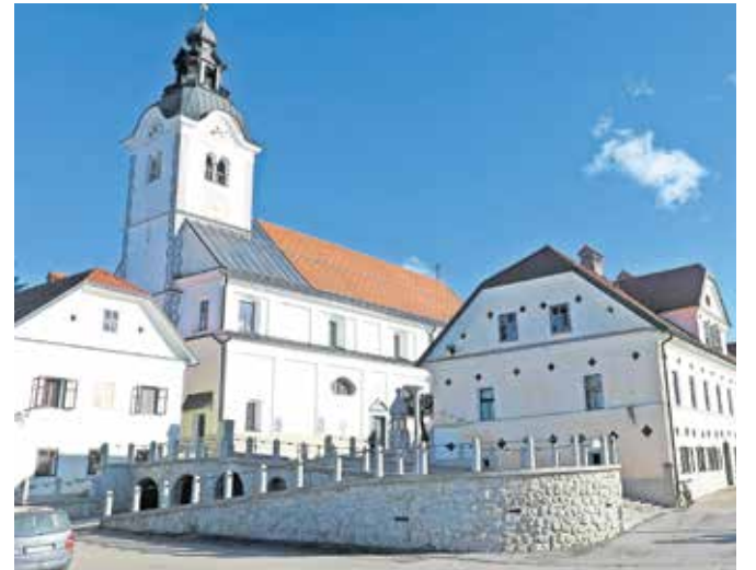
Pri izračunih koeficientov razvitosti ministrstvo za finance upošteva več kazalnikov, med njimi tudi opremljenost s kulturno infrastrukturo.

Glede na izračun sta vodilni občini upravičeni do 50-odstotne podpore investicij s strani države, ostalim navedenim občinam bo v tem in naslednjem letu pri-