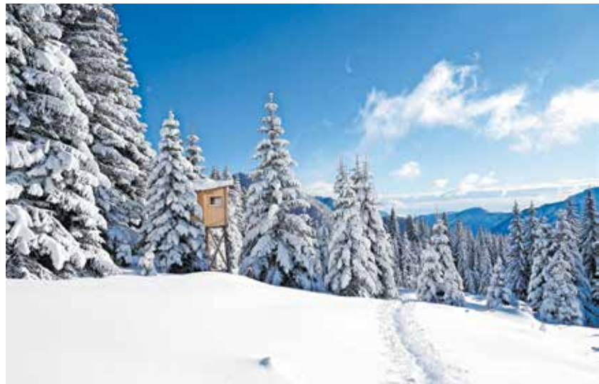
Fotogenična lovska opazovalnica v pravljicnem svetu

Nadmorska višina: 1734 m Višinska razlika: 774 m Trajanje: 3-4 ure Zahtevnost: ★★★★★