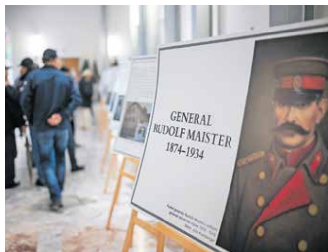
Razstava o Maistrovih borcih iz občine Škofja Loka