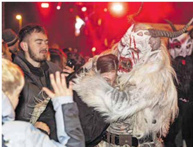
Pred besom parkeljnov tudi odrasli niso bili varni.