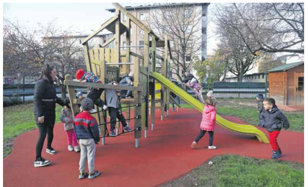
Malčki iz vrtca Janina so novo igralo z veseljem preizkusili.

»V okviru projekta Podpora družini smo letos pozornost namenili izboljšanju pogojev, v katerih otroci odraščajo, se izobražujejo in razvijajo. V sodelovanju z MK Group smo otroškimi vrtcem po vsej Sloveniji namenili donacije v skupni vrednosti 150 tisoč evrov. Verjamemo, da je takšna prenova otroškega igrišča prava naložba v prihodnost naših najmlajših, saj bo spodbudila razvoj njihovih sposobnosti v širšem smislu. V Gorenjski banki bomo z veseljem tudi v prihodnje podpirali tovrstne projekte,«