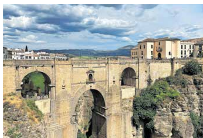
Most Puente Nuevo se razteza čez sotesko El Tajo v Rondi.

bikoborbe ter Baños Árabes (arabske kopeli) in se v družbi zadnjih sončnih žarkov