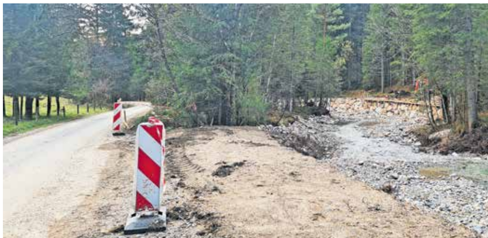
Večina intervencijskih del na vodotokih je končana, dela potekajo le še v strugi Begunjščice na območju doline Draga.

Z namenom izboljšanja pretočnosti strug je občina zaprosila DRSV in lastnike