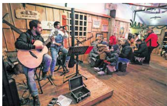
Z glasbo je drsanje, druženje in okrepcilo popestril duet Planet Acoustic.

napovedal, da bodo med 20. in 23. decembrom organizirali slikanje z Božičkom.