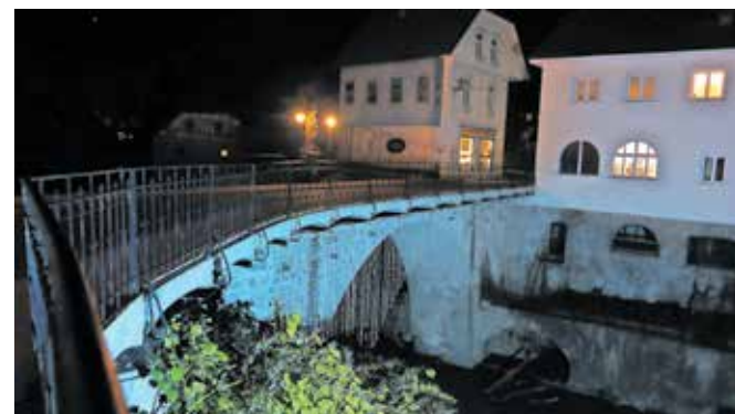
Kamniti most je konec tedna zasijal v turkizni barvi.

Škofja Loka – Osvetlitev največjih znamenitosti v državi, kar je zagotovo tudi Kamniti oziroma Kapucinski most v Škofji Loki, ki je najstarejši kamniti most v Sloveniji, je prikaz enotnosti 194 držav pri zgodovinski in globalni zavezi za odpravo raka materničnega vratu. Tako smo minuli petek praznovali tretjo obletnico začetka globalne strategije Svetovne zdravstvene organizacije za odpravo raka materničnega vratu, prvega, ki ga zmoremo in znamo odpraviti. Kamniti most pa se je zasvetil v turkizni barvi.