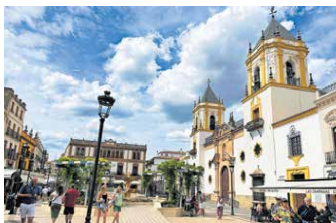
Plaza del Socorro v starem delu mesteca Ronda