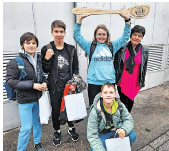
Ekipa Osnovne šole Škofja Loka - Mesto si je prislužila zlato kuhalnico.