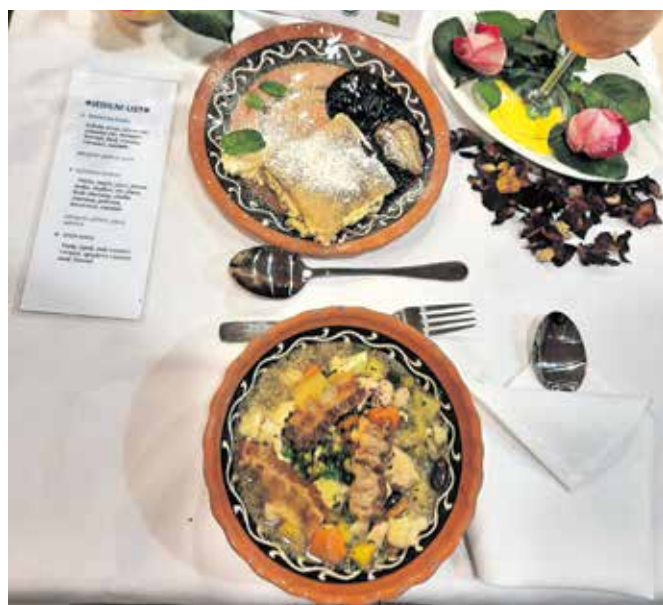
Komisijo so navdušili z mineštro, pirinimi palačinkami s skuto in sadjem ter čajem z okusom vrtnic.