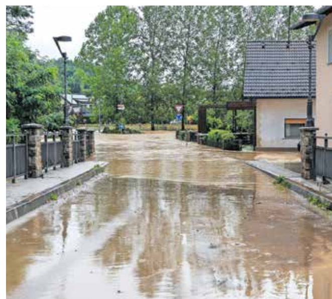
V občini Komenda je finančno nakazilo doniranih sredstev prejelo 482 gospodinjstev.