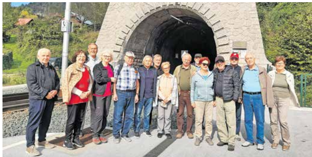
Udeleženci izleta v kraje, pomembne v boju za severno mejo v zahodnem delu Karavank, pred južnim portalom železniškega predora na Hrušici. Na severnem delu so leta 1918 in 1919 potekali hudi boji.

potovanja. Sredi mesta je postavljen spominski kamen, na katerem piše, da so »do tja in nič dlje leta 1919 prišli srbski konjeniki«, na vrhu pa sta vrisani smeri poteka de-