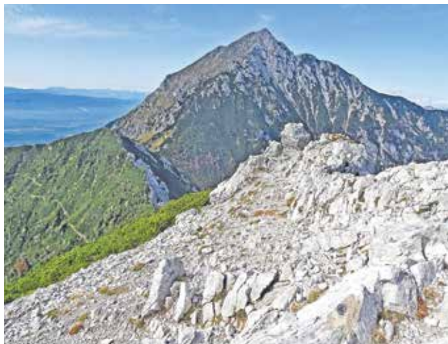
Storžič z Malega Grintovca