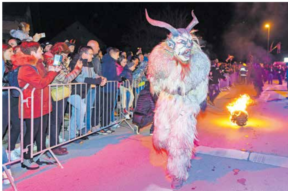
Strah v kosti je gledalcem nagnala že prva skupina – domači Goričanski parkeljni.