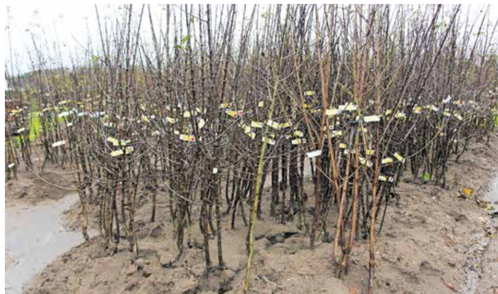
V Zakotnikovi drevesnici ponujajo okoli sto sadik različnih vrst in sort sadnega drevja, samo sadik jablan je okrog trideset.