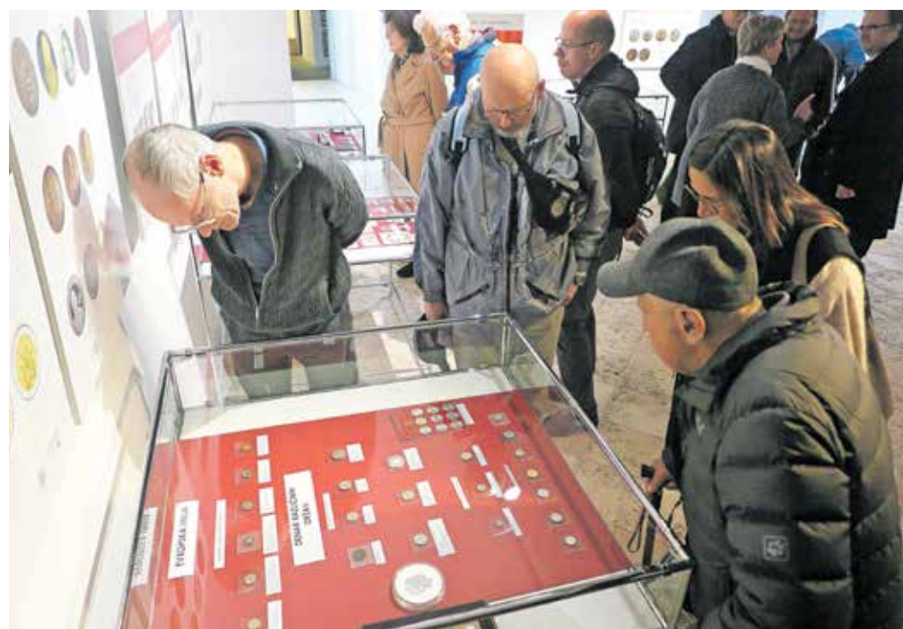
Portreti ljudi na denarju s posebnimi zgodbami so vedno zanimivi.