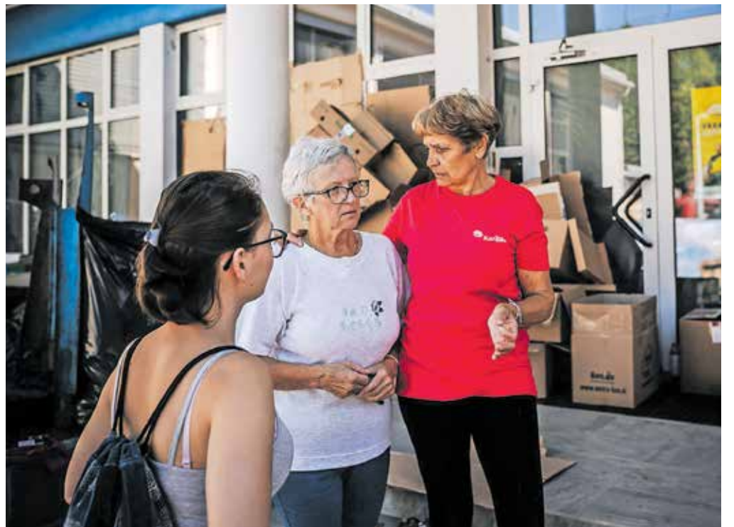
Prostovoljci organizacije Karitas so opravili več kot 1500 laičnih razbremenilnih pogovorov.