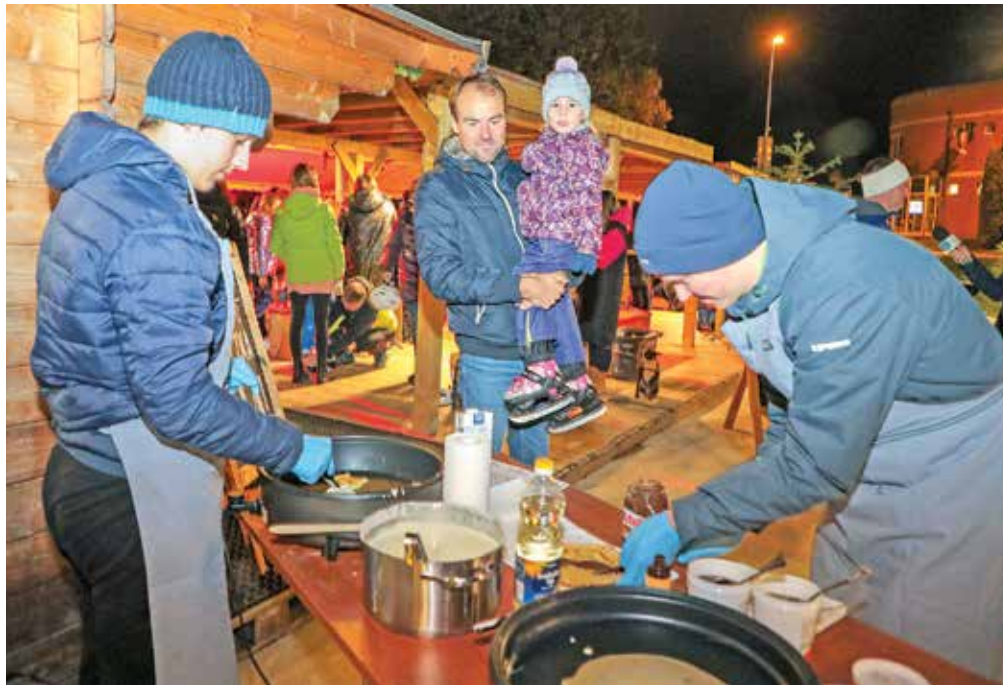
Peka palačink je bila v rokah medvoških študentov.

9. do 21. ure. Tak urnik bo tudi med prazničnimi počitnicami, je dodal Luka Strojjan, ki skrbi za gostinsko ponudbo ob pokritem drsališču. Topli napitki, pijače in prigrizki so na voljo v prostoru, ki po besedah sogovornika skuša pričarati vzdušje brunarice na smučišču. »To je naša rdeča nit, ki ji vsako leto kaj dodamo.« Ob tem je