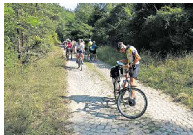
Pot po trasi rimske ceste Via Militaris

V Dragomanu se pot EuroVelo 13 obrne proti jugu in se nadaljuje ob meji s Srbijo, naša pot pa je vodila naprej ob avtocesti proti Sofiji. Spet smo bili na kockah, ki pa so se po sedmih kilometrih nehale in nadaljevali smo po lokalni asfaltni cesti