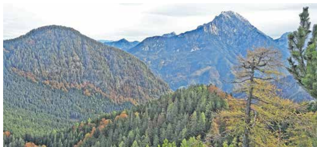
Kočna v vsej svoji mogočnosti z razgledišča

in Kranjsko. Nadaljujemo po levem, novejšem kolovozu. Na točki, kjer se kolovoz še bolj spušča, zavijemo desno na stezico, ki sledi grebenu. Možic stoji ob drevesu. Steza je lepo vidna in lepo sledljiva. Sledimo ji do mesta, kjer začne zavijati na levo stran grebena, tam gremo mi direktno po grebenu navzgor. Če zgrešimo mesto, bomo videli, da se stezica na levi hitro izgubi. Strmo se vzpenjamo in kar naenkrat se spet pojavi stezica. Vzpnemo se po rahlo izpostavljenem skoku. Nato sledi pas ruševja, ki nas pripelje do razgledišča, s katerega se odpre nedrje Kočne. Pred nami je dobro viden del poti, ki nas še čaka. Pot je izsekana, ponekod malce izpostavljena, pripelje nas do gozda in nato do visokih trav. Tukaj se steza hitro izgubi.