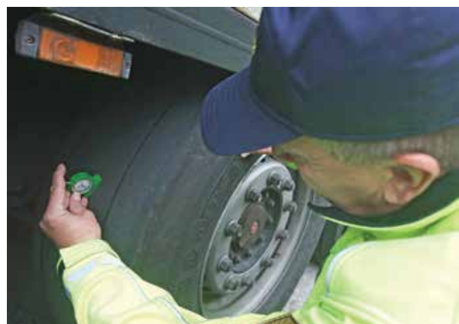
Gorenjski policisti bodo v zimskem obdobju preventivne aktivnosti in tudi poostrene nadzore ustrezne opremljenosti vozil še ponovili.

ru, Trziču in na Jesenicah so kontrolirali skupaj 181 vozil, med njimi jih samo šest ni imelo ustrezne zimске