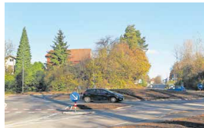
Nekdanje križišče v Lipici je zdaj krožišče.

Minuli konec tedna je tudi Arriva začela normalno obratovanje na avtobusnih linijah Škofja Loka–Ljubljana in Podlubnik–Lipica. Ponovno so vzpostavljena avtobusna postajališča Trata ŽP in Kroj v smeri Ljubljane ter Lipica in Kroj v smeri Škofje Loke.