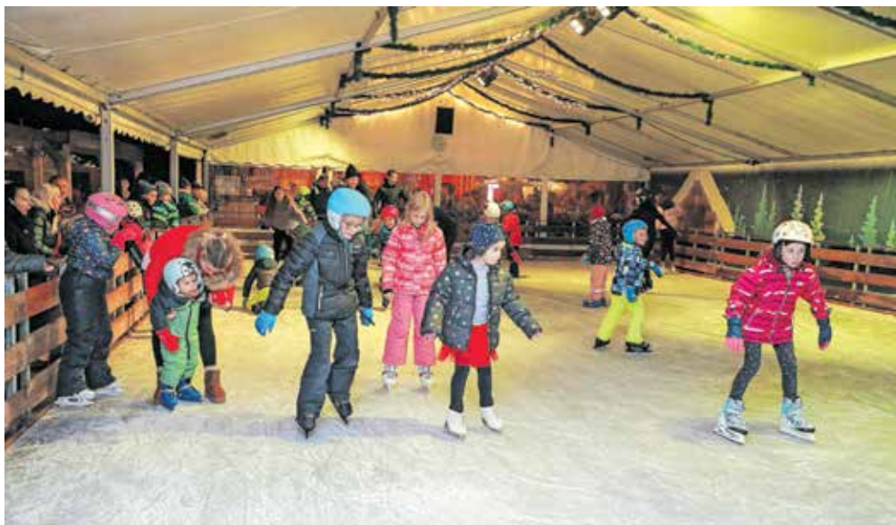
Otroci so si rade volje nadeli drsalke.