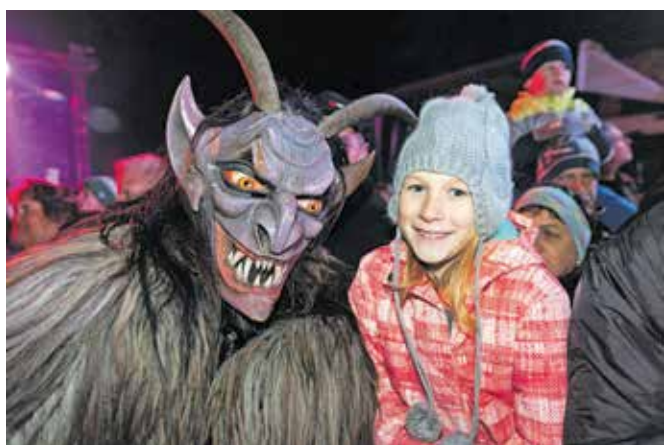
Pridni otroci so se fotografirali s parkeljni, poredni pa ...