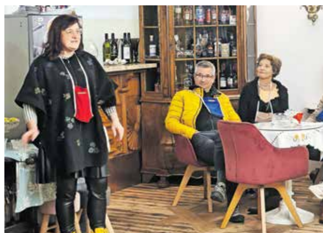
Goste je na gradu Dvor nagovorila »grofica«; med obiskovalci smo opazili tudi olimpijca Rajmonda Debevca.