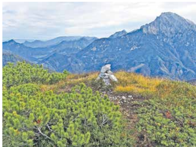
Vrh Licjanovca označuje možic.

Nadmorska višina: 1813 m Višinska razlika: 1500 m Trajanje: 8–9 ur Zahtevnost: ★★★★★ (orientacija)