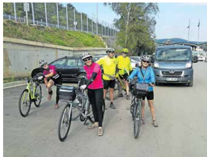
V Bolgariji po prehodu čez mejo

ki je v tem delu speljana po ozki dolini, kjer je prostor le za avtocesto, železnico in potok. Vozili smo po odstavnem pasu, v delih, kjer ga ni bilo, pa po voznem pasu. Avtocesto smo po sedmih kilometrih zapustili na prvem možnem odcepu, a že po dobrem kilometru nam je