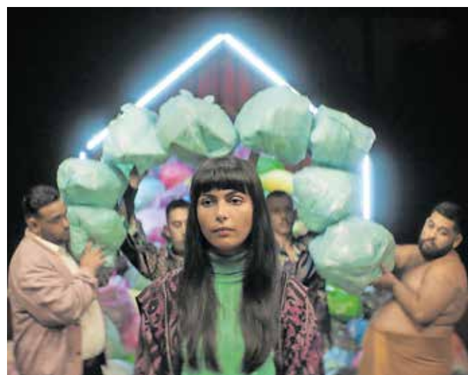
Film Tri tisoč oštevilčenih opek je najbolj prepričal žirijo.

Letošnji Liffe je zabeležil več kot 37.000 obiskovalcev, od tega si je štiri odstotke ljudi filme ogledalo na daljavo. Največ zanimanja je bilo za filme Varuhi formule, Nesrečna bitja, Srečno naključje, Daaaaali!, Interesno območje, Okus strasti, Popolni dnevi, Rdeče nebo, Priscilla in Vsi mi tujci. Prikazani so bili na 296 projekcijah, od tega skupaj 42 v Mariboru, Celju in Novem mestu. Festival je obiskalo tudi štirideset gostov, filmskih ustvarjalcev in članov žirij iz več kot dvajsetih različnih držav, na sporedu je bilo 38 pogovorov s filmskimi ustvarjalci. Glede na dober obisk in zanimanje je tudi letos izjemno raznoliko filmsko ponudbo – velja dodati, da je bilo kar nekaj filmskih projekcij razprodanih – bi lahko rekli, da je bil skupni zmagovalac festivala pravzaprav festival sam.