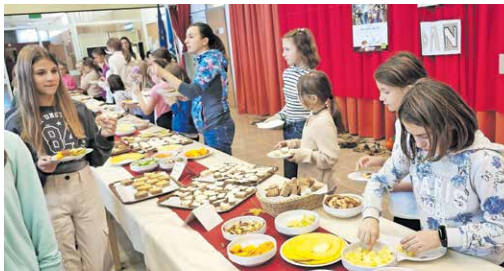
Tradicionalni slovenski zajtrk v Osnovni šoli Ivana Tavčarja Gorenja vas