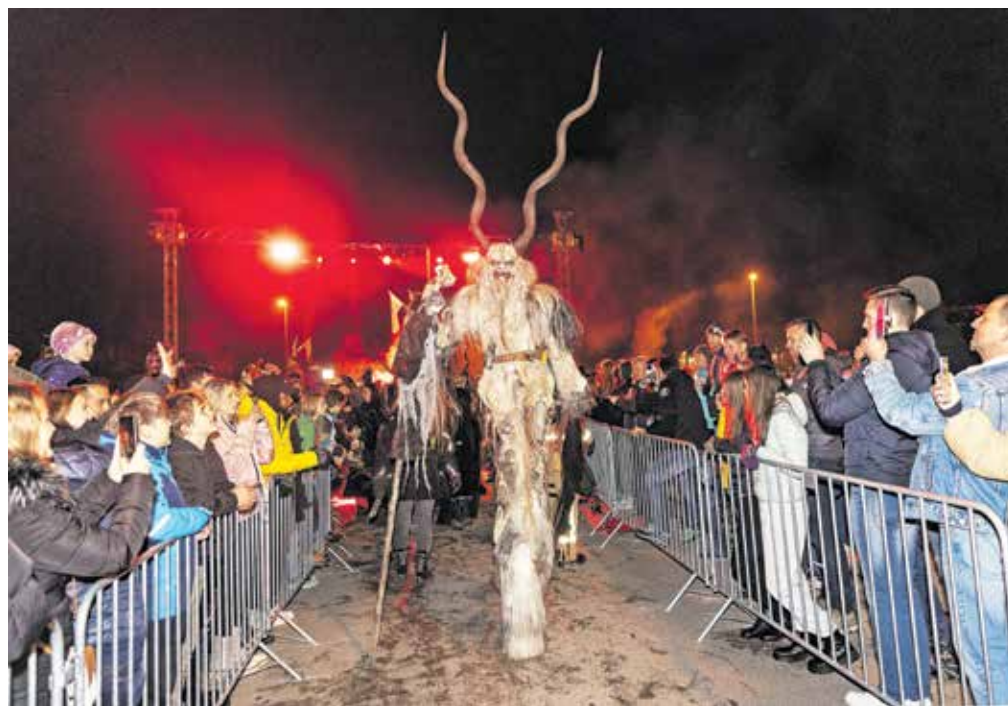
Pošastni parkeljni so letos prišli iz petih držav.