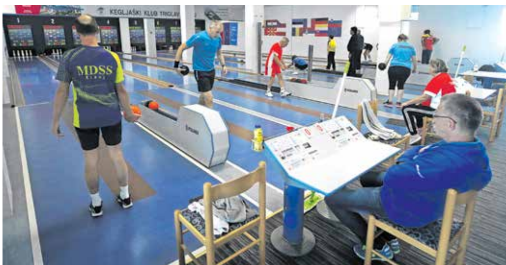
Letošnjega turnirja se je udeležilo šestdeset slepih in slabovidnih kegljačev.