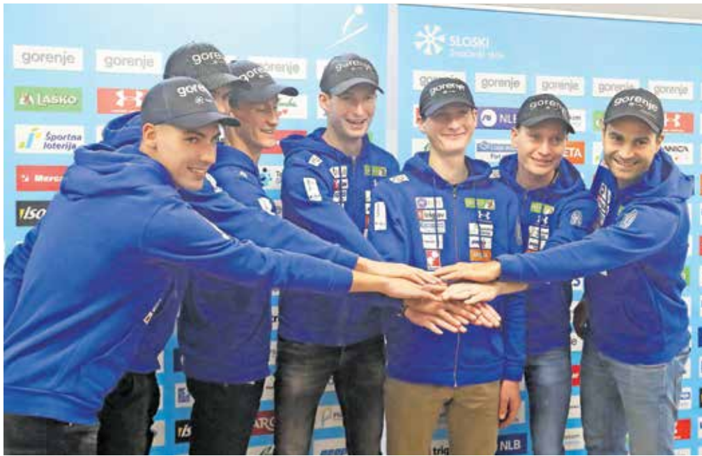
Smučarske skakalce prihodnji konec tedna čaka prva preizkušnja v Ruki.

mem pa, da bo že v naslednji periodi na voljo šesta kvota za Slovenijo,« je povedal Hrgota, ki je sicer oddal, da