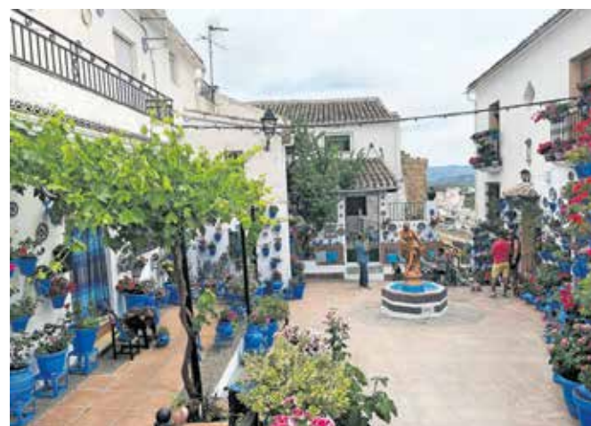
Terasa Patio de las Comedias v Iznajaru, z lično urejenimi preddverji in stotinami modrih cvetličnih lončkov

vasica Iznajar. Nad njo bdi veličasten, istoimenski grad, a je vas, bolj kot po mogočni mavrski zapuščini, poznana po majhni terasi Patio de las Comedias, katere fotografije polnijo številne strani revij o Andaluziji in krasijo novodobne popotniške spletne strani. Teraso obdaja na stotine rožnatih in rdečih geranijev v svetlo modrih lončkih, ki skupaj z lično urejenimi preddverji in pročelji belih hišic, že več vrst zapored osvajajo naslov najlepše andaluzijske terase. Po nekaj posnetih fotografijah, ki bodo prav tako krasile strani časopisa, se z Nejcem odpraviva dlje proti zahodu in se na poti do najine naslednje namestitve v mestecu Zahara, ustaviva v Rondi. Mesto, ki je razdeljeno na dva dela, El Mercadillo (tržnica) in La Ciudad (mesto), povezuje znameniti most Puente Nuevo, ki se razteza čez sotesko El Tajo. Na hitro si ogledava palačo Mondragón, cerkev Santa María la Mayor, areno za