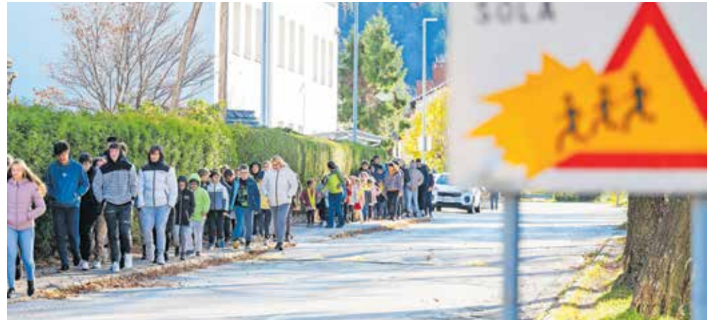
Scenarij evakuacijske vaje je tokrat predvideval nevarnost zemeljskega plazua.