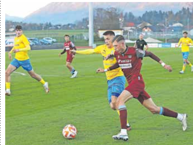
Nogometaši Triglava so jesenski del prvenstva zaključili z zmago na domači zelenici.

Tudi v 3. SNL – zahod so moštva odigrala zadnji jesenski krog. Ekipa Škofje Loke je v gosteh premagala Brda z 1 : 2, v Žireh je Eltron Šenčur premagal domačo ekipo Eksist Žiri z 0 : 2, na Jesenicah je Roltek Dob premagal Jesenice z 0 : 4, Šobec Lesce pa je na Vrhniki igral 0 : 0. Po jesenskem delu tekmovanja na lestvici vodi Roltek Dob s 36 točkami.