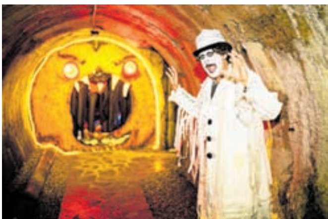
Na noč čarovnic so po vsej Sloveniji pripravili različne dogodke.