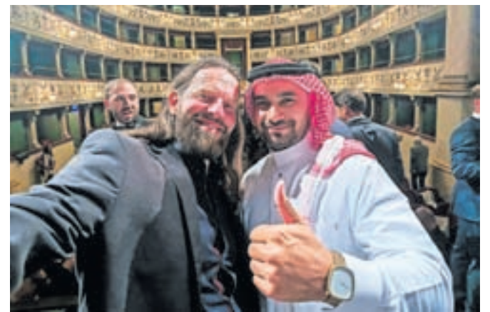
Andrej Tarfila in Ammar Alamir