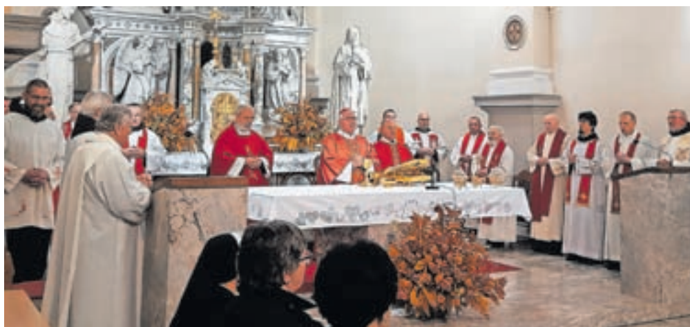
Somaševanje bratov iz Frančiškovih redov v baziliki na Brezjah

Kovač, gorenjski rojak iz Loga v Poljanski dolini, ki deluje kot predstojnik bratske skupnosti kapucinov v Štepanji vasi v Ljubljani, je povedal, da so bila doslej taka srečanja v Štepanji vasi, pri Vipavskem križu, v Celju, v Kančevcih, v Škofji Loki in v Ljubljani. Na vseh je v središču spomin na življenje in delo Frančiška Asiškega. Letos se spominjamo 800. obletnice postavitve prvih jaslic, leta 2026 pa bo molitveno srečanje posvečeno 800. obletnici Frančiškove smrti.