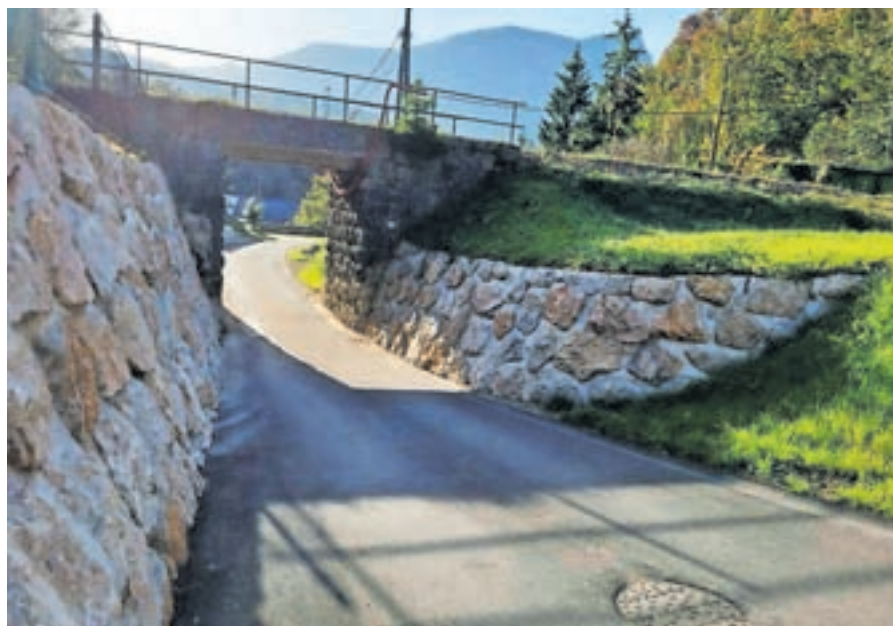
Ureditev dostopne poti do planin Agrarne skupnosti Bohinjska Bela v Triglavskem narodnem parku

odseka proti Slamnikom, ureditev gozdnih cest proti planini Ilovec in Belski planini z odvodnjavanjem. Celotna investicija je znašala okvirno 268 tisoč evrov, od tega občina pričakuje, da bo od ministrstva za okolje in prostor pridobila okvirno 209 tisoč evrov.