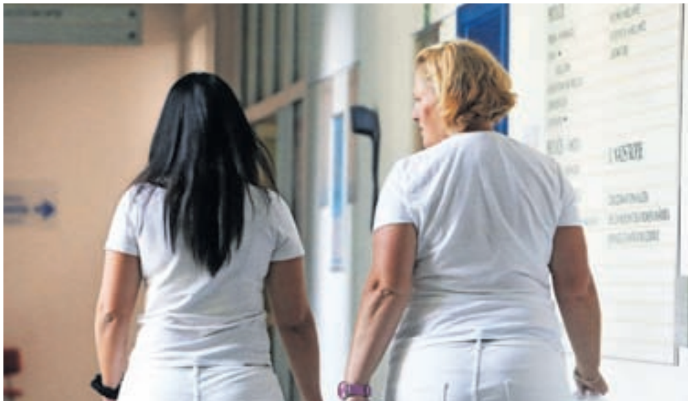
V Zdravstvenem domu Jesenice se srečujejo s pomanjkanjem zdravnikov, kar bo prizadelo zlasti paciente dveh splošnih ambulant.