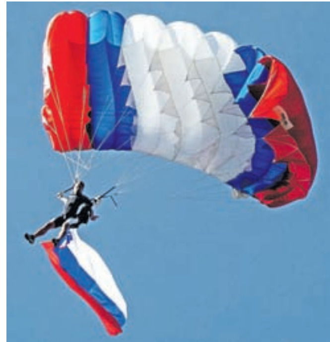
Trije skoki, trije padalci, tri zastave, med njimi tudi slovenska – to je bilo posebno rojstnodnevno darilo.