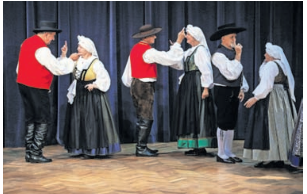
Bilo je nekoč in je še vedno – s folklorno skupino Folklornega društva Šenčur.

Seveda je za vsak ples potrebna tudi glasbena spremeljava, godčevsko skupino sta