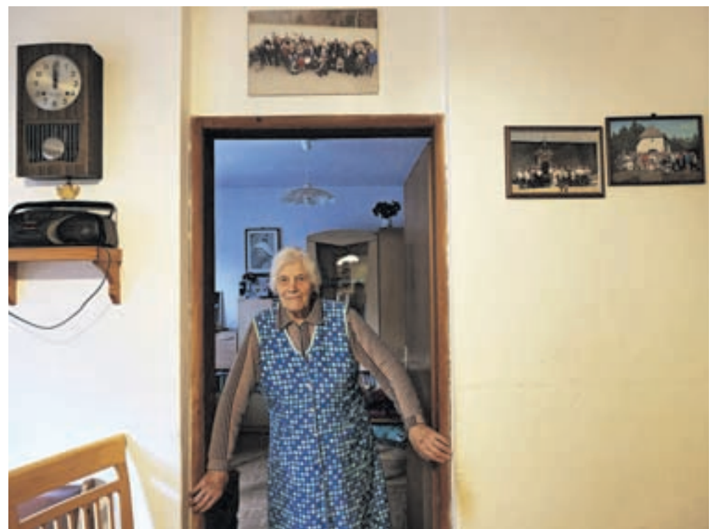
Stene v Aničinem domu krasijo fotografije slavij in družinj izpred let.