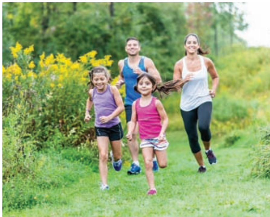
Namen projekta je spodbujanje telesne dejavnosti otrok za boljše počutje in zdravje ter s tem tudi izboljšanje razumevanja pomena telesne aktivnosti v vsakdanjem življenju.

Namen projekta je spodbujanje telesne dejavnosti otrok za boljše počutje in zdravje ter s tem tudi izboljšanje razumevanja pomena telesne aktivnosti v vsakdanjem življenju. V projekt bodo vključeni tudi starši, saj bodo organizirani tudi seminarji in pogovori, kjer bodo predstavili tudi druge vsebine (prehrana, psihologija, sociologija, zdravstveni vidiki). Projekt se bo začel izvajati v novembru in bo trajal dve leti z vmesnimi meritvami učinkov razvoja gibalnih sposobnosti. K projektu vabimo starše in otroke 5., 6. in 7. razreda. Družine bodo po obravnavi pri zdravnici in drugih strokovnih sodelavcih ZD Bled nato v okviru športnih društev vključene v posebne, netekmovalne skupine. Sodelovanje v projektu bo brezplačno. Če želite izvedeti kaj novega in narediti več za zdravje svojih otrok in celotne družine, vas vabijo, da se prijavite na: zabavabrezzaslona@fsp.uni-lj.si . Vse zainteresirane starše bodo povabili na sestanek, kjer vam bodo projekt natančneje predstavili, da se boste lahko odločili, ali je projekt primeren za vas in vašo družino.