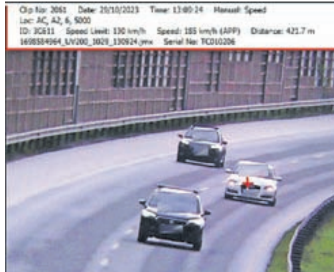
Voznik belega audija je v bližini izvoza Naklo, kjer je omejitev 130 kilometrov na uro, vozil s hitrostjo 185 kilometrov na uro.

V nedeljo je bilo ugotovljenih še več kršitev, in sicer 89. Od tega je sedemdeset voznikov prekorajlo največjo dovoljeno hitrost, 17 voznikov pa je vozilo na prekratki varnostni razdalji. »En voznik je bil pozitiven na prepovedane droge po odrejenem hitrem testu. Strokovni pregled pa je odklonil,« so dodali na PU Kranj. Policisti so ugotovili še prekršek voznika, ki je v avtomobilu na sopotnikovem sedelju prevažal otroka, ki ni bil ustrezno privezan z zadrževalnim sistemom.