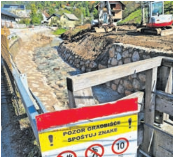
V Bašlu urejajo strugo potoka Belica.

Bašelj – Belica je miren potok, ki teče skozi vas Bašelj, a ob zadnji ujmi so vaščani ob njem spoznali, da ima tudi hudo-urniški obraz. Trenutno na enem odseku struge pred vasjo potekajo obsežna dela. Na Občini Preddvor so pojasnili, da je bila tu že ob lanskem septembrskem deževju deloma poškodovana betonska škarpa. Ta je na isti strani kot glavna prometnica v vas. Zdaj jo urejajo, ker pa bodo vodo speljali stran od škarpe, so tudi od lastnika nasprotnega brega pridobili stavbno pravico, tako da so vodotok skoraj poravnali in strugo na obeh straneh obložili s skalami. Beton je uporabljen le za podporo novi škarpi. Razen v spodnjem delu so zaradi poplavne varnosti razširili strugo. Narasla voda, ki pridobi moč, tako materiala, ki ga nosi s seboj, ne bo odlagala pred mostom. Projekt je vreden 240 tisoč evrov, od države so zanj dobili 190 tisoč evrov, ko bo zaključen, pa bo zagotovljena tudi večja varnost udeležencem v cestnem prometu.