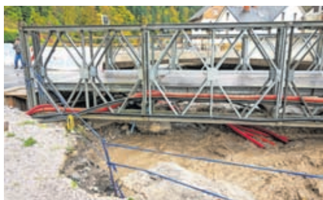
Začasni most v Smolevo je tako poškodovan, da so ga bili primorani zapreti za ves promet.

povedal, da so most začasno toliko »usposobili« in dali čez hidroizolacijo asfaltno zaščito, da se je moč voziti po njem. »Verjetno pa bo treba nato še kaj podreti in na novo narediti, če bo prišlo do poškodbe izolacije, saj