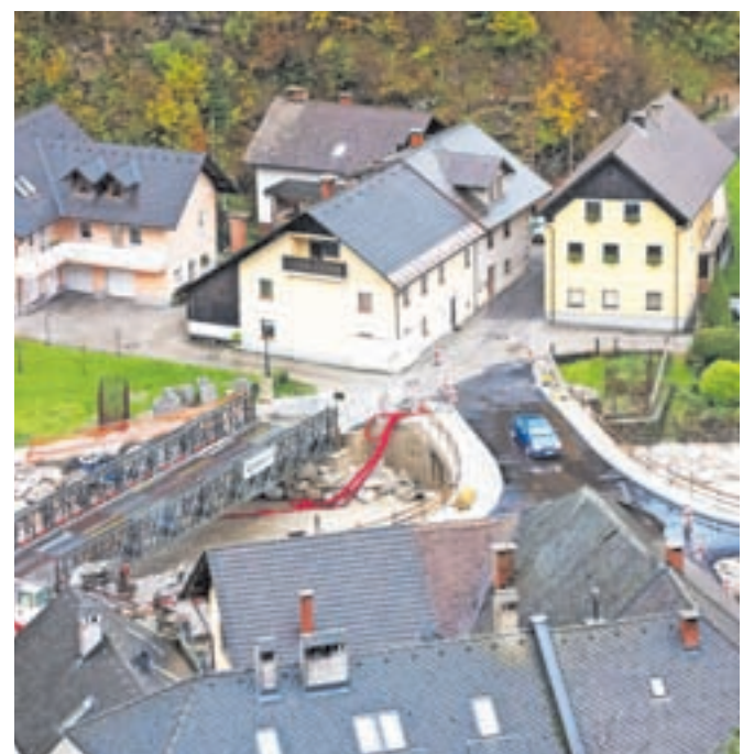
Novi most, ki uradno še ni predan v uporabo, je postal začasni most.

neurju po županovih besedah poškodovanih veliko mostov. »Zaprli in neprevoznostni so denimo mostovi pri Šmidu, pri Petraču in pri Zgagu. Občane prosim, da upoštevajo, da so mostovi zaprti in da se ni varno voziti po njih, saj se lahko porušijo in niso varni za uporabo. Zelo so poškodovani, skrivljeni, udarci lesa in naplavin so naredili svoje, marsikateri je spodjeden. Pri nas je bilo v petek dopoldne res kar hudo,« je razložil Gasser. Koncesionar Eho Projekt in Direkcija RS za vode sta bila na terenu na ogledu poškodb vodotokov na območju Zalega Loga, Sorice, Davče in Železnikov že v ponedeljek.