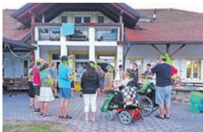
V društvu Sonček, gorenjskem društvu za cerebralno paralizo, organizirajo tudi kolonije in tabore.

Starši imajo v okviru društva možnost usposobiti se za osnovno nego in terapijo oseb s posebnimi