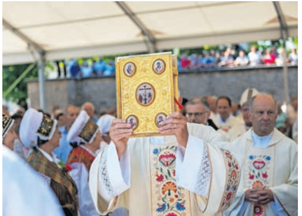
Rimskokatoliška cerkev se srečuje s pomanjkanjem duhovnikov oziroma so vsi že razporejeni po župnijah. (fotografije je simbolična)