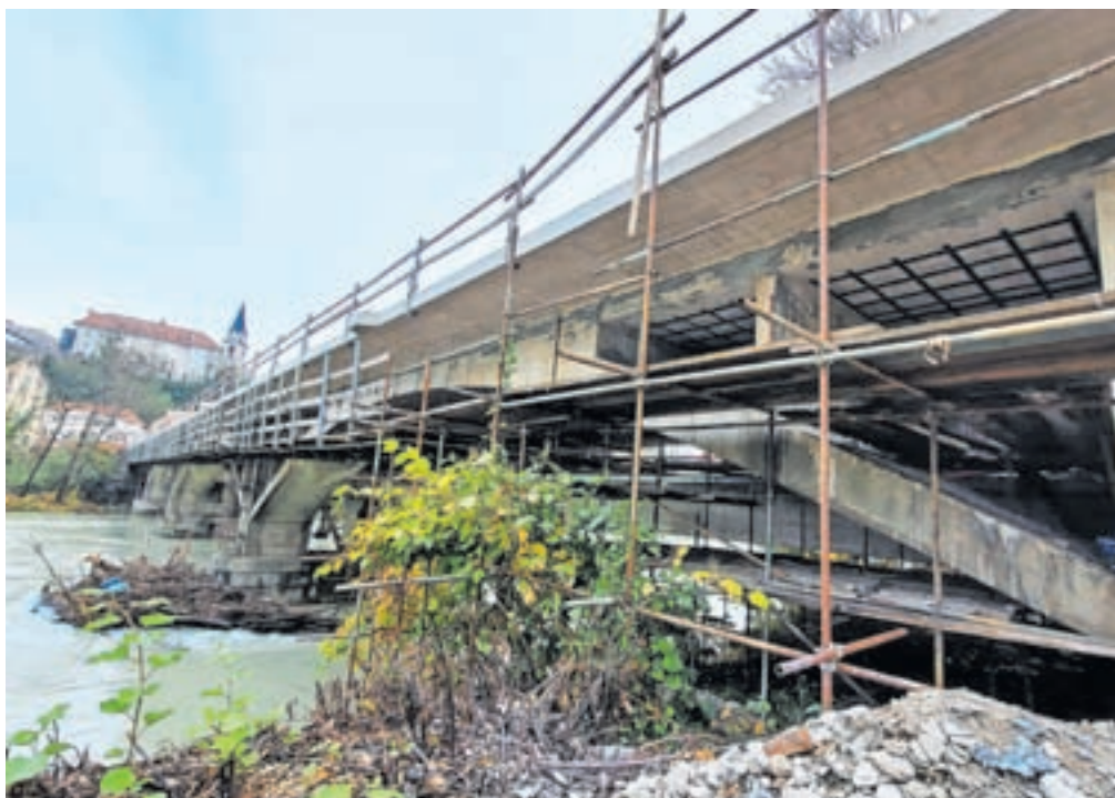
Obnova mostu čez Savo se je zaradi avgustovskih poplav podaljšala in bo končana predvidoma maja prihodnje leto.

Kranj – Kot so pojasnili na Mestni občini Kranj (MOK), je voda med avgustovsko ujmo narasla do visečih odrov pod mostom in tako ogrozila stabilnost delovne konstrukcije. Zaradi tega izvajanje del po predvideni tehnologiji ni bilo izvedljivo, mehanizacijo so zamenjali z manjšo in celo z ročnim delom, kar pa je upočasnilo sanacijo. »Ker prehajamo v deževni jesenski in zimski čas, ko je izvedba nekaterih gradbenih del otežena oziroma tudi onemogočena, je odprtje obnovljenega mosta načrtovano za pomlad 2024,« so dodali na kranjski občini.