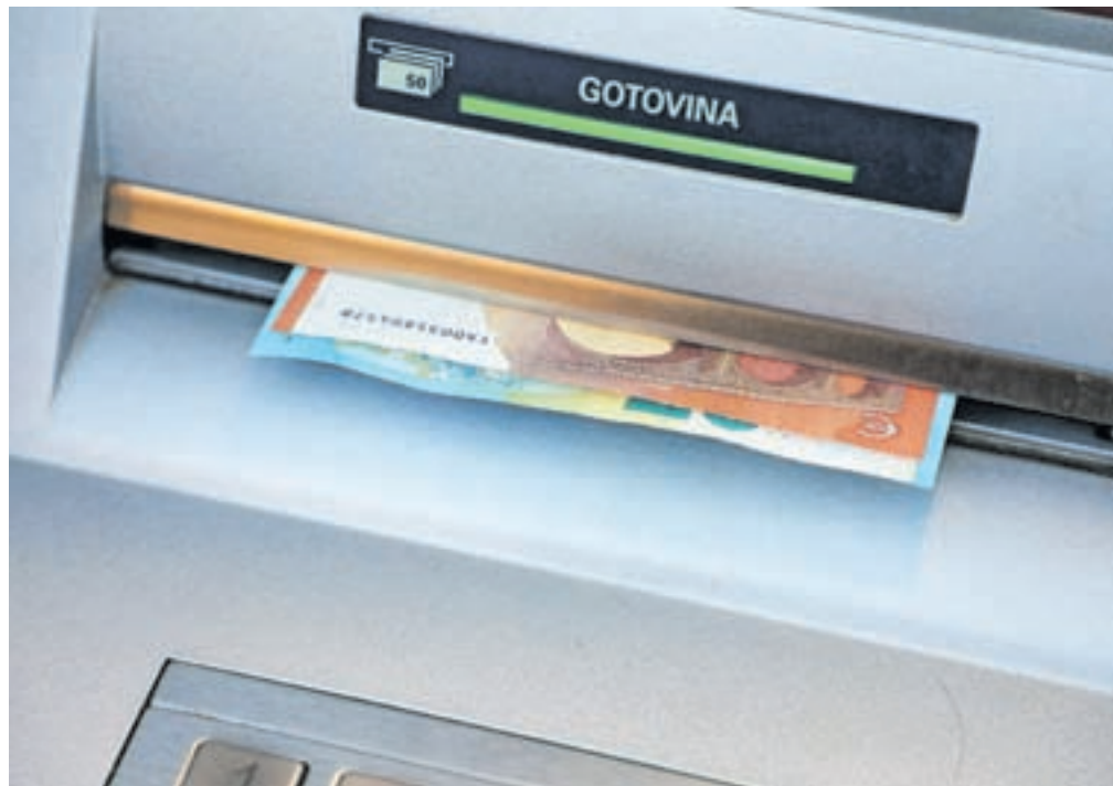
Slovinci prisegamo na gotovino in depozite. Fotografija je simbolična.

Finančna sredstva (gotovina in vloge, delnice in drugo) gospodinjstev pri nas so ob koncu lanskega leta znašala 73,6 milijarde evrov in so se povečala za 2,7