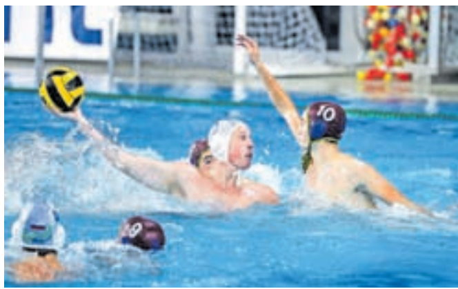
Tudi na domačem turnirju je naša reprezentanca premagala Cattaro.