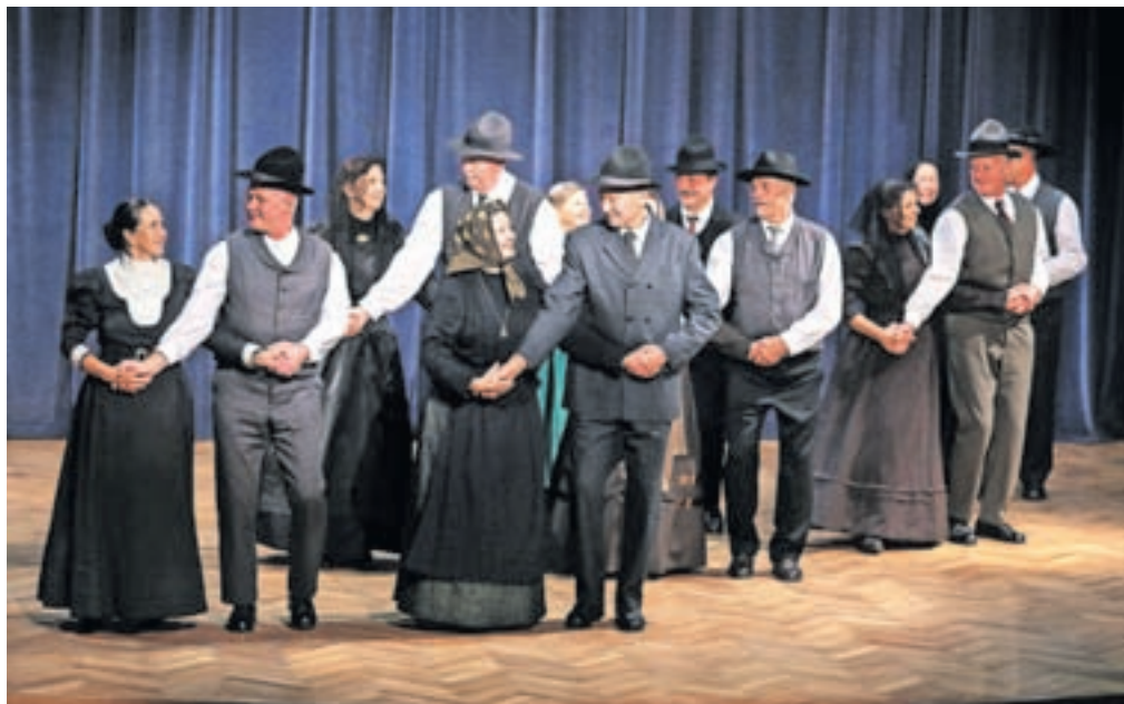
V Šenčurju je gostovala folklorna skupina Kulturnega društva Kal nad Kanalom.

Gostujoča skupina iz Kala nad Kanalom je predstavila še koreografijo Binkoštni ponedeljek na Banjščicah, skupina FD Šenčur pa je večer zaključila s tako imenovano potowčko in priljubljenim plesom šotiš. Občinstvo pa ob prijetnem folklornem večeru zagotovo ni pozabilo tiste Sem dekl'ca mlada vesela, ki so jo šenčurske folkloristke zapele v Bergltancu.