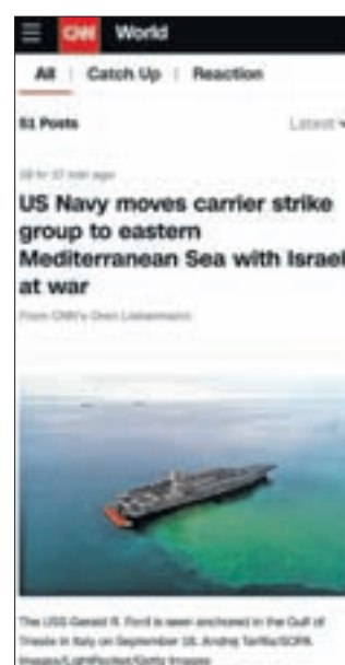
Na spletni strani CNN

»Sicer imam vsaj en fotoaparata vedno nekje blizu, kamorkoli že grem. Kako bi bil drugače vedno ob pravem času na pravem mestu? (smeh) Meja med tem, kdaj delam in kdaj je to moj hobi, je zelo zabrisana.«