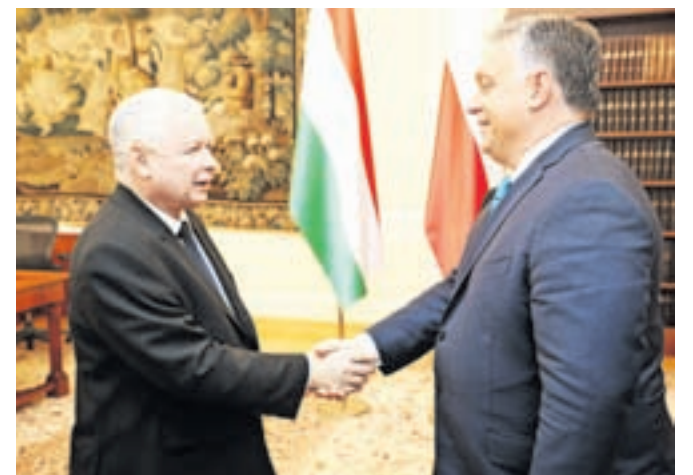
Jarosław Kaczyński in Viktor Orbán, prvaka poljske in madžarske desnice, med srečanjem v poljskem sejmju, 22. septembra 2017