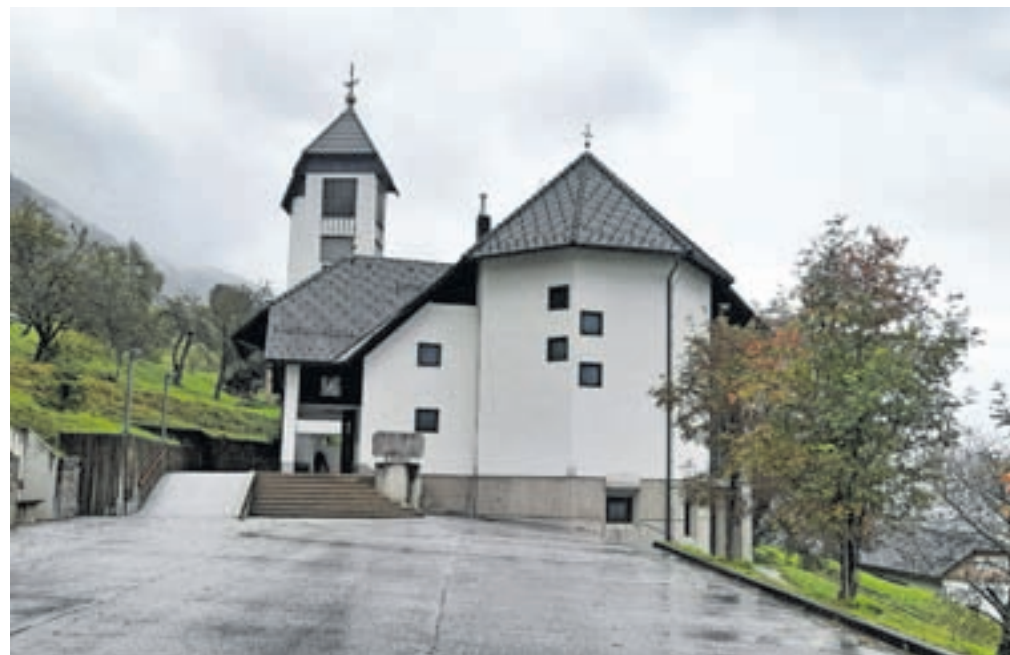
Cerkev svete Lucije v Dražgošah, blagoslovljena junija leta 1968. Bila je prva na novo zgrajena cerkev v Sloveniji. Staro z dragocenimi in na srečo rešenimi oltarji so Nemci januarja leta 1942 porušili.