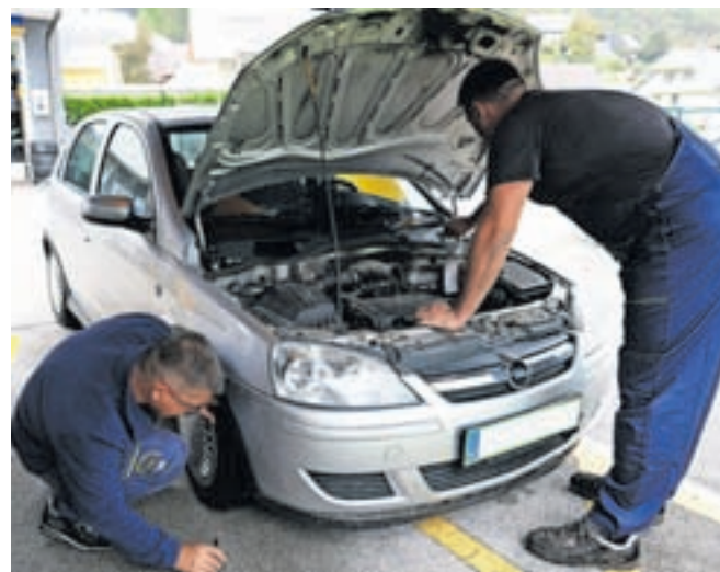
Pred zimo preverite pnevmatike, hladilno in čistilno tekočino, brisalce ter obvezno zimsko opremo.

Pri izbiri moramo biti pozorni, da je pnevmatika homologirana za zimo, kar nakazuje znak s snežinko na bočni strani. »Minimalni zakonsko določeni profil pnevmatike je tri milimetre, a po naših izkušnjah