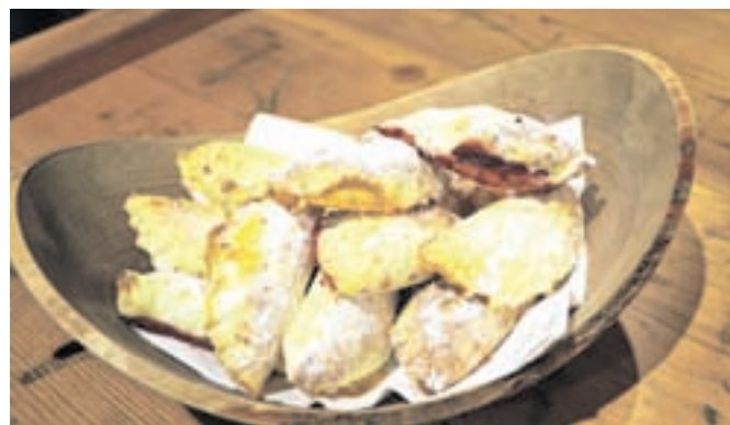
Sladki piškoti z mohantom / Foto: Alenka Brun

biniral mohant in postrv. Izvedeli smo tudi, da mohant pravzaprav delajo takrat, ko ne delajo drugih sirov – torej v času, ko je manj mleka. Od kod pa ime zanj, nas je zanimalo. Sicer naj bi bilo več razlag, ena med njimi pa