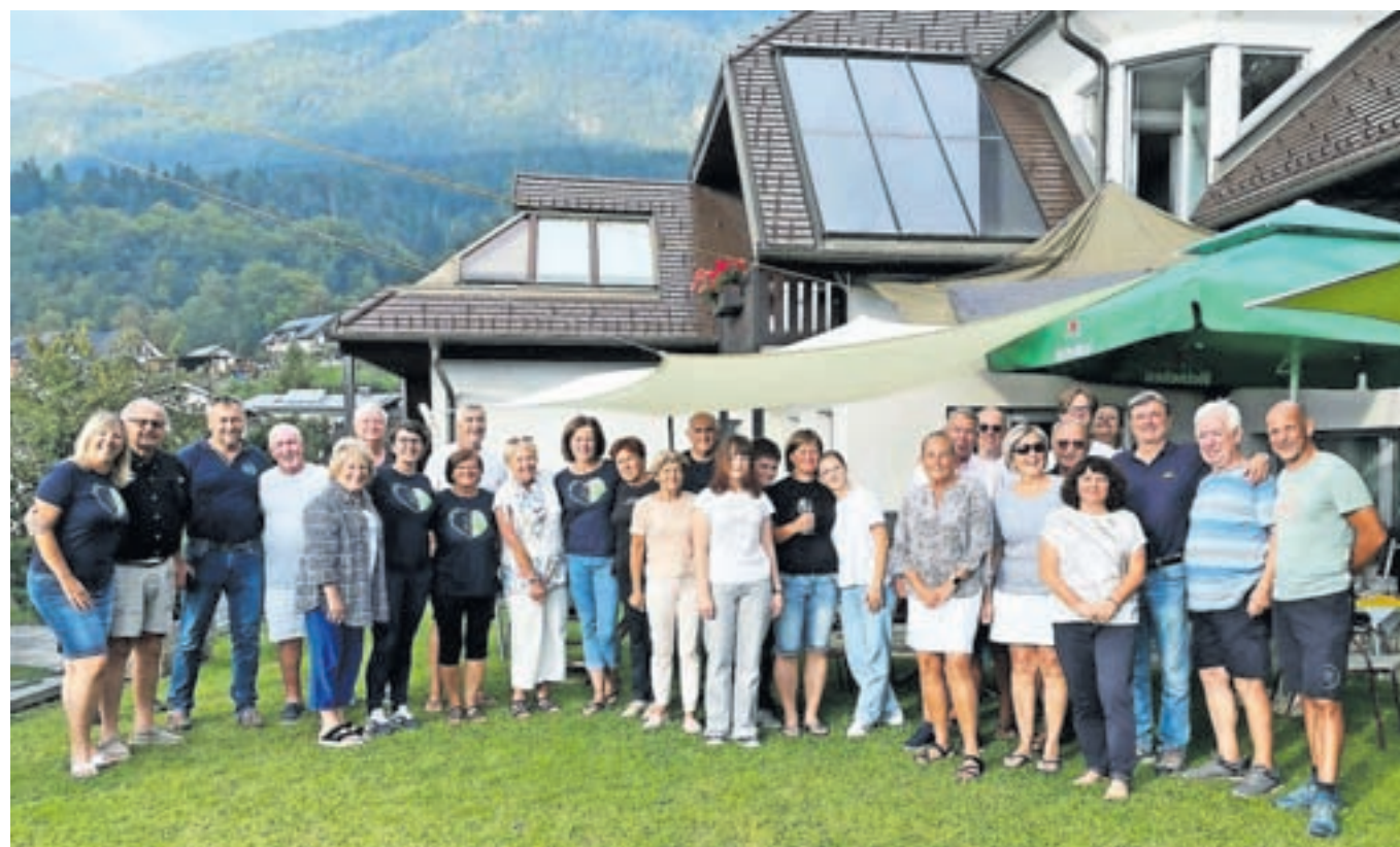
Potovanje po Evropi so Američani zaključili s sproščenim piknikom pri prijateljih v Križah.

Kamnik – V četrtek, 9. novembra, bo v Športni dvorani Kamnik potekal drugi karierni sejem, ki ga organizirajo KIKštarter, Podjetniški klub Kamnik in Občina Kamnik. Vrta sejma bodo odprta med 8. in 18. uro. Sejem je namenjen tako učencem višjih razredov osnovne šole, dijakom in študentom kot tudi iskalcem zaposlitve in vsem drugim, ki razmišljajo o spremembi karierni poti. Sodelovanje na sejmju je že potrdilo več podjetij in organizacij iz regije, seznam pa je na voljo na spletni strani Podjetniškega kluba Kamnik.