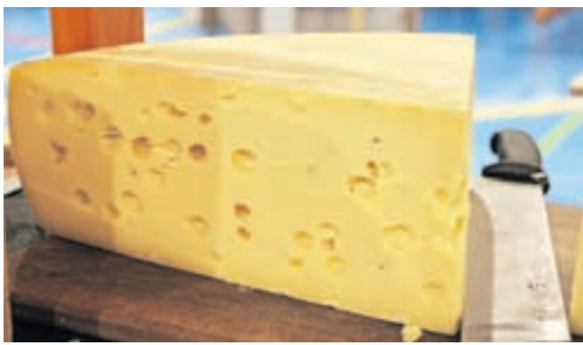
Bohinjski sir je znan po vsej Sloveniji.

In še namig: testo lahko uporabimo tudi za slano pecivo. Razrežemo ga na palčke, premažemo z jajcem, potresemo s sezamom, makom ali naribanim sirom ter spečemo. Mikljeva pravi, da se ta slani prigrizek lahko lepo kombinira s pivom.