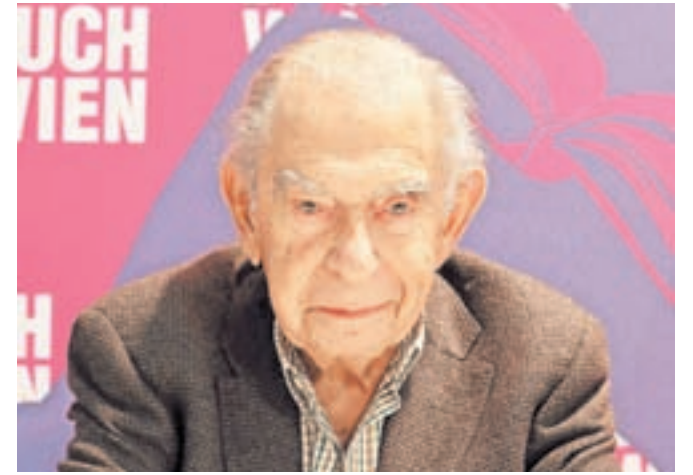
Paul Lendvai (1929), dunajski publicist madžarskega rodu, je velik poznavalec Balkana in Srednje Evrope.