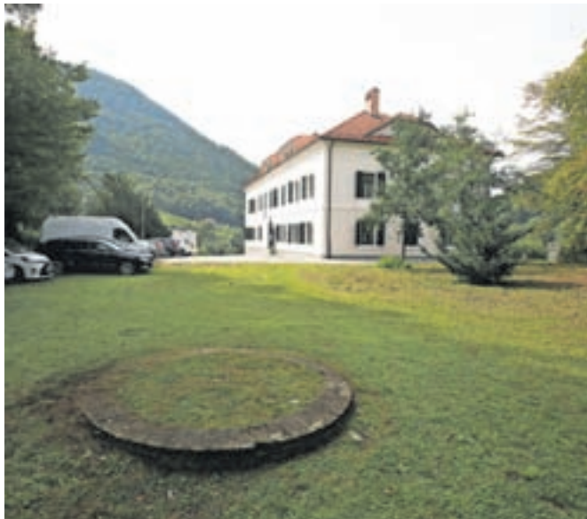
Z ureditvijo parka Radetzky bodo vzpostavili novo javno turistično infrastrukturo.

Investicija je vredna skoraj 900 tisoč evrov, od tega bo Občina Tržič zagotovila skoraj 540 tisoč proračunskih