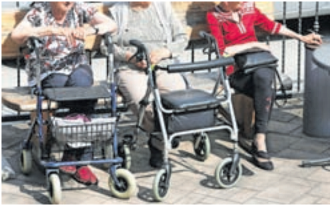
V Domu starejših občanov Trebnje obravnavajo primer fizičnega nasilja, ki naj bi ga nad njihovo oskrbovanko izvajala 16-letna dijakinja načasem počitniškem delu. Slika je simbolična.