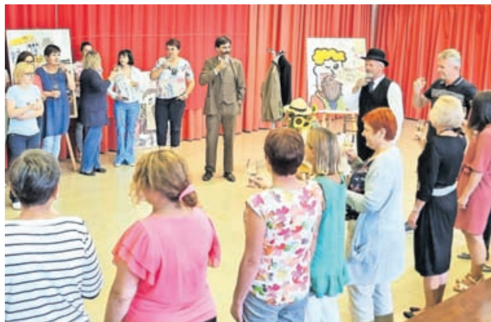
V Osnovni šoli Ivana Tavčarja Gorenja vas so se spomnili rojstnega dneva znamenitega rojaka Ivana Tavčarja. Dne 28. avgusta je namreč minilo 172 let od njegovega rojstva.

V igranem prizoru je Tavčarju prišel voščil tudi Cankar in mu kot darilo prinesel njegove knjige, ki jih je pred leti zastavil, kot je priznal, zato jih je bilo težko najti. V hudomušnem dialogu sta se pogovarjala o delih, ki jih drug pri drugem najbolj cenita, čeprav sta, kot je dejal Tavčar, desetletja živela in delala drug mimo drugega. Skupaj z drugimi je nato Cankar nazdravil Tavčarju.