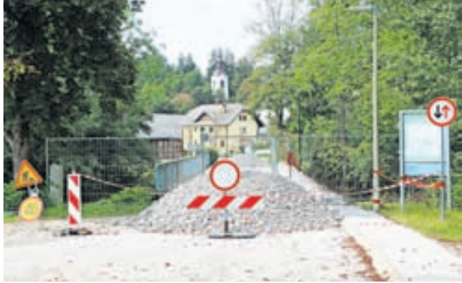
Most čez reko Kokro bo zaprt do predvidoma 16. oktobra letos.

Breg ob Kokri – Na Občini Preddvor ocenjujejo, da je po zadnji vodni ujmi za dobre 3,8 milijona evrov škode. Trenutno imajo še vedno aktiven štab Civilne zaščite, trudijo pa se zagotavljati čim bolj normalno stanje. Sicer je najprej kazalo, da so jo vsi mostovi v občini »odnesli« dobro, a se je kmalu izkazalo, da je potrebna nujna intervencija na mostu čez Kokro, ki povezuje vasi Tupaliče in Breg ob Kokri. Ugotovili so namreč, da je most ostal brez sredinske podpore. Reka Kokra je precej narasla in bila dovolj divja in močna, da je s seboj odnesla betonski podporni steber. Tako je sedaj most zaprt, saj občina izvaja nujno intervencijo za preprečevanje nadaljnje škode, da se bo potem sploh lahko izvedla celostna sanacija mostu. Predvidevajo, da bo most zaprt do sredine oktobra letos, obvoz je skozi Preddvor.