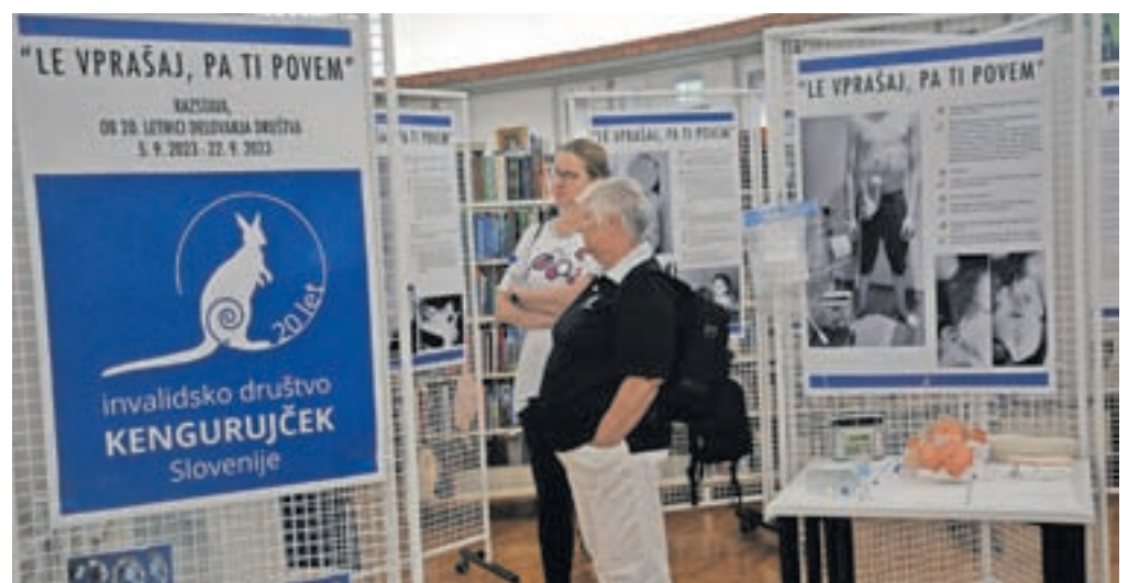
Razstava je zapolnjena z zgodbami, čustvi in izkušnjami, ki so zaznamovali dvajsetletno potovanje Invalidskega društva Kengurujček Slovenije.

movali dvajsetletno potovanje našega društva, življenje naših članov in njihovih družin. Skupaj smo prehodili dolgo pot, polno izzivov, vendar smo se naučili, kako premagovati ovire in graditi mostove do boljšega jutri. Ob tej obletnici smo se