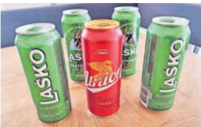
Raziskava Zveze potrošnikov Slovenije je pokazala, da lahko slovenski mladostniki po spletu brez ovir nakupujejo alkoholne pijače.