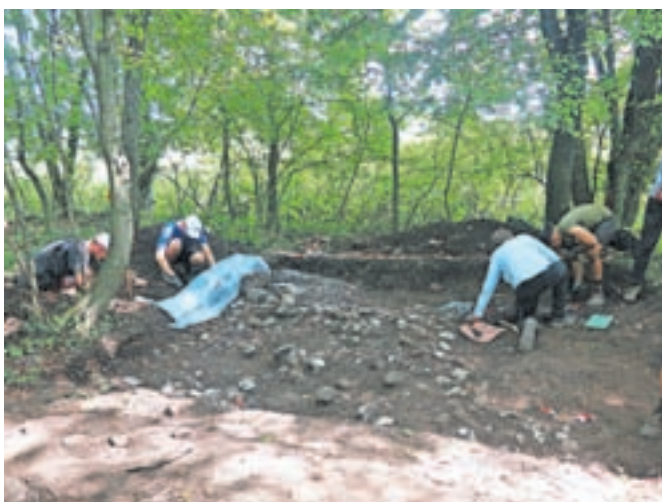
Delovno vzdušje na griču med industrijsko cono na Polici in nekdanjo tržiško progo