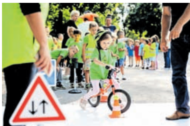
Slovenija sodi med najvarnejše na področju prometne varnosti otrok, starih do 14 let.

V prvi polovici letošnjega leta je bilo v prometnih nesrečah udeleženih 228 otrok v starosti do 14 let, enako kot v istem obdobju lanskega leta, žal pa sta življenja izgubila dva otroka, in sicer pešec in potnik v vozilu, lansko leto pa eden, kot kolesar. Precej nižje je število hudo telesno poškodovanih, saj jih je bilo letos devet, lansko leto pa 18.