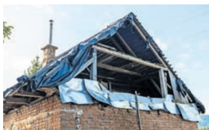
Veter in dež sta odkrila streho in podrla dimnik.