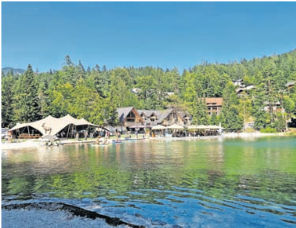
V Jasna Challet Resortu so za projekt pridobili milijon evrov.

Ljubljana – Na ministrstvu za gospodarstvo, turizem in šport so v petek predstavili rezultate razpisa za turistične namestitve, s katerim so podprli 58 investicijskih projektov za obnovo ali izgradnjo novih turističnih namestitev. Gre za sofinanciranje v višini dobrih 57,1 milijona evrov evropskih sredstev iz Sklada za okrevanje in odpornost, s čimer je ministrstvo podprlo investicije v skupni vrednosti 217 milijonov evrov. Skupaj z že izvedenima razpisoma za gorske centre in turistične namestitve ter javno turistično infrastrukturo je ministrstvo tako lani in letos podprlo za 359 milijonov evrov investicij.