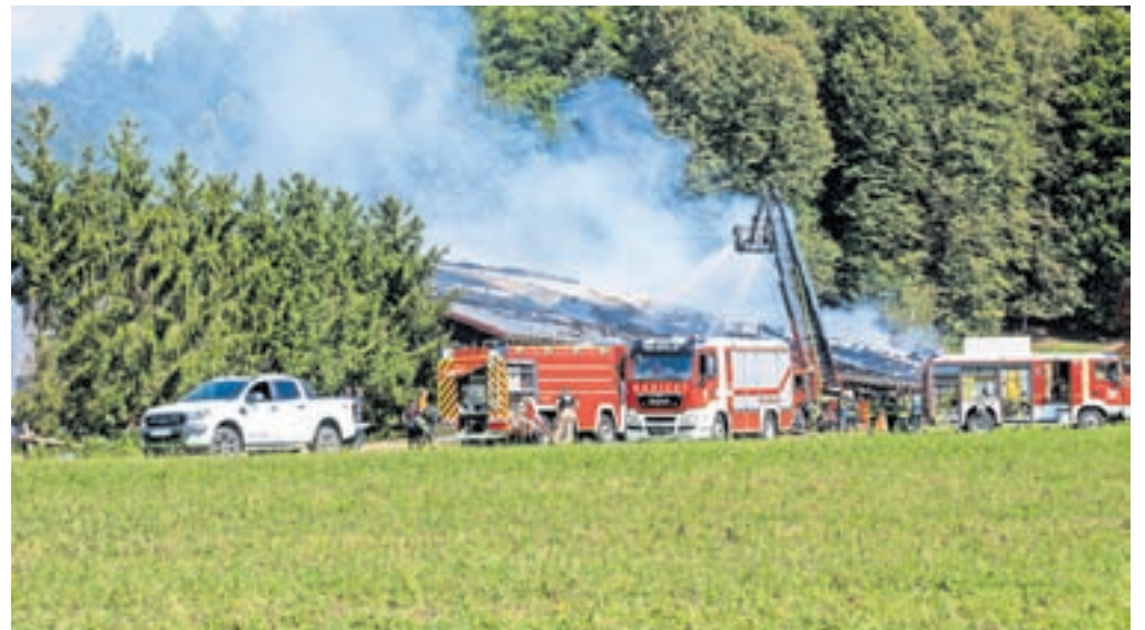
Na kraju dogodka je bilo kar 215 posredovalcev z 52 vozili, od tega 198 gasilcev s 43 gasilskimi vozili.

Ko so bili vzpostavljeni ustrezni pogoji, so policisti in pristojne službe začeli ogled in ugotavljanje vzroka za nastanek požara. Ta še