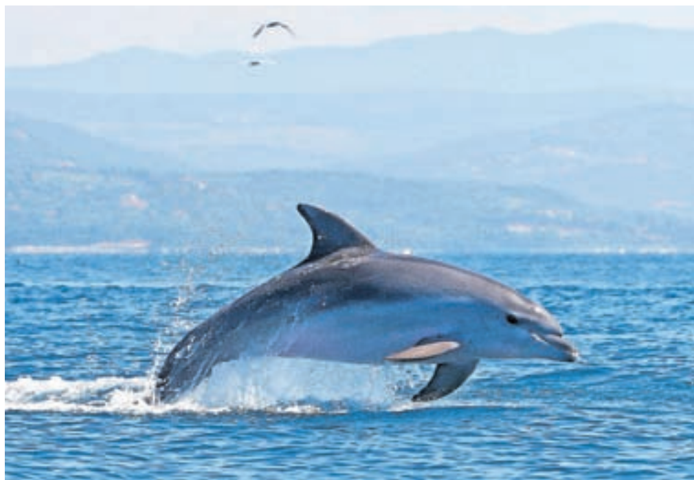
Društvo Morigenos se primarno ukvarja s preučevanjem in raziskovanjem delfinov v slovenskem morju. / Foto: Arhiv Društva Morigenos

povedala mlada prostovoljka, bi bilo namreč zelo nerodno, če bi morali razpravljati o delfinih, poimenovanih po raznih kodah in številkah. »Imamo Morigenosa, Emanuelo, Banankota, pred kratkim smo enega poimenovali Srečko, saj se je ujel v mrežo in kasneje tudi sam rešil. Sama pa bi si želela, da bi enega poimenovali Tuna.«