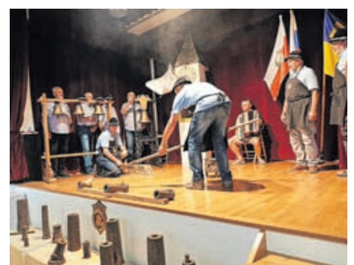
Kamnogoriški možnaristi so ob odprtju razstave pripravili tudi stiliziran prikaz streljanja z možnarji, v ozadju na odru doma krajanov so tudi pritrkovalci.

»Običaj je zamrl. V nas, ki smo iz pričevanja staršev in dedov še vsaj delno poznali način življenja v času žebjarstva, pa je tlela iskrica upanja, da bi ga oživili. Zgodilo se je, da smo se na večer pred veliko nočjo za točilnim pultom v gostilni Mlin srečali štirje enakomisleči in se dogovorili,