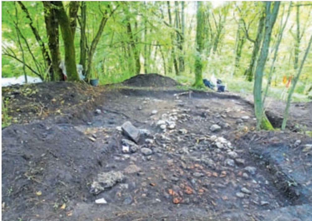
Končni pogled na najdišče, preden je bilo vrnjeno v prvotno stanje