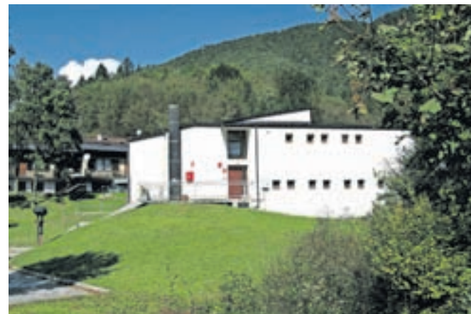
»Rozajanska kulturna hiša« v Ravanci v Reziji je ena najbolj zahodnih postojank slovenstva v Italiji. Da bi tudi ostala!