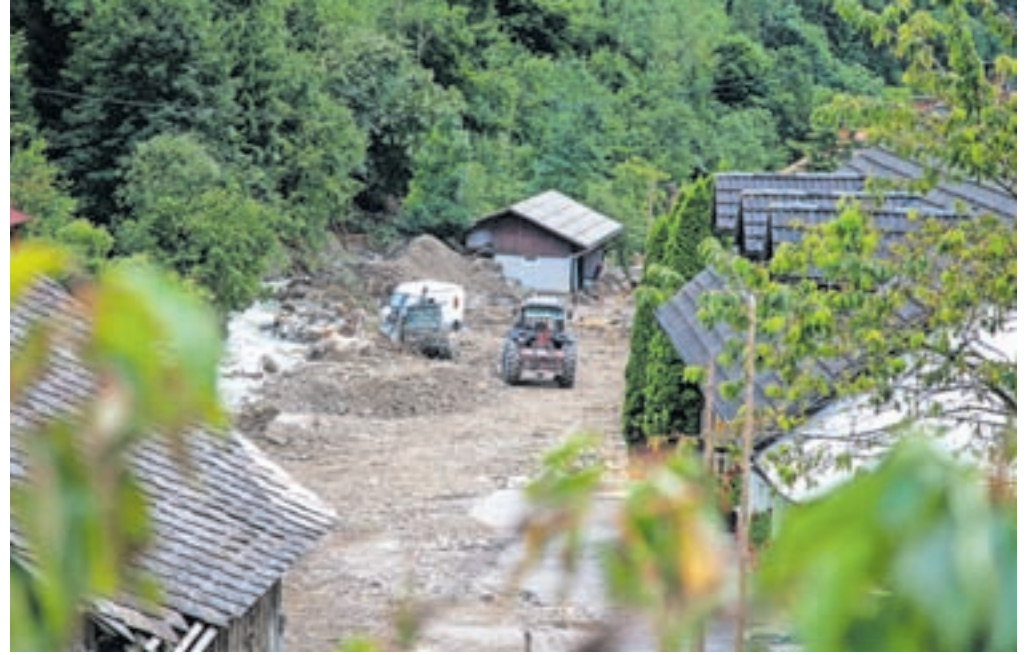
Z rebalansom so zagotovili sredstva za obnovo.

Svetniki so v razpravi pozdravili hitro in kvalitetno izvedeno intervencijo. Nekateri so sicer izrazili obžalovanje, da so zaradi zagotavljanja