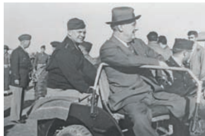
Predsednik Roosevelt med obiskom ameriške vojske na Siciliji, 8. decembra 1943. Levo od njega generala Eisenhower in Patton (stoji).