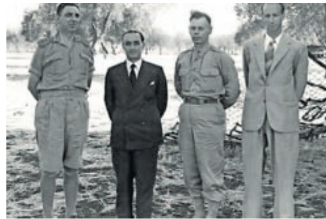
Podpisniki premirja na Siciliji, 3. septembra 1943, z leve: Kenneth Strong, Giuseppe Castellano, Walter Bedell Smith in Franco Montanari

Kapitulacija in dogajanje, ki je sledilo, je omogočilo ukinitvev krivične rapalske meje in njen premik daleč nazaj proti zahodu, na današnjo mejo med republikama Italijo in Slovenijo. Kakšen pomen pa ima to dejstvo za današnje stanje, za katero velja, da meje niso več tako pomembne, saj je naša država z vsemi štirimi sosednjimi povezana v EU. To je res, a gotovo ni večno. Za zdaj gre po mojem predvsem za vprašanje, kako ohranjati in krepiti vezi med slovensko matico in rojaki, ki so ostali onkraj državnih meja v Italiji, Avstriji in Madžarski. Da bi tam tudi obstali.