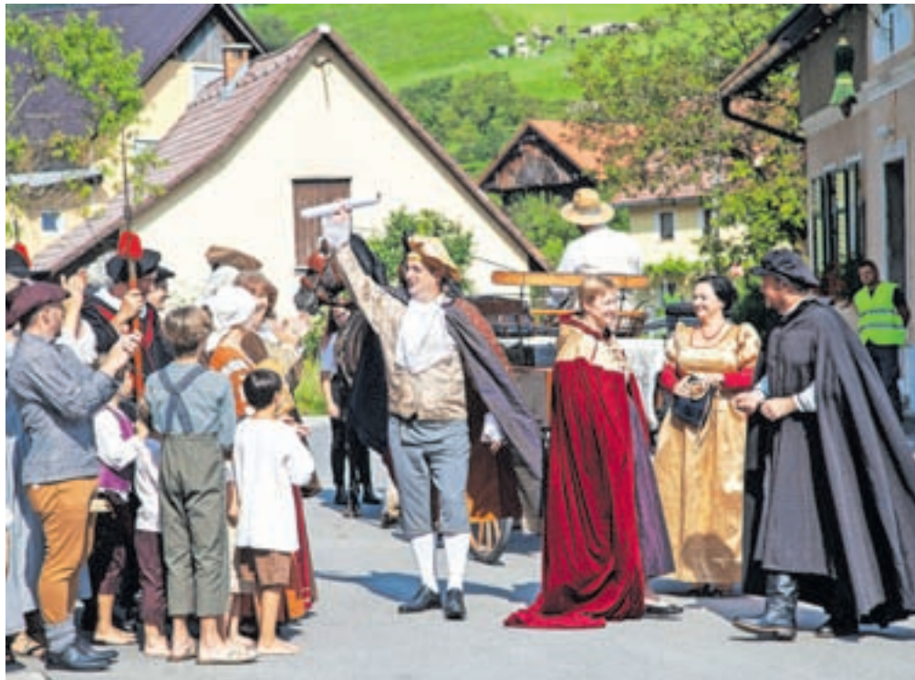
Podelitev trških pravic so Motničani obudili tudi na letošnji Prangerjadi.

Motnik je sicer nekdanj slovel po dobro razviti obrti, predvsem usnjarstvu, furmanstvu in priprganju. Bil pa je tudi rudarski kraj. V bližnjem rudniku rjavega premoga so našli tudi fosilne ostanke pritlikavega nosoroga iz obdobja pleistocena, ki je dobil latinsko ime Meninatherium telleri , po bližnji Menini planini in rudarskemu uradniku