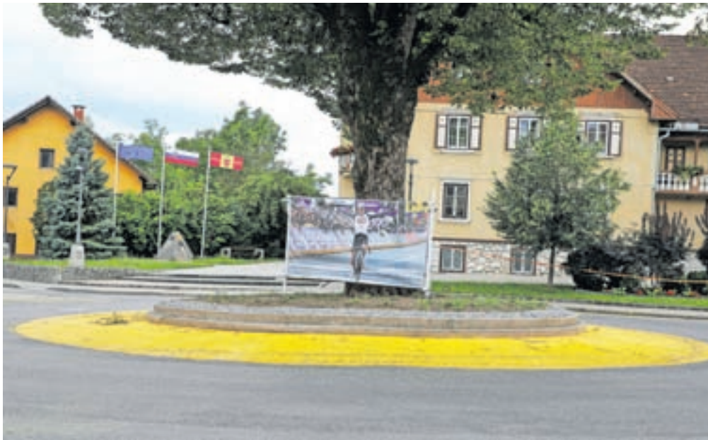
Komendski rondo je tudi tokrat obarvan rumeno.