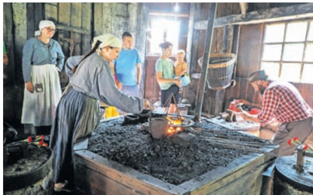
V Vigenjcu Vice so prikazali kovanje žebličkov, kuhali pa so se žganci, ocvirki in polenta.

Kljub temu danes pričakujem zelo lep dan in dobro druženje, veseli pa me, da se ljudje še trudijo ohranjanju tradicijo, ki na žalost počasi zamira,« je pojasnila.