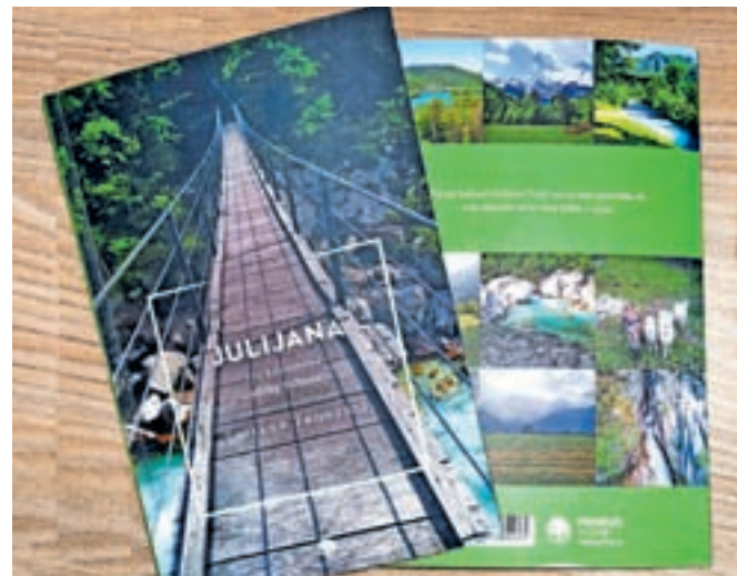
Knjiga o poti Juliana trail

V knjigi ne manjka tudi opisov znamenitosti, uporabnih