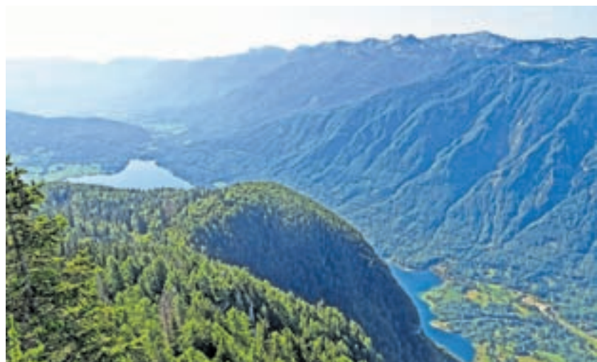
Bohinjsko jezero se na svoji vzhodni obali pokaže kot srce.

Nadmorska višina: 1761 m Višinska razlika: 550 m Trajanje: 6 ur Zahtevnost: ★★★★★