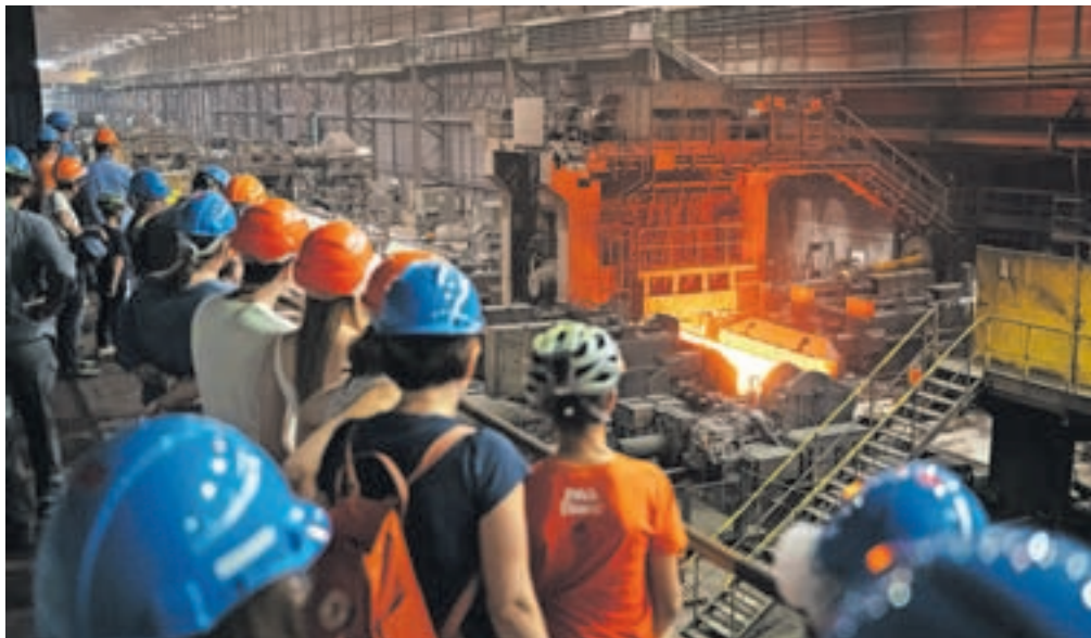
Odpuščenje zaposlenih kljub ustavitvi pomembnega dela proizvodnje ni predvideno, zagotavljajo v Skupini SIJ.

Jesenice, Ljubljana – V jeseniški družbi SIJ Acroni je v četrtek, 13. julija, prišlo do večje poškodbe glavnega motorja valjalnega orodja v vroči valjarni, so minuli petek sporočili iz krovne družbe SIJ. Kot so zapisali na spletni strani, bo zaradi poškodbe, pri kateri sicer ni bil poškodovan noben delavec, pomemben del proizvodnje ustavljen za predvidoma tri mesece. Dogodek bo povzročil večjo gospodarsko škodo v poslovanju, so povedali.