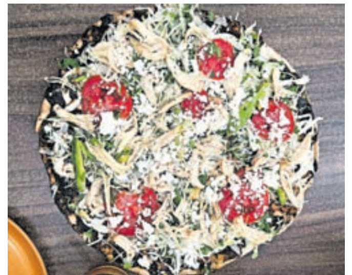
Po tlayudah so še posebno znani v Oaxaci.

Številne jedi izvirajo iz časov staroselcev – in tako kot takrat je še danes temelj mehiške kuhinje koruza. Tortilje, ki jih pripravljajo iz nje, so spremljevalec vsake jedi, in nepogrešljiv del tacosov, morda najbolj emblematične mehiške jedi. V koruznih listih pa skuhamo in postrežemo tudi slovite tamale, ki so odlične za zajtrk. Iz obdobja