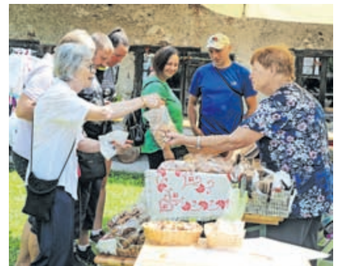
V Kropi se je zbralo lepo število ljudi, ki so si zaželeli dobrega druženja, kulinarčnih užitek in znanja o kovaških običajih.

predvsem zaradi predstavitve kovaštva. »V preteklosti sem bila že večkrat v Kropi in tudi moj bližnji prijatelj je po poklicu kovač, tako da mi je področje že poznano.