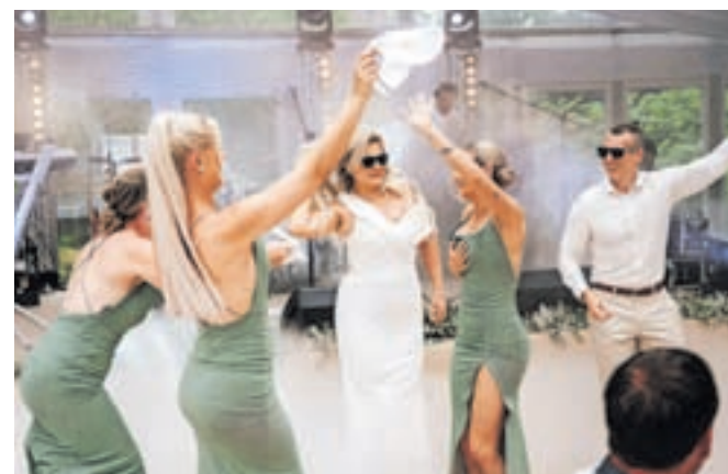
Nevesta pravi, da je poročni dan kar prehitro minil ...