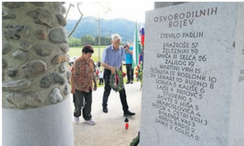
Žrtvam so se poklonili s polaganjem vencev.