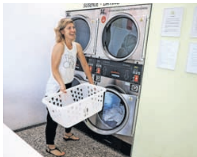
Ena od rednih strank kranjske pralnice

čaka, postopek pranja in sušenja traja približno eno uro. Tudi tu imajo industrijske