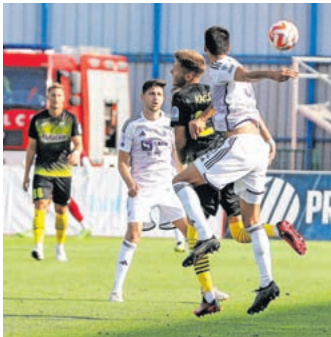
Maribor (v belih dresih) je bil tokrat premočan za Radomljane.