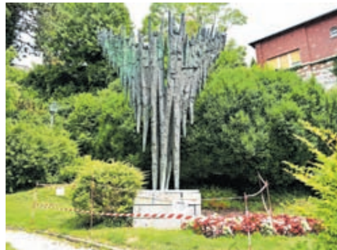
Restavriranje bronaste skulpture bo potekalo v naslednjem letu.

Občina Kamnik je že izvedla vse potrebne aktivnosti in priprave za sanacijo, obenem pa je pridobila interventna sredstva ministrstva za kulturo v višini okoli 50.000 evrov za demontažo in prestavitev bronastega dela spomenika. Pred kratkim pa so od ministrstva za kulturo dobili tudi obvestilo, da so bili uspešni tudi na letošnjem razpisu za obnovo kulturnih spomenikov, in sicer je bilo odobrenih