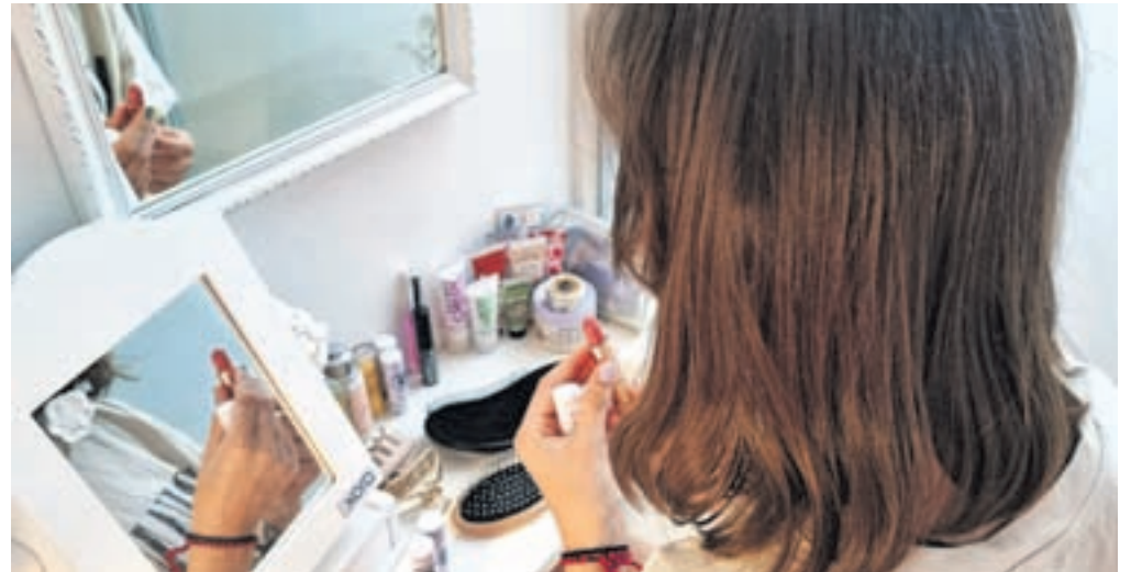
Otroška ličila niso primerna igrača. Fotografija je simbolična.

Ocenjevalci Miporja so pregledali seznam sestavin po mednarodni nomenklaturi kozmetičnih sestavin