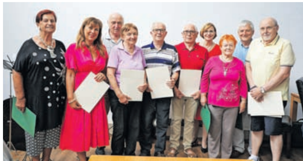
Ob jubilejnem, 20. srečanju gorenjskih izgnancev so podelili tudi zahvale in priznanja.