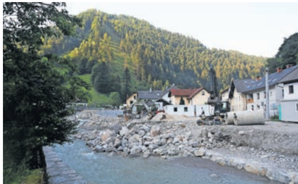
Najzahtevnejša dela potekajo na odseku, kjer gradijo nov most v Ovčjo vas z navezavo na novo obvozno cesto mimo starega dela Železnikov.

Protipoplavni ukrepi so že končani na vodotokih Prednja Smoleva in Dašnica ter na prvem odseku Selške Sore od Alplesa do Domela. Zaključna dela potekajo na drugem odseku od Domela