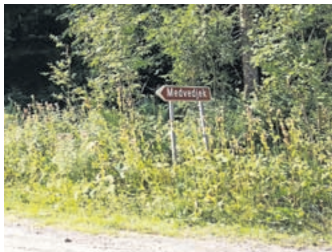
Medvedjek v kočevskih gozdovih

Že drugi dan smo kolesarili po deželi medvedov, na kar spominjajo tudi imena krajev (Medvedjek) in figura medveda v grbu Občine Loški Potok. Prvi vzpon do najvišje točke etape tistega dne – 1087 m n. m. – je bil dolg deset kilometrov. Nato se je pot prevesila po lepi makadamski cesti navzdol skozi