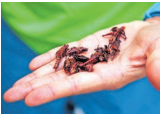
Pražene kobilice so v Mehiki precej vsakdanji prigrizek.