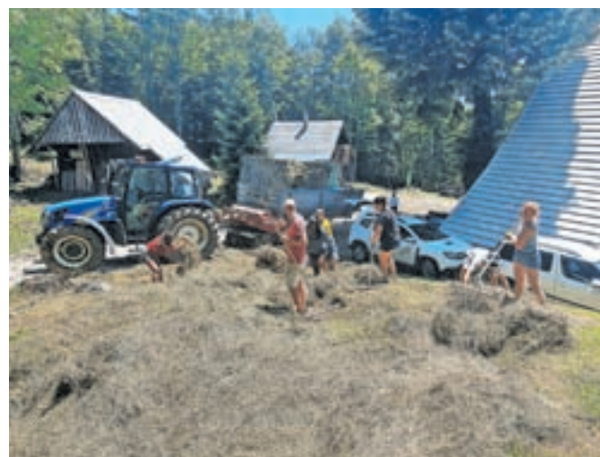
Na Vogarju so prostovoljci pomagali pri spravilu zelenega mulča.

nost za odhod v bolj vzhodne dele Evrope. »Vesel sem, da sem prišel prav v Slovenijo, tu mi je všeč. Navdušen sem