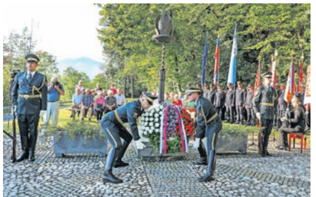
Usmrčenim žrtvam so se poklonili s položitvijo vencev.

»Zgodba na bistriškem klancu je tako tragična in tako boleča, da je ne smemo nikoli pozabiti. Zato je še toliko bolj pomembno, da se dogodka vsako leto ponovno spominjamo, da se spominjamo žrtev, nam, ki pa smo še na tem svetu, pa je v poduk, da se izogibamo netenju sporov in vojnih spopadov, ki vedno postrežejo s