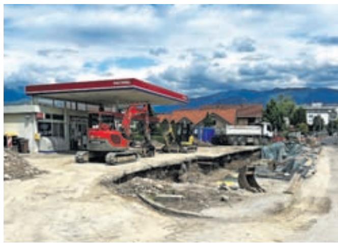
Prenova bencinskega servisa na Ljubljanski cesti v Kamniku

Kot je znano, je Petrol začel tudi celovito prenovo obeh postajališč Barje na južni ljubljanski obvoznici. Kakšne pa ima načrte na širšem območju Gorenjske? Kot pravijo, bodo prihodnje leto prenovili prodajno mesto v Medvodah. »Sicer pa načrtujemo postopno prenovo celotne prodajne mreže, tudi Gorenjska bo del tega,« so še pojasnili.