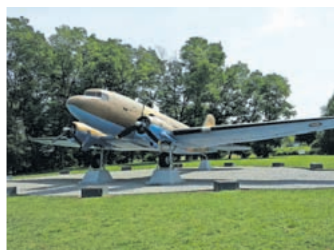
Letalo douglas DC-3 skytrain, C-47 dakota pri vasi Otok