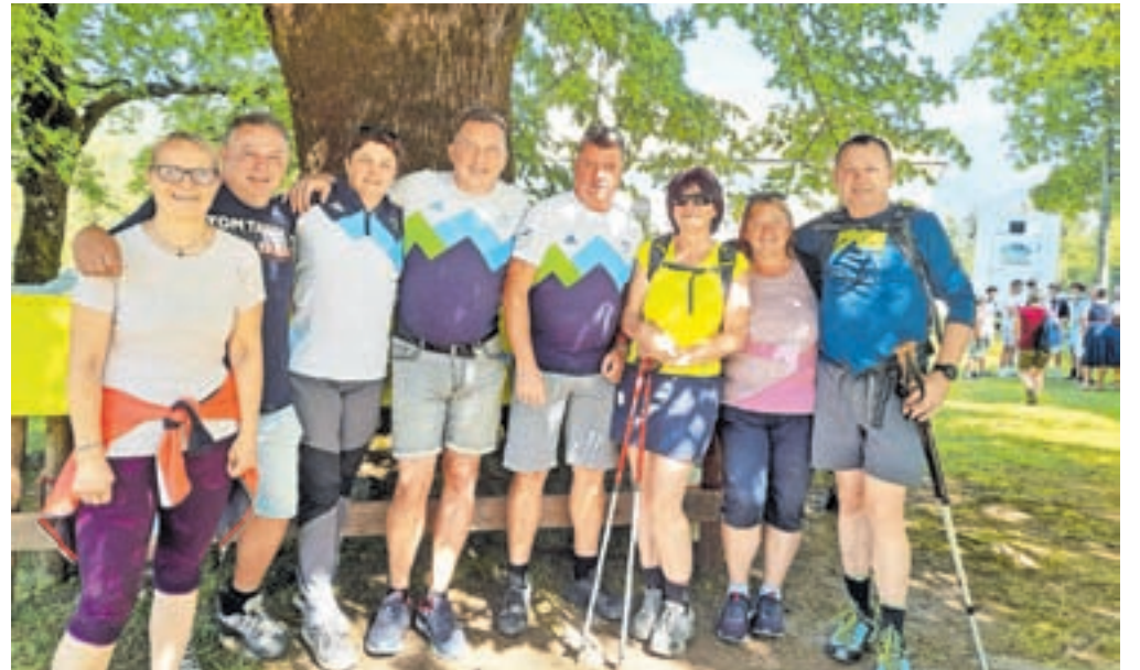
Skupina Kranjcev iz Bašlja in Trstenika pod Pristovnikovo lipo pri cerkvi v Kortah

ške, radi prihajajo tudi sosede s kranjske strani. Nič čudnega, saj sta bili Koroška