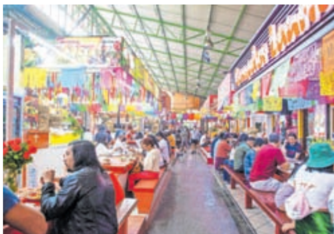
Mehiške tržnice so ena od najboljših izbir za preizkušanje jedi.

Čeprav je preizkušanje hrane eno najbolj zanimivih početij v Mehiki, pa se še posebno zaradi nekoliko nižjih higienskih standardov lahko srečamo tudi z Montezumovim maščevanjem, kot v tem delu sveta pravijo prebavnim motnjam turistov. Montezuma je bil namreč azteški poglavar, ki so ga ubili španski zavojevalci. Mene je doletelo na nočni vožnji proti Veracruzu, kjer so leta 1519 Španci prvič stopili na mehiška tla. Še sreča, da je bilo na avtobusu stranišče. (Se nadaljuje)