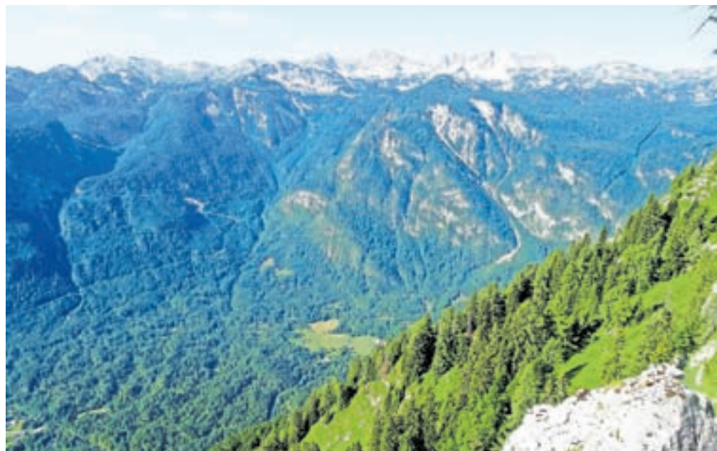
Pogled s Pršivca na greben Bohinjsko-Tolminskih gora

Na vrhu nas bosta pričakala vpisna knjiga in čudovit razgled. Pršivec si iz oči v oči gleda z Rjavo skalo, kamor pripelje vzpenjača na Vogel. Bohinjsko-Tolminske gore se nam pred očmi razgrnejo kot ogrlica in vsaka gora