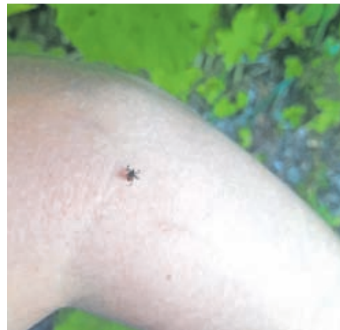
Klopov je letos manj, a vseeno se je treba po prihodu iz gozda (pa tudi zgolj z vrta) temeljito pregledati.

Na več delih Gorenjske so naši bralci opazili ali, bolje rečeno, začutili pik