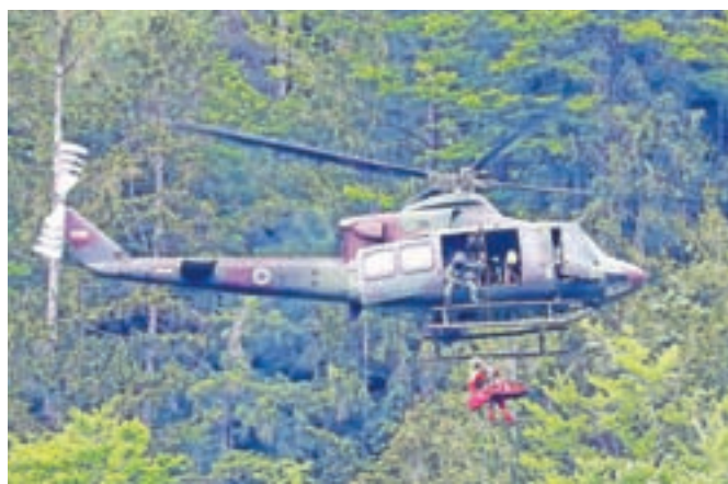
Enota HNMP Brnik je del javne zdravstvene mreže oziroma sistema nujne medicinske pomoči, organiziranega pri Zdravstvenem domu Kranj.

Kot poudarjajo, vsak težko oboleli ali poškodovani pacient pomeni dodatno obremenitev bolnišnic, predvsem Splošne bolnišnice Jesenice in Univerzitetnega kliničnega centra Ljubljana. Urgence pa ekipe v HNMP