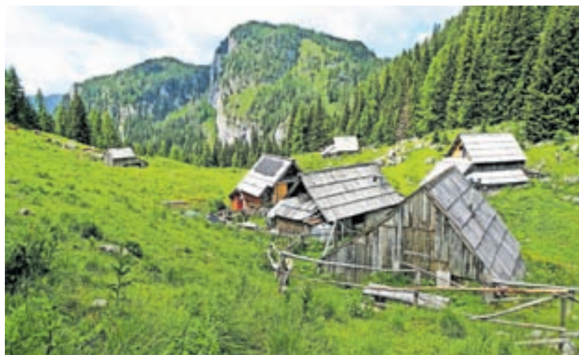
Planina Viševnik, za njo pa vrhova Vrtec in Stadorski orličji