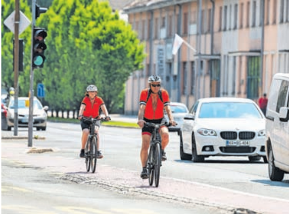
Večina prometa na Jesenicah, tudi s kolesi, se odvija po državni cesti R2.

Župan Peter Bohinec je pojasnil, da je bil omenjeni koncept pripravljen prav z namenom načrtovanja in gradnje novih kolesarskih stez, kolesarskih poti, pomožnih kolesarskih pasov in pločnikov.