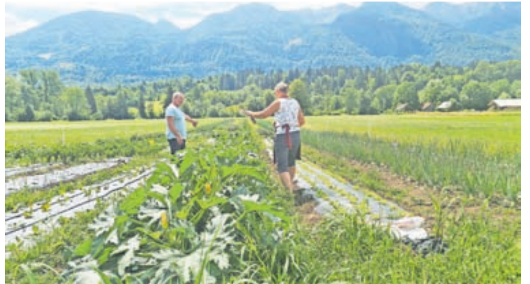
Zelenjavna njiva v Spodnji Bohinjski dolini

»S šestimi kmeti smo podpisali dogovor o pridelavi in spomladi na približno dveh hektarih površin posejali ječmen, pšenico, piro, koru-