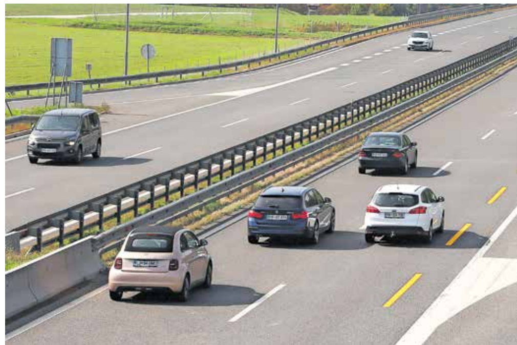
Razdalja do vozila pred nami ne sme biti manjša od razdalje, ki jo pri hitrosti, s kakršno vozimo, prevozimo v dveh sekundah. Fotografija je simbolična.

Na gorenjski avtocesti so policisti obravnavali trideset voznikov, ki so vozili na