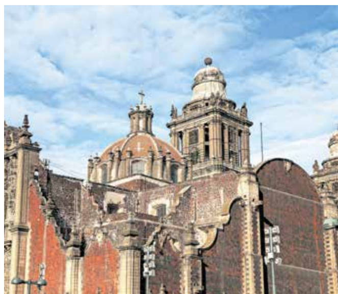
Pogled na katedralo v središču mesta

Latinska Amerika me je očarala že, ko sem pred dobrih desetimi leti obiskal države južneje ob ameriških Kordiljerah. Zato sem brez oklevanja izkoristil priložnost, da v času, ko se je svet končno osvobodil primeža epidemije, поблиže spoznam še Mehiko.