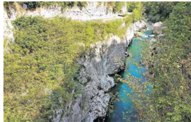
Smaragdna Soča – pogled z Napoleonovega mostu

zapustili glavno cesto, prečkali reko Idrijco in po lokalni asfaltirani cesti nadaljevali skozi Drobočnik do Gorenjega Loga, kjer se je pot spremenila v kolovoz, ki je postajal vse slabši. Po kamenju in skalah smo se začeli strmo spuščati do potoka Vogršček, ki smo ga prečkali dobrih sto metrov