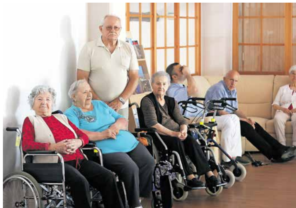
Upokoence je neprijetno presenetila informacija o sistemu financiranja. Slika je simbolična.

V NSi menijo, da je zakon zelo nesolidaren. »Prizadeti