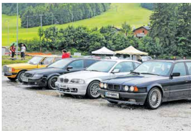
Youngtimerji so avtomobili z dušo, ki za svoje lastnike predstavljajo zlato dobo avtomobilizma.

ne zgolj mobilnostjo in premagovanjem razdalj,« je pojasnil Tomc. Poudaril je, da so mladodobniki ljubiteljska vozila, ki niso namenjena vsakodnevnim vožnjam. »Naloga lastnika je, da vozilo ohranja in vzdržuje v vrhunskem stanju, na cesti pa se odpravi le ob posebnih priložnostih. Tovrstna vozila lahko opravijo največ pet tisoč kilometrov letno, avto pa mora biti čim bolj originalen,« je Tomc še povzel specifikke mladodobnikov. Youngtimer srečanje so tokrat organizirali že petič, njegov glavni namen pa je po Tomčevih besedah druženje enako mislečih, ki cenijo avtomobile in avtomobilsko kulturo 80. in 90. let. V Kranjski Gori se jim je pridružilo malo manj kot 150 voznikov s svojimi avtomobili, ki jih