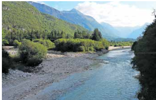
Soča in hribi nad Bovcem – pogled z mostu pri Žagi

Iz Bovca smo se mimo letališča spustili do reke Soče in skozi Čezsočo kolesarili do mostu, kjer smo nekoliko pred Logom prečkali Sočo in po glavni cesti nadaljevali proti Kobaridu. Prečkali smo reko Učjo, ki je znana po svojih koritih, in nato skozi Srpenco in Trnovo do Kobarida, kjer smo po Napoleonovem mostu prečkali Sočo in do Tolmina kolesarili skozi vasi na levem bregu: Ladra, Kamno, Volarje, Gabrje.