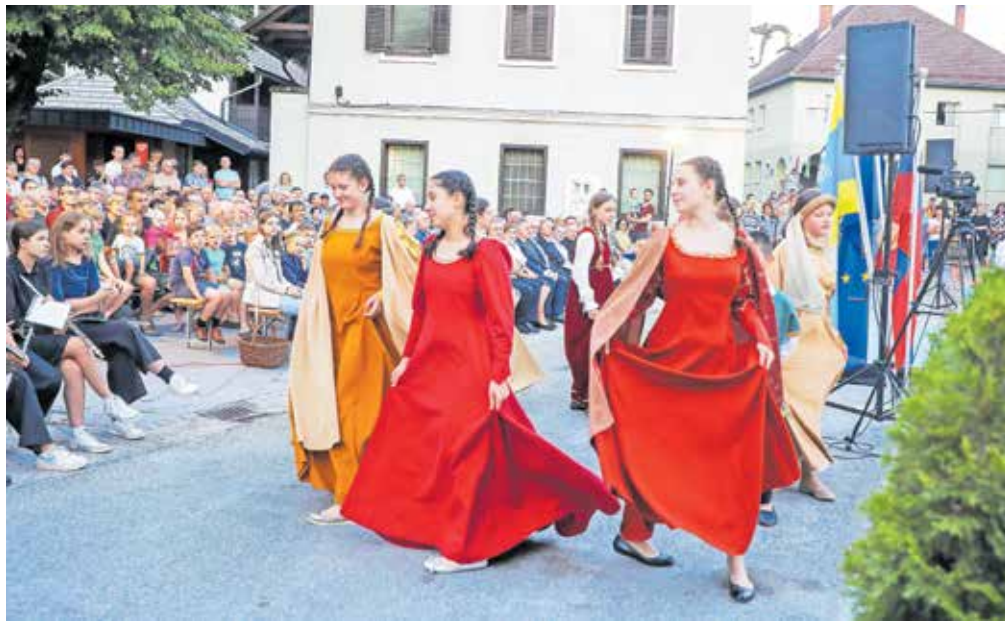
Nastop folklorne skupine Podružnične šole Selca

Ureditev vaškega jedra sta sofinancirala KS Selca in Občina Železniki, oblikoval pa ga je arhitekt Bojan Rihtaršič.