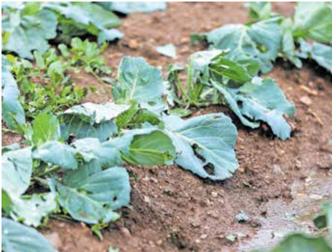
Toča je prizadela tudi vrtnine. Ponekod se bodo obrasle, nekatere bo treba posejati na novo.