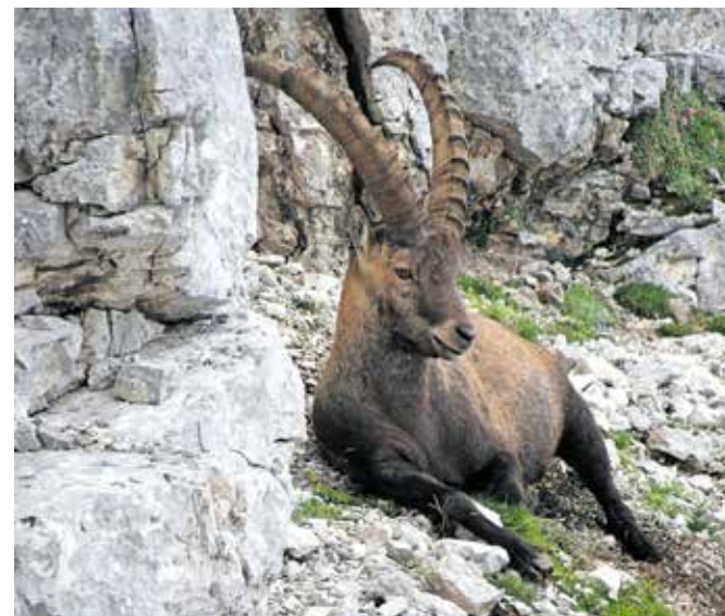
Kralji teh gora so kozorogi.