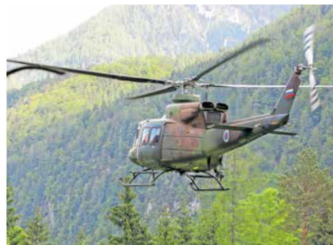
Zaplezanega francoskega planinca so gorski reševalci rešili na klasičen način, v dolino pa so ga prepeljali s helikopterjem.

In kakšne so globe za neupoštevanje varnostne razdalje? V skladu s 44. členom zakona o pravilih cestnega prometa se z globo 40 evrov kaznuje za prekršek voznik, ki ne potrebuje voziškega dovoljenja in ne upošteva varnostne razdalje. Z globo 200 evrov se kaznuje za prekršek voznik motornega vozila, ki ne vozi na ustrezni varnostni razdalji, z globo 300 evrov se kaznuje za prekršek voznik motornega vozila, ki ne vozi na varnostni razdalji, določeni s prometnim znakom. Vozniku se izrečejo tudi tri kazenske točke.