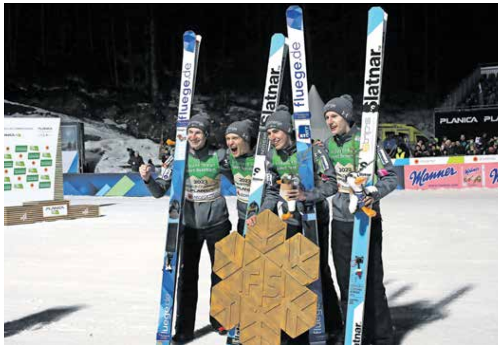
Svetovno prvenstvo v Planici je bilo uspešno za organizatorje, izkazali pa so se tudi naši športniki.

Svetovno prvenstvo je gostilo 1707 športnic, športnikov in spremljevalnega osebja ekip iz 68 držav, prvenstvo pa je spremljalo tudi 1800 medijskih predstavnikov. Pri organizaciji in izvedbi dogodka je sodelovalo 1700 ljudi, od tega skoraj 700 prostovoljcev iz 16 držav. V času prvenstva je bilo prek službe za nastanitve OK Planica v Kranjski Gori, kar pomeni od Mojstrane do Rateč, realiziranih 16.630 nočitev, na Bledu in v Lescah 2.425 nočitev, na območju Trbiža 1.200 nočitev ter na območju Beljaka in Baškega