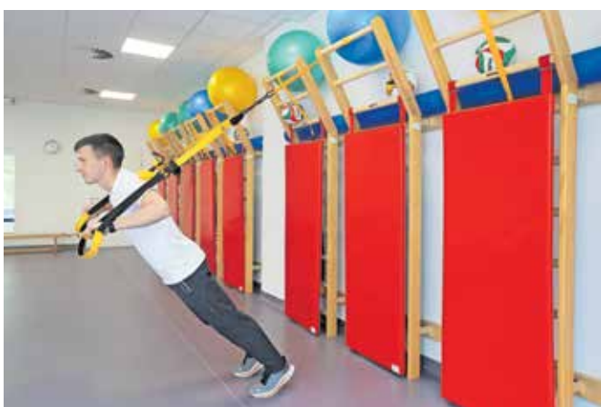
Tehnično pravilne izvedbe različnih vaj

skupaj s športnimi vzgojitelji in trenerji opazamo, da se za obisk fitness centrov vse pogosteje odločajo tudi srednješolci. Na eni strani polni energije in zagona, na drugi pa največkrat s premalo znanja se vadbe za moč največkrat lotijo napačno in tako