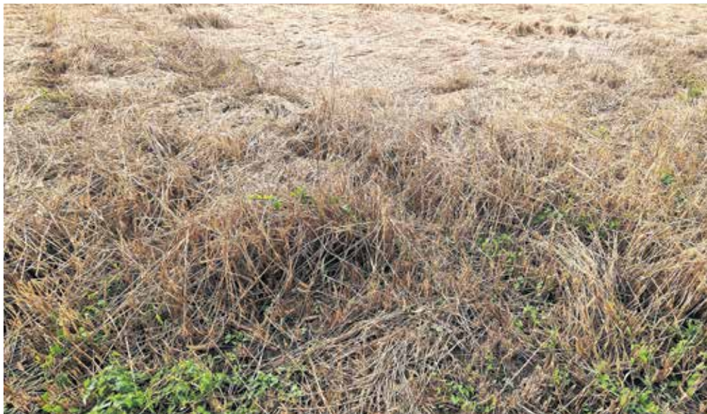
To je ena od toče prizadetih njiv žita: klasja skorajda ni videti, zrnje je po tleh, slama je polomljena ...