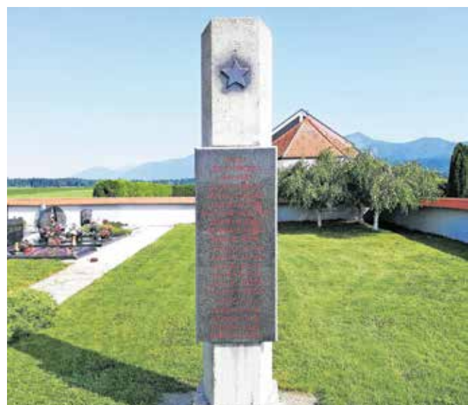
Nekdo je znova prebarval rdečo zvezdo.

ponavljajo iz leta v leto. Kot je še dodal, ne pozna podobnega primera v Sloveniji. »Težko je razumeti ... Sprašujem se, kako bi se oseba, ki to počne, počutila, če bi nekdo tako ravnal z njenim družinskim nagrobnikom.« Za obnovo poškodovanega spomenika bo naslovil prošnjo na Občino Cerklje. »Župan je o dogodku že obveščen, običajno obvestimo tudi zavod za varstvo kulturne dediščine in policijo.«