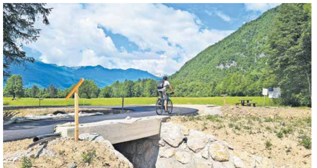
Del kolesarske steze pred Bohinjsko Bistrico, kjer je slikovita pot že preplastena z asfaltom

Zato pozivajo vse potencialne uporabnike, da na traso nove kolesarske poti ne zahajajo, prav tako prosijo ponudnike turističnih nastanitvev, da nanjo ne usmerjajo gostov in obiskovalcev. »Kolesarji so se za zdaj na relaciji Soteska–Bohinjska Bistrica dolžni voziti po državni cesti. Po končani gradnji pa bodo