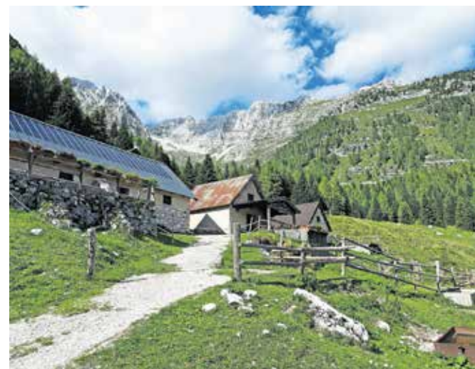
Planina Krni dol; po ostenju zgoraj poteka slikovita pot Ceria Merlone.