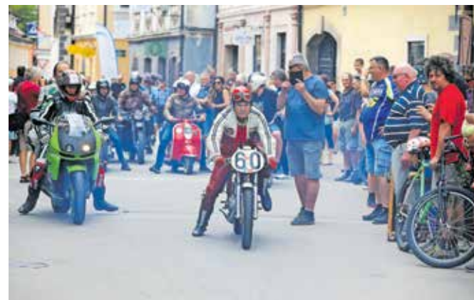
Ob progi in v središču Škofje Loke si je spektakel ogledalo ogromno ljubiteljev moto športa.

Med zbranimi na slovesnosti so bili tudi nekdanji tekmovalci, ki so Slovenijo zastopali v svetu