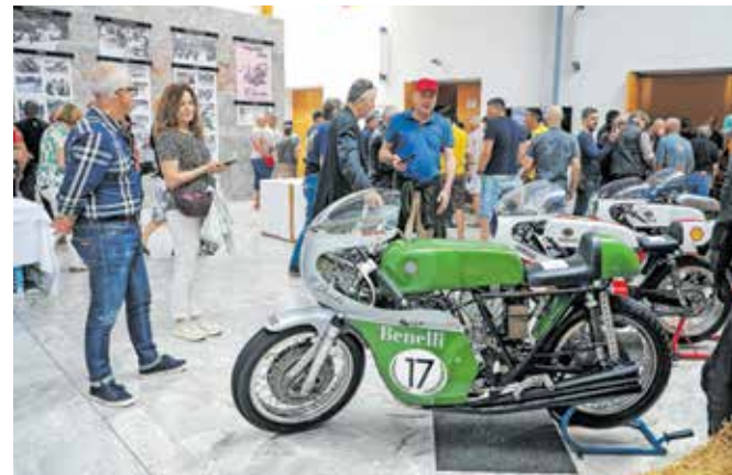
Zanimivi razstavi v središču mesta in v Sokolskem domu si je moč ogledati še do 23. julija.