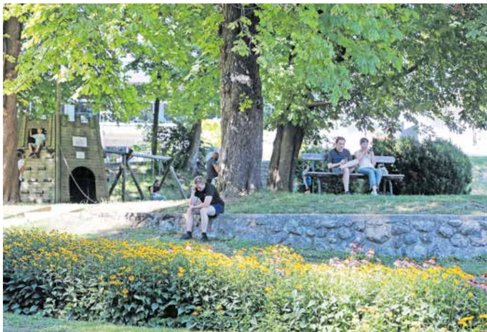
V času največje moči sonca se umaknimo v senco. Slika je simbolična.

Vročina bolj prizadene tudi osebe s socialno-ekonomskimi problemi, kot so brezdomci, socialno izolirani, tudi prebivalci s slabšim dostopom do zdravstvenih ustanov, pa tudi tiste, ki so dodatno izpostavljeni dejavnikom iz okolja, kot so