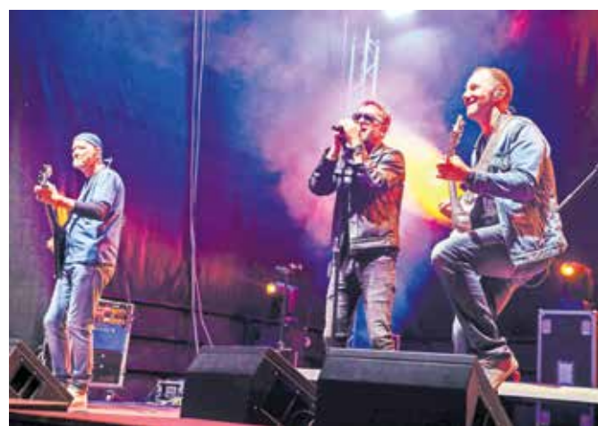
Skupina Miz je navdušila obiskovalce, ki so glasno prepevali ob njihovih največjih uspešnicah.

Teden mladih je tako kot vsako leto omogočil ustvarjanje novih spominov; 22-letni Beno Brečević iz Kranja je povedal, da je festival odlična priložnost za sprostitev po končanem izpitnem obdobju. »Odličan začetek poletja, druženje mladih, koncerti, zabava in končno odidih po študijskih obveznostih,« je še dejal.