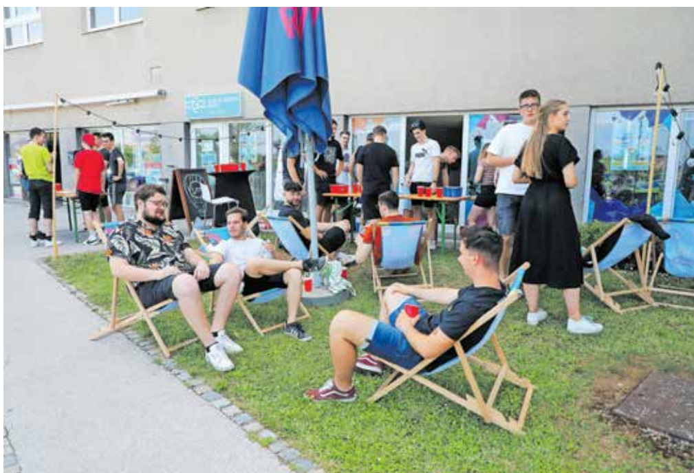
Mladi so se družili in sprostiti tudi ob turnirju v tako imenovanem beer pongu.