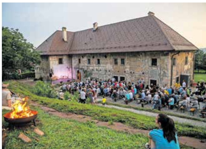
V izvirnem avditoriju Šempetrške graščine

Sledila je pogostitev z domačimi jedmi, pogačami, poticami, vodiškimi prestami, izvirsko vodo z Jezerskega in dobrotami – pršutom, panceto in teranom prijatelja Dečev, Hinka Krstana. Vzdušje na dogodku je bilo čarobno, nekaj posebnega. »Kdor je doživel, ne bo pozabil,« je po besedah pevke Tanje Malovrh naslednji dan ob srečanju na ulici dejala domačinka iz Stražišča.