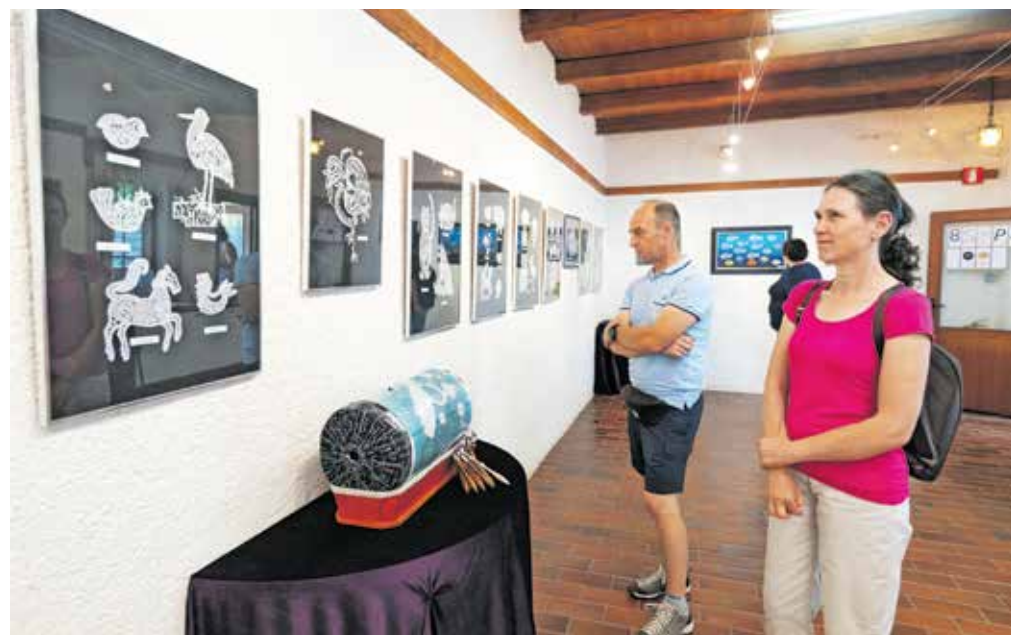
Razstava domačih klekljaric je v Galeriji Muzeja Železniki na ogled do 11. julija.