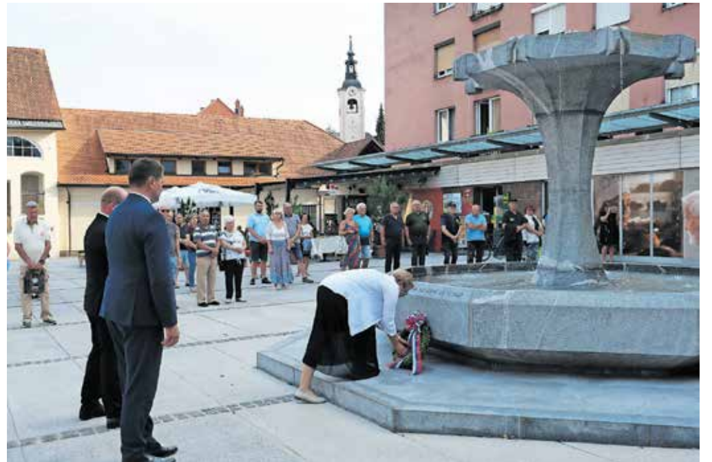
Žrtvam so se poklonili s polaganjem venca.

»Prireditve organiziramo v opomin in spomin na grozodejstvo, ki je bilo zagrešeno na tem mestu s strani okupatorja, ko je bilo obešenih osem talcev, med njimi tudi trije člani takratne Gorske reševalne službe Kamnik,« je dejal župan. Jevšnikova je ob tem dodala, da so ti posamezniki dali največ – svoja življenja. »Te usode si niso izbrali sami, niso začeli vojne in niso samo žrtve nesmiselne in boleče šestletne morije. Zdi se, da je zavest o pomenu zmage nad nacifašizmom v drugi svetovni vojni v svetu preprosto premalno upoštevana. To predstavlja jedro problema, s katerim se sooča tako Evropska