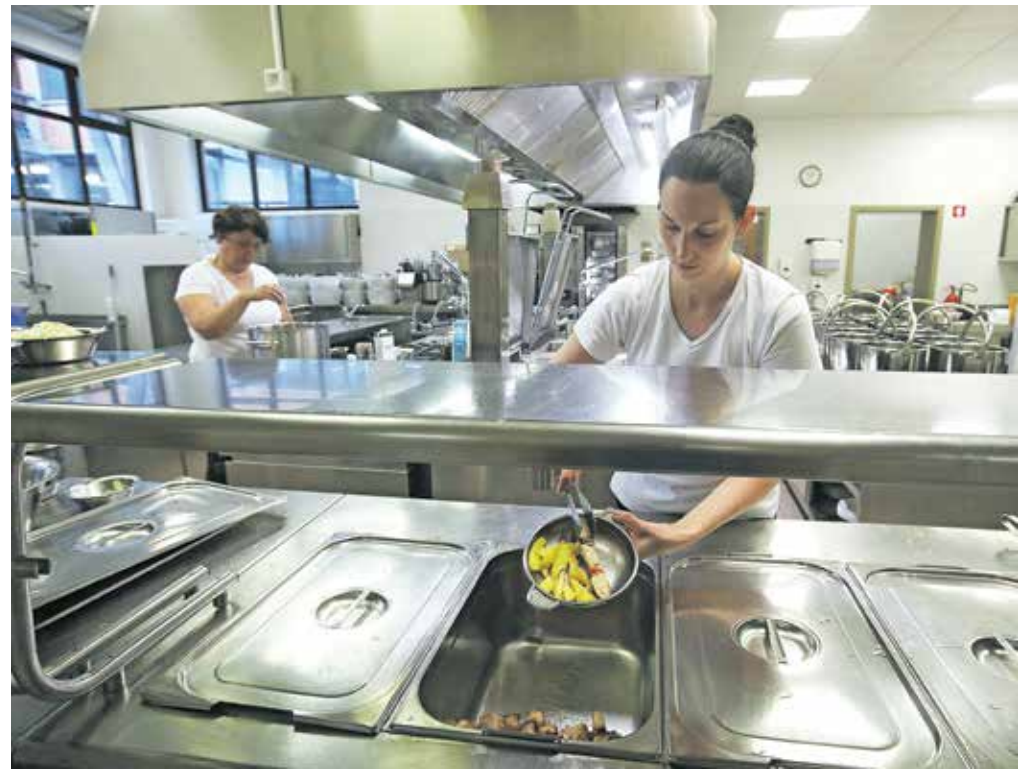
V šolskih kuhinjah se že zdaj spopadajo s prostorsko in kadrovsko stisko.