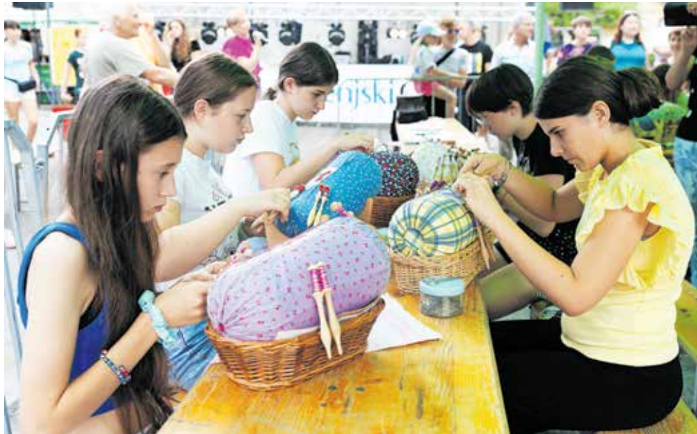
Na klekljarski ustvarjalnici je 33 otrok klekljalo ptičke.