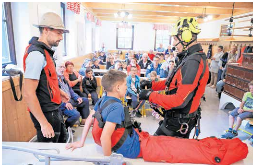
Rejniki in otroci so z zanimanjem opazovali prikaz reševanja in oskrbe ponesrečenca, ki ga je pripravila Gorska reševalna služba.