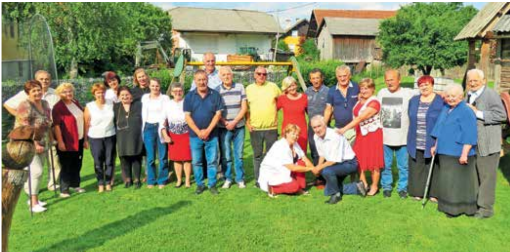
Srečanja ob 50. obletnici valet se je udeležilo 19 nekdanjih sošolcev ter oba razrednika in dva učitelja.