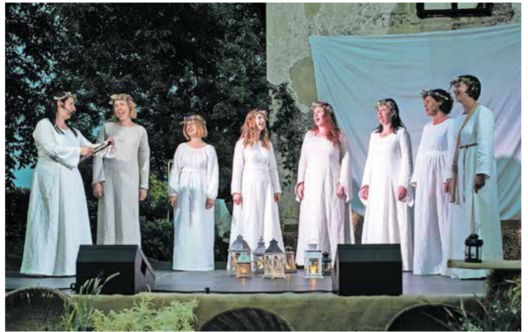
Dečve so ob svoji petindvajsetletnici predstavile pesmi, ki so jih naši predniki povezovali s kresovanjem.

Program je obsegal pesmi, ki so se v preteklosti pele ob kresovanju. Dečve so jih poiskale v zbirkah ljudskih pesmi in na avdio posnetkih. Prepoln graščinski vrt je bil navdušen nad izvedbami pesmi, kot so Bog daj, Že škrjančki lepo žvrgolijo, Sijaj, sijaj, sončece, Travniki so že zeleni, Tri tičice, Zrelo je žito in drugih iz različnih slovenskih pokrajin. Dečve imajo sicer v svojem pevskem repertoarju več kot sto pesmi, vsako leto nanižajo povprečno deset nastopov, več kot petdesetkrat so