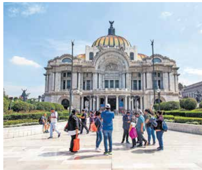
Palacio de Bellas Artes (Palača lepih umetnosti) je ena glavnih znamenitosti mehiškega glavnega mesta.

Kljub temu pa ima Mehika ponuditi veliko preveč lepega, da bi se ji zaradi tega izognili ali se omejili le na kakšno od številnih turističnih letovišč, ki ponujajo instant različico turizma. Gre za eno turistično najbolj obiskanih držav na svetu in ob upoštevanju zdravorazumskih varnostnih ukrepov in priporočil vodnikov ali domačinov je možnost za slabo izkušnjo vendarle izjemno majhna. (Se nadaljuje)