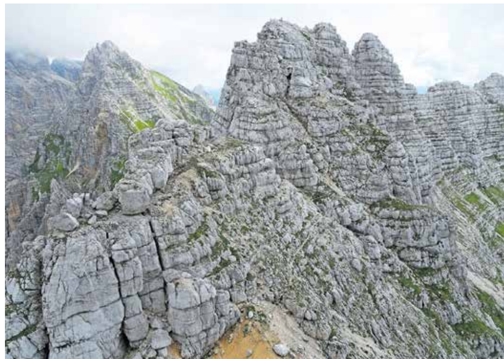
Pogled z vrha Krni dol na pot pred nami ... Kje je pot?

sestop neposredno navzdol, nato pa malce prečenja v desno do melišča, po katerem se sprehodimo do Škrbine nad Tratico, kjer so vidni ostanki vojne norije. Na drugi strani škrbine, okoli ogromne skale, je čudovit skalni fotelj z razgledom na Nabojs, Viš in Koštrunove špice.