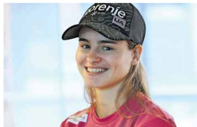
Nika Križnar, evropska prvakinja

mesto. Prvič so bili na sporedu iger smučarski skoki, naši pa so osvojili štiri kolajne. Na veliki skakalnici je bila zlata Nika Križnar, druga pa Nika Prevc. Nika Prevc je srebrno odličje osvojila še na manjši skakalnici, obe pa sta bili z Anžetom Laniškom in Timijem Zajcem tretji na ekipni tekmi.