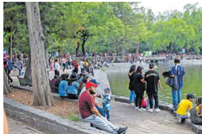
Prostran park Chapultepec predstavlja zelena pljuča mesta in ponuja oddih številnim prebivalcem.