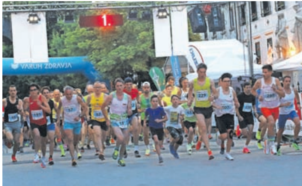
Na nočnem 10-kilometerskem teku se je letos zbralo več kot 750 tekačic in tekačev vseh starosti.

Župan Radinja je bila nato tudi med udeleženci večernega Teka štirih mostov, kjer sicer ni zmagal, vseeno pa ga je še en lep športni dogodek v mestu znova navdušil. »V prazničnem letu, ko Škofja Loka praznuje 1050 let, je bil današnji tek res praznik športa in prijateljstva. Tek štirih mostov ni