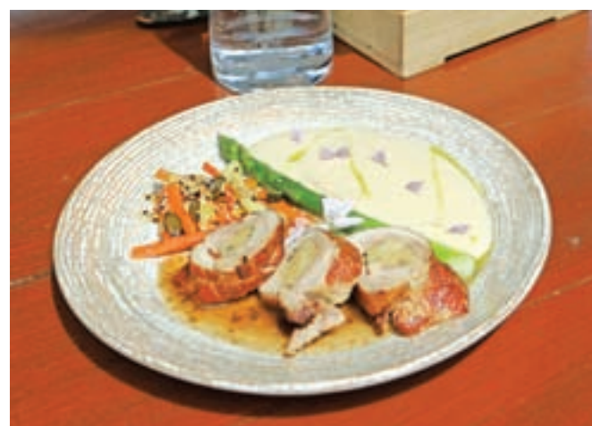
Krakovčev piščanec, polnjen s kruhom in pehtranom v družbi pireja zelene in pečene jabolka