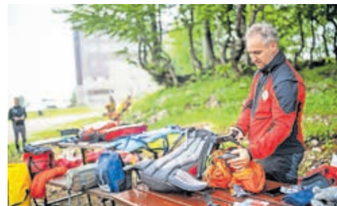
Obiskovalce gora opozarjajo, naj posebno pozornost namenijo dobri pripravi na turo, pri čemer naj poskrbijo tudi za ustrezno opremo.

V Združenju gorskih vodnikov so poudarili, naj gostje, ki nimajo ustreznih znanj in izkušenj, in tudi turistične organizacije najemajo ustrezno usposobljene gorske vodnike. »Tisti, ki se odločijo za najem