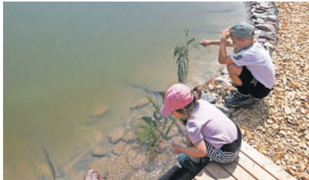
Upoštevat je treba, da sta za preživljanje otroka zavezana oba starša.

Preživninski kalkulator je v osnovi namenjen socialnim delavcem in sodnikom. »Izhaja iz potreb otroka, ki naj predstavljajo osnovo, hkrati pa preverja tudi zmožnosti staršev,« so pojasnili na ministrstvu in dodali, da so za širšo javnost pripravili preprostejšo verzijo, ki izračuna zgolj osnovne potrebe otroka glede na starost. »Naš cilj je omogočiti ločenim staršem lažje dogovarjanje glede preživljanja otroka. Gre za spletno aplikacijo z opredeljenimi mesečnimi potrebami otroka, ki so opredeljene po posameznih kategorijah: hrana in pijača, obutev in oblačila, stanovanje, zdravstvo,