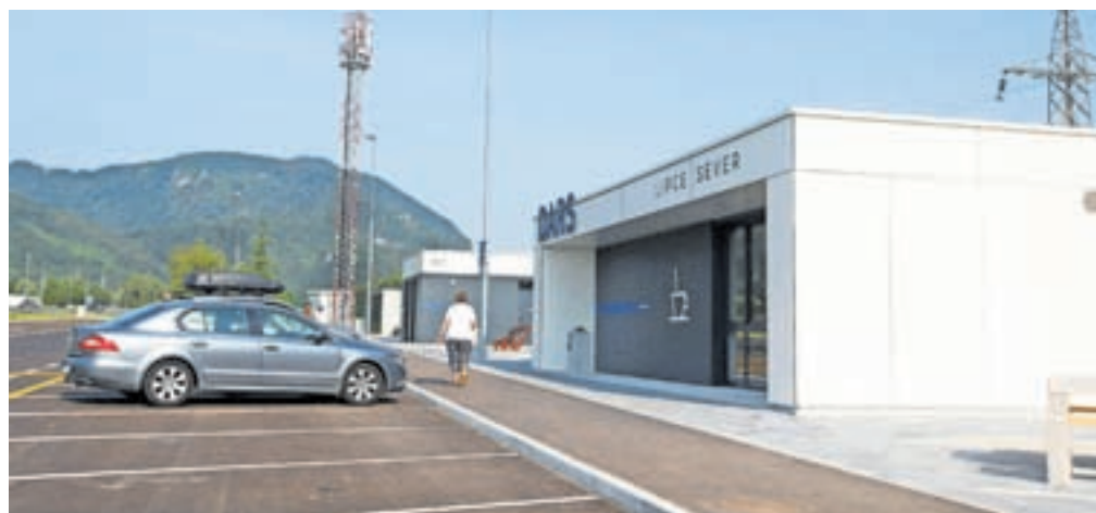
Po končani prenovi imajo mala počivališča poenoteno moderno celostno podobo, urejene sanitarije, površine za počitek in rekreacijo ter oskrbo za avtodome. Za zdaj pa še niso odprti gostinski objekti.

Na približno sedemdeset kilometrov dolgem gorenjskem avtocestnem kraku je poleg štirih malih počivališč še šest velikih, kjer imajo tudi bencinske servise in večje gostinske objekte.