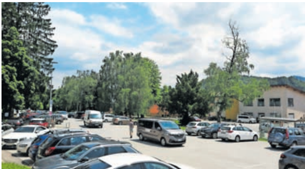
Čeprav je na parkirišču Štemarje največja gneča sredi dopoldneva, je še vedno moč najti prost parkirni prostor.

Popisovalci so opazovali javno dostopna parkirišča in si od zgodnjega jutra pa vse do poznega večera zapiso-