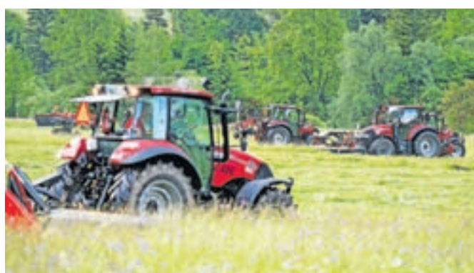
Traktorji Case, ki jih prodaja Agrometal, s SIP-ovimi priključki med delom na travniku v bližini smučišča v Mojstrani

Podjetje SIP Šempeter je predstavilo delovanje kosilnic, obračalnikov, zgrabljalnikov in pobiralnih zgrabljalnikov, podjetje Agrometal iz Ljubljane traktorje Case (s SIP-ovimi priključki), Gorenc Stare s Spodnje-ga Brnika pa vilice za prenašanje bal in česalo s sejalnico. Predstavitev si je ogledalo blizu tristo ljudi, med njimi so bili predvsem kmetje iz Zgornjesavske doline.