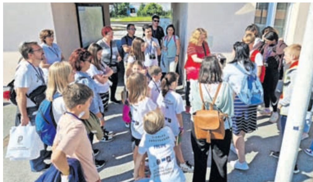
Učenci, ki so v Španiji svoje vrstnike navduševali nad knjigami slovenskih avtorjev, so se v Medvodah srečali tudi z učenci OŠ Preska.

Za svoje delo so ambasadorji ob svetovnem dnevu knjige prejeli medalje in posebna priznanja, za posebno