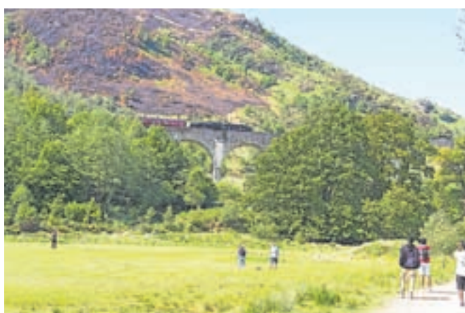
Viadukt Glenfinnan je zaslovel zlasti zaradi filma o Harryju Potterju. Vsako leto ga obiše več kot tristo tisoč turistov.