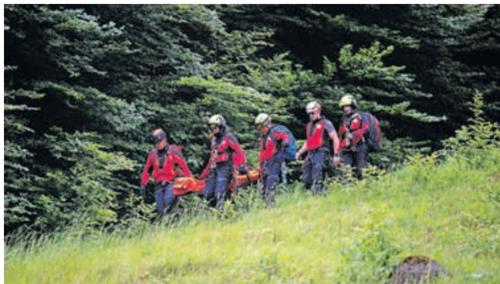
Na terenu so pripravili praktični prikaz gorskega reševanja s helikopterjem po scenariju ene od nesreč tujih državljanov, ki se je zgodila v preteklem letu.

Letos za zdaj GARS beleži nekaj manj nesreč kot v preteklem letu, kar je po njihovi oceni posledica dolgotrajnega obdobja slabega vremena v zadnjem času. »Pred glavno sezono, ki bo za gorske reševalce zagotovo ponovno zelo zahtevna, pa smo vsi skupaj, tako kot vsako leto, dobro pripravljeni, da v vsakem trenutku priskočimo na pomoč vsakomur, ki jo bo potreboval,« so še dejali.