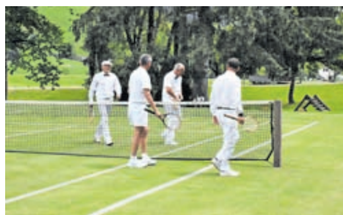
Minuli konec tedna so ob Dvorcu Visoko pripravili turnir Tenis v belem.