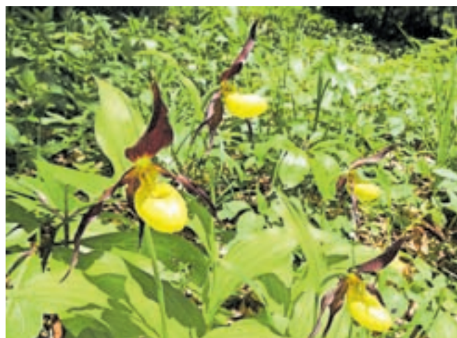
Za lepi čevljc, ki se mu latinsko reče Cypripedium calceolus , se med ljudmi uporablja tudi poimenovanje Marijini šolnčki. Roža pripada družini kukavičevk (Orchidaceae).