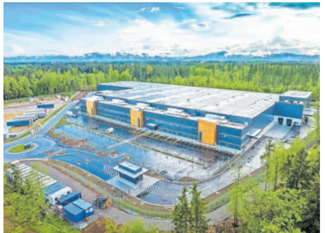
Nov obrat Bosch Rexroth Slovenija na Brniku se razprostira na 24.500 kvadratnih metrih površin.