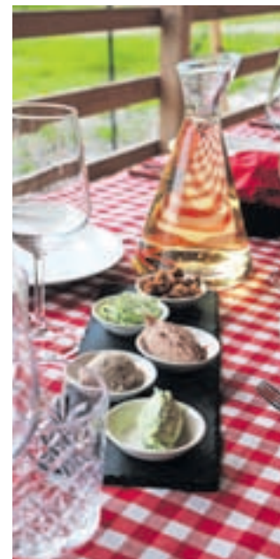
Slovenske večere z domačo glasbo in slovenskimi okusi bo ob petkih zvečer v Kranjski Gori gostila Oštarija.