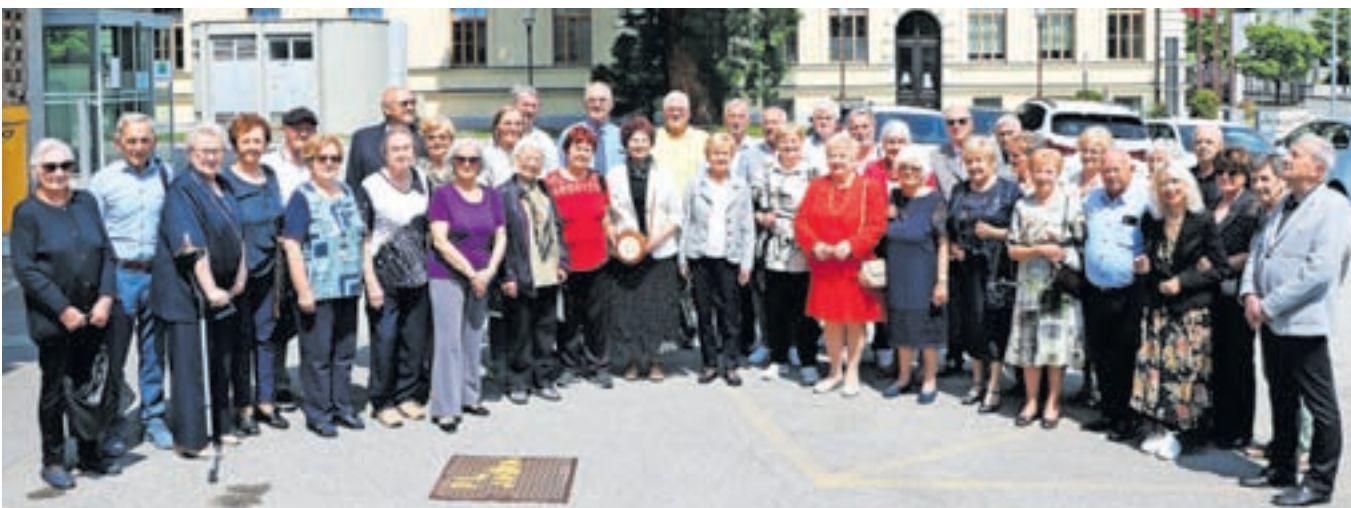
V njihovih časih, to je bilo pred šestdesetimi leti, je bila srednja tehniška tekstilna šola v Kranju edina tovrstna v takratni Jugoslaviji.