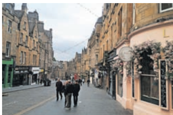
Edinburg je slikovito mesto, tudi mi pa smo bili navdušeni nad številnimi lepo urejenimi ulicami.

Dobre volje in polni nove energije smo se pripeljali v Liverpool ter nato proti otoku Man. (Se nadaljuje)