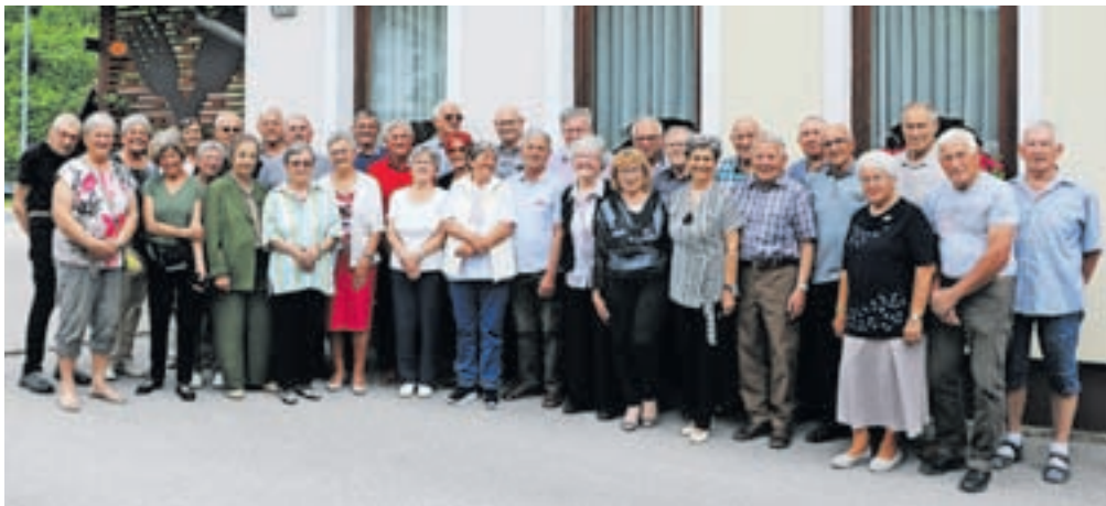
Srečali so se po šestdesetih letih, odkar so zapustili šolske klopi osnovne šole v Železnikih.

Izvem, da je bilo v njihovih časih na šoli pet razredov: kemijski, predilski, pletilski, tkalski in združeni razred, v katerem so bile recimo pletilje in šivilje, ki so bile pravzaprav že izučene za poklic in so se potem odločile, da nadaljujejo na Srednji tekstilni šoli v Kranju. Ker je bila srednja tehniška tekstilna šola takrat v