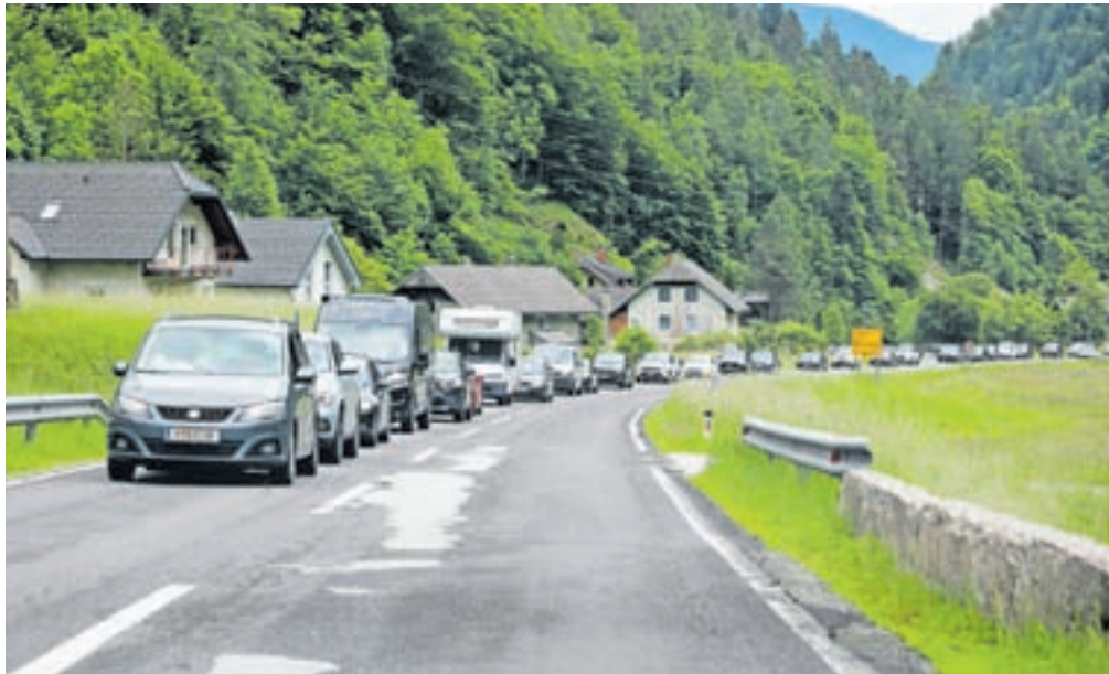
Gneča na cesti proti predoru Ljubelj na junijsko nedeljo / Foto: Tina Dokl

»V lokalni strategiji razvoja turizma, ki jo pripravljamo, bržda ne bomo predvideli ukrepov, povezanih z