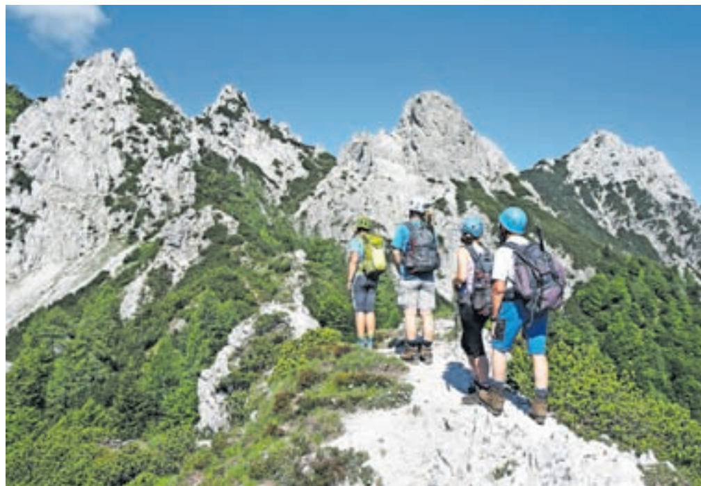
Atraktiven greben Ljubeljščice je precej krušljiv, zato od gornika zahteva trden korak.

razgleden, se steza povzpne na greben, po katerem nadaljujemo pot. Ves čas lahko zremo v severno ostenje Begunjščice in prelepi Šentanski plaz, ki je v zimskih mesecih vabljiv za turne smučarje. Obenem pa dokaj blizu, a še vedno kar daleč pred seboj gledamo roglje Na Možeh, še dlje za njimi pa znameniti Palec. Sredi bukovega gozda nas najprej presejati skala, ki jo obhodimo po desni strani. Ko smo okoli nje, nas smerokaz usmeri na Povno peč. Od tu naprej nadaljujemo po čistem, odprtem grebenu, ki ponekod postreže s precejšnjo zračnostjo. Ko dosežemo Ljubeljščico, vstopamo v svet, ki ga ne gre podcenjevati. Tudi tabla nas opozori, da je od tam dalje priporočljiva varovalna oprema. No, vsaj čelada je obvezna, za neizkušene pa tudi samovarovalni komplet. Pot se večkrat rahlo spusti po krušljivem terenu in vodi mimo izrazitih apnenčastih skal, ki bodo burile vašo domišljijo. A če boste opazovali skale, se ustavite, kajti bodite res skoncentrirani na pot, ki zahteva vso pozornost. Vmes vas bo velik napis Zelenica usmeril v pravo smer. Dosegli boste tudi skalni skok, ki