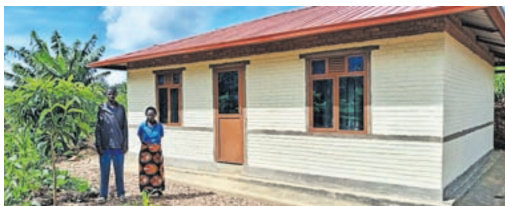
Hiša, ki so jo s pomočjo znanja in tehnologije podjetja Damahaus Prestige zgradili v Ruandi