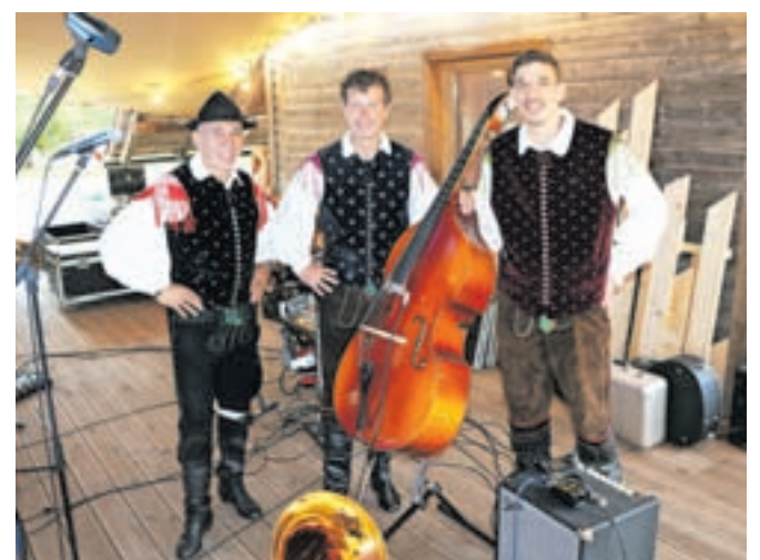
Skupina Projekt / Foto: Alenka Brun