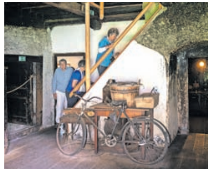
Ogled Pocarjeve domačije, ki s svojim videzom, bogato zbirko razstavljenih predmetov in zgodbo o Pocarjevih obiskovalcu pričara sliko življenja v krajih pod Triglavom od daljnih stoletij do danes

Fotografski delavnici je sledila botanična, na kateri so rastline poimenovali, potem pa so obiskovalcem v sodelovanju z Gornjesavskim muzejem Jesenice (GMJ) predstavili razstavo Vse arcnije iz rož narejene, ki je čez poletje na ogled v skednju Pocarjeve domačije. »Za postavitev razstave nas je navdihnil lik tete Pehte, znane zeliščarke iz Zgornjesavske doline. Gre sicer za staro izročilo, saj so ljudje že v pradavnini uporabljali zdravilna zelišča, si pomagali z njimi in znanje prenašali iz roda v rod. Vmes je uradna medicina to izročilo malo presekal, danes pa se spet vračamo k pomoči naravnih zelišč in lajšamo