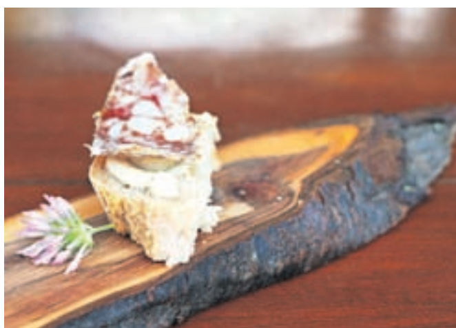
Pozdrav iz kuhinje: grizljaj domačega črnega kruha s suho klobaso v spremstvu zeliščne skute