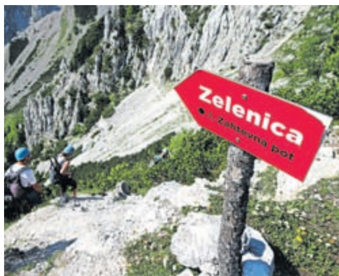
Smerokaz, ki nas usmeri proti Zelenici. / Foto: Jelena Justin

Nadmorska višina: največ 1704 m Višinska razlika: 820 m Trajanje: 4–5 ur Zahtevnost: ★★★★★