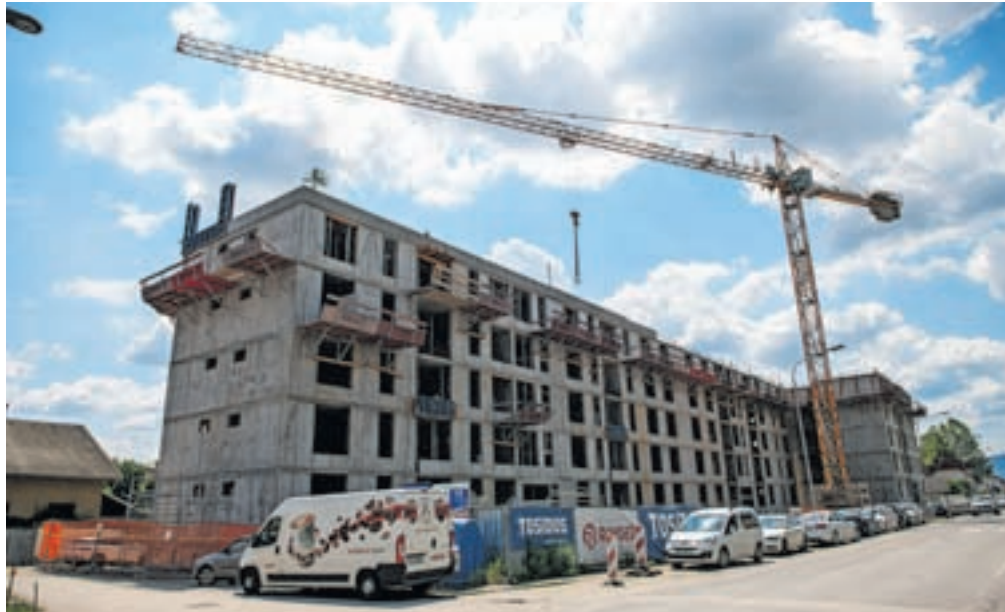
Kompleks D26 je sodobno zasnovan objekt, ki bo vključeval 66 stanovanj, od tega 30 oskrbovanih.

Lampič se je županu zahvalil za podporo in poudaril, da je gradnja stanovanj po projektu D26 velikega pomena za Kranj in Gorenjsko. Cilj investitorjev sicer ni samo gradnja običajnih stanovanj, temveč