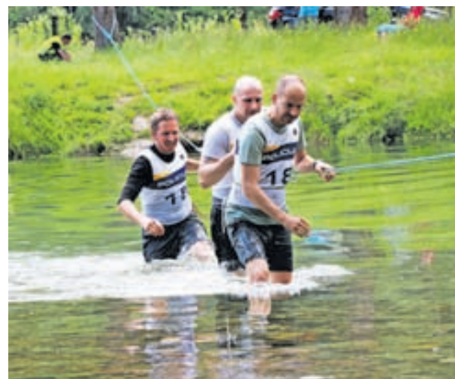
Tekmovanja se udeležijo le fizično in psihično najboljše pripravljene policisti, vojaki, gorski reševalci in gasilci.