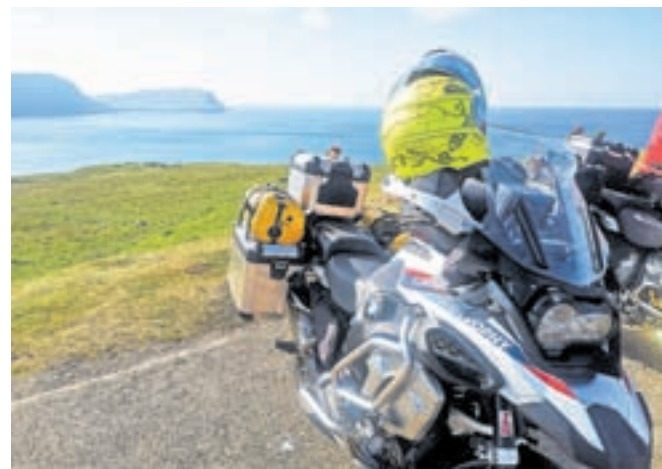
Po Škotski je moč potovati z motorjem, še več pa smo po poti srečali avtomomov.

Še bolj posebna je bila v naslednjih dneh škotska pokrajina, ki je z motorja morda še bolj zanimiva. Ledeniške doline in jezera so nas