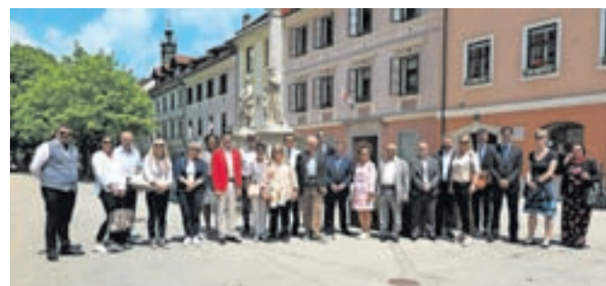
Veleposlanice in veleposlaniki, akreditirani v Sloveniji, so v prazničnem juniju tudi letos obiskali Škofjo Loko.

Veleposlanice in veleposlaniki, skupaj se jih je zbralo 22 iz 17 držav, so se nato sprehodili po mestu in obiskali Alejo zaslužnih Ločarov. Vse skupaj je nato čakalo še presenečenje, saj so odšli v zahodno krilo nekdanje vojašnice, kjer potekajo še zadnja dela pri urejanju novih prostorov škofjeloškega društva upokojencev. V novi večnamenski dvorani jim je zapel pevski zbor Vrelec in prejel glasen aplavz. Druženje so zaključili s kosilom v Gostilni Starman.