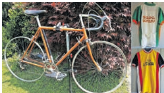
Specialka s konca sedemdesetih, kolesarski čevlji, dres Save Kranj in ŠD Jakob Štucin

S kolesom sem se vozil že prej. Konec sedemdesetih in v osemdesetih letih sem se vozil na svoji prvi specialki, ki jo še hranim kot spomin na tiste čase. Nekaj prijateljev se nas je včlanilo v športno društvo Jakob Štucin Hrastje - Prebačevo. V okviru društva smo kupili specialke, uvožene iz Italije. V tistem času je bilo kolesarstvo v Kranju zelo popularno.