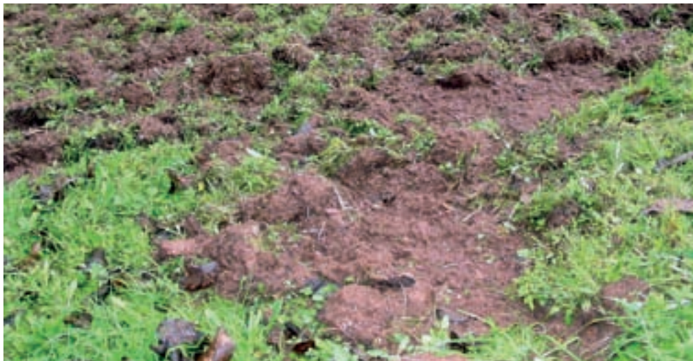
Po škodi, ki jo povzroča divjad, še zlasti divji prašiči, že šesto leto zapored prednjači lovišče Škofja Loka. Na sliki je eden od razritih travnikov na njihovem območju.

Največ škode, to je več kot petino celotne, je divjad v zadnjih dveh letih povzročila v lovišču Škofja Loka,