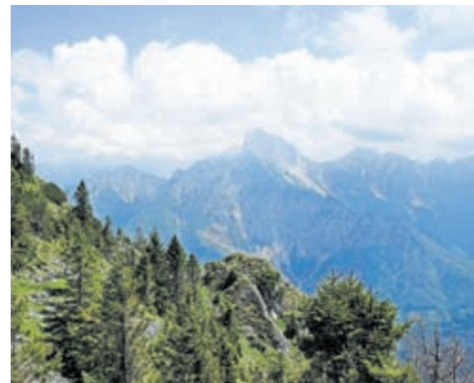
Z vojaške mulatjere se odpre lep pogled na Monte Sernio.

mestoma so odlično vidni ostanki gradnje poti iz časa prve svetovne vojne. Monte Tersadia je bila namreč v času prve svetovne vojne obrambna linija tirolske fronte, saj je zaradi svoje sredinske lege omogočala pregled nad vsemi dolinami. Mulatjera nas pripelje na sedlo Tersadia, na drugi strani spodaj zagledamo planino Valmedan Alta. S sedla zavijemo levo in se po travnatem pobočju, po katerem tudi vodi mulatjera, povzpemo vse do vrha. Pod vrhom Tersadie, na teh travnatih pobočjih, lahko vidimo ostanke različnih utrdb, pešpoti, rovov, utrjenih zavetišč za vojake itd. Te ostaline