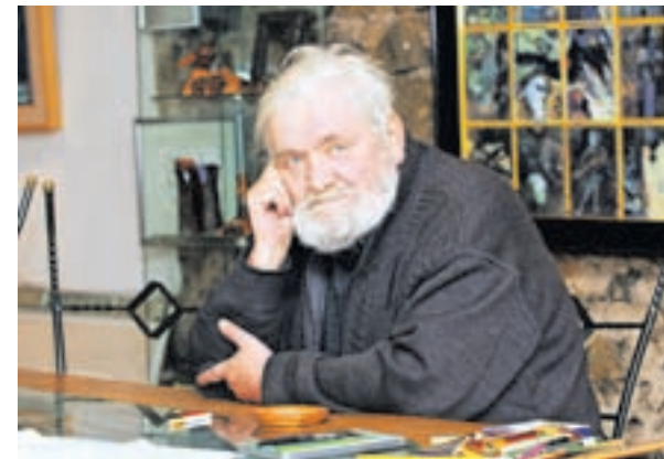
Tomaž Kržišnik

Umrl je slikar, oblikovalec, scenograf in likovni pedagog Tomaž Kržišnik, bil je tako žirovski kot slovenski umetnik. S svojimi deli je že v sedemdesetih inovativno zaznamoval slovensko likovno sceno, veliko ustvarjalnih in trajnih sledi pa je zapustil tudi v domačem kraju. Rodil se je 9. februarja 1943 v Žireh. Študiral je na Akademiji lepih umetnosti v Varšavi in na njej leta 1968 magistriral. Po vrnitvi je v letih 1973–1976 učil na Šoli za oblikovanje v Ljubljani, od 1988 pa na Oddelku za oblikovanje Akademije za likovno umetnost v Ljubljani, kjer je bil izvoljen v naziv rednega profesorja in se leta 2008 upokojil. Med obema pedagoškima obdobjema je deloval kot svobodni umetnik. Umrl je v domu starejših občanov v Žireh 22. maja 2023.