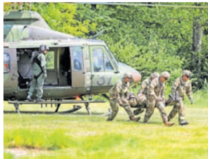
Pripadniki 132. gorskega polka 1. brigade SV so že osmo leto organizirali skupno usposabljanje na področju gorniških veščin.

nja s področja gibanja, preživetja ter bojnega delovanja v sredogorju in visokogorju. Vaja je bila razdeljena na dve fazi. V prvem tednu je bilo težišče na usposabljanju na področju individualnih vojaških gorniških veščin ter bojnih postopkov, v drugem tednu pa je bilo usposabljanje namenjeno kolektivnim nalogam iz taktike delovanja manjših taktičnih enot v gorah. V ta namen udeleženci vaje na območju Karavank od torka, 30. maja, do