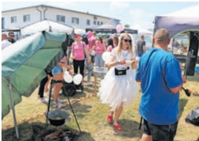
Bodoča nevesta se je oglasila s svojim golažem.

Nalanski Golažijadi je tretje mesto osvojila ekipa Top, drugi so bili Pogrej in pojej, prvi pa PGD Reteče - Gorenja vas. Slednji so tako osvojili tudi prehodni pokal – zlati kotel. Najizvirnejša ekipa pa je postala Dobr je. Letos so se karte malo premešale, in sicer v korist lanske najizvirnejše ekipe, saj je letos skuhala najboljši golaž in za eno leto dobila v varstvo prehodni pokal, drugo mesto je osvojila ekipa 1962, tretje pa Kanglece. Najizvirnejši pa so bili letos predstavniki Gasilske enote Gorenja vas.