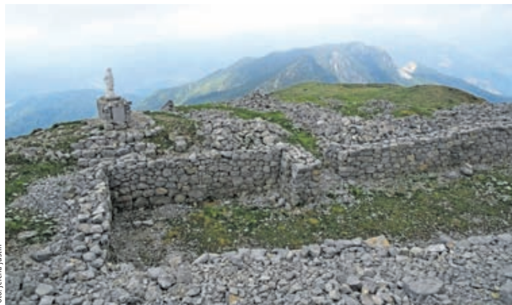
Na vrhu Monte Tersadia so ostaline iz časov prve svetovne vojne in kip Marije. Simbolno.