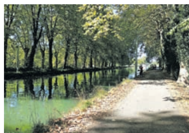
Kolesarska pot ob prekoku Canal de Garonne

prekopov so zapornice, kjer barke spustijo na nižji oziroma dvignejo na višji nivo.