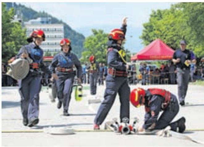
Tekmovanja Gasilske zveze Mestne občine Kranj se je udeležilo 66 desetin.

gasilskega društva (PGD) Mavčiče, ki so zmagale kar v šestih kategorijah (pionirji, pionirke, mladinci, mladinke, članice A in člani B), ob tem pa so dosegle še po tri druga in tretja mesta. Pri starejših gasilcih je zmagala desetina PGD Besnica, pri starejših gasilkah PGD Bitnje, pri članih A in članicah B pa ekipi PGD Predoslje.