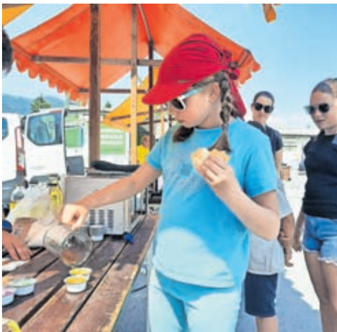
Veliko zanimanja je bilo za delavnico izdelovanja dišečih svečk.

dobili posodo za zbiranje odpadnega olja v gospodinjstvu. V Škofji Loki imamo že šest tovrstnih zbiralnic, postavili jih bomo še več. S tem omogočamo, da ljudje lahko od doma prinesejo odpadno olje v zbiralnice. Prikazujemo tudi t. i. kanal-jet, vozilo, s katerim čistimo kanalizacijo, kolega z vodovoda na stojnici prikazujeta, kako iščemo vodovodne okvare.« Posebno pa v zadnjih dveh mesecih promovirajo 60-litrski zabojnik za biološke odpadke. »Zelo zanimiva zadeva, na Gorenjskem zabojnika s takim volumnom še ni. S sortirnimi analizami črnega zabojnika smo ugotovili, da občani vanj odlagajo še do 30 odstotkov biološko razgradljivih odpadkov. Zato smo pripravili