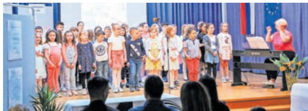
V Osnovni šoli Jakoba Aljaža Kranj so minuli torek odprli razstavo risb, ki so nastale na letošnjem 14. Dadinem likovnem natečaju.