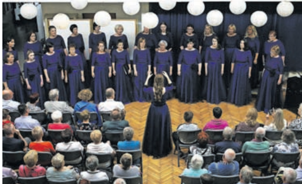
Ženski pevski zbor Dupljanke na sobotnem jubilejnim koncertu v Naklem

Na prazničnem večeru, ki sta ga vodila Neža Rozman in Marko Kavčič, je predstavnik Javnega sklada za kulturne dejavnosti