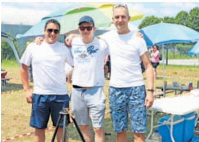
Ekipa Kanglece