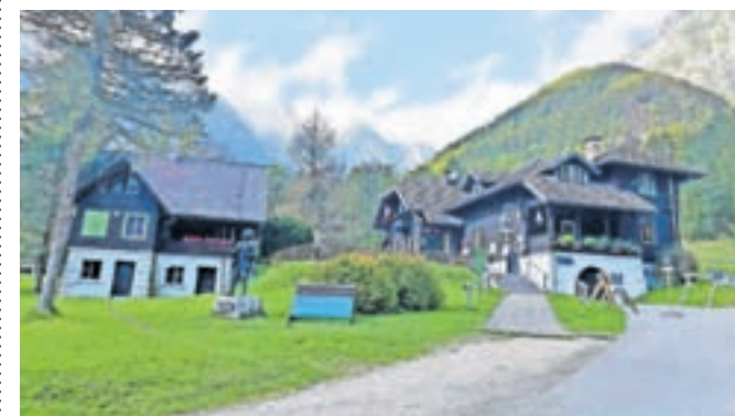
Dom v Kamniški Bistrici s pripadajočo depandanso

Po obnovi pritličnega dela se bodo v prihodnje lotili tudi zgornjega nadstropja in kleti ter terase, izpod katere bodo izkopali tudi cisterni, ki sta služili za shranjevanje kurilne-