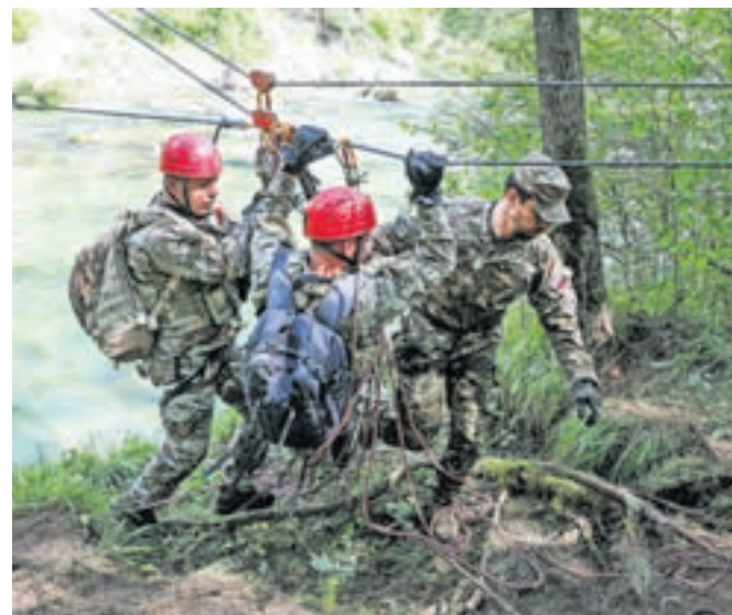
Dinamični prikaz usposabljanja na eni od delovnih točk v okolici Vojašnice Boštjana Kekca na Bohinjski Beli

Vajo so uradno odprli predzadnjo soboto v maju s slovesnim postrojem sodelujočih v Vojašnici Boštjana Kekca na Bohinjski Beli, a začela se je že teden dni prej. Sodelujoči so na območju Bohinjske Bele in Karavank ter na zelo različnih tipih reliefa ter v spremenljivih vremenskih razmerah v dnevno-nočnih pogojih preverili veščine in zna-