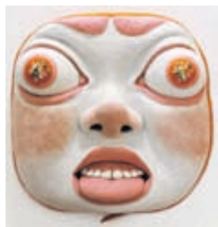
Umetniško delo Paola Pucka iz cikla Sonce / Foto: BIEN

Kranj – Letošnji BIEN bo Kranj (odprtje bo 31. maja ob 18. uri v Layerjevi hiši), povezal še s tremi slovenskimi mesti – Škofjo Loko (2. maja ob 17. uri, Miheličeva galerija), Jesenicami (6. junija ob 16.30, Stara Sava, Kolpern) in Novo Gorico (5. junija, Xcenter). Osrednja tema bienalne razstave je sonce – mit, legenda, sveto, tisto, ki ustvarja senco.