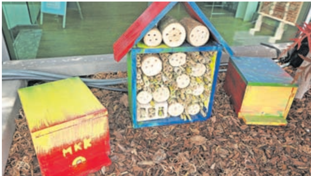
Otroci so lepo pobarvali bodoča žuželčja gnezdišča.