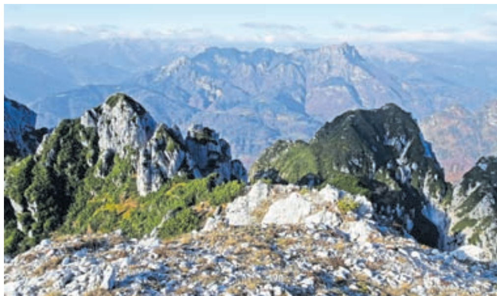
Naš današnji vrh, Monte Tersadia, fotografiran z vrha Cuel Mauron

Nadmorska višina: 1959 m Višinska razlika: 900 m Trajanje: 6 ur Zahtevnost: ★★★★★