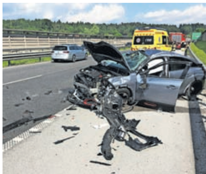
Vse nesreče so se končale z materialno škodo in lažjimi poškodbami udeležencev.

Prva nesreča se je zgodila nekaj minut pred 14. uro, ko je v bližini odcepa za Brnik 74-letni tuji voznik z osebnim vozilom zapeljal v obcestni jarek. Dobre pol ure kasneje je v bližini odcepa za Kranj vzhod 55-letni voznik avtomobila zaradi