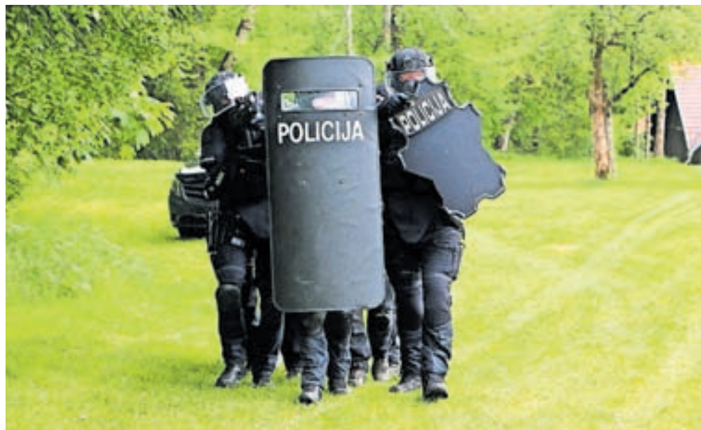
Ob tridesetletnici delovanja so policijski pogajalci in kriminalisti mobilnih kriminalističnih oddelkov v Gotenici pripravili tudi skupno prikazno vajo.

V.d.generalnega direktorja policije mag. Senad Jušić pa je v luči zadnjih strelskih