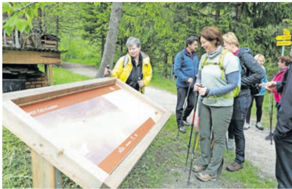
Prva informacijska tabla nas popelje na pot Čez Kamen.

Širše območje Srednje-ga Vrha je bilo leta 1998