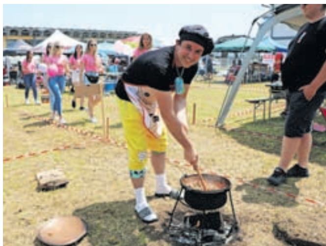
V ekipi Mitjeva fantovščina so kuhalnicona trenutke zaupali tudi ženinu.