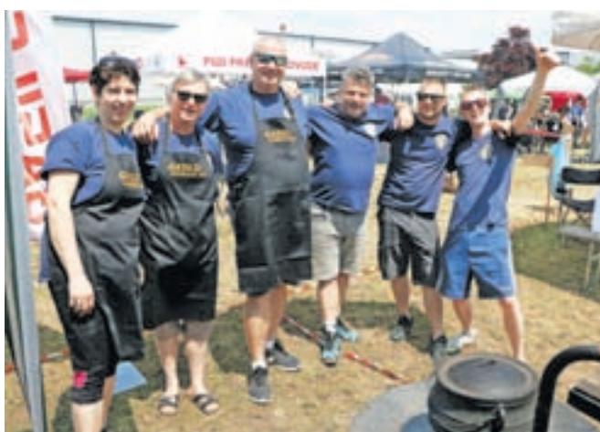
Nasmejani in dobro razpoloženi kuharji iz gasilskih vrst iz Gorenje vasi