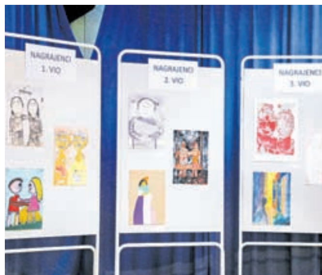
Nagrajene risbe