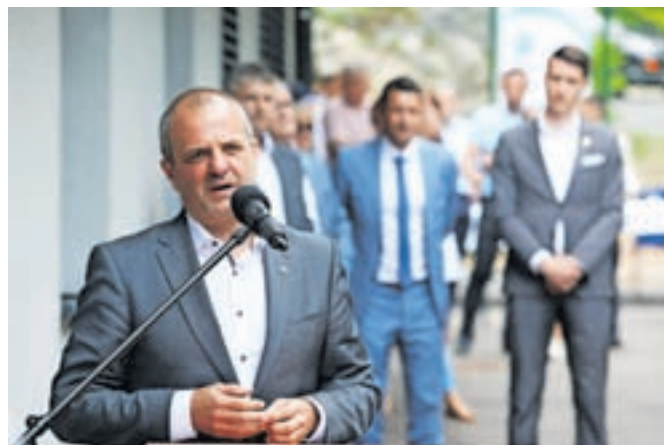
Minister za naravne vire in prostor Uroš Brežan

Minister Brežan je med drugim še povedal, da je bilo v iztekajoči se finančni perspektivi izvedenih 22 projektov vodooskrbe, za katere je bilo iz evropskega in slovenskega proračuna namenjenih 171 milijonov evrov; v novi perspektivi bo na voljo 92 milijonov, prioritarno – glede na lanskoletno sušo – za vodooskrbo slovenske Istre.