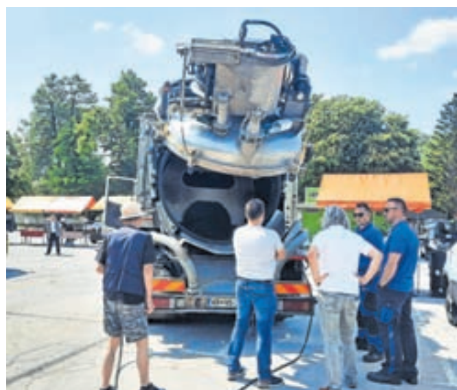
Predstavitve vozila za čiščenje kanalizacije / Foto: Klara Mrak

bil škodljiv za naravo. Prav zaradi tega ga gospodinjstva v Sloveniji najpogosteje nepravilno odlagajo, in sicer tako, da ga zlijejo v kuhinjsko korito ali straniščno školjko in s tem v javni kanalizacijski sistem. S tem ne tvegajo samo tega, da bi v svoj kanalizacijski sistem priklicali različne škodljivce ali tvegali njegovo zamašitev, temveč lahko povzročijo onesnaženje površinskih voda in podtalnice. Po strokovnih ocenah lahko en liter odpadnega olja onesnaži kar tisoč litrov vode. To pa je količina vode, ki jo povprečen odrasel Evropejec porabi v petih dneh.