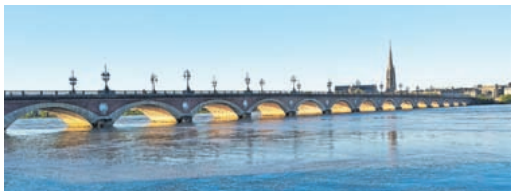
Bordeaux, Kamniti most (Pont de pierre) in bazilika sv. Mihaela

Prespali smo v mestu Valence d'Agén. Naslednji dan smo v bližini mesta Moissac srečevali veliko pohodnikov z nahrbtniki. V mestu je znamenita cerkev v nekdanjem benediktinskem samostanu, ki je pomembno postajališče na Jakobovi poti (Via Podiensis), ki poteka skozi mesto. Dan smo zaključili v Toulousu.