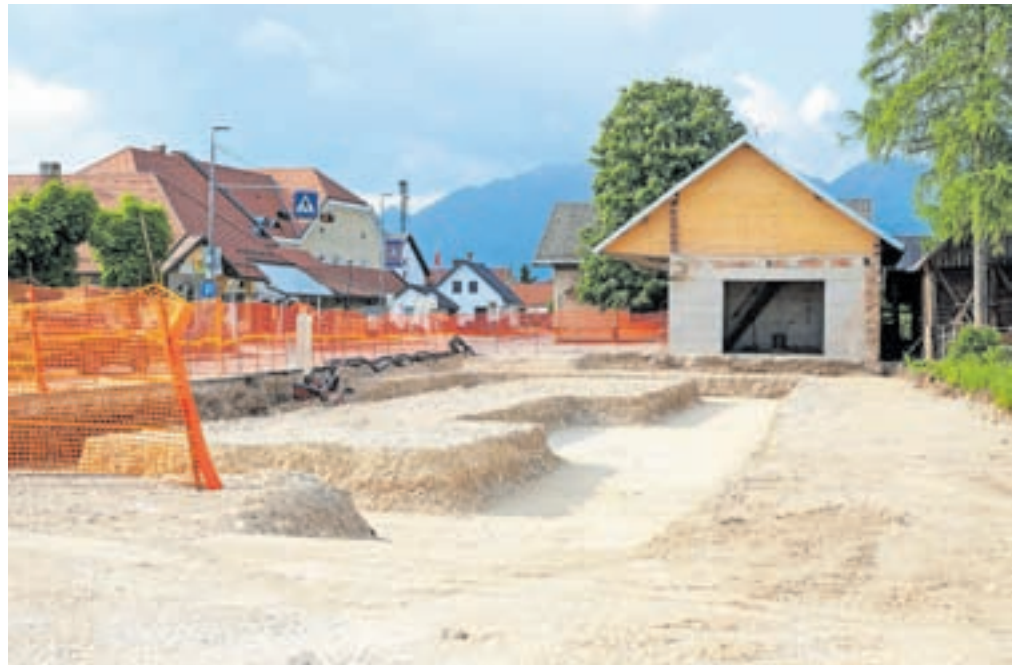
Zadruga gradi na Na Jami v Šenčurju novo trgovino s ponudbo za podeželane.

beljakovin, je bila povprečna dejanska odkupna cena 48,12 evra in je bila za 2,92 evra ali za 5,72 odstotka nižja kot marca. Odkupovalci so za mleko s 3,7 odstotka maščobe in 3,15 odstotka beljakovin plačali povprečno 40,13 evra za sto kilogramov, cena, izračunana glede na dejansko vsebnost maščobe in beljakovin v mleku, pa je znašala 46,08 evra. Odkupna cena se je znižala že četrti mesec zapored.