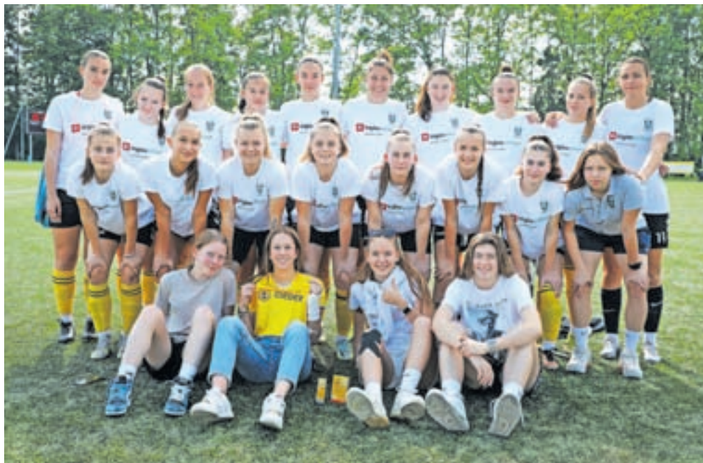
Ekipa ŽNK Radomlje Medex je prvenstvo zaključila na četrtem mestu.

igralk v naši ligi lahko imele velike izzive, tako da napredek iščejo v tujini. To je tudi eden izmed ciljev naše ekipe, da mladim talentiranim dekletom ponudimo priložnost, da se razvijejo, ko naredijo korak naprej, pa nadaljujejo pot v tujini. Kot klub pa si seveda želimo