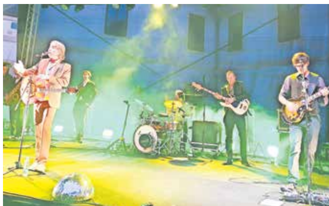
Navkljub rahlemu dežju je Magnifico navdušil obiskovalce koncerta na Loškem gradu.