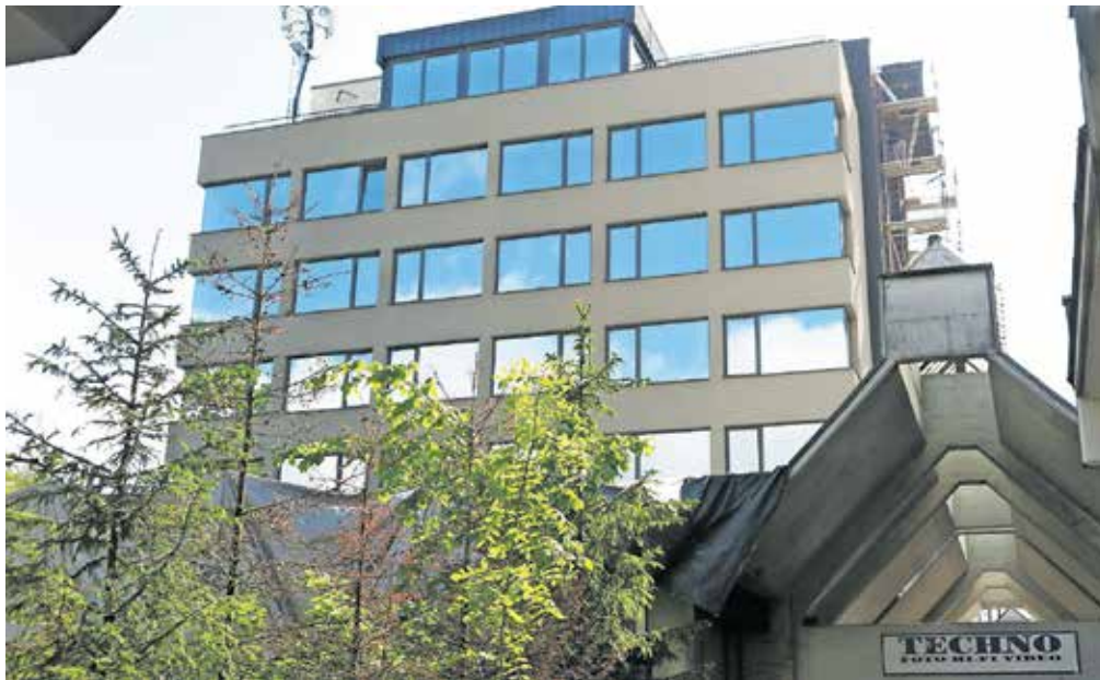
Hotel Lonca dobiva vedno lepšo podobo. / Foto: Vilma Stanovnik