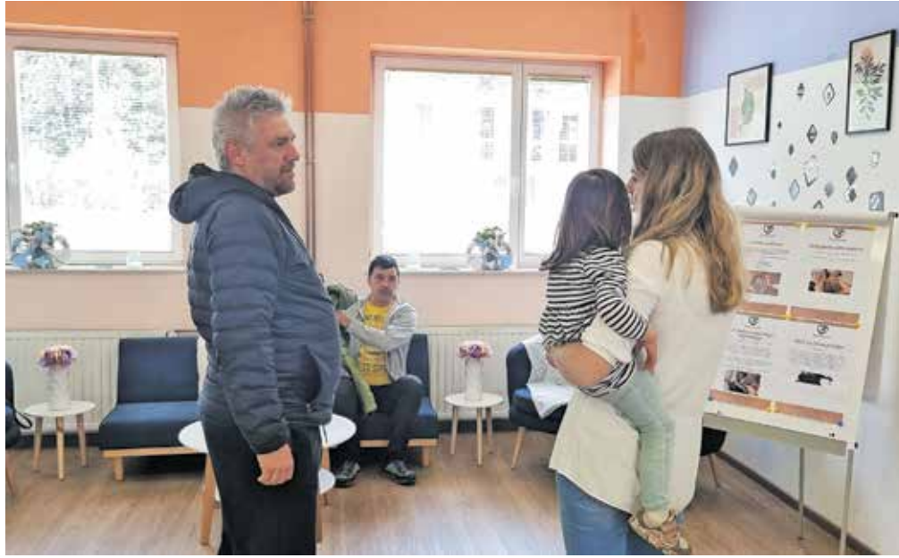
V Zavodu Generacije so v soboto pripravili dan odprtih vrat.

Na sedanji lokaciji imajo prostore že približno leto dni, a jih občani še vedno