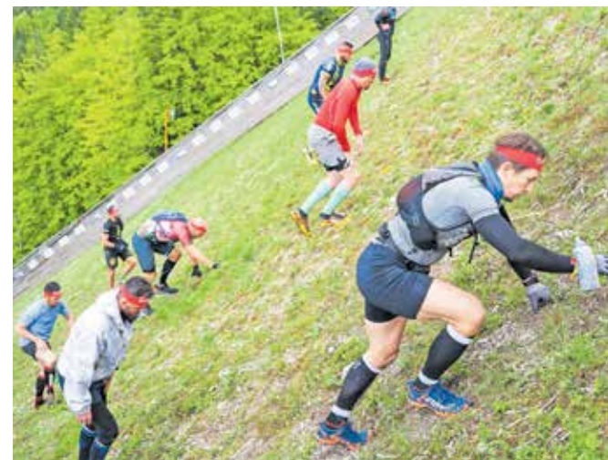
Vzpon po planiški velikanki ni mačji kašelj.

so se lahko pomerili na 800 metrov, tja do 15. leta pa na razdalji kilometra in pol ter treh,« je povedala in izrazila zadovoljstvo na obiskom tekmovalcev, saj so nekateri za planiško tekaško tekmo z ovirami prišli celo čez ocean. »Špartanci! so zares zelo posebni tekmoval-