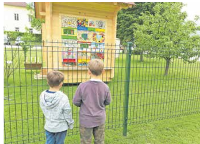
Novost vzbuja radovednost, kar je tudi eden od namenov postavitve učnega čebelnjaka na vidno mesto.

razkril, da sta prejela največ glasov, ter skupaj z drugimi govorniki poudaril pomen prizadevanj za ohranitev čebel in drugih oprasovalcev ter prenosa čebelarškega znanja na nove generacije. PRVA Pokojninska družba je s tem namenom v sodelovanju s Čebelarско zvezo doslej (v štirih letih) razdelila 16 učnih čebelnjakov.