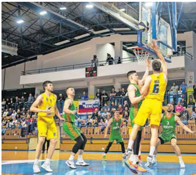
Košarkarji Gorenjske gradbene družbe Šenčur (v rumenih dresih) so se na prvi tekmi pred domačimi gledalci dobro upirali Cedeviti Olimpiji in izgubili za osem točk.

Prvo tekmo v Šenčurju so dobili z osmimi točkami razlike s 64 : 72, drugo doma, v ljubljanskem Tivoliju, pa bolj prepričljivo z 91 : 70. Šenčurjani so se favoritom v prvem polčasu dobro upirali, nato pa popustili. Že uvrstitev v polfinale je zanje izjemen dosežek, saj so tako daleč v državnem prvenstvu prišli sploh prvič. »Olimpiji čestitam za uvrstitev v finale. Na obeh tekmah so bili boljši od nas, še posebno na drugi.