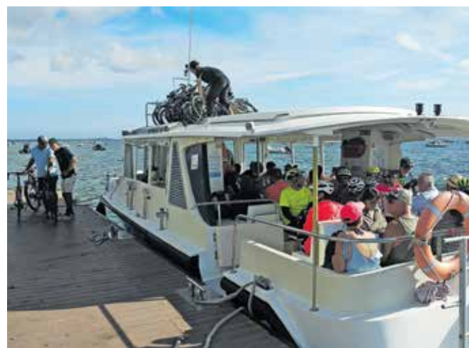
Z ladjico smo se peljali čez zaliv Arcachon.

Nadaljevali smo po kolesarskih poteh skozi gozdna to pokrajino ob obali. Pri svetilniku Coubre se je pot povsem približala morju. Kolesa smo pustili v gozdu in se bosili po mivki povzpeli čez