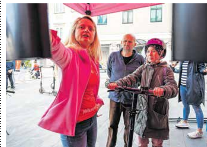
Simulator vožnje z e-skirojem otrokom omogoča prvi preizkus njegove uporabe v nadzorovanem okolju.

oziroma opravljenim kolesarskim izpitom. Zato jim želimo ponuditi prvi preizkus tega privlačnega mikromobilnostnega sredstva v nadzorovanem okolju, kjer lahko varno spoznajo nevarnosti in pasti vožnje. Simulator bo koristno orodje tudi za starše, ki se odločajo, ali e-skiro kupiti svojemu otroku, saj stroka starše opozarja, naj se za ta ko-