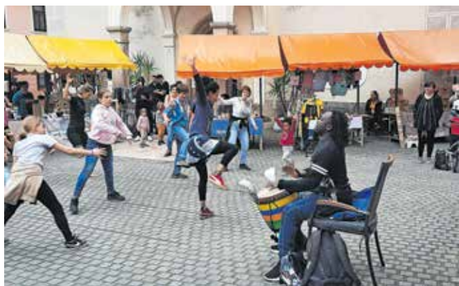
Na Luftu so pripravili tudi delavnice za odrasle in otroke.

da so tako tisti, ki obožujejo njegovi Silvijo in Od Ljubljane v Portorož, pa do tistih, ki so jim ljubše novejšje, Tivoli, Cici Mici in podobne, dobili, kar jim je ljubo. Koncertni konec tedna v Škofji Loki so v sobotnem večeru zaozkožili Perpetuum Jazzile, mesto pa so v soboto dodobra napolnili tudi obiskovalci letošnjega prvega Lufta, ki je bil tokrat v duhu Afrike.