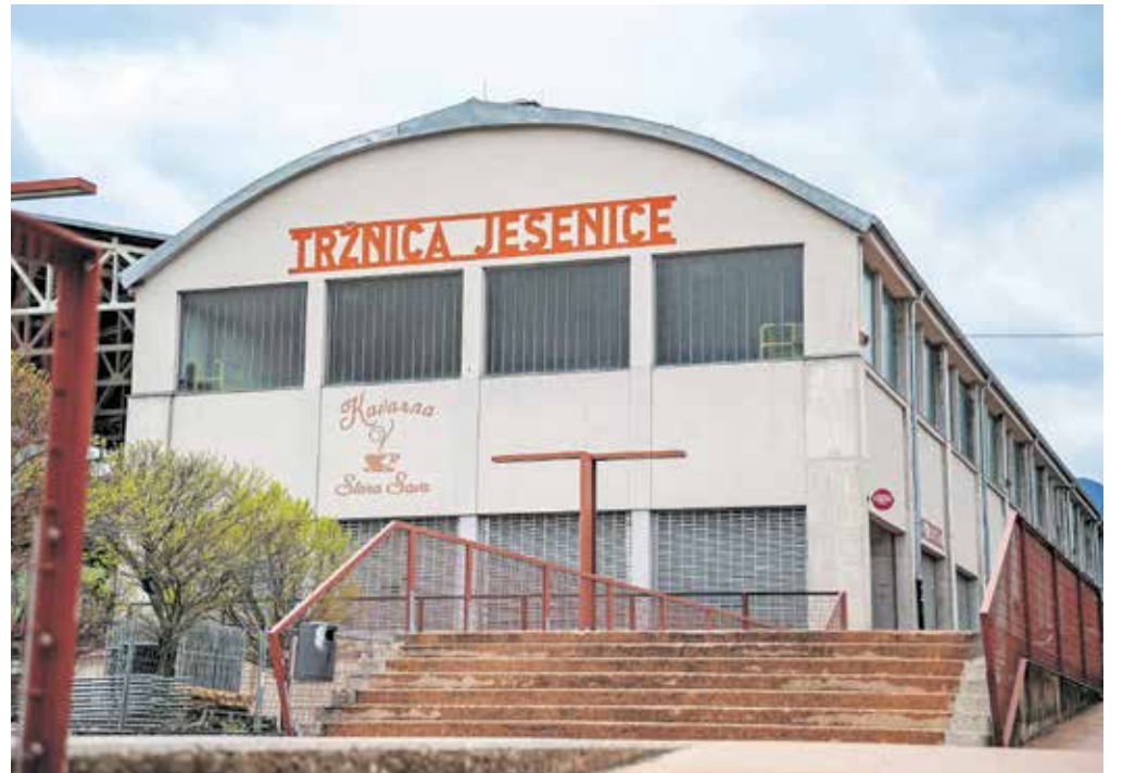
V sklopu tržnice deluje tudi kavarna, za katero je že od leta 2016 sklenjena najemna pogodba z najemnikom, in plezalna stena, ki jo ima v najemu Športnoplezalno društvo Jesenice.