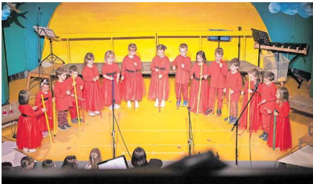
Program so pripravili zdajšnji in nekdanji varovanci vrtca.

tnim pedagogom razvijajo motoriko, spoznavajo angleški jezik, pa tudi raziskujejo svet umetniškega ustvarjanja in glasbe. Med drugim je