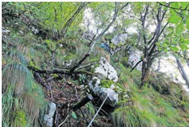
Detajl z zavarovane poti. Teren je zahteven. Dva kilometra, 1100 višinskih metrov.