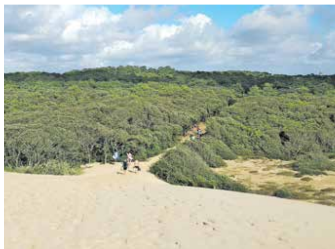
Po sipini navzdol pri svetilniku Coubre

Pri mestu Rochefort nas je pot pripeljala do reke Charente, kjer ob koncih tedna čez reko vozi brod. Glede na to, da je bil četrtek, smo morali narediti ovinek do mostu Pont Transbordeur (transportni most), nekakšne gondole za prečkanje reke iz leta 1900, ki je sedaj namenjena le kolesarjem in pešcem. Od približno dvajsetih podobnih transportnih mostov, ki so jih zgradili po svetu, jih je danes ohranjenih le še osem.