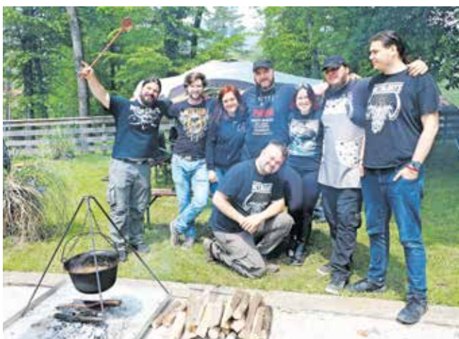
Ekipo Kovinarji so sestavljali ljubitelji metalske glasbe.

da so za ocenjevanje pripravile čim boljši golaž. Seveda je večina razmišljala o prvem mestu, vsaka ekipa je imela kakšno svojo skrito sestavino, dodelan babičin recept ali se je kuhanja golaža lotila kar družinsko. Eni so pražili čebulo le pol ure, drugi tri ure. Tudi kurišča so se med seboj zelo razlikovala – kotle so namreč tekmovalci priskrbeli sami, okoli njih pa je bilo prav veselo. Vreme jim je šlo na roko, tako da se je tekmovalje v pripravi najboljšega golaža na koncu razvil v prijetno druženje. Med