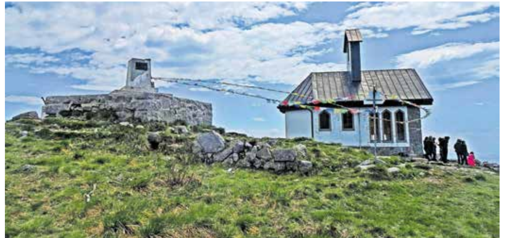
Na vrhu Matajurja, ki so ga staroverci imenovali Velika baba

Ko vztrajno sledimo grebenu in premagujemo zavarovane odseke, smo pred