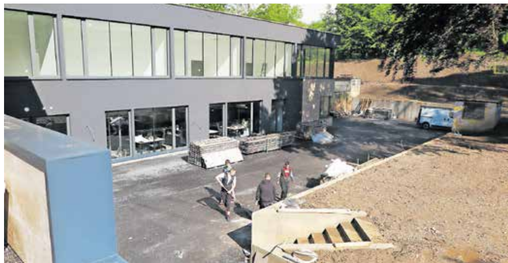
Tudi okolica hotela bo temeljito prenovljena.

Prenova hotela je vredna okoli pet milijonov evrov,