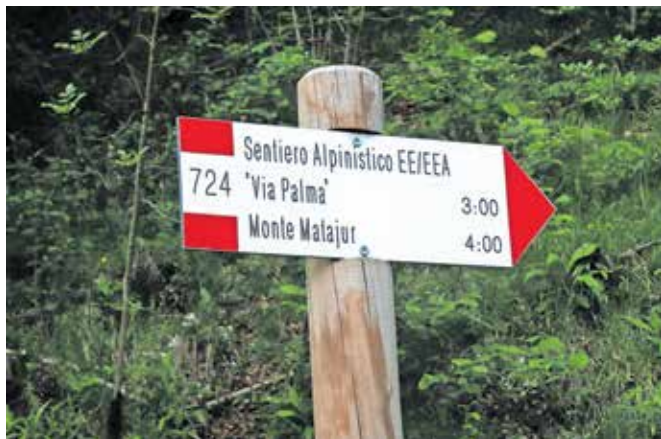
Tale pot nas čaka. Lepe časovnice, kajne? Take ta prave hribovske.

Nadmorska višina: 1642 m Višinska razlika: 1427 m Trajanje: 7 ur Zahtevnost: ★★★★★