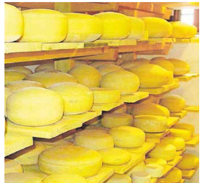
Gorenjske kmetije so prejele veliko priznanj za mlečne izdelke. Slika je simbolična.