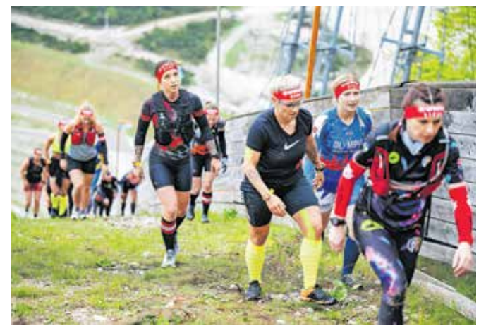
Na teku z ovirami Spartan Race Kranjska Gora hosted by I Feel Slovenia se je preizkusilo več kot 2400 tekmovalcev iz 37 držav.