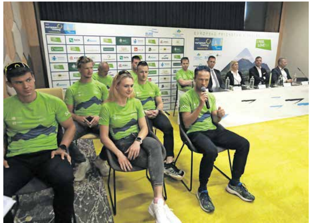
Slovenski tekmovalci in prireditelji so pripravljani na začetek evropskega prvenstva v veslanju na Bledu.

Odprtje prvenstva bo jutri ob 18. uri v Veliki Zaki, v četrtek (od 9. ure do 13.30) in v petek (od 9. do 16. ure) bodo predtekmovanja in repasaži, v soboto (od 9. do 15. ure) in v nedeljo (od 9. do 14. ure) pa polfinali in finali.