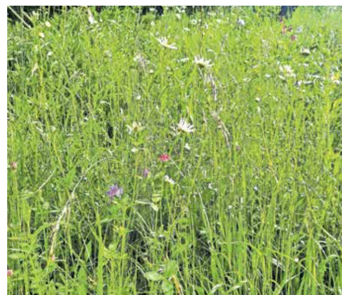
Cvetočih travnikov je vse manj

Zakaj bi bilo nujno, da ohranimo še tisto peščico »starih travnikov«, na katerih