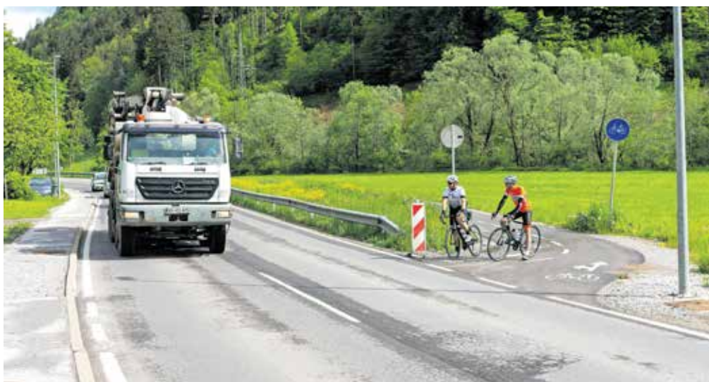
Načrtovano kolesarsko stezo nameravajo navezati na lani zgrajeni odsek od Selc do začetka Studena, kjer se sedaj kolesarji na regionalno cesto vključujejo na slabo pregledni lokaciji tik za ovinkom.