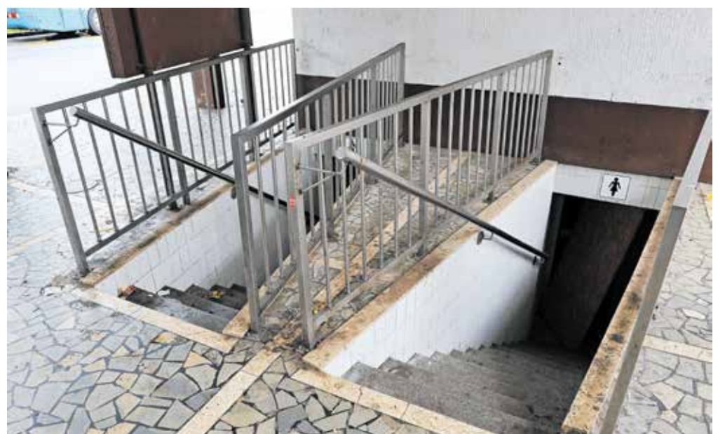
Zanemarjeno zaprto javno stranišče na radovljiški avtobusni postaji bodo zdaj vendarle prenovili.

»Nove sanitarije bodo nadomestile obstoječe v kletni etaži, ki tehnično ne ustrezajo današnjim potrebam. Urejene bodo v pasaži med obstoječo čakalnico in administrativnim delom postajnega objekta in bodo ustrezale vsem sodobnim standardom. Ustrezna higiena