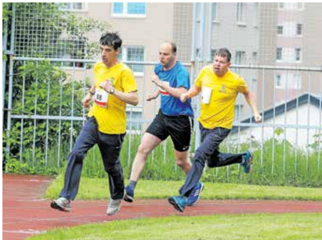
Vsi tekmovalci so se borili do zadnjega.

Jesenice – Na Osnovni šoli Prežihovega Voranca Jesenice so v soboto, 20. maja, pod organizacijskim vodstvom Osnovne šole Poldeta Stražišarja potekale že 28. regijske igre specialne olimpijade Gorenjske. Skozi dopoldan se je v teku na 50, 100, 200 in 400 metrov, košarkarskih elementih, namiznem tenisu, skoku v daljino in metu žogice pomerilo približno 150 športnikov z motnjo v duševnem razvoju, katerih skupno geslo je Pustite mi zmagati, če pa ne morem zmagati, naj bom pogumen v svojem poskusu. Na igrah je sodelovalo enajst ekip, in sicer Cirus Kamnik, Sožitje Kamnik, Sožitje Mengeš, CUDV Radovljica, Sožitje Jesenice, Kranjska Gora in Žirovnica, Sožitje Radovljica,