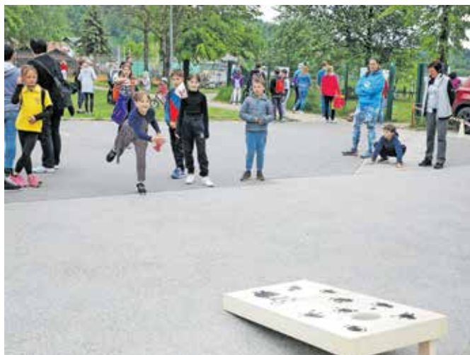
Preizkusili so se lahko tudi v igri štrbunk, ki so jo izbrali za najboljšo igro festivala Turizmu pomaga lastna glava.