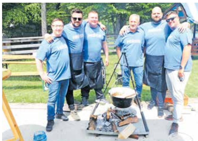
Gorenjska zasedba: razpoložena ekipa Hiško