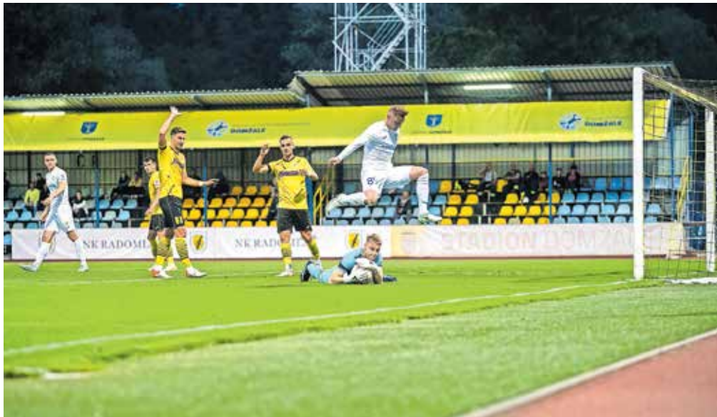
V zadnjem krogu Prve lige Telemach sta se pomerili edini ekipi s širšega Gorenjskega med elito. Domžalam (v belih dresih) ni uspelo zatresti mreže Kalcerja Radomlje, so si pa kljub porazu priigrale Evropo.