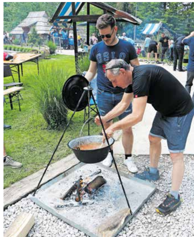
Mešanje golaža je bilo eno izmed najpogostejših opravil.

Čevap, Pikapolonice, Kovinarji, Štajersko-gorenška naveza ... Na koncu je tretje mesto osvojila ekipa Rožmarin, drugi so bili Golaž majstri, prva pa ekipa Liam.