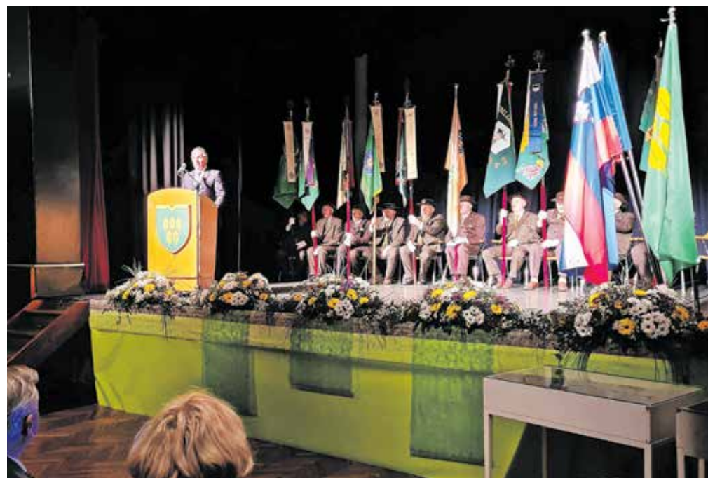
Slavnostni govornik, predsednik Državnega sveta RS Marko Lotrič, in praporščaki na slovesnosti, ki so jo ob svetovnem dnevu čebel pripravili na Breznici, rojstni vasi Antona Janše

Kot je še poudaril Lotrič, so čebele tudi zanesljiv kazalnik, kako dobro skrbimo