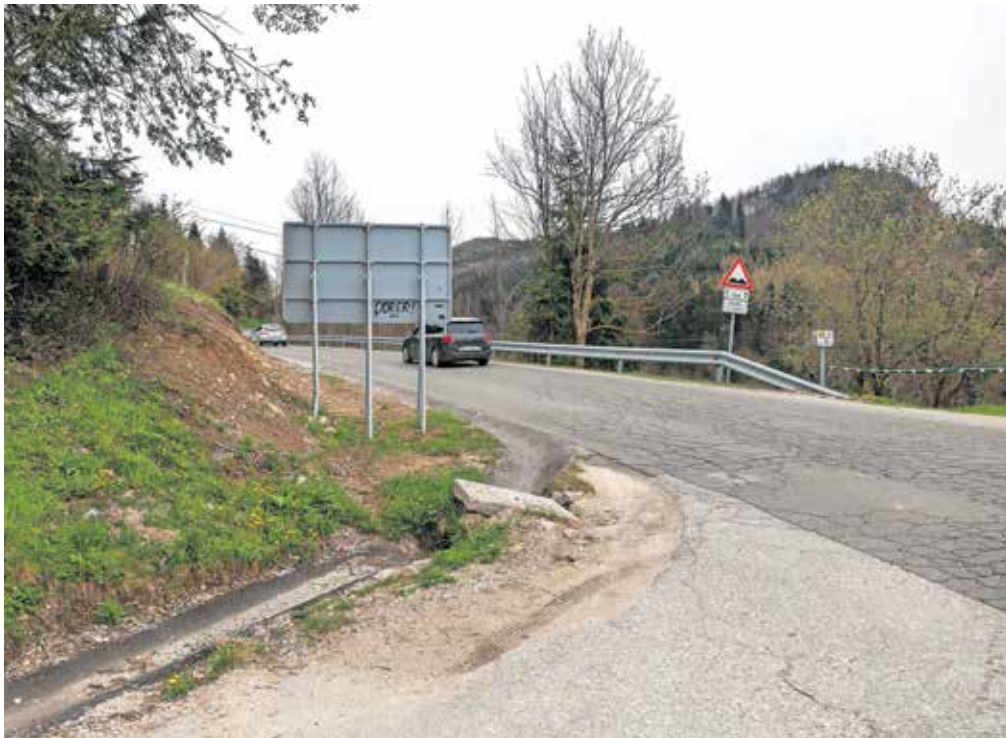
Že sicer nepregledno križišče še dodatno zastira velika usmerjevalna tabla.

nameščene tik ob križišču in zastirajo pogled, kjer je vidljivost zaradi ovinka že tako slaba, hitrost pa omejena na devetdeset kilometrov na uro. »Zaradi neprimernega križišča oz. ovinka morajo številni (pre)težki tovornjaki in predvsem šolski izletniški avtobusi za vožnjo proti Veliki planini in z nje iti obrnit na prelaz Črnivec.« nadaljuje Štupar. V praksi sicer marsikdo pelje mimo križi-