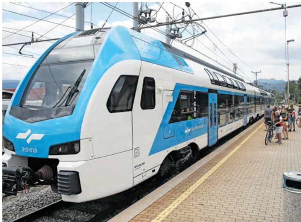
Slovenske železnice posodablajo vozni park, kar zagotovo prispeva k večji privlačnosti javnih prevozov. Tako so lani zaključili nakup 52 sodobnih vlakov, do konca prihodnjega leta pa jih nameravajo kupiti še dvajset.

Po novem bo vsaki vrsti vozovnice določena zgornja