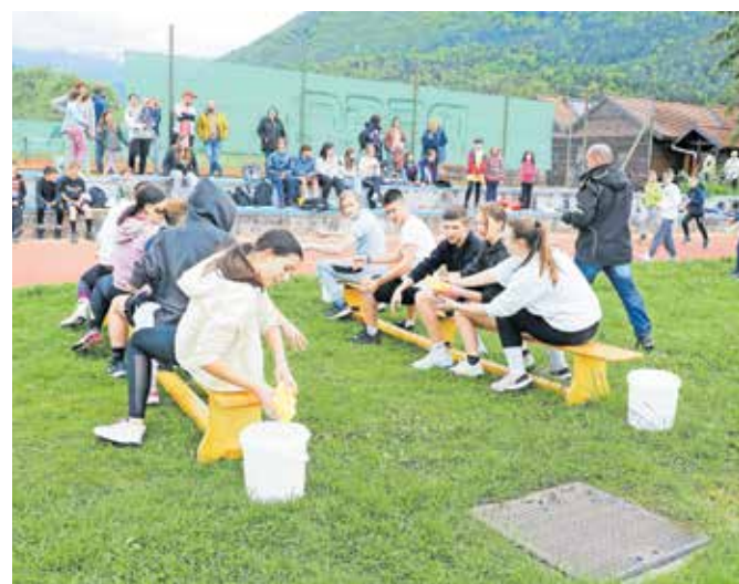
V OŠ Križe je minuli četrtek potekal športni festival mladih Fridijada.