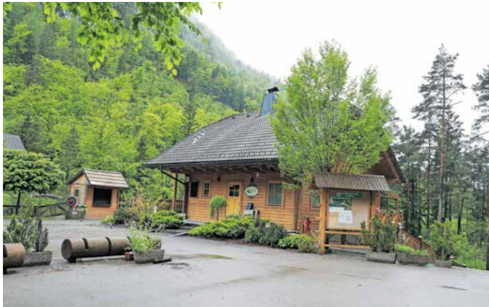
Okrepčevalnico Zavrh bodo v tem tednu po petih mesecih znova odprli.

Koselj, so nedavno dobili novega najemnika, ki bo poskrbel za ponovno odprtje, v kratkem pa bo okrepčevalnico prevzel tudi novi lastnik.