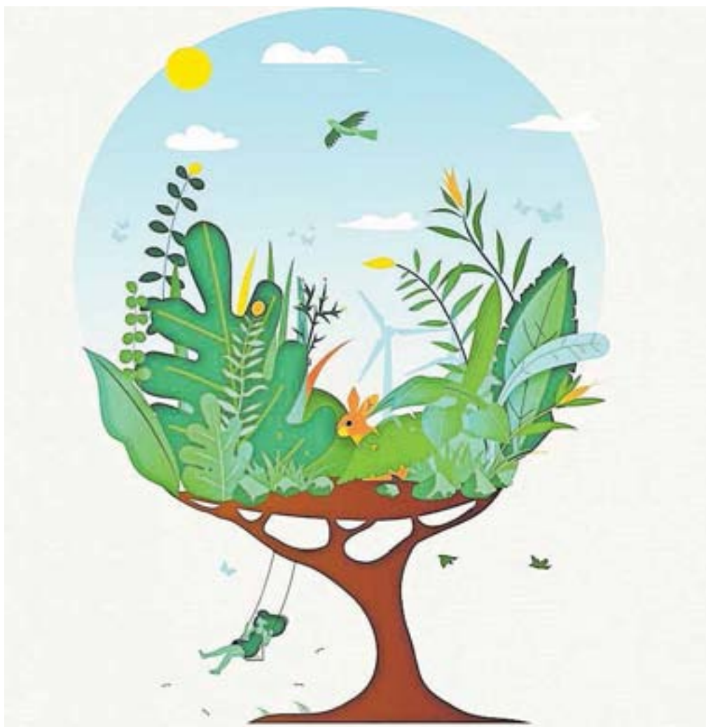
Podoba, ki povezuje muzeje v letošnji temi mednarodnega dneva muzejev

Seveda pa bodo muzeji po Sloveniji praznik počastili s številnimi dogodki in programi ali z dnevom odprtih vrat. Nekateri izmed njih se predstavljajo tudi v Gorenjskem glasu.