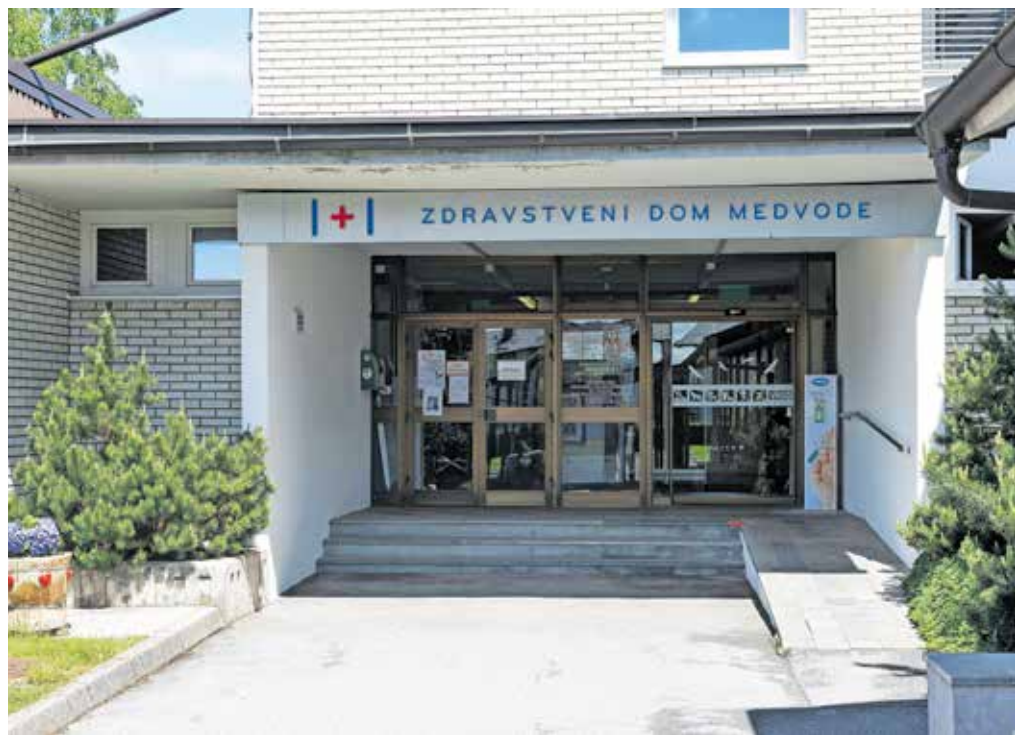
V Zdravstvenem domu Medvode, kjer je devetdeset zaposlenih, nimajo prav nobenega koncesionarja.