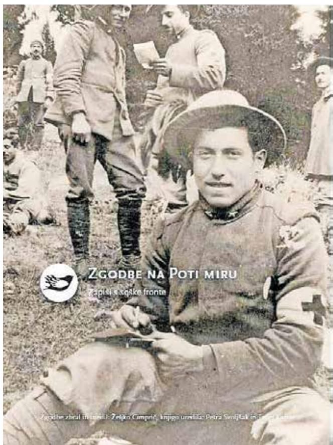
Naslovnica knjige Zgodbe na Poti miru

lahko kupite v Kobariskem muzeju ali Slovenskem planinskem muzeju, velja eno leto in omogoča kar od 25- do 30-odstotni popust. Kobariski muzej je odprt vsak dan od 9. do 18. ure.