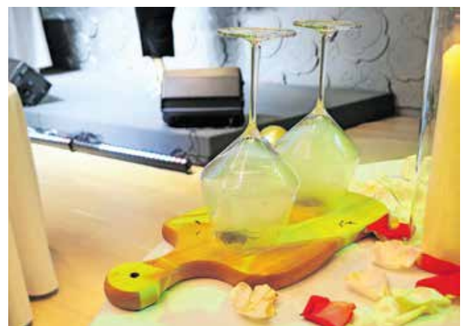
Gin s tonikom so postregli v »dimljenem« kozarcu.