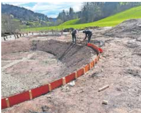
Rekreacijsko središče Log – gradbena dela

Občina Gorenja vas - Poljane je uredila novo rekreacijsko središče Log, ki leži v neposredni bližini središča Gorenje vasi. V njem je manjši ribnik, ki bo služil za izobraževanje o avtohtonih živalskih in rastlinskih vrstah, obenj je umeščen tudi trim otok s telovadnimi postajami. Načrtovan je tudi zeleni zasajen hrib, za katerim bo umeščen manjši prostor za piknike s klopmi in mizami. Do središča se dostopa po urejeni pešpoti iz javne poti ob Poljanski Sori, ribnik pa je dostopen po manjših pomolih. V okolici bo je nameščena urbana oprema (klopi, stojala za kolesa), igrala za