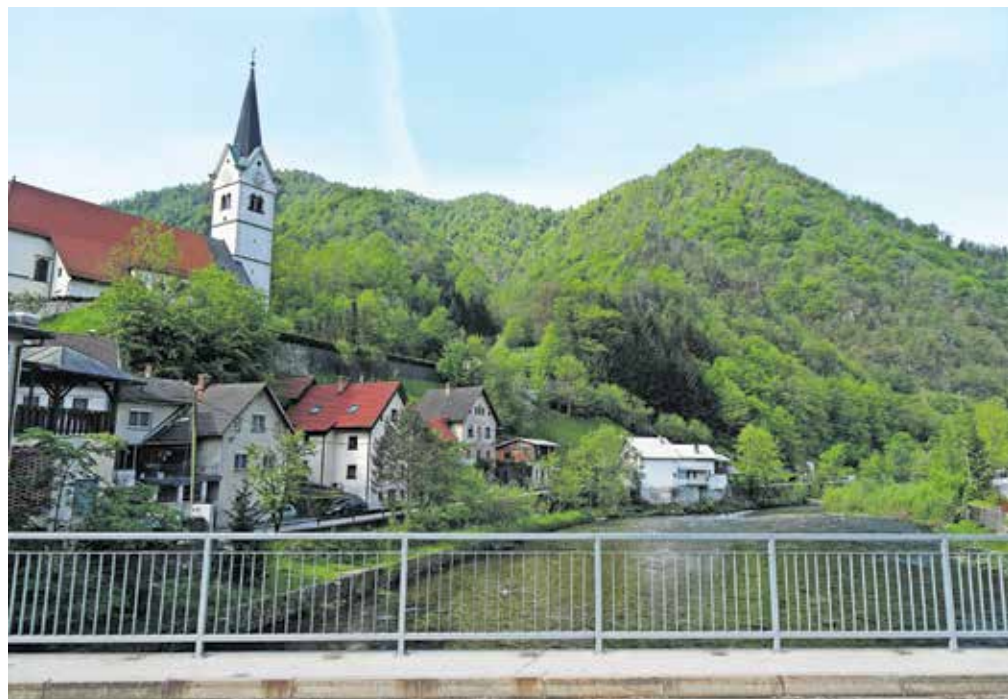
Pogled na greben iz Spodnje Idrije

se povzpemo po senožeti, kjer je drevje trenutno v bujnem razcvetu. Na naši levi kot vojaki stojijo strumne smreke. Pot se za trenutek položi in zavije malce bolj v levo. Globoko pod nami, na naši levi strani, je Šolska grapa. Steza se precej strmo vzpenja in približno po 15 minutah smo na razpotju, kjer levo vodi smerokaz Cerkovni vrh/Lom, desno pa pot Pod Vranjim grebenom. Zavijemo desno. To je naša Pr'farska gamsarica. Zakaj tako ime? Ker se začne pri Fari in ker bomo na tej prečni poti zagotovo videli gamse. Pot se ves čas prečno vzpenja, ponekod precej strmo. Naj opozorim, da je steza občasno težje sledljiva, ker je na njej kup podrtega drevja, ravno tako je