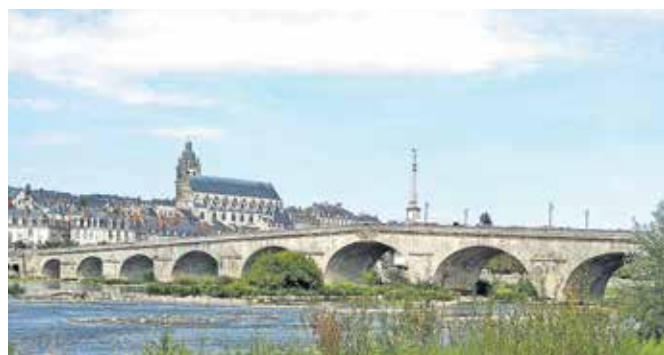
Blois, kamniti most čez Loaro, v ozadju je stolnica sv. Ludvika.

Lansko leto septembra smo se s kolesi potepali po Franciji, ob Loari, Atlantiku in kanalu dveh morij, ki povezuje Atlantik in Sredozemsko morje. Potovanje smo začeli v Orleansu in kolesarili ob Loari do Angersa, kjer smo zapustili reko in kolesarili proti La Rochelle