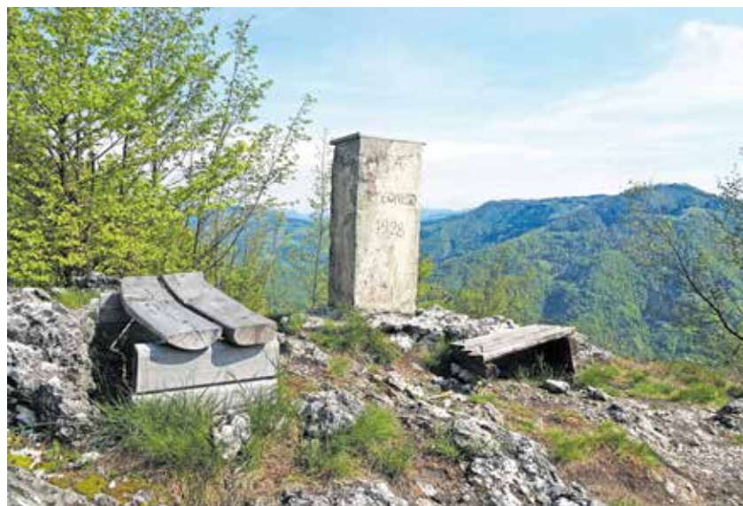
Vrh Cerkovnega vrha (Lom) / Foto: Jelena Justin

Nadmorska višina: 808 m Višinska razlika: 500 m Trajanje: 4 ure Zahtevnost: ★★★★★