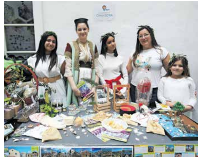
Učenci in učiteljica OŠ Daša Pavičiča so predstavili Črno goro.

»Na Gorenjsko smo prišli že v torek zvečer, v soboto se vračamo v Črno goro. Ogleдали smo si Kranj, obiskali tamkajšnjo Osnovno šolo Franceta Prešerna, s katero sodelujemo že od leta 2018. Ogleдали smo si tudi Radovljico z okolico; učenci so