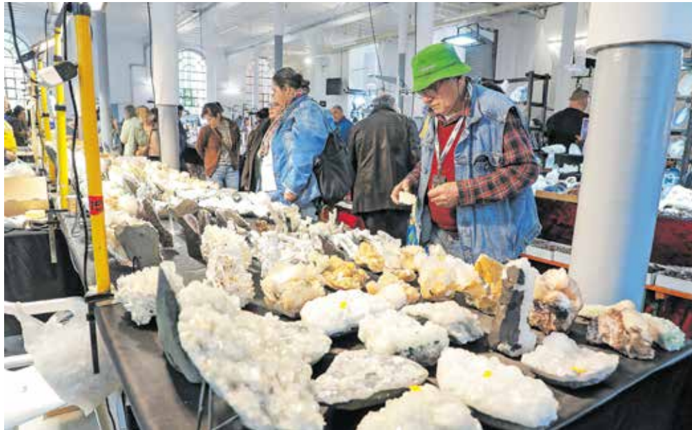
Že 49. Minfos je zaživel v vsem svojem mineralno-kristalnem čaru in obiskovalcem postregel s pravnjo mero naravnih danosti, ki jih je predstavljalo več kot šestdeset razstavljalcev.