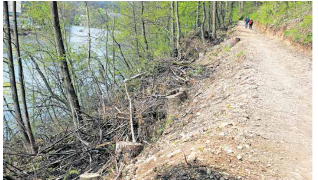
Po februarjem poseku obolelih dreves so ob pešpoti do Struževega ostali številni kupi vej.

»To, kar se je zgodilo v drevoredu, je masaker nad naravo. Ljudje so zgroženi, ne morejo verjeti. Vse skupaj je videti, kot da smo na vojnem območju, kot bi padla bomba. Razumljivo, da je bilo treba stara, podrti in nevarna drevesa podreti in odpeljati. Toda ne na tak način, to je nesprejemljivo in nerazumljivo. Uničena cesta, uničene klopce, uničeno drevje in grmovje, ogromni kupi vej in lesa, izruvani štori, ostanki tudi večjih podrtih dreves. Za povrhu vsega je ogromno kamenja, vej in lesa porinjenih direktno v strugo reke Save! Hlodovina, ki se bo lahko prodala, je bila odpeljana. Vse ostalo, kar ni nič vredno, je