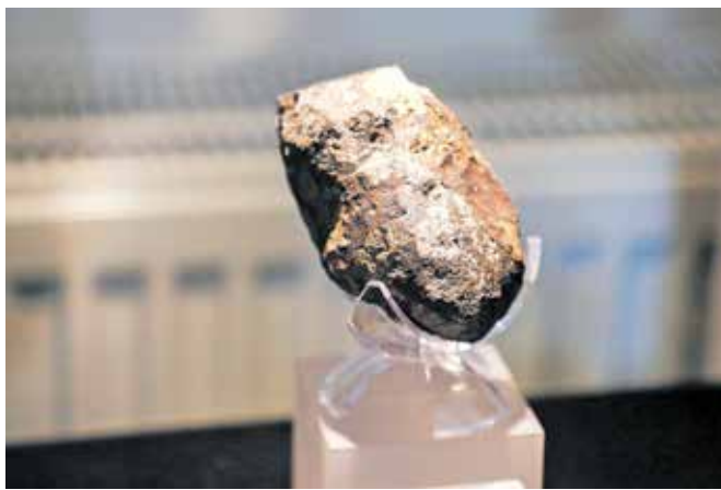
Največji kos meteorita, ki so ga našli v bližini Novega mesta

izobraževalni aspekt, saj obiskovalcem omogoča, da se z naravnimi danostmi spoznajo na bolj poglobljen način in ne samo z estetskega vidika. Oddelek za geologijo je ponudil razstavo Z(a)vito o polžih, na kateri se je bilo mogoče spoznati s primerki fosilnih polžev iz njihove geološke zbirke in pridobiti znanja o vrstah polžev, ni-