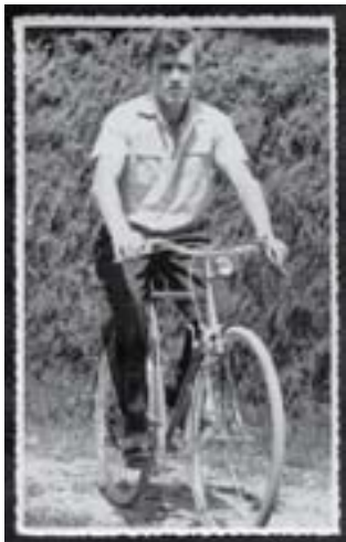
Fotografija iz mladosti

Želel je postati mizar, vendar je tako naneslo, da se je mlad zaposlil. Oče mu je kupil kolo, da se je lahko vozil v »fabriko«. Kljub temu pa je našel čas za svojo strast,