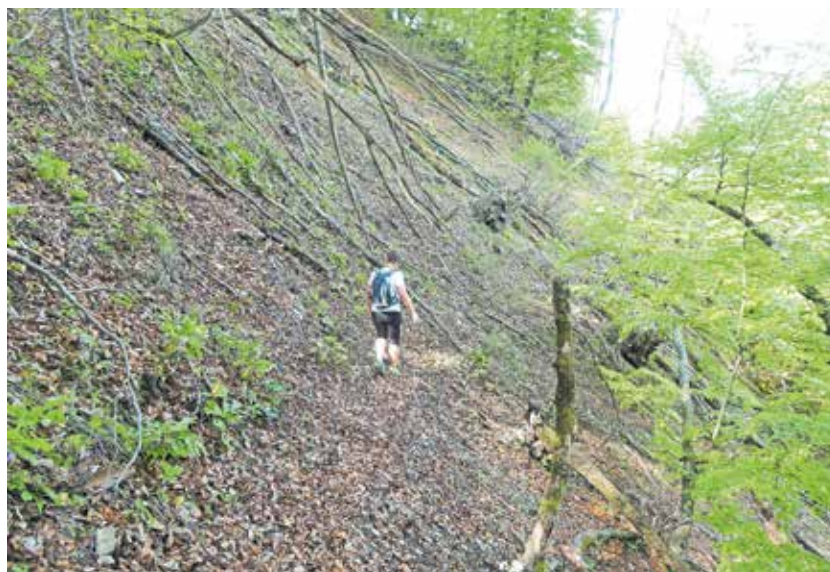
Zahtevna, neoznačena pot, ki poteka pod Vranjim grebenom