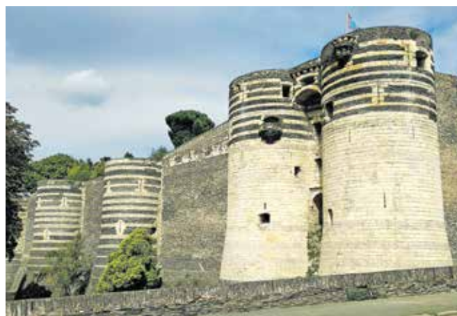
Grad Angers / Foto: Slavko Zupanc

poti, druga skupina pa je prispela s Flixbusom. Mesto Orleans ima bogato zgodovino, na kar spominjajo številne znamenitosti: stolnica sv. Križa, most Jurija V., trg La Place du Martroi s kipom narodne junakinje in svetnice Ivane Orleanske na koprju, ki je znana tudi kot Devica Orleanska. Prvi dan nas je pot vodila iz Orleansa po