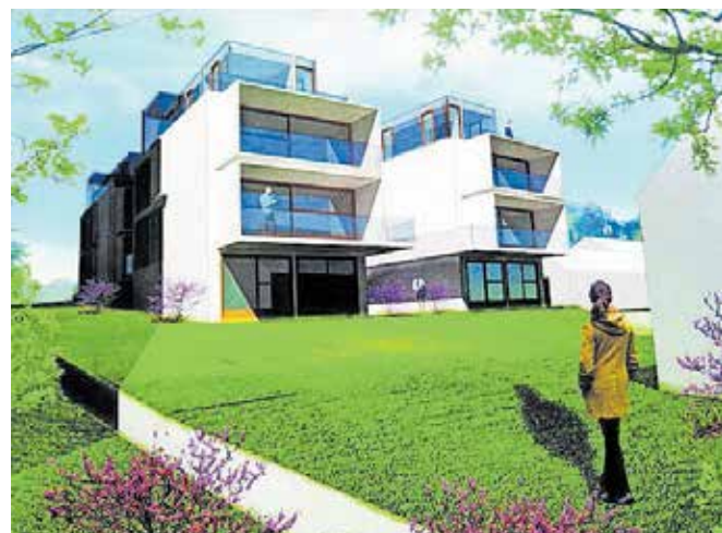
V štirih dvostanovanjskih enotah bo skupaj osem nadstandardnih stanovanj.

Stanovanja bodo dvo-, štiri- ter petsozna, najmanjša bodo obsegala 50 kvadratnih