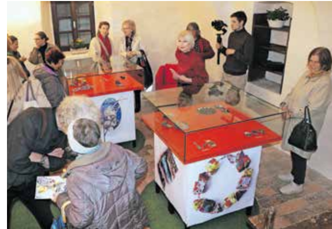
Odprtja razstave nakita v Radovljici se je udeležilo kar lepo število ljudi.

V Šivčevi hiši v Radovljici pa so v sklopu SIJW 2023 odprli razstavo nakita, kjer razstavljajo Sara Mermal, Kristina Drnovšek, Uršula