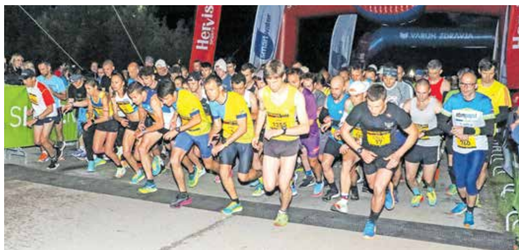
Start teka na 10 kilometrov je bil na Promenadi v središču Bleda. Na progo se je podalo več kot 1100 tekačev.

Kobe se s časom 31 minut in 24 sekund ni približal svoji rekordni znamki, je pa dejal, da je kljub temu na progi zelo užival. Zmagal je prepričljivo pred tekačema