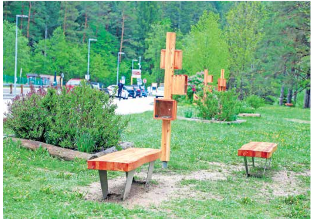
Zavod za turizem in kulturo Žirovnica je ob parkirišču pri jezeru Završnica postavil novo ulično opremo.

Po petih mesecih bodo v tem tednu znova odprli okrepčevalnico Zavrh nad MHE Bukovlje v Rekreativskem parku Završnica. Kot je pojasnil lastnik Anton