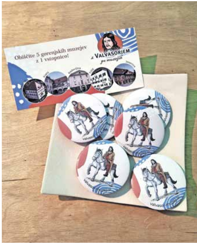
Valvasor vabi v gorenjske muzeje.

Vaš vodič po muzejih ni nihče drug kot Janez Vajkard Valvasor, prvi muzealec, polihistor in poznavalec slovenskih pokrajin. Po svojem popotovanju je ob grafikah popisal tudi različne zanimivosti, ki jih muzeji tudi na zabaven način uporabijo pri svoji promociji. Skupinsko vstopnico za pet muzejev