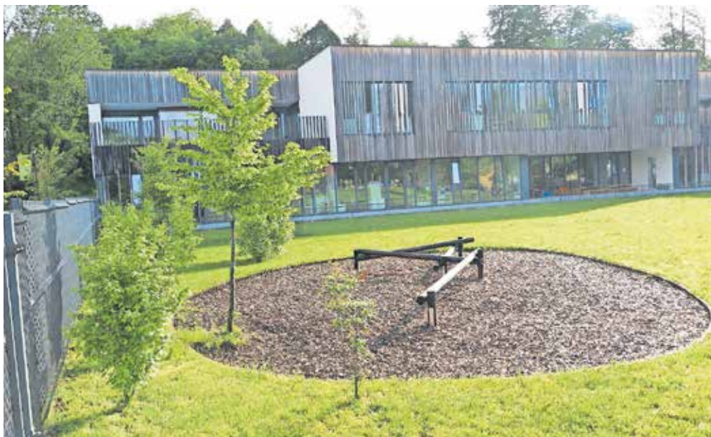
Kljub novemu Vrtcu Kamnitnik je na čakalnem seznamu v loški občini za novo šolsko leto ostalo 128 otrok.

Škofja Loka – V začetku tega meseca so nekateri starši otrok v škofjeloški občini razočarani prebrali pošto, s katero so izvedeli, da za njihovega otroka ni prostora v vrtcu. »Na Občini Škofja Loka smo prepričani, da si vsi otroci v naši občini zaslužijo ustrezne prostore. Ravno zato smo leta 2019 zgradili in v uporabo predali novo enoto Kamnitnik, ki deluje v okviru Vrtca Škofja Loka. S tem smo zmanjšali čakalno vrsto tistih, ki v vrtec zaradi pomanjkanja prostora niso mogli biti vključeni. Nova enota je bila delno namenjena tudi zagotovitvi ustreznih prostorov za oddelke, ki so do takrat delovali v enoti Čebelica. Po odprtju enote, še posebej pa pri vpisu v šolsko leto 2022/23, se je izkazalo, da je – kljub povečanju mest v vrtcih – teh še vedno premalo. Glede na to, da število rojstev v občini ne raste, so bila predvidevanja v smeri, da bo treba zagotoviti prostor samo še za en ali dva oddelka, a se je izkazalo, da je potreb za mestih v vrtcu še vsaj za pet oddelkov,« pojasnjujejo na občini in dodajajo, da je odstotek vključevanja otrok prvega