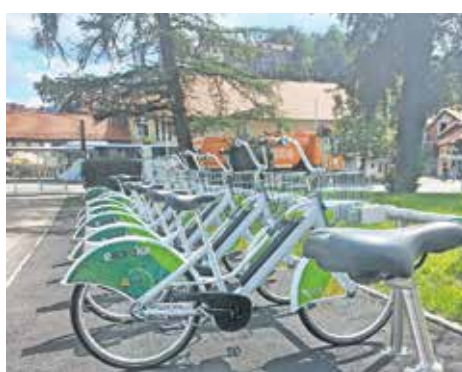
Postaja Štemarje

Za uporabo se mora uporabnik registrirati v sistem, pridobiti uporabniško ime in geslo. Registracija se lahko opravi v spletni aplikaciji mobiln.si ali v turistično-informativnem centru v Škofji Loki. Sistem eKOLOka je del širšega sistema Gorenjska.bike, zato si lahko uporabnik z istim uporabniškim računom kolo izposodi tudi v drugih občinah na Gorenjskem.