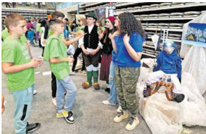
V Medvodah so bili na ogled turistični produkti učencev 29 osnovnih šol. Prepoznavnost svojih krajev so skušali izboljšati skozi športne aktivnosti, namenjene razvoju mladinskega turizma.

Mladi turistični navdušenci so ustvarjali na temo Športna doživetja bogatijo mladinski turizem. »Navdušeni smo, da se je tudi letos odzvalo toliko šol – skoraj sto. Najboljše se predstavljajo v