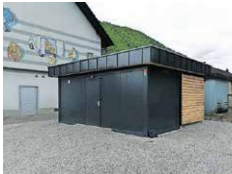
Objekt na tržnici v Železnikih / Foto: Občina Železniki

Občina Železniki je sprejela načrt, da bo na mestu nekdanje neurejene površine v naselju Železniki ob pošti postavila tržnico.