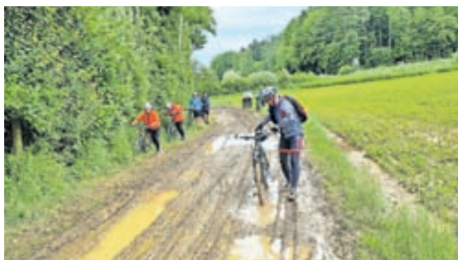
Včasih pelje pot tudi po blatu.

vas Waldsberg. Od tu je vodila lepa vaška pot do vasi Muggendorf, Jahanisbrunn ter Ober in Unterkarla, kar bi v prevodu pomenilo zgornja in spodnja Karla. Od tu pa po prijetnih poljskih poteh do krajev Unterpurkla, Drauchen, Dornau, mimo mesta Goritz pri Radgoni in nazaj v Slovenijo v našo Cankovo. Tako smo spoznali le en manjši del kolesarskih poti po avstrijski Štajerski. Mogoče se še kdaj vrnemo.