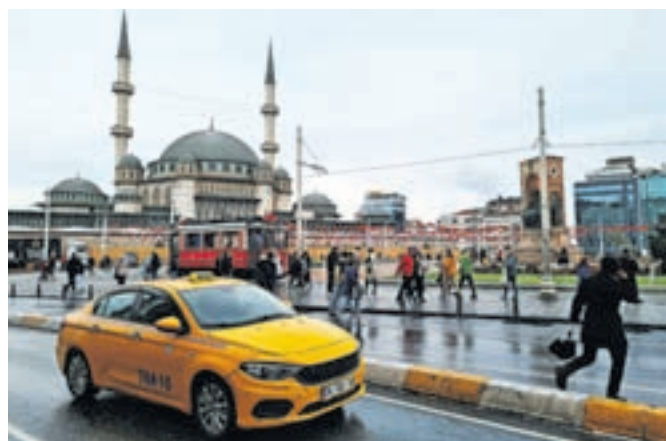
Trg Taksim z novo mošejo v ozadju / Foto: Alenka Brun

turških lir za kilogram. Za turško kavo odšteješ v teh predelih med 30 in 40 turških lir, cena obroka kakšne njihove turške mesne specialitete pa je odvisna od tega, ali ga pojedete v stoje ali sede v restavraciji oziroma lokalu – enkrat je to lahko 180 lir, drugič 250 ali pa 400. Znameniti turški zajtrk so pred leti ponujali kot edinstveno doživetje in je bil del kulinarčnih tur. To sicer še vedno velja, a ga danes lahko dobiš za vsakim vogalom, takoj ko lokali in lokalčki odprejo svoja vrata ... (Se nadaljuje)