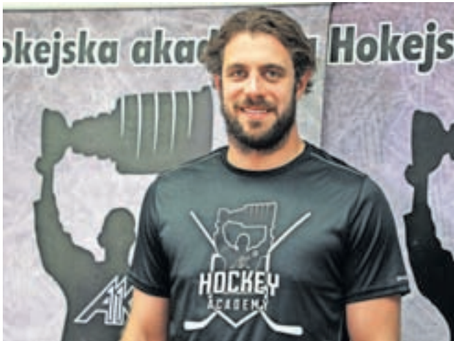
Anže Kopitar pravi, da gredo v končnico optimistični in samozavestni.

Edmontonu se bodo skušali oddolžiti za lanski poraz v končnici. »Serija bo zagotovo dobra, tako kot lani. Igrati bomo morali naš