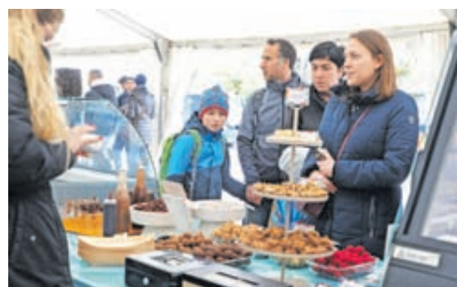
Radovljica je ponovno zaživel v vsej svoji čokoladni veličini.