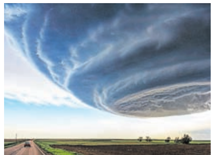
Nagajena fotografija Dan neodvisnosti

in drzen fotograf zasledita tudi v naših krajih. Naslov razstave Podobe neukrotljive narave še bolj do izraza pride v galerijski postavitvi na hodnikih prvega nadstropja, kjer nam razkriva fotografije tornadov in drugih sočasnih pojavov, strel, zračnih vrtincev in podobno, ki jih je Korošec posnel v ZDA. Pomladi se za mesec dni odpravi na ono stran Atlantika in od juga proti severu spremlja tornade in hodi za njimi. Če je prej omenjena nagajena fotografija z naslovom Dan neodvisnosti nastala v Arizoni, je zadnja v nizu posneta na meji s Kanado. Kot je ob odprtju razstave poudaril, je pri sledenju orkanov poleg dobre fotografske opreme s seboj treba imeti tudi načrte a, b in c, v katero smer