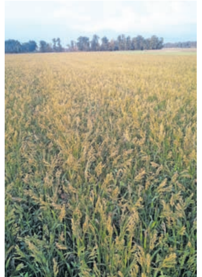
Njiva prosa na ekološki kmetiji Kozina v Čirčah