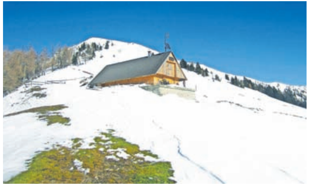
Koča na planini Dovška Rožca

Z Lahovega prevala se markirana pot odcepi levo strmo skozi gozd do planine Dovška Rožca, kjer je koča pašne skupnosti, moderna in urejena, s sončnimi celicami na