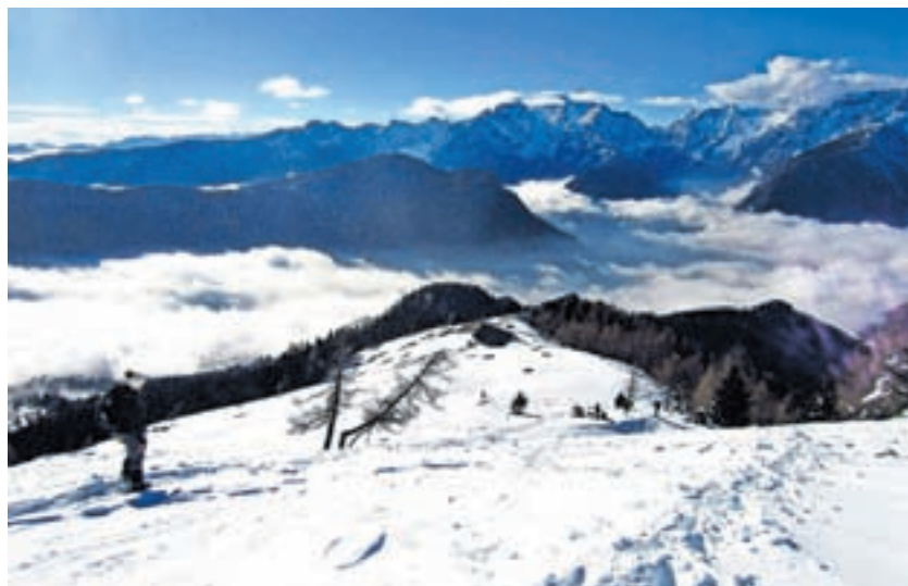
Vršni greben Dovške Babe s pogledom na triglavsko kraljestvo / Foto: Jelena Justin