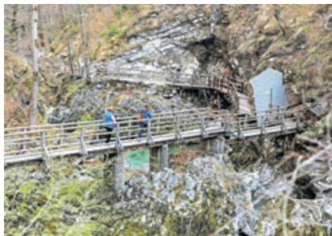
V skladu z odredbo je lahko v soteski Vintgar hkrati največ 245 ljudi, dnevno pa največ 2290.