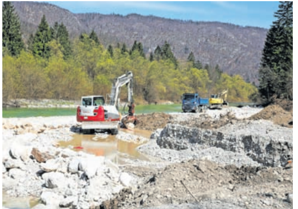
Del nove kolesarske poti, ki bo potekala čez območje vasi Lepence, zahteva poseg v rečno strugo.