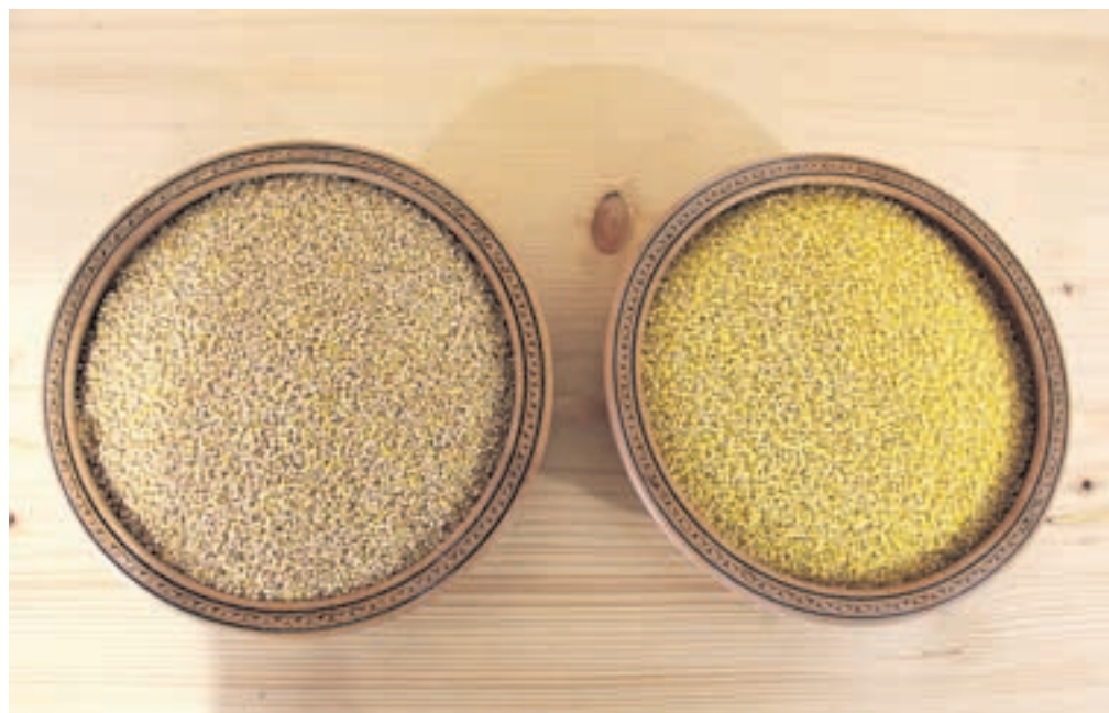
Proso in prosena kaša z ekološke kmetije Kozina

Na Kozinovi kmetiji je bilo nekdanje vedno mesto tudi za proso. Matej se še dobro spominja, kako so ga nekdanje sušili na posebnih »derah«, ki so bile del gospodarskega poslopja. Ko se je začel izboljševati standard prebivalstva in se spreminjati tudi njihove prehranske navade, je kašo kot »hrano revežev« začelo