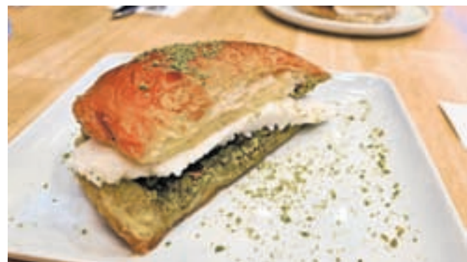
Baklavo vam po novem lahko postrežejo tudi kot nekakšen sendvič s sladoledom. / Foto: Alenka Brun

promenada. Ob njej najdemo vse od najboljših ponudnikov baklave in lokuma ter drugih sladkarij, kot sta Koska in Mado, do trgovin z oblekami znanih in priljubljenih evropskih blagovnih znamk, kot je Zara. Tudi cene so tu evropske, a vrst pred blagajni ni manjkalo. Covidne čase so preživeli tudi prodajalci kostanja; znameniti sladoledarji, ki jih zasledimo v različnih krajših predstavitevnih filmih, so še vedno glasni in s svojo humorno pojavo