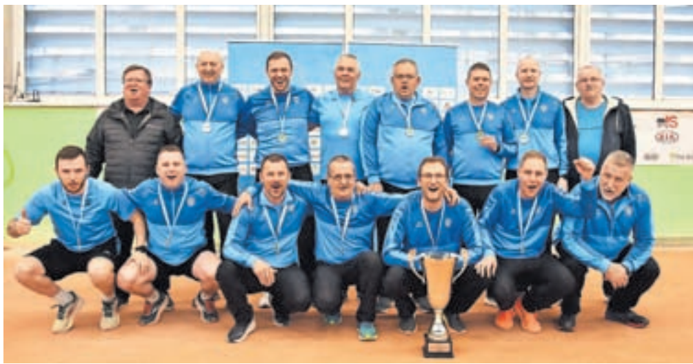
Balinarji Trate so izpolnili pričakovanja: v Postojni so še šestnajstič postali ekipni državni prvaki.

Redni del nedeljskega finala med favoritom Trato (prvo mesto v rednem delu super lige) in Ilirsko Bistrico (tretje mesto v rednem delu) se je končal z rezultatom 13 : 13, potem ko so Škofjeločani pred zadnjimi štirimi