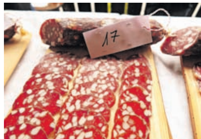
Zmagovalno salamo po mnenju strokovne komisije je izdelal Ciril Gantar iz Idrije.

menim, da bi v njih striktno morali biti samo sol, poper, česnova voda, belo ali rdeče vino, mogoče malo koriantra,« strokovno pove Martina. Začudim se njenemu znanju, a mi postane jasno, od kod prihaja: z možem Miranom namreč prav tako izdelujeta salame. »V nekaterih se res preveč čuti česen, ni pa velike razlike med njimi, v glavnem so vse dobre,« doda Miran.