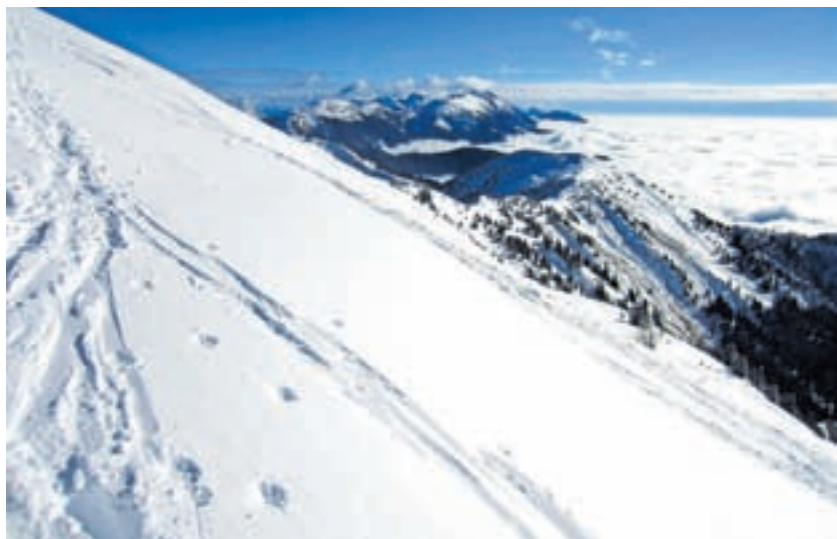
Veriga Karavank v smeri vzhoda, proti Stolu

Nadmorska višina: 1891 m Višinska razlika: 1186 m Trajanje: 5 ur Zahtevnost: ★★★★★