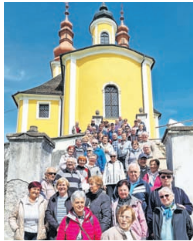
Naši gostje, zbrani na stopnicah, ki vodijo k Marijini cerkvi na Sladki Gori