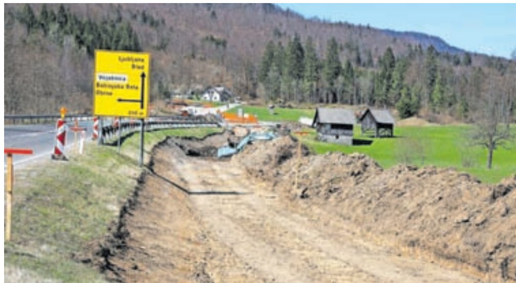
Kolesarska pot bo skupaj dolga petnajst kilometrov, gradnja pa naj bi bila sklenjena do konca leta 2024.

»V času projektiranja so bile potrebne določene prilagoditve zaradi različnih razlogov, ki sta jih podala projektant in investitor, zato so sledila usklajevanja na terenu, v okviru katerih je bilo še vedno mogoče slediti osnovnim pogojem,« so dejali na zavodu. Med gradnjo pa se je po njihovih navedbah izkazalo, da nekatere usklajevne projektne rešitve niso izvedljive. »Zaradi, kot kaže, slabo predhodno ocenjene mehanske stabilnosti pobočja s strani načrtovalcev,« so poudarili. Izvajalec del je zavod seznanil z novimi dejstvi in tehničnimi rešitvami, v okviru katerih so – kot dodajajo na zavodu – lahko podali le še minimalne ukrepe