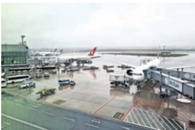
Novo carigrasko letališče