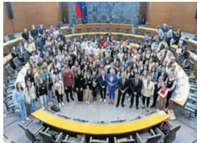
Zasedanje 33. nacionalnega Otroškega parlamenta v državnem zboru