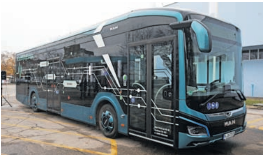
Za osem e-avtobusov, ki bodo po Kranju začeli voziti še letos, bodo postavili prav toliko polnilnic.

Kranj – V kranjskem mestnem prometu bodo v kratkem začeli voziti prvi štirje od skupno osmih električnih avtobusov, ki jih bo do konca leta prejel koncesionar Arriva. Kot smo že poročali, je vseh osem e-avtobusov po ceni približno 490 tisoč evrov na vozilo kupila Mestna občina Kranj (MOK) s pomočjo Eko sklada, ki k nakupu prispeva po 350 tisoč evrov za vsako vozilo. Arriva bo v nadaljevanju za avtobuse plačevala najemnino.