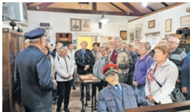
Spoznali smo, kako pomembno je bilo delo prometnika na železniški postaji.