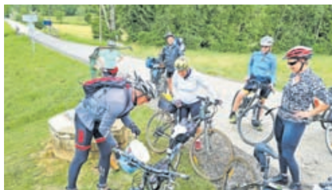
Kolesa smo morali čim prej očistiti.