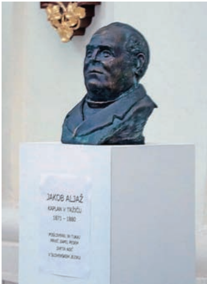
Doprnski kip Jakoba Aljaža stoji v farni cerkvi v Tržiču.