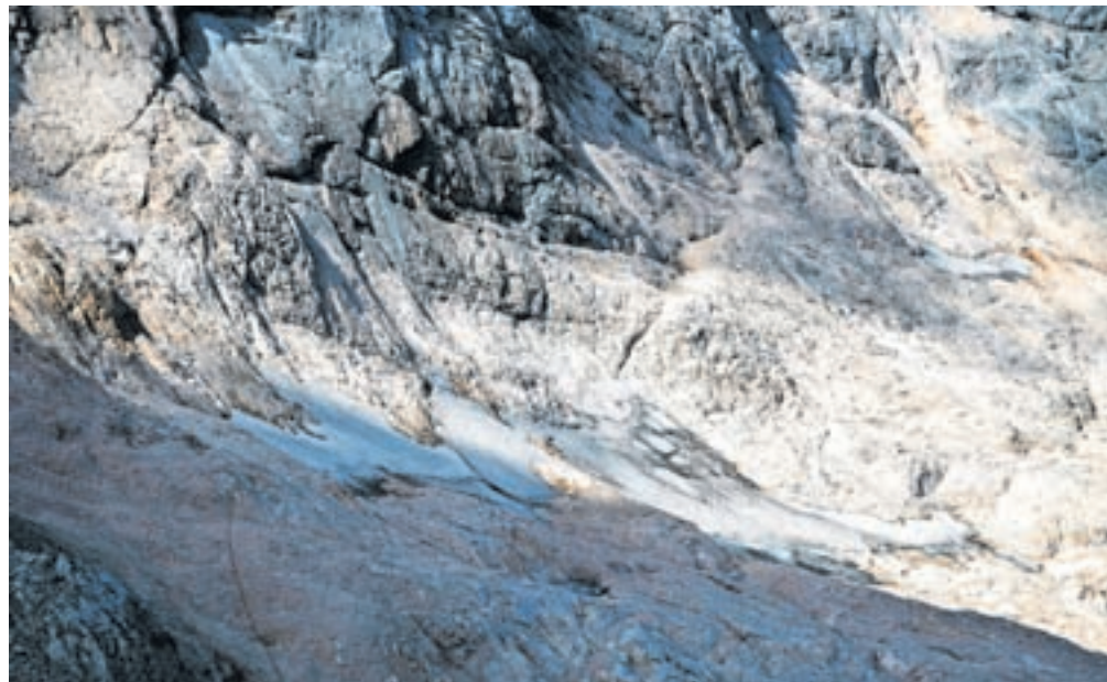
Triglavski ledenik, katerega obstoj, tako kot ledeniške krpe pod Skuto, omogočajo izrazita senčna lega, občasne nadpovprečno snežne sezone ter sneg, ki ga prinesejo na površje ledenika snežni plazovi in veter