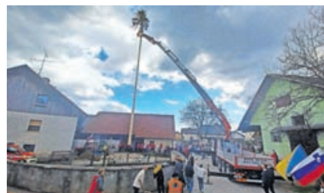
Aleša so prijetno presenetili z velikim mlajem iz šenčurske župnije.