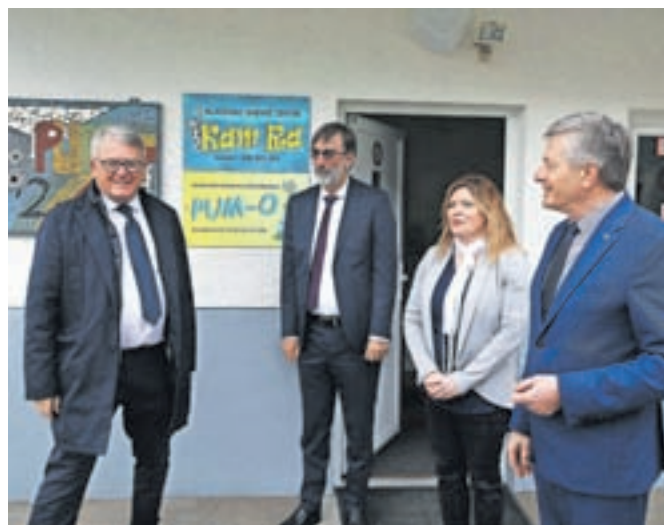
Prav radovljiški program PUM-O si je konec februarja letos kot primer dobre prakse projekta, financiranega z evropskimi sredstvi, v družbi šolskega ministra Darja Felde ogledal evropski komisar za delovna mesta in socialne pravice Nicolas Schmit.

Na družbenih omrežjih se je oglasil tudi minister