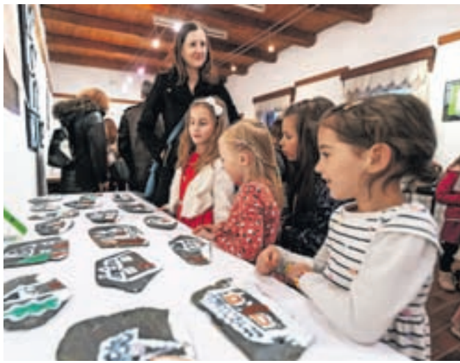
Z odprtja razstave Selca nekoč, ki bo v galeriji Muzeja Železniki na ogled do 8. maja