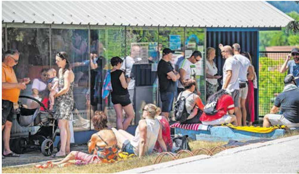
Nekaj deset občanov je pred kratkim pripravilo protest pred zaprtim bazenom – s kopalnimi brisačami ...

Zaradi zaprtja bazena pa je bilo burno tudi na zadnji seji občinskega sveta, na kateri je skupina svetnikov na čelu s svetniško skupino Levica – Jeseniška alternativa predlagala amandma k rebalansu proračuna, po katerem naj bi 1,6 milijona evrov namesto za dokončanje obnove Ruardove graščine (ki je po mnenju nekaterih občinskih svetnikov 'jama brez dna') namenili za obnovo bazena. Po dolgi razpravi so na koncu prisluhnili argumentu občinske uprave, da letos omenjenih sredstev za bazen ne bi mogli porabiti in bi ostala neizkoriščena. Za