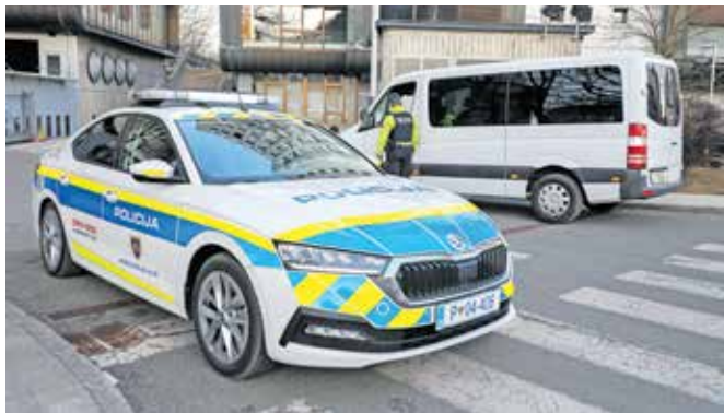
Policija je v najem prevzela še 52 specialnih patroljnih vozil Škoda Octavia. Slika je simbolična.

za notranje zadeve, imajo skupno 2755 vozil, od tega 2337 lastnih vozil, 418 vozil pa v najemu. Največ je osebnih civilnih vozil (1238), osebnih patroljnih vozil (677), sledijo intervencijska vozila (110). Vozni park je star povprečno 6,4 leta. Najstarejša so kombinirana vozila in motorna kolesa, ki so v povprečju stara več kot dve leti, pomladili pa so vozniki park osebnih patroljnih vozil, ki je zdaj star povprečno 3,4 leta.