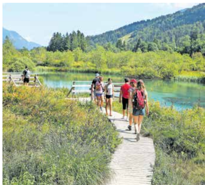
Lepote Kranjske Gore so k uporabi turističnih bonov privabile številne goste.

Na širšem območju Gorenjske je bilo unovčenih dobrih petnajst odstotkov vseh turističnih bonov.