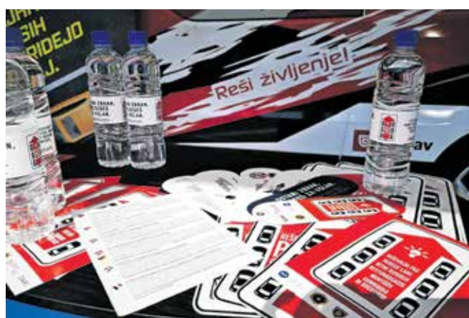
Z magnetno nalepko, ki opozarja na pravilno razvrstitev ob vsakem zastoju, so opremili že več kot 60 tisoč vozil.