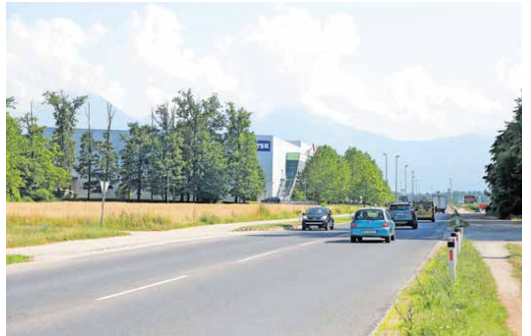
Za nadhod za pešce in kolesarje pri Planetu Kranj so zagotovili dodaten denar.

in sicer za most na Ljubljanski cesti pri kranjski železniški postaji 811 tisoč evrov, za nadhod pri Planetu Kranj pa dober milijon evrov, ker