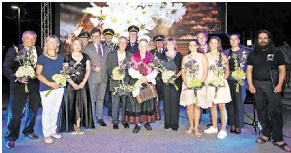
Letošnji občinski nagrajenci v Medvodah