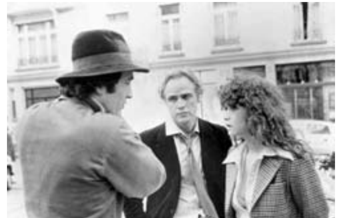
Režiser Bernardo Bertolucci ter igralca Marlon Brando in Maria Schneider med snemanjem filma Zadnji tango v Parizu, 1972