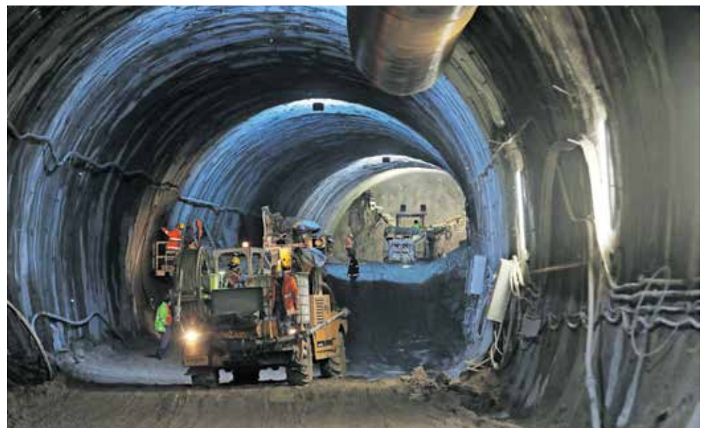
Delavci turškega izvajalca Cengiz Insaat delajo dan in noč, vse dni v tednu.

ttega je slovenski odsek dolg 3446 metrov, avstrijski pa 4402 metra. Medtem ko so Avstrijci svoj del izkopa zaključili že septembra lani, bo izkop na naši strani