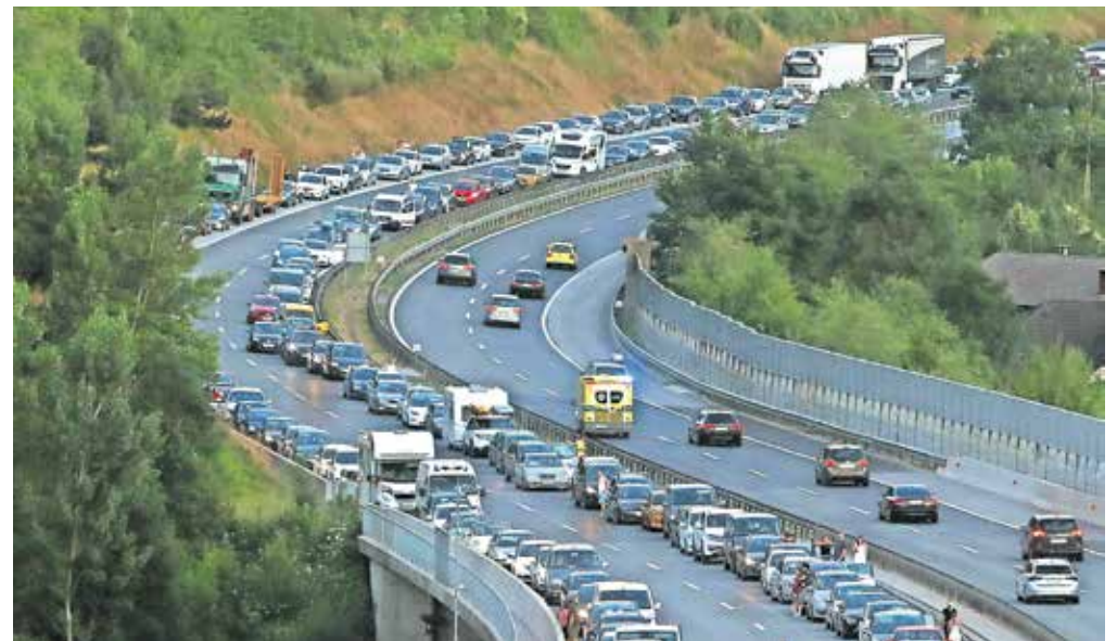
Primer vzorno vzpostavljenega reševalnega pasu na gorenjski avtocesti

Pred kratkim so tudi Agencija za varnost cestnega prometa (AVP), policija, Zavod Reševalni pas, Družba za avtoceste v RS (DARS), gasilci in reševalci skupno opozorili in ozaveščali, da je pravilno razvrščanje v primeru zastojev na avtocesti življenjskega pomena. Tovrstno ozaveščanje sicer poteka že od leta