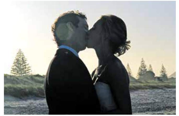
Med snemanjem romantičnih prizorov poljubljanja in drugih spolnih praks je prihajalo tudi do igralkam in igralcem neljubih dejanj ...