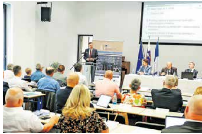
Državni svet je na seji v Litiji, kjer jih je nagovoril tudi predsednik republike Borut Pahor, soglašal s predlogom pokrajinske zakonodaje.