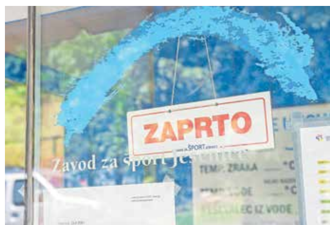
Edino jeseniško kopalnišče Ukova je v letošnjem vročem poletju zaprto...