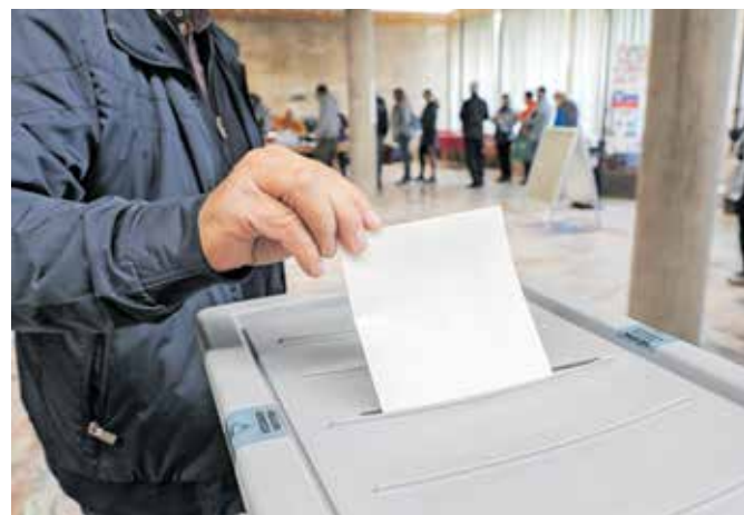
Predstavniki t. i. ljudske koalicije so v državni zbor vložili pobudo za razpis referendum o noveli zakona o nalezljivih boleznih.