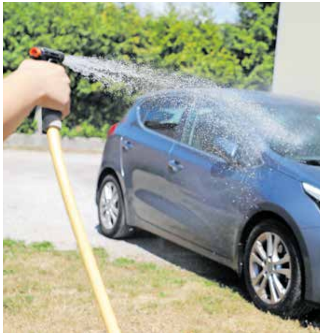
Komunalna podjetja pozivajo, naj v sušnem obdobju varčujemo z vodo. / Foto: Tina Dokl

V jeseniškem Javnem komunalnem podjetju Jeko vpliv letošnje suše na izdatnost virov zaznavajo že od