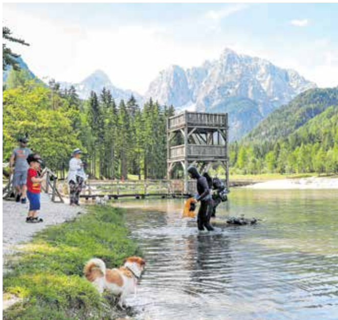
Po številu unovčenih bonov je bila pred Gorenjsko le še obalna regija

na več različnih mestih, je v statistiki zabeležen večkrat). Unovčenih pa je bilo za 301 milijon evrov bonov, na voljo pa jih je bilo za skoraj 357 milijonov evrov, kar pomeni, da je neizkoriščenih ostalo nekaj več kot 55 milijonov evrov. V občinah s širšega območja Gorenjske (podatke smo zbrali tudi v tabeli) je bilo skupaj unovčenih za dobrih 52 milijonov evrov