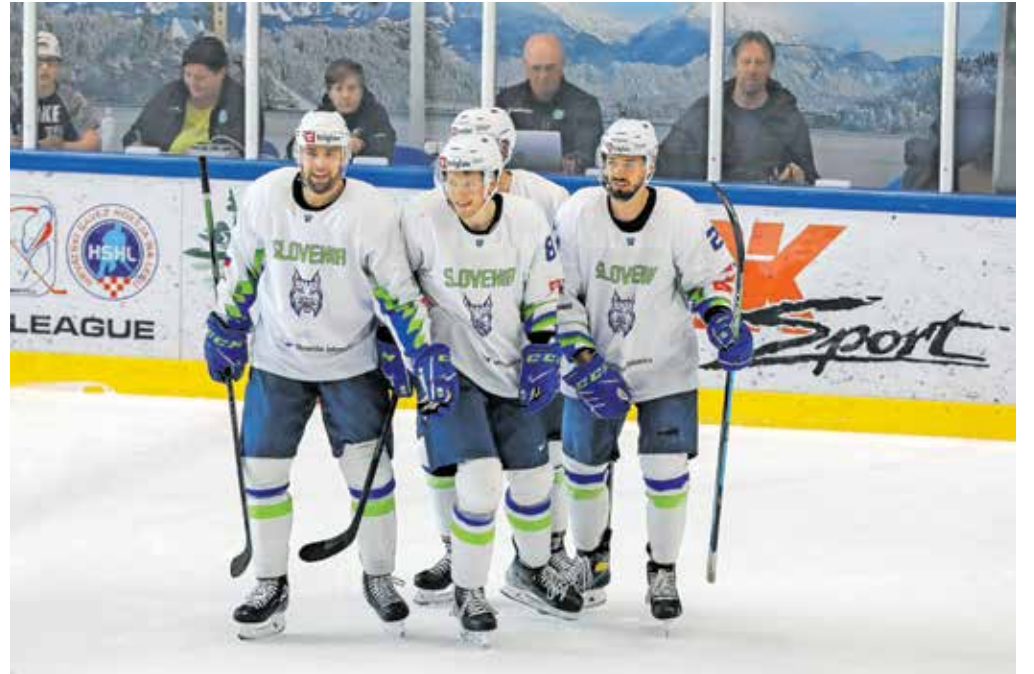
Našo hokejsko reprezentanco, ki si je pred domačimi navijači izborila mesto med svetovno elito, čaka zanimiva sezona.