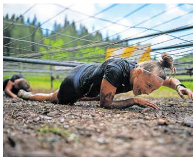
Udeleženci so premagovali različne ovire.

Tisoč oviratloncev je na Admiral Oviratlonu premagalo 34 ovir na desetkilometrski trasi. Na Junior