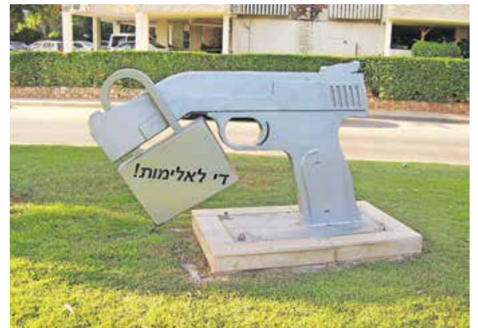
Skulptura-opomnik proti nasilju v izraelskem mestu Petah Tikva. Napis v hebrejščini pomeni: Stop violence!, Ustavite nasilje!