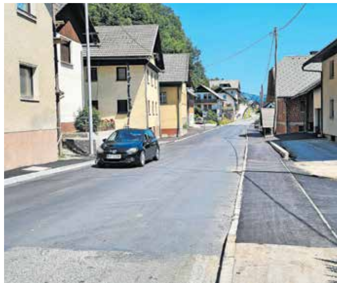
Na krajšem odseku regionalne ceste na Studenu so zgradili nov oporni zid, pločnik ter fekalno in meteorno kanalizacijo.

Investicija je bila sprva ocenjena na 143 tisoč evrov, od tega naj bi jo s 44 tisoč evri sofinancirala občina, a so odsek urejanja s prvotnih 25 metrov po doseženem dogovoru z lastnikom sosednjega zemljišča