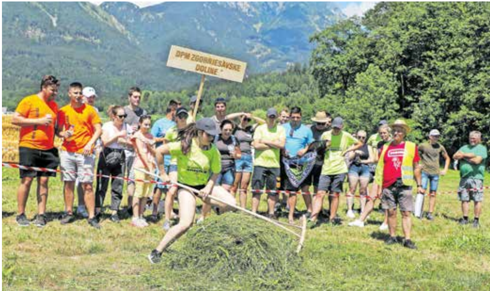
Tekmovalci so se pomerili v dveh že tradicionalnih igrah, košnji in grabljenju, ter treh različnih spretnostnih igrah.

Na sobotnem dogodku, ki je potekal v Goričah pri Kranju, je sodelovalo 26 ekip, med njimi se je 21 ekip društev podeželske mladine potegovalo za laskavi naziv