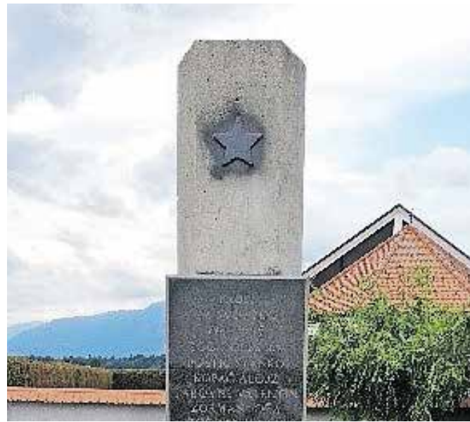
Zvezdo je nekdo že četrtič prebarval.

maja uspeli sanirati prejšnjo skrunitev, pa se je ta pred dnevi ponovno zgodila. Glede na to, da se oskrunjenje spomenika ponavlja, Janež početje pripisuje eni osebi oz. skupini oseb. »Zanima me, kako bi se oseba, ki to počne, počutila, če bi nekdo tako ravnal z njenim družinskim nagrobnikom,« se sprašuje Janež, ki je početje prijavil tudi policiji in obvestil lokalno skupnost.