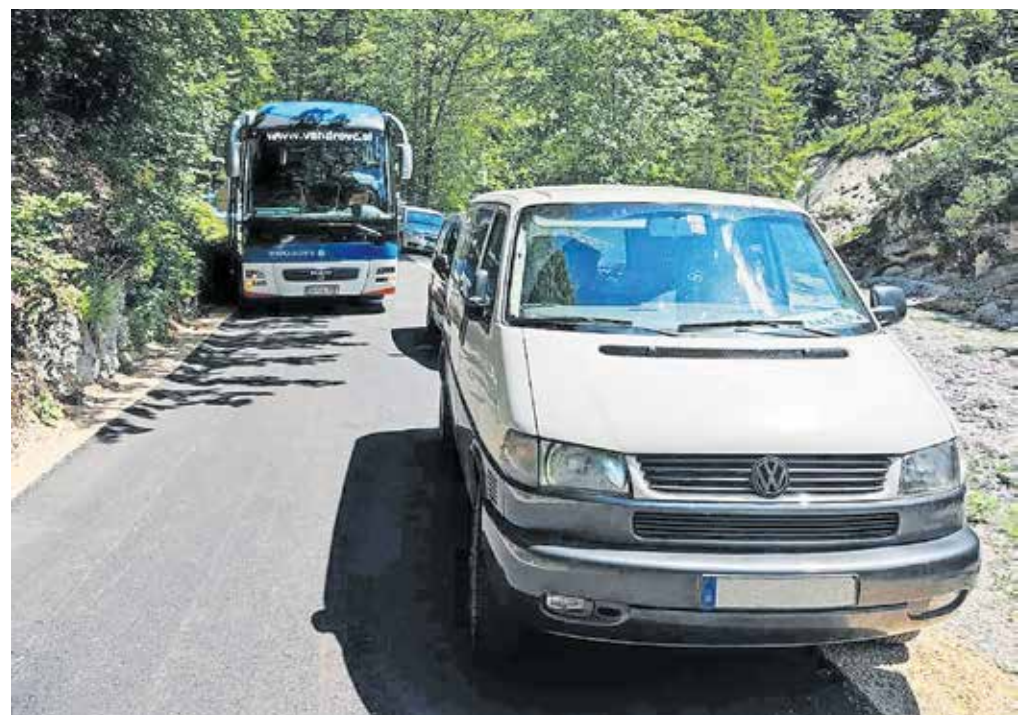
Minuli konec tedna je nemški turist svoj avtomobil v Vratih parkiral tako, da se avtobus ni mogel prebiti mimo vozila.