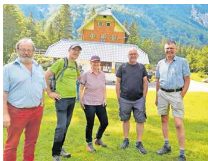
Gostje iz Ziljske doline