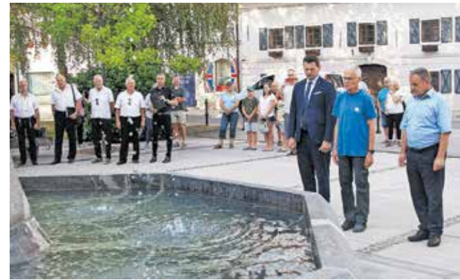
Spominska slovesnost ob Fontani na Trgu talcev v Kamniku