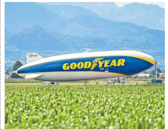
Slovito zračno plovilo na leškem letališču / Foto: Nik Bertonec

Lani so se z njim nad Blejskim jezerom lahko popeljali povabljeni gostje, na žalost številnih navdušenec pa niti lani niti letos niso