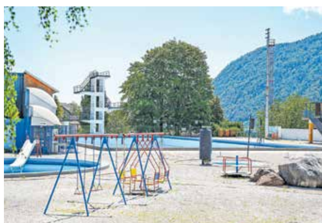
Kopalnišče Ukova: letos sameva, v preteklih letih pa je bilo na njem vsako poletje živahno dogajanje.