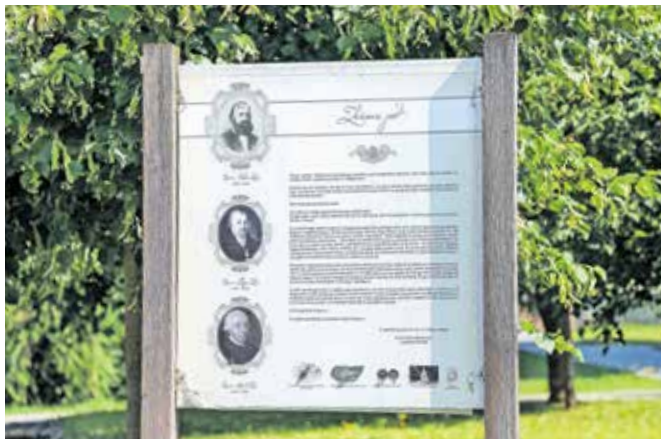
Zoisova pot je priljubljena med sprehajalci, zdaj pa jo bodo nadgradili v sprehajalno čebelarsko pot.

Zoisova pot Brdo–Predoslje je priljubljena med sprehajalci, zdaj pa jo bodo