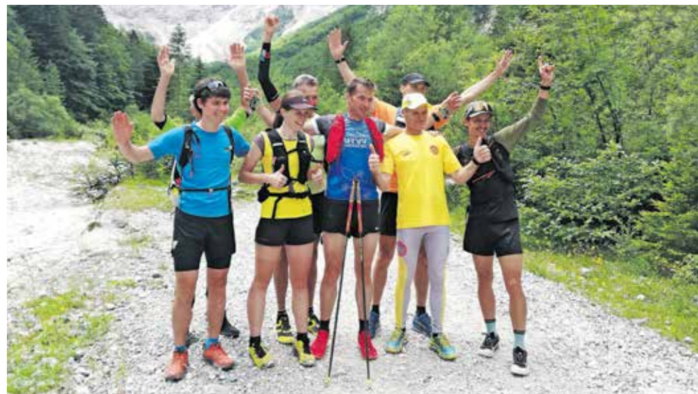
Nazaj v dolini, obdan s športnimi prijatelji