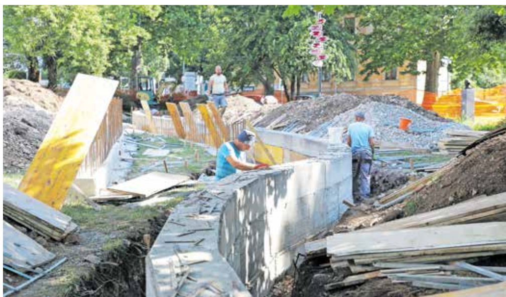
Prenova Parka La Ciotat med drugim vključuje spremembo poteka sprehajalnih poti.

V Kranju poteka prenova Parka La Ciotat, ki bo dobil tudi pitnik. Rok za izvedbo je sredina julija, so pojasnili na Mestni občini Kranj.