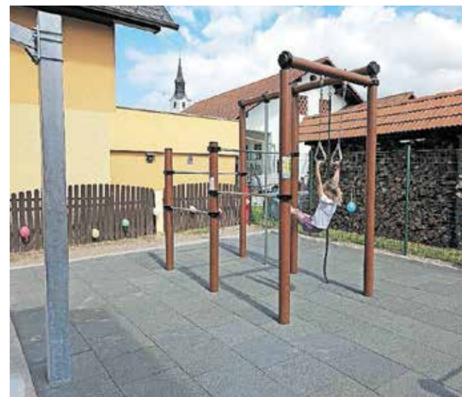
Otroci so se razveselili novega sodobnega vadbenega igrišča.

prikazali uporabo vadbenih naprav, udeležilo vodstvo osnovne šole, učitelji in predstavniki Krajevne skupnosti Kovor, Občine Tržič in Športne zveze Tržič. Investicijo v skupni vrednosti 16.675 evrov sta sofinancirali Občina Tržič in Krajevna skupnost Kovor, izvajalec del je bil Taurus šport.