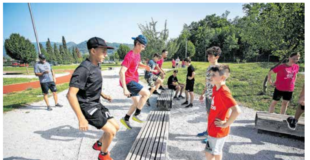
Mladi znanje in kondicijo nabirajo tako na ledu kot v okolici dvorane.