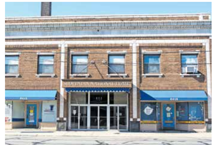
Slovenski narodni dom (Slovenian National Home) v soseski St. Clair–Superior v Clevelandu v Ohio.