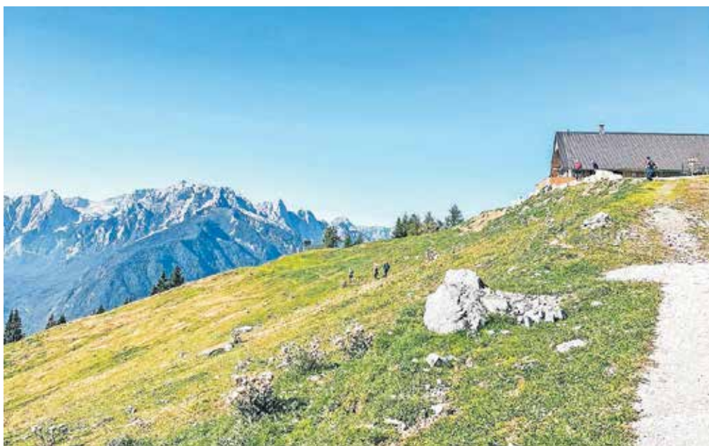
Planine so priljubljen cilj številnih pohodnikov in gorskih kolesarjev, za doseganje sozvočja kmetijstva in turizma na planinah pa je potrebno stalno ozaveščanje o pomenu planin.

«Planine so prav tako priljubljen cilj številnih pohodnikov in gorskih kolesarjev. Za doseganje sozvočja kmetijstva in turizma na planinah pa je potrebno stalno ozaveščanje o pomenu planin. Tako se je na planinah v pašni sezoni treba izogibati pretiranemu teptanju rastlin s hojo ali vožnjo zunaj označenih poti in vznemirjanju živali. Veliko težavo predstavlja tudi nekontrolirana vožnja z gorskimi kolesi v naravnem okolju, ki običajno poteka po strmih terenih, uničuje pašnike in vznemirja živali. Na zelenih pobočjih Dovške Babe in planine Dovška Rožca se vsako leto od konca junija pa do vse septembra pase večja količina živine iz okoliških vasi. Z Agrarno skupnostjo