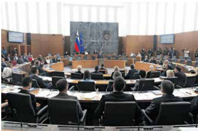
Državni zbor je zavrnil predlog SDS za razpis posvetovalnega referenduma o predlaganih spremembah zakona o Radioteleviziji Slovenija.