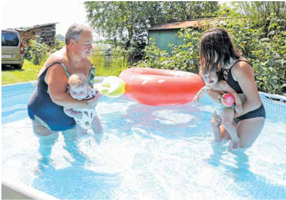
V vročih poletnih dneh mariskdo poišče osvežitev v vodi.

»Letošnji junij bo, kot kaže, uvrščen vsaj med prvih pet najbolj vročih doslej, ob tem pa bo presuh in nadpovprečno osončen,« je pojasnil Gregorčič. Kot je napovedal, se bo vročina, a ne ekstremna, predvidoma nadaljevala do torka, 5. julija, nato pa vendarle kaže na osvežitev z nekaj dežja. Dotlej bo ozračje le občasno osvežila