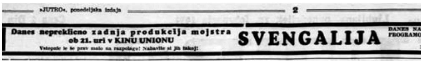
Oglas za predstavo Leopolda Škrbinca - Svengalija v dnevniku Jutro leta 1939

sta v zaporu sedela dva nedolžna. S svojim nastopom je modrooki čarovnik v Sankt Peterburgu navdušil celo zloglasnega Rasputina. Nastopal je po vsej Evropi. Po drugi svetovni vojni pa je zapadel v nemilost pri novih komunističnih oblasteh, ki so mu prepovedale »ukvarjanje z grafologijo, magijo in drugimi okultnimi vedami«. (Konec)