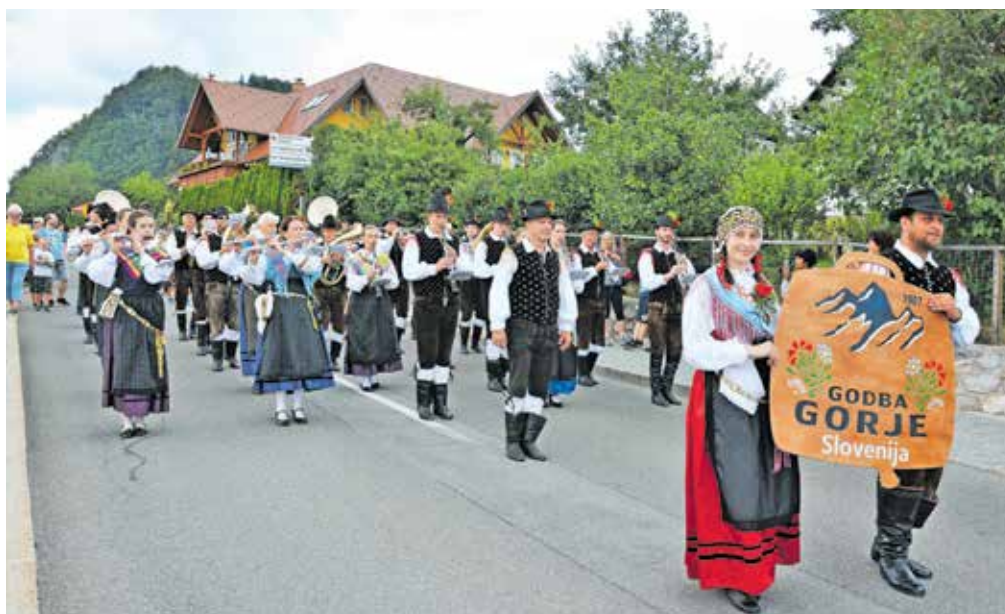
Godba Gorje letos praznuje 115 let delovanja.