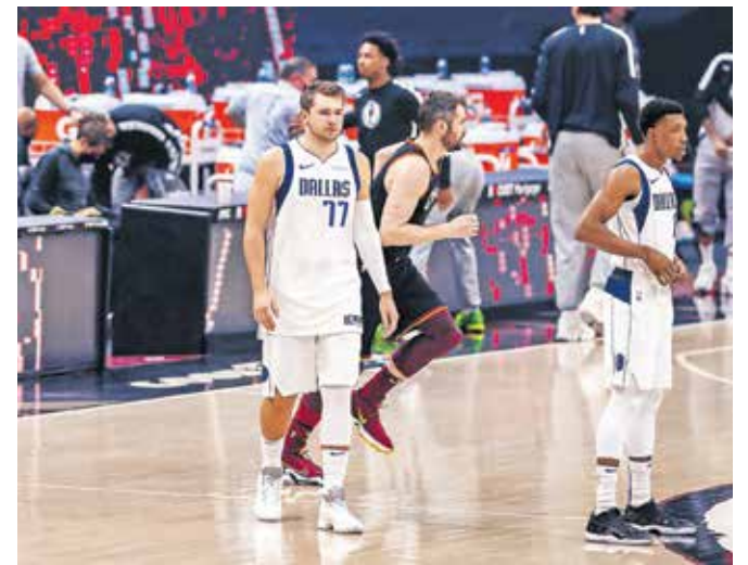
Košarkar Luka Dončić, ki ta čas igra za ekipo Dallas Mavericks v ameriški ligi NBA, je gotovo najbolj znani slovenski »zdomec«.