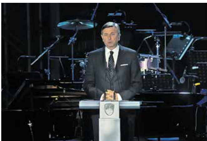
Na osrednji proslavi ob dnevu državnosti je bil slavnostni govornik predsednik republike Borut Pahor.