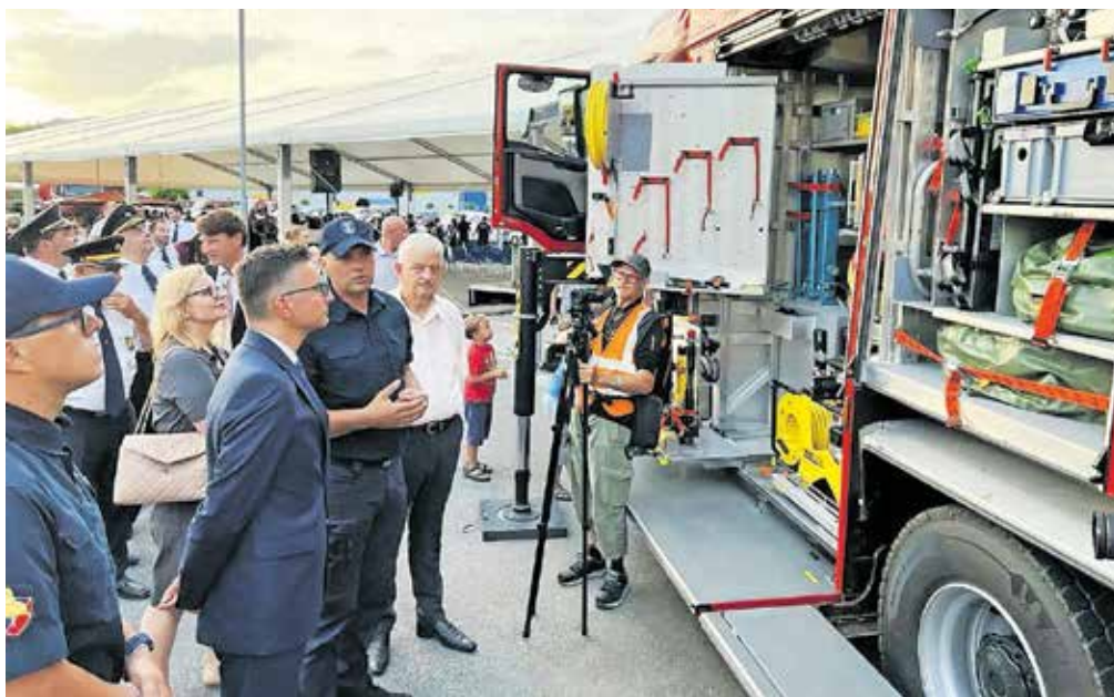
Prevzema novih vozil se je udeležil tudi minister za obrambo Marjan Šarec.

Gasilsko vozilo za posredovanje ob nesrečah z nevarnimi snovmi je bilo dobavljeno sicer že junija 2020, vrednost vozila pa znaša skoraj šeststo tisoč evrov. Doslej so z njim posredovali na nekaj manj kot petdeset intervencijah. Kombinirano vozilo za logistiko je opremljeno z dvizno ploščadjo in je namenjeno opravljanju meritev in logistični podpori ob intervencijah, njegova vrednost pa znaša dobrih 48 tisoč evrov. Vozilo za tehnične intervencije z dvigalom pa je namenjeno posredovanju ob naravnih nesrečah, porušeni objektih, nesrečah v prometu, reševanju na