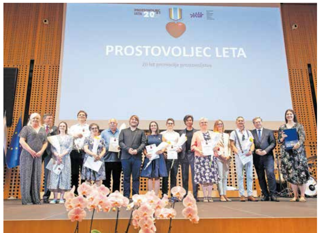
▶ 3. stran Letos je potekal jubilejni, dvajseti izbor za naj prostovoljce. / Foto: Aleš Senožetnik