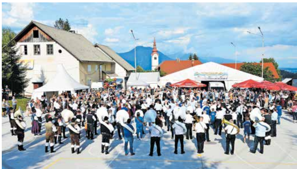
Jubilej so zaznamovali s tridnevnim slavljem.

skladb, od Pastirske pa vse do vsem znane Na Golici,« je povedal.