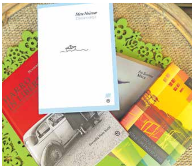
Nekaj namigov za poletno branje