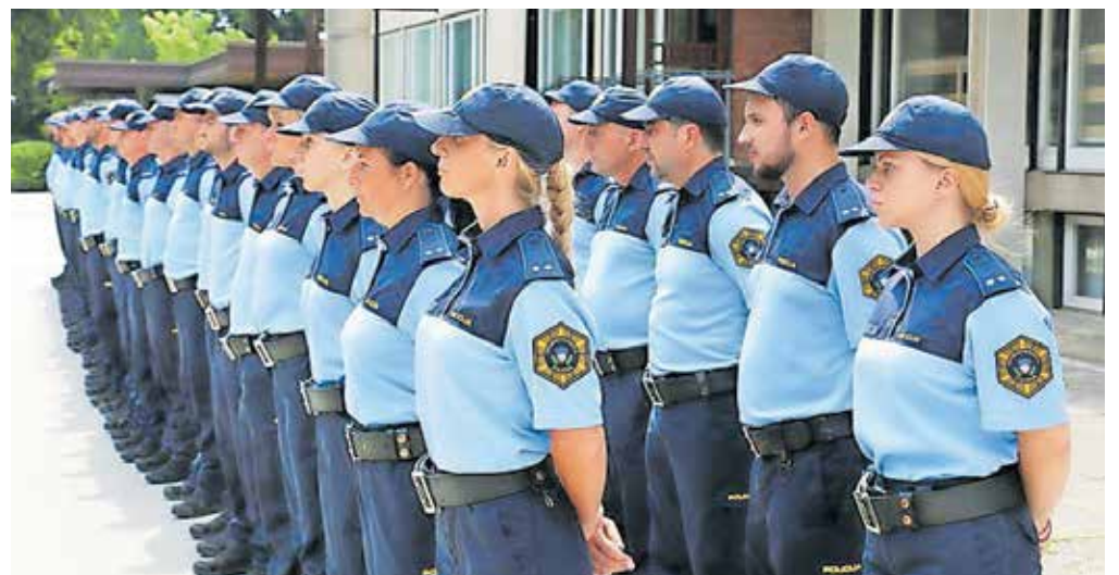
Na Policijski akademiji je zaprisegla deveta generacija pomožnih policistk in policistov.

Pomožni policisti, t. i. rezervisti, so državljani Slovenije, ki so sklenili pogodbo o prostovoljni službi v pomožni policiji in so