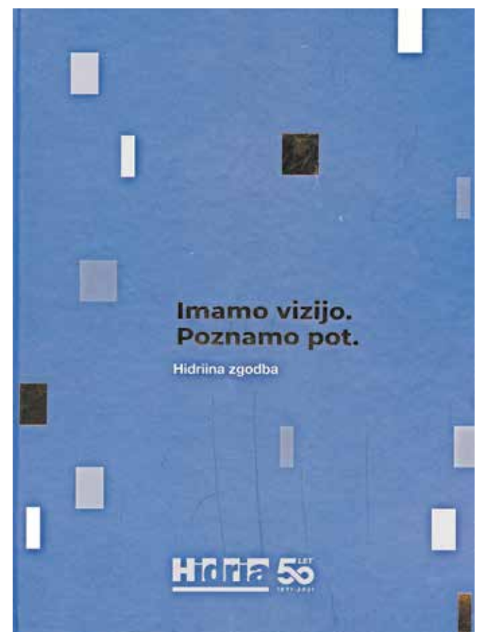
Imamo vizijo. Poznamo pot, Hidriina zgodba, zbornik, Hidria, Spodnja Idrija, 2021, 204 strani