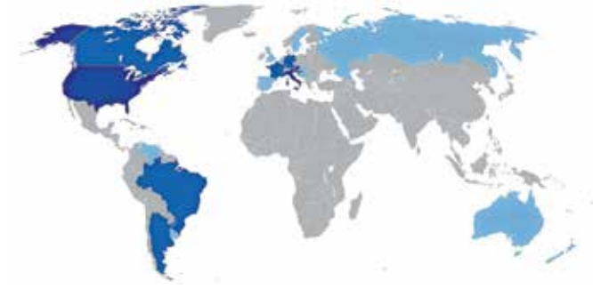
Zemljevid slovenske diaspore. S temno modro so označene države, v katerih je Slovencev največ, bodisi slovenskih manjšin ali izseljencev in zdomcev.

»Želimo si, da bi Slovenci po svetu ostali del enotnega slovenskega prostora in se dejavno vključevali v naš intelektualni, kulturni, gospodarski, znanstveni in družbeni razvoj.« Tako so zapisali na vladni spletni strani in s to željo gotovo vsi soglašamo. A za njeno uresničenje bi morali tudi več narediti.