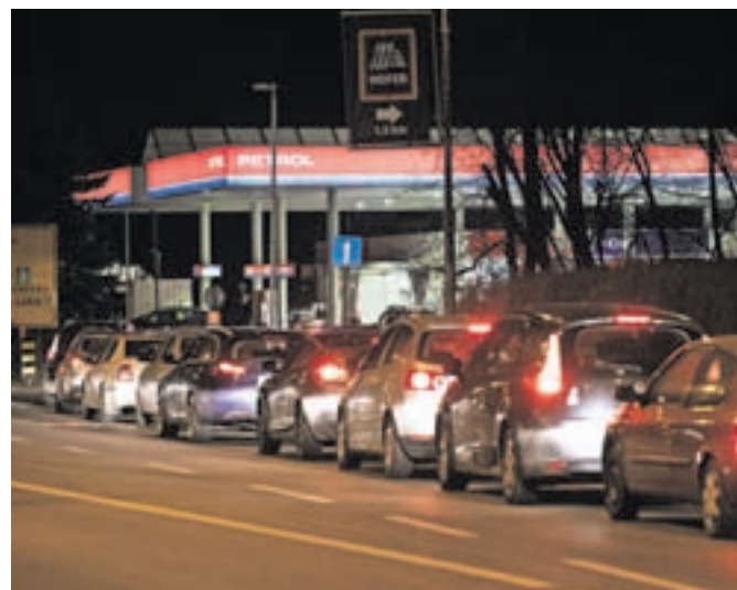
V zadnjih mesecih smo bili večkrat priča podobnim prizorom pred bencinskimi servisi.

Nejevolja voznikov je posledica odločitve vlade, da sprejme novo uredbo o oblikovanju cen določenih naftnih derivatov, ki je v veljavo stopila danes in ki uveljavlja delno regulacijo cen goriv, zaradi česar so ta od danes dražja. Kot je prejšnjo sredo na novinarski konferenci povedal premier dr. Robert Golob, je bil ukrep nujen, saj se je nafta v letu in pol podražila za približno 75 odstotkov, maloprodajne cene pri nas pa temu niso več sledile. Do včeraj sta bili ceni 95-oktanskega bencina in dizelskega goriva fiksirani pri 1,56 oz. 1,66 evra za liter. Kakšne so nove cene, do zaključka redakcije še ni bilo znano, kot pa so