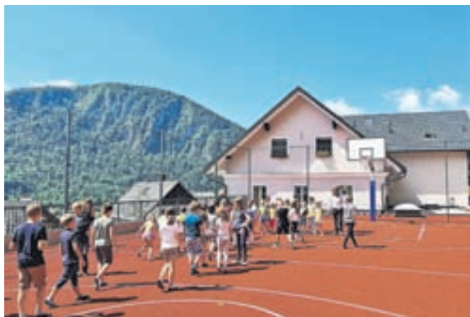
Uredili so športno igrišče, igrišče za najmlajše ter na zadnji strani šolski stavbi dodali še zunanjo učilnico.