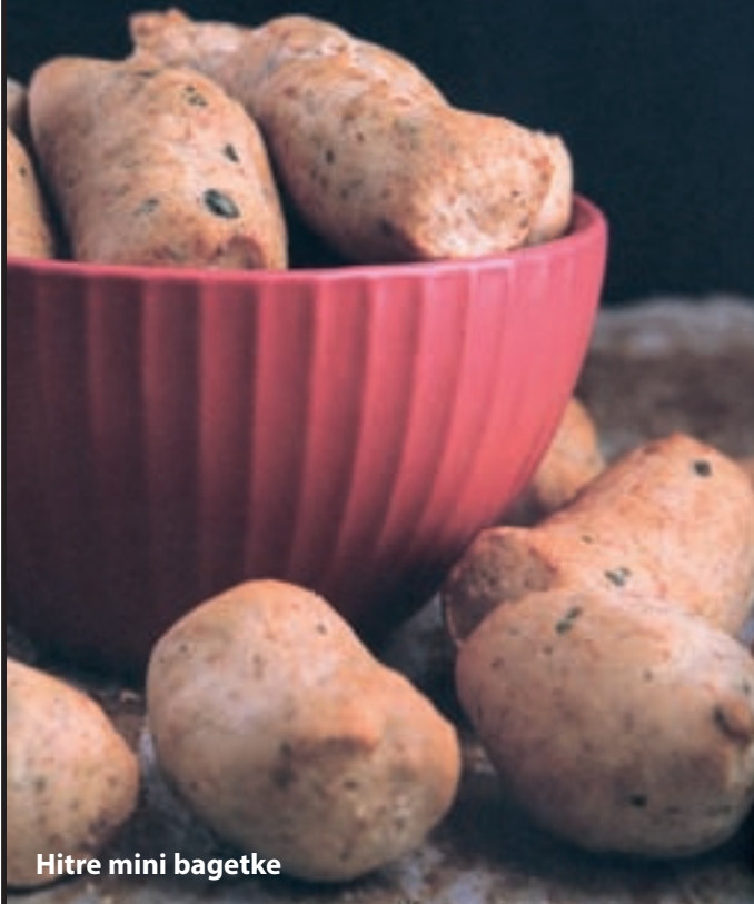
Hitre mini bagette