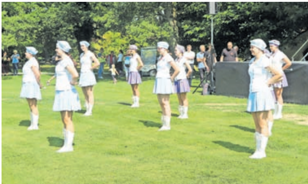
Predstavile so se tudi članice Društva kamniških mažoretok Veronika.

Zamisli za vseslovenski festival, ki naj bi odslej postal tradicionalen, se je