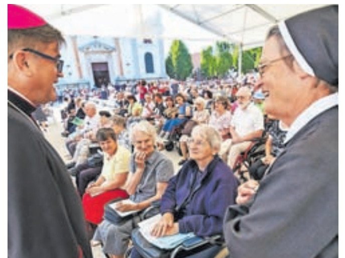
Več kot tri tisoč bolnikov, invalidov, starejših in njihovih spremljevalcev se je udeležilo sobotnega romanja na Brezje.