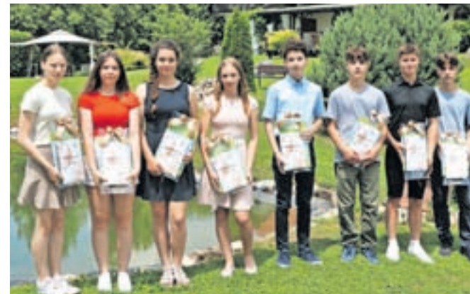
Pohvale preddvorskega župana za odličnost je letos prejelo osem devetošolcev OŠ Matije Valjavca Preddvor, ki zapuščajo osnovnošolske klopi.

sprejemu učencem namenil tudi nekaj spodbudnih besed. Župan Roblek jim je zaželel uspešno nadaljevanje izobraževalne poti in v nagovoru poudaril, naj se vedno zavedajo potenciala, ki ga nosijo s seboj, ter naj ga razvijajo. Pomemben pa