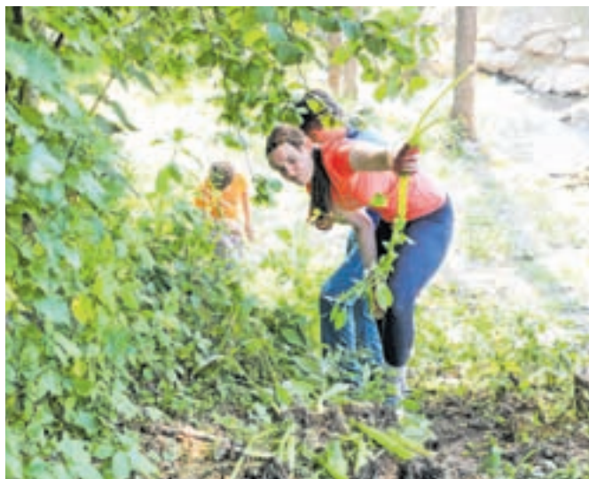
Odstranjevanje invazivnih tujerodnih rastlin v Kranju se je udeležilo okoli sto prostovoljcev.

je tudi sam lotil čiščenja, je pomembno zavedanje, da so invazivke razširjene tudi na zasebnih zemljiščih in naj jih zato lastniki odstra-