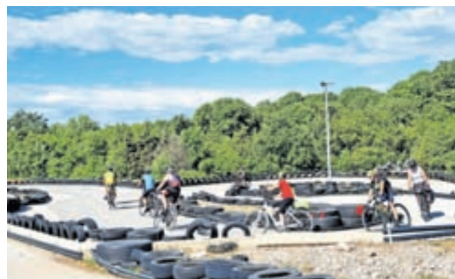
Ob poti proti Malinski samo se preskusili v vožnji po stezi za karting.

koder vodi samo ena cesta, na kateri na približno petih kilometrih premagaš dvesto metrov vzpona. Po vzponu je sledil spust proti Malinski in še vožnja po kolesarski stezi v mesto Krk, kjer smo prvič prenočili. Drugi dan smo se odpeljali proti Malinski in že na vrhu prvega vzpona opazili stezo za karting, ki je najbrž v poletnih mesecih precej zasedena. Ko smo bili mi tam, ni bilo nikogar, zato smo lahko preizkusili vožnjo kolesi po zaviti stezi za karting. Steza, polna zavojev, je pravi poligon za vajo ravnotežja. Po krajšem spustu smo zavili proti Solinam. V središču vasi Kras smo imeli krajšo pavzo. V vasi je bila manjša trgovina, kjer smo spoznali, kako velika cenovna razlika je med turističnimi in obrobni kraji. Mimo