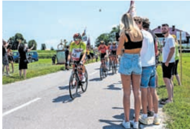
Predzadnja etapa je bila za Tadeja Pogačarja posebna, saj je zavila tudi v njegovo domačo občino Komenda. V centru se je zbrala množica navijačev, igrala je tudi godba, sokrajana pa so pričakali tudi na Klancu (na fotografiji).

Gledalci so glasno spodbujali vse kolesarje, še posebej Tadeja Pogačarja, najboljšega na svetu. In potem je sledil še spust v dolino – le nekaj manj promet, kot je bil vzpon.