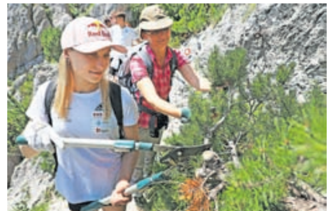
Planinsko pot v dolini Tamar je čistila tudi olimpijska prvakinja Janja Garnbret.

je naš pomemben partner za treninge, saj ti v zadnjem obdobju pogosto potekajo na naravnih plezalnih stenah. Ker naša ekipa v prostem času prav v naravi najde najkakovostnejšo sprostitve, sta bila današnja rekreacija in čiščenje planinskih poti v Julijskih Alpah zares čudo-