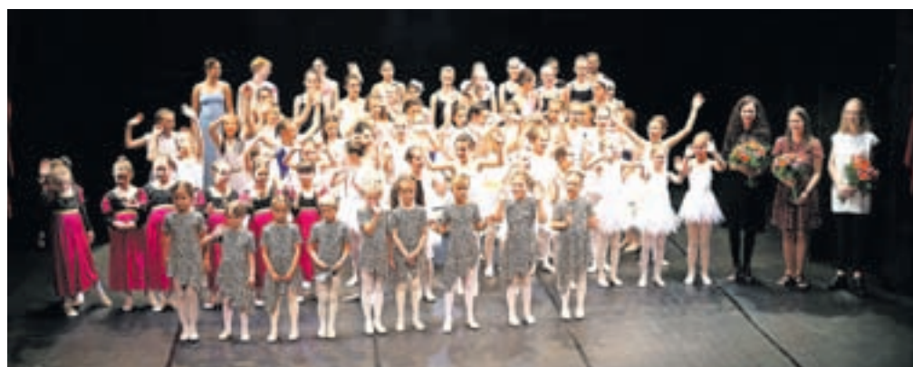
Letni nastop baletnega oddelka GŠ Kranj v Prešernovem gledališču