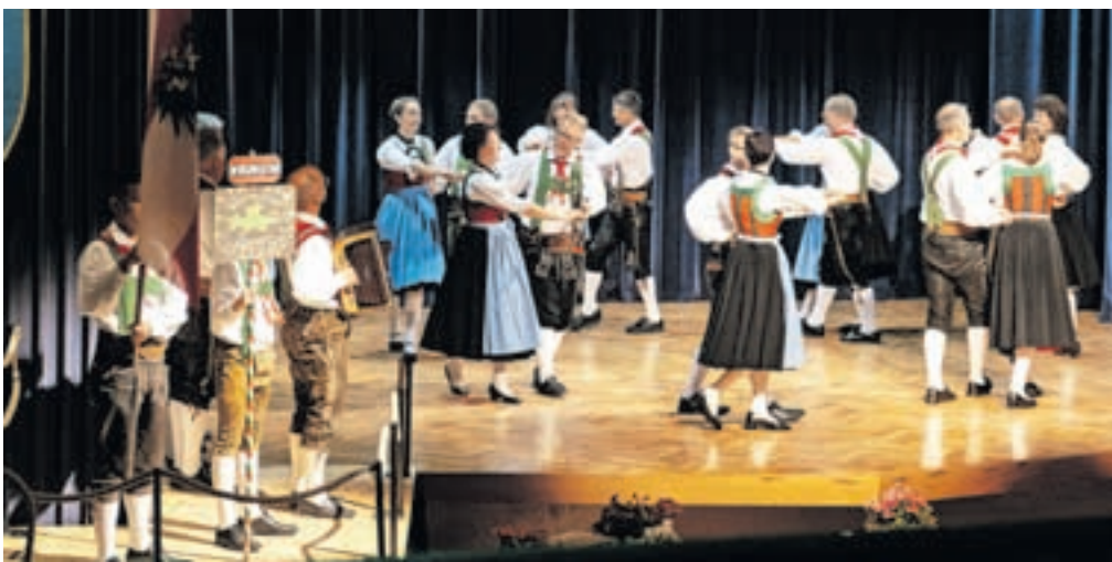
Iz Avstrije je prišla celovška skupina Lindwurm.

V prvi polovici 19. stoletja je bil v zahodni Evropi zelo priljubljen ples šotiš, ki se je pojavljal v različnih oblikah. Zaradi značilnih potrkov in ploskov so ga na Kranjskem imenovali tudi potowčka. Posamezne variante se med seboj razlikujejo v ritmu ploskanja, a tudi v korakih polke in obratih. Plese je v domačem kraju predstavila skupina Folklornega društva Šenčur.