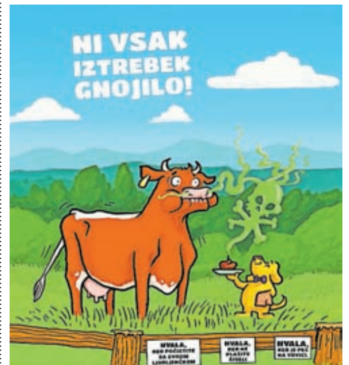
Na kmetijsko-gozdarski zbornici so skupaj z Zavodom Seneno pripravili tablo, ki na hudomušen način poziva sprehajalce psov k pobiranju iztrebkov.