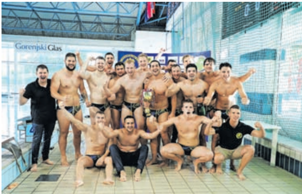
Vaterpolisti Triglava so po pokalni lovoriki osvojili še naslov državnih prvakov.