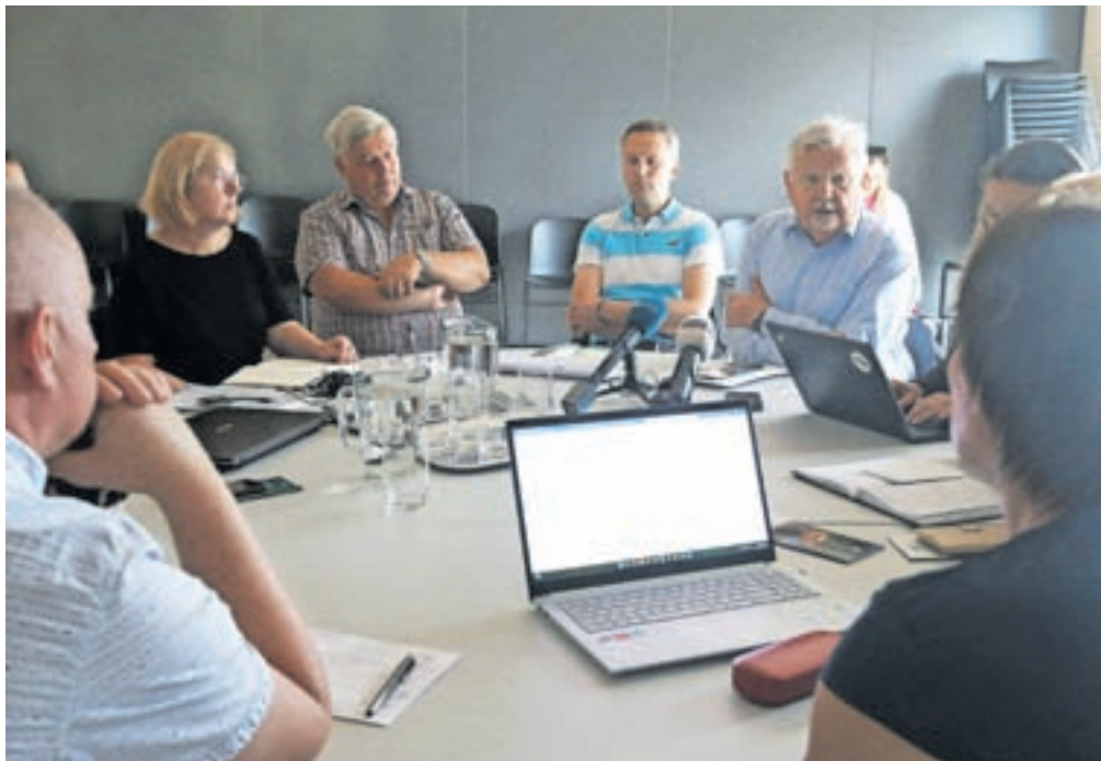
Novinarska konferenca pred začetkom glavne turistične sezone na Bledu