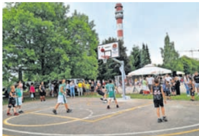
Obnovljeno igrišče pri OŠ Jakoba Aljaža v Kranju