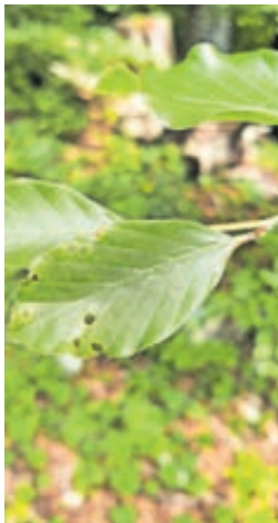
Luknjice v listu – značilna poškodba bukovega rilčkarja skakača

Na blejskem gozdnogospodarskem območju, kjer imajo v lesni zalogi nekaj manj kot 24 odstotkov