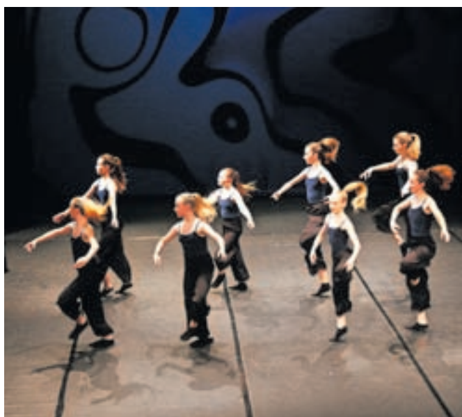
S sodobnim plesom so navdušile učenke 5. razreda.