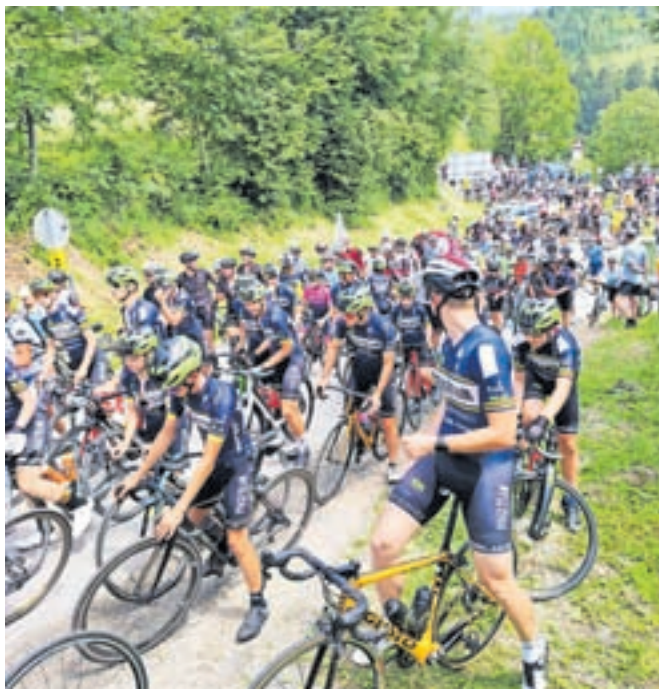
Kolesarski zastoj navijačev na Črničcu proti Veliki planini slabo uro pred ciljem etape

s kolesi je bilo ogromno in kakšnih sto, dvesto metrov od odcepa proti Veliki planini smo morali peš, skorajda drug po drugem. Neverjetno! Do Kranjskega Raka je bila zgoščena kolona, prehitevanje levo, desno. Na cestnih, gorskih, električnih kolesih so bili od otrok do starejših, vmes pa še pohodniki.