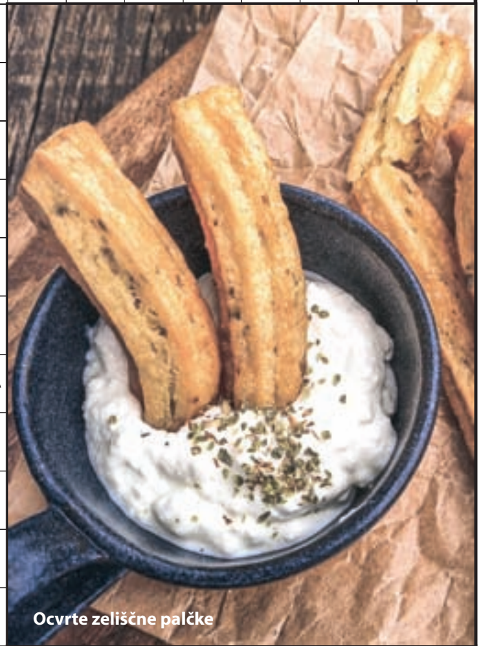
Ocvrte zeliščne palčke

1. nagrada: darilna kartica OBI v vrednosti 20 EUR, 2. in 3. nagrada: knjiga Melanda