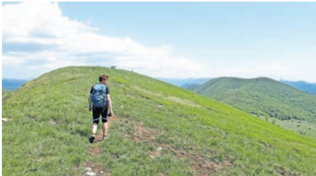
Greben proti vrhu Tuhobiča