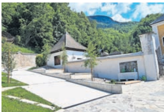
Nov je tudi spominski park pri poslovnih vežicah v neposredni bližini šole.