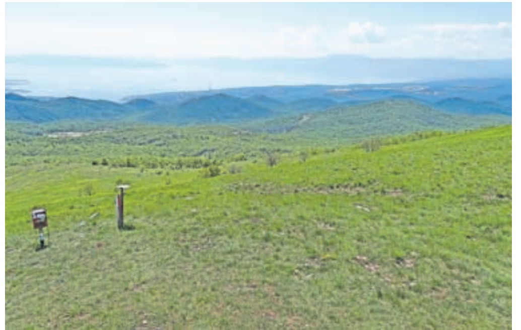
Pogled na Reški zaliv, severni del Krka in Učko v ozadju.

dva kilometra, ko na desni strani zagledamo smerokaz Tuhobič. Zavijemo desno na makadamsko cesto, ki ji sledimo kakšen kilometer, do razpotja poti in manjšega parkirišča. Smerokaz za Tuhobič nas usmeri desno. Sledimo makadamski cesti, ki se v spodnjem delu strmo vzpne, nato pa preči pobočje in nas ponovno pripelje na razpotje, kjer levo navzdol vodi pot do Doma izvidača, mi pa nadaljujemo še naravnost po kolovozni cesti. Cesta je precej razrita in zavila bo levo. Kolovozu sledimo še nekaj časa, ko nas ta pripelje na greben Tuhobiča. Od tukaj dalje smo na prijetni planinski poti, ki vodi skozi bukov gozd. Vzpeljamo