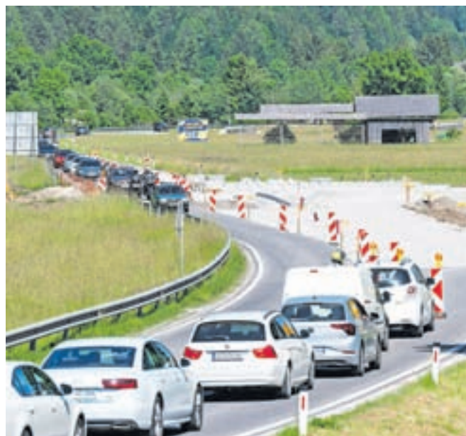
Pred policijo v Kranjski Gori bo krožišče.

Kranjska Gora – Državno regionalno cesto v občini Kranjska Gora je Direkcija RS za infrastrukturo iz jeseniške smeri do Kranjske Gore že obnovila, kar je bil tudi njihov načrt pred svetovnim nordijskim prvenstvom v Planici 2023. »Trenutno sta v gradnji krožišče v Kranjski Gori pred policijo, ki bo končano do julija, in krožišče v Podkorenu, ki naj bi bilo končano do sredine avgusta in kjer je predvidena še povezovalna cesta do poligona, ki jo bo skupaj s pločniki financirala občina. Ta cesta bo velikega pomena tudi za obe