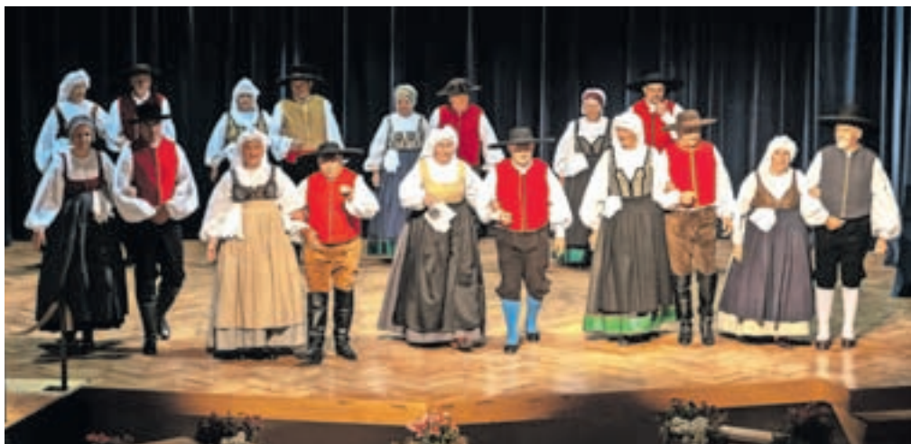
Predstavili so se tudi člani Folklornega društva Šenčur.

Prej 52 leti so se v francoskem Confolensu sestali zastopniki desetih evropskih držav z namenom osnovati mednarodno folklorno organizacijo, ki bi z organiziranimi festivali ohranjala in širila tradicionalne oblike različnih ljudskih kultur. Tako se je rodila mednarodna zveza organizacij folklornih festivalov in ljudske umetnosti CIOFF, v katero je danes včlanjenih 110 nacionalnih sekcij z več kot 250 mednarodnimi folklornimi festivali in akreditacijo pri Unescu. Med njimi je tudi Slovenija, ki je od leta 2005 dalje sodelovala v srečanju sosedskih držav s Hrvaško, Italijo in Avstrijo. Festival je bil prvotno znan pod imenom Festival Alpe-Adria, lani pa so se organizatorji dogovorili, da pritegnejo k sodelovanju tudi Madžarsko in ga preimenujejo v festival Sosedje. Organizacijo