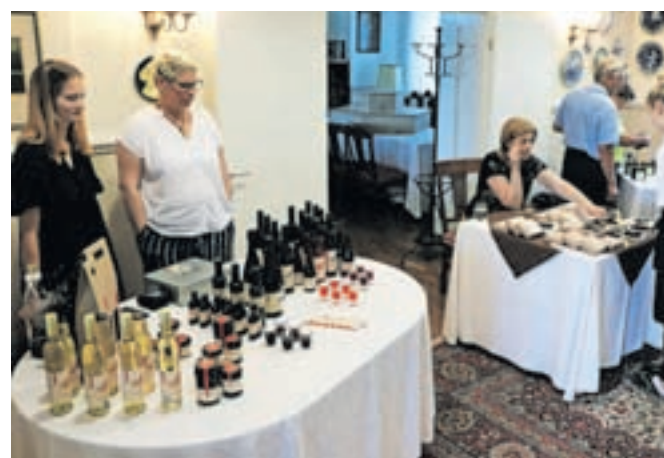
Kolodvorsko tržnico bo Hotel Triglav Bled gostil vsako tretjo nedeljo v mesecu.

Pri glavni jedi je bila kraljica krožnika postrv oziroma njen file z zeliščno