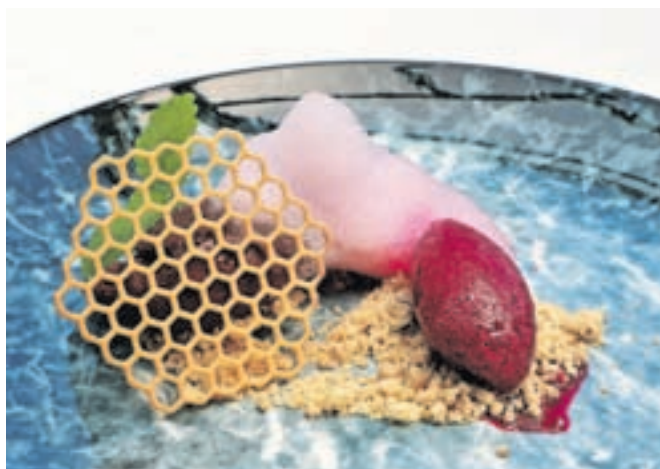
Mousse temne čokolade, sorbet aronije in pese ter pena borovničevega likerja

soljo, dodani so bili konopljni rezanci, krema kopri-ve in česnov konfit. Za sladico pa so postregli mousse temne čokolade, sorbet aronije in pese ter vse skupaj odeli v peno borovničevega likerja.