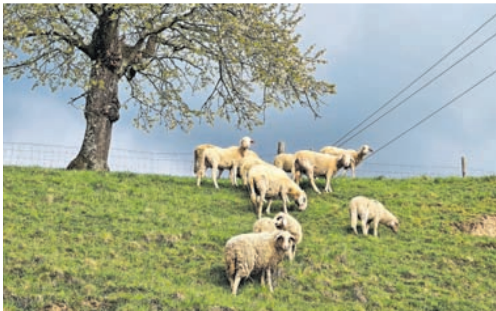
V shemi Izbrana kakovost je odslej tudi drobnica.

pa bo vsako leto ugotavljala skladnost njihovih izdelkov z zahtevami iz specifikacije. Če so živali rojene, zrejene in predelane na kmetiji, lahko uporabniki znaka Izbrana kakovost dodajo še označbo »kmečki«.