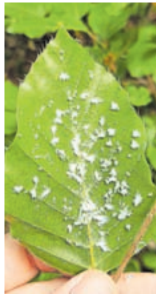
Luknjice v listu – značilna poškodba bukovega rilčkarja skakača

Na kranjskem gozdnogospodarskem območju, kjer je po podatkih iz desetletnega gozdnogospodarskega načrta za gozdnogospodarsko območje Kranj 2021–2030 nekaj manj kot četrtina bukve, letos večjih poškodb listov zaradi