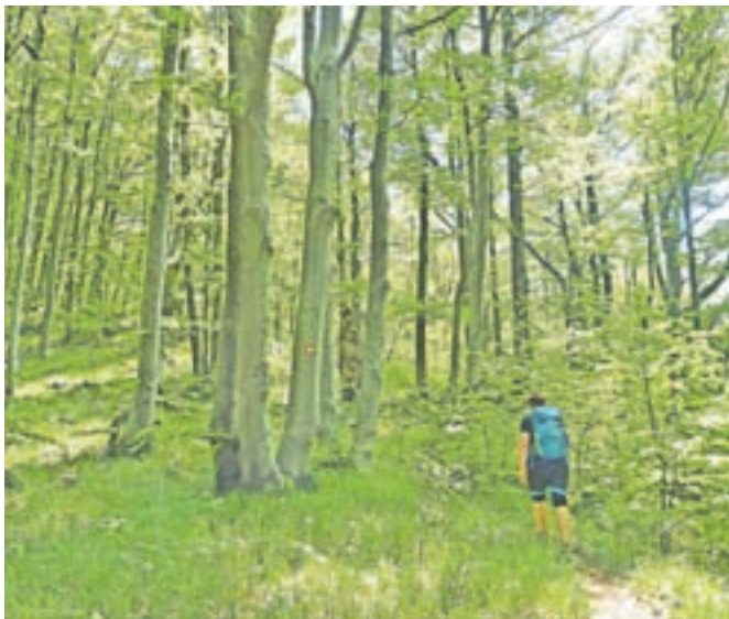
Prijetna pot skozi strnjen bukov gozd

Nadmorska višina: 1109 m Višinska razlika: 250 m Trajanje: 2 uri in 30 minut Zahtevnost: ★ ★ ★ ★ ★