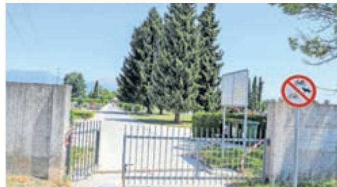
Dosedanja nizka vrata bodo zamenjali z vrtljivimi.

Kranj – Komunala Kranj te dni izvaja gradbena dela na vhodu na Mestno pokopališče Kranj pri nakupovalnem središču Supernova Qlandia. Kot so razložili, bodo odstranili dosedanja nizka vrata in jih nadomestili z vrtljivimi. S tem posegom želijo med drugim preprečiti tudi prehode čez mestno pokopališče s kolesi in mopedi, kar je sicer prepovedano, a do njih vseeno pogosto prihaja. Poleg tega je vožnja s kolesi in motornimi kolesi po pokopališču zelo moteča in nespoštljivo do obiskovalcev in pokojnikov, še poudarjajo v Komunali Kranj, ki je upravljavec kranjskega pokopališča. V času del na tem vhodu vstop ni možen, je pa na vseh drugih vstopnih točkah – najbližja je pri toplarni.