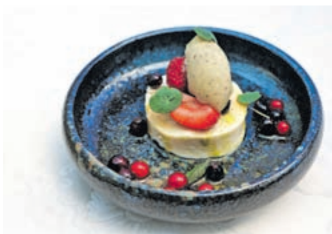
Mladi sir in fermentirano jagodičevje, sorbet zeliščnega čaja, olje mlade čebule