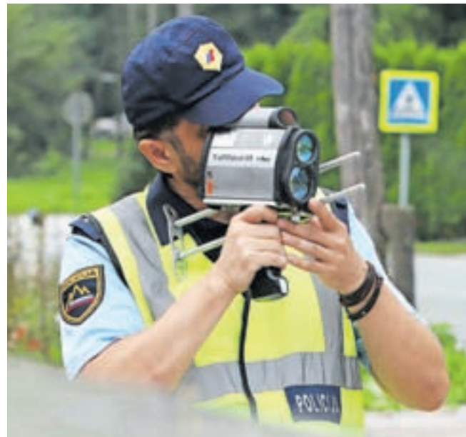
Policisti bodo do nedelje meritve hitrosti izvajali na najbolj izpostavljenih mestih.

Število prometnih nesreč zaradi neprilagojene hitrosti se je letos zvišalo za 18 odstotkov. Smrtnih žrtev je bilo enajst, kar je dobro tretjino manj kot lani, delež umrlih zaradi hitrosti med vsemi umrli pa se je znižal z lanskimi 46 na 31 odstotkov. Kar pet letošnjih smrtnih prometnih nesreč so povzročili vozniki v starosti od 18 do 34 let, ti vozniki pa so letos povzročili trikrat več nesreč zaradi neprilagojene hitrosti kot vozniki nad 65 let.