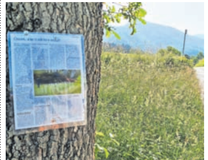
Članek na drevesu ob cesti med Mačami in Bašljem opozarja lastnike psov na to, da so pasji iztrebki lahko vir različnih bolezni pri govedu.

»Ravnanje lastnikov psov je glede iztrebkov urejeno v občinskih pravnih aktih. Ti določajo, da je iztrebke treba pobirati, določena je kazen. A to velja le za javne površine, ki so v lasti ali v upravljaj- nju občine. Drugače je na podeželju, kjer se psi spre- hajajo po kmetijskih in goz- dnih zemljiščih izven na-