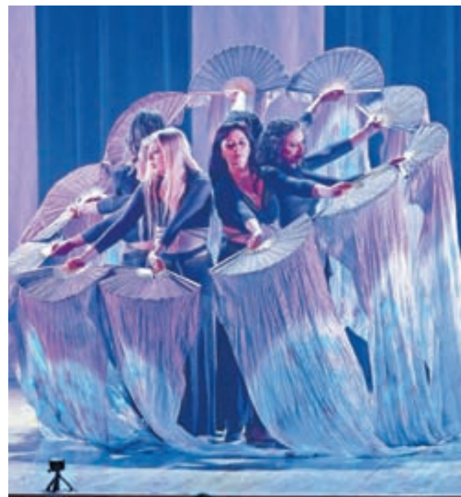
Plesalke so z rekviziti še dodatno popestrile nastope

v epidemičnem obdobju, ko so bili stiki, druženje pa tudi ples omejeni. V obdobju, ko so sproščene pogovore ob kavi zamenjale skrbi, ko nam je manjkalo predvsem smeha in zabave, pravita. Prav zato sta se odločili, da letos s svojimi učenkami z vseh vetrov in vseh starosti gledalcem ponudita spro-