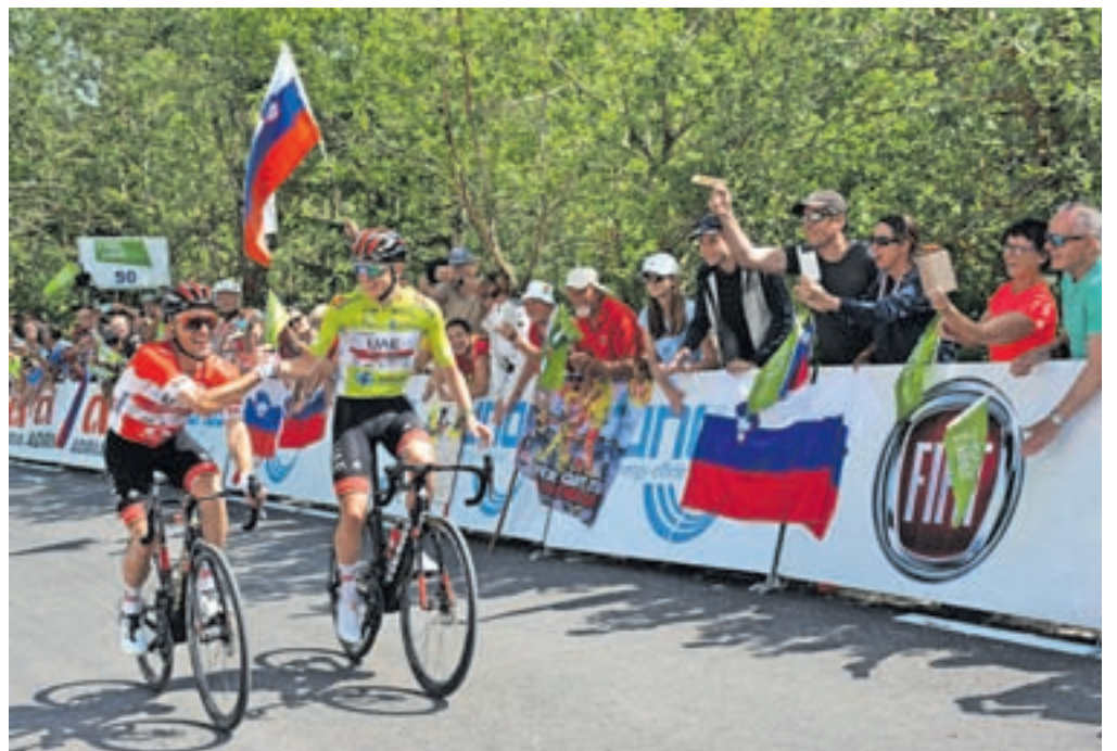
Dirko Po Sloveniji sta zaznamovala klubski kolega Tadej Pogačar (desno) in Poljak Rafal Majka. Skupaj sta zaključila tudi kraljevsko etapo s ciljem na Veliki planini, kjer je navijalo več tisoč ljubiteljev kolesarstva. Etapo je dobil Majka, dirko pa Pogačar.