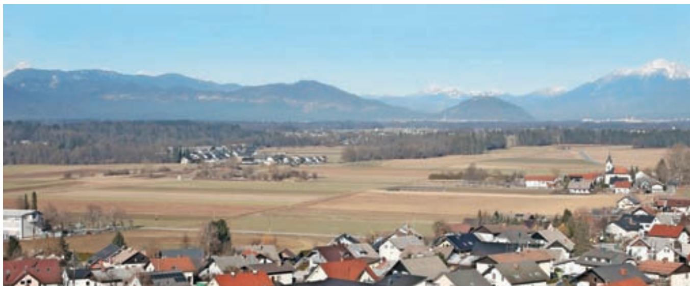
Del komasacijskega območja – pogled s poti, ki vodi na Stari grad nad Smlednikom

Minister za kmetijstvo, gozdarstvo in prehrano dr. Jože Podgoršek je medvoškemu županu Nejc Smoletu simbolično izročil odločbo o dodelitvi denarja 9. februarja na Starem gradu nad Smlednikom, od koder sta si s »ptičje perspektive« tudi ogledala komasacijsko območje.