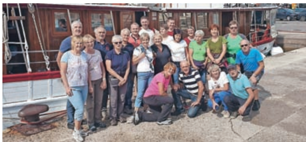
Naše najlepše lansko potovanje je bilo potovanje z barko po jadranskih otokih. Na fotografiji je naša ekipa.

Sedaj je tudi pravi čas, da začnemo razmišljati o letošnjih kolesarskih podvigih. Pogosto smo ljudje bolj motivirani, če si zadamo kakšen cilj ali podvig. Z misljo na podvig se večkrat spravimo v pogon. Na tem mestu vas bom poskušal navdušiti za kakšno potovanje z Gorenjskim glasom. V nekaj nadaljevanjih bom opisal naša lanska podviga. Na