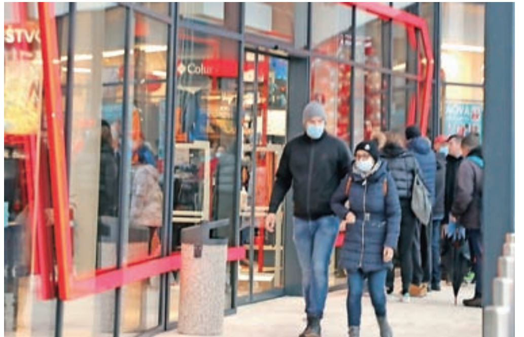
Splošni higienski ukrepi, kot je uporaba zaščitnih mask, ostajajo v veljavi. Slika je simbolična.