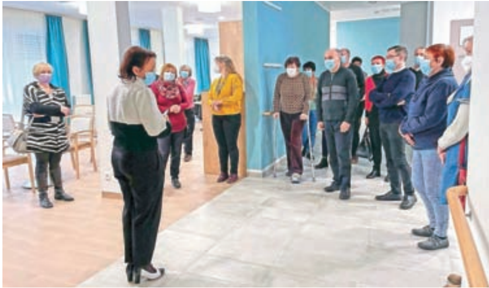
V domu so v petek gostili člane akcijske skupine starosti prijazne občine Žiri.