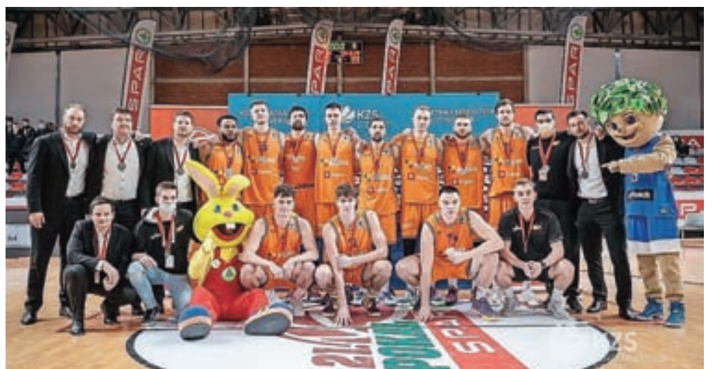
Domžalski Helios Suns so pokalni podprvaki letošnje sezone.

Na drugi strani so Domžalčani petič igrali v finalu, naslov so osvojili leta 2007. Kljub porazu so zadovoljni, saj so izpolnili enega od tihih ciljev letošnje sezone – uvrstitev v finale enega od treh tekmovanj, v katerih nastopajo. V polfinalu so premagali Rogaško. »Po našem naletu v drugi četrtini so nam nasprotniki s štiri zadetimi trojkami na začetku drugega polčasa vrnilo udarec. Olimpija ima širok spekter napadov, menim, da smo na to dobro odreagirali in dokaj optimalno ustavljali napade nasprotnikov. Velik del v naši igri je predstavljal prebijanje obrambe, a nas je na koncu zmanjkalo. Ponosni smo na drugo mesto, nasprotnikom pa