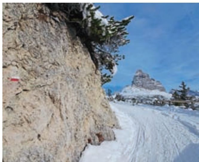
Del udobne mulatjere s pogledom na Tri Cine

Nadmorska višina: 2324 m Višinska razlika: 565 m Trajanje: 5 ur Zahtevnost: ★★★★★