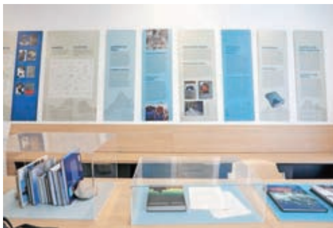
Približali so več kot petdeset knjig, v katerih je 28 slovenskih alpinistov opisalo svoje izkušnje z osemtisočaki.