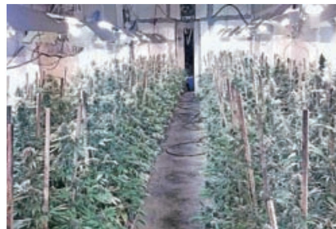
V hišnih preiskavah, ki so prejšnji teden potekale tudi na vzhodnem delu Gorenjske, so kriminalisti odkrili tri prirejene prostore za gojenje konoplje.