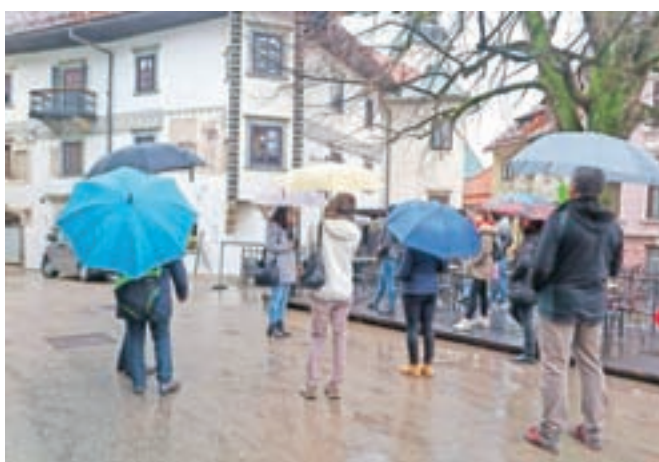
Škofja Loka je zanimiva za številne tujce, s pomočjo turističnih vodnikov pa o njej marsikaj novega lahko izvedo tudi domačini.

»Od mladega so me zanimale vse stvari, povezane z družboslovjem, že v gimnaziji so me zanimali tudi mnogi tuji jeziki. Prav tako rada potujem in vse