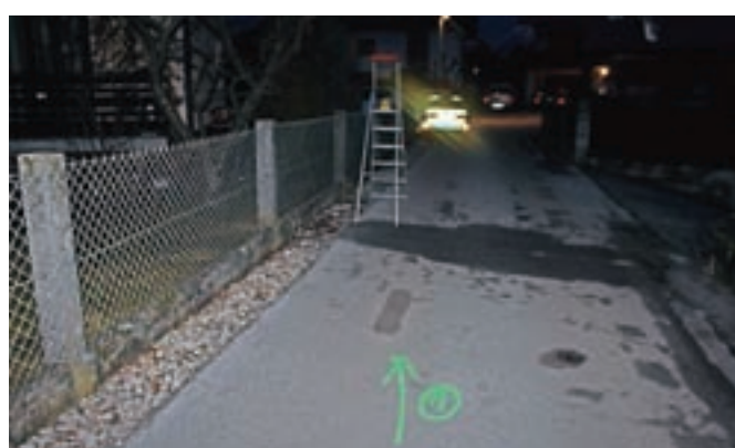
Mlajši voznik skiroja se je zaletel v lesteve, s katere je občan obrezoval drevje.

Kranj – Kranjski policisti obravnavajo prometno nesrečo s hudimi telesnimi poškodbami, ki se je zgodila v nedeljo ob 16.35 na Ulici Milene Korbarjeve v Kranju. Neznani mlajši voznik skiroja je s prednjim delom skiroja trčil v lesteve, postavljeno ob robu vozišča, zaradi česar je z nje padel moški, ki je v tistem trenutku obrezoval drevesa, in se hudo poškodoval. Zaradi razjasnitve vseh dejstev in okoliščin policisti prosijo morebitne priče, da pokličejo na interventno številko 113, anonimno številko 080 1200 ali na Policijsko postajo Kranj (04) 233 64 00.