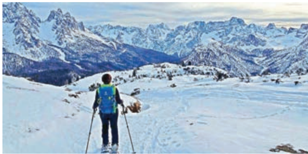
Z vrha je čudovit razgled na vse strani neba. Proti jugu se pokažejo Cadini di Misurina in Sorpiss.

strani vlečnice. S parkirišča nadaljujemo po travnatem pobočju, kjer je tudi steptana proga. Povzpemo se do vojaške mulatjere, ki je ravno tako steptana. Po tej poti občasno tudi vozijo turiste z motornimi sanmi. Enaka zgodba kot po cesti do koč Auronzo, Tri Cine. Po približno pol ure opazimo smerokaz, ki označuje pot levo. Po tej poti se bomo vrnili. Nadaljujemo kar naravnost. Mulatjera, ki ji sledimo, se počasi vzpenja in približno po eni uri smo pod vznožjem gore. Tukaj tudi opazimo stezo, ki se spušča v dolino. Nanjo bomo zavili ob sestopu. Od tod dalje se pot