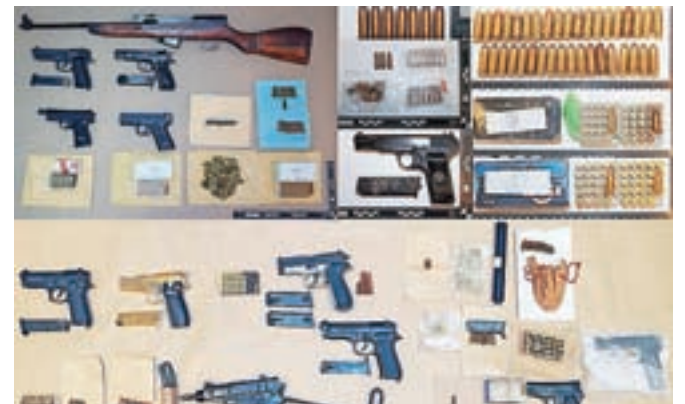
Zaseženo orožje in strelivo

V okviru mednarodne preiskave so kriminalisti v sodelovanju z varnostnimi organi Italije, Španije, Francije,