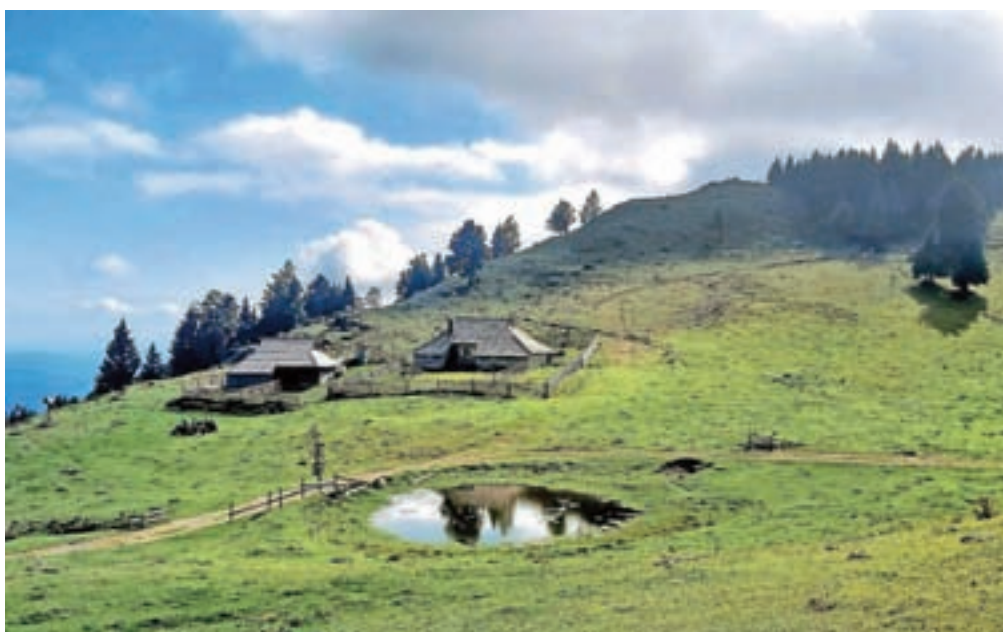
Na Kamniškem se nadaljuje iskanje možnosti za zaščito doline Kamniške Bistrice, Velike planine in drugih predelov Kamniško-Savinjskih Alp v občini.