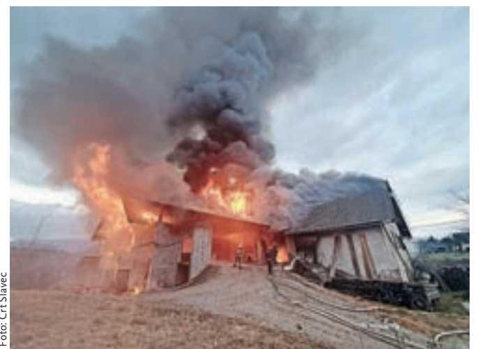
Ob prihodu prvih gasilcev je bil požar že popolnoma razvit.

Skoraj istočasno je prišlo tudi do požara na deponiji peska v Zgornjih Bitnjah, kjer je ob kurjenju odpadnega lesa zagorelo na površini 20 metrov x 20 metrov.