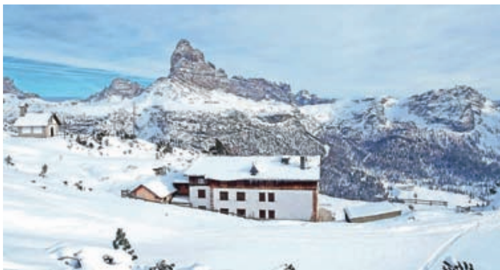
Že nad kočjo Monte Piana, pogled pa še enkrat na Tri Cine