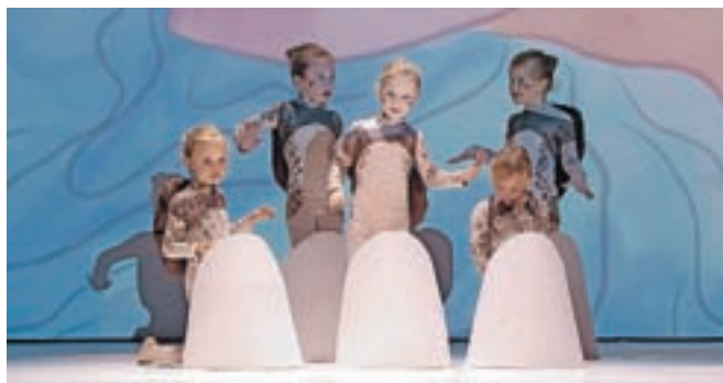
Učenke iz plesnega vrtca so takole upodobile male želvice.

Po premieri in nastopih v Kamniku so gostovali tudi že v Radomljah in Cerkljah, z veseljem pa se bodo odzvali tudi drugim vabilom.