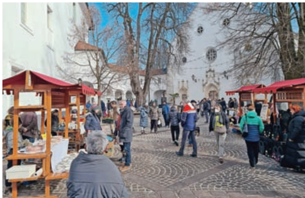
Radolška tržnica je nadaljevanje Podvinske.

Mi smo se oglasili na februarjski Radolški tržnici, je pa za vogalom že marčevska: Radovljica jo bo gostila 5. marca.