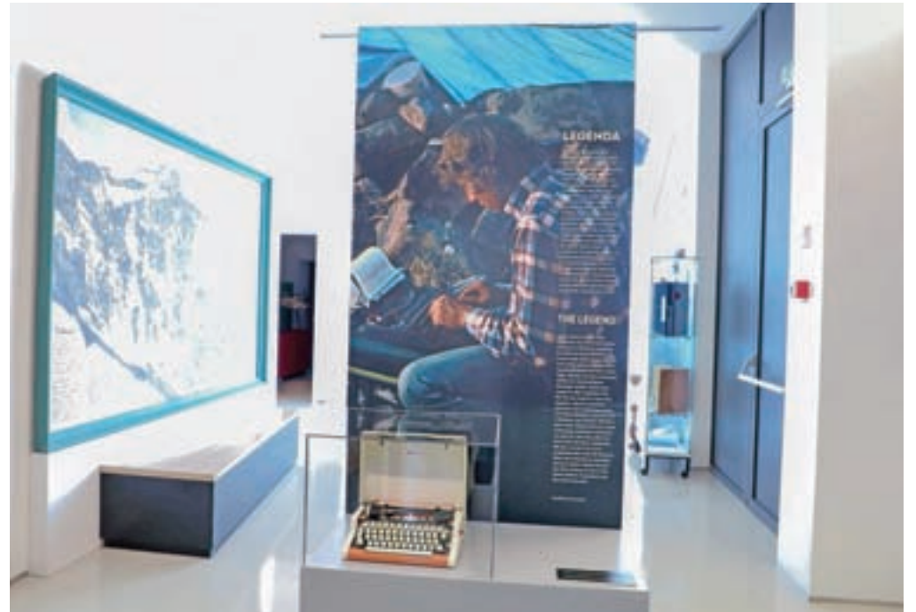
Pisalni stroj Nejca Zaplotnika, s katerim je zapisal tudi znameniti stavek: »Kdor išče cilj, bo ostal prazen, ko ga bo dosegel, kdor pa najde pot, bo cilj vedno nosil v sebi.«

Gorje – Čebelarji Gorij in Bleda so pristopili k projektu Čebelarstva Slovenije in Zavoda za gozdove ob dnevu sajenja medovitih rastlin, ki bo 26. marca. Zavod namerava do leta 2030 posaditi dva milijona sadik, čebelarstva zveza pa bo letos čebelarjem razdelila trideset tisoč sadik drevja in grmovnic. Čebelarji Bleda in Gorij bodo sadike posadili okrog čebeljakov in po degradiranih gozdnih območjih. Istočasno bodo na območju Gorij nad Grabčami obnovili gozd z novimi sadikami iglavcev in listavcev.