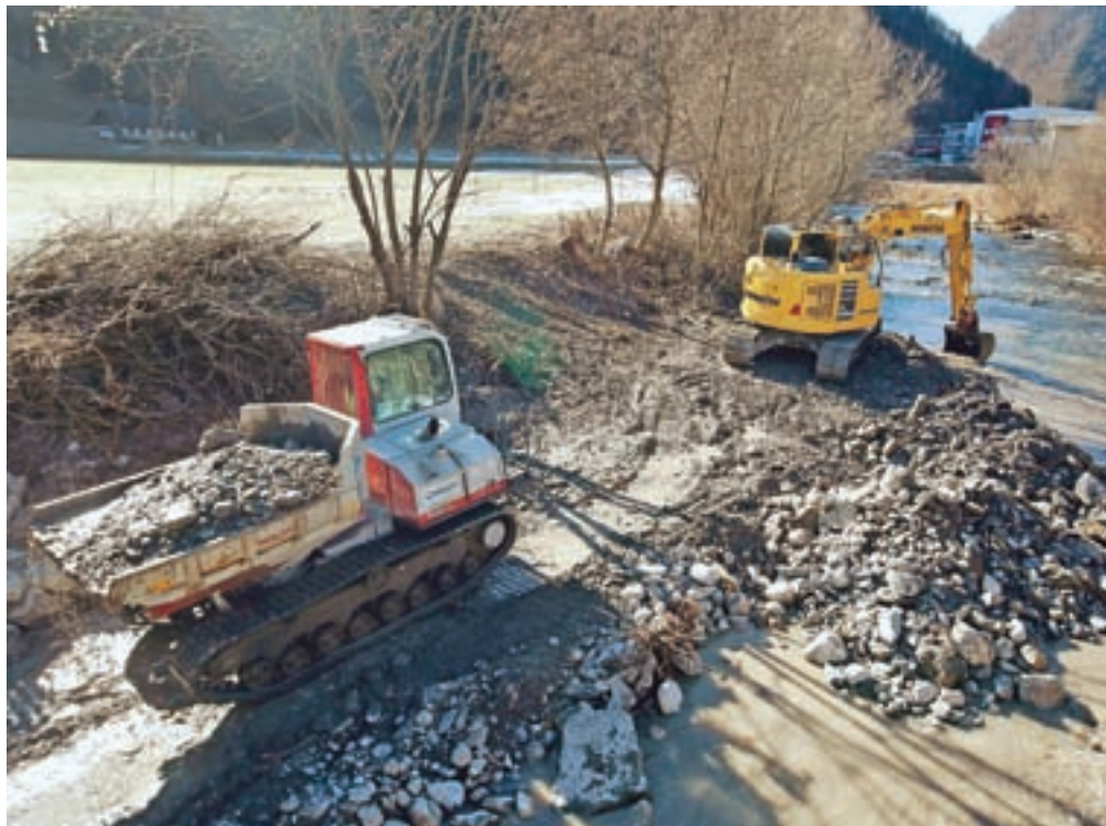
V osnutku načrta zmanjševanja poplavne ogroženosti 2022–2027 so tudi protipoplavni ukrepi v Železnikih, ki jih že izvajajo.

Osnutek načrta prepoznava na Gorenjskem kot poplavno najbolj ogrožena