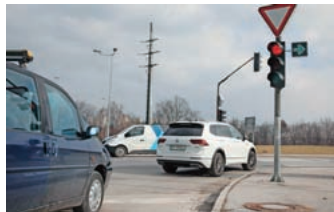
Na novi znak na Laborah se vozniki še privajajo.

Opozoriti velja še, da je zavijanje v desno ob rdeči luči omogočeno, ni pa obvezno. Če se voznik ne počuti dovolj suverena ob novem pravilu, je bolje, da počaka zeleno luč.