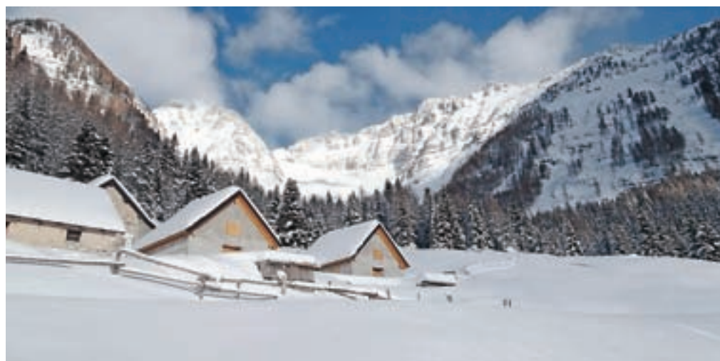
Planina Krni dol, zadaj pa ostenje Poliških Špikov

Nadmorska višina: 1525 m Višinska razlika: 400 m Trajanje: 4–5 ur Zahtevnost: ★★★★★