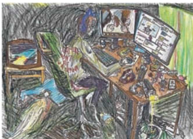
Izbrana dela bodo objavljena na plakatnih mestih, med njimi tudi posebej poudarjena risba Lili Džunov.

Najboljša dela bodo objavljena tudi na spletnih straneh MC Kotlovnica.