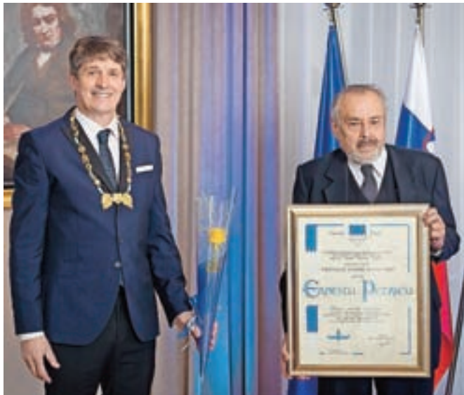
Župan je naziv častni občan občine Tržič podelil prof. dr. Ernestu Petriču.

Tržič – Dvanajsti december je pomemben dan v zgodovini Tržiča, saj je leta 1492 prejel trške pravice in se s tem začel hitreje obrtniško razvijati. Žal epidemija tudi letos ni dopustila, da bi skupaj praznovali občinski praznik, so se pa s spletnim in prenosom po lokalni televiziji v nedeljo zvečer z občinskimi priznanji zahvalili posameznikom in skupnosti. Za častnega občana občine Tržič so imenovali prof. dr. Ernesta Petriča, Tržičana po rodu, ki je opravljal številne strokovne, politične in vodstvene funkcije in je še vedno aktiven. Je tudi avtor več kot deset znanstvenih monografij. Prof. dr. Petrič je v svoji karieri prejel mnoga visoka odlikovanja in priznanja, priznanje v rodnem Tržiču pa ga je, kot je dejal, čustveno še najbolj vznemirilo, se dotaknilo srca. »Lepo je biti v domačem kraju in videti, da te ljudje cenijo, spoštujejo.« Prof. dr. Petrič danes živi na Bledu, a se s Tržičem, kjer je začel tudi svojo karierno pot, še vedno čuti povezanega. »Tu sem bil povabljen, in za to sem večno