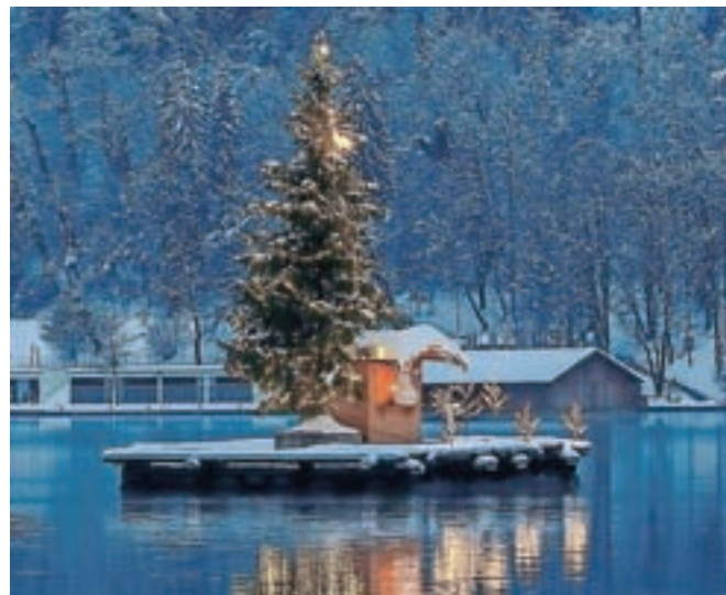
Zimska vasica na jezeru pod Blejskim gradom

vasico postavili na jezero, že postali eden od najbolj priljubljenih fotografskih motivov v destinaciji. »Bled je v teh dneh pravi raj za fotografe in vse, ki si kljub slabim časom želijo nekaj decembrske svetlobe in topline,« so zadovoljni na Turizmu Bled, kjer so poskrbeli tako za okrasitev kot za praznični program.