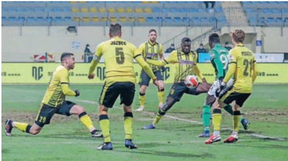
Nogometaši Kalcerja Radomlje (v rumenih dresih) so leto zaključili s tesnim porazom proti Olimpiji.

Njihovi sosedi iz Domžal so po jesenskem delu na šestem mestu. V 19 tekmah so šestkrat zmagali, petkrat igrali neodločeno in osemkrat