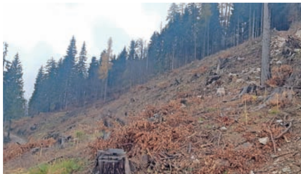
V Škofiji Novo mesto in v njeni družbi Beneficij si prizadevajo čim prej sanirati gozdove, ki so jih prizadele ujme in podlubniki.

udeležuje tudi tečajev za lastnike gozdov. Kljub že bogatim izkušnjam se je pred kratkim v Žireh udeležil tečaja za varno delo z motorno žago v gozdu.