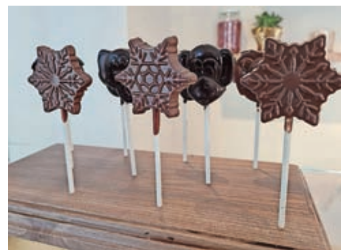
Decembrski čokoladni izbor v radovljiški butični čokoladnici lepo dopolnijo tudi simpatične lizike.