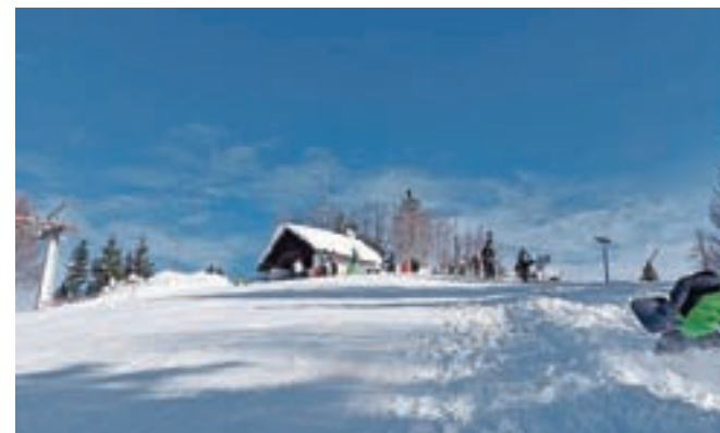
Snežna pravljica na Španovem vrhu

Španov vrh Milan Klinar, so bili prvih smučarjev zelo veseli in upajo, da bo obisk smučišča dober čez celo zimsko sezono. »Smučišče je zelo dobro pripravljeno in urejeno. To nam omogoča debela snežna odeja in nizke temperature,« je povedal Klinar. Smučišče bo do nadaljnjega delovalo vsako soboto in nedeljo, odprta pa