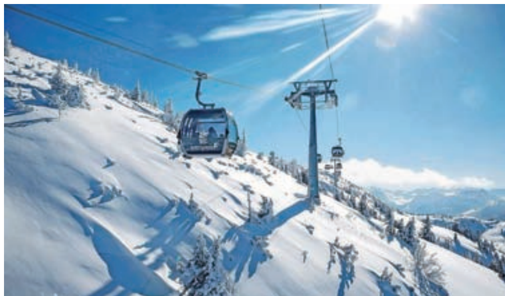
Nova krožna kabinska žičnica naj bi že konec poletja 2023 nadomestila staro dvosedežnico Zadnji Vogel.