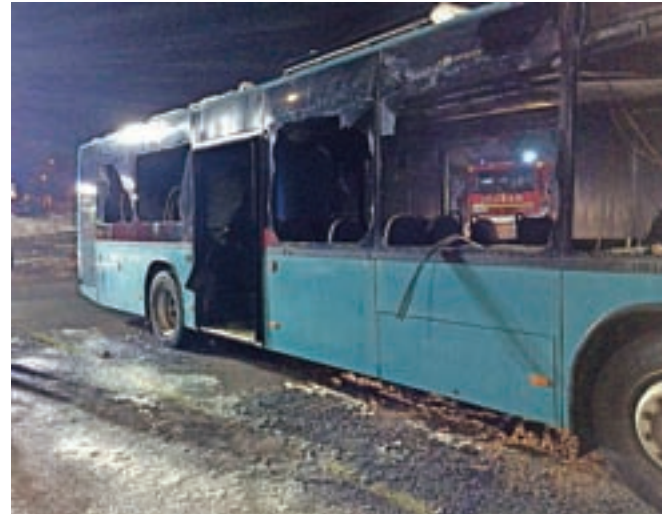
Po neuradnih podatkih je preminuli mladenič skrivaj vstopil v avtobus, ko je bil ta že parkiran na dvorišču podjetja Arriva. Zagorelo naj bi v notranjosti vozila.

V četrtek popoldne je zagorel avtobus na dvorišču podjetja Arriva na Ulici Mirka Vadnova v Kranju. V njem so gasilci našli tudi negibnega moškega, po neuradnih podatkih je šlo za osemnajstletnika iz Predoselj, za katerega so žal ugotovili, da je mrtev. »Po sprožitvi alarma ob 16.20 smo bili gasilci na kraju požara v nekaj minutah. Požar so že skušali gasiti zaposleni z gasilnimi aparati, a so bili neuspešni, saj je avtobus že preveč gorel. K sreči je bil parkiran na samem, tako da smo ga gasilci le obkolili in požar pogasili. Med pregledom notranjosti avtobusa smo našli na neozdravljivo osebno in jo predali reševalcem, ki so potrdili naš sum, da je