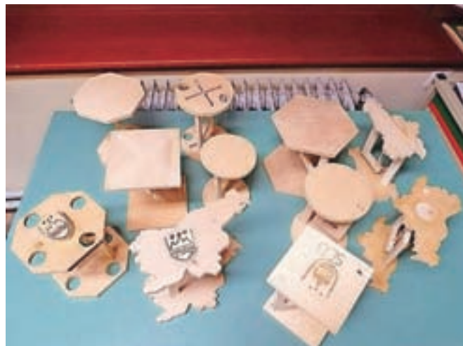
Izdelki tekmovalcev iz OŠ Gorenja vas