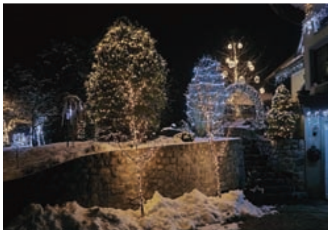
Prižig lučk so si občani lahko ogledali tudi na spletu.

360-stopinjskega videa. Izvemo, da je ustvarjanje prazničnega decembrskega vzdušja družini v veliko veselje. To počnejo že več kot pet let in za okraševanje navadno potrebujejo teden dni; in nato tudi en teden, da okrasitev pospravijo. Nekatere podrobnosti, kot so velike svetlobne krogle na drevesu, pa zahtevajo še kakšen dan priprav več. Kljub velikemu številu lučk pa pazijo, da je končni učinek še vedno okusen in ne preveč kičast.