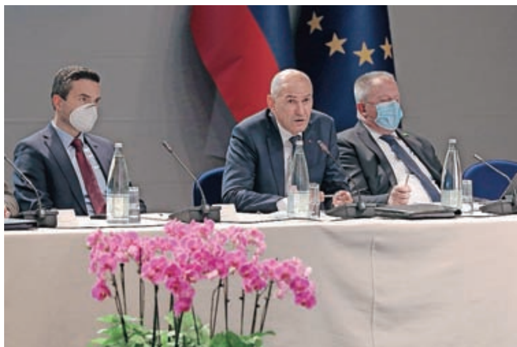
Vlada je na Gorenjskem videla mnogo dobrih praks, ki so lahko za zgled drugim, je ugotavljal premier Janez Janša.