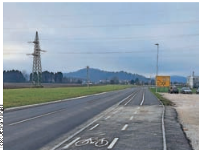
Nova pridobitev za kolesarje in pešce v Mengšu

»Z novo kolesarsko stezo in pločnikom smo omogočili varen prihod do družbe Lek tudi kolesarjem in