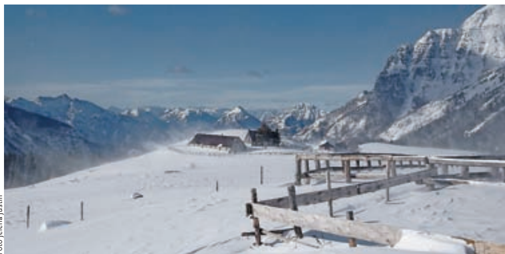
Na planini Pecol je v soboto malce pihalo. Desno se vidi zasneženo pobočje Strme peči.