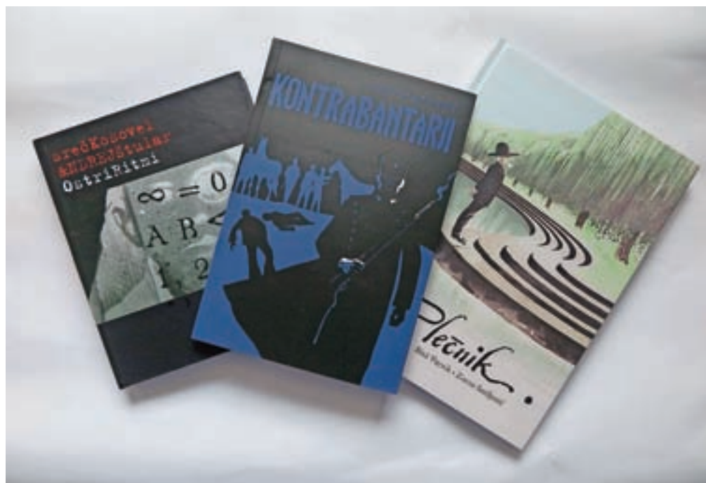
Stripovska jesen po Gorenjsko

Striparja, lutkarja in vsestranskega ustvarjalca Andreja Štularja je z izrazno močjo in duhovito ostrino svojih pesmi navdihnil Srečko Kosovel. Štular je v knjigi z naslovom Ostri ritmi iz njegovih pesmi zgradil ritmične vizualne kompozicije, ki se iz stripa prelivajo tudi v druge načine upodabljanja. Ostri ritmi tako raziskujejo meje med besedo in podobo ter različne možnosti vizualne naracije, pri