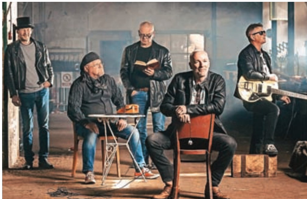
Skupina Mal prepozn s svojo glasbo kljubuje času.

»Sledilo je navdušenje ter spoznanje, da ni nujno, da vsak, ki preseže abrahama, sloni zgolj za 'šankom'. To nas je še bolj povežalo, po polletnem enotedenskem večurnem preigravanju priredb pa smo povsem realno ugotovili, da smo ob koncu vsake vaje precej utrujeni