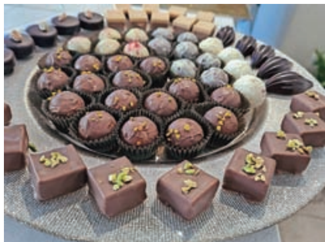
Bogat čokoladni izbor

s čokolado slabih odločitev ni, ampak načrt je bil – vsaj tako sem bila odločena – da kupim največ dva pralineja in ju potem doma v miru