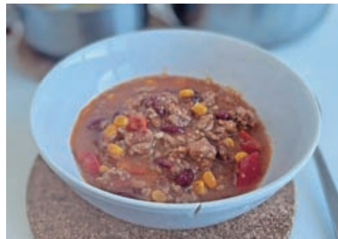
Moja najljubša mojstrovina iz enega lonca – čili z mesom

mojstra v izvornosti jedi, ki se pripravijo v enem loncu, a mi bodo tudi testenine ter rižote na sto in en način kmalu pogledale iz ušes.