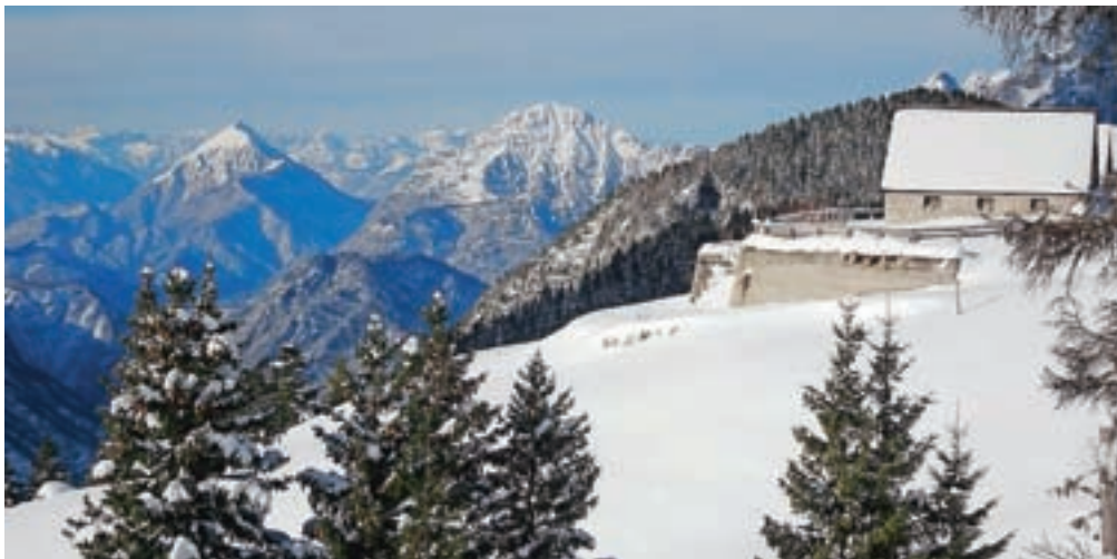
Planina Larice s Pisimonijem in Amariano, daleč zadaj pa Božji prestol oz. Monte Pelmo v Dolomitih

V teh zimskih razmerah je najboljša slediti utrjenim turnim potem. In tudi na naši turi bo tako. Že na parkirišču si natakemo krplice in zagrizemo v okljuke, ki gredo po smučišču. Pot nas kmalu usmeri desno. Smo na markirani poti 625, ki se ponekod strmo dviguje skozi gozd. Udobna, čudovita in izjemno razgledna pot se počasi vzpenja proti planini Krni dol. Na ključnem mestu nas smerokaz usmeri levo v gozd. Kratki okljuki, ki strmo zavijugajo skozi gozd, nas pripeljejo iz gozda ven, tik pod planino. Nad planino zagledamo skalno pregrado Poliških Špikov (Špik nad Nosom in Vrh Krnega dola), pregrado, preko katere poteka ena najlepših zavarovanih poti v Zahodnih