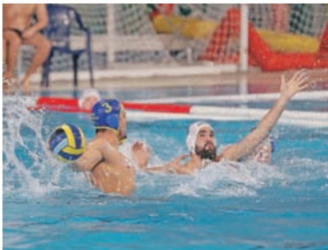
Vaterpolisti Triglava (v modrih kapicah) so ligaški del zaključili brez poraza. Na zadnji tekmi so premagali Kamničane.