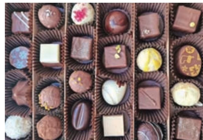
Čokoladne pralineje vam lahko zapakirajo v lično škatlico, lahko pa si jih privoščite v obliki bomboniere.

Tisti dan po jetrcih v Karavli 297 o sladici nisem razmišljala, a ko sem se vračala v dolino, me je prešinilo, da bi se bilo prijetno »pocrklati« s čokoladnim pralinejem. Enim, največ dvema, sem bila odločna. Tako sem mimogrede »skočila« do Radovljice. Sicer ne vem, ali je bila to slaba ali dobra odločitev. Pravijo, da v zvezi