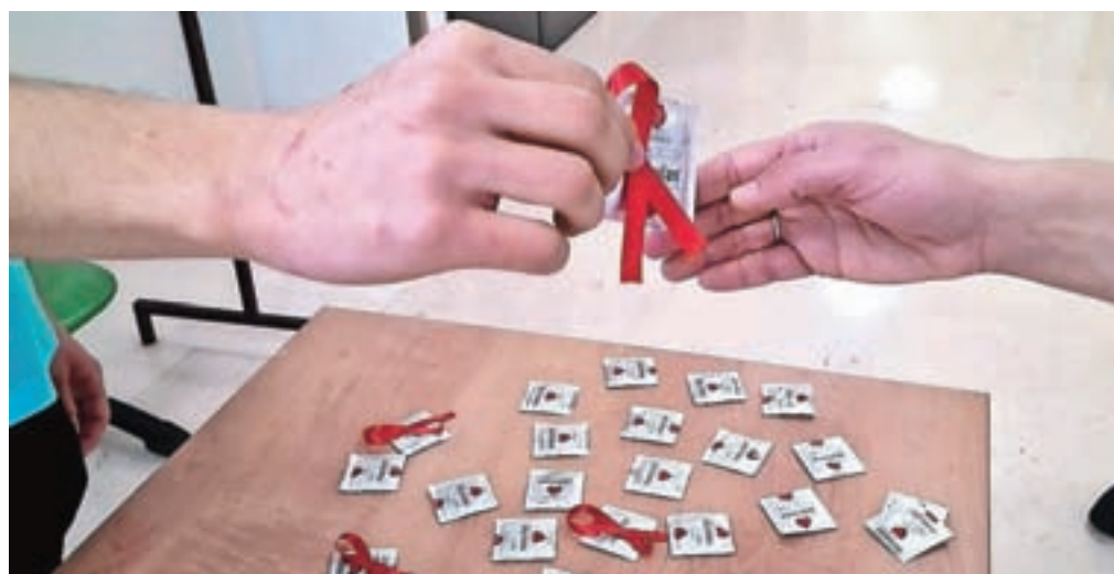
Kondomi in rdeče pentlje, simbol boja proti aidsu

čita z zdravili pred izpostavitvijo, v naslednjem letu bodo pri nas za moške, ki imajo spolne odnose z moškimi, uvedli to novo preventivno metodo. Novosti pa sta še presejanje vseh nosečnic na HIV ter možnost pregleda v ambulanti za spolno prenosljive okužbe brez napotnice.