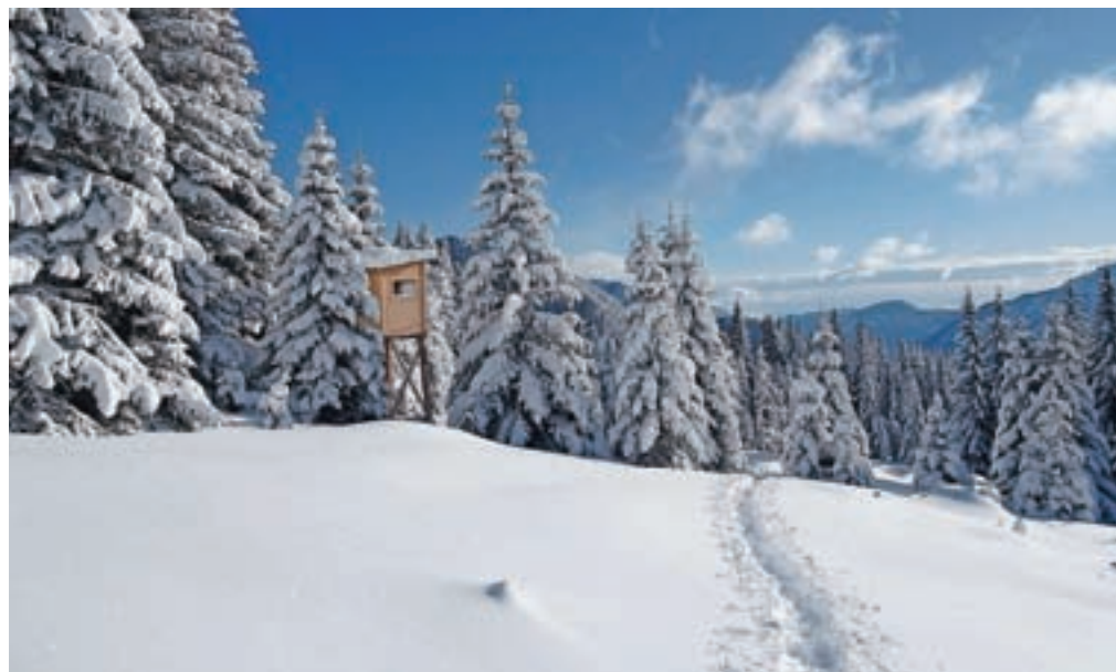
Skrita lovska opazovalnica, mimo katere tudi pelje pot na Voščo

Nadmorska višina: 1734 m Višinska razlika: 774 m Trajanje: 3-4 ure Zahtevnost: ★★★★★