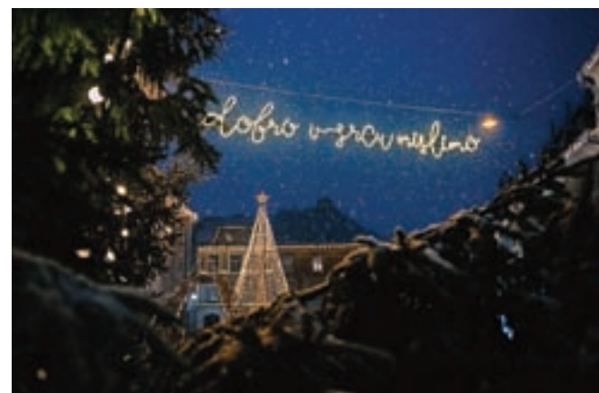
Lani so v dobrodelni akciji za posameznike in družine v stiski zbrali približno 31 tisoč evrov.

Prvo leto so s pomočjo dobrih ljudi zbrali enajst tisoč evrov, lani pa okoli 31 tisoč evrov za 28 posameznikov in družin v stiski. Vsaj enakega odziva si obetajo tudi letos, saj je – tudi zaradi korone – tistih, ki so se znašli na robu preživetja, vedno več. Družine, med katere bodo letos razdelili zbrane