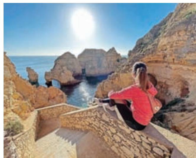
Razčlenjena portugalska obala in pogled na neskončni Atlantik

okrašeni Lizboni. Razmišljam o starih prijateljih, ki so naju obiskali, in tistih, ki prihajajo, ter o novih prijateljstvih, ki sva jih sklenila in jih še sklepava, o ljudeh, ki bodo del mojega