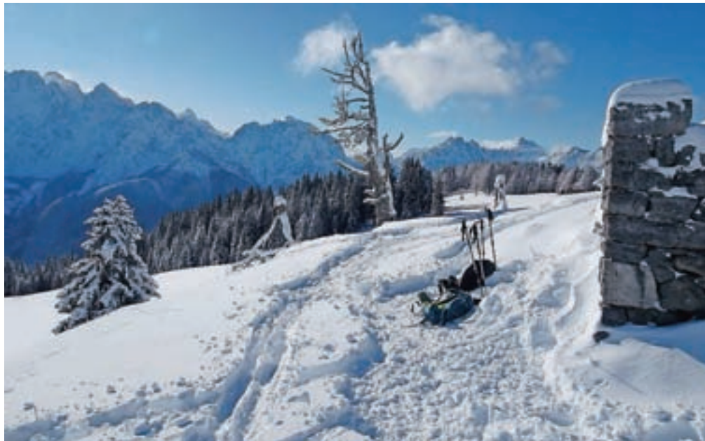
Razgled z vrha Vošče, kjer stojijo ruševine stražarnice

nato skozi gozd, v nekaj okljukih pridobimo precej višine, potem pa dosežemo travnik Jureževe planine, kjer se poleti sicer pase živina. Smo na višini približno 1400 metrov. Sledimo grabnu, bolj proti desni, in dosežemo zasneženo panoramsko cesto, ki nas v kopnih razmerah pripelje mimo lovske kočice do Železnice. V zimskih razmerah običajno le prečimo cesto in nadaljujemo po travniku, ki je pred nami proti gozdu. Ko prehodimo še nekaj višinskih metrov skozi gozd, smo na robu travnika, po katerem je Vošča dobro znana. Če je ogromno snega, je običajno na cesti gaz narejena proti Jureževi