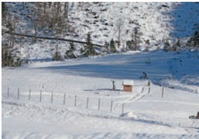
Novo smučišče na Jezerskem je namenjeno začetnikom, njegovo odprtje je načrtovano sredi letošnjega decembra.

Vesel je tudi, da se bo na Jezerskem tradicija nadaljevala, saj so v pridobivanju