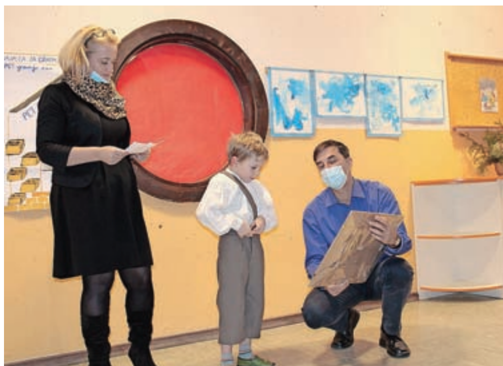
Otroci so županu v zahvalo izročili risbo »novega vrtca«.

tov, še posebej tistih, v katerih se nahajajo naši najmlajši občani. Zato ta investicija predstavlja en pomemben korak naprej. Na ta način smo zagotovili boljše pogoje za delo in vzgojo otrok na eni strani, na drugi strani pa smo naredili pomemben