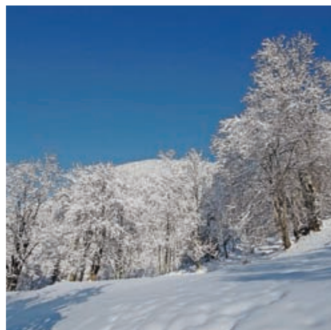
Zimska idila

Pretekli teden je bil vrh Vošče prekrit s pršičem. Do sestopa še ni bilo nobenega turnega smučarja, ki bi vriskal po celem snegu. Ko se