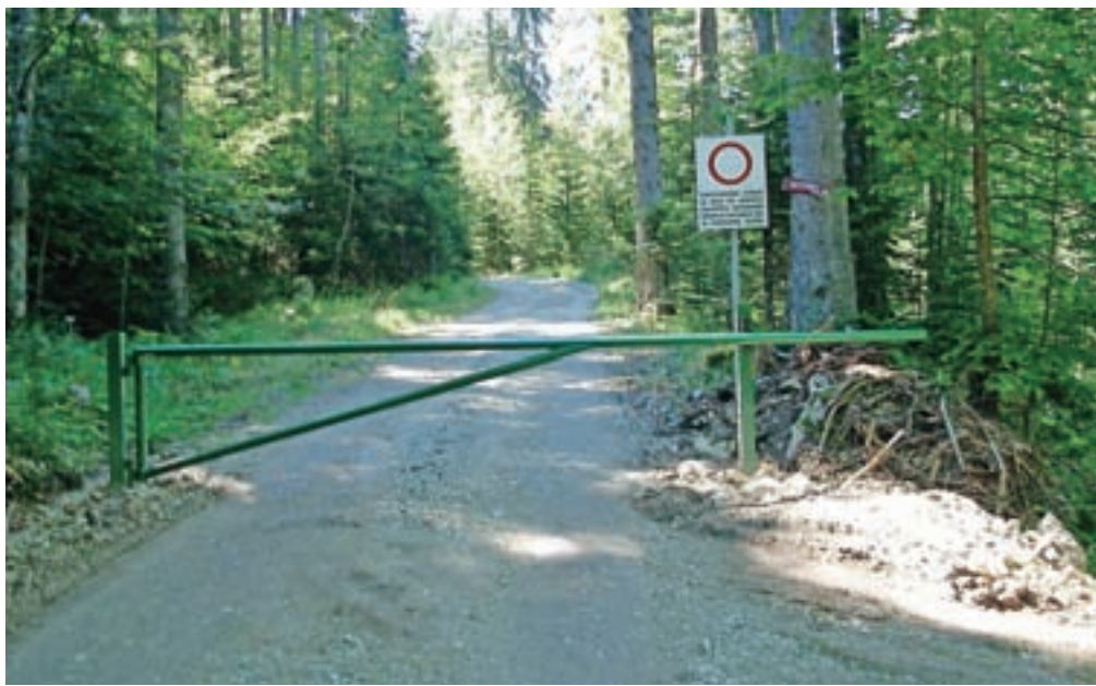
Ena od novih zapornic na gozdnih cestah na Pokljuki