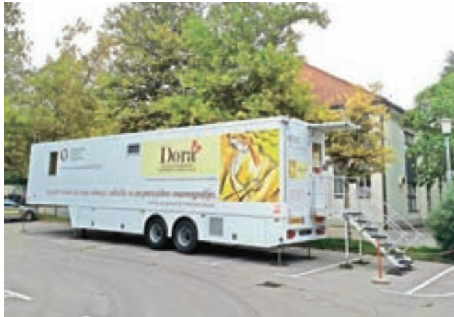
Mobilna enota programa DORA je znova parkirana pri Domu kulture Kamnik.

Od vseh slikanih žensk jih je 61 imelo nadaljnjo diagnostično obravnavo na Onkološkem inštitutu Ljubljana. Raka dojke so z dodatnimi preiskavami na Onkološkem inštitutu odkrili pri 14 ženskah, pri večini je bil na začetni stopnji bolezni. Ker so mobilno enoto zaradi reorganizacije dela postavili nekoliko kasneje, kot je bilo načrtovano, so del Kamničank za mamografijo v minulih tednih vabili v Zdravstveni dom Domžale; vabilu se je odzvalo 83 odstotkov vabljenih. Tokrat bodo na presejalno mamografijo povabili še preostali del žensk iz občine Kamnik med 50. in 69. letom starosti, ki še niso bile slikane.