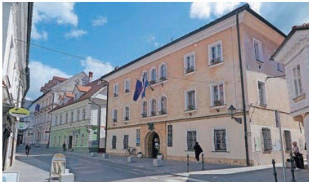
V postopku je še vedno tudi zahteva Meščanske korporacije Kamnik za vrnitev občinske upravne stavbe v Kamniku.

Na UE Tržič imajo v reševanju še pet zahtevkov po zakonu o denacionalizaciji, od tega so štirje večji (K. Born, Ročevnica, K. Polak in T. Knez, manjši zahtevki je F. Born), so pojasnili na UE Tržič. Od tega pri njih in na UE Celje rešujejo tri zahtevke, na Upravnem sodišču v Ljubljani pa vodijo več tožbenih zahtevkov. Na UE Tržič so kot glavne razloge, da se reševanje vleče tako dolgo, navedli, da so ostali samo najtežji postopki, glavni razlog so zahteve upravičencev za vračilo v naravi in ne v obliki odškodnine, tudi tam, kjer to ni možno (javno dobro). »Na parcelah so bili naknadno zgrajeni objekti, ceste ..., ki niso v lasti upravičencev, ti so upravičeni samo do odškodnine, a zahtevajo vračilo v naravi. Tam, kjer je možno, se vrača v naravi, a je treba predhodno ugotoviti funkcionalni del, ki