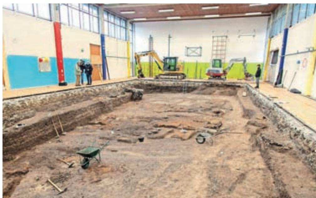
V prvi fazi izkopavanja potekajo v telovadnici, po njeni porušitvi pa bodo območje razširili na celoten tloris.