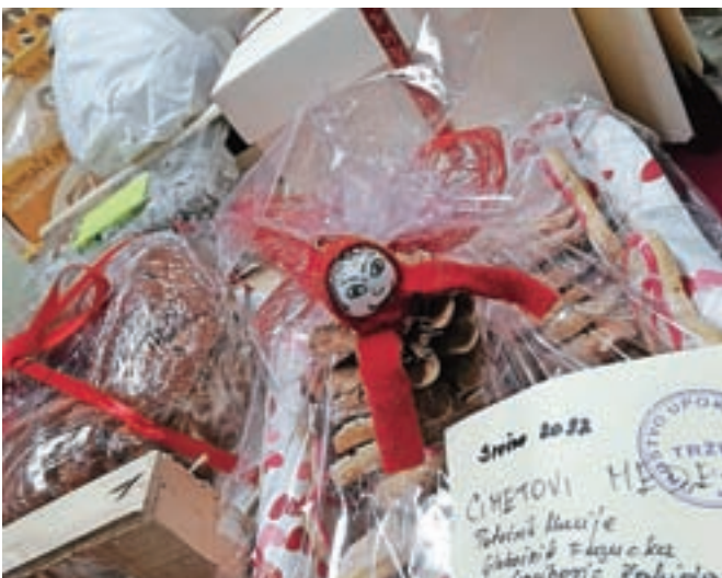
Na deseti dobrodelni dražbi prazničnih slaščic so zbrali 4500 evrov.

iz Tržiča ter okolice, smo tistim, ki se običajno udeležijo dražbe, poslali po elektronski pošti. Posamezniki so nato sporočili znesek, ki bi ga namenili za določeno slaščico, in tisti, ki je ponudil največ, je postal njen lastnik. V sredo smo vsem dražiteljem slaščice osebno dostavili.« Letos so z draženjem prazničnih slaščic zbrali 4500 evrov.