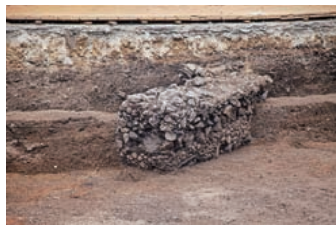
Del zidu rimskega poslopja

namreč že odkrili pet žarnih grobov iz pozne bronzne dobe oz. kulture žarnih grobišč.