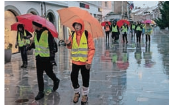
Učenci in delavci Vzgojno-izobraževalnega zavoda Frana Milčinskega Smlednik so se na pohodu iz Smlednika v Vrbo ustavili v Kranju.

»Nihče od pohodnikov ni bil fizično pripravljen na tako dolgo pot, zato so se nekateri spopadali z utrujenostjo, pestili so jih žulji, letos nam je še posebej zagodlo deževje, ki nas je spremljalo od samega začetka do konca. Sicer pa tako potrpežljive skupine v vseh 22 letih še nismo pospremili na pohod, nihče ni izrazil nezadovoljstva, vsi so se potrudili in uspeš-