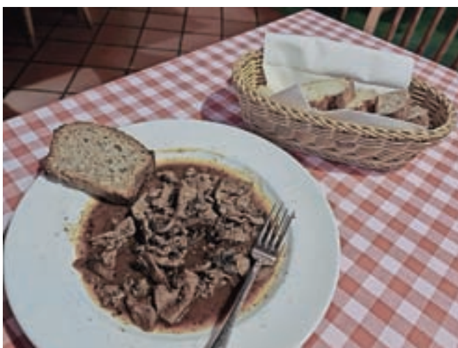
Tokrat so bila glavna jed jetrca.