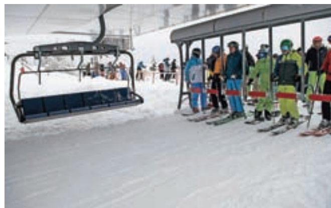
Zaradi sprejemljivejših ukrepov, ki med drugim ne zapovedujejo omejitve pri uporabi žičniških naprav, bodo letos manjše čakalne vrste.