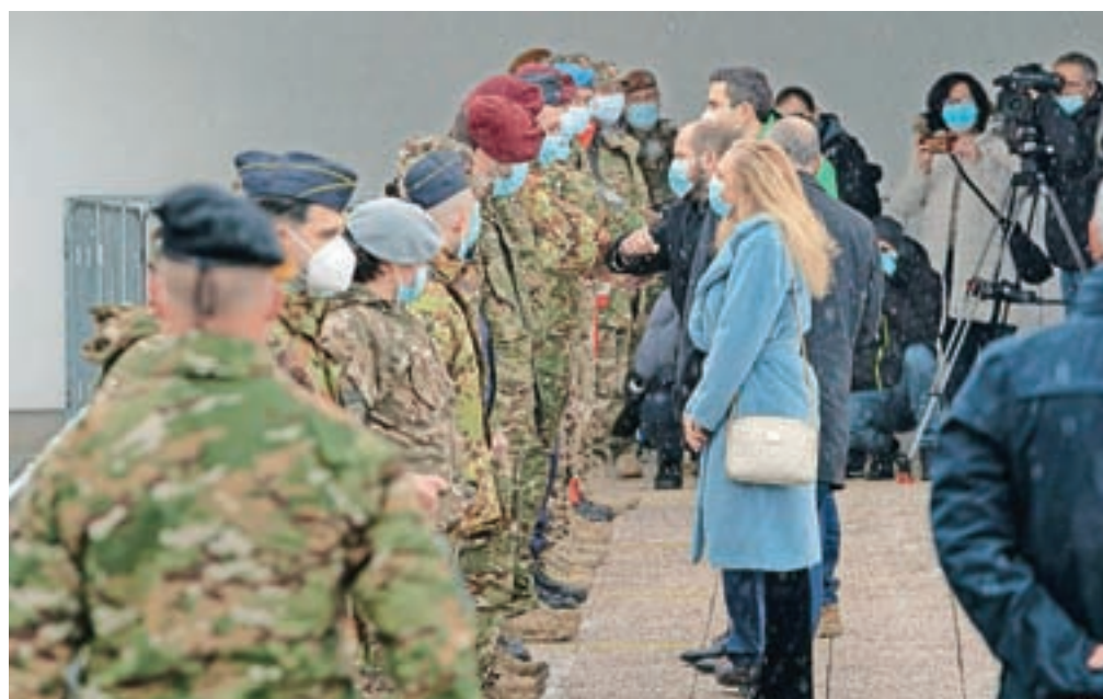
Prve zdravstvene delavce italijanske vojske, ki so v Slovenijo prispeli v nedeljo, sta v Vojašnici Petra Petriča v Kranju pozdravila minister za obrambo Matej Tonin in minister za zdravje Janez Poklukar.