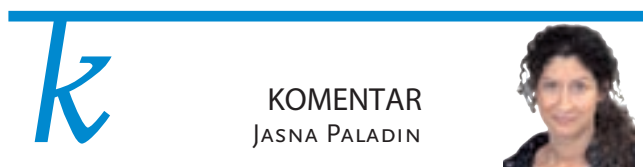
KOMENTAR JASNA PALADIN

Kranj – Po podatkih zavoda za zaposlovanje je bilo ob koncu novembra v Sloveniji registriranih 65.379 brezposelnih, kar je bilo v primerjavi z lanskim novembrom 18.760 ali 22,3 odstotka manj. Število brezposelnih se je najbolj, skoraj za 31 odstotkov, zmanjšalo na Gorenjskem, kjer je bilo novembra 4223 brezposelnih. Delodajalci iz vse Slovenije so novembra sporočili zavodu povpraševanje po delavcih za 13.871 prostih delovnih mest.