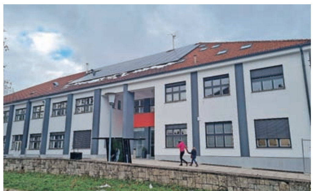
Dom kulture Kamnik ima novo, energetske varčno fasado in sončno elektrarno na strehi.

Pri koncu je tudi energetska sanacija stavbe, katere zanimivost je predvsem sončna elektrarna na južni strani strehe, kar kamniški kulturni hram na tem