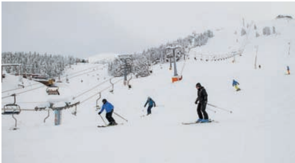
Smučišče Krvavec prekriva več kot meter debela snežna odeja.

Letos so na Krvavcu uvedli nekaj novosti. Med drugim so vsem, ki bodo smučarsko vozovnico kupili vnaprej, omogočili prednostni vhod na gondolo, sanirali so cesto, kupili nov teptalnik snega in več topov za zasněževanje, prenavljajo Plažo, razširili so tudi restavracijo. »Skupnih investicij je bilo za več kot milijon evrov,« je dodal Janša in komentiral še omejitve za preprečevanje širjenja okužb s koronavirusom na smučiščih. »Pohvalno s strani vlade, da je prisluhnila upravljavcem smučišč in uvedla pogoje, ki so sprejemljivi. Zaščitna maska in pogoj PCT sta seveda del našega vsakdanjika. Veseli