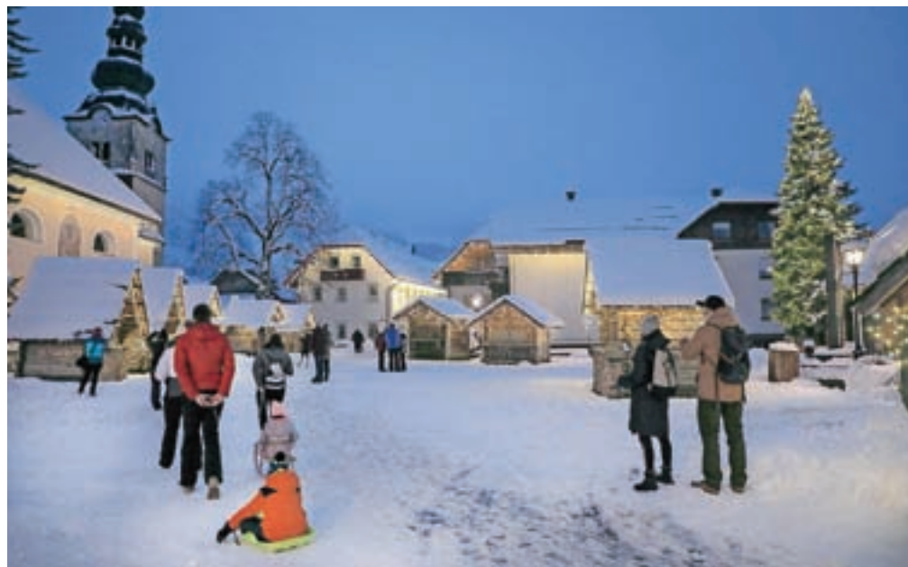
Tudi na stojnicah v Alpski vasi v Kranjski Gori boste v času do praznikov vsak konec tedna (po 20. decembru pa vsak dan) lahko kupili različne izdelke, darila ..., ponudba hrane in pijače pa z zadnjim vladnim odlokom trenutno ni dovoljena. Slika je simbolična.

Vlada je natančneje določila obratovanje žičniških naprav. Poleg higienskih priporočil NIJZ je uporaba žičniških naprav in njim pripadajočih smučarskih prog dovoljena osebam, ki upravljavcu ob nakupu vozovnice ali na smučišču predložijo dokazilo o izpolnjevanju pogoja PCT. V zaprtih žičniških napravah je za osebe, starejše od šest let, obvezna uporaba kirurške maske ali maske tipa FFP2. V odprtih žičniških napravah pa je obvezna uporaba kirurške maske ali maske tipa FFP2, če med potniki