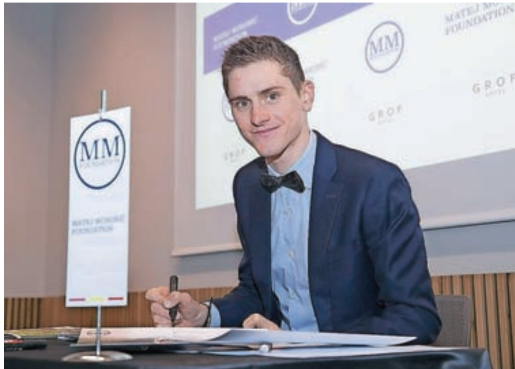
Matej Mohorič je v četrtek predstavil Matej Mohorič Foundation.