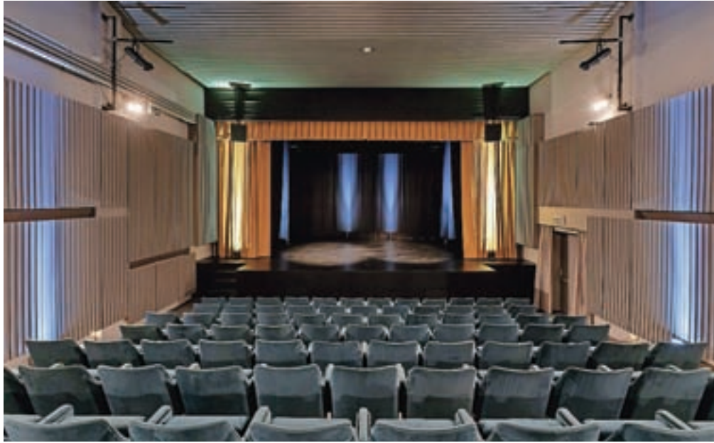
Dvorana Kulturnega doma Medvode je po dolgih letih dočakala prenavo.

»Dvorana je dolga leta čakala na ureditev vizur ter prenavo električne napeljava in opreme, ki so trije od osnovnih pogojev za kvalitetno izvedbo produkcij in prijetno izkušnjo obiskovalca. Dotrajana električna napeljava in zvočni park ter nosilci lučnega parka, komaj delujoč pogonski motor za premikanje zaves, oblede glavna gledališka zavesa in porumenelo filmsko platno so pri vsakokratni izvedbi predstav in prireditev opominjali izvajalce kulturnih programov, da je predvsem dvorana nujno potrebna prenove. Obiskovalci bodo odslej končno deležni prijetnejše izkušnje, saj