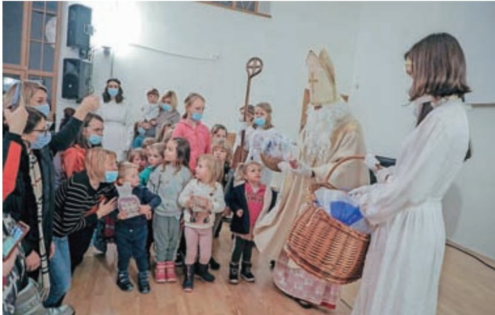
Miklavž je otrokom prinesel darila.

Prireditev je povezovala Maša Demšar, ki je otrokom zaupala, da parkeljni samo čakajo, da koga zvabijo v svoj krog, in tako je tudi njeno obiskal sam šef vseh hudobnih duhov, Lucifer. »Da je Miklavž 'larifari', mi je rekel, in naj grem raje z njim, da se bom imenitno zabavala.« Prav tako jo je poskušal prepričati, naj bo s slabimi dejanji zgled otrokom, ne dobrimi, in naj ne verjame Miklavžu,