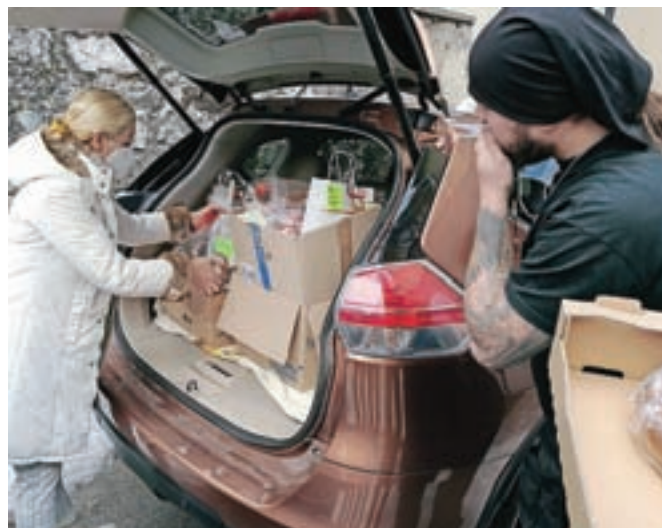
Letos so praznične slaščice dobrodelne dražbe osebno dostavili dražiteljem.