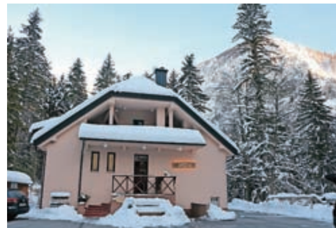
Gostišče Karavla 297 se s ceste, ki vodi proti mejnemu prehodu Ljubelj, sicer vidi, vendar ne stoji čisto ob cesti.