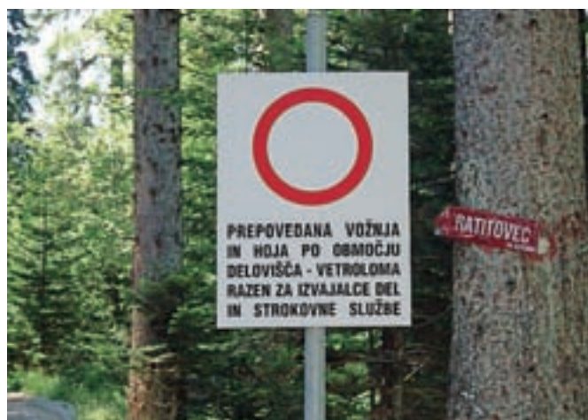
Na gozdnih cestah na Jelovici ni zapornic, so le prometni znaki.

Kranj – Ministrstvo za kmetijstvo, gozdarstvo in prehrano je objavilo javni razpis, s katerim bo finančno podprlo projekte sodelovanja med kmetijami in izvajalci programov izobraževanja ter zdravstvenega, socialnega in invalidskega varstva. S projekti, za katere zagotavlja skupno 750 tisoč evrov, bodo preverili možnost uvedbe tovrstnih dejavnosti na kmetijah. Vlogo za pridobitev finančne podpore bo možno vložiti v času od 13. decembra do 10. februarja, pogoj za sodelovanje na razpisu pa je na podlagi pogodbe vzpostavljeno partnerstvo.