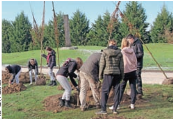
Pri sajenju dreves so v Arboretumu sodelovali tudi dijaki.