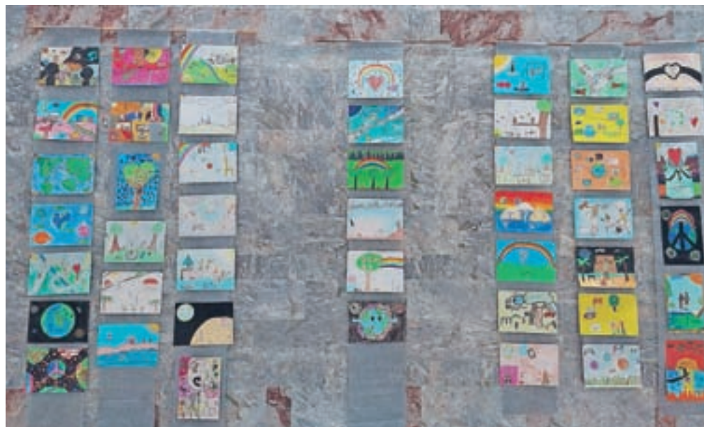
Risbe z natečaja Plakat miru si je do sredine novembra mogoče ogledati v Sokolskem domu v Škofji Loki.

mevanju. Svoja razmišljanja o teh temah so mladi s pomočjo mentorjev skozi različne likovne tehnike predstavili v svojih risbah.