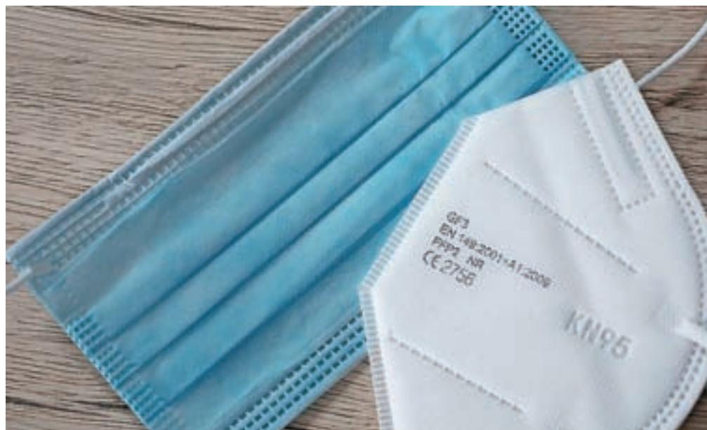
V zaprtih javnih krajih je obvezna uporaba zaščitne kirurške maske ali maske tipa FFP2, maska iz blaga ni več dovolj.