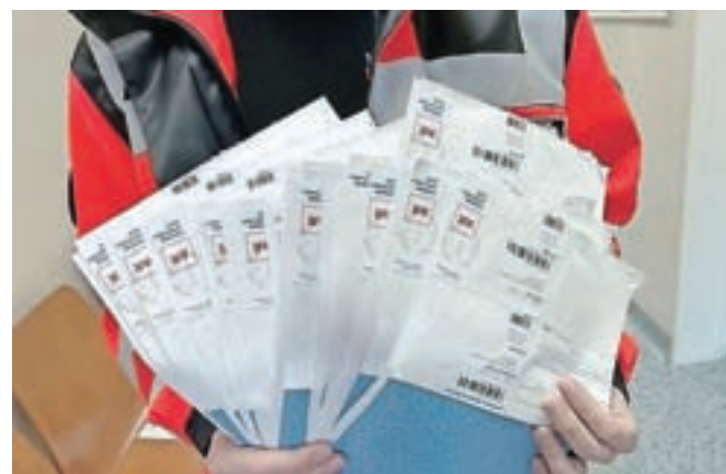
V Zdravstvenem domu Kamnik so zgolj 4. novembra prejeli trinajst kazni za prehitro vožnjo vozil na nujni vožnji.

»Kazni na koncu sicer ne dobimo, ampak tovrstni dopisi redarstva za seboj potegnejo kup pisarniškega dela: najprej moramo poiskati, katera vozila so to bila in kdo jih je vozil, potem poiskati potni nalog, vso dokumentacijo natisniti, napisati dopise ... Gre za kup nepotrebne