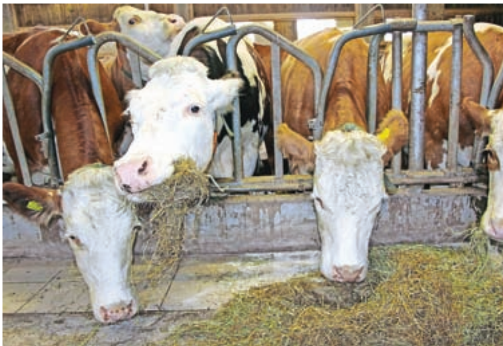
K oddaji vloge tokrat še posebej vabijo majhne živinorejske kmetije, ki niso kandidirale na prvih dveh razpisih.

Za finančno podporo se lahko potegujejo kmetije, ki obdelujejo najmanj 1,5 hektarja in manj kot šest hektarjev primerljivih kmetijskih površin (od 3 do 11,99 hektarja trajnih travnikov ali 1,5