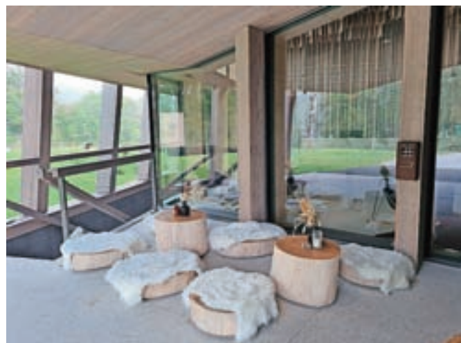
Kotiček za druženje pri vходу v hotel

veliko gostov tega ne mara. Samo z vzglavnikom sem imela nekaj težav, če pa bi prej odprla omaro, bi videla obvestilo, da lahko gostu pri- skrbijo drugega... Pa majhne okrogle talne okrasne lučke pri oknu so mi povzročale nekaj težav: pretaknila sem vso sobo, a jih nisem mogla ugasniti. Na smeh mi gre, če pomislim, da sem se spomnila dogodivščine iz Dubrovnika izpred let, kjer je šofer turističnega avtobusa prevažal skupino japonskih turistov in z njimi potem ponočeval v enem izmed luksuznih hotelov, kjer se je na podoben način mučil z ugašanjem luči. Ni in ni šlo; ni