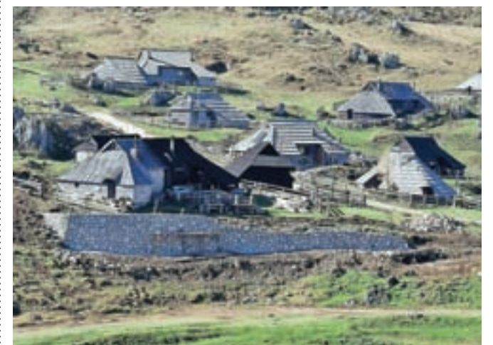
Ali je gradnja zidu v pastirskem naselju skladna s predpisi, občinske službe še ugotavljajo.

»Občinske službe bodo v teh dneh opravile ogled omenjenega objekta, in če bodo za to obstajali pogoji, tudi ukrepale v skladu s svojimi pristojnostmi. Za vsak poseg gradnje je treba pridobiti pogoje in soglasje ali mnenje pristojnih nosilcev urejanja prostora. Za enostavne objekte, ki so grajeni izven območja vplivnih pasov občinskih cest, Občina Kamnik ne izdaja soglasij,« so nam odgovorili in konec tedna sporočili, da jim ogleda zaradi slabega vremena še ni uspelo opraviti.