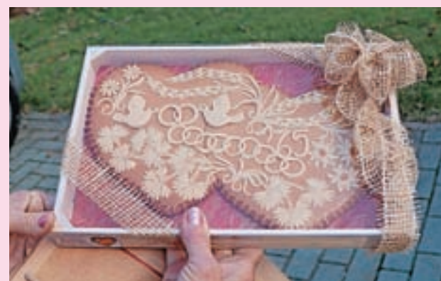
Majhna pozornost, a posebno darilo: dražgoški kruhek