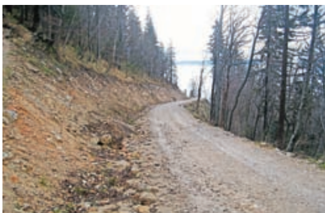
Država s finančnimi podporami spodbuja gradnjo in obnovo gozdnih cest in vlak. Slika je simbolična.

Za sofinanciranje gradnje in posodobitve gozdnih cest in gozdnih vlak ter