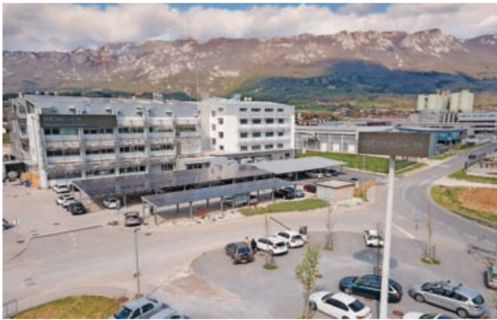
Podjetje BIA Separations je v sodelovanju z družbo BioNet razvilo optimiziran proces proizvodnje cepiva.

Ajdovščina – BIA Separations, ajdovsko podjetje, ki je del nemške družbe Sartorius, je v sodelovanju z družbo BioNet, ki velja za vodilno tehnološko podjetje na področju izdelave gensko spremenjenih cepiv, razvilo optimiziran proces proizvodnje cepiva mRNA. Obe podjetji sta se povezali v začetku letošnjega leta in najprej razvili optimiziran proces proizvodnje cepiva pDNA, nato pa še cepiva mRNA, obe tehnologiji pa nato uspešno prenesli iz laboratorijev BIA Separations v industrijski obrat BioNeta.