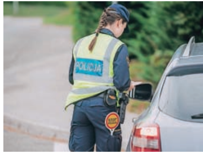
Vsaka policijska uprava bo izvedla vsaj en poostren nadzor, v katerem bodo policisti odredili preizkus alkoholiziranosti z vsakim udeležencem, ki bo pripeljal mimo.

V okviru preventivne akcije AVP vodi kampanjo za preprečevanje vožnje pod vplivom alkohola Kol'kor kapljic, tolk' nesreč, občinski sveti za preventivo in vzgojo v cestnem prometu v terenskih akcijah delijo nove