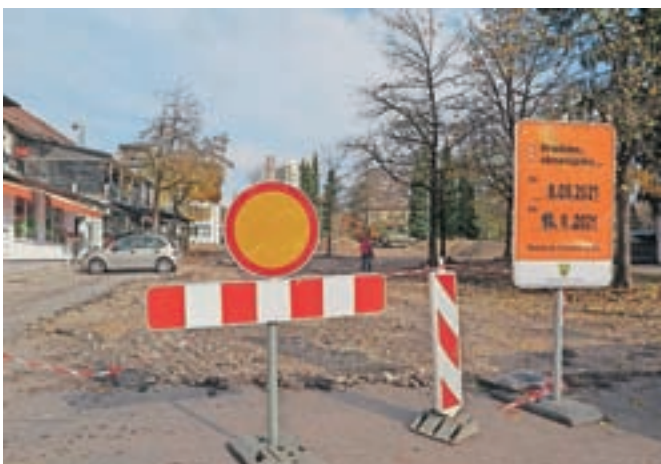
Del parkirišča Štemarje je od konca minulega tedna zaprt zaradi obnove.

Škofja Loka – Od minulega konca tedna je delno zaprto parkirišče Štemarje nasproti avtobusne postaje v Škofji Loki. Parkirišče bodo namreč na novo uredili in asfaltirali. Predvidoma bo zaprto dva tedna, do 20. novembra. Na škofjeloški občini svetujejo, da tisti, ki ste uporabljali to parkirišče, v času prenove parkirajte na spodnjem parkirišču ali na parkirišču v nekdanji vojašnici. Hkrati vse prosijo za razumevanje.