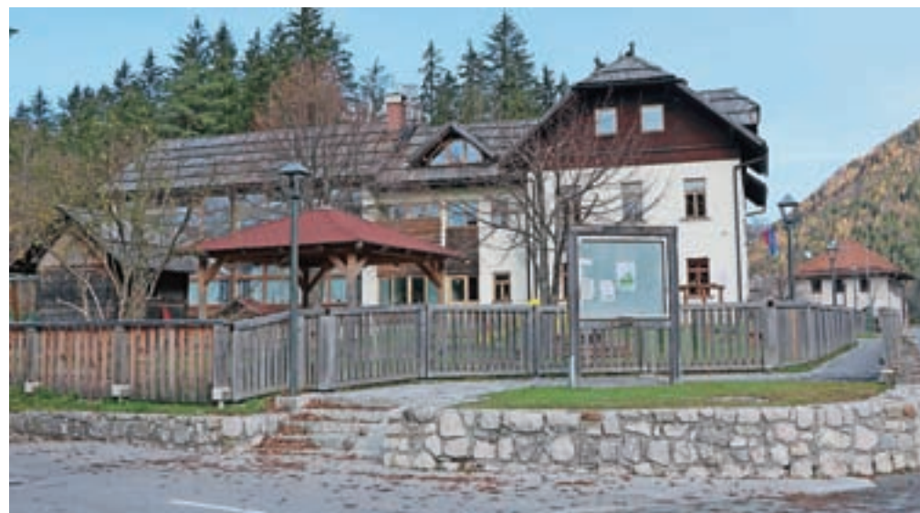
Na Jezerskem je v podružnični šoli OŠ Matije Valjavca Preddvor in vrtcu Palček prostorska stiska vsako leto izrazitejša.

Jezersko – Sedaj imajo težavo s pomanjkanjem prostora tudi že na razredni stopnji. »Potrebni sta prenova celotnega objekta in prilagoditev prostorov potrebam šole in vrtca,« pojasnjujejo na občini. Na prostorsko stisko in organizacijsko težavo so najprej opozarjale vzgojiteljice, kasneje pa tudi učiteljice na podružnični šoli. »Poleg povečane števila otrok v vrtcu in šoli pa se v zadnjih letih povečuje tudi število obrokov, predvsem kosil. Tako je iz leta v leto večji izziv pomanjkanje prostora tudi v kuhinji in jedilnici.« Ugotavljajo, da imajo na eni strani težave s pomanjkanjem prostora, na drugi pa so v mansardi stare šole neizkoriščene površine nekdanjih stanovanj. »Zato smo se odločili, da s temeljitostno sanacijo obstoječih objektov lahko brez novogradenj zagotovimo kvalitetne pogoje za programe vrtca in