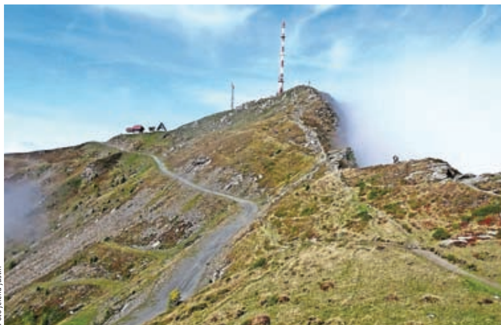
Pogled nazaj na prehojeno pot proti Goldecku. Nadaljujemo naprej do Martennocka.

pridemo na Martennock, 2039 m n. m. Ste kdaj še en vrh dvatisočaka dosegli tako, da ste sestopali? Na vrhu stoji ogromen 18-metrski križ, na katerem piše, da je čuvaj gorskega sveta.