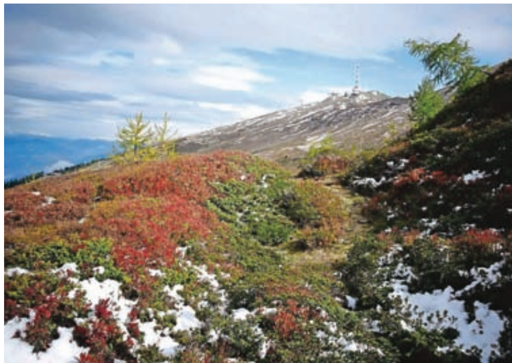
Barve jeseni proti vrhu Goldecka

Z vrha nadaljujemo po grebenu. Najprej se strmo spustimo. Sestop zahteva malce pozornosti, nato pa sledimo prečni poti do sedla, kjer nas markacije usmerijo levo. Prečimo pobočje neimenovanega vrha, dosežemo še eno sedlo, naš naslednji vrh pa se že vidi v daljavi. Mimo številnih možicev