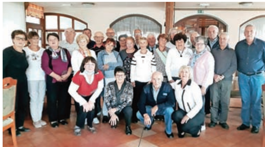
Na slavnostni seji ob 70-letnici Društva upokojencev Cerklje