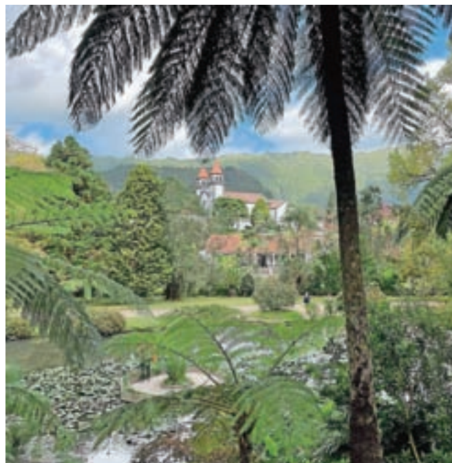
Park Terra Nostra in pogled na zvonik v mestecu Furnas