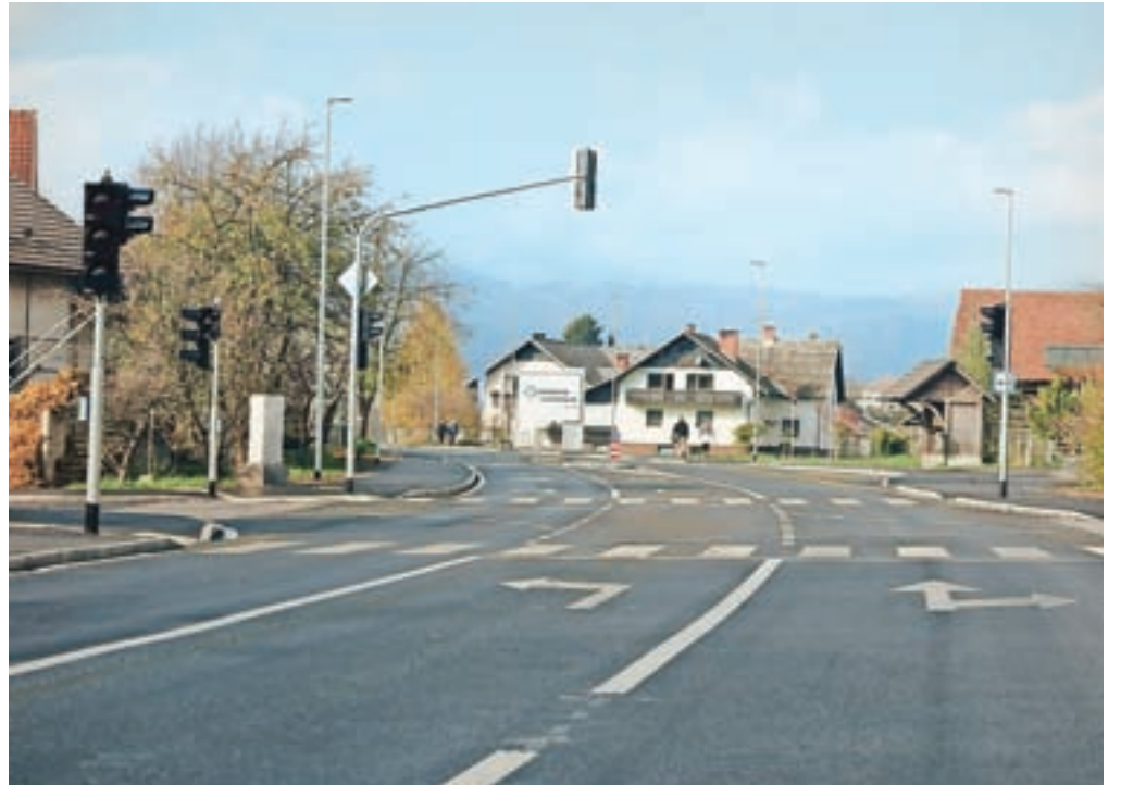
Obnova ceste skozi Godešič je končana, potekajo le še zaključna dela čiščenja, urejanja okolice in odprava morebitnih pomanjkljivosti.

Obnovo je izvajala Direkcija RS za infrastrukturo, zaradi slabih vremenskih razmer v aprilu in maju pa so pogodbeni rok podaljšali. Kot smo poročali, je bilo med vozniki kar precej slabše volje zaradi udarnih jam