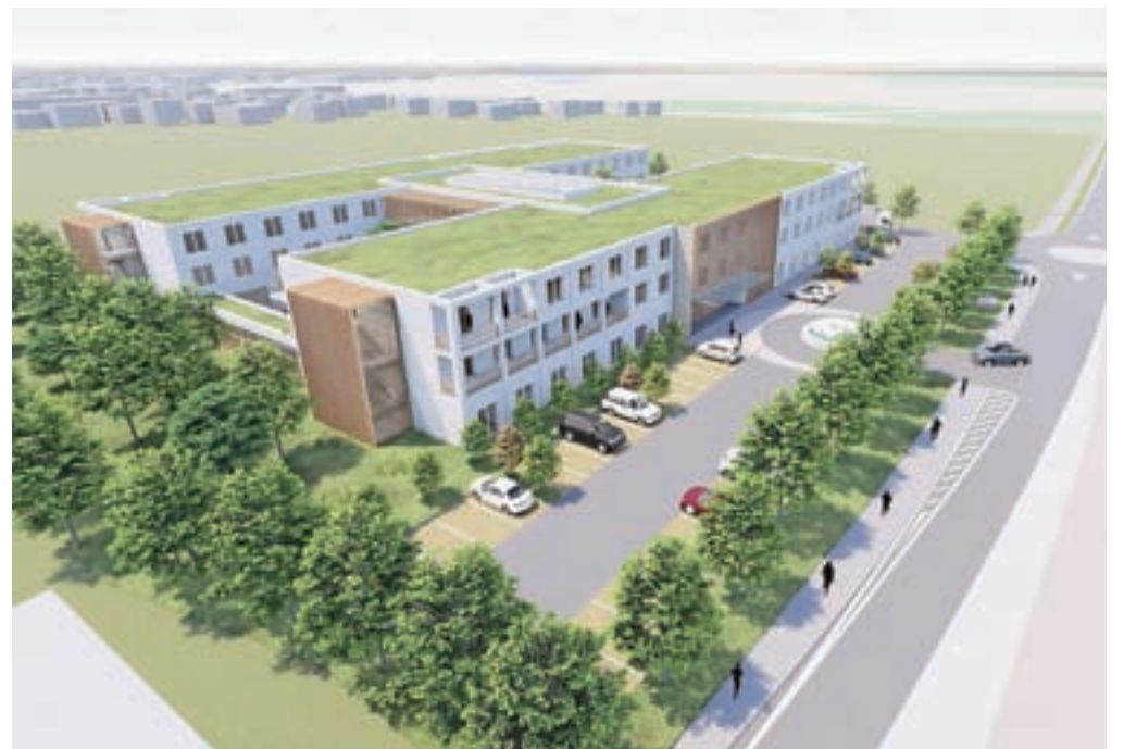
Takole bo videti dom starostnikov v Šenčurju.