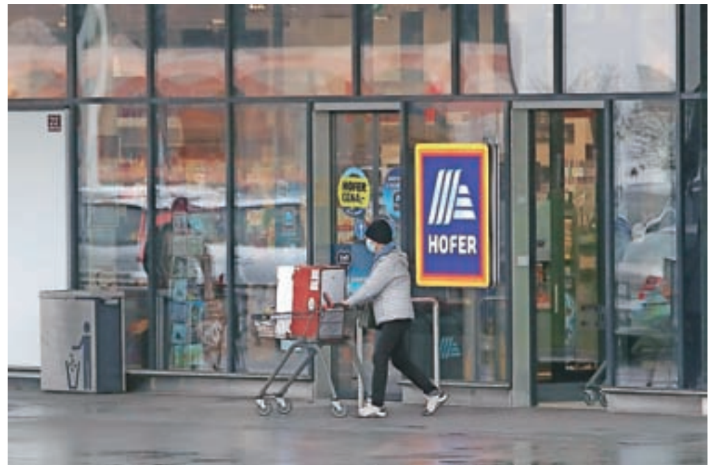
V trgovinah mora biti zagotovljenih najmanj deset kvadratnih metrov površine na osebo. Slika je simbolična.