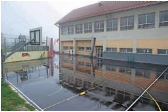
Obnovljeno športno igrišče pri dražgoški šoli, v kateri naj bi po novem letu začel delovati še vrtec.

po predšolskem varstvu. V Dražgošah vrtca doslej ni bilo, vzpostaviti pa nameravajo enoto za eno skupino otrok. V pritličju šole bodo uredili dobrih sto kvadratnih metrov površin, od tega 65 »kvadratov« za igralnico, predvidene pa so še sanitarije, garderoba in kabinet za osebje. Za izvedbo 89 tisoč evrov vredne investicije je občina izbrala podjetje Akvaing iz Ljubljane, ki prav ta čas ureja tudi dodatne prostore v centralni šoli v Železnikih. Na občini upajo, da bodo novi vrtčevski prostori izdelani in opremljeni do konca letošnjega leta ter da bo vrtec v Dražgošah z novim letom že lahko začel obratovati.