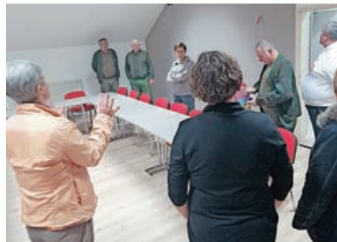
Na ogledu prenovljenih prostorov

Poleg zbirke predmetov iz zgodovine gasilstva bo namreč v muzeju prostovoljstva velik poudarek namenjen prav zgodbam in anekdotam ljudi, ki so tako ali drugače