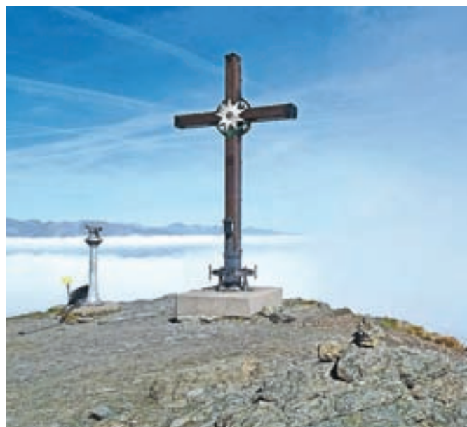
Vrh Goldecka v optimalnem vremenu ponudi čudovit razgled.

pa se čez travnato pobočje, ob ograji, spustimo do parkirišča. Nadmorska višina: maks. 2142 m Višinska razlika: 500 m Trajanje: 4 ure Zahtevnost: ★★★★★