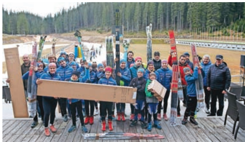
Predaja opreme slovenskim biatlonkim klubom

v snežno sezono so na Pokljuki izkoristili tudi za predajo opreme slovenskim biatlonkim klubom. »Iz pozitivnega rezultata svetovnega prvenstva, ki smo ga organizirali v letošnjem letu, sta se Športno društvo Pokljuka in organizacijski odbor odločila, da pomagamo mladim športnikom, da vlagamo nazaj v šport. Kupili smo sto kosov opreme (smuči, palic in čevljev), ki