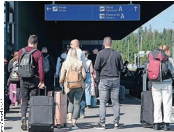
Promet na letališču Jožeta Pučnika se povečuje.

decembra tudi Wizz Air. Prvi bo do štirikrat tedensko letel na Gatwick, drugi pa na Luton trikrat na teden. Trikrat tedensko bo povezavo z Moskvo ponujal Aeroflot, Air France pa 11-krat s Parizom. Ker bo francoski prevoznik na letališču tudi nočil, bodo trikrat tedensko leti na voljo zgodaj zjutraj. Z Air Montenegro bo mogoče dvakrat tedensko leteti v Podgorico, v Varšavo bo šest letov v tednu ponujal LOT, v Zürich pa štiri Swiss Air Lines.