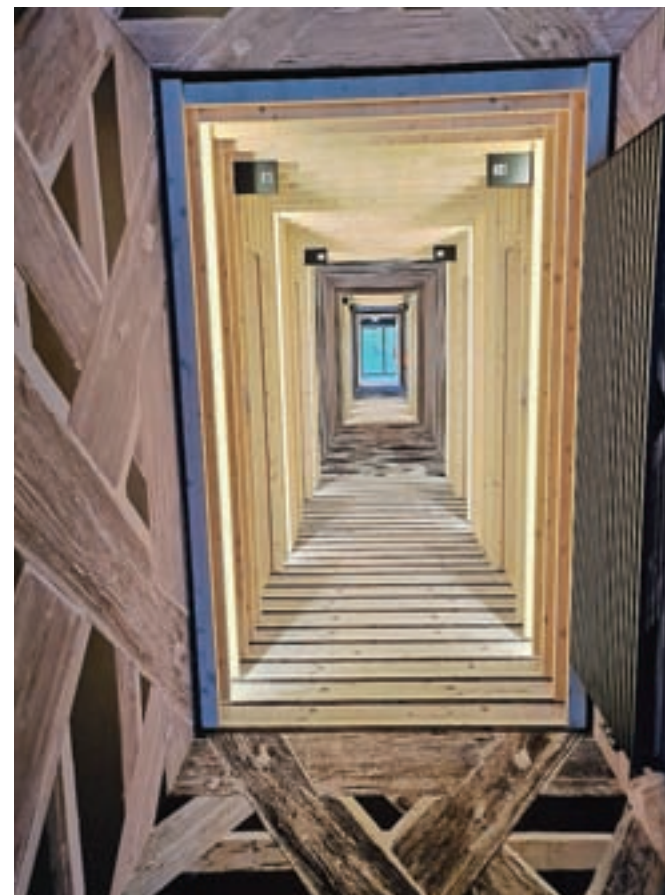
Hodnik, ki vodi do sob

našel stikala. Poklical je na recepcijo, kjer so mu potem prijazno razložili, da mora zaploskati ... Tudi jaz sem poskusila s ploskanjem, kar ni delovalo, ampak na koncu sem se odločila, da očitno pač morajo goreti.