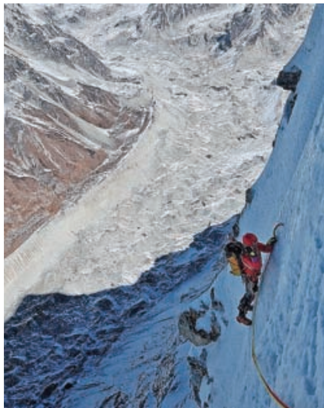
Prvi raztežaj drugega dne, z mestom za bivak pod skalnim previsom

je prvič povzpela nemška alpinistična odprava leta 1972, slovenska alpinista pa sta opravila prvi pristop po severozahodni steni.