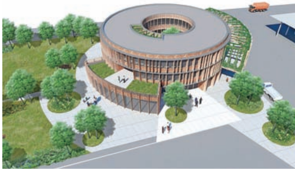
Načrtovani center krožnega gospodarstva