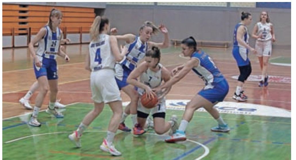
Košarkarice Triglava so v ligi WABA morale priznati premoč ekipe Budućnost Bemax iz Podgorice.

»Da bi bil viden napredek v naši igri in da bi nadoknili manko v višini, je naša ekipa v tekmo vložila premalo energije,« je po tekmi povedal trener domačih