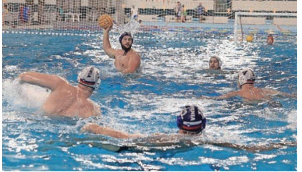
Naša vaterpolska reprezentanca se je znova zbrala, jutri pa jo čaka prva tekma.