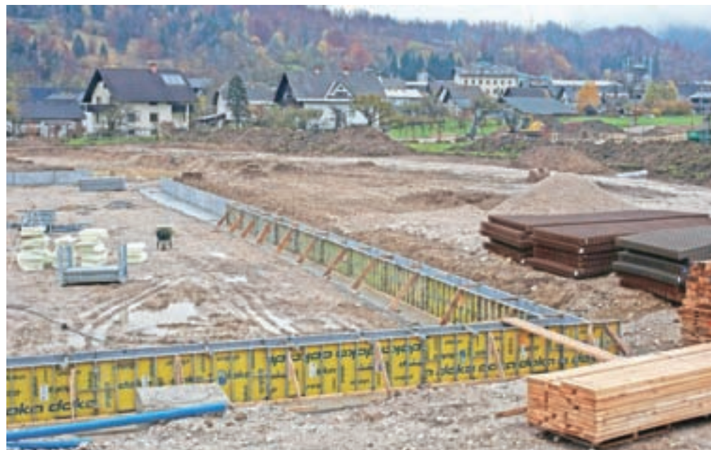
Dela so že začeli, rok za zaključek je prihodnjo jesen.

končne arhitekturne rešitve je Občina Bohinj sodelovala z Zbornico za arhitekturo in prostor Slovenije, ki je končno rešitev poiskala v okviru javnega natečaja. Pri pripravi projekta