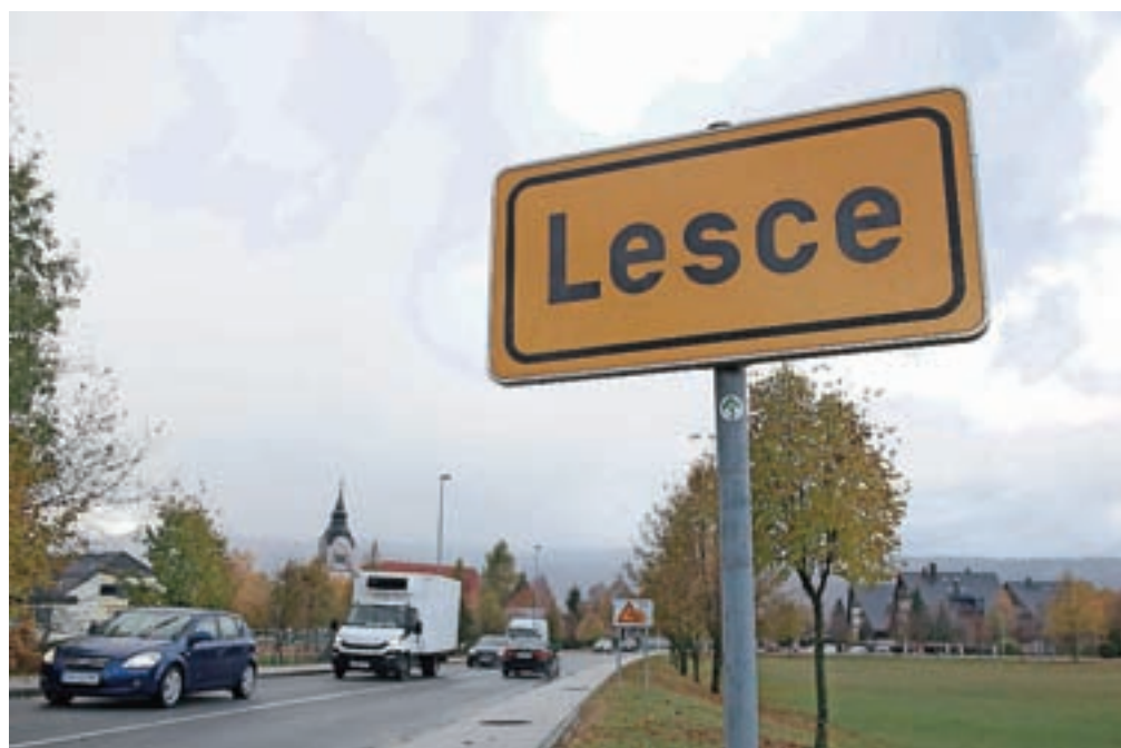
V Lescah se želijo odcepiti od radovljiške občine, novo občino naj bi sestavljali krajevni skupnosti Lesce in Begunje.