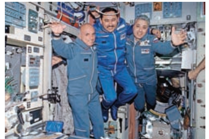
Prvi vesoljski in »samoplačniški« turist je bil ameriški inženir in podjetnik Dennis Tito (levi), fotografiran na Mednarodni vesoljski postaji, 30. aprila 2001.