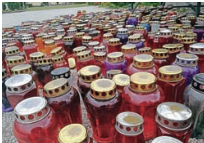
Namesto prave lahko do konca prihodnjega tedna prižgemo virtualno SMS svečko in doniramo pet evrov.