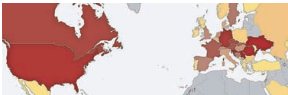
Razširjenost priimka Horvat po svetu

Na Hrvaškem je priimek Horvat prvič omenjen leta 1414 v bližini Zagreba.