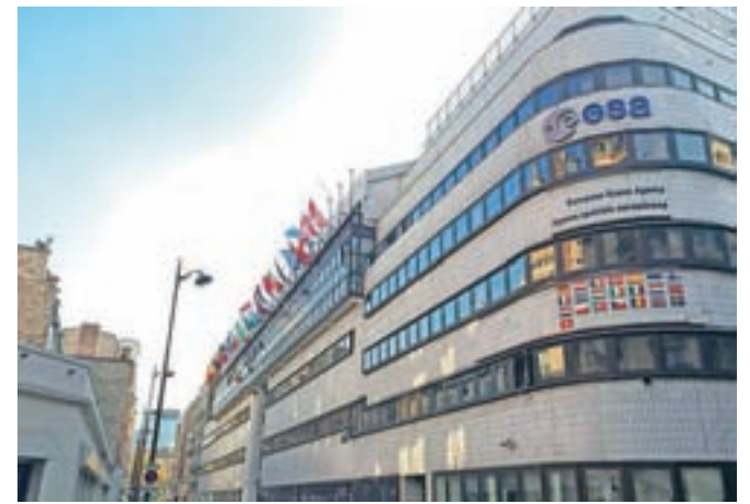
Sedež Evropske vesoljske agencije (ESA) v Parizu, 2015. Na palači so zastave 22 držav članic, Slovenija je za zdaj le pridružena članica.

Kaj pa dobra stara Luna? »Moje mnenje je, da bo Luna vsekakor postala naslednja baza v vesolju po Mednarodni vesoljski postaji.« (Vir: Nina Slaček in Aljoša Masten, intervju z J. Aschbacherjem, MMC RTV SLO)