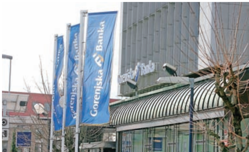
Gorenjska banka z nakupom Sberbank banke v Sloveniji povečuje tržni delež. Na sliki: poslovna stavba Gorenjske banke v Kranju.

Kranj – Gorenjska banka je v sredo podpisala pogodbo za nakup Sberbank banke v Sloveniji, kar predstavlja del skupne pogodbe med Sberbank Europe AG ter AIK Banko, Gorenjsko banko in AEC Ltd. za nakup hčerinskih družb Sberbank v Sloveniji, Srbiji, Bosni in Hercegovini, na Hrvaškem in Madžarskem. Gorenjska banka bo s tem povečala obseg poslovanja na slovenskem bančnem trgu in se z 9,4-odstotnim tržnim deležem uvrstila med tri največje banke.