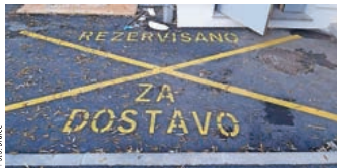
Napis pred novim vrtcem v Bitnjah, zaradi katerega se nekateri v zadnjih dneh nasmihajo, drugi pa zgražajo

»Rezervisano za dostavo« se je namreč delavcu, ki so mu zaupali izdelavo napisa, verjetno prihaja z juga nekdanje