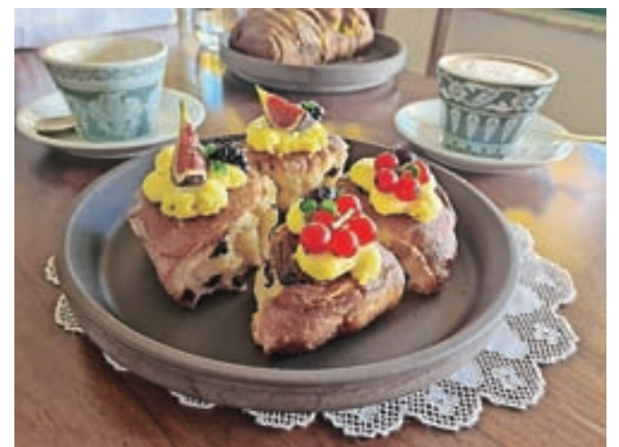
Fernandli iz sladkega testa z drožmi