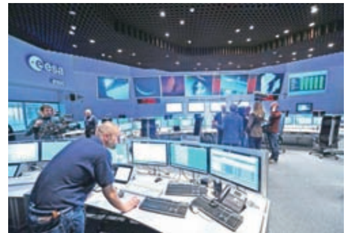
Glavna kontrolna točka v operativnem središču ESA v Darmstadtu, Nemčija, leta 2014