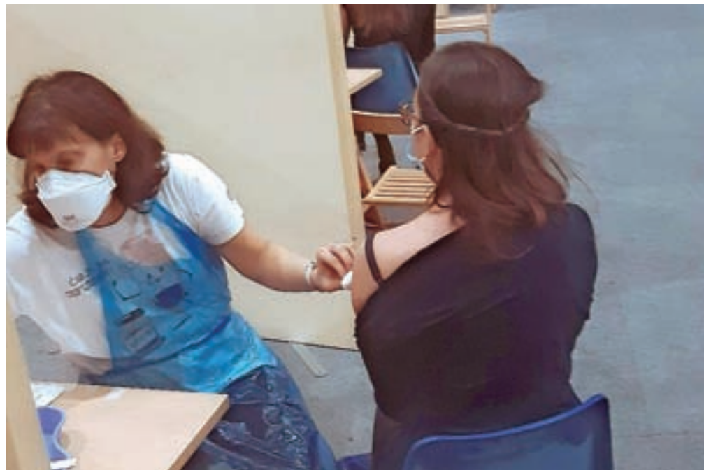
V cepilni center Zdravstvenega doma Kranj v kranjski vojašnici je v sredo na odprto cepljenje prišlo tisoč ljudi, od tega se jih je 638 cepilo proti covidu-19 (drugi proti gripi), med njimi večina s tretjim odmerkom. Prvi odmerek cepiva proti covidu-19 je prejelo le 99 oseb.

O ukrepih je vlada tehtala na včerajšnji seji, vendar odločitve do zaključka časopisne redakcije niso bile znane. Neuradno pa je bilo v minulih dneh slišati, da naj bi se vlada za zdaj odločila za milejši scenarij s strožjim nadzorom pogoja PCT (preboleli, cepljeni,