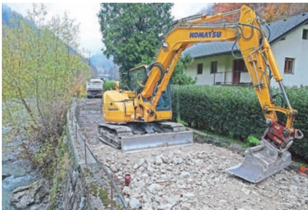
Gradnja kolesarske steze na območju Jesenovca. Celoten projekt morajo dokončati do sredine prihodnjega leta.