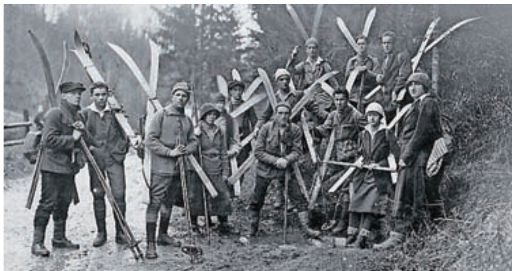
Skalaši so poleg plezanja v gorah gojili tudi smučanje.

»Čas ustanovitve Skale je bil precej poseben čas. Mladi se niso več zadovoljevali s hojo po nadelanih in označenih poteh ter tudi ne samo s prehranjevanjem v gorskih kočah. Hoteli so plezati po skalnih stenah, zahajati v gore ne samo poleti, ampak tudi pozimi, kar je veljalo za avanturo, tudi s smučmi in ledno opremo. Pri nas so tako nastajale zelo različne skupine, ki so skupaj zahajale v gore, si izmenjevale izkušnje, spomine in alpinistično literaturo. Iz njih je nato nastalo tudi formalno združenje – Skala. Skalaši so poleg plezanja v gorah