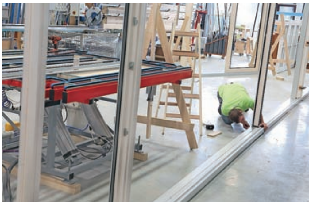
Delavcev primanjkuje tudi v proizvodnih podjetjih.

Okoli tretjina podjetij v predelovalnih dejavnostih ima težave s pridobivanjem zaposlenih, prav tako dvajset odstotkov storitvenih podjetij. Tudi številna gorenjska podjetja se srečujejo s pomanjkanjem delovne sile. Podobno kot v večini proizvodnih podjetij se v Iskri Mehanizmi srečujejo s težavami pri iskanju orodjarjev.