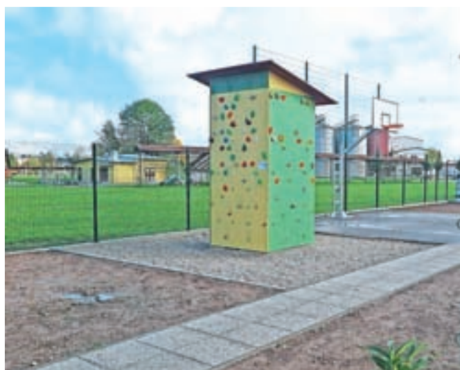
V vasi Trata urejajo otroško igrišče.

Urejati so že začeli tudi otroško igrišče v vasi Trata in ob stari Osnovni šoli v Gabrku ter postavljati ograje ob športnih površinah v Športnem parku Trata, a dela še niso končana. Načrtujejo tudi, da jim bo do konca letošnjega leta uspelo urediti še fitness na prostem pred podružnično osnovno šolo v Retečah ter športno in otroško igrišče pri Podružnični osnovni šoli Sveti Lenart in postaviti dva prikazovalnika hitrosti v krajevni skupnosti Zminec.