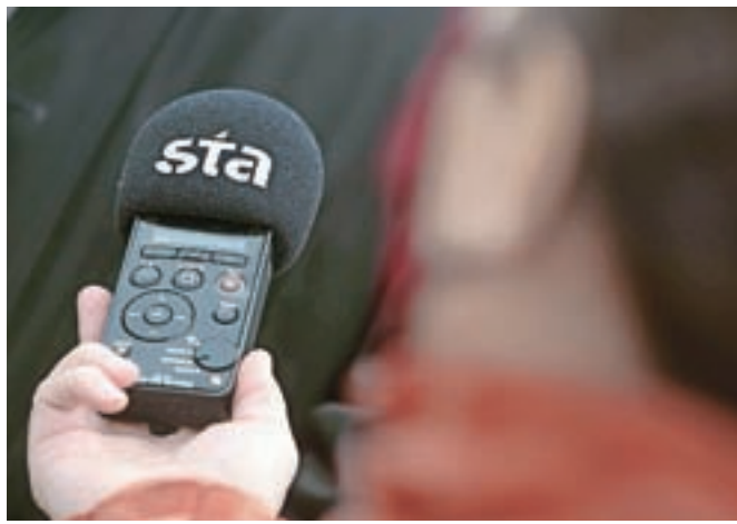
STA bi morala letos za opravljanje javne službe dobiti okoli dva milijona evra, a ni prejela še niti centa.