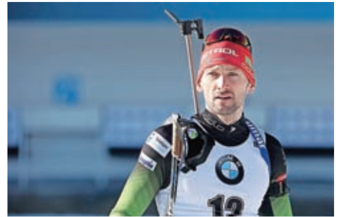
Jakov Fak

Dva Gorenjca sta bero kolajn povečala tudi štiri leta kasneje, leta 2018 v Pjongčangu v Južni Koreji. Sedmi dan olimpijskih iger smo se razveselili prvega odličja, saj je biatlonec Jakov Fak osvojil srebrno medaljo. Biatlonec, ki živi v Lescah, je brezhibno opravil s strelskim nastopom, saj je na klasični 20-kilometrski preizkušnji zadel vseh dvajset tarč in za zmagovalcem zaostal za pet sekund. Srebrna medalja je bila njegova. Jakov Fak je mož za