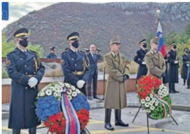
Na Prevali nad Novo Gorico so odkrili spomenik padlim madžarskim vojakom na soški fronti.