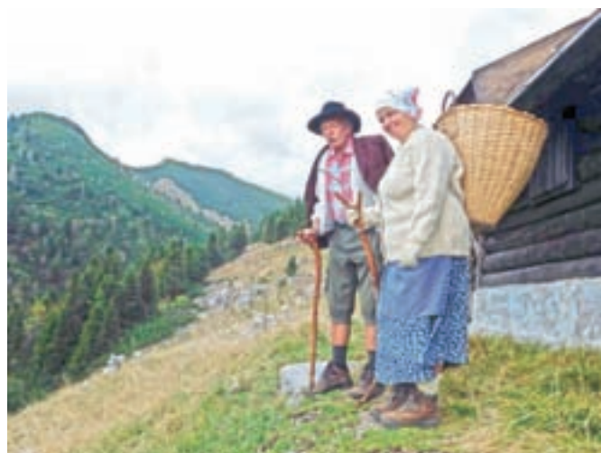
Prizor iz jesenjskega dela snemanja filma

Preddvorčana menita, da bo film do konca novembra zaključen. Glede na čas in trud, ki je bil v film vložen, pa si končni izdelek zagotovo zasluži dogodek, premiero, predstavitev. A ker se razmere iz dneva v dan slabšajo, Lombar Premrujeva pove, da bodo upoštevali ukrepe, a tudi zdravo pamet. »Če ne bomo mogli imeti premiere, bomo pa malo počakali ali poiskali drugo rešitev,« še doda.