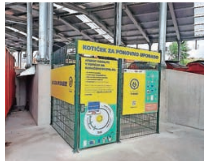
Kotiček za ponovno uporabo v zbirnem centru v Suhadolah

Suhadole – V Zbirnem centru Suhadole je postavljen nov kotiček za ponovno uporabo, v katerega lahko oddate še delujoče aparate za ponovno uporabo, od pralnih strojev, hladilnikov in zamrzovalnikov, električnega orodja do igrač, računalnikov, telefonov, televizorjev in druge zabavne elektronike. Kotiček je postavila družba ZEOS v sklopu projekta Life Spodbujamo e-krožno skupaj s partnerjema Zbornico komunalnega gospodarstva pri GZS in podjetjem TSD ter lokalnim partnerjem Publikusom. Zbranim aparatom bodo preverili funkcionalnost in električno varnost, nato pa jih vrnilo na trg po primerni ceni ali jih podarili. Projekt izhaja iz ideje, da bi podaljšali življenjsko dobo aparatom in jih vrnilo v ponovno uporabo. Kot kaže statistika, namreč en do dva odstotka še delujočih aparatov vsako leto konča med e-odpadki in so po nepotrebnem predelani, s čimer prispevamo k večji porabi in onesnaževanju naravnih virov.