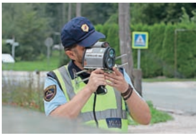
Policisti so med poostrenim nadzorom hitrosti pri enem od motoristov izmerili 240 km/h. Slika je simbolična.

»Razdalja pri hitrosti 130 km/h bi morala biti približno petkrat daljša. Gre za pravilo dveh sekund. Na preprost način jo vozniki določijo tako, da ob robu vozišča izberejo neki predmet oz. orientacijsko točko in štejejo 'ena in dvajset, dvajset'«. Če isto mesto s sprednjim delom vozila prevozijo po izteku štetja dveh sekund, je varnostna razdalja ustrezna. Če ga prevozijo prej, je razdalja premajhna in jo morajo povečati,« so razložili na Policijski upravi Kranj.