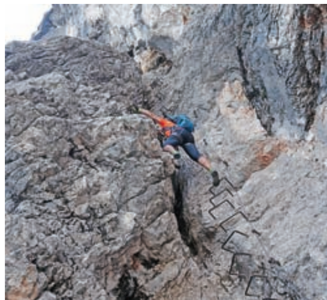
Znameniti kamin v Kopiščarjevi poti na Prisojnik