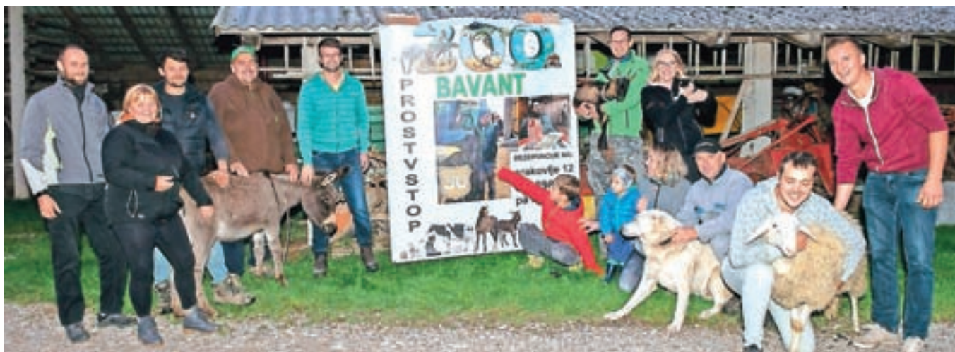
Takole so potekale priprave na presenečenje za slavljenca, ki so mu pripeljali nekaj novih živali, hkrati pa so po vasi izobesili še plakate, ki so vabili v Bavantov mini živalski vrt.