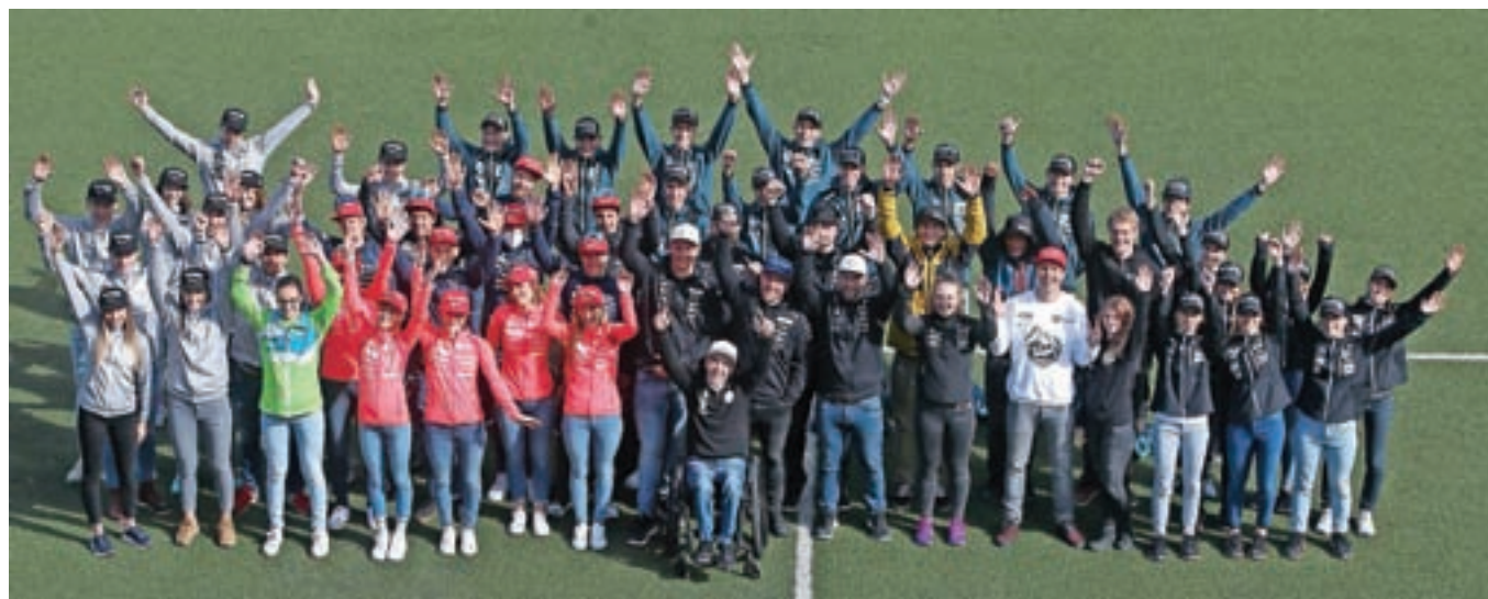
Slovenski zimski športniki so se pred začetkom sezone zbrali v Planici.

Pekingju od 4. do 20. februarja 2022. »Od zadnjih olimpijskih iger smo vložili več kot štirideset milijonov evrov v razvoj, priprave in tekmovanja na vseh ravneh, da bi na lahko v Peking prišli najbolje pripravljeni. Zdad nas čaka zadnje dejanje, tekme za olimpijska odličja. Smučarska zveza Slovenije v olimpijsko sezono vstopa prerajena, finančno stabilna in sanirana, usmerjena k visokim ciljem,« je dejal Steiner.