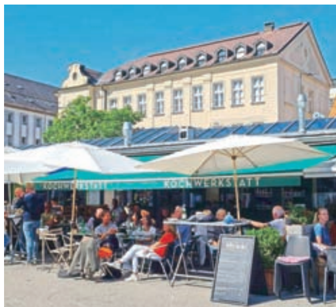
Kochwerkstatt ostaja priljubljen lokal tako med domačini kot tudi turisti.

priznane prodajalce s podeželja in vrhunsko urbano kulinariko. Menjava generacij je v zadnjih letih prispevala k temu, da je tržnica znova zelo priljubljena. Nekateri jo obiščejo zaradi velike