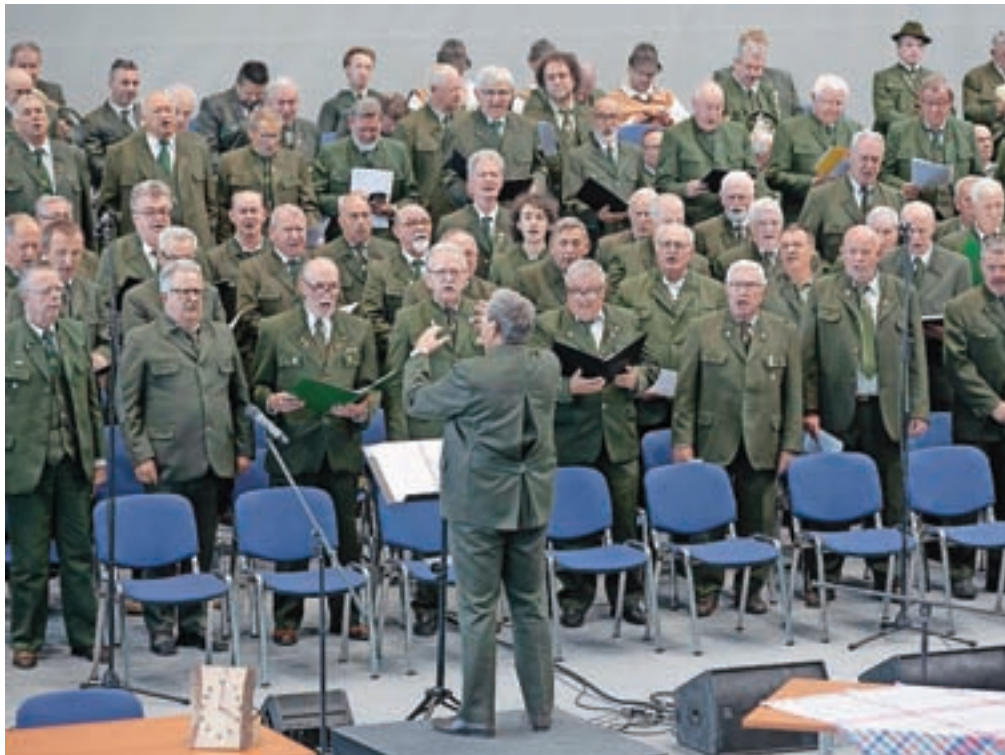
Zbralo se je sedemnajst skupin rogistov in deset lovskih pevskih zborov iz vse Slovenije, skupaj več kot dvesto nastopajočih.