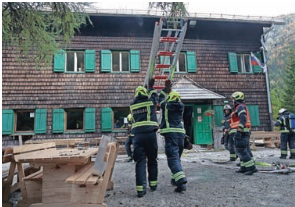
Večina planinskih objektov je lesenih in zato hitro vnetljivih.

Domžale – V Domžalah je minuli konec tedna nekdo vlomil v vrtno lopo, iz katere je ukradel kolo in visokotlačni čistilec. Lastnik je prijavil za okoli 1500 evrov škode.