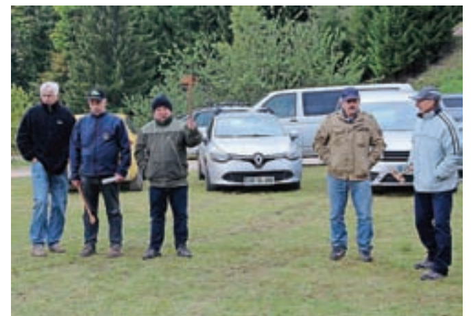
Kupci so s tablicami izkazujevali interes za nakup.