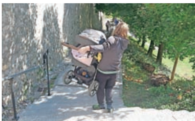
Za marsikoga, zlasti za invalide in starše z vozički, je priti do Loškega gradu in nazaj pravi podvig.

Kot so pojasnili na loški občini, je bila povezava med Trgom pod gradom in Loškimi gradom urejana glede na prostorske danosti (višinska razlika in konfiguracija zemljišča) v izvedbi, kot jo poznamo danes. Ta zajema tudi stopnice. Te res predstavljajo oviro tako za vozičke za dojenčke kot tudi za invalidske vozičke. »Zato smo predvideli dostop do Loškega gradu po Grajski poti s Poljanske ceste, ki bo urejena do konca leta. Po tej poti bodo na Loški grad lahko dostopali tudi starejši in druge gibalno ovirane osebe s pomočjo e-minibusa, ki smo ga uvedli v mesecu septembru,« še pojasnjujejo.