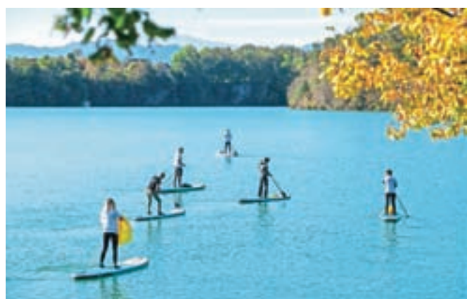
Na reki Savi, na odseku od Trbojskega jezera proti Kranju, so suparji skupno nabrali približno trideset kilogramov smeti.

Pobudo so kot ekološko in družbeno koristno prepoznali pri Merkur Zavarovalnici in jo bodo v kampanji Ker sem čudež življenja podprli tako finančno kot promocijsko, saj želijo, da sporočilo doseže čim širši krog ljudi in jih aktivira k aktivnemu življenju in skrbi za okolje. Projekt pa podpira tudi društvo Ekologi brez meja, ki je suparjem priskrbelo vreče za smeti.