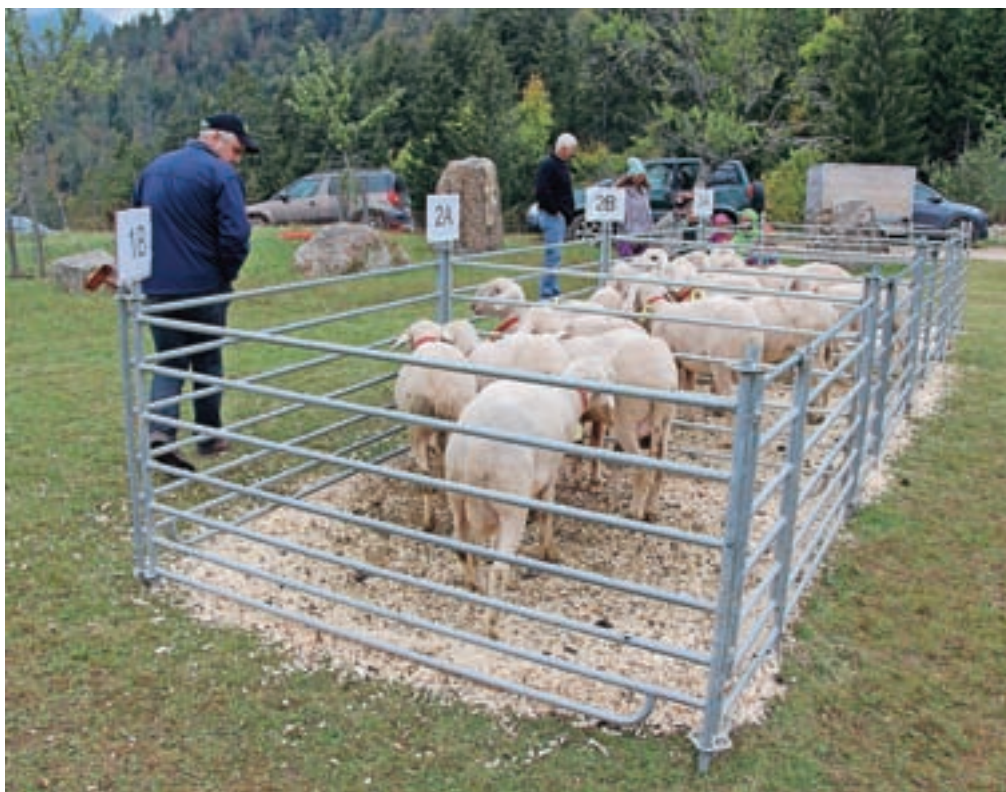
Ovni, razvrščeni v štiri kakovostne razrede, so bili v ogradi na prostem na ogled kupcem.