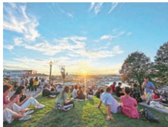
Na stotine ljudi, ki čakajo na sončni zahod v parku Jardim do Morro

Tedna, ko končno dobim obisk iz Slovenije, in tedna pred prvimi študentskimi počitnicami, ki poleg oddiha prinesejo sedem dni zabave, kjer bo več kot deset tisoč ljudi mahalo v slovo