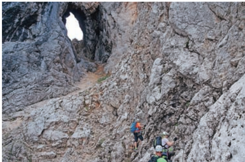
Napredovanje proti Prednjemu Prisojnikovemu oknu

Pot se strmo vzpenja, v pomoč so nam brezhibne jeklene jeklenice, so pa tudi mesta, kjer ni varoval. Ob rdečkasto-rumenkasti steni se usmerimo levo proti »zloglasnemu« kaminu, ki je včasih, ko pot še ni bila tako dobro opremljena z varovali, predstavljal strah in trepet. Kamin je visok približno 15 metrov, rahlo previsen in povsem navpičen