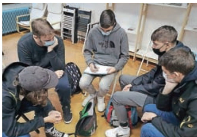
V sklopu Tedna podjetnosti so dijaki obiskali tudi Kovačnico.