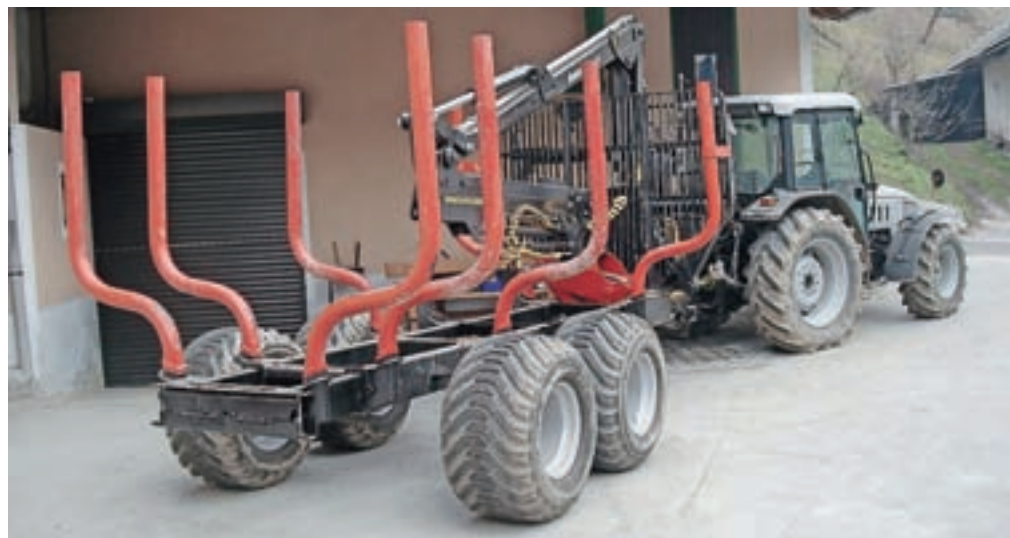
Finančno podporo bo možno uveljavljati tudi za nakup gozdarske prikolice.

Agencija za kmetijske trge in razvoj podeželja bo sprejemala vloge v elektronski sistem v času od 2. novembra do vključno 10. januarja prihodnje leto. Podpora bo dodelila vlagateljem najbolje ocenjenih popolnih vlog, ki bodo presegle vstopno mejo 40 odstotkov najvišjega možnega števila točk, dodeljevala jih bo do porabe denarja, pri tem pa bo upoštevala ekonomski in geografski vidik ter prispevek naložbe k doseganju okoljskih ciljev.