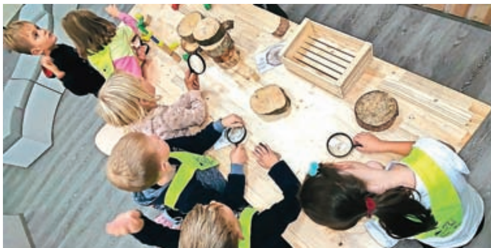
V kreativnem otroškem mestu Minicity v Ljubljani so v začetku oktobra odprli interaktivno igralno enoto, ki so jo poimenovali Lesarska delavnica.

Lesarska delavnica je nastala na pobudo SPIRIT Slovenija ter direktorata za lesarstvo na ministrstvu za gospodarski razvoj in tehnologijo. Želijo si, da bi otroci s pomočjo didaktičnih vsebin, izzivov in nalog spoznali poklic lesarja ter pri tem pridobivali uporabna znanja in podjetniške veščine,