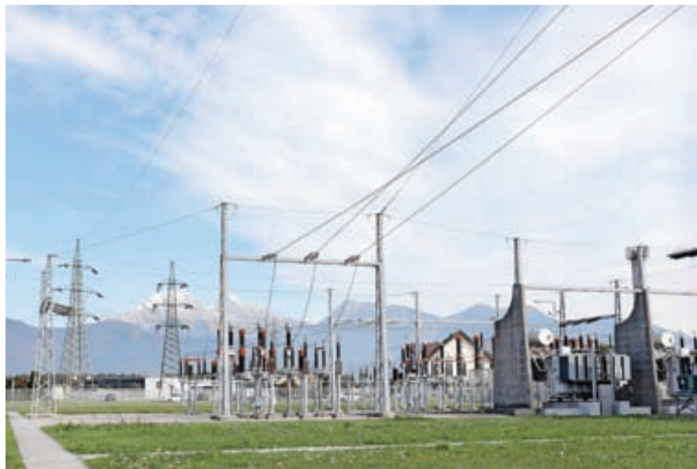
Zaradi rasti cen energentov na gospodarski zbornici svirajo pred poglobljanjem krize v energetiki.