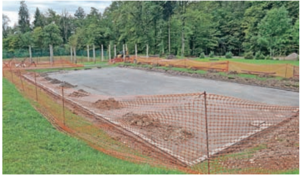
Obnovo športnega parka na Golniku bodo končali do konca novembra.

Vsa tri asfaltna igrišča bodo na novo preplastili s finim asfaltom in obnovili talne označbe. Zamenjali bodo košarkarske table z obroči in roketne gole z mrežo, na odbojgarskem in roketnem igrišču pa namestili lovilno mrežo v dolžini najmanj šestdeset metrov in ograje v dolžini