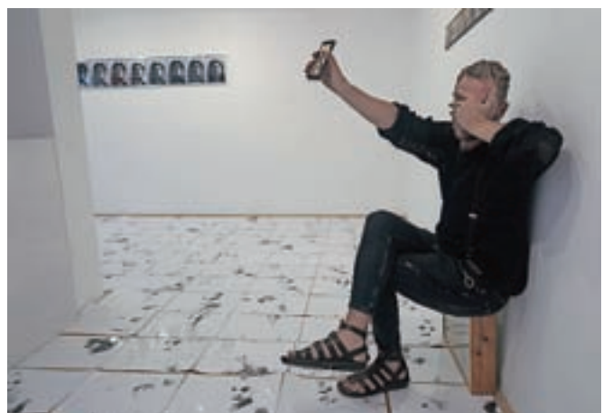
Sredi ukradene identitete / Foto: Igor Kavčič

Sprehodimo se torej po fotografijah, bolj ali manj prepoznavnih Borovničarjevih portretih. Fotografije so presvetljene, na tleh galerije pa jih je kakih tristo. Na stenah tako vidimo platna monotonih barv – v rdeči in modri, Borovničar pa je barvo nanje nanašal oziroma odtiskoval s prstnim odtisom, svojim palcem. Emilija Podjavoršek Matjažev fotografski portret računalniško spreminja v svojega lastnega. Z mobilnimi telefoni pa sledimo podobi avtorja in njegovega prstnega odtisa. Tu je še mala plastika v obliki palca.