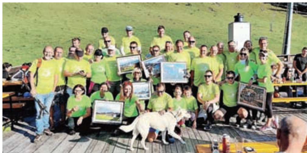
Junaki Krvavca 2021