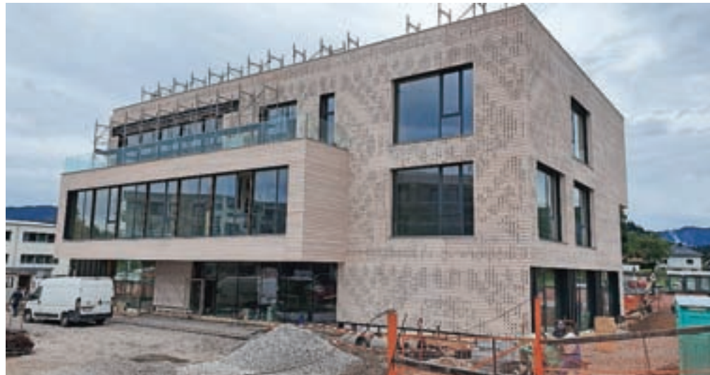
Objekt ima predvideno raznoliko programsko vsebino, ki bo, tako načrtujejo, kot celota tvorila kulturno-družabni center kraja. Stavba blejskega medgeneracijskega centra je zasnovana kot lesena skoraj ničenergijska stavba.

»Medgeneracijski center bo predstavljal raznovrstno okolje, ki vsebuje vse funkcionalne, družbene in prostorske elemente, ki jih običajno najdemo v širši urbani okolici. Uporabnikom bo zagotavljal kvalitetno okolje, ki presega zgolj zagotovitev funkcionalnih potreb in ustvarja nov kulturno-družabni center kraja,« napovedujejo. Stavba je zasnovana tako, da so mirne dejavnosti orientirane na zelene in zaščitene zunanje prostore, stran od prometa. V projektu je predvideno, da se v prostorih lahko sočasno zadržuje do okoli 120 obiskovalcev različnih programov in do sedem zaposlenih.