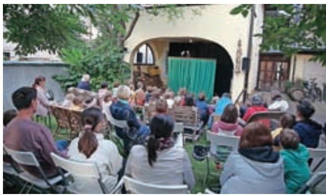
Ob 31-letnici Lutkovnega gledališča Tri so uprizorili predstavo Nekoč je bila.