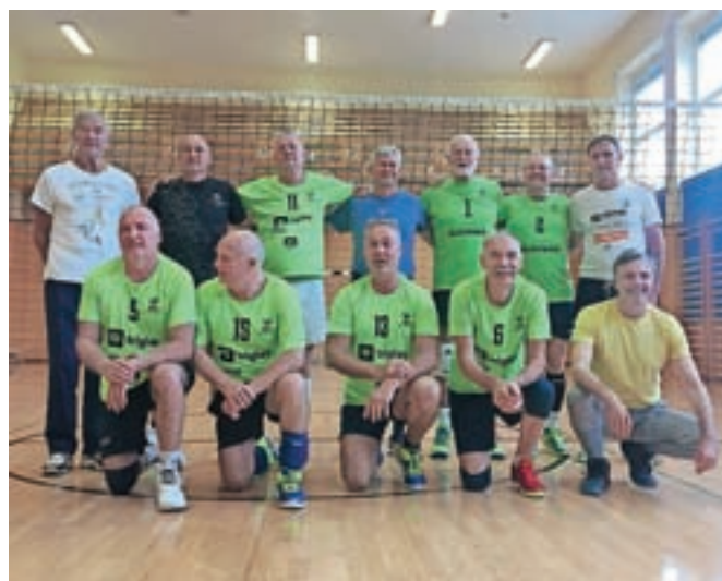
Slovenski odbojkarji veterani, ki bodo nastopili v kategoriji 56+.

Ekipo sestavlja 14 igralcev iz skorajda celotne Slovenije, tudi z Gorenjskega. V avgustu so se zbrali na kratkih pripravah na Zgornjem Jezerškem in trenirali v dvorani Osnovne šole Matije