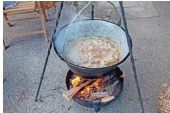
Priprava gobove juhe z ajdovo kašo