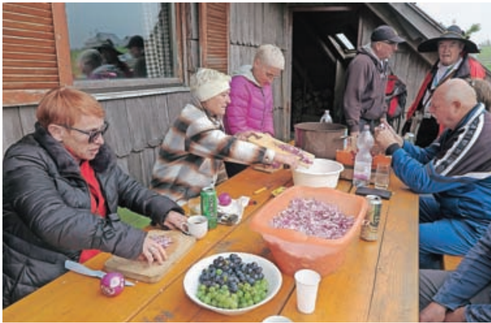
Bajtarji so že v petek popoldne lupili in narezali dvajset kilogramov čebule ...

»Golaž je že vse od začetka spremljevalec našega praznika in že vsa leta ga kuhamo na prvo oktobrsko