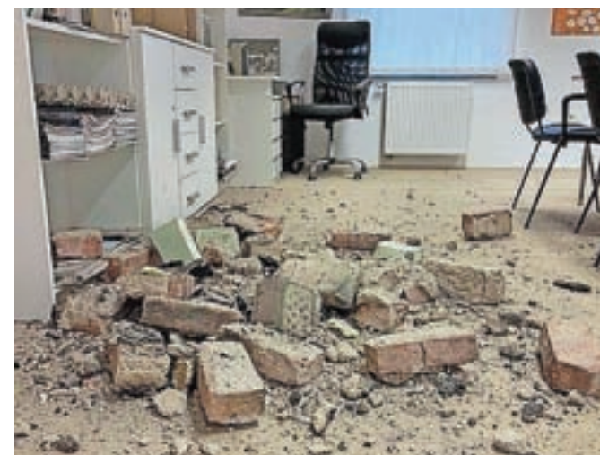
V medgeneracijskem centru se je zrušil del stropa.

MOK na očitke, da za objekt, ki od leta 2014 deluje v nekdanji kranjski gostilni Blažun, ni bilo izdano uporabno dovoljenje, odgovarja, da vzdrževalna dela, ki so jih izvedli pred sedmimi leti, niso terjala gradbenega dovoljenja. »Navedeno potrjuje tudi zapisnik gradbene inšpektorice iz leta 2014, ki je opravila ogled med izvajanjem del,« so še poudarili na kranjski občini.