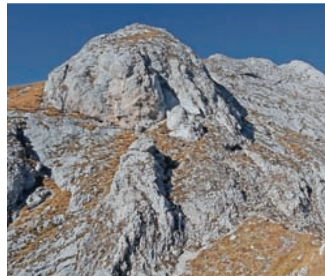
Stena, v kateri se skrivata dva tehnično zahtevnejša detajla: gladka plošča in kamin

navzgor, pod Prevalskim Stogom, vse do vrha Mišeljskega prevala. Na prevalu, ko zagledamo Vernar in Tosc na drugi strani, zavijemo na levo pobočje in sledimo redkim možicem čez tipičen kraški svet, poln škrapelj in žlebičev. Celoten greben vidimo ves čas pred seboj. Kopasti predvrh obidemo po desni strani, kjer nam možici kažejo najlažje prehode med jamami in brezni. Ko dosežemo travnato področje, se nam pokaže drugi predvrh, ki se ga ravno tako lotimo po desni. Dosežemo prvo tehnično zahtevnejše mesto: okoli 10-metrsko gladko ploščo, posuto z drobirjem, ki jo prečimo. V mokrem bi bil zdrs lahko usoden. Dosežemo širše skalnato področje, nad katerim zagledamo 60 metrov dolg kamin, ki ga premagamo malce po levi in desni strani, na vrhu pa tudi po sredi. Če se držimo možičkov, nas čaka plezanje II. težavnostne stopnje, sicer je lahko zelo hitro še zahtevnejše. Na vrhu kamina je ožje travnato sedelce. Od tod dalje le še sledimo grebenu, ki je ponekod bolj, ponekod manj strm. Previdnost mora biti velika, saj je krušljivo in izpostavljenost. Prostoren vrh nas nagradi: Stogovi, Ogradi, Debeli vrh, Vrh Hribaric, Kanjavec, Triglav, Mišelj vrh, Vernar, Tosc itd. Sestopimo po