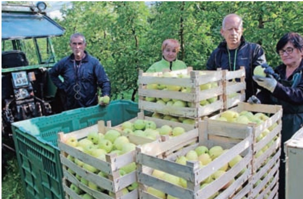
Med obiranjem jabolok v sadovnjaku Resje

Mošnje – V največjem gorenjskem sadovnjaku, v nasadu Resje, s katerim gospodarji Kmetijsko gozdarska zadruga Sava Lesce, so letos na 22 hektarjih rodnega sadovnjaka pridelali le okrog sto ton jabolok, kar je od osemdeset do devetdeset odstotkov manj kot bi ga v normalnih razmerah. Običajno jih pridelajo okrog osemsto