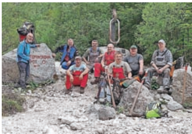
Tehnična skupina markacistov PZS po obnovi Tominškove poti

Mojstrana – S Planinske zveze Slovenije so sporočili, da je priljubljena Tominškova pot, ki je ena najstarejših planinskih poti v Sloveniji in prva, ki je bila nadelana s pomočjo sredstev iz slovenskih virov in je zato postavljena na prav posebno mesto med slovenskimi planinskimi potmi, obnovljena in znova odprta. Zaradi hudourniških voda, podora in poškodovanih varoval je bila namreč pot več mesecev zaprta. Obnove poškodovanih varoval se je lotila tehnična skupina osmih markacistov Planinske zveze Slovenije, pri tem pa jim je pomagala tudi družba Slovenski državni gozdovi, ki je poskrbela za pridobitev potrebnega lesa, in Slovenska vojska, s pomočjo katere so material do delovišča lahko dostavili s helikopterjem.