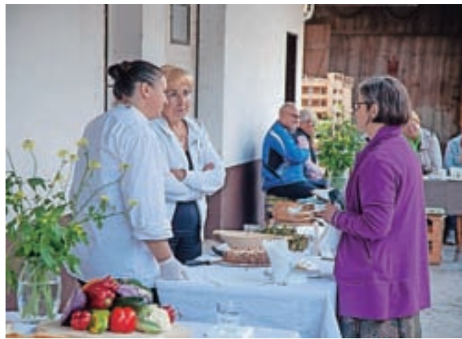
Dogajanje na domačiji Pr' Franc

»Letošnji Dnevi evropske kulturne dediščine, ob katerih smo organizirali današnji dogodek, potekajo v znamenju hrane pod temo Dober tek! Prav zato smo se v sodelovanju s kranjskim zavodom za varstvo kulturne dediščine odločili, da obudimo pripravo starih jedi,