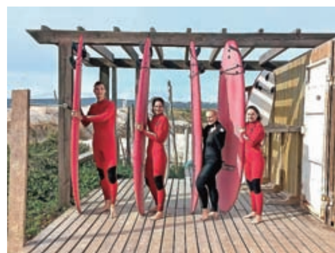
Prva učna ura surfanja na neusmiljenih valovih Atlantika

začel boleti hrbet, moja kolena so enako trpežna kot pretekla leta in tudi sladkarije se še ne nabirajo v »šlavfkih« okoli trebuha. Le misli so druge: rojstnodnevne želje sem letos zamenjala za hvaležnost – za vse, kar je bilo in kar je: za nove prijatelje,