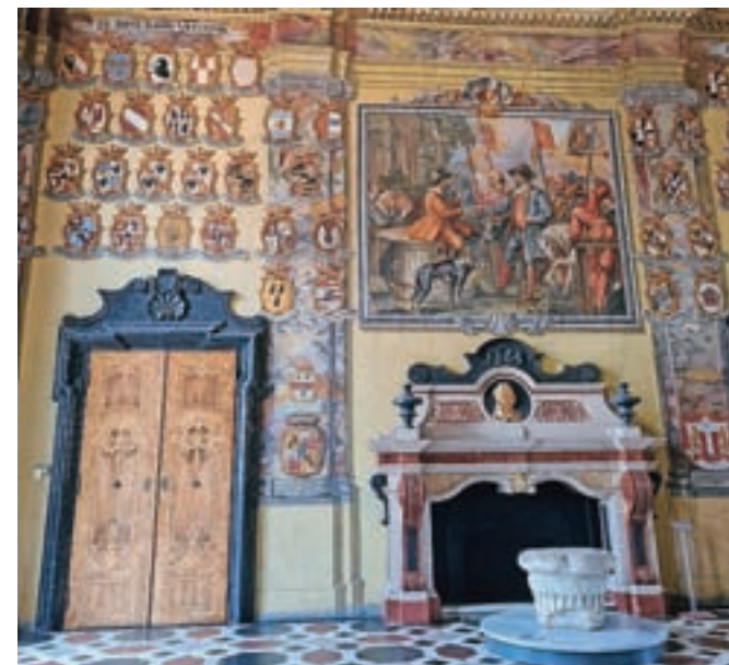
Znamenita dvorana grbov v deželni hiši (Landhaus) s knežjim kamnom