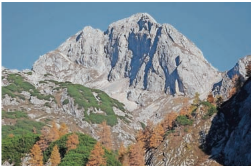
Škednjovec, drzna špica sredi fužinarskih gora

izredno izpostavljenem in krušljivem grebenu do sedla med Škednjovcem in Vrhom Hribaric. Nadaljujemo sestop po meliščih, tik pod steno Škednjovca, ki nas pripeljejo na markirano pot. Zavijemo desno proti Lazoviškemu prevalu. Gremo čez preval in malce pod njim, pri oznaki za Vodnikov dom oz. smer proti Mišeljskemu prevalu, zavijemo levo na neoznačeno stezico, ki