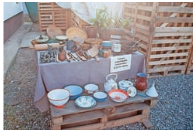
Razstava starih kuhinjskih pripomočkov