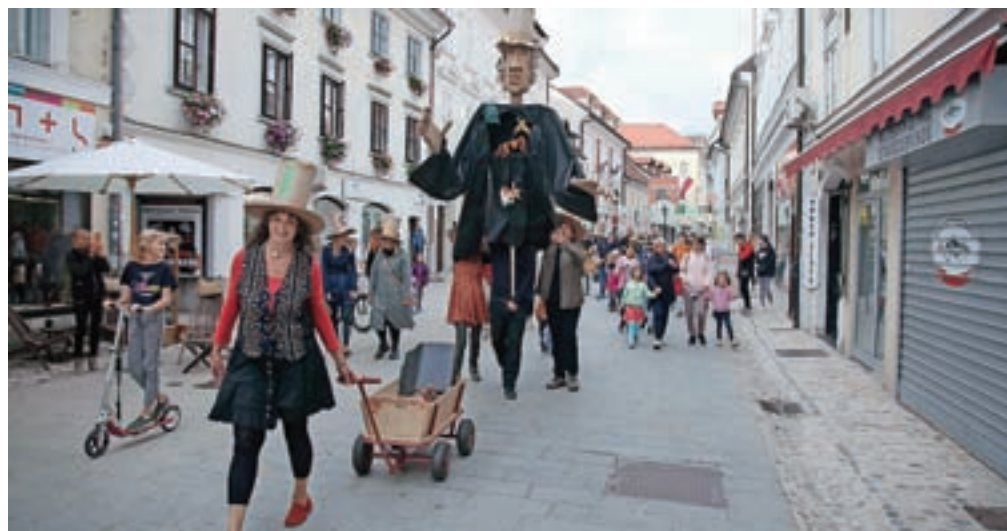
Ulični sprevod klobukarjev je v petek naznanil začetek nove sezone v Kulturnem centru Krice krace.