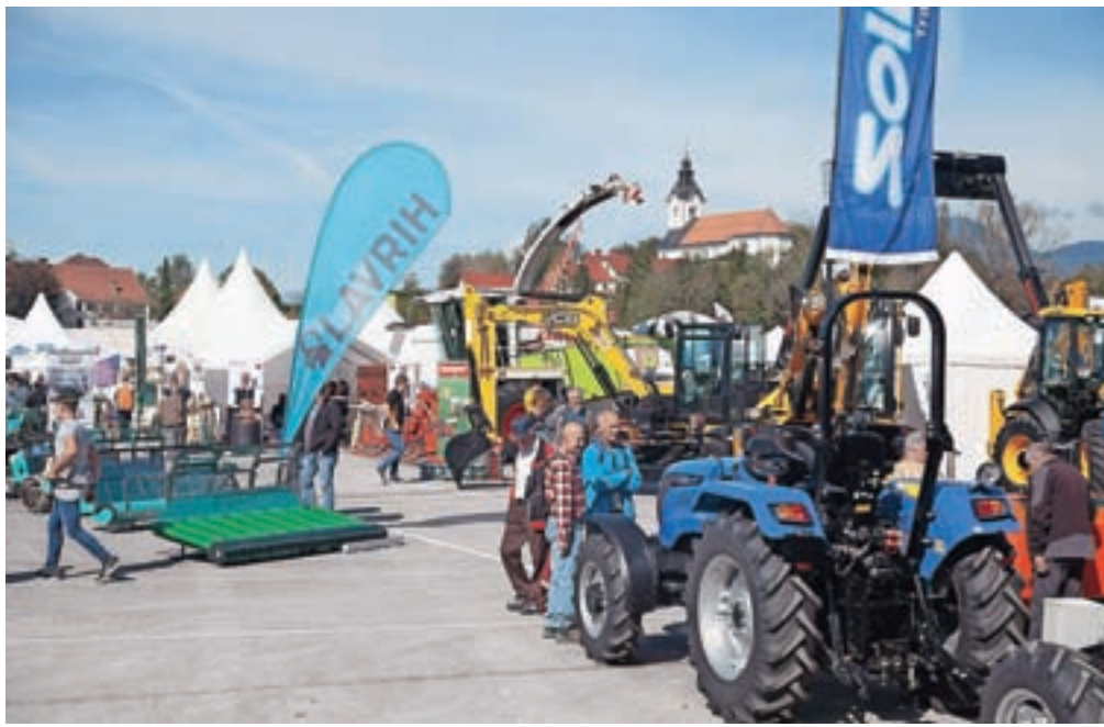
Okoli štiristo razstavljalcev je sodelovalo na letošnjem sejmju.

Z minuto molka pa so zbrani počastili spomin na začetnika in dolgoletnega predsednika Konjeniškega