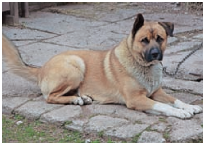
Spremenjeni zakon prepoveduje privezovanje psov, a dovoljuje nekatere izjeme. Slika je simbolična.

Kranj – »To je pomemben korak k zagotavljanju boljših pogojev za življenje domačih živali in tudi dokaz, da imamo ničelno toleranco do kakršnegakoli mučenja rejnih ali domačih živali.« je po sprejetju zakona dejal minister za kmetijstvo, gozdarstvo in prehrano Jože Podgoršek in poudaril, da je ena ključnih sprememb omejitev posedovanja eksotičnih vrst živali.