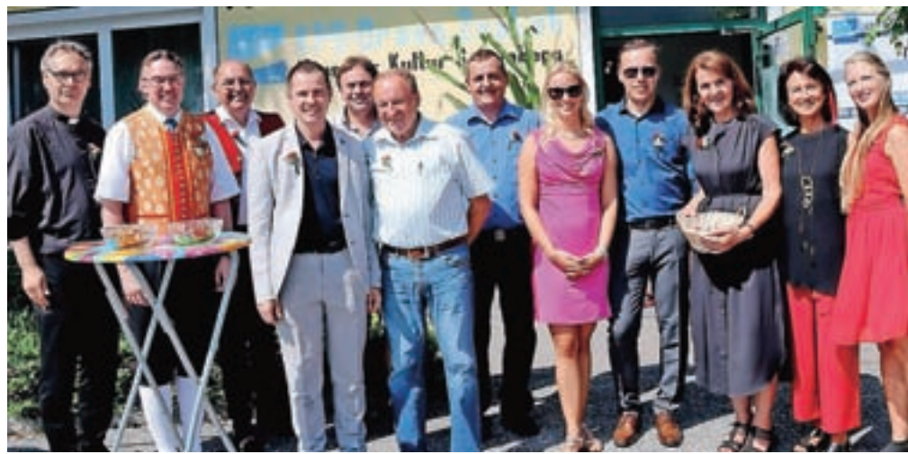
Člani Katoliškega prosvetnega društva Drava in gostje na prazničnem potovanju pred domom kulture v Žvabeku