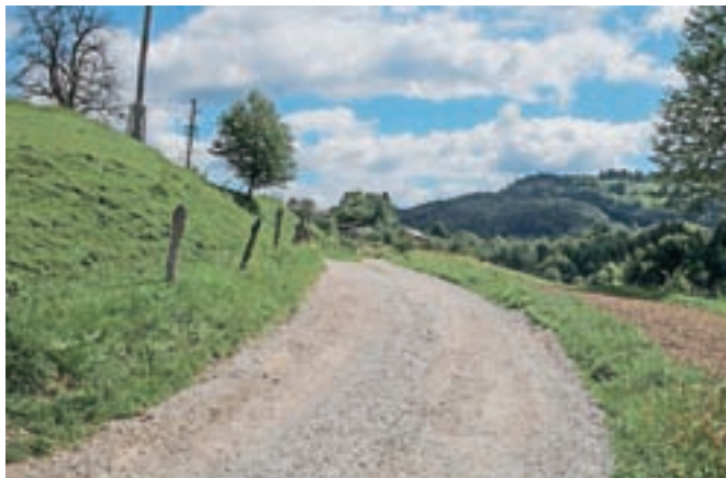
V krajevni skupnosti Tuhinj bodo asfaltirali javno pot Cirkuse v Tuhinju–Veliki Hrib dolžini 604 metre.

»Makadamske javne poti in lokalne ceste bomo asfaltirali glede na prioritete, ki smo jih prejeli od posameznih krajevnih skupnosti. Asfaltirali bomo kar 13 odsekov makadamskih javnih poti in lokalnih cest – mislim, da največ v zgodovini občine –, naš cilj pa je predvsem zmanjšanje stroškov vzdrževanja na hribovitih delih in na delih javnih poti in cest, ki še niso asfaltirane. Pogodbena vrednost vseh investicij znaša 535.524,77 evra. S pogajanjem smo cene