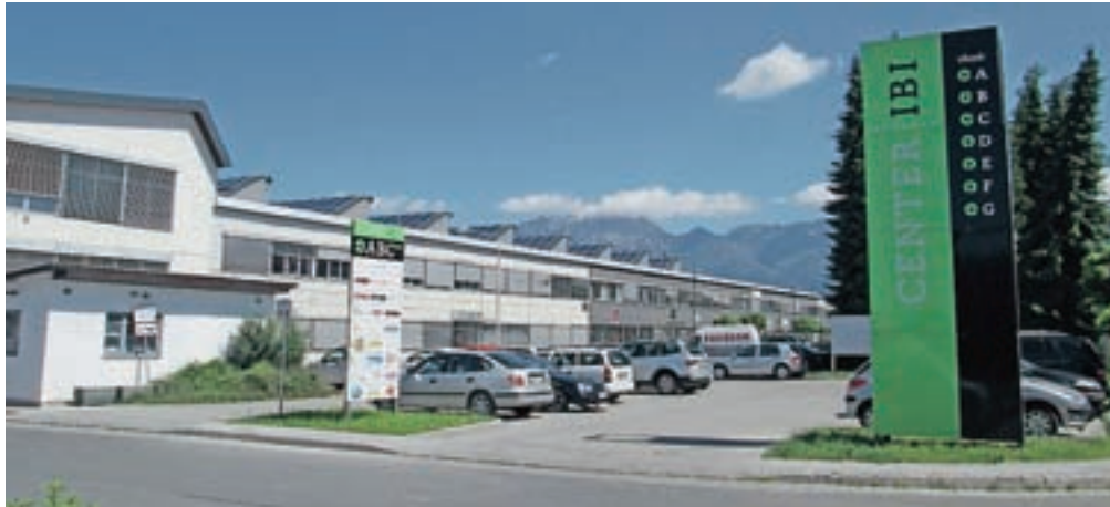
Nekateri industrijski obrati so bili preurejeni za storitvene dejavnosti, na primer nekdanji obrati IBI-ja v Kranju.

Leta 1992 je bilo v program reševanja Sklada za razvoj vključenih deset gorenjskih podjetij, vendar so bila kasneje prodana. Nekdanji