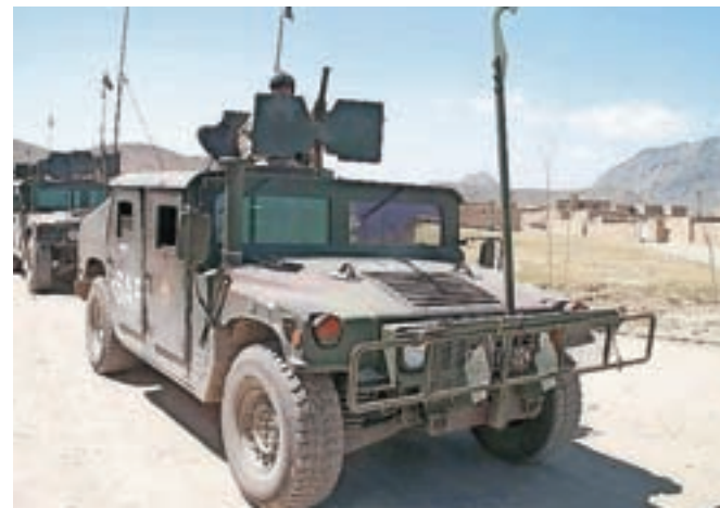
Slovenska enota na misiji ISAF v Afganistanu, na terenskih vozilih znamke Humvee