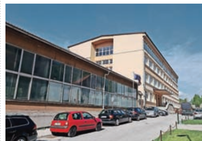
Prenova kompleksa Srednje šole Jesenice bo izziv za arhitekturno stroko.

Kot je znano, je vlada maja letos sprejela sklep o uvrstitvi obnove Srednje šole Jesenice v načrt razvojnih programov 2021–2024. Ocenjena vrednost težko priča-