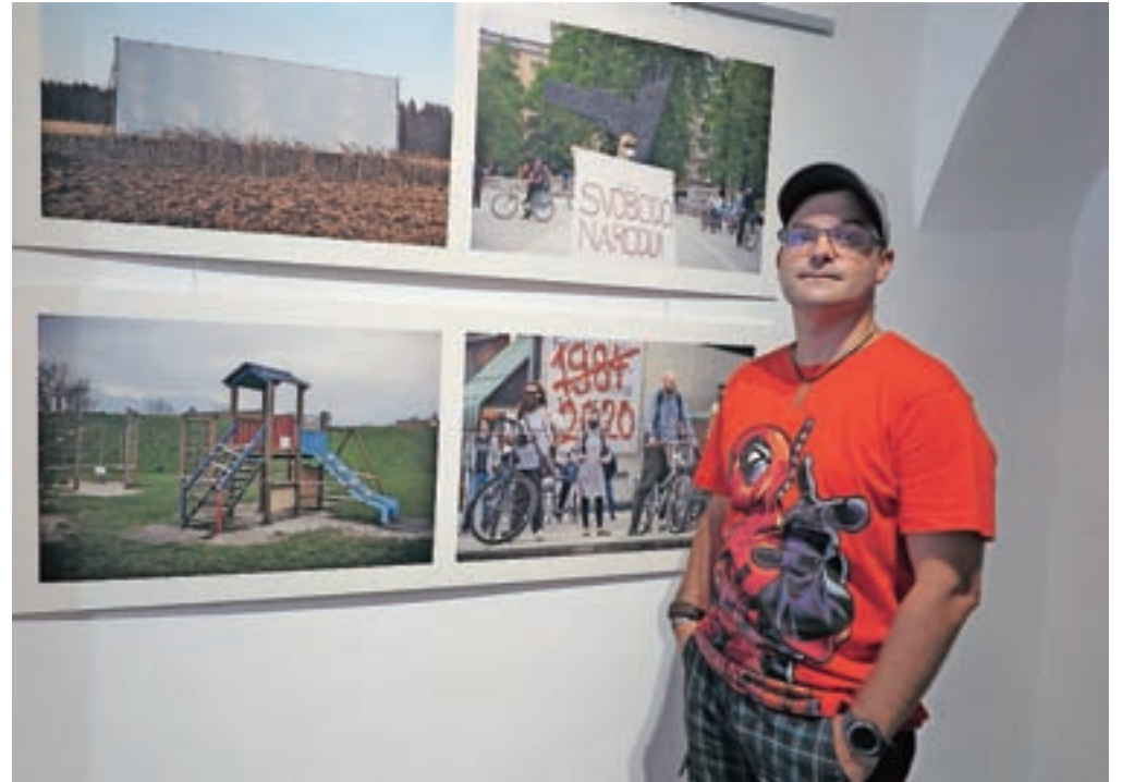
Fotoreporter Luka Dakskobler je pronicljiv raziskovalec aktualnega časa.

Na eni strani prazna avtocesta, na drugi poln trg protestnikov. Zdravstveni delavec v oranžni zaščitni opre, ki dela za dobro ljudi, ali policist »robocop«, ki brca baklo, v vlogi represivnega organa. Babica in vnukinja