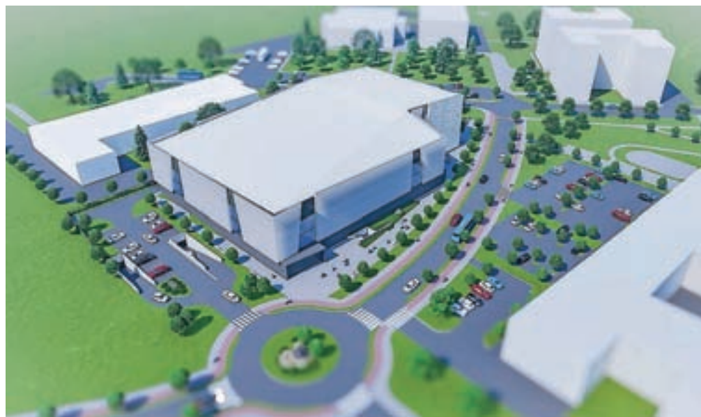
Nacionalni plezalni center bi v Kranju najraje gradili v javno-zasebnem partnerstvu.

Na Mestni občini Kranj (MOK) so pojasnili, da bo plezalni center namenjen vrhunskim in rekreativnim