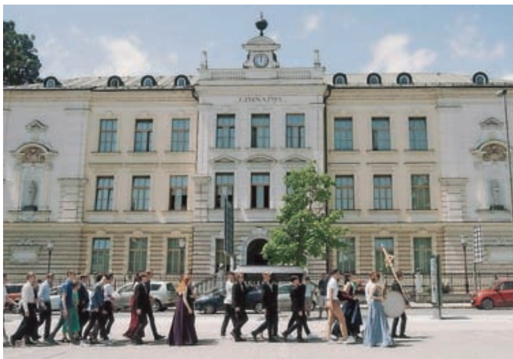
Tradicionalni maturantski sprevod po Kranju

nim, slavnostnim maturantskim plesom. Ukrepom primerno smo ga pripravili kar v šoli in ga poimenovali Popoldne z maturanti.« Zelo odmeven je bil tudi dogodek Dan ZaMe oziroma dan za mentalno zdravje s priznanimi predavatelji, ki so ga v šoli pripravili na pobudo dijakov, ki so že lanskega decembra zaznali psihološki vpliv epidemije na dijake. Na daljavo so izpeljali tudi Dan talentov, posnetke pa je še vedno mogoče najti med podkasti, ki jih dijaki objavljajo na šolskem kanalu na YouTubeu. Prav tako na YouTubeu je mogoče najti še kratke filme z zanimivimi znanstvenimi poskusi, ki jih snemajo v okviru projekta Čarovnije narave. Gimnazija Kranj tako že več kot 220 let ostaja vodilna gorenjska izobraževalna ustanova, ki se zaveda svoje tradicije in akademske odgovornosti, ki jo ima do mladega človeka sodobnega časa. Ob visoki obletnici prve mature si želijo, da gimnazija ostane prostor in nosilka odličnega znanja, kakovostne izobrazbe, prodornih idej, kritičnega mišljenja, slovenske narodne zavesti in svetovljanskega duha.