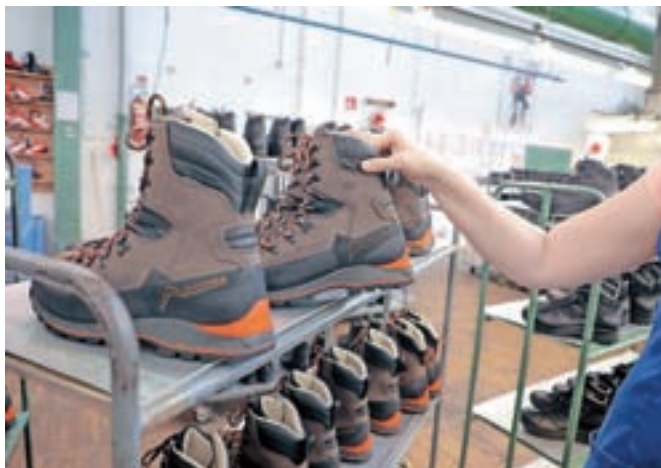
Prednostno naj bi DUTB iskal strateškega kupca, ki bo prepoznal vrednost blagovnih znamk in razvojni potencial družbe Alpina. Fotografija je simbolična.

V dogovoru z DUTB namreč ne smejo razkrivati informacij glede prodajnega postopka, so pojasnili. V Alpini sicer že od leta 2016 poteka finančno prestrukturiranje, a je vpliv pandemije in posledično ukrepi držav za njeno zavezitev pomembno upočasnili uspešnost tega postopka, so sporočili v začetku marca, ko so objavili tudi informacijo, da so odpustili osemnajst zaposlenih, še dvajsetim pa delovno razmerje odpovedali s tako imenovanimi mehkiimi metodami. Izguba v preteklem letu je bila namreč večja, kot so predvidevali, predvsem zaradi izpada prihodkov kot posledice ukrepov za preprečevanje pandemije, zelene zime v sezoni 2019/2020 in dolgotrajnega zaprtja smučišč. Ob 38,7 milijona evrov čistih prihodkov so imeli namreč 4,6 milijona evrov izgube, so razložili v Alpini. Zelena zima v sezoni 2019/2020 je negativno vplivala na prodajo zimskih športne obutve, manjše povpraševanje po smučarskih čevljih je bilo tudi v letošnji smučarski