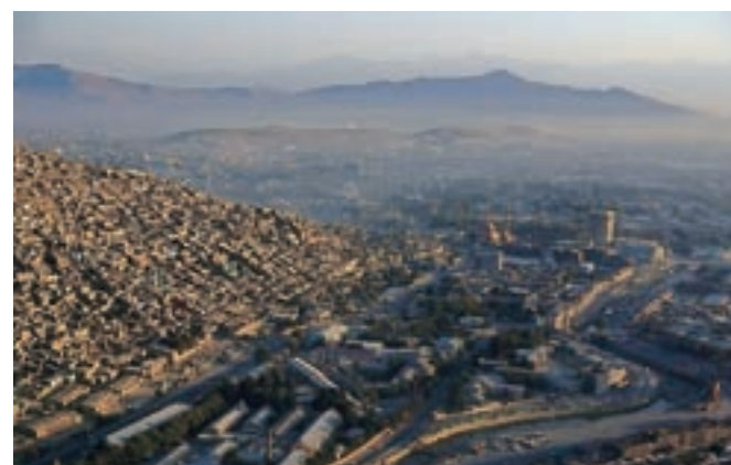
Pogled na vedno fascinantni Kabul iz zraka. Srečni in redki so tisti, ki lahko to nesrečno mesto še zapustijo po zračni poti.