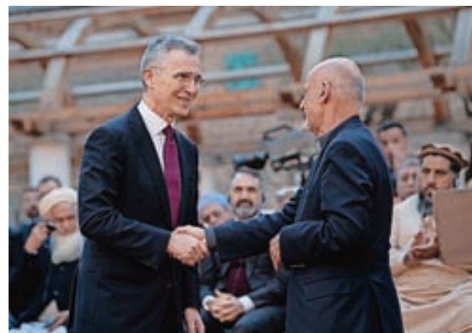
Porazenca vojne v Afganistanu: generalni sekretar Nata Jens Stoltenberg in afganistanski predsednik Ashraf Ghani, v Kabulu, 29. februarja 2020