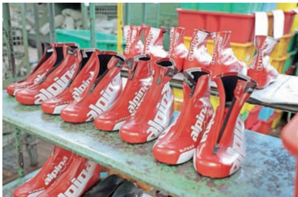
DUTB je začel postopek prodaje stoodstotnega lastniškega deleža in vseh svojih terjatev do družbe Alpina iz Žirov. Fotografija je simbolična.