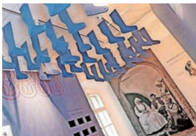
Iz bogate zbirke Tržiškega muzeja, ki bo tudi na Šušarsko nedeljo na široko odprla svoja vrata

obremenjevati okolja; in spremembo potrebuje tudi naš šušarski praznik. Zato pravim, da se vrnemo nazaj h koreninam, k slovenskemu, tržiškemu poreklu. Naslednjo nedeljo med 8. in 19. uro bo živahno v starem mestnem jedru, pod enotnimi stojnicami se bo predstavilo približno trideset obrtnikov, med njimi štirje ponudniki suhe robe. Od teh jih je okrog deset iz Tržiča, a še premalo, če mene vprašate. Pogoj za udeležbo na stojnici je, da imajo slovenski ponudniki vsaj sedemdeset odstotkov prodajnega programa izdelkov lastne proizvodnje ali slovenskega porekla.