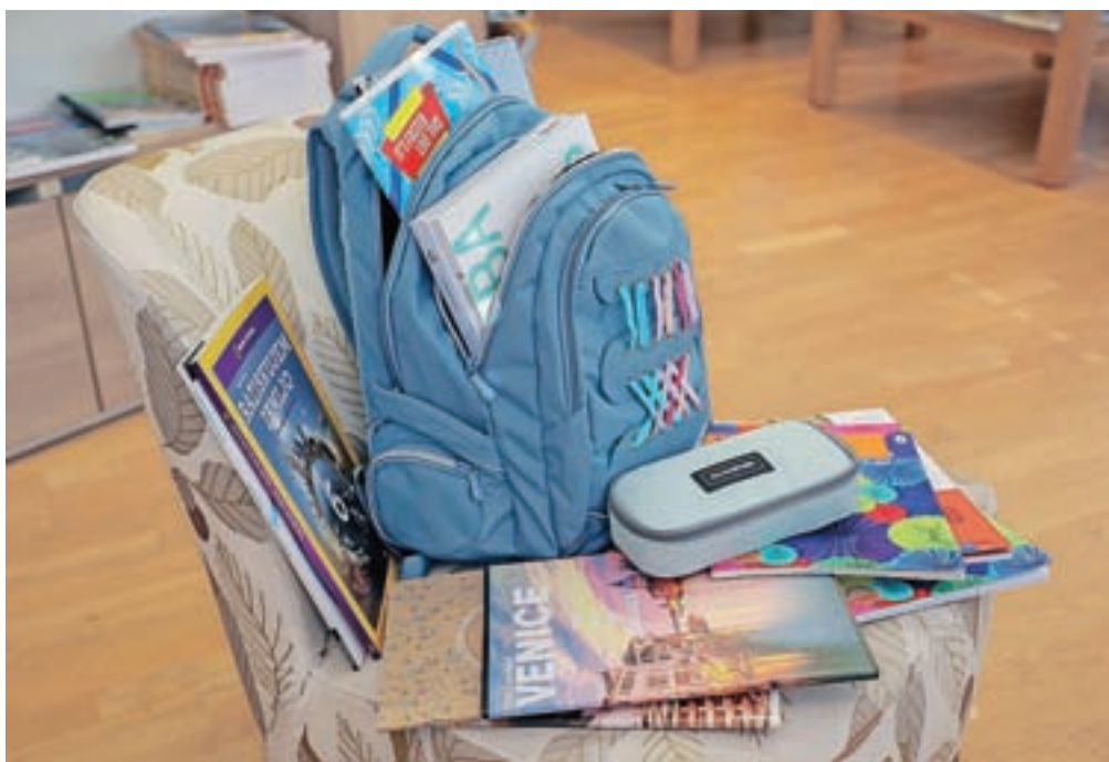
V humanitarnih organizacijah so tudi letos pripravili več akcij, s katerimi bodo družinam pomagali pri nakupu šolskih potrebščin.

jo Slovenska karitas v avgustu razdeli socialno ogroženim družinam s šoloobveznimi otroki, in sicer v obliki paketov šolskih potrebščin ali v obliki bonov oziroma naročilnic za nakup delovnih zvezkov in šolskih potrebščin. "Družine v stiski se po pomoč glede šolskih potrebščin lahko obrnejo na najbližjo karitas v svojem kraju," so pojasnili na Slovenski karitas in dodali, da so v lanski vseslovenski dobrodelni akciji Otroci nas potrebujejo do konca leta zbrali skoraj 184 tisoč evrov. Pomoč je lani prejelo 11.963 otrok, letos jo bo po njihovi oceni potrebovalo več kot 12 tisoč otrok. Številni starši, ki komaj shajajo iz meseca v mesec, se namreč ob koncu šolskega leta znajdejo v še večjih težavah, ko njihovi otroci prejmejo sezname šolskih potrebščin, ki jih je treba čez poletje kupiti za naslednje šolsko leto, opozarjajo in dodajajo, da je samo za najnujnejše in obvezne šolske potrebščine za