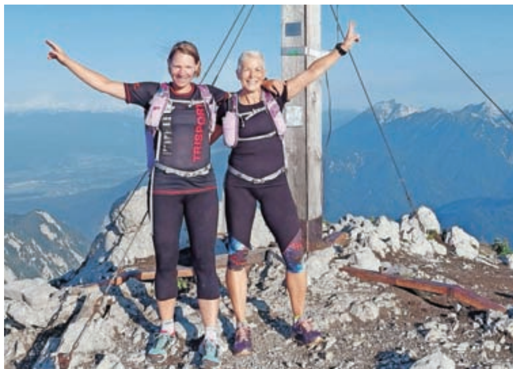
Na vrhu Storžiča

Pred odhodom sta naštuđirali Vikijev vodnik, kakšno stran vodnika poslikali s telefonom, da sta jo potem na poti lahko na shranjeni sliki ponovno prebrali. »Pot je pretežno dobro markirana, sem in tja sva markacije