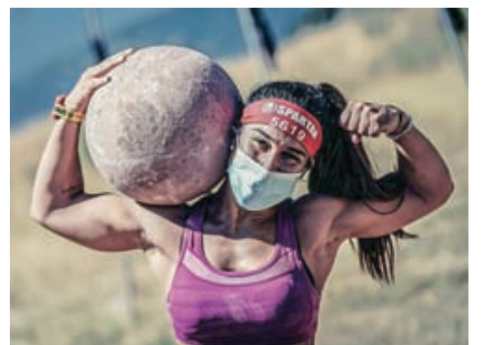
»Špartanci« se bodo jutri pomerili v Kranjski Gori. Na progi, dolgi pet kilometrov, jih bo čakalo deset ovir. Napovedujejo zanimivo tekmovalje.

Prvi start bo med 9. in 11. uro, drugi pa med 13. in 16. uro. Možnost prijave bo tudi na samem prizorišču. Dogajalo se bo cel dan.