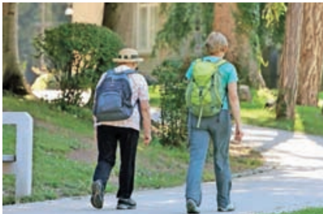
Interventni zakon poleg novih turističnih bonov prinaša še druge ukrepe za pomoč gospodarstvu in turizmu. Fotografija je simbolična.

Poleg novih turističnih bonov zakon prinaša tudi dvajset milijonov evrov, namenjenih za subvencioniranje skrajšanega delovnega časa še vsaj do konca septembra z možnostjo podaljšanja do konca leta. Podjetjem s področja turizma, gostinstva in industrije srečanj bo država sofinancirala regres za letni dopust za letošnje leto v višini 1024 evrov na zaposlenega. Do ukrepa pa bodo upravičeni vsi, ki so dejavnost registrirali najpozneje do 31. maja letos in imajo več kot