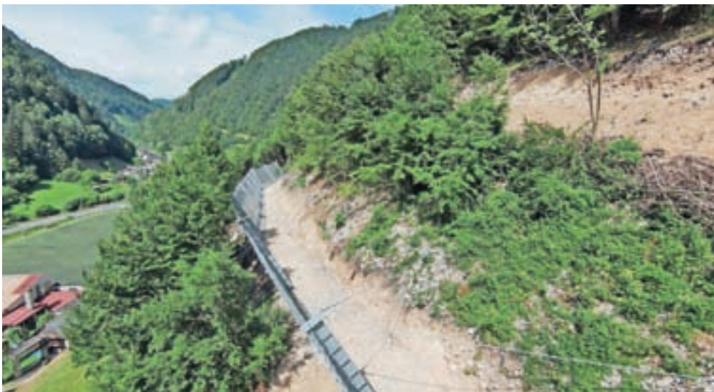
Za zaščito najbolj ogroženih hiš Na Plavžu so na brežini postavili od štiri do pet metrov visoke zaščitne ograje v skupni dolžini 414 metrov.

Zaščitne ograje sicer privablajo tudi radovedne opazovalce, ob tem pa je Pintar opozoril, da na poti, ki je služila gradnji objekta, prihaja do nenadzorovanega proženja kamnja. »K temu pripomore veliko vznemirjanje divjadi, ki se nahaja na gozdnem pobočju nad zgrajenimi mrežami,« je dodal.