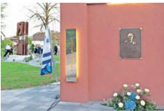
Na steni Obrazi sotočja so odkrili spominsko ploščo Jakobu Aljažu, v neposredni bližini (levo) pa v njegov spomin postavili Stolp upanja.

povezava treh cerkva sv. Jakoba, ki stojijo v občini Medvode, z rojstno hišo Jakoba Aljaža. Pohodniki se bodo odpravili na pot s treh točk (cerkev sv. Jakoba na Petelinu v Žlebeh, tabla Učna pot Žlebe in cerkev sv. Jakoba v Hrašah), cilj vseh pa bo pri rojstni hiši Jakoba Aljaža v Zavrhu.