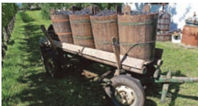
»Bendima« pri Vovkovi v Dutovljah je tudi etnološka poslastica, saj grozdje nabirajo v lesene posode (urnice).

Priimek Vovk je dobil človek, ki je bil divjega, napadalnega značaja. Možno pa je tudi, da so tak priimek ljudje dali kakemu posebej prestrašenemu človeku. Priimki so namreč nastajali velikokrat tudi iz ironije. Možno je tudi, da je tak priimek dobil nekdo, ki je bil vedno