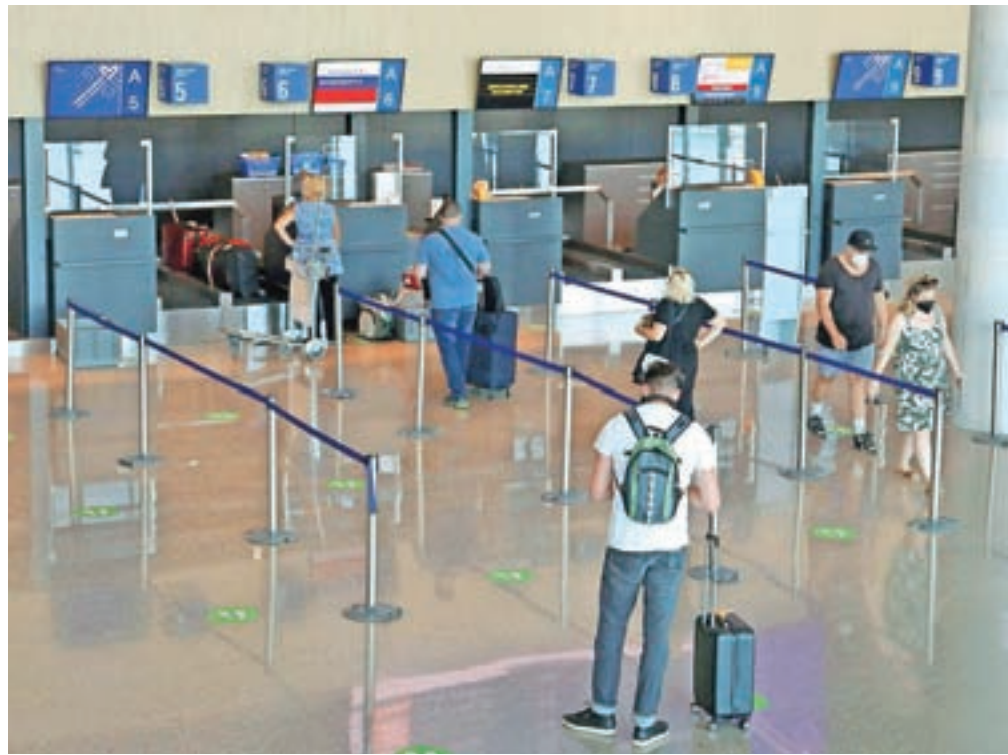
Potniki na novem terminalu brniškega letališča

Kot nam je povedala Brigita Zorec, vodja korporativnega komuniciranja v Fraportu, se trenutno vsi potniški leti odvijajo z novega terminala. V času projektiranja, ko je bilo prometa še