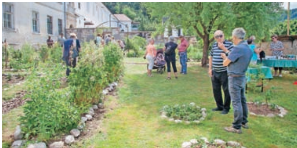
Zeliščni vrt za samostanskim obzidjem v Mekinjah

S projektom, ki ga sofinancirata tako Evropska unija kot država, v Mekinjah tako nadaljujejo oživljanje samostana, spogledujejo pa se tudi s kulturnim turizmom. V samostanu so namreč uredili več sob, ki se po besedah direktorice v teh dneh že lepo polnijo. Prevladujejo tuji gostje, nekaj pa je tudi Slovencev, ki uporabijo turistične bone.