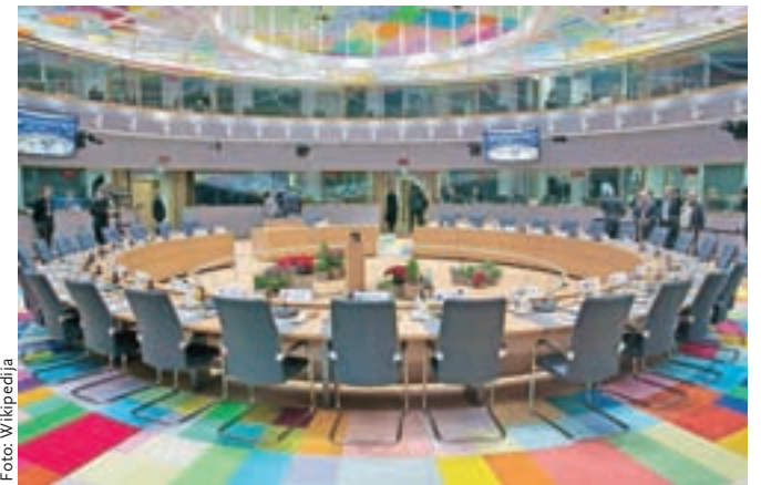
Sejna dvorana Evropskega sveta v palači Evropa v Bruslju