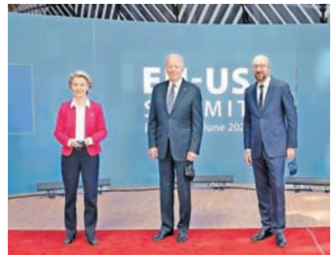
Predsednica evropske komisije Ursula von der Leyen, ameriški predsednik Joe Biden in predsednik Evropskega sveta Charles Michel, Bruselj, 15. junija 2021