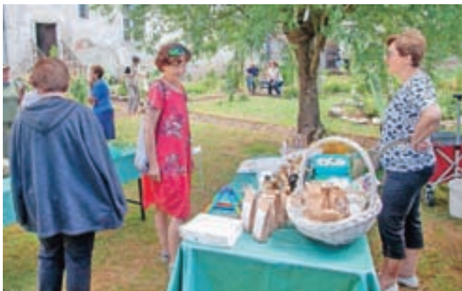
Petkovo odprtje je privabilo tudi precej obiskovalcev.

Zunanja podoba vrta za samostanskim obzidjem se bo spreminjala tudi v prihodnje. Pomembno mesto bodo tako kmalu zasedle vrtnice, v sušilnici in predelovalnici v samostanskih prostorih pa bodo izdelovali