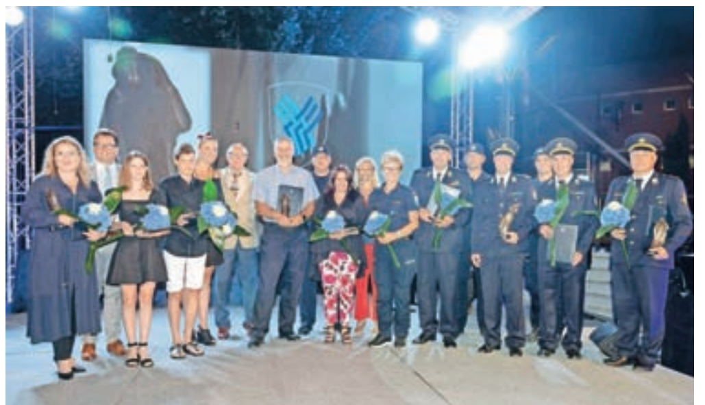
Letošnji občinski nagrajenci v Medvodah / Foto: Peter Košenina

Pred slavnostno sejo so na sotočju Sore in Save za