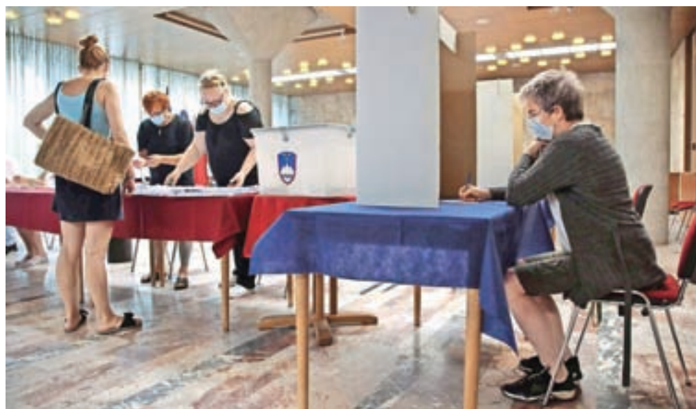
V prvih dveh dneh se je predčasnega glasovanja v državi udeležilo 54.456 volivcev oziroma 3,21 odstotka vseh volilnih upravičencev. Na referendumu o drugem tiru leta 2017 je v dveh dneh predčasno glasovalo 8.378 volivcev oziroma 0,49 odstotka vseh volivcev. / Foto: Gorazd Kavčič