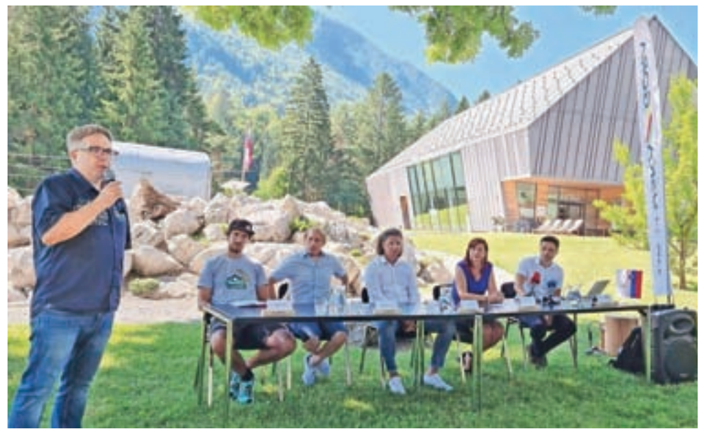
Novosti so predstavili v sredo pred Slovenskim planinskim muzejem v Mojstrani.

V skrbi za večjo varnost in prijetno bivanje obiskovalcev ter domačinov so letos uvedli Turistično patroljo.