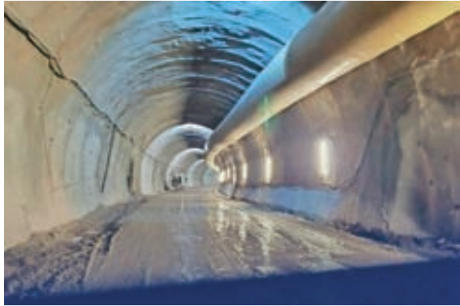
Gradnja druge cevi predora Karavanke se nadaljuje.

Hrušica – Prejšnji teden je izvajalec Cengiz zabeležil pomemben mejnik – izkopali so prvi kilometer vzhodne cevi predora Karavanke. Kot so pojasnili v družbi Dars, dela pri izgradnji druge cevi karavanškega predora potekajo v okviru načrtanih planov. Trenutno izkop poteka skozi daljši geološki prelom, drugih posebnosti pa ni. V predoru dela 115 delavcev Cnegiza, od tega je 16 slovenskih, ki so zaposleni pri tem turškem podjetju. Poleg tega delo zunaj predora opravlja še 35 delavcev več slovenskih podizvajalcev, med njimi je tudi Gorenjska gradbena družba. Na avstrijski strani predora Karavanke bodo izkopna dela, ki so jih začeli dve leti pred nami, po zadnjih informacijah zaključili predvidoma konec septembra letos, so nam še povedali na Darsu.