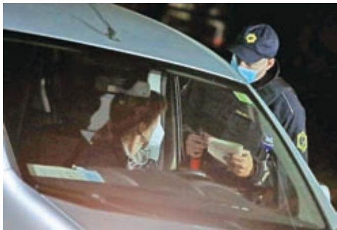
Državni zbor je potrdil novelo zakona o nalezljivih boleznih, ki po navedbah vlade oži polje njene proste presoje pri sprejemanju omejitvenih ukrepov.