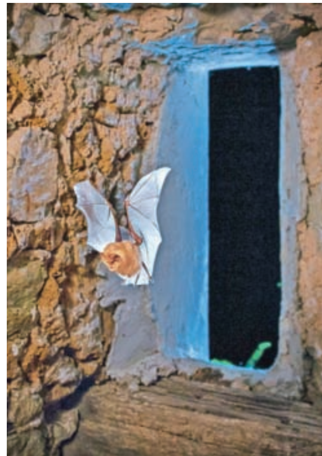
Netopirji naseljujejo tudi številne objekte kulturne dediščine.

Kot pojasnjujeta Presetnik in Zamolova, je miroljubno sobivanje netopirjev in človeka mogoče, pripravne rešitve pa zelo poceni. Podest iz desk nad zvonovi denimo prepreči onesnaževanja z netopirskimi iztrebki – gvanom, dele stavb, ki jih netopirji navadno ne uporabljajo, pa lahko zastremo. Ob prenovah stavb pa se je treba posvetovati tudi s strokovnjaki za ohranjanje narave, ki bodo skupaj z upravljavci