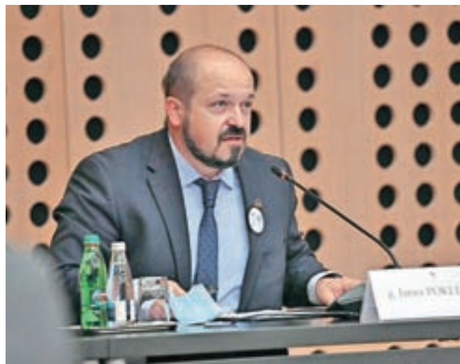
Minister za zdravje Janez Poklukar na srečanju z župani na Brdu pri Kranju

Brdo pri Kranju – »Pred sabo imamo jasno sliko, kje smo, imamo tudi natančen pogled v prihodnje tedne in mesece. Vemo, kaj se je dogajalo v taki situaciji v prejšnjih valovih in nič drugače ne bo tokrat, razen da smo soočeni z novimi, bolj kužnimi različicami virusa,« je v svojem nagovoru županov poudaril predsednik vlade Janez Janša. Opozoril je, da imamo ta čas na voljo dovolj cepiva in je mogoče celo izbrati med različnimi cepivi, pa se ljudje ne cepijo, obenem pa v bolnišnice sprejemajo ljudi, ki tudi resno zbolijo za covidom-19 in niso cepljeni, čeprav bi lahko bili. »Naša naloga je, da organiziramo cepljenje tako, kot je bilo rečeno. Tisti, ki bo jeseni resno zbolel ali celo umrl, ker se ni cepil, bo težko krivil vlado, župana ali kogarkoli za to,« je še dejal in dodal, da bomo na koncu vsi nosili posledice, če bodo zaprti vrtili in šole, omejena proizvodnja in se bo javno življenje ustavilo. »Ne le, da bomo psihološko to težko prenesli, ampak bomo s tem zapravili tudi enkratno priložnost, ki jo imamo za okrevanje,« je še poudaril Janša.