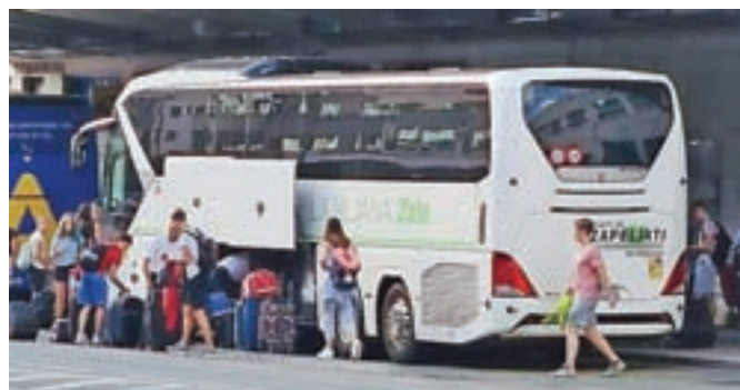
V Lloret de Mar so gorenjski maturanti potovali z avtobusi.

Jesenice – Potem ko so v skupini maturantov z Dolenjske, ki se je v soboto vrnila z maturantskega izleta v Španiji, odkrili skoraj šestdeset okužb, se je včeraj zjutraj domov vrnila tudi skupina več kot tristotih gorenjskih maturantov. Na testiranju s hitrimi testi pred odhodom v Slovenijo so bili sicer vsi negativni, a 87 jih testiranja ni opravilo. V Španiji so se epidemiološke razmere v zadnjih dneh izrazito poslabšale, močno se je povečalo število okužb zlasti med mladimi. A Lloret de Mar je na oranžnem seznamu, kar pomeni, da dijakom ob predložitvi negativnega testa ali potrdila o cepljenju oziroma prebolelosti ni bilo treba v karanteno. V NIJZ gorenjskim maturantom kljub temu svetujejo, naj se pet dni čim bolj zadržujejo doma.