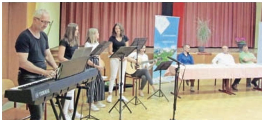
V Ločah ob Baškem jezeru so z besedo in pesmijo predstavili pravljico o nastanku pesmi Njav čriez izaro.