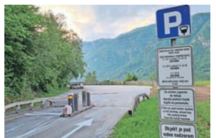
Parkirišče Vegelj ob Bohinjskem jezeru: načrtujejo, da ga bodo dodatno ozelenili in zmanjšali število parkirnih mest za avtomobile ter več prostora namenili kolesom in motorjem.

Idejna zasnova vključuje tudi nadomestitev dotrajane objekta za padalce ter ureditev tlakovane površine za pešce, ki bi bila od parkirišča