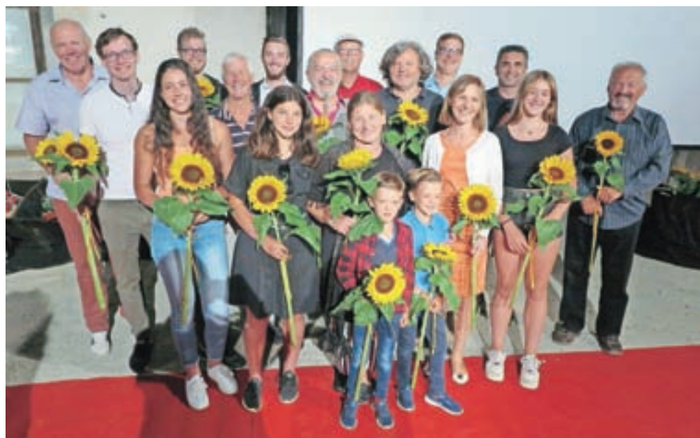
Filmske premiere Desetega brata se je udeležil večji del filmske ekipe in bil več kot zadovoljen z videnim.

V KUD Predoslje konec poletja načrtujejo še nekaj javnih projekcij Desetega brata, potem pa bodo film ponudili tudi na YouTubeu.