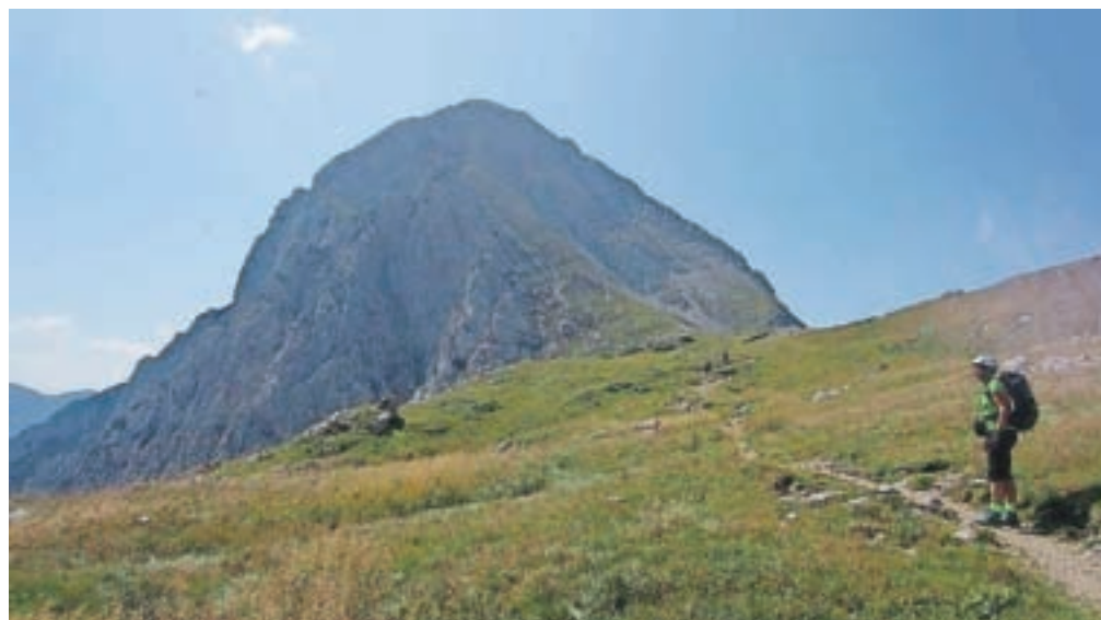
Pogled na Brano s Kamniškega sedla