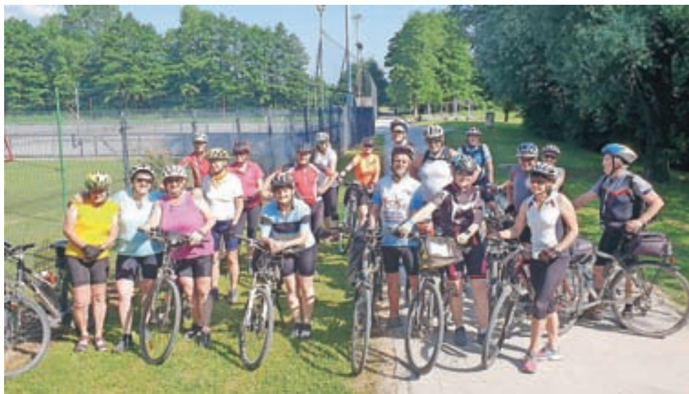
Glasovi kolesarski popotniki v športnem parku v Kočevju

zvrežajo za potrebe Slovenske vojske. Po kratkem spustu smo se pripeljali v Kočevsko Reko, naselje, ki so ga po drugi svetovni vojni spremljale mnoge skrivnosti. (Se nadaljuje)