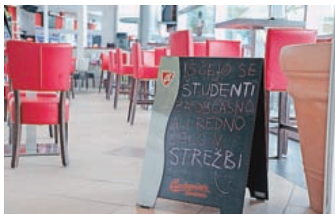
Študentov in dijakov za delo trenutno ne primanjkuje samo v gostinskem ali turističnem sektorju, temveč tudi na drugih področjih.

Ponudba del je v preteklem letu nihala glede na aktualne ukrepe v zvezi z epidemijo covid-19. Največji padec so zaznali marca in aprila lani, ko je bilo do devetdeset odstotkov manj