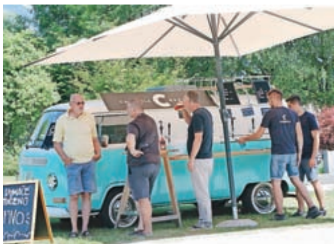
V Radovljici se je ponovno ustavil domači turkizni Volkswagnov kombi, retro lepoteč pivovarne Carniola.