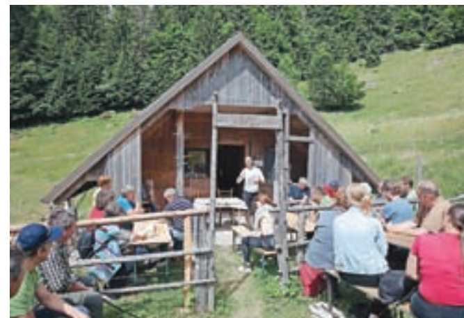
Srečanje gorenjskih agrarnih skupnosti na planini Ilovec – Galetovec

Ob tem je Tilka Klinar pojasnila, da v Avstriji servitutne pravice nikoli niso bile odvzete. »Kljub temu se