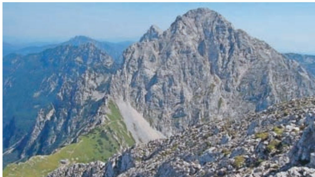
Pogled na Planjavo in Kamniško sedlo z vrha Brane

Nadmorska višina: 2252 m Višinska razlika: 1352 m Trajanje: 6 ur Zahtevnost: ★★★★★