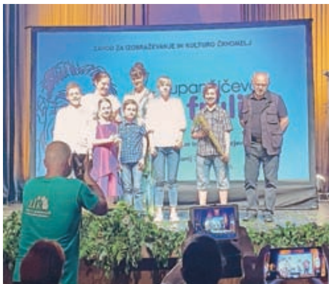
S podelitve v Črnomlju