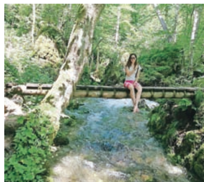
V prijetnem hladu izvira Kamniške Bistrice

Celjskih, prepovedani ljubezni ob Cerkniškem jezuru, hudiču, ki je odnesel gozd, in čudnem možicu na Čatežu. Danes pa z zanimanjem raziskujem