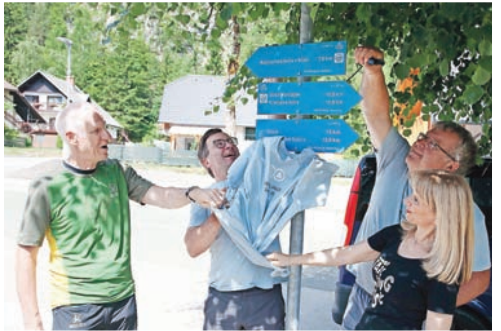
Krožno kolesarsko pot Juliana Bike so odprli predstavniki Občine Kranjska Gora, Planinske zveze Slovenije, Skupnosti Julijske Alpe in Slovenske turistične organizacije.

in direktor Turizma Bohinj, bo Juliana Bike v naslednjih letih dobila nadgradnjo. »Že prihodnje leto in v letu 2023 pripravljamo sekundarno in terciarno omrežje. Sekundarno bo povezovalo destinacije med seboj, terciarno bo potekalo po destinacijah. Tako bomo dobili dobro razvejano in urejeno mrežo kolesarskih poti, ki bodo zadovoljile kolesarje vseh zmogljivosti, znanja in opreme,« je povedal Langus.