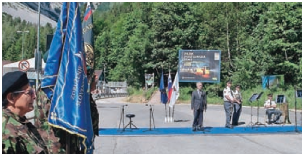
Osrednji govornik je bil minister za notranje zadeve Aleš Hojs.

Podljubelj – Osrednji govornik na prireditvi notranji minister Aleš Hojs je povedal, da je danes to čudovit prostor, ki ga mnogi v naši samostojnosti obiskujejo zato, da se povzpnejo na lepe slovenske vršace, a da je prav ta prostor v zgodovini prestal že mnogo, premnogo. Kot je dejal, so se najpomembnejši kamenčki v mozaiku, ki so danes združeni v celoto, »zgodili v času slovenske pomladi, v času naše odločitve za samostojnost in predvsem takrat, ko smo fizično ubranili to našo odločitev.« Mejni prehodi, kot je Ljubelj, so bili ključni za obrambo naše domovine. »Ko so z oklepniki agresorji želeli zasesti ta mejni prehod, so naleteli na barikade, ki so jih postavili ne zgolj teritorialci, postavili so jih tudi civilisti, pogumni domačini in vsi ti, ki so takrat vedeli, da bomo le skupaj zmogli odpor proti agresorju ... Ko so na mejnih prehodih menjali table SFRJ s tablam Slovenija, smo vedeli, da smo blizu zmage. Takrat smo vedeli, da se