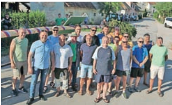
Ob jubileju so župana občani prijetno presenetili tudi z velikim mlajem.

Na predvečer rojstnega dne je župana razveselila in prijetno presenetila prav posebna barvita povorka, sestavljena iz vozil občinskih prostovoljnih gasilskih društev pa tudi predstavnikov številnih ostalih društev. Povorka se je ob taktih domačega Pihalnega orkestra ponosno vila vse od