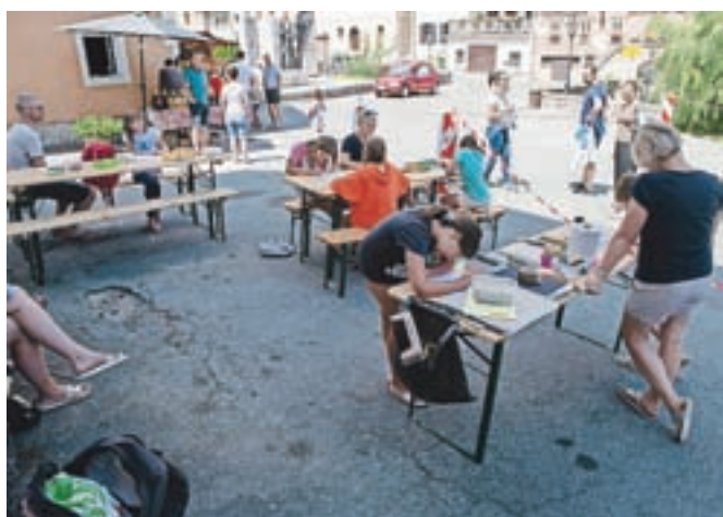
Vrata svojih hiš so odprli tudi prebivalci »gosposke gase« in prikazali kovanje, šivanje, tiskanje, izdelovanje mozaikov. Na delavnici so otroci lahko izdelovali različne izdelke.

Kroke poznam le v grobem, vem, da se je tu kovalo. Sem pa opazila, da se je kraj v petih desetletjih precej spremenil. Danes je mnogo bolj urejen in si resnično zasluži naziv muzej na prostem,« je povedala in dodala: »Kovanje je bilo v mojem otroštvu nekaj običajnega, danes pa ga zasleđiš le ob takih priložnostih, kot je Kovaški šmaren.«