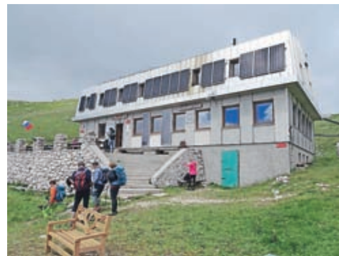
Koča na Kamniškem sedlu

Vrh, na katerem stoji križ iz leta 1995, nam nudi tisto, zaradi česar je tako lepo priti na višino in se ozreti