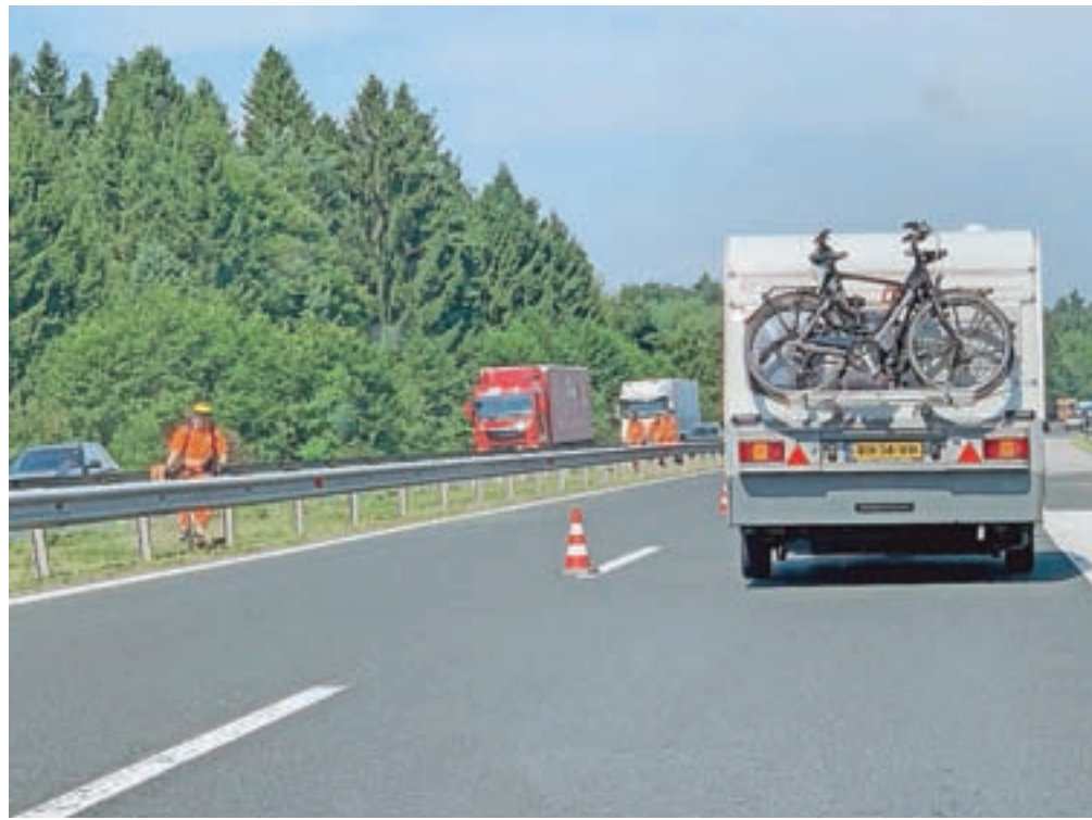
Prtljaga naj bo v vozilo zložena pravilno in varno pritrjena, zagotovite pa si tudi dobro preglednost skozi vsa okna in ogledala.

ti cestnega prometa se lahko v tem obdobju namreč občutno poslabša. V izogib temu bo policija v tem obdobju izvajala določene aktivnosti za odpravljanje zastojev. Sodelovali bodo z vzdrževalci cest, ki so pristojni za postavitev ustrezne prometne signalizacije. Policisti bodo prisotni na mestih, kjer bo prihajalo do zastojev, in bodo