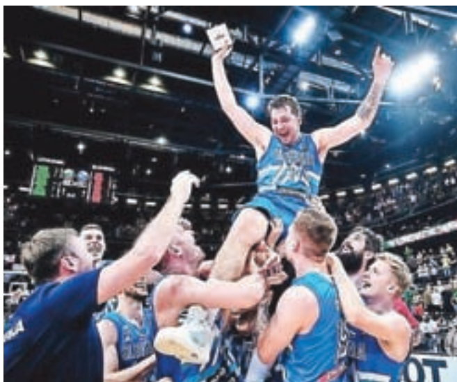
Slovenski košarkarji so se po zmagi nad Litvo veselili prve uvrstitve na olimpijske igre. Luka Dončić (na ramenih soigralcev), ki ima slovenski dom v Smledniku, je bil izbran za najboljšega igralca turnirja.