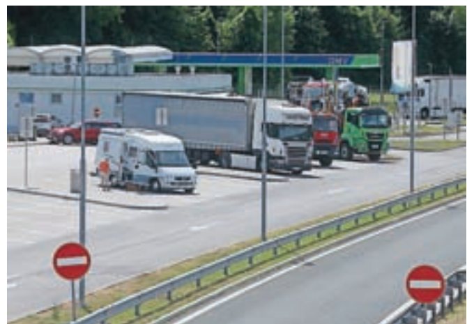
Avtocestna postajališča so za tatove znova zanimiva, zato policisti opozarjajo na previdnost.

»Gotovine, kartic in dokumentov ne hranite na istem mestu, ampak jih imejte skrite v različnih delih vozila. S seboj ne nosite večjih zneskov gotovine. Ko spite v avtomobilih, vredne stvari imejte blizu sebe, vozila pa dosledno zaklepajte. Storilci delujejo tudi ponoči, ko ljudje v avtomobilih spijo, čez dan pa bodisi izkoriščajo odsotnost lastnikov zaradi opravkov in rekreacije ali pa jih s spraševanjem o stvarih zavajajo, da drugi storilec lahko pregleda vozilo in odnese vredne stvari,« opozarjajo policisti.