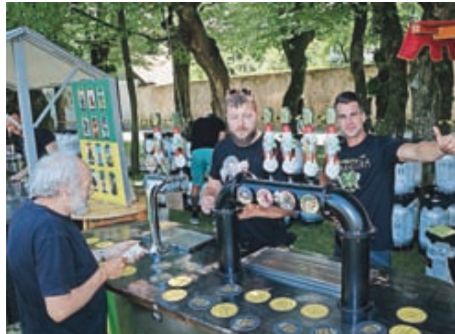
Okusi piva Radovljica: pivovarna Green Gold iz Šempetra v Savinjski dolini