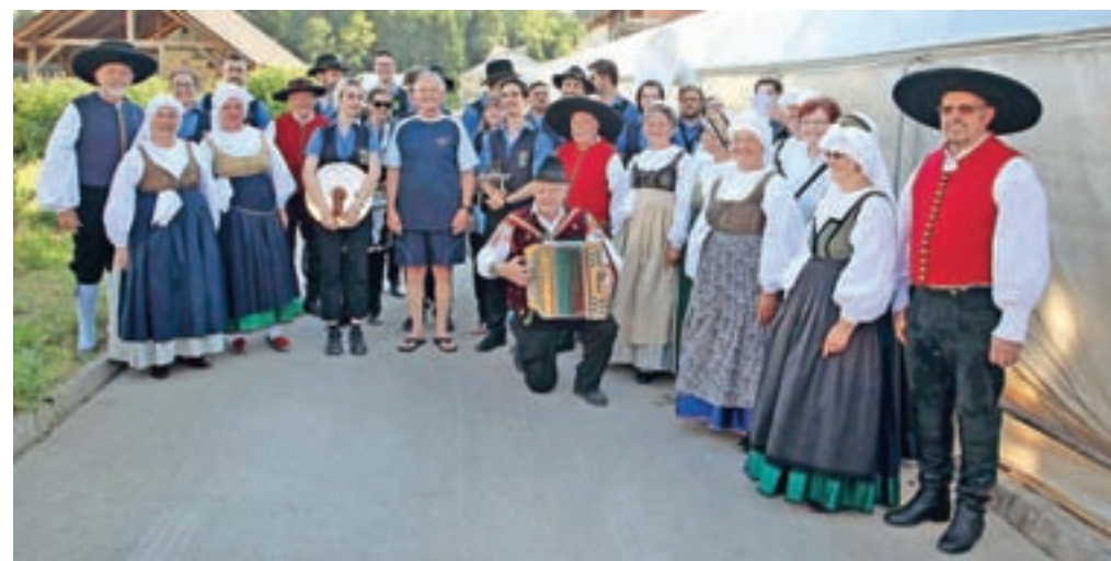
Slavljenec v družbi folklornikov ter članic in članov domačega pihalnega orkestra

občanom, prijateljem, družini ter vsem ljudem dobre volje iskreno zahvalil za lepe želje, voščila in darove, ob tem pa obljubil, da bo ostal aktiven še naprej, tako v svojem poklicu kot tudi v trenutkih prostega časa.