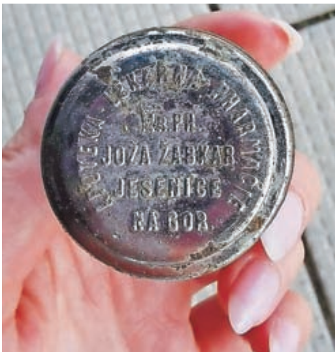
Pokrovček z napisom

Na najdbo se je odzval tudi upokojeni jeseniški muzejski dokumentalist Tone Kobilj, ki je zapisal, da je bil Jože Žabkar znani jeseniški