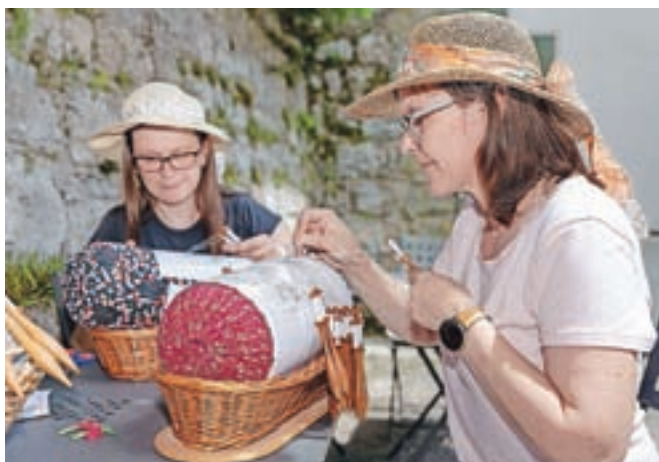
Klekljarice so na več lokacijah na prostem prikazovale umetnost sukanja belih niti.