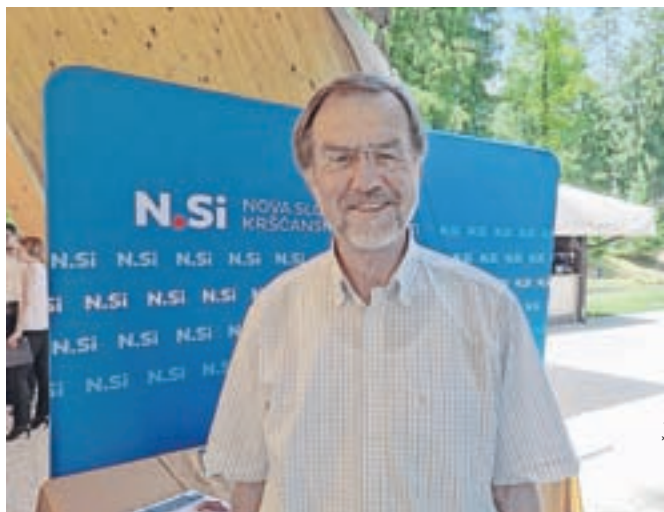
Lojze Peterle, predsednik osamosvojitvene vlade

»Nimam se za zelo pogumnega človeka, sem pa tak, da grem za tistim, kar sem spoz-