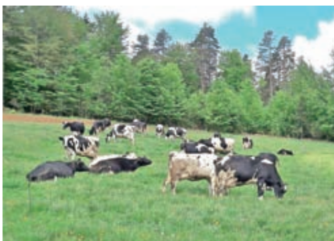
Povečanje cen vhodnih surovin občutijo tudi rejci goved.

prašičev in goved in zaradi slabe letine tudi sadjarji, nižje kot lani so tudi odkupne cene mleka. »Ob vsem tem je najbolj žalostno, da se cena hrane v maloprodaji zvišuje. To pomeni, da preostali deležniki v prehranski verigi, to je odkupovalci, predelovalna industrija in trgovci, stroške vračunajo v končno ceno, medtem ko kmetije te možnosti nimajo,« ugotavljajo v zbornici in opozarjajo na nesprejemljivo prakso, da se križa v prehranski verigi spet rešuje na plečih kmetov in