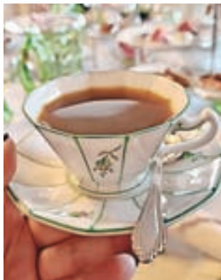
Kava iz posebnega porcelana pripomore k posebnemu vzdušju.

Na gradu Strmol (Cerklje na Gorenjskem) so se tokrat odločili, da nas povabijo na druženje ob pitju kave. Dogodek je bil sicer zasnovan po principu čajanke, povabljenih je bilo razmeram primerno nekoliko manj, a glavno besedo je tokrat poleg klepetavih dam in simpatičnih prigrizkov