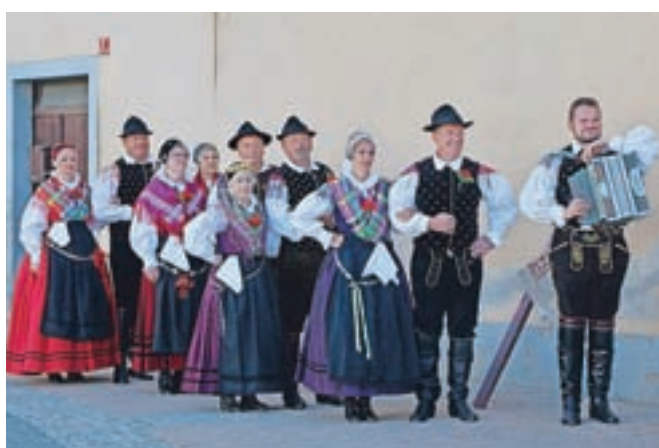
Seniorji Folklornega društva Preddvor