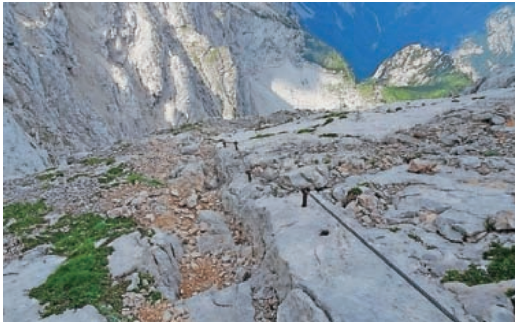
Kopinškova pot je izpostavljena, zračna in izjemno lepo speljana.

s slapom Rinka, Okrešljem, Mrzlo goro, Rinkami, Skuto, Grintovcem, pred nami pa greben proti Planjavi, na severu je Krofička, na vzhodu Raduha, Olševa, Uršlja gora, Peca. Z vrha sestopimo proti zahodu, v smeri Korošice. Ko dosežemo razpotje, zavijemo desno proti sedlu Škarje. Sledi delček poti, ki je zavarovan, nato pa se malce povzpne do