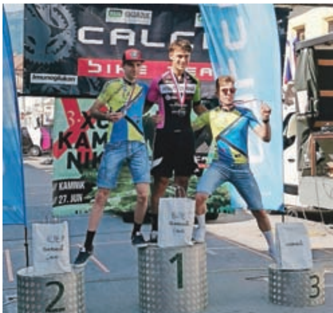
Najboljši trije v moški konkurenci elite

Naslov državne prvakinje med gorskimi kolesarkami v olimpijskem krosu je med članicami osvojila Tanja Žakelj (Unior-Sinter). V cilju je imela dve minuti in 41 sekund naskoka pred Uršo Pintarič (Pintatim). Maruši Knap (Calcit Bike Team) je pripadel naslov v