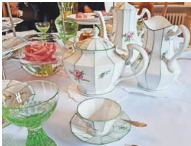
Ličen grajski porcelan