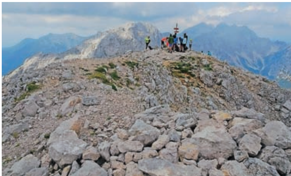
Vrh Ojstrice je priljubljen gorniški cilj.

Z vrha se odpre čudovit razgled po celotni verigi Kamniško-Savinjskih Alp; pod nami je Logarska dolina