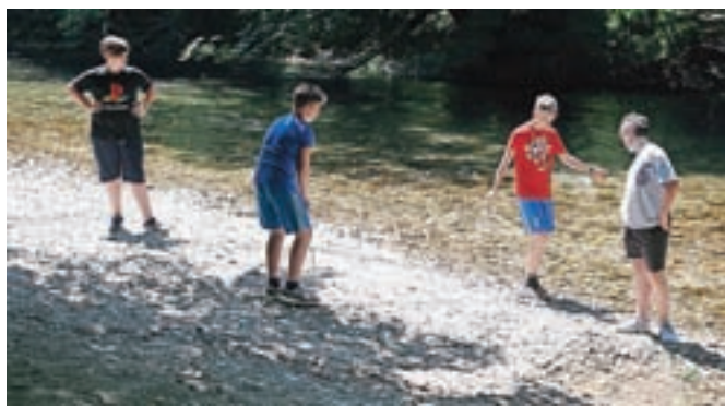
Učenci OŠ Staneta Žagarja iz Kranja so raziskovali odpadke v kanjonu Kokre.