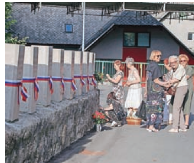
V Mostah pri Žirovnici vsako leto pripravijo slovesnost v spomin na ustreljene talce.