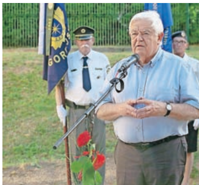
Slavnostni govornik ob odkritju spomenika v škofjeloški vojašnici je bil Milan Kučan.