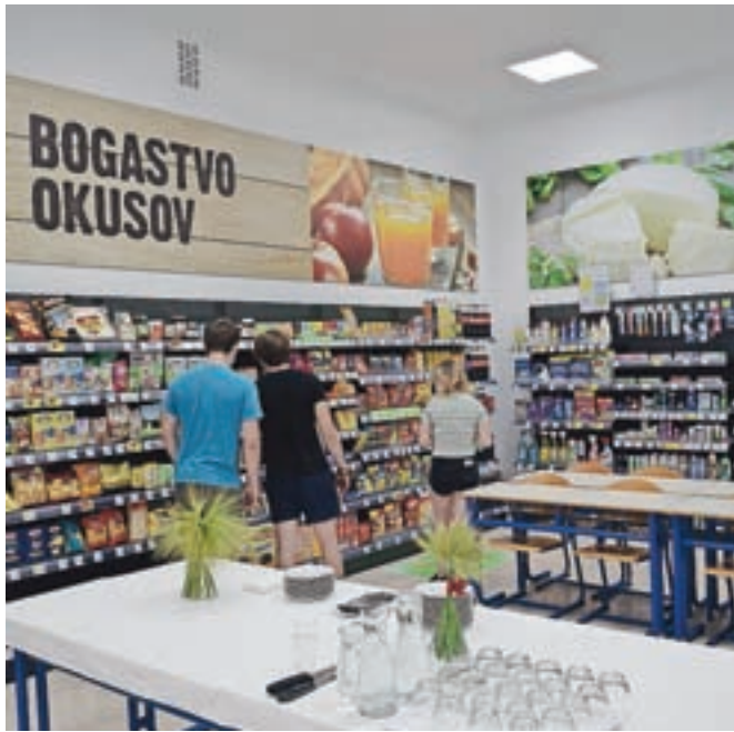
Na Srednji ekonomski, storitveni in gradbeni šoli so bogatejši za novo učno prodajalno.