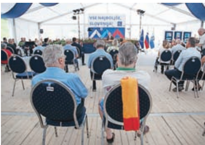
Uporaba maske ostaja obvezna na odprtih javnih krajih, če ni mogoče zagotoviti medosebne razdalje najmanj 1,5 metra.

Ljubljana – Minister za zdravje Janez Poklukar je povedal, da so začeli testno uvajanje enotnega in za državljane brezplačnega evropskega (digitalnega) covidnega potrdila, ki bo v polni meri zaživelo ta teden. To potrdilo ni potovalni dokument, bo pa od 1. julija olajšalo gibanje med članicami EU. Potrdilo vključuje tudi QR-kodo, ki je lahko natisnjena na papir ali v mobilnih napravah, in vsebuje samo potrebne bistvene informacije, kot so ime in priimek, datum rojstva, datum izdaje, informacije o PCT in edinstveno oznako.