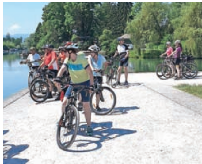
Na Špici, kjer se Ljubljanska razcepi na dva dela

omogočala »pogovorno kolesarjenje«. Navdušeni smo bili nad razsežnostjo barja, saj s 163 kvadratnimi kilometri predstavlja 0,8 odstotka slovenskega ozemlja. Polja so preprežena s potmi, torej pravi raj za kolesarje.