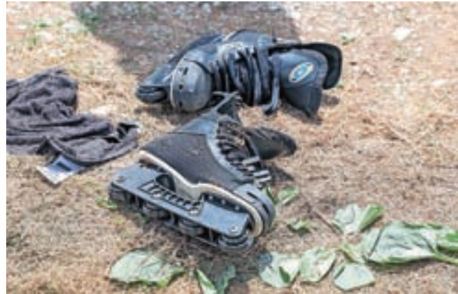
Jih kdo pogreša?