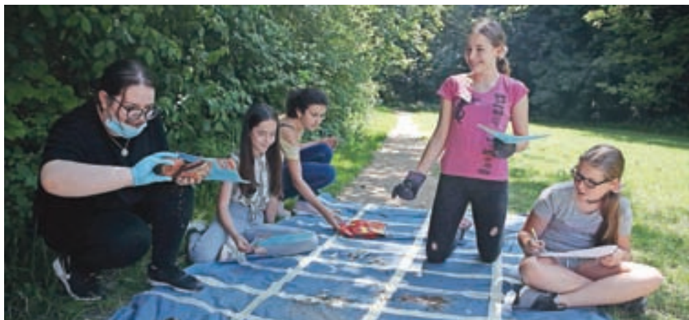
Vse zbrane odpadke so natančno analizirali.

Med njimi so bili tudi učenci OŠ Staneta Žagarja iz Kranja. »V sedmem razredu smo imeli v letošnjem šolskem