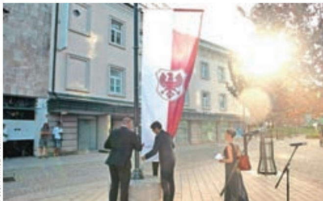
Na kranjski zastavi je po novem tudi občinski grb.