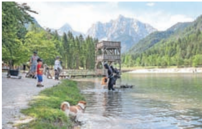
Potop v vodo s temperaturo 11 stopinj Celzija

Matjaž Repnik je sklenil, da so potapljači z akcijo čiščenja prispevali k ohranitvi okolja, obenem pa so navdušeni, da ni bilo veliko smeti, kar kaže, da okoliški obiskovalci resnično znajo skrbeti za čisto okolje. »Naj jezero Jasna ostane čisto,« je še pozval.