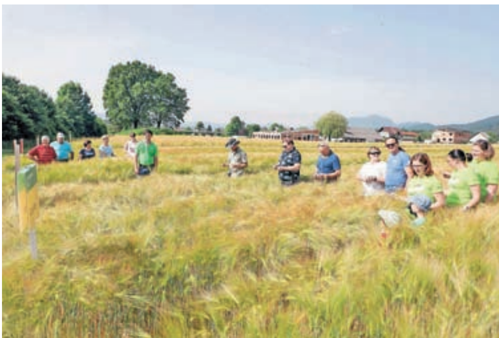
Kmetijsko gozdarski zavod Kranj je prejšnji ponedeljek pripravil na Šifererjevi kmetiji v Zgornjih Bitnjah ogled poskusa s 33 sortami ozimnih žit (18 sort ječmena, 9 sort pšenice in 6 sort tritikale). Udeležencem so predstavili tudi značilnosti letošnjih ravnih razmer za žita in vlogo strniščnih dosevkov v njivskem kolobarju.

Kakšni so bili letos (doslej) pogoji za pridelovanje ozimnih žit? Vznik je bil dober, le pozno sejana žita so dočkala zimo precej majhna, le z enim ali dvema listoma. Konec oktobra je nastopila prva ohladitev, ki je nekoliko upočasnila rast. November je bil hladnejši kot običajno, naslednji trije meseci, predvsem februar, pa toplejši od dolgoletnega povprečja. Konec februarja in v začetku marca so bili ugodni pogoji za prvo dognojevanje. April in maj sta bila v primerjavi s prejšnjimi leti hladna in precej mokra, vendar to razraščanju in razvoju žit ni škodovalo. Posebnost letošnjega pridelovalnega leta je