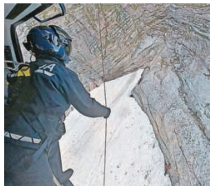
V gorah je še vedno precej snega, kar je tudi minuli konec tedna presenetilo več planincev.

Nekaj reševanj so ekipe Gorske reševalne zveze Slovenije opravile tudi na klasičen način. V nedeljo popoldan se je v ferati nad Bohinjskim jezerom zaplezala planinka. Bohinjski gorski reševalci so jo nepoškodovano s pomočjo vrvene tehnike rešili in pospremili v dolino.