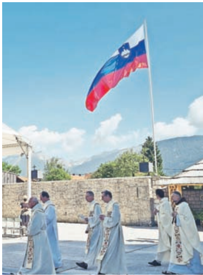
Od daleč vidna zastava Republike Slovenije na vrtu frančiškanskega samostana na Brezjah

Brezjanska »zastava vseh slovenskih zastav« je tudi obogatila 800-letnico frančiškanskega reda, ki so jo bratje Frančiškovega reda