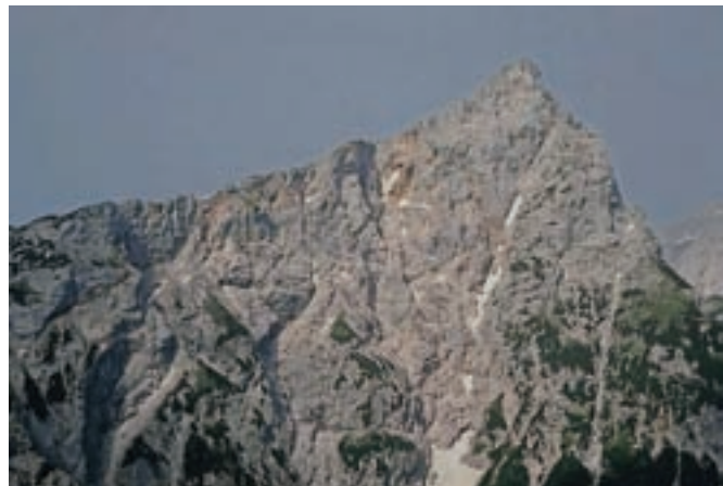
Ojstrica svojo najbolj ošiljeno podobo pokaže, ko smo na Križevniku.

Čez Jezerski vrh prestopimo mejo z Avstrijo, se zapeljemo čez Pavličovo sedlo nazaj v Slovenijo ter zavijemo proti Logarski dolini.