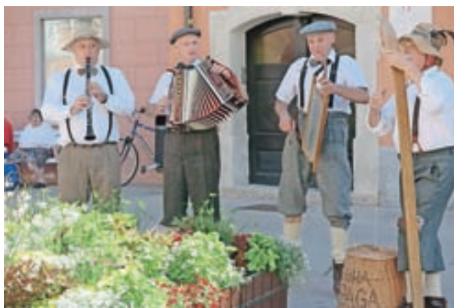
Srečanje je tudi tokrat s poskočno glasbo spremljala glasbena skupina Suha špaga.