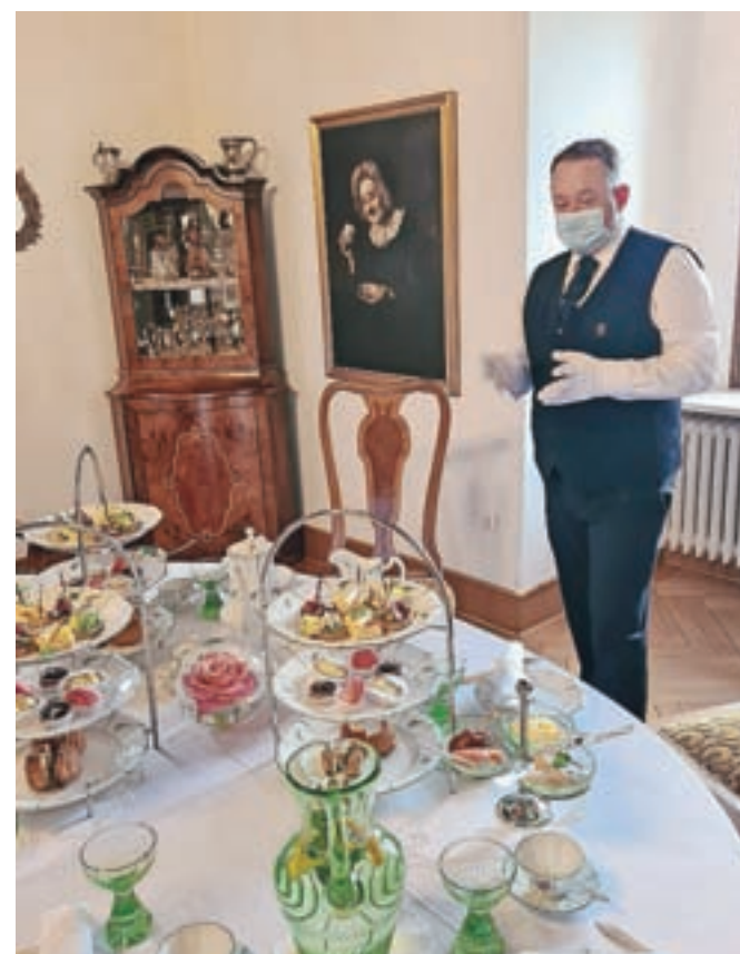
K dobri kavi na gradu Strmol se vedno pričujejo dobri sogovorniki, brez malih prigrizkov pa seveda tudi ne gre.