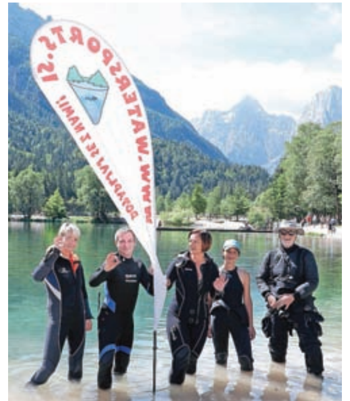
Pred potopom v jezero Jasna, naslednjič, upajmo, še z večjo udeležbo potapljačev.