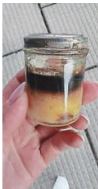
Krema je spodaj rumena, zgoraj črna, ohranila pa je močan vonj po kafri.