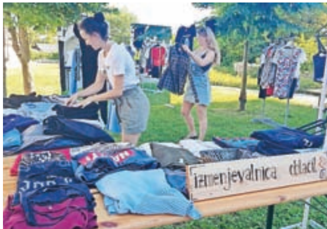
Izmenjevalnica oblačil v sklopu Tedna mladih – hlače za hlače, majica za majico

V Valencii sem odkrila čar trgovin z oblačili iz druge roke. Z vedno novimi pričakovanji sem zakorakala v vintage butike v Ruzafi in se vsako nedeljo zapeljala do ogromnega boljšega trga Rastro, kjer sem izgubljeno tavalala med gorami polomljenih igrač, obrabljenega kuhinjskega pribora, »groovy« oblike iz šestdesetih, skladnicami starih vinilnih plošč in se čudila vsem, kar so ljudje privlekli na plano. Zdi se, da za Špance vse nošeno ne pomeni ponošeno, ponošeno pa izžareva dušo in svojevrstnost, ki je pojmovana kot edinstven modni stil. Čudila sem se odločnosti, s katero so predstavljali svoj imidž, zagovarjali želje in uveljavljali lastni stil, ki je skozi sijajno zunanjo podobo postavil smernice novi