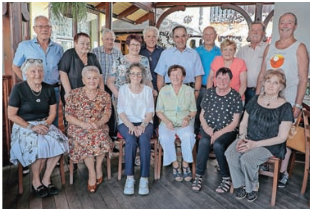
Minilo je šestdeset let, odkar so nekdanji sošolci in sošolke tedanje OŠ Lucijan Seljak, danes OŠ Stražišče Kranj, zapustili osnovnošolske klopi.