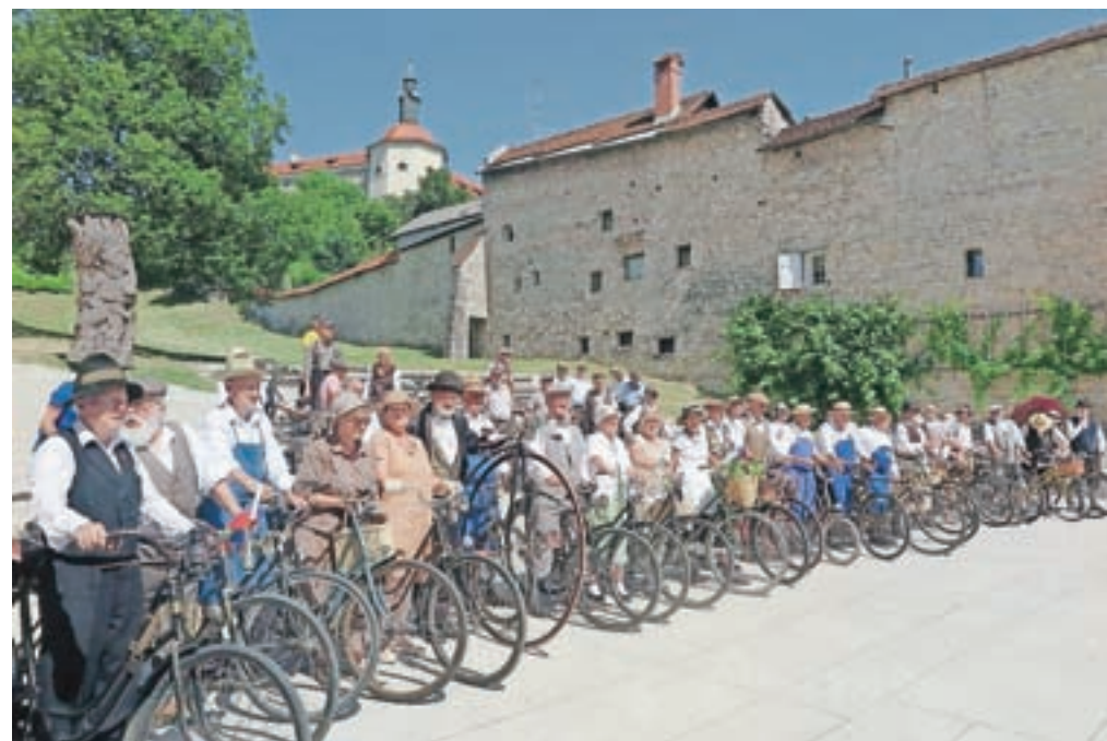
Spomin na 14. srečanje starodobnih kolesarjev bo ostal tudi zaradi skupinskega fotografiranja pod Loškim gradom.