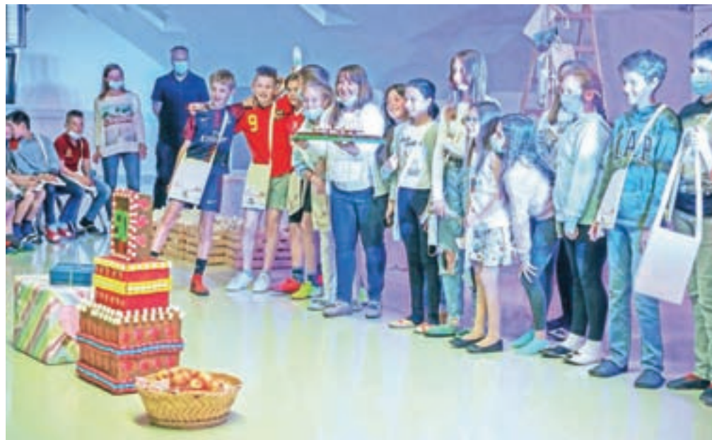
Prireditve ob 50-letnici Osnovne šole Josipa Vandota Kranjska Gora so pripravili v treh skopih, kjer so se predstavili učenci vseh treh triad.