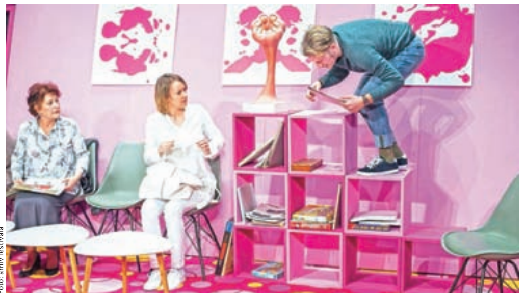
Festival bo odprla komedija Resno moteni v izvedbi Šentjakobskega gledališča iz Ljubljane.

Tu je še besedilo, ki je nastalo v času epidemije. V predstavi K(o)ronske zdrave, Slovenskega stalnega