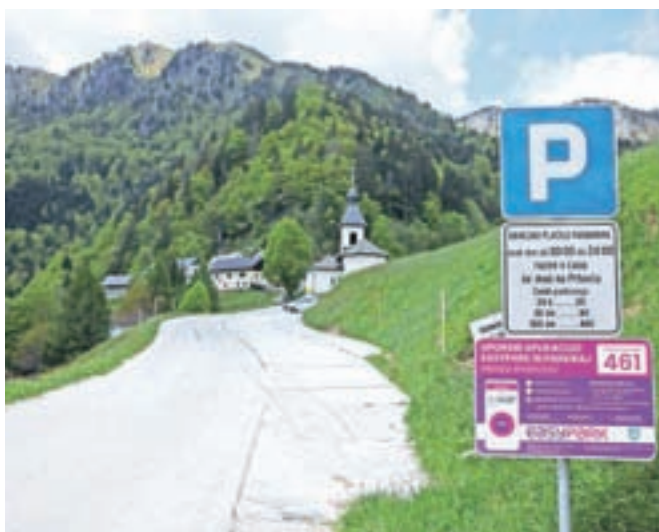
»Večina planincev je tako plačljivo parkiranje kot način plačila na Prtovču dobro sprejela, tako da posebnih težav ni,« pravijo na Občini Železniki. / Foto: Gorazd Kavčič

Po mnenju našega bralca je tak način pobiranja parkirnine diskriminatoren, saj ni vsem enako dostopen. »Dnevna parkirna stane dva evra in rade volje bi plačal še kak evro več, a če nimaš pametnega telefona in