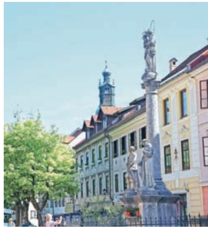
Z državnim sofinanciranjem bodo obnovili tudi Marijino znamenje na Mestnem trgu

14. stoletja kot masivna enoločna kamnita konstrukcija. Čez reko sloni na dveh kamnitih bregovih selške Sore, na sredi pa stoji kopija kipa Janeza Nepomuka na dvignjenem podstavku. V prvi polovici leta 2020 je bil izveden pilotni primer konservatorsko-restavratskih del, hkrati pa je bil izdelan zelo natančen popis potrebnih del z oceno stroškov. Projekt vključuje celovito obnovo po posameznih sklopih. Oba pomembna zgodovinska objekta so se odločili obnoviti, da bo okolica lepša tako v prid kakovosti življenja Ločank in Ločanov kot ugodnega prvega vtisa obiskovalcev in turistov. V dveh letih, ko bo potekala obnova, v Škofji Loki zaznamujejo posebne dogodke: letos mineva tristo let od zapisa najstarejšega ohranjenega dramskega besedila v slovenskem jeziku Škofjeloškega pasijona, ene največjih dragocenosti Škofje Loke