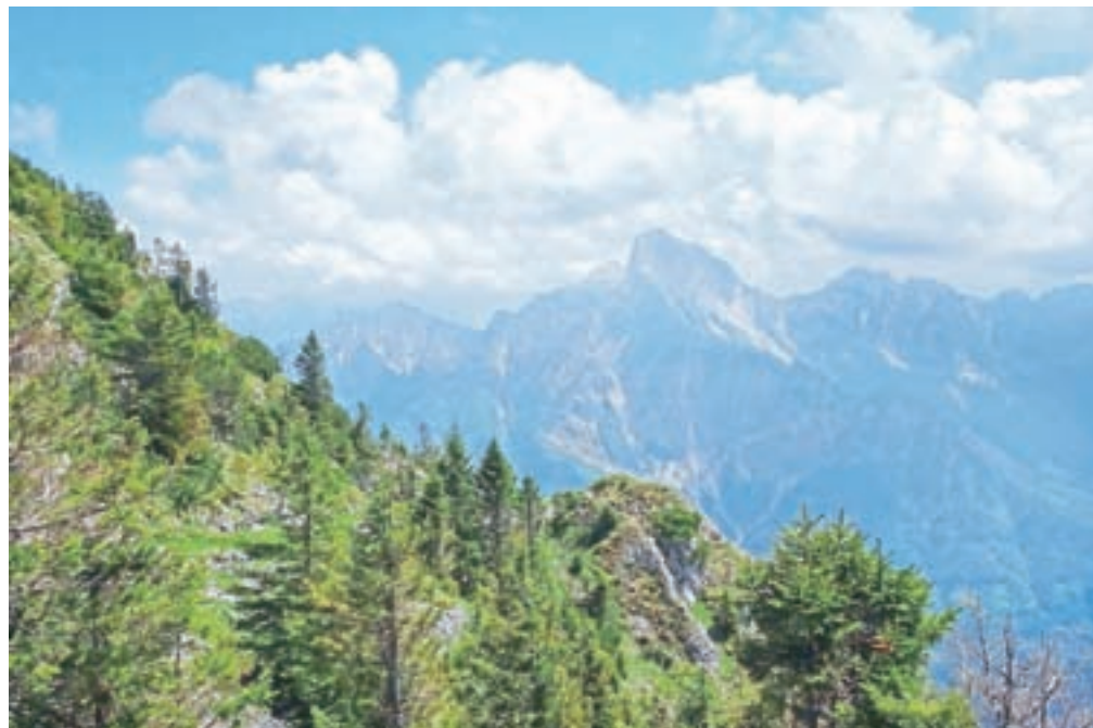
Z vojaške mulatjere se odpre lep pogled na Monte Sernio.