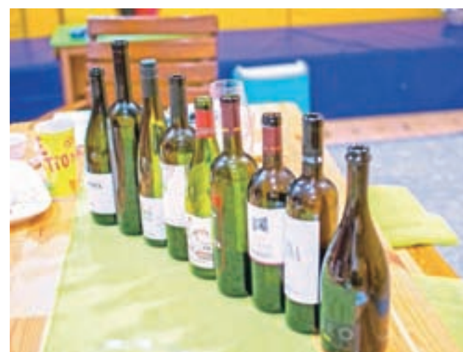
Osem slovenskih vin in šampanjec za pompozni začetek večera

vino kot pri nas odšteli vsaj petdeset evrov več?