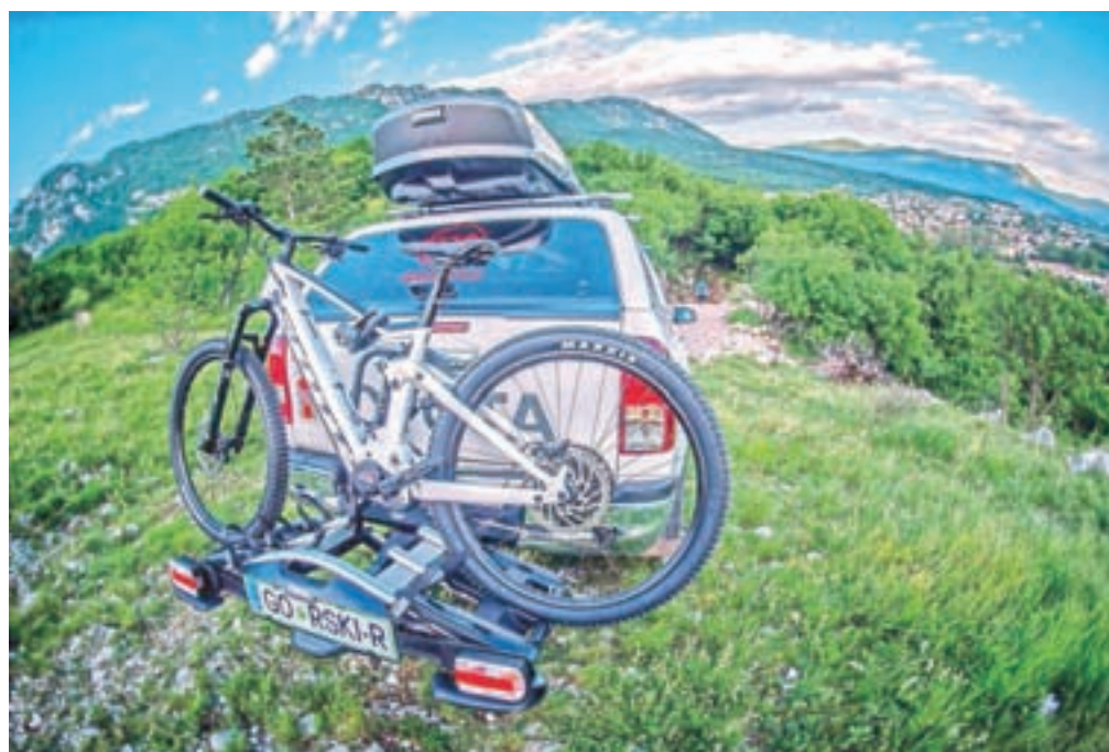
Gorski reševalci – najprej ajdovski – bodo odslej do ponesrečencev na težko dostopnih terenih dostopali tudi s pomočjo električnih gorskih koles.

Predstavili so tudi letošnjo novost, ki bo skrajšala odzivni čas gorskih reševalcev pri klasičnem reševanju. V Ajdovščini so namreč zasnovali prvo reševalno ekipo gorskih reševalcev