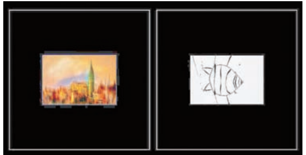
Dve izmed miniatur z razstave fotografij Simona Krejana

Krejan je za razstavo pripravil 46 fotografij in jih