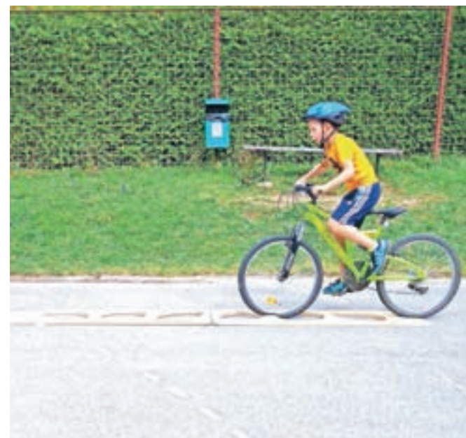
Program Varno na kolesu je v letošnjem šolskem letu že devetič zapored mlade spodbujal k varni in aktivni vključitvi v promet.