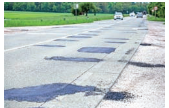
Pokrpana cesta na območju vasi Meja na cesti Jeprca-Kranj. Izvedena so bila le nujna popravila, celotna prenova vozišča je predvidena še letos.

Meja – V sklopu vzdrževalnih del so bila pred kratkim na regionalni cesti od Jeprce proti Laboram, na območju vasi Meja, izvedena popravila vozišča. Kot so pojasnili na Direkciji RS za infrastrukturo, je šlo le za nujna popravila, celovita prenova 4,5 kilometra dolgega odseka vozišča pa je predvidena še letos, če ne bo zapletov pri javnem naročilu. Ocenjena vrednost celotne prenove je 2,7 milijona evrov.