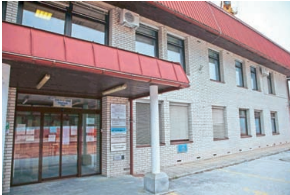
V času epidemije so se obremenitve zaposlenih v ambulanti Arcus Medici še povečale, kar je vplivalo tudi na dostopnost do zdravnikov.

Tako kot številna druga področja pa je tudi delo v njihovi ambulanti lani zaznamovala epidemija covid-19. »Med drugim pacienti ne morejo več priti neposredno v ambulanto, kjer smo lahko takoj rešili veliko težav, ampak se morajo predhodno naročiti. Verjamem, da zlasti starejši tega niso vajeni, a tega si nismo izmislili mi, ampak so taka navodila ministrstva za