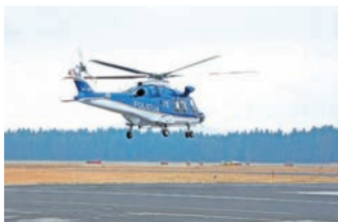
Dežurna ekipa za reševanje v gorah, v kateri je minuli konec tedna sodelovala posadka policijskega helikopterja, je v prvih dneh opravila kar štiri helikopterska reševanja.

V soboto so helikopterska reševanja potekala na Sovatni nad Vratu, na območju Otlice nad Ajdovščino in na Rušnem vrhu. Na Sovatni je planinka zdrsnila pri sestopu in si lažje poškodovala nogo. Na območju Otlice si je planinka nogo poškodovala pri padcu, na Rušnem vrhu pa se je planinka