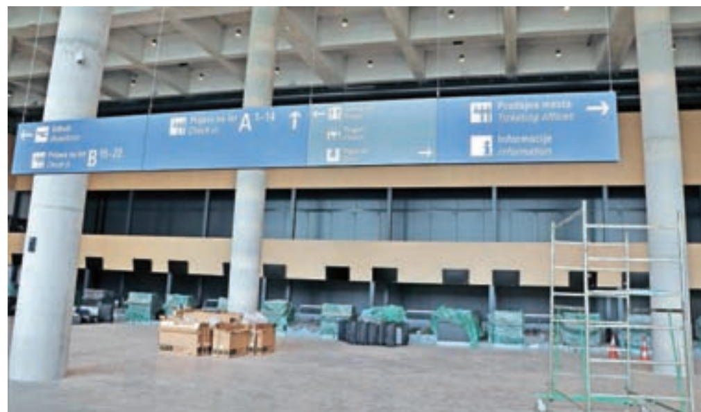
Prva večja usmerjevalna tabla, ki pozdravi potnika ob vstopu v odhodno avlo.