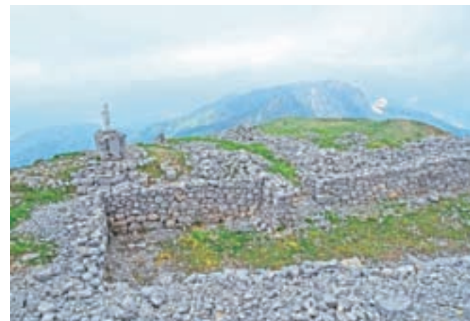
Na vrhu gore Monte Tersadia so ostaline iz časov prve svetovne vojne in kip Marije. Simbolno.

Od zavetišča dalje se mulatjera strmo vzpenja in mestoma so odlično vidni ostanki gradnje poti iz časa prve svetovne vojne. Monte Tersadia je bila namreč v času prve svetovne vojne obrambna linija tirolske fronte, saj je zaradi svoje sredinske lege omogočala pregled nad vsemi dolinami. Mulatjera nas pripelje na sedlo Tersadia, na drugi strani spodaj zagledamo planino Valmedan Alta. S sedla zavijemo levo in se po travnatem pobočju, po katerem tudi vodi mulatjera, povzpemo vse