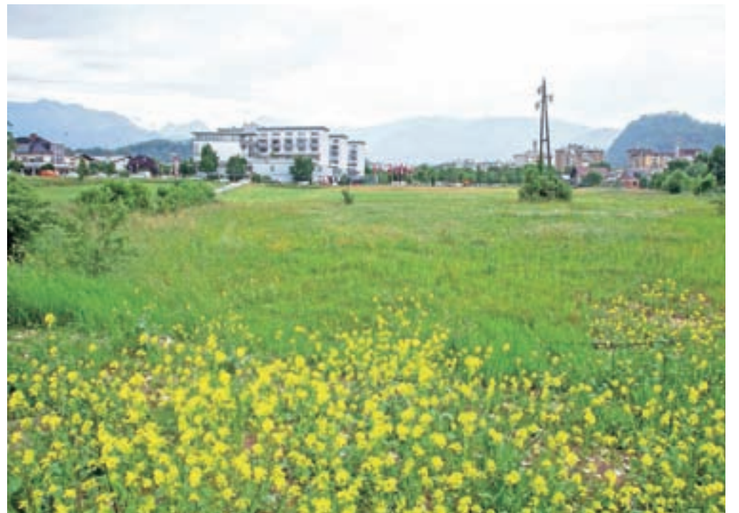
► 8. stran Zelenica med tovarno Titan in Mercator centrom bo kmalu pozidana.

»Vemo, da je promet na tem območju že sedaj zelo povečan, zato smo v okviru občinske uprave že pristopili k ukrepanju. Dolgoročne strategije na področju prometa občina žal nima, idealna bi bila zahodna obvoznica, ki pa je v prostor ne moremo umestiti,« nam je povedal župan Matej Slapar.