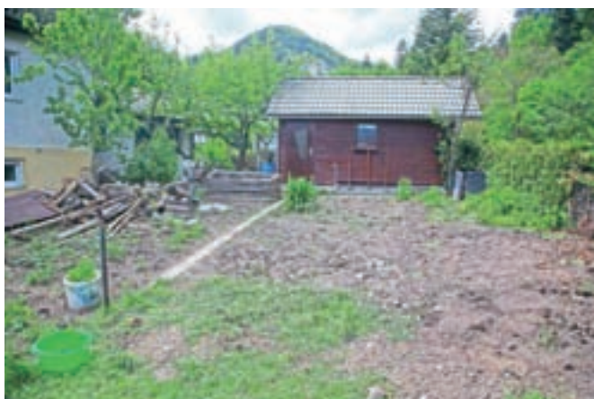
Po sodni odločbi ... zemljišče zravnano. Rastlinjak, gugalnica, kamin, klopce podrti ležijo na kupu (levo) ...