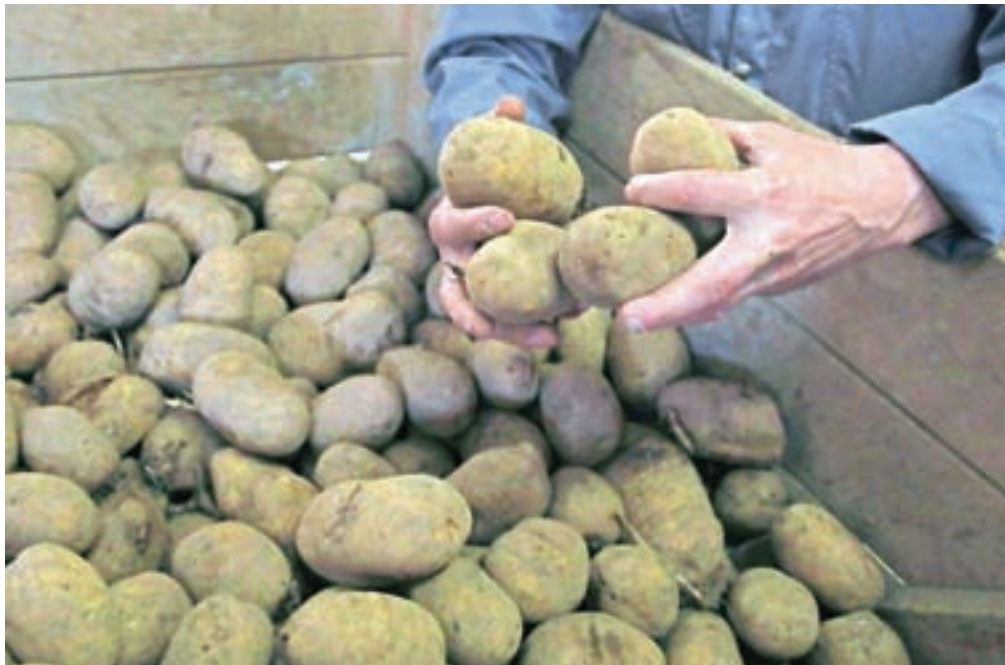
Do finančnega nadomestila za izpad dohodka so upravičeni tudi pridelovalci jedilnega krompirja.

Kranj – Kot ugotavljajo na ministrstvu za kmetijstvo, gozdarstvo in prehrano, so na kmetijskih gospodarstvih, ki se ukvarjajo s prirajo govejega mesa, močno občutili posledice drugega vala epidemije covid-19. Koeficient ekonomičnosti reje se je znižal na približno 90 odstotkov, odkupne cene mlajših bikov so se v obdobju od oktobra 2020 do marca 2021 v primerjavi z najvišjimi cenami v letih 2017–2019 znižale za 17,5 odstotka, neto dodana vrednost na žival pa se je v obdobju od oktobra 2020 do marca 2021 v primerjavi z leti 2017, 2018 in 2019 znižala s 193,50 na 117,62 evra. Vlada je zato sprejela odlok,