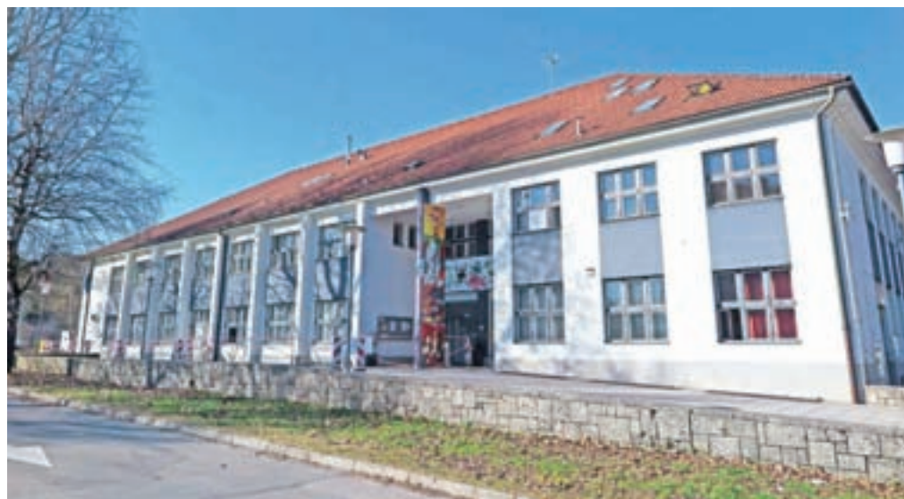
Dom kulture Kamnik bo od 1. julija dalje del Zavoda za kulturo.