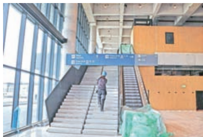
Iz dneva v dan novi terminal dobiva lepši izgled.

Gre za investicijo, ki je bila resnično potrebna. »Terminala ne potrebujemo le zato, ker smo imeli prostorsko