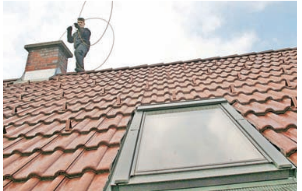
Spori med dimnikarji še kar trajajo. Fotografija je simbolična.

Obe strani sta vse od razhoda v sporu in borbi za stranke. Družba Dovrtel sistemi naj bi po besedah