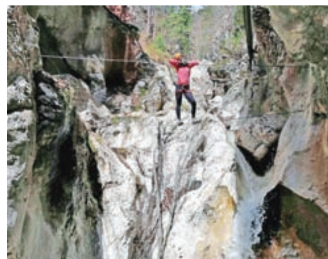
Eden izmed treh visečih mostov nad sotesko

Jerman (D/E) – strah in trepet vsem meni podobnim začetnikom.