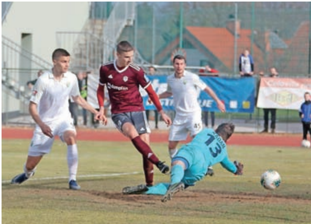
Z uvrstitvijo v skupino za prvaka je glavni cilj triglavanov izpolnjen, a priložnosti za zmage bodo iskali tudi na zadnjih šestih tekmah.

Orle do konca tekmovanja čaka še šest tekem v skupini za prvaka, prva bo v soboto proti prvi ekipi rednega dela Radomljam, nato pa bodo že v sredo gostovali pri Rudarju v Velenju. A kot pravi trener Kranjčanov Boštjan Miklič, ki je vodenje kluba prevzel januarja, se je ekipa po uvrstitvi v skupino za prvaka otresla bremena in v zaključni del tekmovanja vstopa sproščeno. »V vsaki