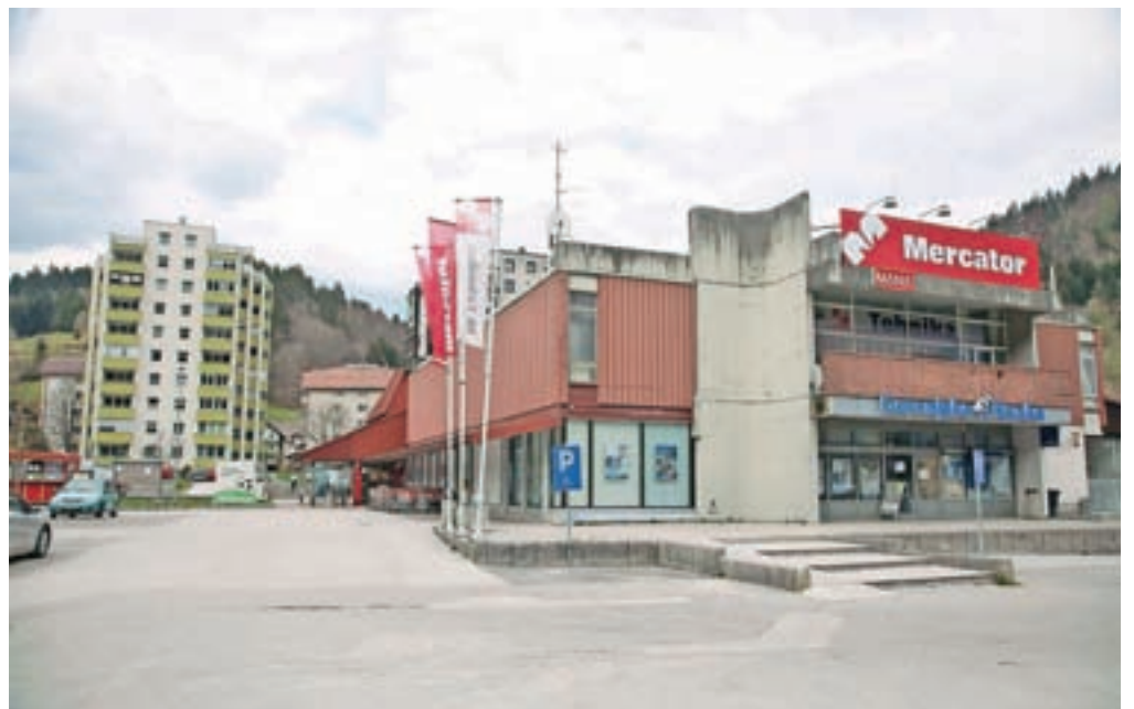
Mercator je trgovski objekt v Železnikih zgradil pred 44 leti. Sedaj ima v pripravi idejno zasnovo za novega, občina pa bi ob njem gradila garažno hišo.

da bi na tem območju zgradili nov Mercatorjev trgovski objekt, občina pa bi zgradila garažno hišo. V izdelavi je idejna zasnova, ki bo podlaga za nadaljnja usklajevanja z občino,« so povedali. Mercator je objekt Na Kresu zgradil leta 1977. Ima 2800 kvadratnih metrov skupne uporabne površine, od tega je za Mercatorjevo dejavnost namenjenih 1926 kvadratnih metrov, za najem 570, približno 300 kvadratnih metrov pa je še skupnih površin.