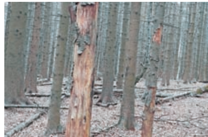
Pri varstvenih delih v gozdovih se bodo osredotočili na posek in spravilo lubadark.

mehanic in opreme za sečnjo in spravilo lesa ter za ureditev gozdne infrastrukture bodo vlagateljem vlog pripravili potrebne podatke in dokumentacijo.