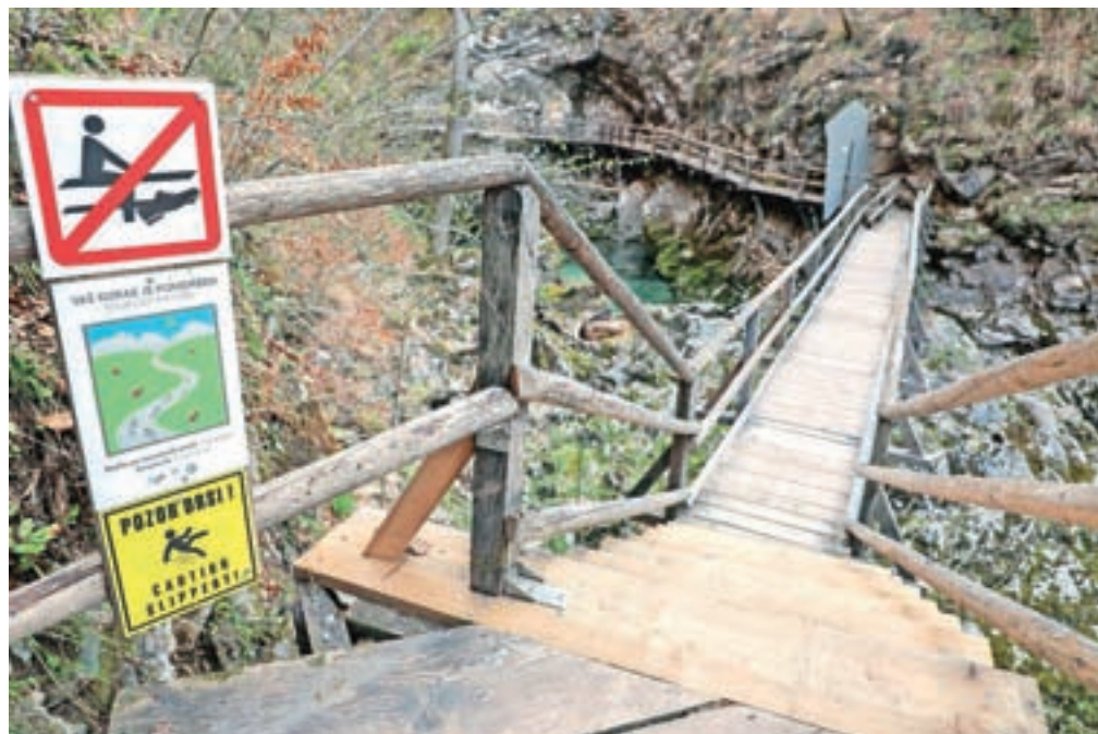
Soteska Vintgar se ponaša tudi z zanimivim in bogatim rastjem in rastlinstvom.

Bregant ne dvomi, da bo omenjeni popis podlaga in iztočnica za nadaljnje znanstvene raziskave. Obenem pa verjame, da bo knjižica zanimiva tudi naključnim bralcem, ki se zavedajo pomembnosti narave in ohranjanja habitatov.