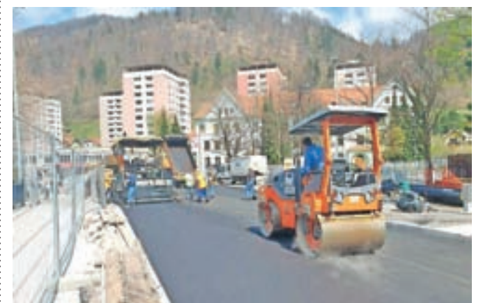
Cesto so že asfaltirali, odprli naj bi jo sedmega maja.

Jesenice – Na Jesenicah se zaključuje rekonstrukcija nadvoza nad železniško progo pri TVD Partizan Jesenice. Kot so sporočili z Občine Jesenice, naj bi cesto predvidoma odprli 7. maja. Glavna cesta skozi Jesenice je bila zaradi obnove nadvoza zaprta od novembra lani, odprtje je bilo sprva načrtovano konec maja, a je izvajalcu investicijo uspelo zaključiti že nekaj tednov pred rokom. Gre za državni projekt, investitor je Direkcija RS za infrastrukturo.