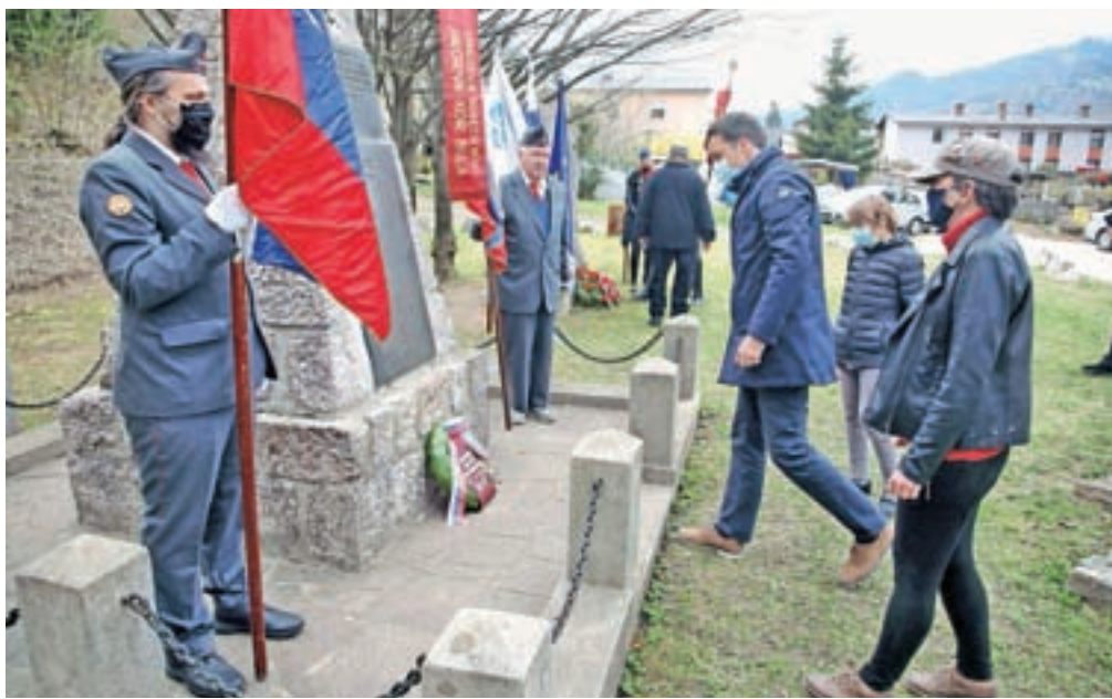
Pred dnevom upora proti okupatorju so se pri spomenikih NOB poklonili tudi v občini Jesenice.

Predsedstvo borčevske organizacije je ob prazniku