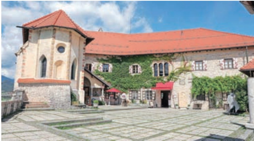
Za vse, ki ne marajo gneče, je zdaj pravi čas za obisk Blejskega gradu, svetujejo blejski študenti.