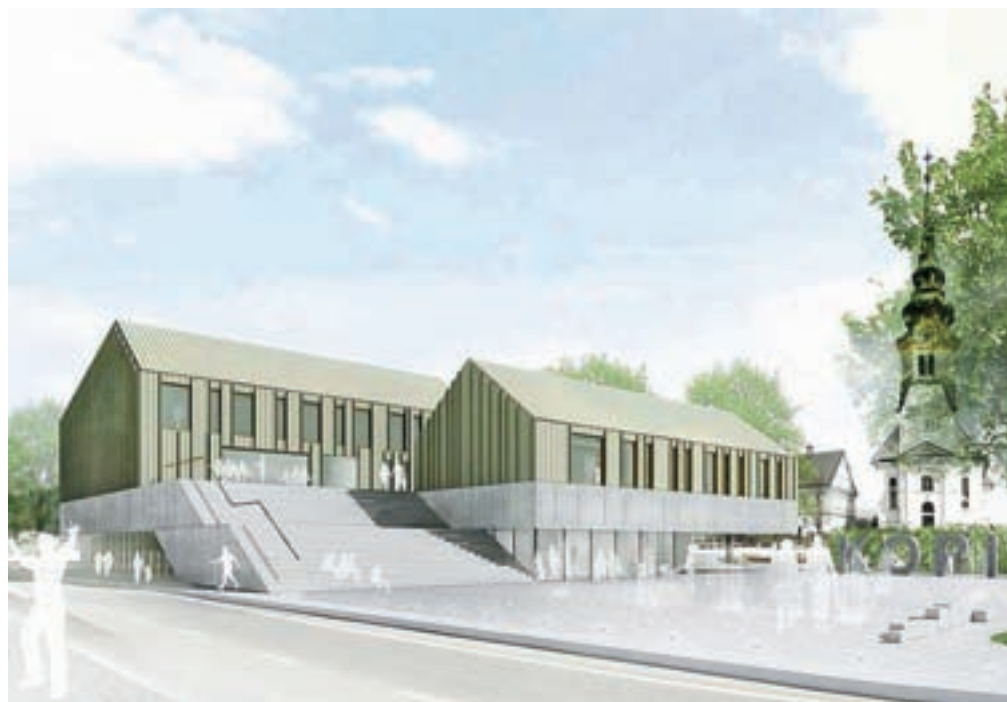
Takole bo videti novi Kopitarjev center