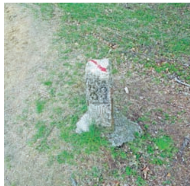
Mejni kamen rapalske meje. V spomin in opomin na pogodbo, ki je razdelila Slovence.

Z vrha sestopimo po markirani poti. Tam, kjer smo prej ponovno dosegli markirano pot, gremo kar naravnost. Markirana pot se ponekod precej strmo spušča. Ko dosežemo širši kolovoz, zavijemo desno in kolovoz nas pripelje na asfaltno cesto,