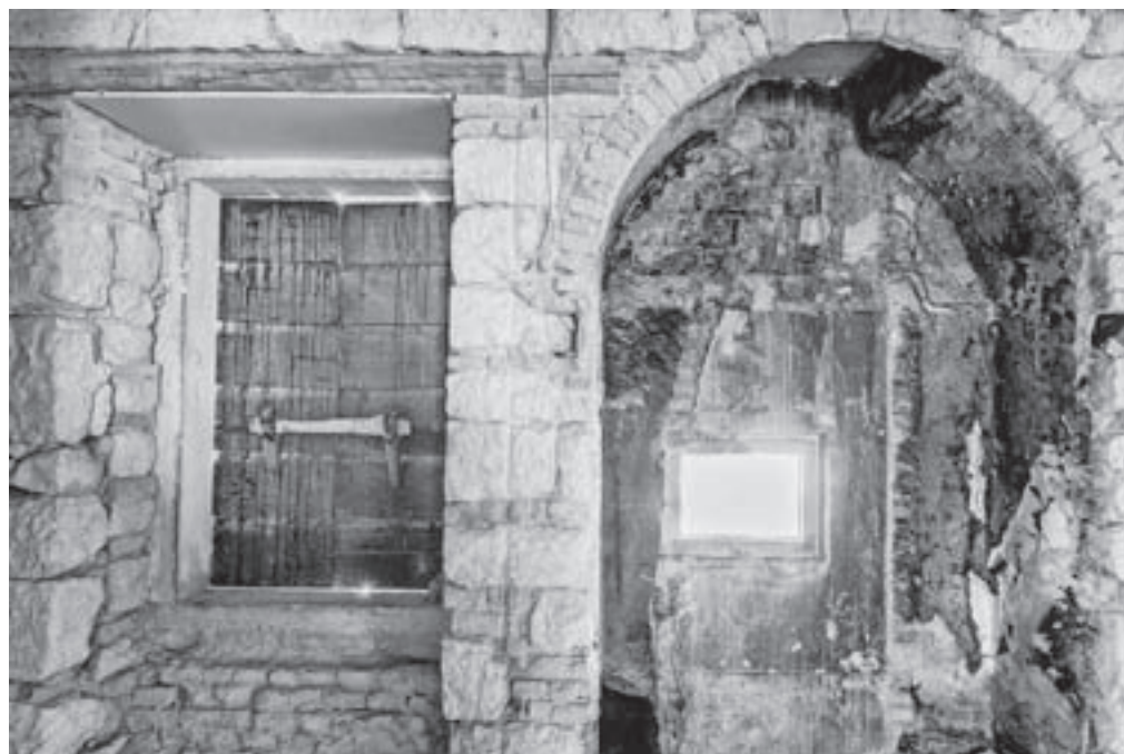
Zakonca Bidovec sta popolnoma prenovila še eno staro zgradbo ...

Butik hotel Spirito Santo Palazzo Storico je ime dobil po istoimenski cerkvi, porušeni v petdesetih letih prejšnjega stoletja, vsaka soba pa ima ime po eni od rovinjskih ulic. Suite Palazzetto Spirito Santo pa so ime dobile po starejši »sestri«.