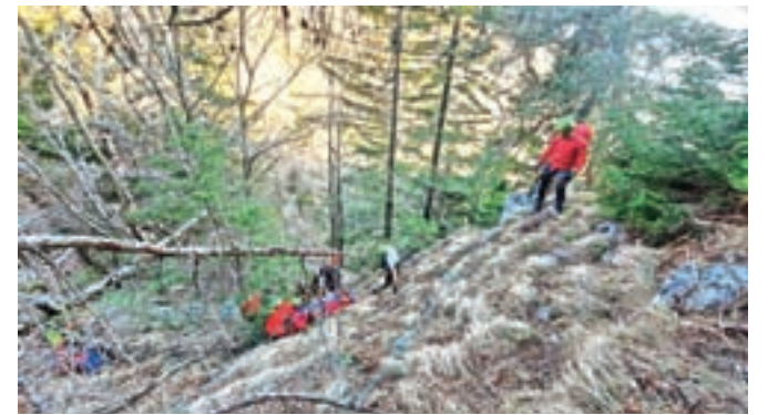
Reševanje ponesrečenega padalca je potekalo na zelo zahtevnem terenu.

Hudo poškodovanega padalca so s helikopterjem Letalske policijske enote prepeljali v ljubljanski klinični center.