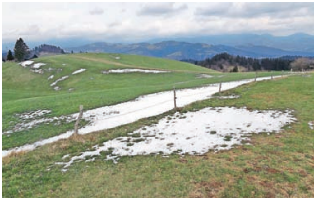
Razgleden in neporaščen Mrzli vrh

Nadmorska višina: 987 m Višinska razlika: 550 m Trajanje: 3 ure Zahtevnost: ★★★★★