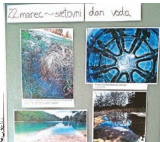
Fotografije z natečaja so na ogled na hodniku šole. Na vrhu desno je zmagovalna fotografija Tadeje Osredkar.

nam je rekla, da lahko fotografiramo karkoli, le da je povezano z vodo. Doma imamo kozarčke s posebnim dnom. Ko je v kozarcu voda, je učinek steklenega dna in vode zelo lep,« pa je ozadje, kako je nastala njena fotografija, opisala Tadeja Osredkar, ki se zaveda, da je voda nujno potrebna za življenje. »Je pa tudi blagodejna, saj se poleti v njej hladimo, otroci se v njej igrajo ...« O pomenu vode so razmišljali tudi drugi učenci. Zavedajo se, da imamo srečo, ker je na področju, kjer živimo, za zdaj vode še dovolj. Tadeja Kržišnik pravi: »Voda je edinstvena. A kljub temu da jo poznamo v toliko različnih oblikah, je vedno ista zmes, ista tekočina, isti vir življenja.« Manca Buh je priznala, da se je že kot malčica vedno rada igrala z vodo in jo raziskovala. »Med vsemi informacijami o vodi me je presenetilo, da je na svetu tako malo pitne vode, a jo tako zelo potrebujemo.« Lena Pintar je poudarila, da je voda dom veliko