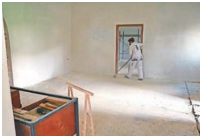
V notranjosti gradu ves čas potekajo dela.

Preddvor – V Preddvoru še naprej poteka obnova gradu Dvor, saj ga želijo za obiskovalce odpreti na začetku ju-