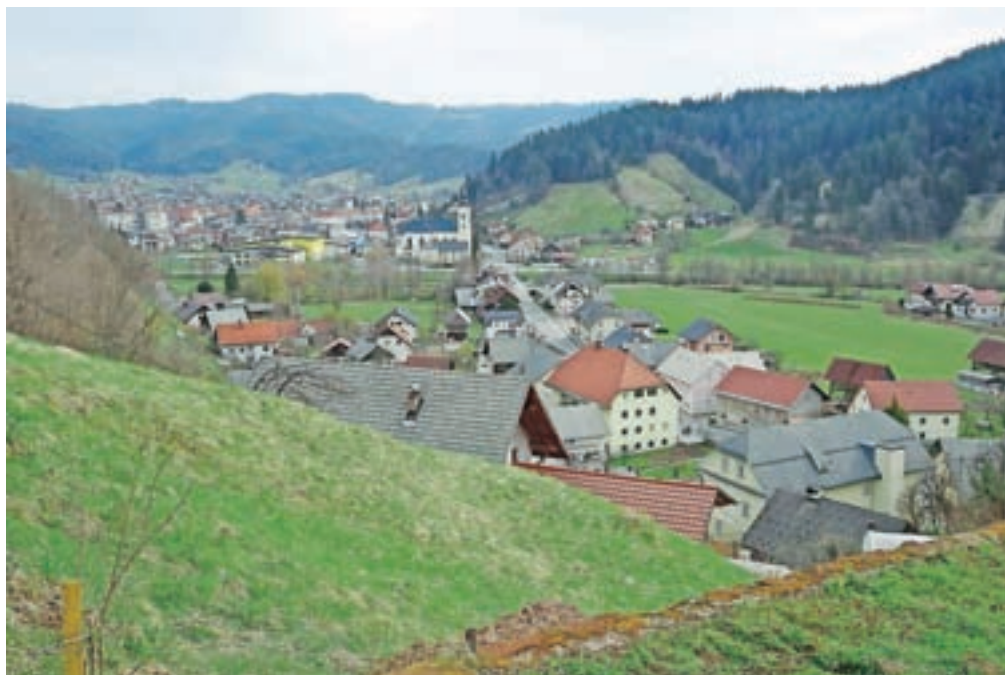
Pogled na Žiri

seveda!, sicer pa ob robu travnika) do kolovoza, ki je nad njim. Kolovozu sledimo v desno. V tem delu pot ni označena. Na nekaj razpottih predlagam, da se držimo bolj uhojene poti oz. širšega kolovoza. Ves čas se vzpenjamo in višje dosežemo makadamsko cesto, po kateri poteka Loška kolesarska pot. Na cesti zavijemo desno in kaj hitro smo pri kmetiji, kjer se je pred leti snemal resničnosti šov Kmetija. Gremo čez dvorišče kmetije in se po kolovozu povzpemo do široke planinske poti, kjer se nam z desne strani priključi markirana pot, ki smo jo prej na križišču zapustili. Po tej poti bomo sestopili.