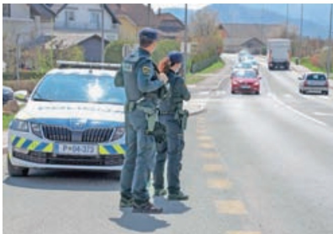
Gorenjski policisti so v maratonskem merjenju hitrosti ugotovili štiriinosemdeset kršitev.

Gorenjski policisti so hitrost merili z merilniki hitrosti v vseh oblikah (ročni, iz vozila in provida). V dvanajstih urah so ugotovili 84