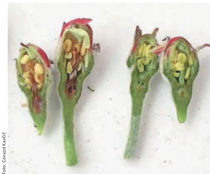
Poškodovani in nepoškodovani brsti sadnega drevja

Kranj – Na Kmetijsko gozdarskem zavodu (KGZ) Kranj so na podlagi lastnih ogledov in ocen pridelovalcev pripravili prvo oceno posledic nedavne pozebe na Gorenjskem. Pozeba je, enako kot drugje v Sloveniji, najbolj prizadela sadno drevje, pri tem je bila, kot pravijo strokovnjaki, usodna predvsem hladna druga noč, ko so bile nizke temperature povezane še z nizko zračno vlago. Škoda je velika, po doslej znanih podatkih ocenjujejo, da se bodo izgube pridelka pri sadju gibale od sedemdeset do sto odstotkov, odvisno od lege, sadnih vrst in sorte ter tudi od možnosti zaščite nasadov pred zmrzaljo.