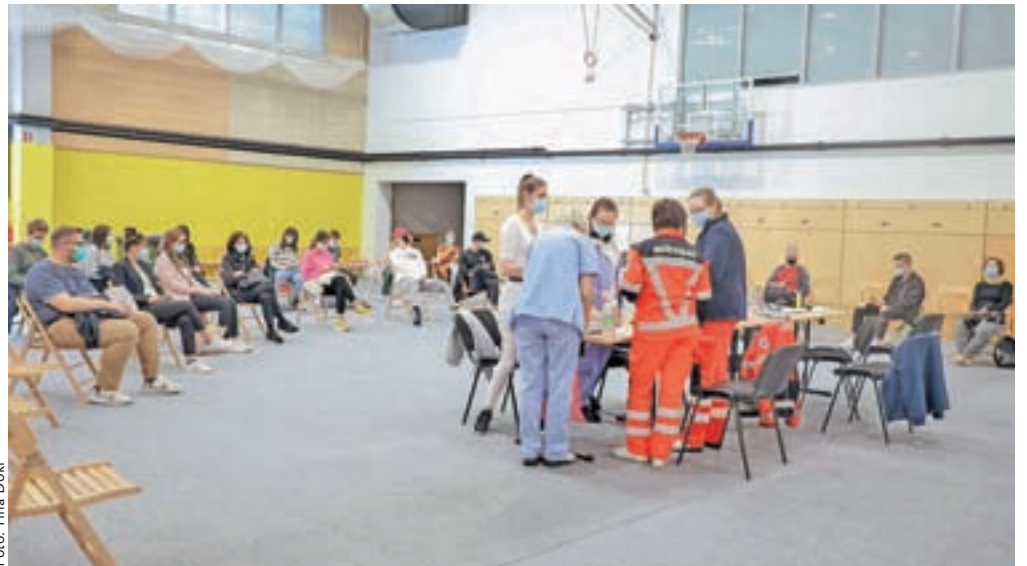
Po petkovih podatkih ZD Kranj, ki cepljenje proti covidu-19 izvaja v kranjski vojašnici, je bilo skupno cepljenih 22.100 ljudi. V petek so cepili tudi 237 maturantov (na sliki).

Vlada je pred nekaj dnevi sprejela že šesto posodobljeno Nacionalno strategijo cepljenja proti covidu-19, na novo oziroma podrobneje so v njej opredeljene prednostne skupine za cepljenje. V prednostno skupino so dodani starejši od petdeset let, zaposleni v vzgoji in izobraževanju, ki še niso bili cepljeni, in zaposleni pri upravljavcih kritične