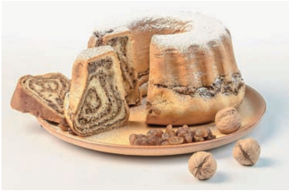
Slovenska potica je zdaj zaščitena tudi na evropski ravni.

Kot je ob tem dejal minister za kmetijstvo, gozdarstvo in prehrano Jože Podgoršek, je potica zagotovo jed, ki najbolje simbolizira praznični jedilnik Slovencev, v letu, ko je Slovenija evropska gastronomska regija, pa postaja tudi ambasadorica Slovenije v Evropi in v svetu. »Zaščitena je samo še dodatna potrditev in spodbuda, da verjamemo v izvrstne slovenske tradicionalne jedi,« je dejal minister in se zahvalil vsem, ki so pomagali pri