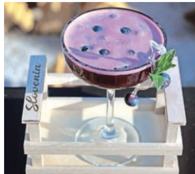
Zmagovalni brezalkoholni koktajl

Tomaž Fartek je sicer zmagovalni koktajl že poimenoval, vendar sedaj išče drugo ime zanj, ker je ugotovil, da so pred slabimi 15 leti to ime za podobno tekmovanje že uporabili. Zanj je uporabil naslednje sestavine: 1,0 cl pireja borovnice, 1,0 cl karamelnega sirupa, 0,5 cl sveže stisnjene limetinega soka, 2,0 cl ananasovega soka, 5,0 cl čaja jagoda-rabarbara, 10,0 cl mineralne vode Mattoni, za dekoracijo pa: cvet orhideje, svežo meto, lističe ananasa, borovnice, lupino grenivke in zlate bleščice oziroma zlati prah. Zaupal nam je tudi pripravo: »Za omenjeni koktajl najprej skuhamo čaj in pustimo, da se ohladi. V ročni mešalnici dodamo vse sestavine razen mineralne vode, vse skupaj dobro pretresemo, natočimo v koktajl kozarec in dolijemo mineralno vodo. Koktajl okrasimo in