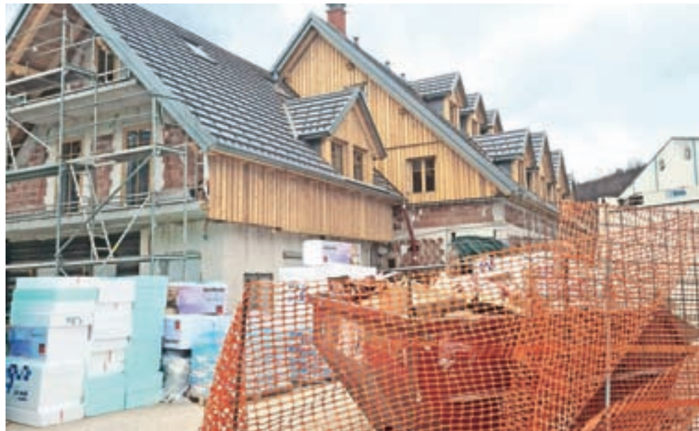
Prenovljeno Gostišče Danica bo predvidoma odprto v začetku poletja.

Ob vstopu v restavracijsko Gostišča Danica bo goste preplaval prijeten občutek domačnosti, ki ga bodo