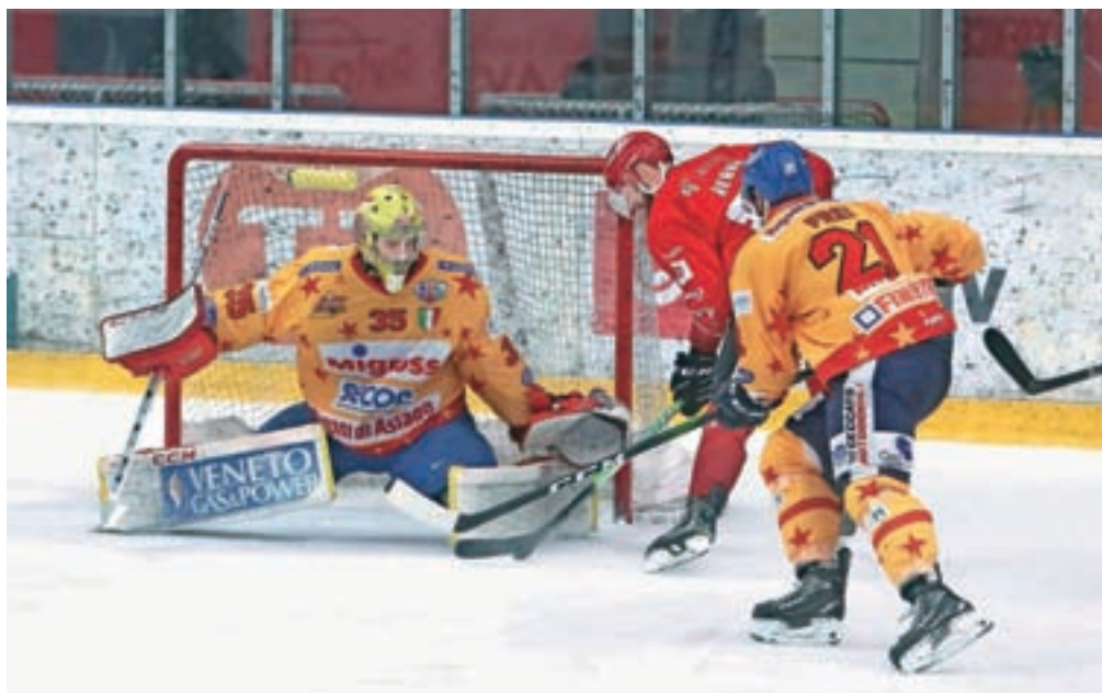
V odločilni peti tekmi so Jeseničani izgubili proti Asiagu.

Jeseničani so tako po odlični igri v rednem delu prvenstva znova ostali brez zelenega finala. Z Asiagom se bo pomerila ljubljanska Olimpija, ki je v soboto zvečer gladko odpravila avstrijski Lustenau. Finalna serija se začne danes v Tivoliju.