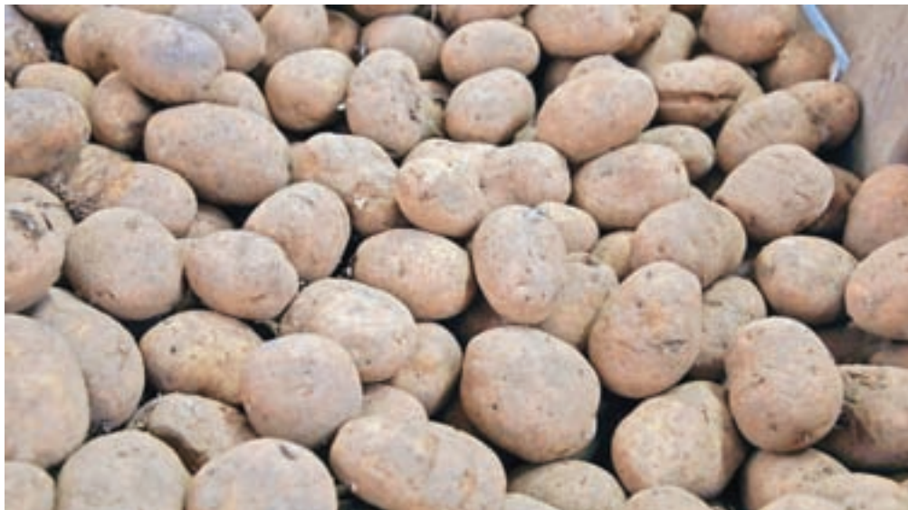
Pridelovalci še vedno upajo, da bodo vsaj nekaj lanskega krompirja še prodali, ne vedo pa, kaj bodo naredili z neprodanimi količinami.