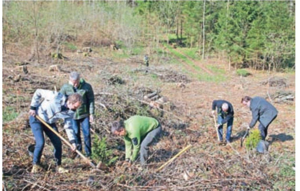
Ob Tavčarjevem dvorcu na Visokem so začeli obnavljati gozdno učno pot.

»Namen vseh učnih poti je, da se na primeren način ljudem prikaže pomen gozda in kakšna je njegova vloga, obenem pa opozoriti na lokalno pogojene zanimivosti,« je poudaril Umek in dodal, da je na Visokem glavna zanimivost vsekakor dvorec Visoko, ki že več kot sedemsto let kraljuje na nepoplavni ravnici desnega brega Poljanske Sore. Prenove učne poti so se lotili že pred leti, dodatni zagon obnovi pa sta dali Gorenjska