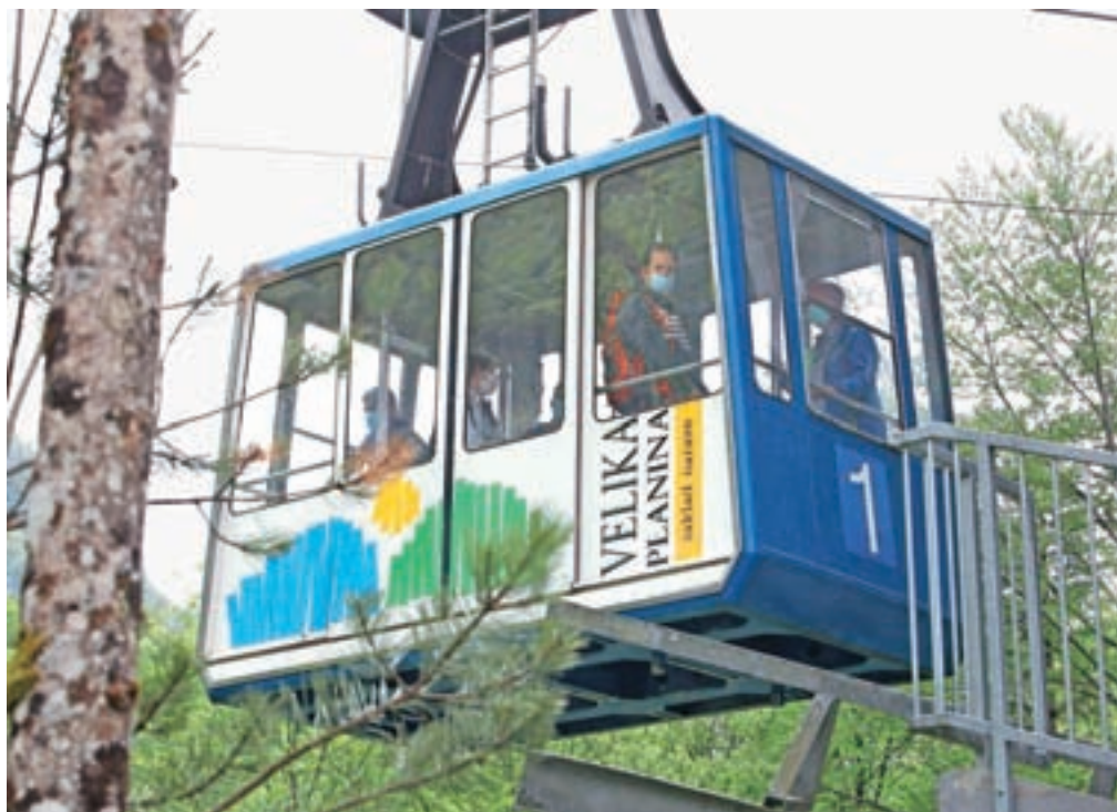
Lani so z nihalko prepeljali skoraj polovico manj potnikov kot leto poprej, letos pa bodo to število skušali povečati tudi s prodajo letnih vozovnic.

V družbi Velika planina si poslovanje v letošnjem letu želijo izboljšati, čeprav jim epidemiološke razmere dolgo niso bile naklonjene. Nihalko so večkrat morali zaustaviti, ponovno so jo znova pognali 12. aprila, ta dan pa so začeli ponujati tudi novost – prodajo letnih vozovnic za nihalko in sedežnico za sto evrov (za otroke od 6. do 14. leta pa petdeset evrov). Vozovnica velja 365 dni od nakupa, tudi v času zimskih aktivnosti, prodajajo pa jih na blagajni nihalko ali na spletu.