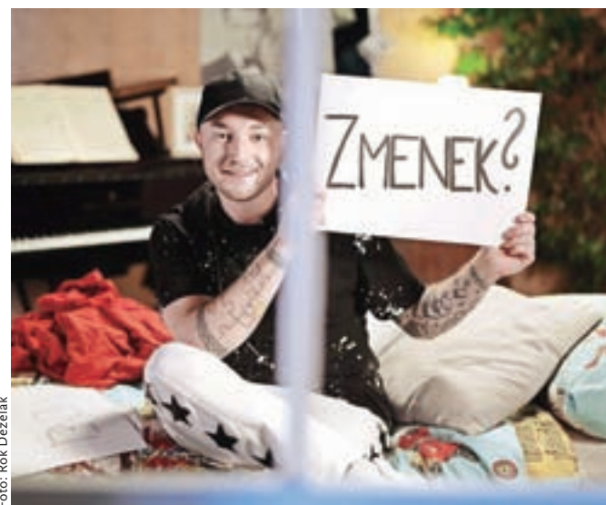
Glavno moško vlogo v videospotu odigra pevec sam.