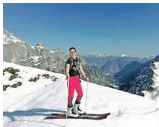
Nori pomladni užitki na turnosmučarskem potepu po Julijcih

sprehodu na Kofce in si brez pardona privoščili še vsaka svojo porcijo odličnih orehovitih štrukljev. Ko tako preletavam vse te majhne radosti, se sama pri sebi zasmejim svoji dramatičnosti