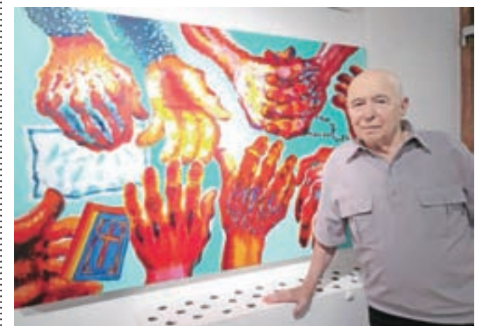
Franc Novinc na jubilejni razstavi ob 80-letnici na Loškem gradu

Franc Novinc nedvomno velja za enega najprepoznavnejših slikarjev iz Gorenjske in je tudi eden pomembnejših sodobnih slovenskih likovnih ustvarjalcev nasploh. Na začetku ustvarjalne poti je delal kot svobodni umetnik in tudi kot restavrador. Leta 1984 je prejel nagrado Prešernovega sklada za umetniške dosežke na področju krajinarstva, dve leti pozneje je bil na Akademiji za likovno umetnost in oblikovanje izvoljen za docenta, leta 1991 za izrednega in leta 1996 za redne-