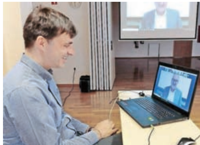
Jeseniški župan na virtualnem srečanju z županom Nagolda

je zelo pomembno, da v teh težkih časih ne pozabimo na umetnost. »V zadnjem letu nismo mogli hoditi v gledališče, na koncerte, v muzeje. A ne smemo pozabiti, da je tudi umetnost nepogrešljiv del naših življenj,« je spomnil. Oba župana sta izrazila veselje, da sodobne tehnologije omogočajo tudi sodelovanje na daljavo. »Ne moremo se videti v živo, a svoje veliko prijateljstvo ohranjamo s pomočjo interneta,« je dejal župan Nagolda in izrazil upanje, da bodo razmere že kmalu omogočale, da se srečajo tudi osebno. Dogodka so se udeležili tudi predstavniki obeh fotografskih društev in kolesarjev obeh mest.