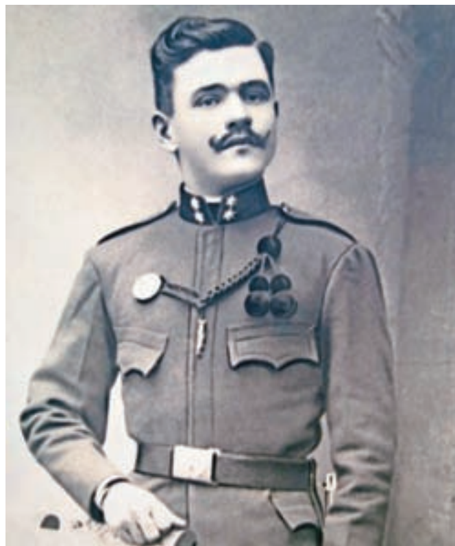
Vojak na fotografiji je bil po uniformi sodeč pripadnik 17. pešpolka, tako imenovanih kranjskih Janezov.