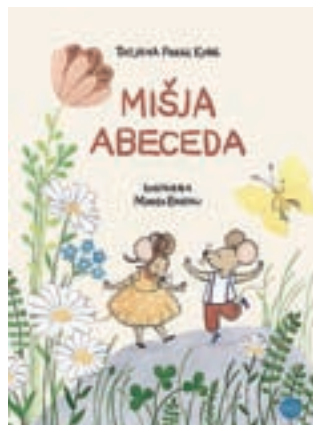
Najmlajšim je na festivalu namenjena slikanica Mišja abeceda.

POTOVANJA • VINO • HRANA • DOGODIVŠČINE • MOŠKI • ŽENSKÉ • POTOVANJA • VINO • HRANA • ŽENSKÉ