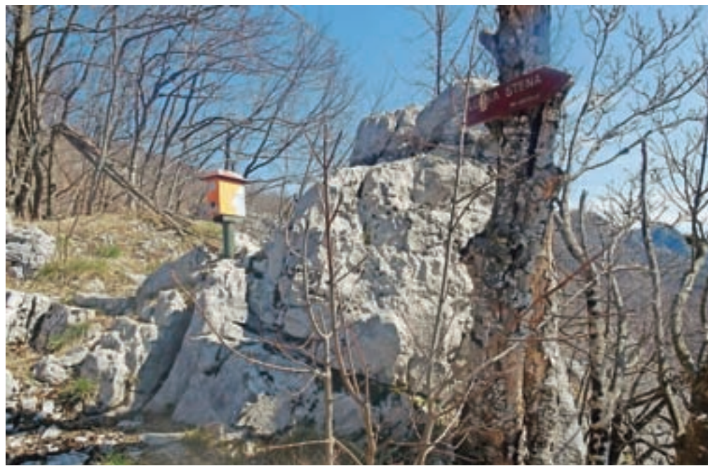
Skrinjica na Firstovem repu s smerokazom proti Loški steni

markacijam in kmalu dosežemo odcep za Cerk. Do tukaj se bomo kasneje vrnili, mi pa še kar nadaljujemo v smeri Firstovega repa, ki ga tudi končno zagledamo zapisanega na enem od smerokazov. Cesta se začne spuščati in nas pripelje do spominskega obeležja nekdanje partizanske bolnišnice. Zavijemo levo, cesta se začne vzpenjati. Dosežemo obračališče, na levi pa opazimo oznake za Firstov rep in tudi za Loško steno. Kolovoz se rahlo spušča in na ostrem desnem ovinku nadaljujemo kar naravnost skozi gozd. Občutek je, kot da hodimo po nekakšnem