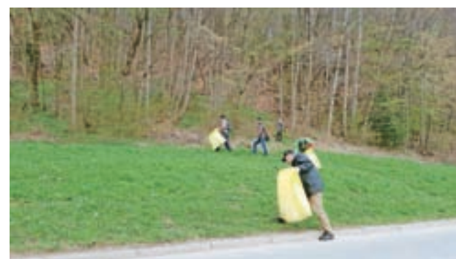
Akcija je potekala v vseh krajih nakelske občine, odzvalo se je veliko prostovoljcev.