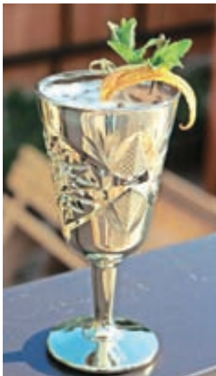
Leta 2017 smo v Fartkovem brezalkoholnem koktajlu okušali pasijonko.

ni ravno optimističen glede izvedbe junijskega tekmovanja. Kislo se nasmehne, da so bila v času, odkar je prisotno covid-19, vsa tekmovanja odpovedana. Tudi letošnje jesensko svetovno prvenstvo so že prestavili na drugo leto. Gostila ga bo Kuba. Da bi ga