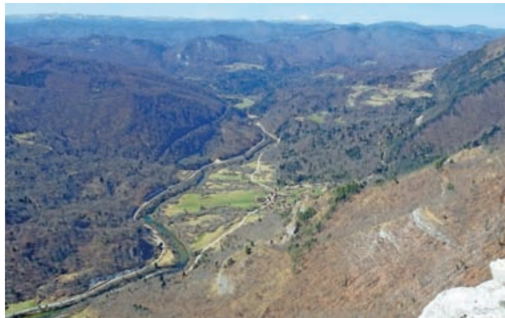
Z Loške stene pogled na dolino reke Kolpe. V ozadju se vidi Snežnik.

Nadmorska višina: 1192 m Višinska razlika: 900 m Trajanje: 7 ur Zahtevnost: ★★★★★