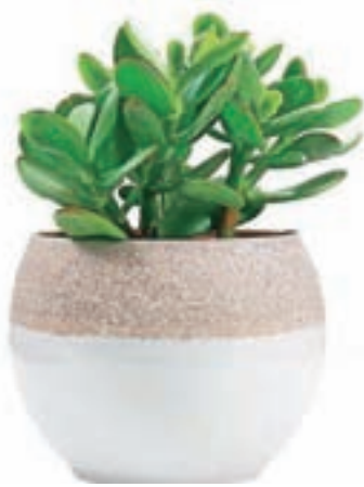
Tolstica oziroma drevo denarja

Ti nageljni, ta rožmarin, za okna, polna sonca, takih nima ves ta svet, pa pojdi tja do konca.