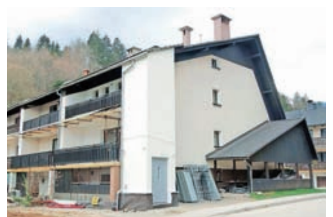
Jašek s hišnim dvigalom je nedavno dobil fasado.

je pojasnil Čufar. Zadovoljen je, da je izvedba projekta potekala hitro, še zlasti po začetnih zapletih ob iskanju izvajalca za dvigalo. Ob zbiranju ponudb so bili razočarani nad odzivnostjo izvajalcev, na koncu pa jim je vendarle uspelo najti ustreznega, in sicer podjetje Lift Dvig iz Ljubljane.