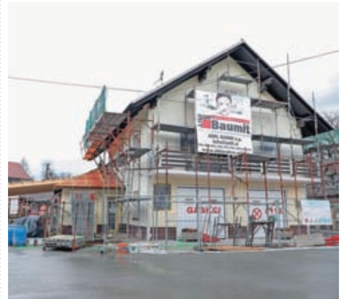
Obnova gasilskega doma na Lužah bo predvidoma končana v dveh mesecih.