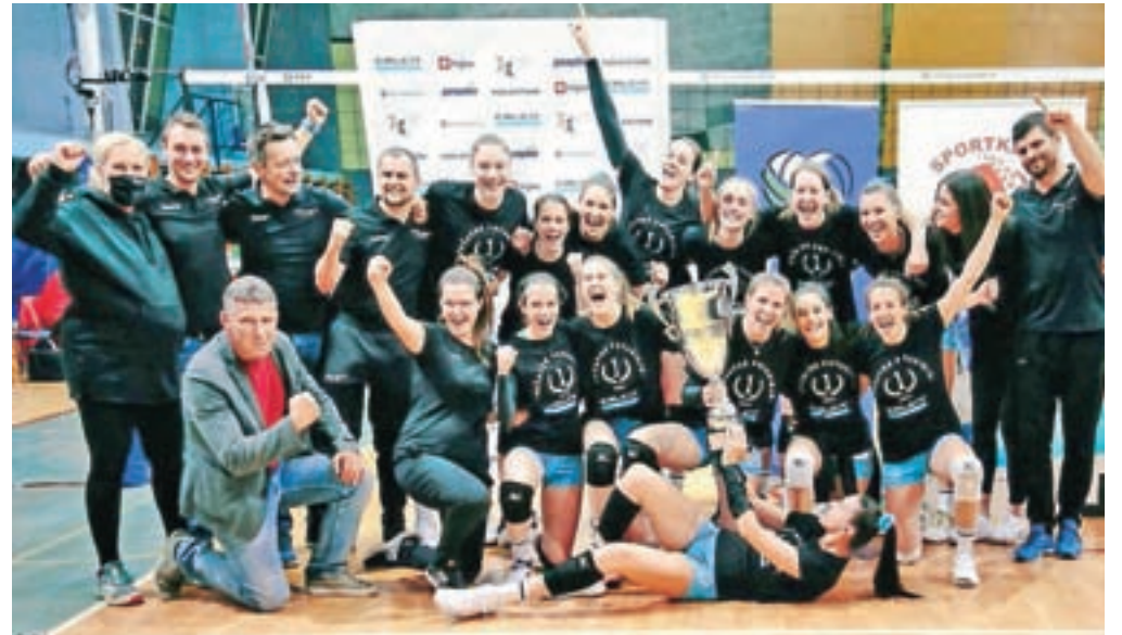
Naslov državnih prvakinj ostaja v Kamniku.

»V prvih dveh nizih se nam je poznalo, da je 18 dni minilo od naše zadnje tekme. Sicer smo bili oboji v enakem položaju, vendar je bil pri nas izpad normalnega treninga bolj očiten. Predvsem v drugem nizu