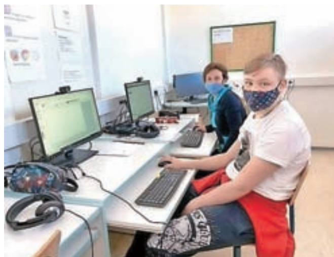
Računalniški tekmovanji za šole s prilagojenim programom so tokrat pripravili na daljavo.

in predstavitev ter znanje spletnega brskanja,« so pojasnili pri ZOTKS. Največ