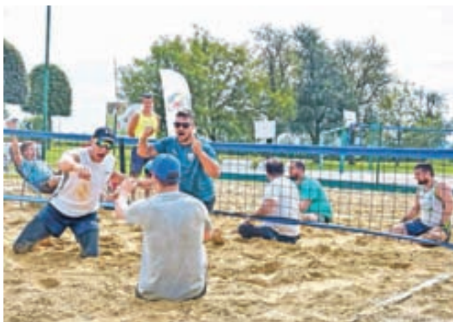
V Ljubljani bo julija Slovenia Open, doslej prvo evropsko tekmovanje športnikov invalidov v odbojki na mivki in odbojki na mivki sede.

Evropska zveza za odbojko sede, ki šteje 26 držav članic, vodi pa jo Slovenec Branko Mihorko, je vse bolj aktivna v organizaciji mednarodnih tekmovanj. »V prihodnje bomo poleg številnih reprezentančnih obračunov spremljali tudi klubsko prvenstvo, novost so tudi tekmovanja v odbojki na mivki. V Ljubljani bo tako med 27. in 29. julijem potekal Slovenia Open, doslej prvo evropsko tekmovanje športnikov invalidov v