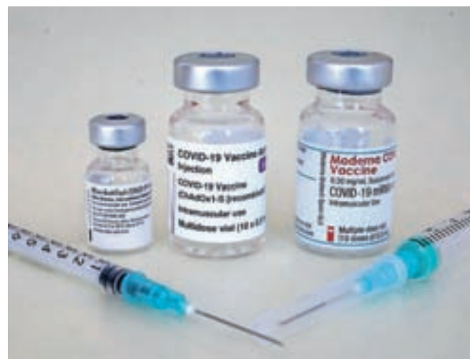
NIJZ na svoji spletni strani pojasnjuje, da glede na omejeno dobavo cepiva in ogromno čakajočih na cepljenje izbira cepiva v trenutnih razmerah ni mogoča.

»Cepiva so popolnoma nova in nepreizkušena, zato ni nikjer zagotovila, da telesu ne morejo povzročiti škode.