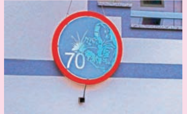
Najprej moder ...

Pred slabim tednom dni smo po naključju izvedeli, da na Brezjah pri Trziču stoji zanimiv »mlaj«, ki so ga slavljencu postavili ob sedemdesetem rojstnem dnevu. Zapeljali smo se mimo in ugotovili, da je rojstnodnevno obeležje, ki ga tokrat predstavlja na prvi pogled običajen okrogel znak s številko, vseeno nekaj posebnega. Čez dan je krog bel z rdečo obrobo in številko sedemdeset, medtem ko takoj, ko pade mrak, spremeni podobo. Takojšen spomin na disko vročico povzroči tudi svetlobni efekt, saj se barve menjajo. Tako je krog osvetljen zeleno, pa tudi modro, kar je lepo vidno na fotografijah. Prazen prostor pa se z večernim mrakom zapolni: številki se pridruži zanimiva podoba moškega, ki je več uporabe varilnega aparata – po domače »švasanja«.