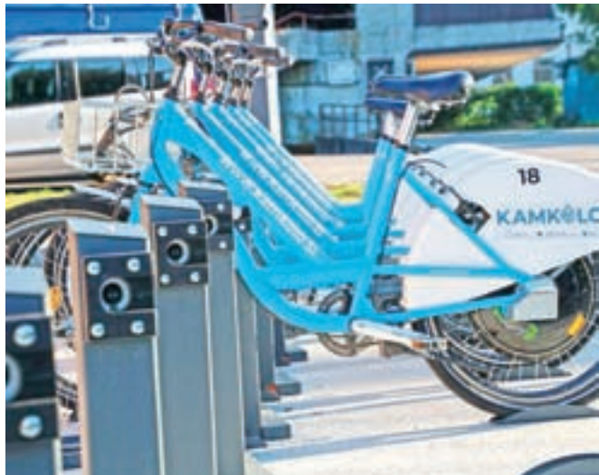
V sistemu Kamkolo je že štirideset električnih koles.

Tako kot do sedaj bo tudi letos veljalo, da bodo kolesa lahko uporabljali vsi, ki bodo za to plačali letno članarino. Čeprav članarina velja za tekoče koledarsko leto, pa bo zaradi epidemioloških razmer članarina, plačana v lanskem letu, izjemoma veljala do 1. junija. Uporabnikom bo še vedno na voljo 14 ur brezplačne izposoje na teden, uporaba sistema pa bo dovoljena le polnoletnim osebam. Ker pa so lani zaznali več primerov vandalizma, so se letos odločili še zaostri Splošne pogoje dostopa in uporabe sistema za izposajo električnih koles v občini Kamnik.