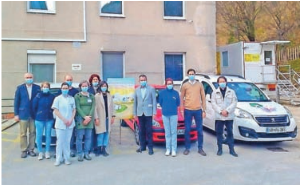
Mobilni paliativni tim v Splošni bolnišnici Jesenice je zaznamoval desetletnico delovanja.

Paliativna ali blažilna oskrba je namenjena lažšanju motečih simptomov kronične neozdravljive bolezni. Do nje je upravičen vsak pacient, ki trpi zaradi kronične neozdravljive bolezni. Oskrba se večinoma izvaja na pacientovem domu, nosilca osnovne paliativne oskrbe sta izbrani osebni zdravnik in patronažna medicinska