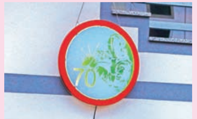
... potem pa že zelen.

Pred slabim tednom dni smo po naključju izvedeli, da na Brezjah pri Trziču stoji zanimiv »mlaj«, ki so ga slavljencu postavili ob sedemdesetem rojstnem dnevu. Zapeljali smo se mimo in ugotovili, da je rojstnodnevno obeležje, ki ga tokrat predstavlja na prvi pogled običajen okrogel znak s številko, vseeno nekaj posebnega. Čez dan je krog bel z rdečo obrobo in številko sedemdeset, medtem ko takoj, ko pade mrak, spremeni podobo. Takojšen spomin na disko vročico povzroči tudi svetlobni efekt, saj se barve menjajo. Tako je krog osvetljen zeleno, pa tudi modro, kar je lepo vidno na fotografijah. Prazen prostor pa se z večernim mrakom zapolni: številki se pridruži zanimiva podoba moškega, ki je več uporabe varilnega aparata – po domače »švasanja«.