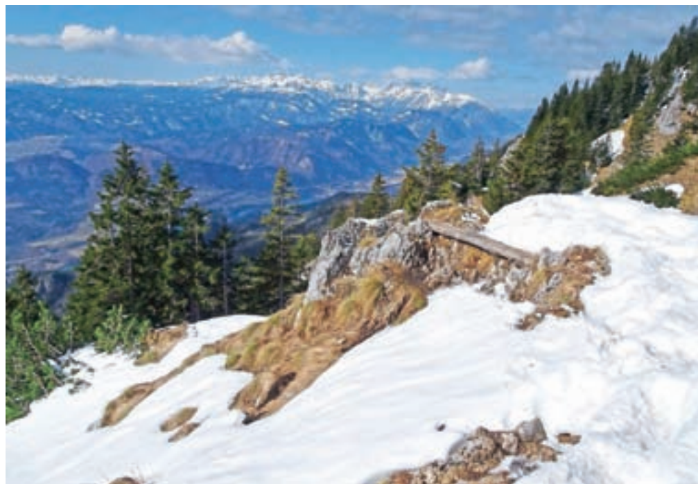
Prižnica s pogledom na Julijske Alpe in Jesenice

Zimski vzpon poteka po Žirovniški poti. Od tod naprej se pot strmo vzpenja, vendar kljub strmimi teži niti ni občutiti, saj je lepo speljana v okljukih. Ko pridemo do klopce, smo pri t. i. Prižnici. Področje Prižnice je v zimskih razmerah plazovito, zato previdno, če je sneg. Ob našem vzponu smo si pri Prižnici nadeli dereze in v roke dali cepin. V zadnjem delu strmina pridobi naklon. Greben na desni strani žlebu nas bo pripeljal naravnost do Prešernove kočice, ki stoji na nadmorski višini 2174 metrov. Naš današnji vrh je blizu. Pozimi običajno vzpon poteka kar po žlebu navzgor, lahko pa zagrizemo v strmino na desni