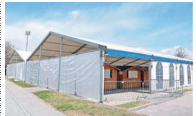
Cepilni center v Športnem parku Domžale