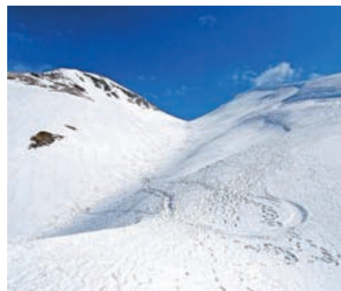
Stolov žleb

Stol nudi obiskovalcu enkratnega razgleda. Kot na dlani so ostri vrhovi Julijskih Alp. Triglav z Rjavino, Bovški Gamsovec, Stenar, Škrlatica itd. Pred nami se razprostira greben Karavank; Belščica z Vajnežem, Struška, Golica, Dovška Baba, dominantna Kepa. Na vzhodni strani pa Vrtača, Begunjskičica, Storžič, Kamniške Alpe ... Južna stran je geografsko barvita; Ljubljanska kotlina, gorenjska ravnina, notranjsko hribovje s Snežnikom, Polhograjsko in Loško hribovje, Porezen, Ratitovec, Jelovica. Severno je avstrijska Koroška, pa Ovčji vrh, Vrbsko jezero in Celovec. Severozahodno kipijo