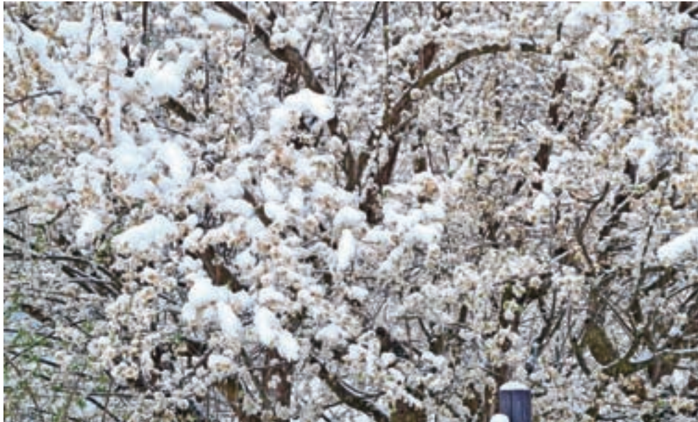
Pozeba je najbolj prizadela že cvetoče sadno drevje.

»Prizadete kmetije potrebujejo pomoč. Vladi bomo predlagali sprejetje interventnega zakona, poenostavitev postopkov pri