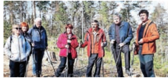
Skupina tradicionalnega Prdenovega pohoda z Jurčkove Dobrave na Šenturško goro