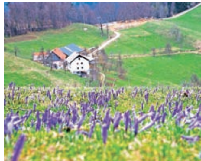
Morje žafranov nad kmetijami Mrzlega Vrha

da v časih zviška gledamo na preveč oglaševane izletne destinacije, se med njimi vedno najdejo svetle izjeme, ki so vsaj mene tokrat zapele v lepe konce Gorenjske, ki jih drugače ne bi nikoli