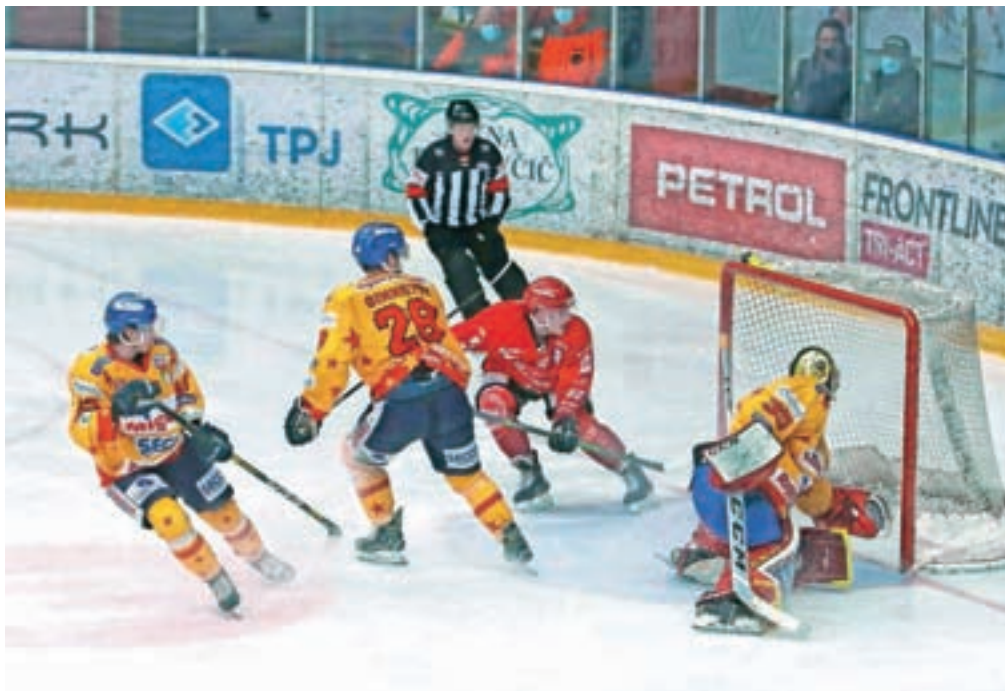
Hokejisti Jesenic (v rdečih dresih) so polfinalni obračun z Asiagom v četrtek začeli z zmago, v soboto pa so v gosteh izgubili. Obeta se napet boj za uvrstitev v finale, ki bi lahko bil slovenski.

Želje se Jeseničanom niso uresničile, saj so na drugi tekmi v soboto v gosteh izgubili. Italijani so bili boljši s 4 : 1 (0 : 1, 3 : 0, 1 : 0). Železarjem je pripadla prva tretjina, tekma pa se je odločila v drugi, ko so domačini zadeli kar trikrat. »Zavedali