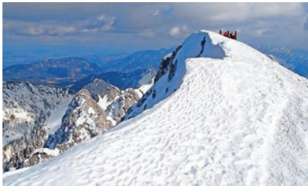
Veriga Karavank; Potoški Stol, Vajnež, Struška, Golica, Dovška Baba, Kepa ...

Nadmorska višina: 2236 m Trajanje: 6–7 ur Višinska razlika: 1586 m Zahtevnost: ★★★★★