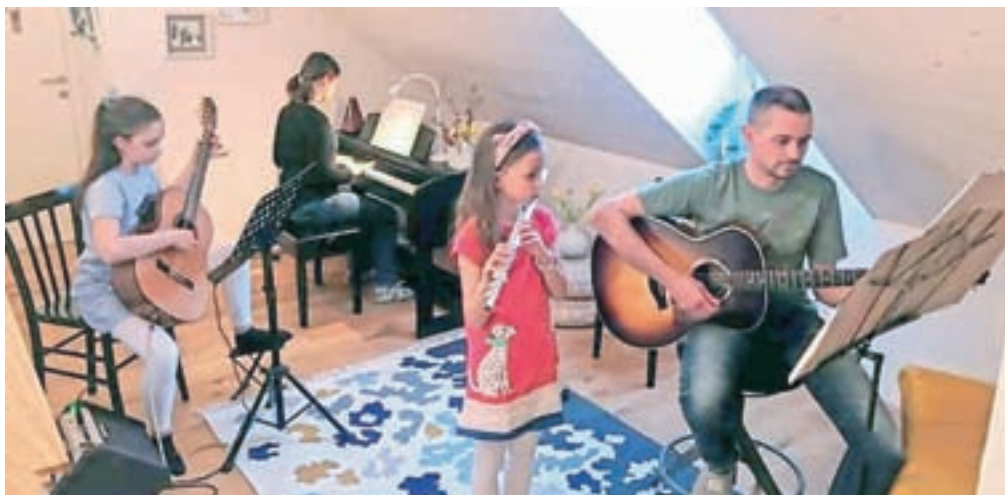
Družina Magister na Nastopu družin v živo iz domače dnevne sobe

Jesenice – Pred skoraj desetimi leti so v Glasbeni šoli Jesenice začeli prirejati koncert, na katerem se predstavijo glasbene družine, v katerih vsaj en član obiskuje jeseniško glasbeno šolo. Tako učenci na oder stopijo skupaj z brati in sestrami, starši, starimi starši, tetami in strici ... Zanimanje za nastop je vsako leto veliko, pred štirimi leti je tako koncert prerasel v festival, ki se je preselil v Kolpern,