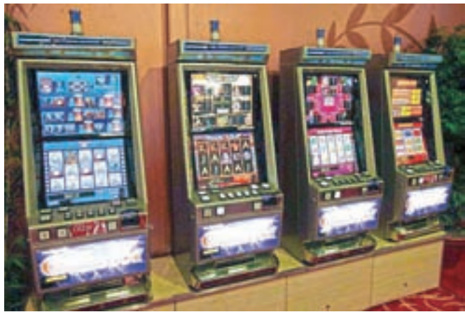
V Admiralovem igralnem salonu v Kranju bi bilo 97 igralnih avtomatov in elektronska ruleta z osmimi igralnimi mesti.

Skupina Admiral Slovenija ima sicer po državi že devet igralnih salonov, enega tudi v Lescah.