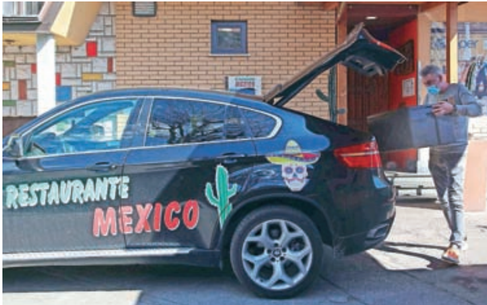
V mnogih gostilnah, tudi v restavraciji El Restaurante Mexico v Kranju, skušajo obdobje prisilnega zaprtja prebroditi z dostavo in osebnim prevzemom hrane.