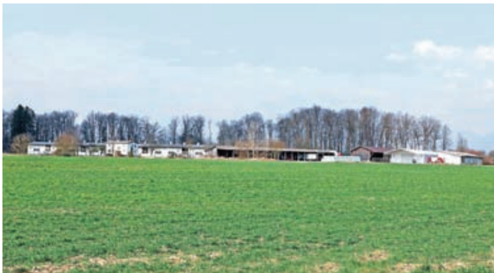
Zakupljena državna zemljišča še naprej obdeluje KŽK.

Kranj – Sklad kmetijskih zemljišč in gozdov in KŽK, kmetijstvo, sta februarja 2017 sklenila pogodbo, s katero je Sklad dal KŽK-ju do konca leta 2023 v zakup nekaj maj kot 630 hektarjev državnih kmetijskih zemljišč. Ker naj bi KŽK kršil zakupno pogodbo in zakupljena zemljišča brez dovoljenja Sklada oddajal v podzakup, je Sklad sredi predlanskega julija KŽK-ju odpovedal zakupno razmerje, odpoved pa naj bi začela veljati 31. decembra 2019. KŽK se je na odpoved zakupne pogodbe pritožil, v tožbi pa je navedel, da je odpoved pogodbe