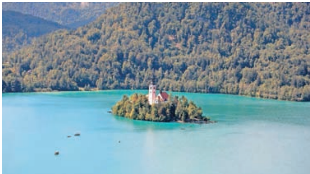
Katja Kos je v verzih zapisala pravljico o nastanku Bleda.

»Pod visoko grajsko skalo je živel prijazen zmaj, redno hodil je k frizerju, lase si česal je nazaj. Ob megli je ogenj kuril, da ljudje so našli pot, sploh se nikdar ni razburil, zmaj je bil res fin gospod,« se začne zgodba o blejskem zmaju, o katerem se je nato vest razširila