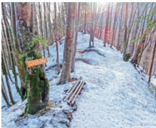
Greben Vreteno, kjer se naši poti »čez Mev« z leve pridruži pot »od žage« oz. Slovenske peči.