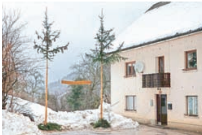
Na dvorišču so slavljenca domači postavili mlaj.