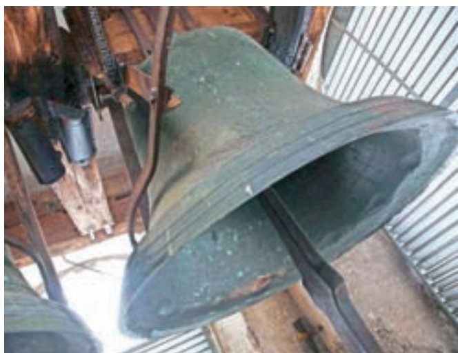
Znameniti dupljanski bronasti zvon je preživel vse vojne in kljub starosti še vedno lepo zveni.