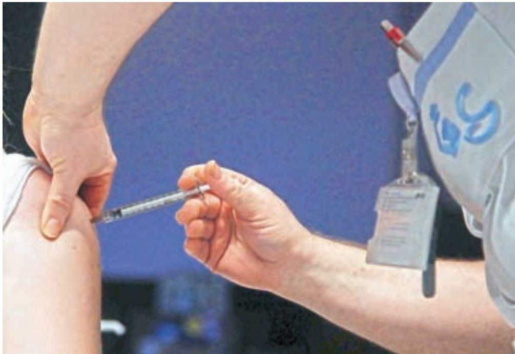
V Sloveniji se je že začelo cepljenje proti novemu koronavirusu.

Razmeroma hitro so nato grozno odgovorili znanstveniki in začeli nemudoma razvijati cepivo proti novemu virusu, saj bi zgolj to lahko zaustavilo pandemijo ... Iz nuje so posegli po popolnoma novih postopkih, ki se povsem razlikujejo od dozdajšnjih, ko so cepiva večinoma temeljila na uporabi inaktiviranih, oslabljenih ali mrtvih virusov oziroma bakterij, ki so spodbudili imunska dogajanja v cepljenem organizmu.