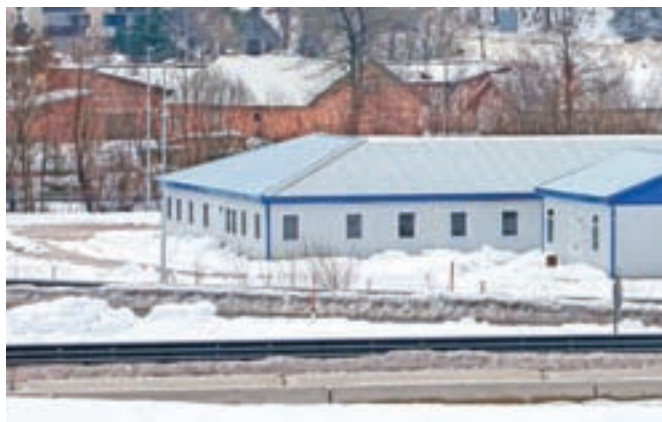
Naselje za turške delavce je postavljeno ob avtocestnem izvozu na Hrušici.