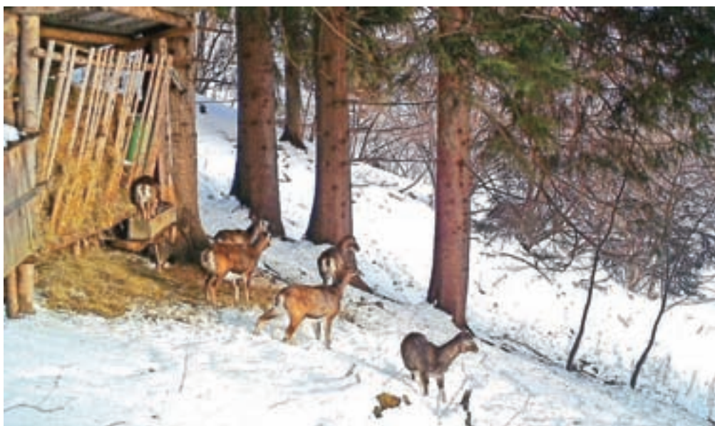
Divjad na enem od krmišč na Zgornjem Gorenjskem

Kot pojasnjuje Blaž Černe iz blejske območne enote Zavoda za gozdove Slovenije, divjad na območjih z debelo snežno odejo že občuti prehransko stisko. Če se bo ta stiska nadaljevala do pomladi, se lahko ponovita zimi 2005/2006 in 2012/2013, ko je bilo zaradi izčrpanosti in boleznih veliko poginov. Divjad je sicer prilagojena na življenje v zimskih razmerah, posamezne vrste se jim še posebej