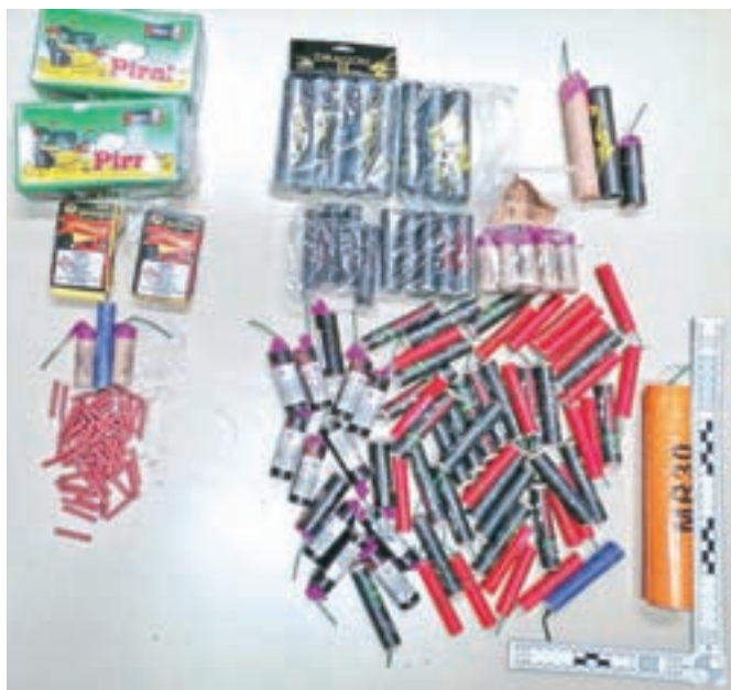
Policisti so najstnikoma zasegli veliko količino različnih petard.

kosov petard. Obravnavajo ga tudi zaradi neupoštevanja ukazov policistov. Med zbiranjem obvestil so policisti zaznali kršitev še enega najstnika in mu prav tako zasegli okoli sto kosov različnih petard. S kršitvami so policisti seznanili tudi njihove starše, so pojasnili na Policijski upravi Kranj.