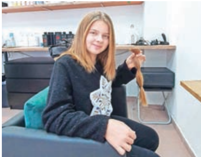
Podarila je več kot trideset centimetrov svojih las.

»Tudi sama bi bila vesela, da bi kdo kaj podobnega naredil zame, če bi se