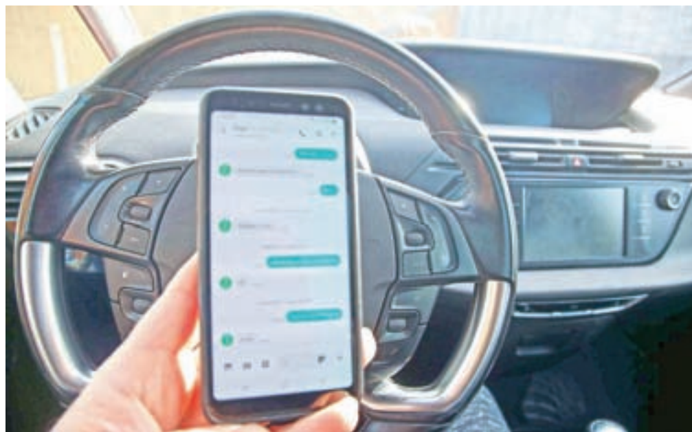
V obravnavi v državnem zboru je novela zakona o pravilih cestnega prometa, po katerem se bo uporaba telefona med vožnjo kaznovala z 250 evri in tremi kazenskimi točkami. Zdaj je predpisana globa v višini 120 evrov.

»Mobilni telefoni močno vplivajo na kognitivne sposobnosti voznika. Pisanje sporočil ali pregledovanje družbenih omrežij med vožnjo pomeni do 23-krat večje tveganje za nastanek prometne nesreče. Telefoni motijo našo koncentracijo, saj človek ni sposoben opravljati dveh miselnih operacij hkrati,« opozarjajo na AVP. Tuje raziskave kažejo, da je med pisanjem SMS-sporočila ali pregledovanjem družbenih omrežij voznik povprečno pet sekund osredotočen na telefon, in ne na vožnjo. Pri hitrosti 60 km/h prevozi razdaljo več kot 83 metrov. V naselju pri vožnji 50 km/h prevozi skoraj 70 metrov. Še večje tveganje pa je na avtocestah, kjer pri hitrosti 130 km/h v petih sekundah prevozi več kot 180 metrov, na hitri cesti pri vožnji 100 km/h pa prevozi 139 metrov. »Gre