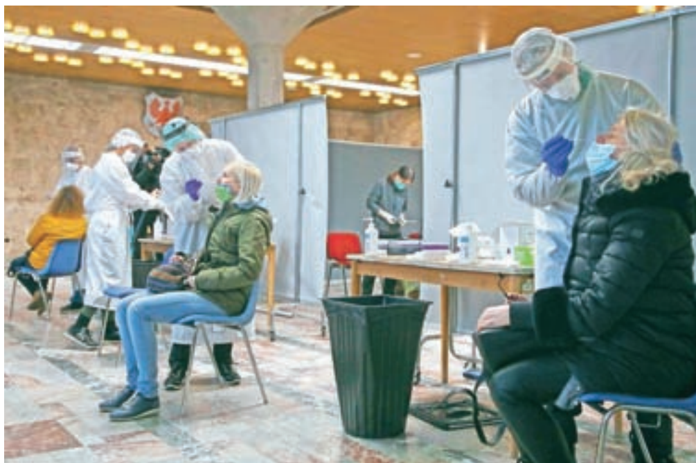
Na Gorenjskem je včeraj potekalo testiranje s hitrimi antigenski testi za zaposlene v vrtcih in šolah, posnetek je iz avle Mestne občine Kranj.