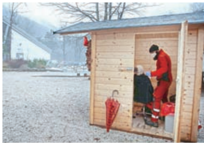
Med smučišči, ki izvajajo testiranje s hitrimi testi, je tudi Velika planina.

Kranj – Ob umirjanju števila okužb z novim koronavirusom je vlada v soboto ponovno dovolila odprtje smučišč v posameznih regijah z boljšo epidemiološko sliko.