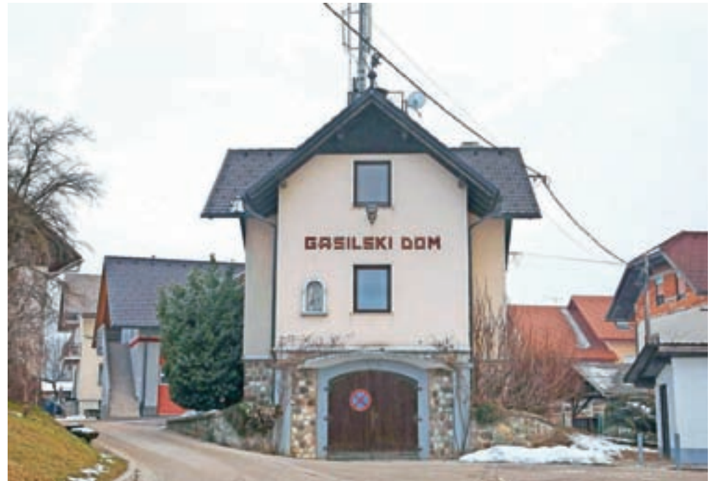
Gasilski dom Prostovoljnega gasilskega društva Predoslje

Kot nam je še povedal, imajo v Mestni občini Kranj od šestnajstih gasilskih domov uporabna dovoljenja le trije, še dva pa jih bosta prejela po obnovi, ki že poteka. Mestna občina Kranj je v proračunu za letošnje leto zagotovila denar za obnovo gasilskih domov (najprej se bodo lotili tistih štirih, v katerih imajo prostore tudi krajevne skupnosti), a do njega bodo upravičena le