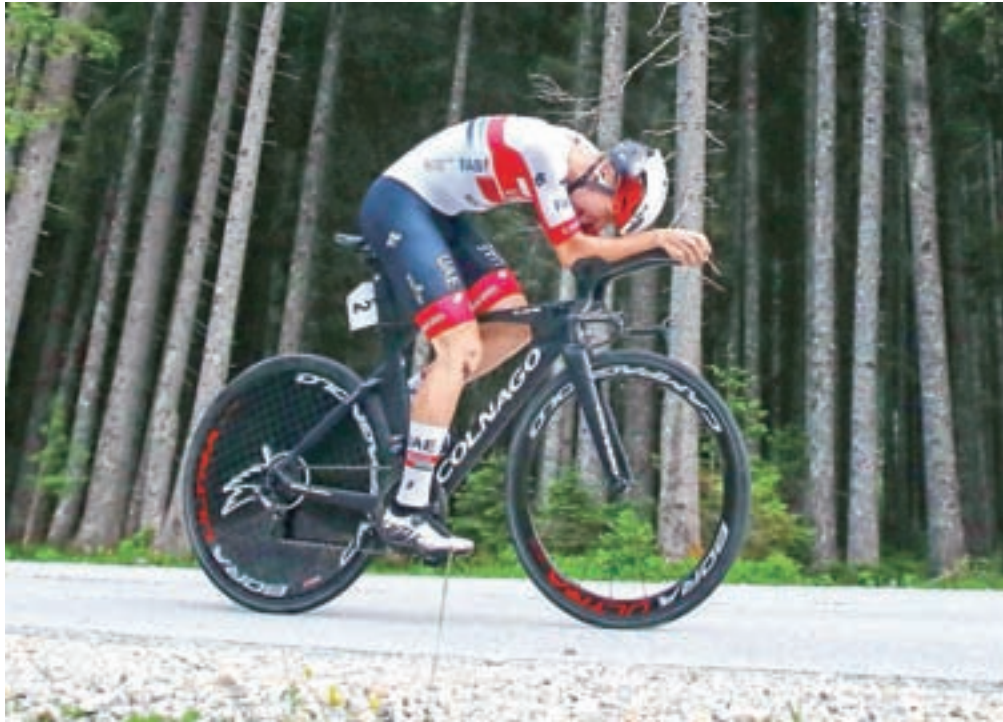
Tadej Pogačar se vselej rad vrne domov in kolesari po slovenskih krajih. Slovenijo bo po svetu promoviral tudi kot destinacijo aktivnega oddiha. Na sliki je med državnim prvenstvom v cestni vožnji na Pokljuko.

Pogačar se je oglašil s priprav v Združenih arabskih emiratih. »Smo v Al Ainu. Vreme je lepo, pogoji za trening so dobri. Ni pa to Slovenija, ni dom,« je priznal na začetku, nato pa glede sodelovanja s STO, kolesarjenja pod slovensko zastavo in sloganom I feel Slovenia dodal: »V čast in v ponos mi je nastopiti za Slovenijo, doseči kakšen dober