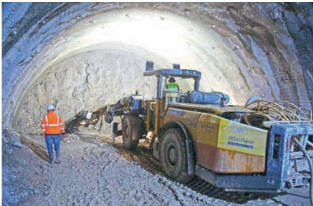
Do prejšnjega petka so izkopalih dobrih tristo sedem metrov globoko v Karavanke.

Spomnimo, izvajalca so na avstrijski strani v delo uvedli že septembra 2018, medtem ko se je na naši strani najprej zapletalo z razpisi,