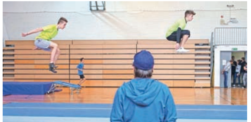
V Gimnaziji Franceta Prešerna v Kranju bo po novem še en športni oddelek.

V programih splošnih gimnazij je prihodnjim dijakom na voljo 5762 mest, od tega 420 v zasebnih šolah, v programih strokovnih gimnazij pa je razpisanih 1418 mest. V programih srednjega strokovnega izobraževanja bo novincem na voljo 9600 mest, v programih srednjega poklicnega