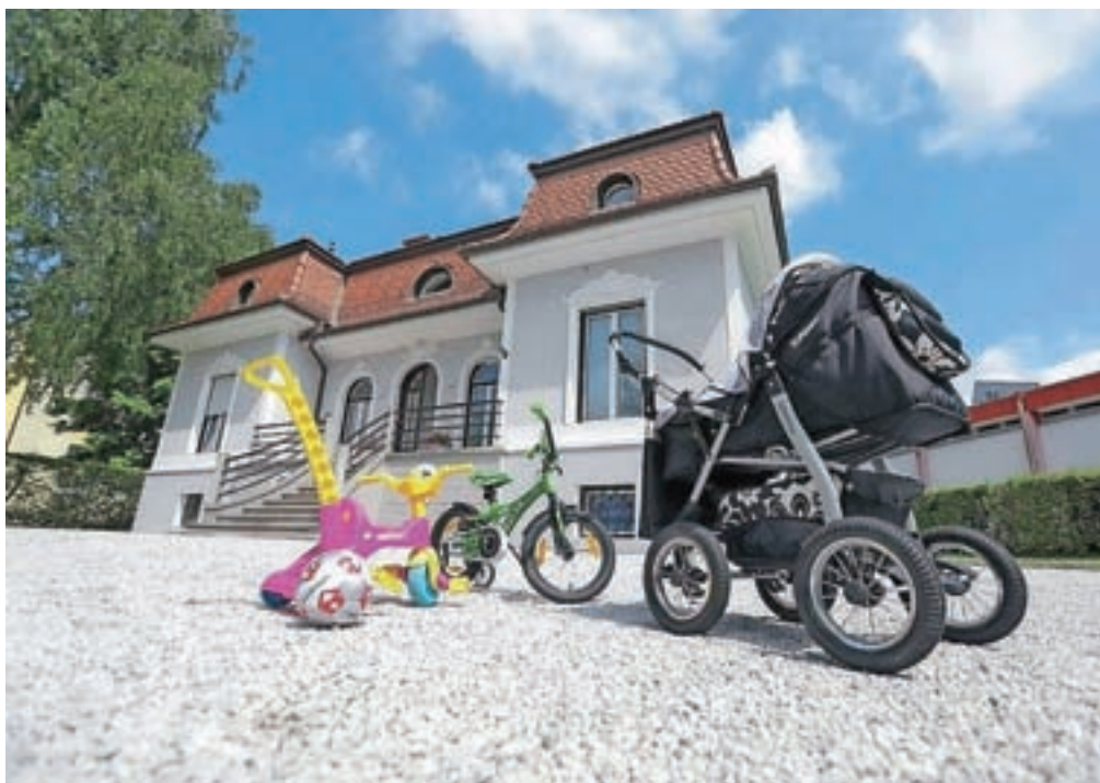
Materinski dom Gorenjske v Kranju nudi prijazno okolje mamicam z otroki.

MD Gorenjske lahko naenkrat sprejme do deset uporabnikov (štiri ženske in do šest otrok), imajo štiri zasebne sobe (ena soba je urejena za samsko žensko – nosečnico ali mamico z dojenčkom, tri sobe pa lahko sprejmejo tri osebe), ostali prostori doma so namenjeni