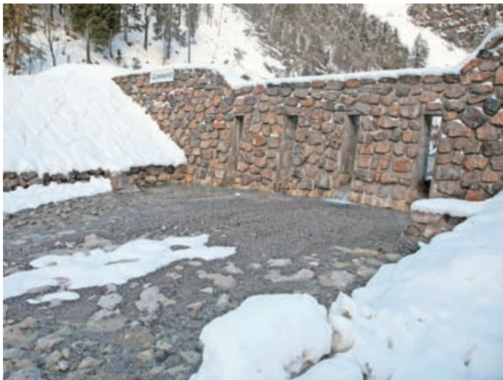
Ena ključnih investicij za zagotavljanje varnosti je bila lani zgrajena zaplavna pregrada na vodotoku Belca, ki jo je izpeljala država ob pomoči Občine Kranjska Gora.

Za miniranja in ureditev dostopne ceste na vrh podora so namenili šeststo tisoč evrov iz državnega proračuna, medtem ko je plačilo davka na dodano vrednost izvedenih sanacij, projektov, nadzora, monitoringa, odmer, strošek nadzora ter izdelavo tehnične dokumentacije plačala Občina