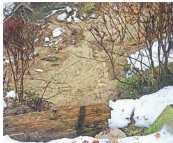
Zemljina je skupaj z drevjem zgrmela v Jezernico, ki je zato poplavila bližnjo klet.

Plaz si je že v soboto ogledala Komisija Občine Bled za odpravo posledic naravnih nesreč. Kot so povedali na občini, so vodo speljali s plazišča stran, plazišče pa toliko zaščitili, da trenutno ne predstavlja več grožnje za okolico. Včeraj si je plaz ogledal tudi strokovnjak s področja geologije, ki bo ocenil, v kakšnem stanju je in kako bo potekala