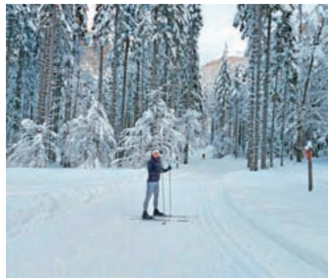
Tekaške proge proti spodnji postaji žičnice na Jezerskem

strmi spusti od zgornje žičnice pa zahtevajo že nekaj tekaškega znanja. Če vas radovednost vleče v Rateče, pa je tam ravninski del speljan vse od meje z Italijo proti Trbižu, rahli vzponi