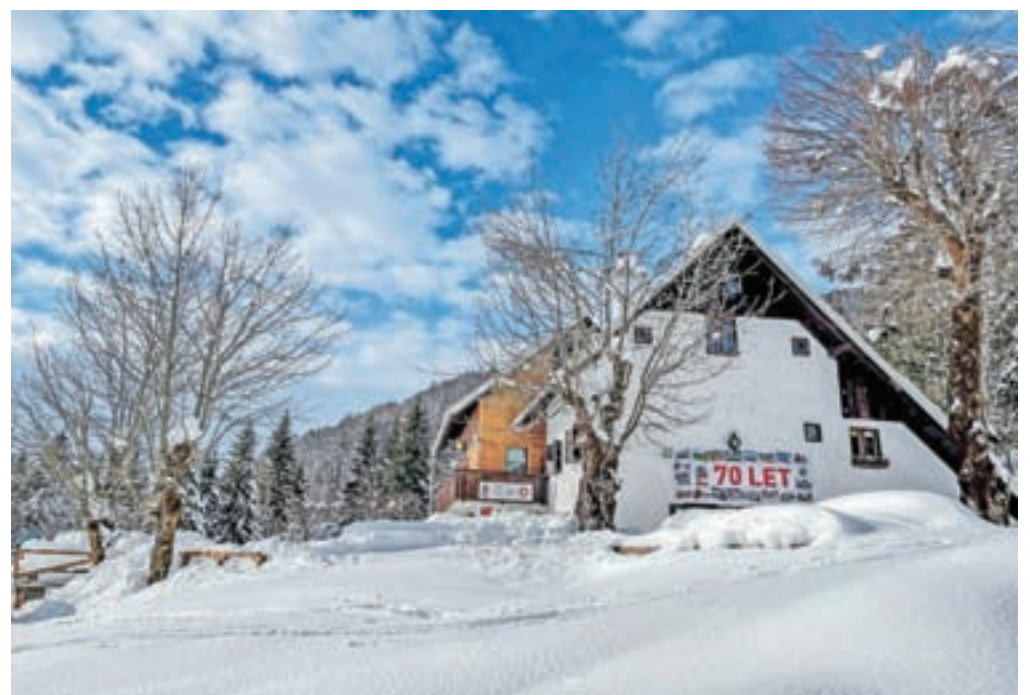
Kosijev dom na Vogarju v znamenju okroglih obletnic

leta 1961. Pred obnovo in razširitvijo stanu v planinsko postojanko so leta 1962 napeljali vodovod z dva kilometra in pol oddaljene planine Hebed. Leta 1963 so zrušili precejšen del stare stavbe in začeli graditi na novo; že jeseni istega leta je bil objekt pod streho. Naslednji dve leti so nadaljevali gradnjo in dom opremili ter julija 1966 pripravili slovesno odprtje. Ob 20-letnici društva so dom poimenovali po Dragu