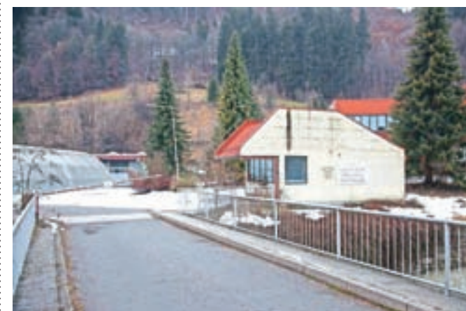
V kompleksu nekdanje Lepenke so proizvodno-skladišni objekti, upravna stavba z vratarnico in pripadajoči pomožni objekti.