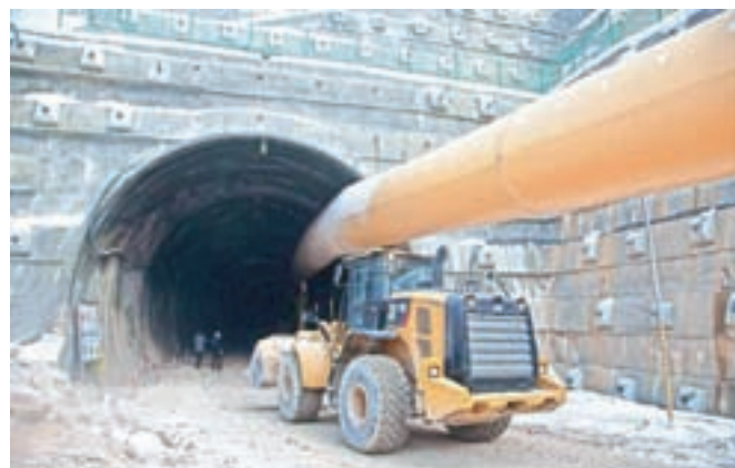
Gradnja vzhodne cevi predora Karavanke: sledijo terminskemu planu.

Gradnja vzhodne cevi predora bo predvidoma končana v letu 2025.