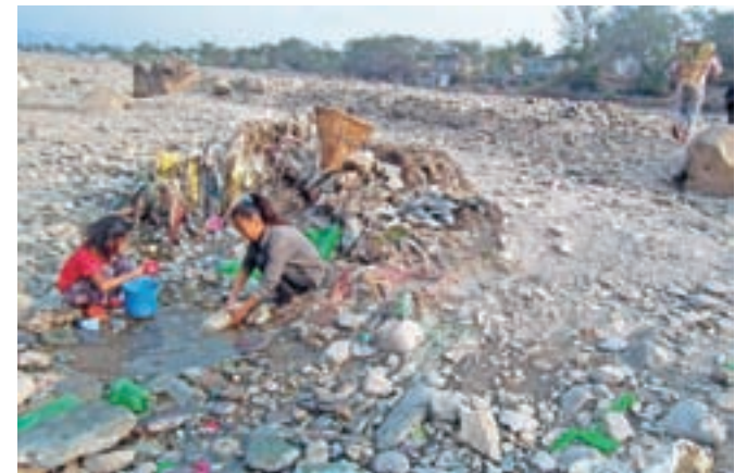
Tisti, ki imamo vode v obilju, težko razumemo, da je mnogi nimajo več. Deklici na sliki jo natakata iz izsušene reke Shardu v Nepal.