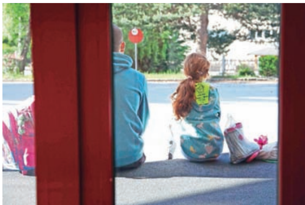
Pouk v šolskih klopih se bo za prve tri razrede osnovne šole začel v torek, dan prej bo testiranje zaposlenih s hitrimi antigenimi testi.