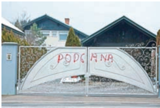
Na ograji na domu Karla Erjavca v Naklem se je v sredo jutraj pojavil napis »podgana«.