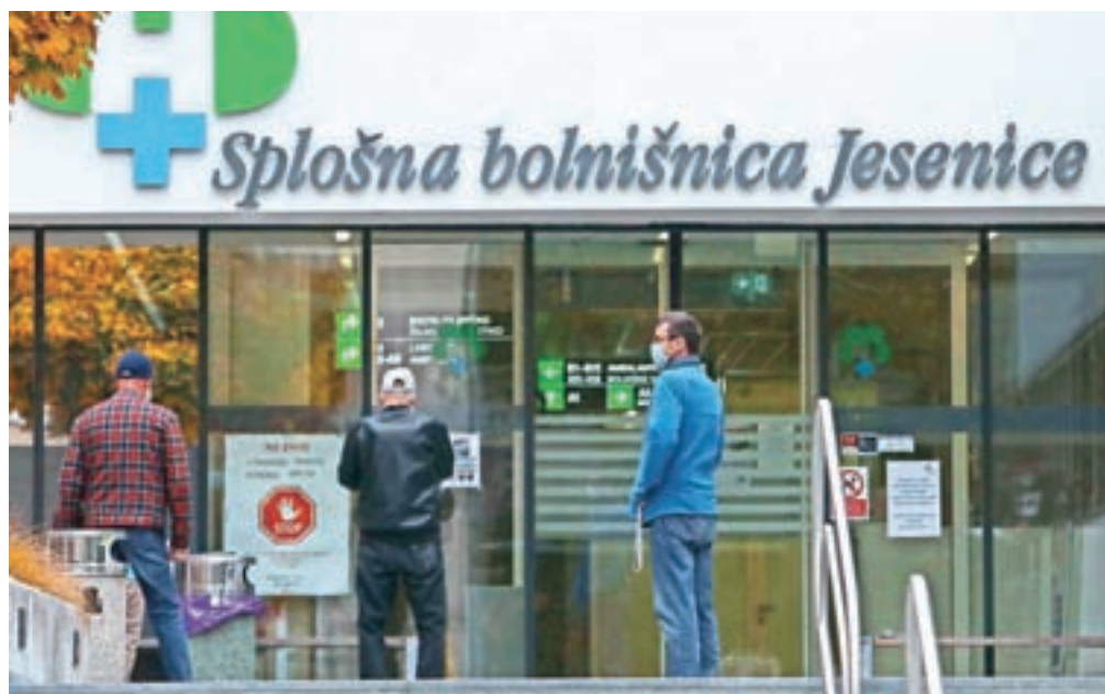
Bo splošna bolnišnica ostala na Jesenicah?