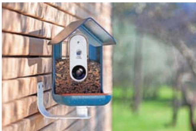
Slovenski projekt pametne ptičje hišice Bird Buddy (Ptičji prijatelj) je na Kickstarterju zbral skoraj 4,2 milijona evrov sredstev.