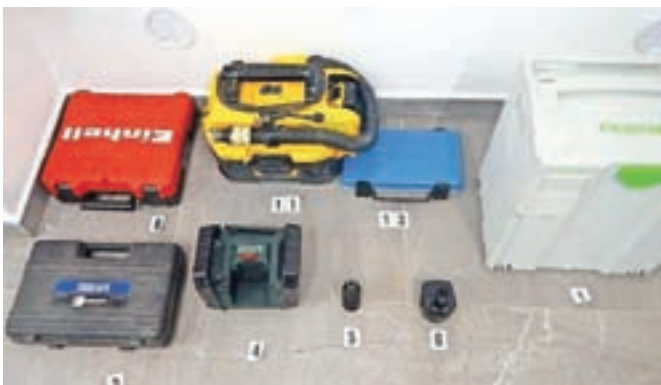
Je katero do zgornjih orodij vaše?

ukradene predmete iz vlovov na širšem območju Ljubljane in drugod po Sloveniji v letu 2019 in v začetku letošnjega leta, policisti pozivajo vse, ki predmete prepoznajo, da pokličejo na Policijsko postajo Logatec (01/750-80-20), kjer hranijo zasežene predmete. Z dokazili o lastništvu se lahko na PP Logatec zglasite tudi osebno.