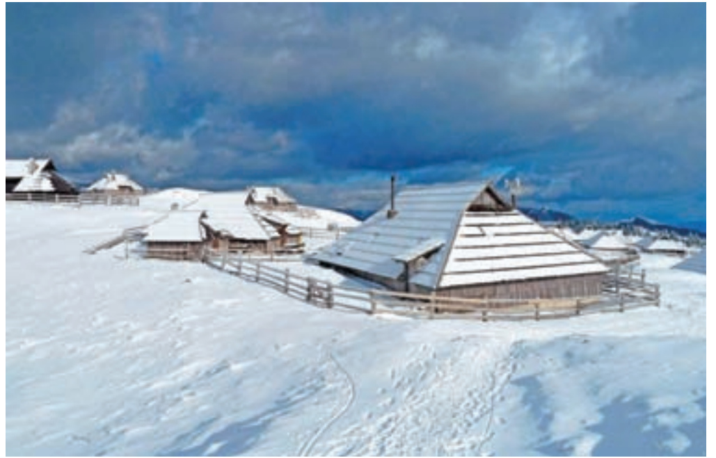
Lastniki koč na Veliki planini imajo odvajanje odpadnih voda različno urejeno.

S tem na občini želijo pomagati vsem lastnikom pastirskih, turističnih in planinskih koč, ki bodo morali odvajanje še urediti. Podatkov, koliko je takšnih objektov, na občini nimajo. »Uredba med drugim tudi določa, da mora lastnik obstoječega objekta, za katerega je bilo izdano gradbeno dovoljenje v skladu s predpisi, ki urejajo graditev objektov pred 14. decembrom 2002, oziroma je bil objekt v uporabi pred tem dnevem oziroma je obstoječa ureditev odvajanja in čiščenja komunalne odpadne vode skladna s predpisi, ki so veljali v času gradnje objekta, zagotoviti odvajanje in čiščenje v skladu z navedeno uredbo, najpozneje ob prvi rekonstrukciji