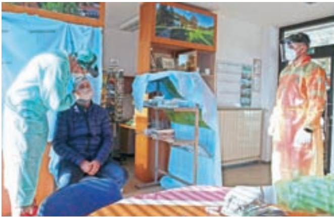
Dvakrat tedensko izvajajo hitro testiranje na lokaciji starega Petrola, zdajšnji točki TIC Škofja Loka.

Škofja Loka – Strokovni delavci Zdravstvenega doma Škofja Loka ob torkih in petkih (od 13. do 17. ure) izvajajo hitro testiranje na točki Turistično informacijskega centra (stari Petrol). Naročanje na brezplačno množično testiranje ni potrebno, s seboj pa je treba imeti zdravstveno kartico in osebno izkaznico. Množični hitri testi so namenjeni osebam brez simptomov, bolni pa naj se obrnejo na izbranega osebnega zdravnika, ki jih bo napotil na testiranje v covidni center v Zdravstvenem domu Škofja Loka. Tam se je tudi že mogoče naročiti na cepljenje, in sicer po spletnem obrazcu; če to ni mogoče, pa naj kličejo telefonsko številko 030 488 960 od 9. do 15. ure. O uspešni oddaji prijave in terminu cepljenja bodo obveščeni. Pri naročanju (kdaj kdo pride na vrsto) bodo upoštevali prednostne kriterije za cepljenje, ki jih je določilo Ministrstvo za zdravje, ter količino odmerkov cepiva, ki bo tedensko dodeljena zdravstvenemu domu, še sporočajo iz Škofje Loke.