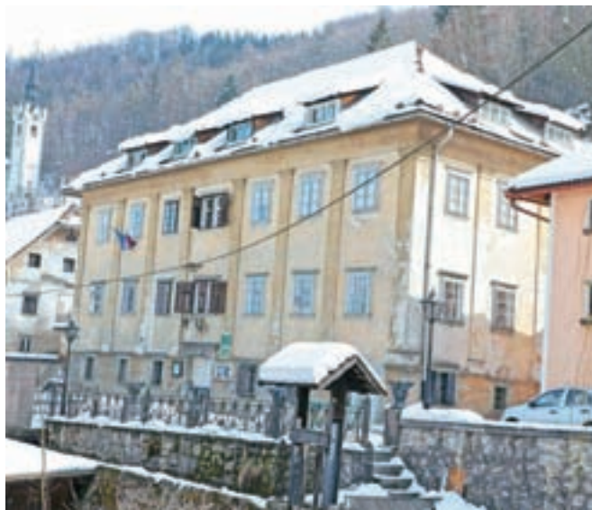
Klinarjeva hiša v središču Kroke – v njej je danes Kovaški muzej.

Zato se želi prijaviti na v začetku leta objavljen javni razpis ministrstva za kulturo, ki bo v letošnjem in prihodnjem letu sofinanciralo projekte na področju nepremične kulturne dediščine. A zgolj tistih nepremičnin, ki so razglašene za spomenik, pri čemer so izrecno izzete nepremičnine znotraj naselbinskih krajinskih in arheoloških