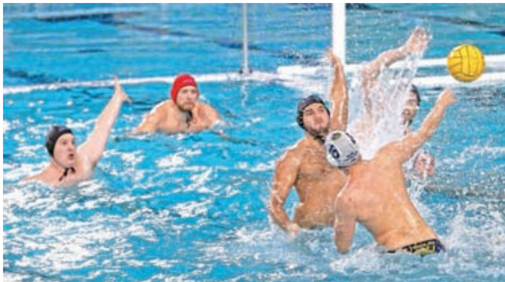
Tako kot v pokalnem tekmovanju sta favorita v državnem vaterpolskem prvenstvu Kamnik in Triglav.

nam je uspelo osvojiti naslov pokalnih prvakov. Po tem smo imeli nekaj prostih prazničnih dni, sedaj pa se že zavzeto pripravljamo za nadaljevanje sezone. Žal v Kamniku ni pokritega bazena, tako da treniramo v Radovljici, pa bomo trenirali tudi tam. Skupaj s Triglavom smo favoriti za nastop v finalu prvenstva in seveda startamo tudi na to lovoriko. Od aprila naprej bomo igrali v domačem bazenu v Kamniku in upam, da bo tudi to naša prednost,« je pred začetkom državnega prvenstva povedal trener Kamničanov Aleš Komelj, ki se zaveda, da so Kamničani favoriti že na prvi tekmi v Kopru.